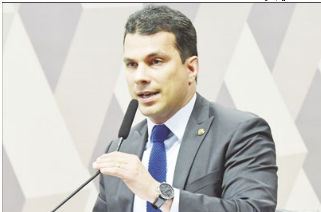
Senador Irajá é o relator da proposta que legaliza o jogo

Atualmente, tanto quem pratica jogos de azar quanto aqueles que possuem casas que oferecem tais atividades estão sujeitos a contravenções penais, ou seja, modalidades mais branda de infração. As penas para os proprietários das casas de jogos de azar abertas ao público é de prisão simples por até um ano e pagamento de multa. Já os jogadores são penalizados