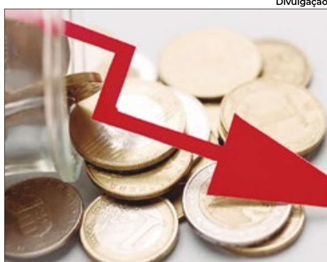
Divulgação Receita em alta é frustrada por avanço do déficit