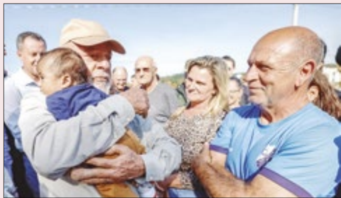
Lula no Sul: altos índices de desconfiança