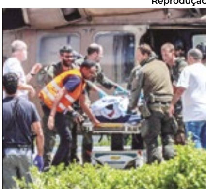
Quatro reféns libertados com vida na mesma região,

As forças de Israel resgataram quatro reféns vivos de dois locais diferentes durante operação na área central da Faixa de Gaza, no sábado. Moradores locais relataram que,