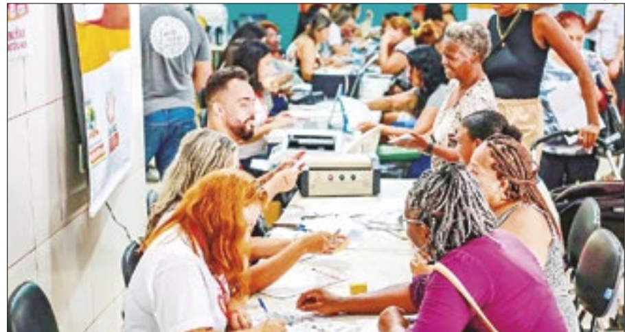
Ação foi promovida pela secretaria de Assistência Social de Belford Roxo

Os moradores do Bairro Jardim do Ipê, em Belford Roxo, tiveram vários serviços da prefeitura disponibilizados na última sexta-feira (07/06) bem pertinho de casa. A oportunidade foi oferecida pela Secretaria Municipal de Assistência Social, Cidadania e Combate à Fome (Semascf), através do Projeto Cidadania em Ação. O evento que tem a parceria da Fundação de Desenvolvimento Social de Belford Roxo (Funbel), Secretaria Municipal de Saúde, Secretaria Municipal de Segurança Pública, Secretaria Municipal de Transporte e Secretaria Municipal de Trabalho, Renda e Economia Solidária, aconteceu na Rua Sófocles, esquina com a Rua Joinville. Foram realizados 994 atendimentos, das 9h às 13h.