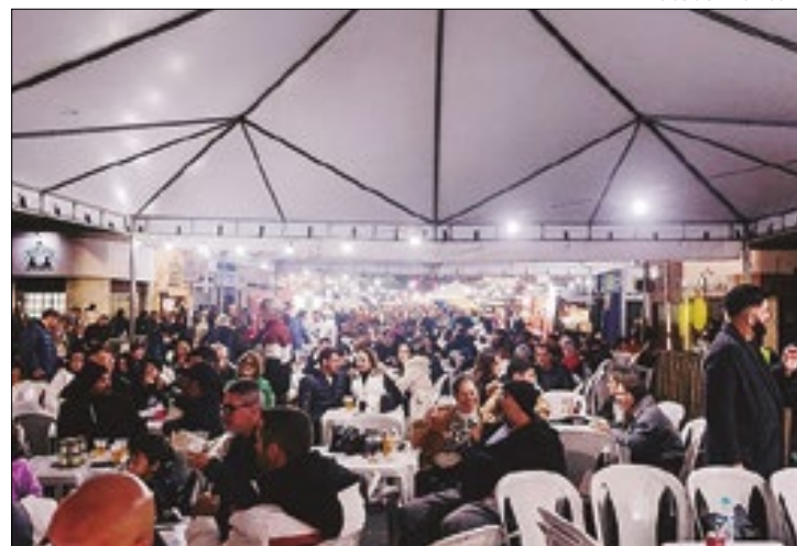
Evento atraiu 60 mil pessoas aos parques da cidade

Às vésperas da edição de 2024, Teresópolis quase viu o evento ser cancelado devido à lei municipal que proibia a obstrução das principais avenidas para eventos particulares, gerando incerteza e tensão. Vereadores e organizadores se reuniram na Câmara Municipal para resolver o impasse. Após um entendimento político e jurídico, foi aprovado que a proibição se aplicava apenas às avenidas principais.