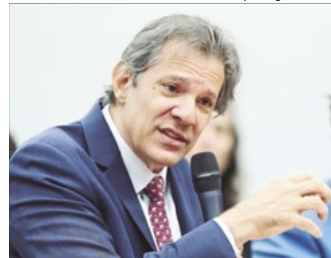
Ministro Fernando Haddad: compensação de perdas