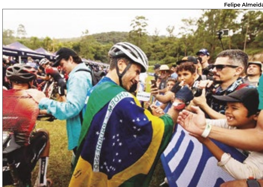
Aos 25 anos, Galinski acumula títulos em competições no Brasil e Europa

Em 2019, o atleta começou a se destacar na categoria Sub-23 do cenário nacional, mas ainda não era nem top 10 melhores da elite no Brasil. Como ele mesmo disse, sempre foi “um menino muito sonhador e que tem objetivos acima da realidade”, por