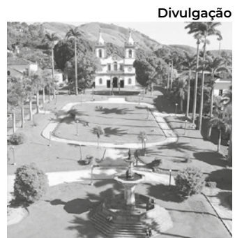
Vassouras em tempos dourados