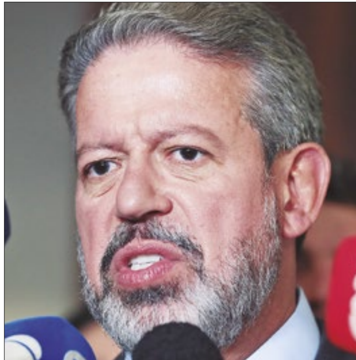
Arthur Lira pode criar novos problemas para o governo

Agora, caso a medida seja aprovada no Congresso Nacional, a ideia é beneficiar o ex-presidente Jair Bolsonaro (PL). Nos próximos dias o ex-presidente deve ser indicado pelos casos envolvendo vendas de joias dadas de presente ao governo brasileiro e a fraude no cartão de vacinação contra a Covid-19. A maioria das acusações contra Bolsonaro, nesses casos e nos demais em que é investigado, decorrem da delação