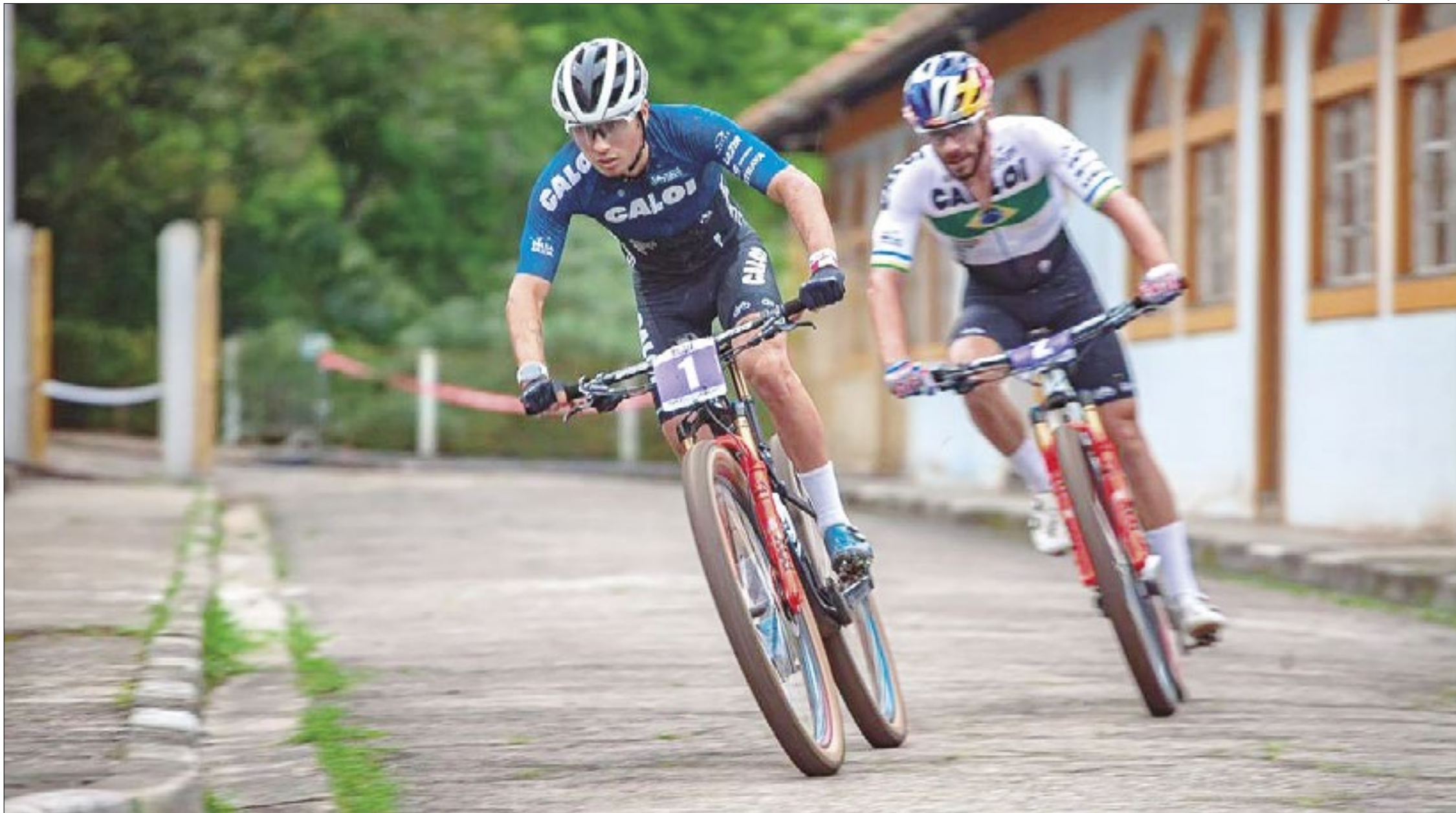
O bicampeão mundial Henrique Avancini se aposentou no ano passado, e agora se dedica a treinar a jovens promessas do MTB para as principais competições da modalidade