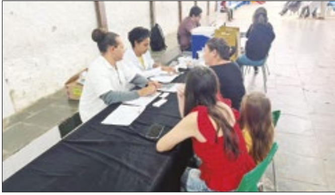
Prefeitura investe em atendimento humanizado