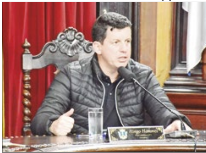
Hingo oficiou a Prefeitura cobrando devolução