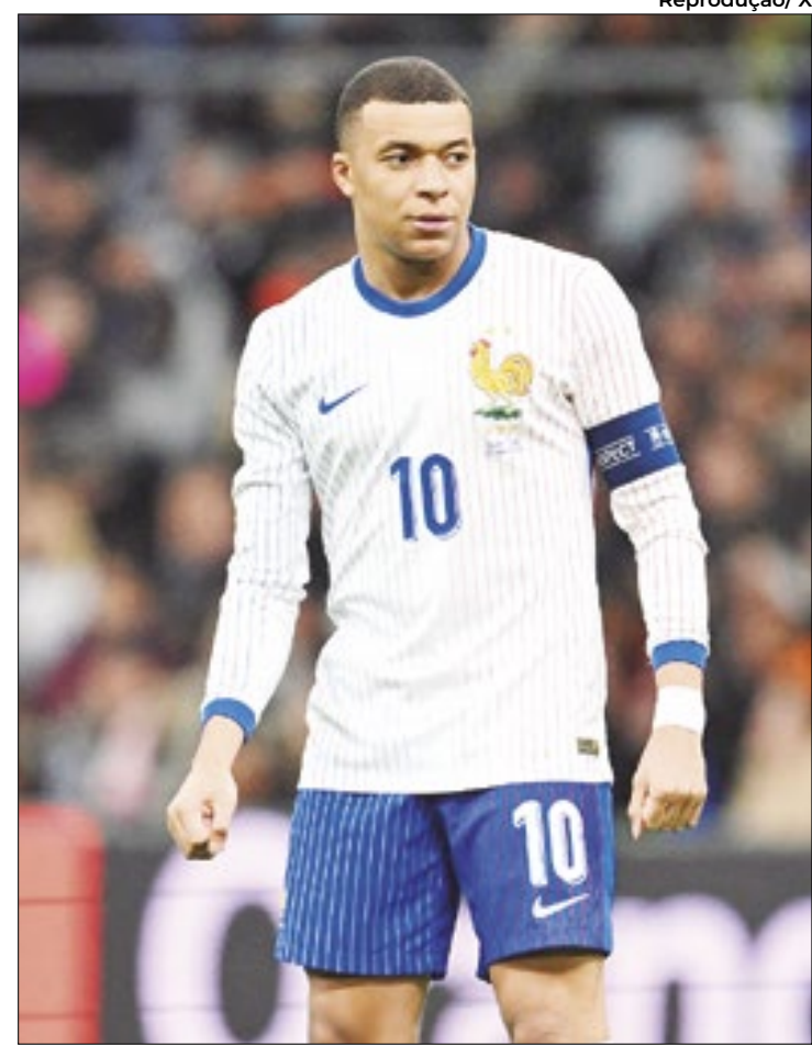
Para britânicos, a camisa branca francesa é a mais bonita da Eurocopa 2024

Além da França, Itália e Espanha agradaram na vestimenta e aparecem com seus dois uniformes no top 10.