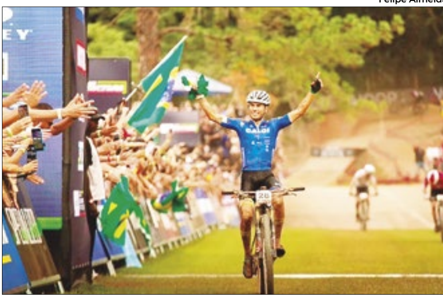
Time de Avancini vai levar um pouco de Petrópolis a Paris neste ano

Avancini se aposentou das competições no ano passado sendo: 23 vezes campeão brasileiro, 14 deles na elite; 5 títulos de Copa do Mundo (4 no XCC e 1 no XCO); bicampeão Mundial de maratona cross-country; vice-campeão mundial de XCC em 2021; líder do ranking mundial ao final de 2020; 13º lugar em Tóquio 2020, o melhor resultado da história do Brasil na competição.