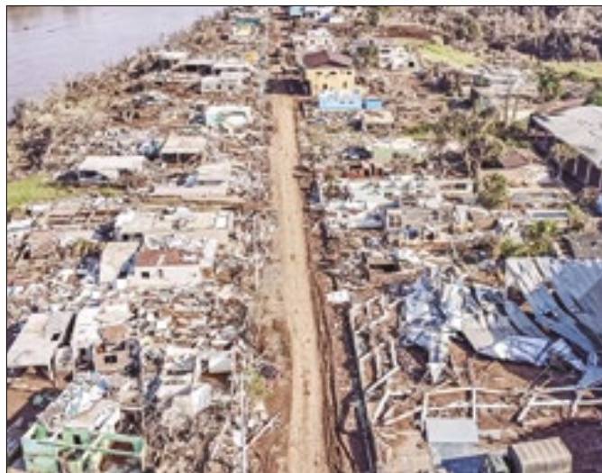
Desolação total na cidade de Arroio do Meio