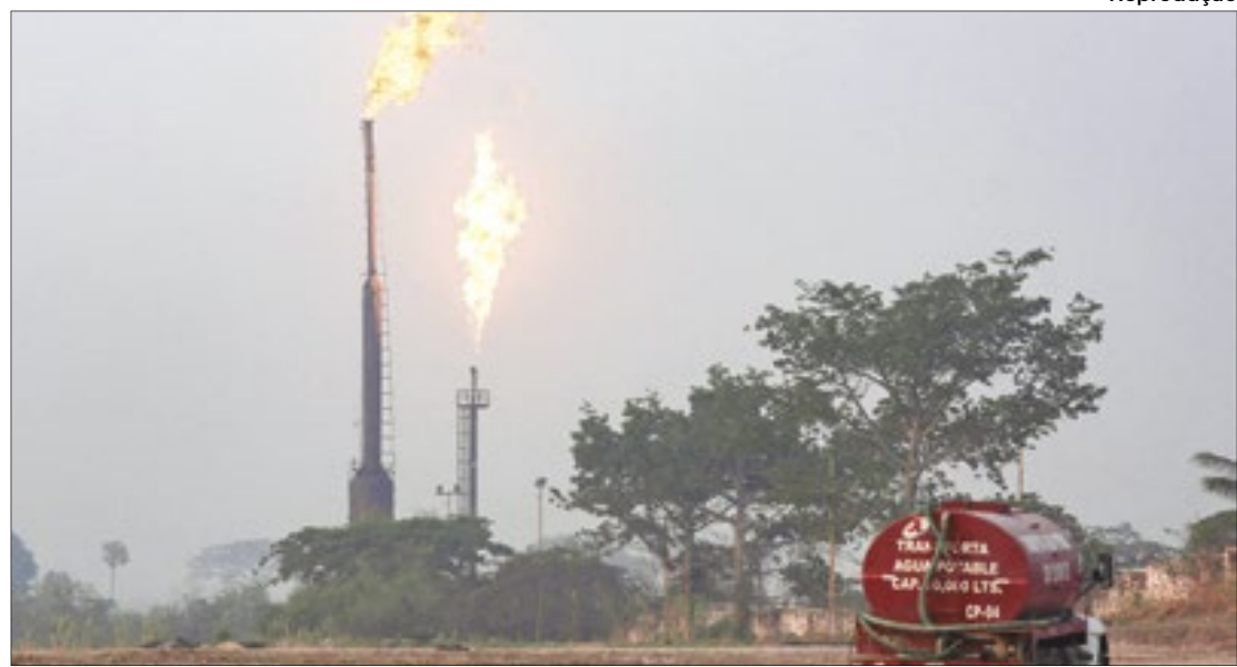
Relatório foi produzido pelo Instituto de Governança e Desenvolvimento Sustentável

Embora sejam menos abundantes do que o dióxido de carbono (CO2), os poluentes climáticos de vida curta, cujos principais representantes são