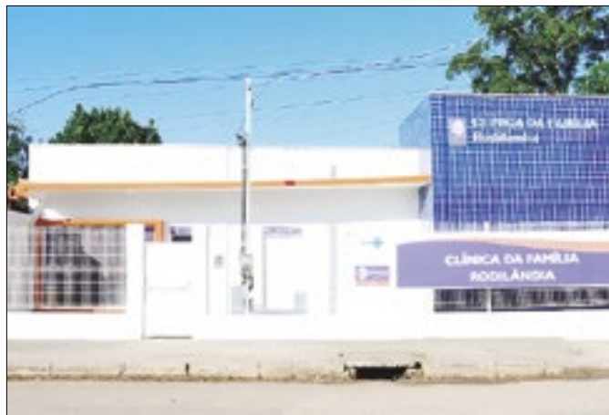
Unidade de Saúde em Rodilândia foi reinaugurada