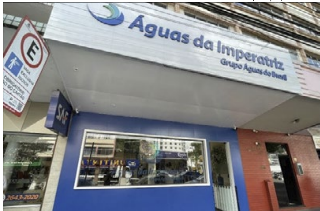
Desconto vinha sendo discutido desde fevereiro entre Prefeitura e concessionária