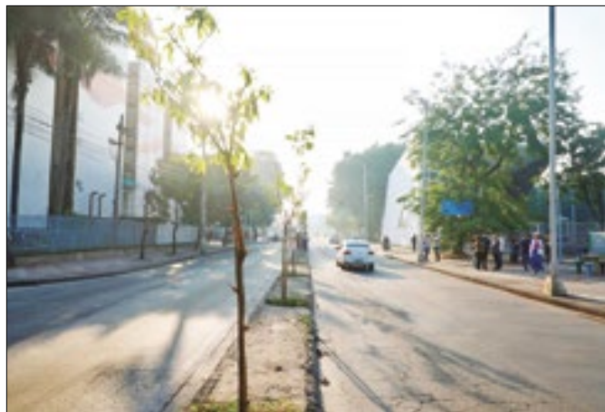
Rafael Catarcione/Prefeitura do Rio

Primeiras mudas do Corredor Verde foram plantadas