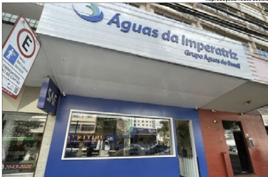
Desconto vinha sendo discutido desde fevereiro entre Prefeitura e concessionária