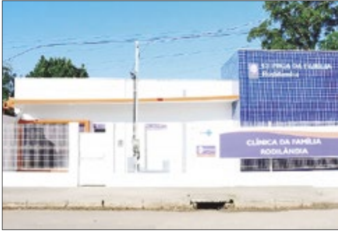
Unidade de Saúde em Rodilândia foi reinaugurada