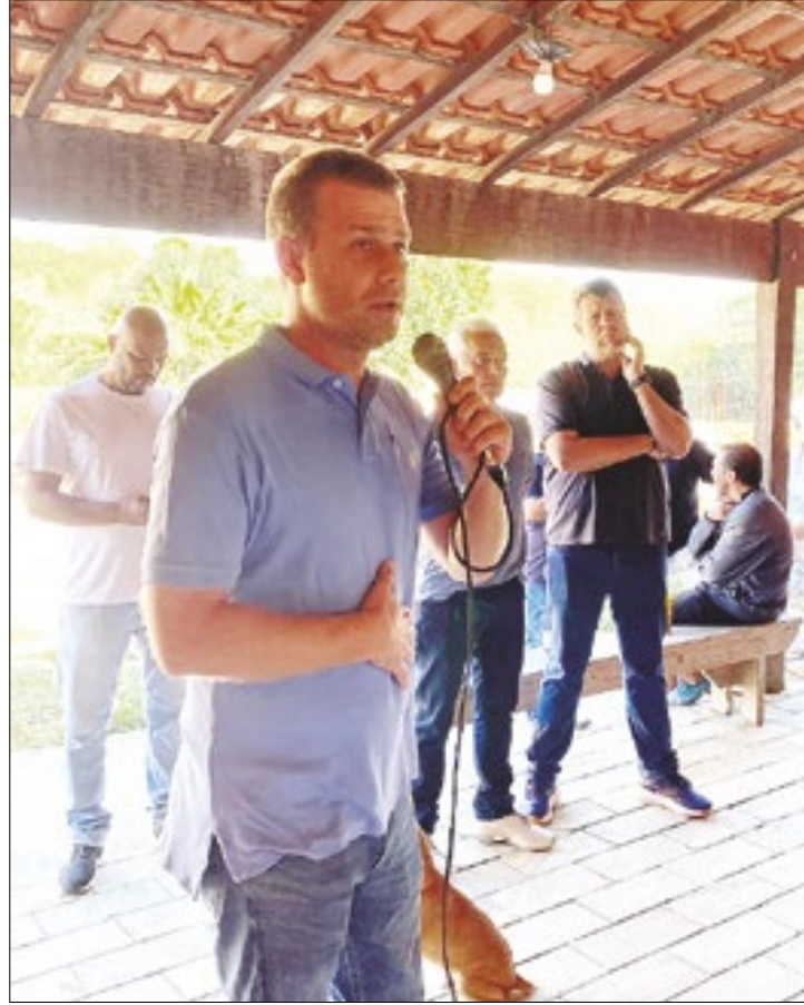
Arthur Tutuca diz que está pronto para encarar desafio e sair como pré-candidato a prefeito de Pirai

Na sequência, o deputado estadual e secretário de Estado de Turismo, Gustavo Tutuca, pediu a palavra para agradecer