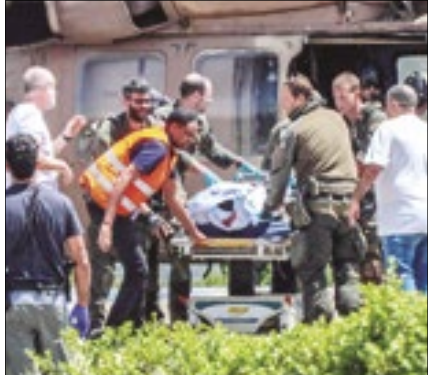
Quatro reféns libertados com vida na mesma região,

As forças de Israel resgataram quatro reféns vivos de dois locais diferentes durante operação na área central da Faixa de Gaza, no sábado. Moradores locais relataram que,