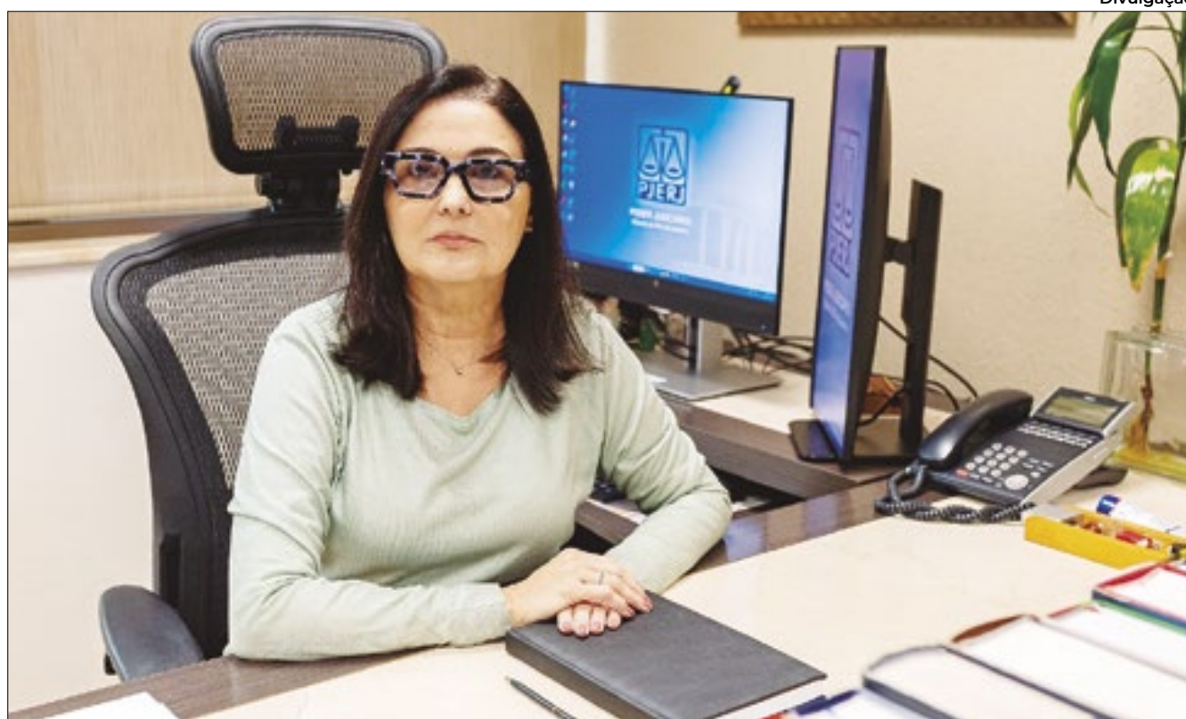
Desembargadora Patrícia Vieira diz que já vivenciou a discriminação de gênero

Para a desembargadora, é possível, sim, combater essas situações no Judiciário. “Na minha opinião, sem descuidar de sua atividade fim, é claro, promovendo a cultura da diversidade e equidade, no âmbito da instituição, através de uma gestão judiciária à promoção de ações afirmativas, como vem sendo estimulada e implementada, na atualidade”, afirmou.