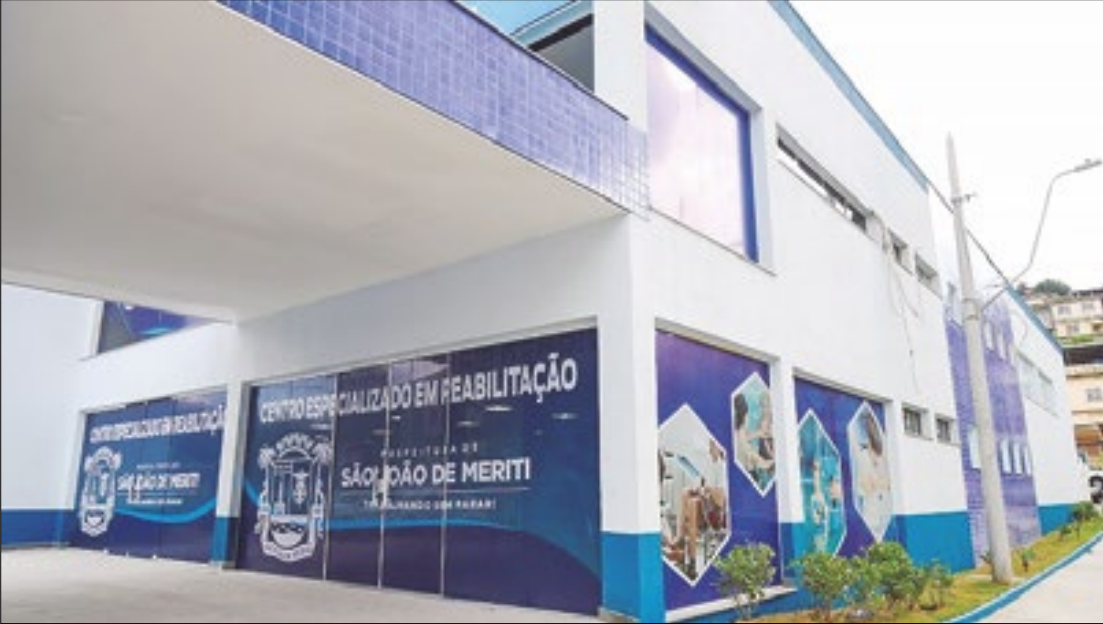
Centro Especializado em Reabilitação de São João de Meriti funciona no Parque Novo Rio

A Prefeitura de São João de Meriti inaugurou na sexta-feira (7/6) à noite o Centro Especializado em Reabilitação Norma Bastos Fernandes (CER), o primeiro da cidade. O equipamento é do tipo II, ou seja, presta atendimento em duas modalidades de reabilitação: física e intelectual.