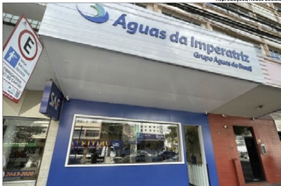
Desconto vinha sendo discutido desde fevereiro entre Prefeitura e concessionária