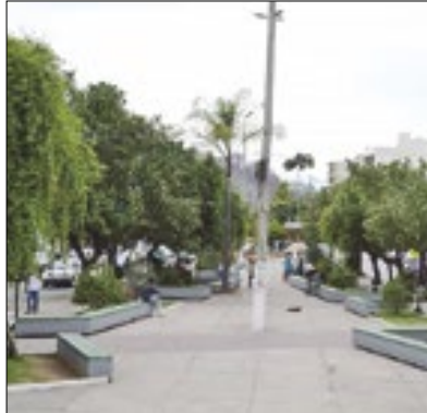
Praça de Conselhoheiro Paulino

A Prefeitura de Nova Friburgo, por meio da Secretaria Municipal de Esportes, realizará no próximo sábado (15), um Aulão de Esporte em Conselhoheiro Paulino. O evento acontecerá das 9h às 12h, na Praça de Conselhoheiro.