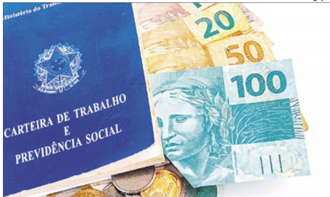
Presidente do TCU, Bruno Dantas, vê com preocupação 'contencioso entre Poderes'

Mesmo após o governo petista 'cortar' R$ 5,7 bilhões em