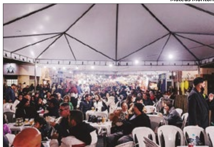
Evento atraiu 60 mil pessoas aos parques da cidade

Às vésperas da edição de 2024, Teresópolis quase viu o evento ser cancelado devido à lei municipal que proibia a obstrução das principais avenidas para eventos particulares, gerando incerteza e tensão. Vereadores e organizadores se reuniram na Câmara Municipal para resolver o impasse. Após um entendimento político e jurídico, foi aprovado que a proibição se aplicava apenas às avenidas principais.