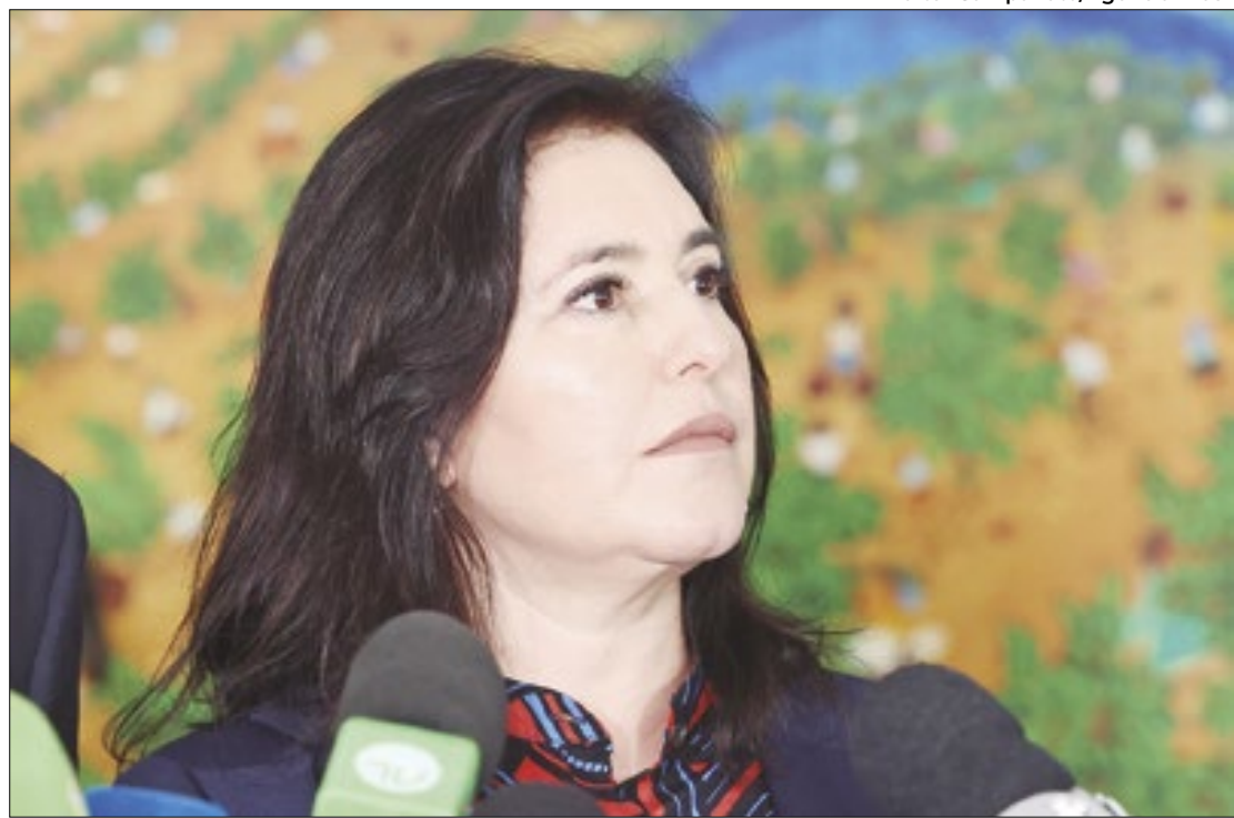
Simone Tebet estará esta semana na Comissão de Orçamento

Já na Câmara dos Deputados, o presidente da Casa, Arthur Lira