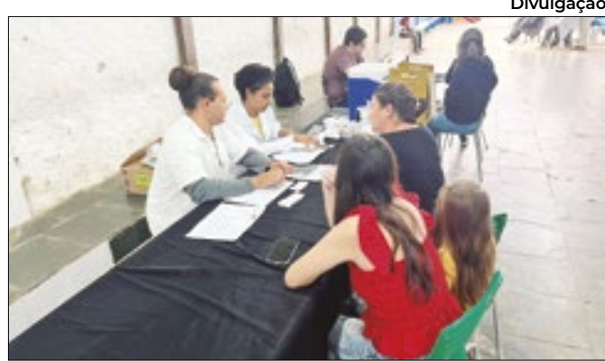
Prefeitura investe em atendimento humanizado