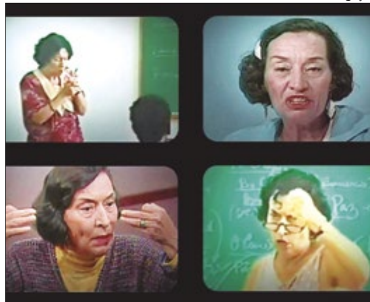
Irreverente e polêmica, economista deixa legado inestimável

Nascida em Anadia, Portugal, em 1930 e formada em