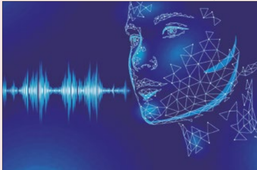
O uso da IA ameaça o trabalho de centenas de dubladores no Brasil