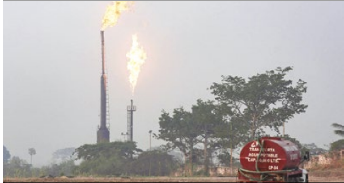
Relatório foi produzido pelo Instituto de Governança e Desenvolvimento Sustentável

Embora sejam menos abundantes do que o dióxido de carbono (CO2), os poluentes climáticos de vida curta, cujos principais representantes são