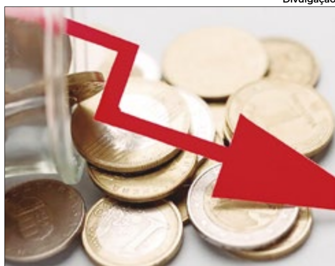
Receita em alta é frustrada por avanço do déficit