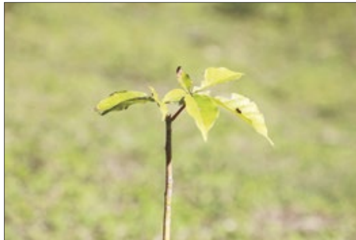
Iniciativa visa compensar emissões de carbono

Desde abril do ano passado, o programa "Asfalto Novo, Vida Nova" plantou pelo menos 86.930 mudas de árvores em 50 municípios paranaenses. A iniciativa, que leva pavimentação urbana para pequenas cidades do Estado, inclui o plantio de árvores para compensar a emissão de carbono das obras.