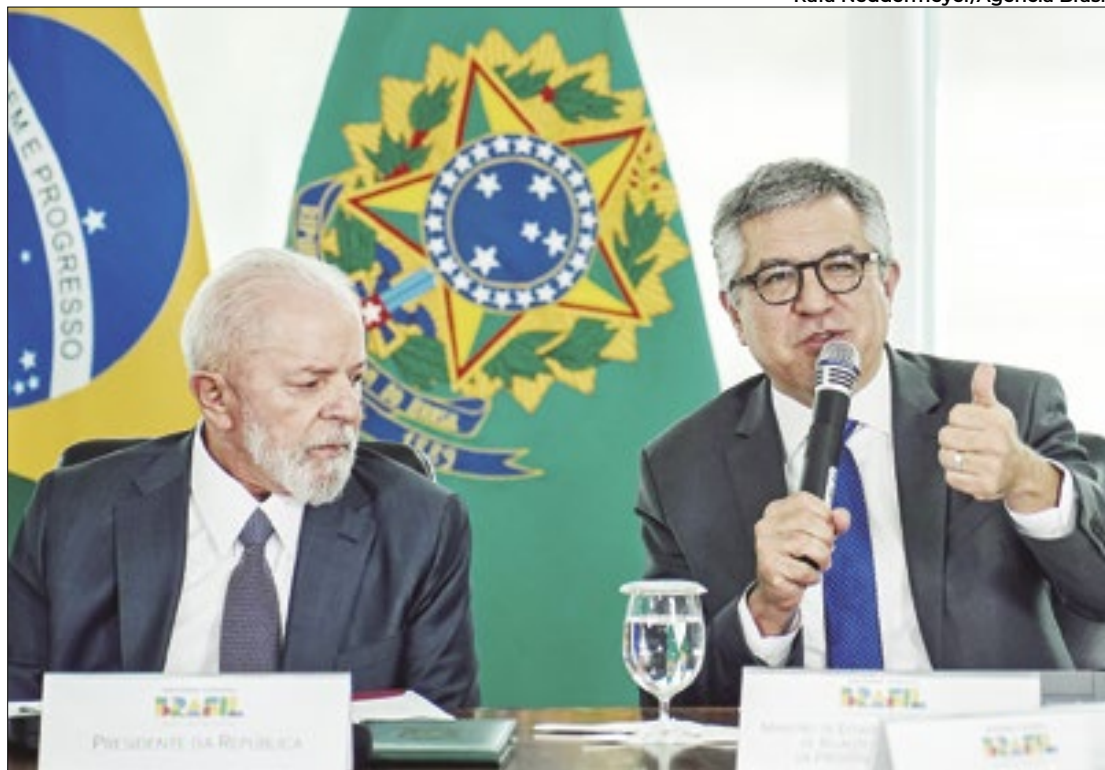
Lula quer melhorar articulação política, da qual faz parte Padilha

Três pautas de cunho ideológico marcaram a sessão de análise dos vetos presidenciais com reverses ao governo: o fim das saidinhas de presos, um pa-