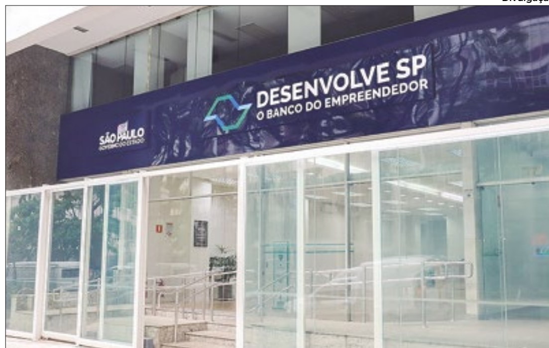
Desenvolve SP e Banco do Povo Paulista não terão que consultar o Cadin

Desenvolve SP e Banco do Povo Paulista terão facilidades