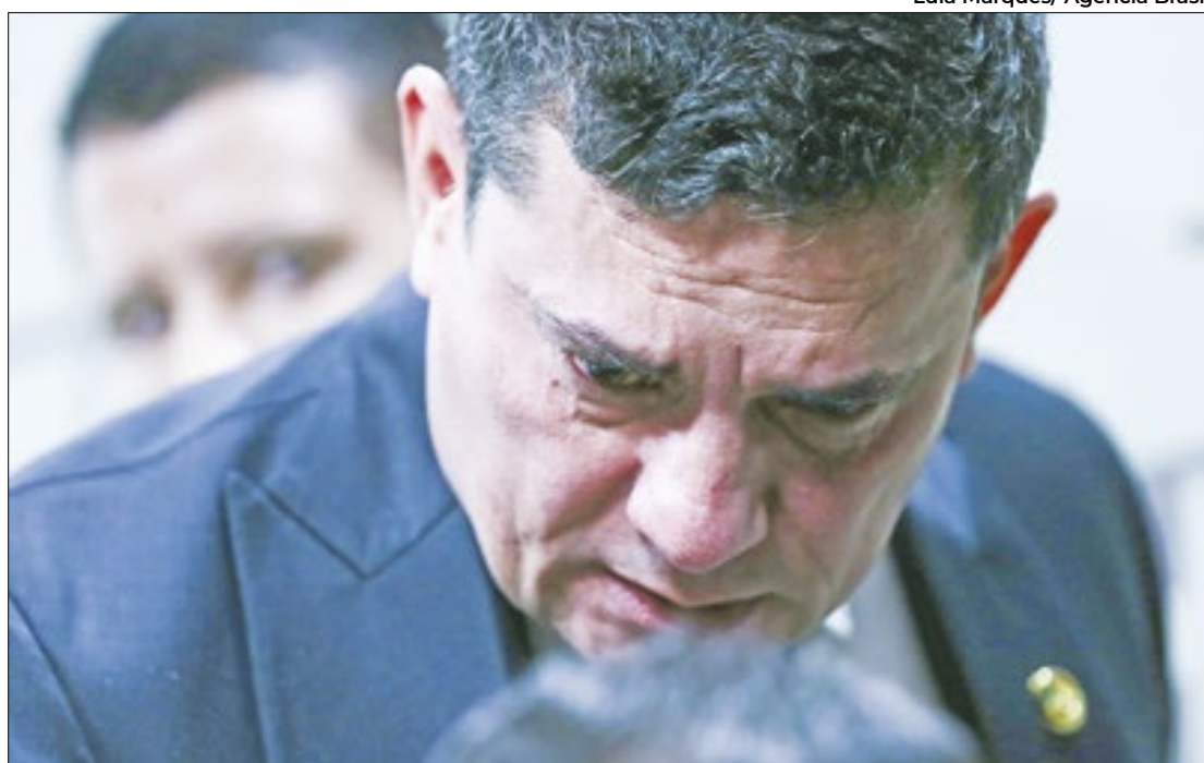
Advogado de Moro disse que foi apenas uma “frase infeliz”

A filmagem mostra o ex-magistrado em uma festa junina conversando com outras pessoas. Uma voz feminina, ao fundo diz: “Está subornando o velho”. Moro, então, responde: “Não, isso é fiança. Instituto para comprar um habeas corpus do Gilmar Mendes”.