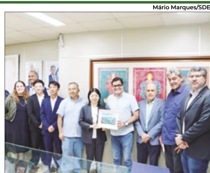
Representantes chineses exploram oportunidades