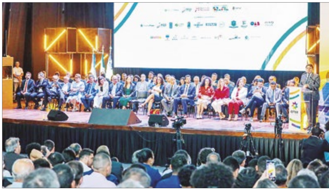
Evento foca na difusão e discussão de novas tecnologias para a transição energética

"O Piauí produz cinco vezes mais energia do que consome, e a matriz elétrica é 100% limpa, exportando esse excedente para o sudeste brasileiro. O próximo passo é transformar essa eletricidade em hidrogênio verde e seus derivados. O Piauí se posicionou como protagonista nessa discussão e já atraiu investidores com dois projetos que deverão já estar sendo construídos em 2025. Essa produção