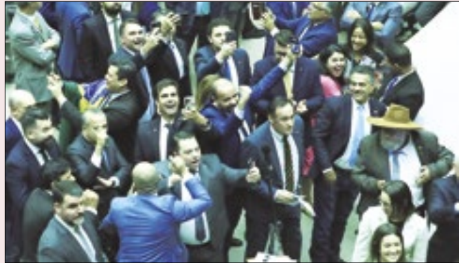
Parlamentares comemoram veto sobre fake news