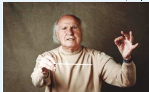
Aos 90 anos, o maestro Isaac Karabtchevsky fará sua primeira turnê internacional com a Orquestra Petrobras Sinfônica. Sionista, condena o conflito entre Israel e o Hamas e defende um Estado palestino