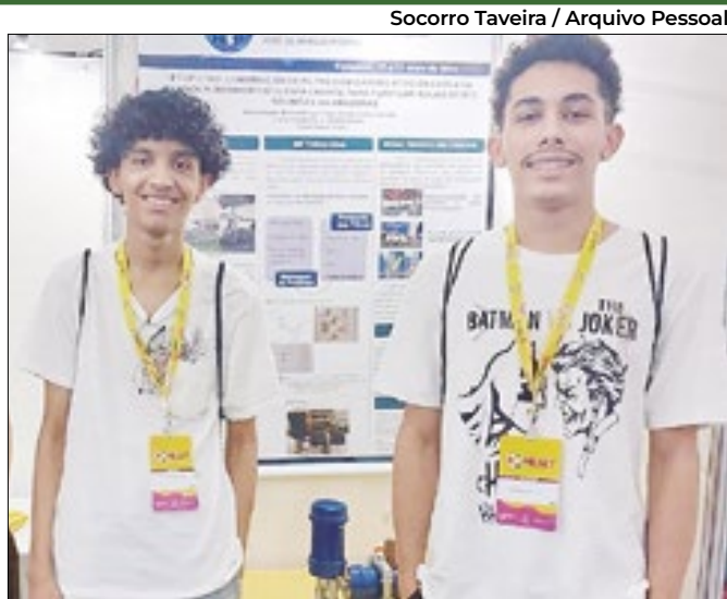
Estudantes vão poder participar de evento na Rússia