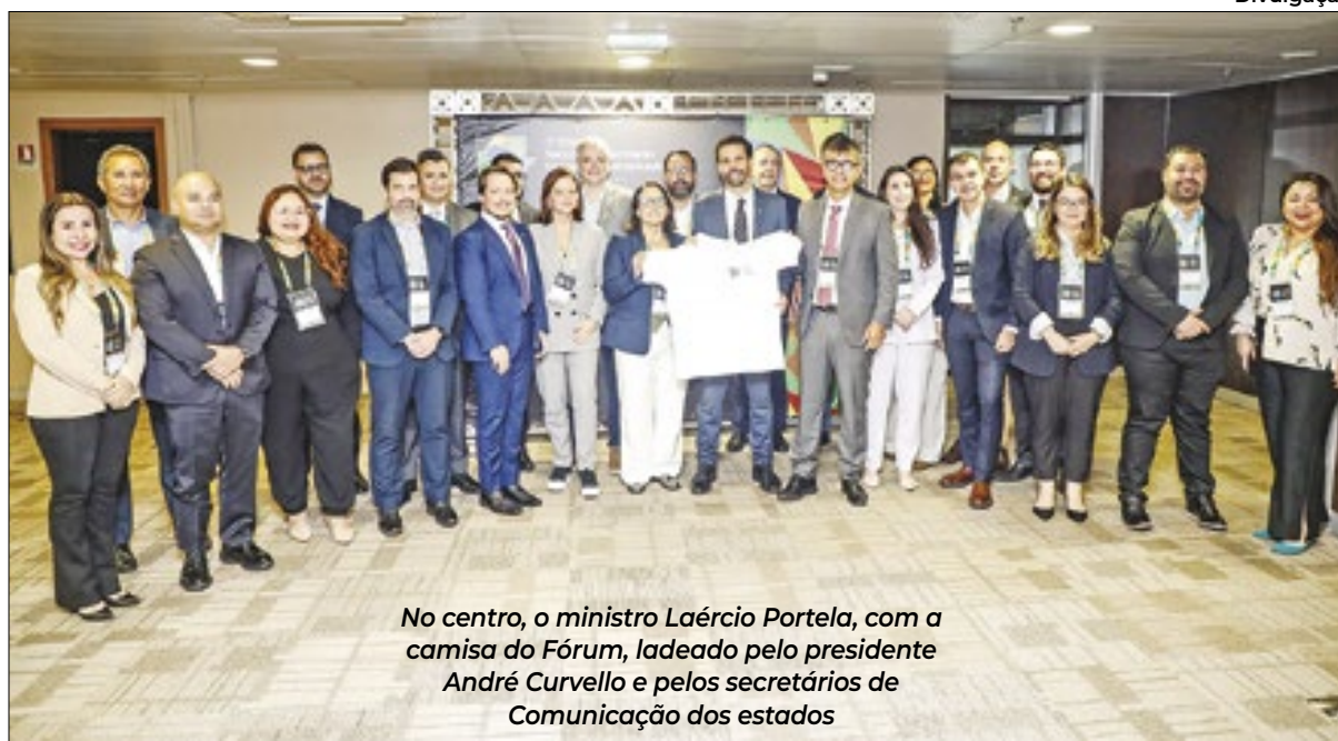
No centro, o ministro Laércio Portela, com a camisa do Fórum, ladeado pelo presidente André Curvello e pelos secretários de Comunicação dos estados

Ao abrir o primeiro dia do 5º Fórum Nacional de Secretários Estaduais de Comunicação, em Brasília, o ministro interino da Comunicação Social, o jornalista Laércio Portela, disse que o Governo pretende fazer uma interlocução mais regionalizada, para fazer chegar a cada estado, de maneira mais efetiva, o que está sendo feito e interessa àquela população. Essa é a primeira vez que o Governo Federal participa do evento, que forma o maior bloco de comunicação social pública do país. O ministro também apresentou aos representantes dos estados os próximos objetivos para o combate às fake news.