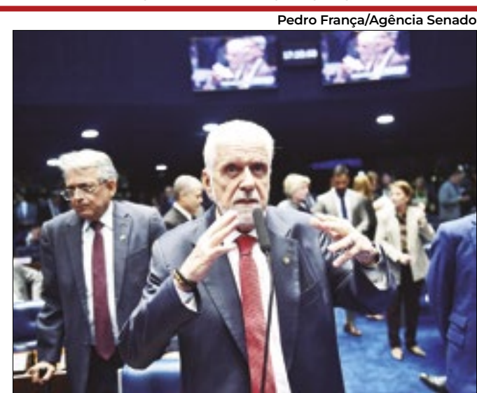
Wagner foi acionado pelo ministro da Fazenda