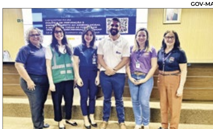
Itaqui se tornou o primeiro porto público a lançar a política

"O Rio Grande do Norte é um dos líderes na cooperação brasileira com a China. Vamos trabalhar para gerar cada vez mais relações estratégicas. Acredito que, nos próximos 50 anos, teremos uma parceria ainda maior com o Rio Grande do Norte", comentou a diplomata.