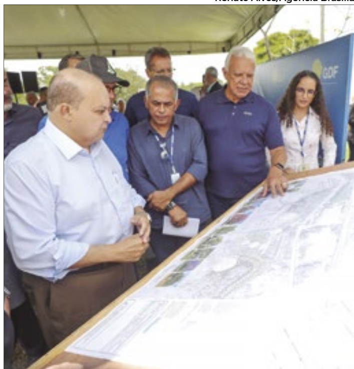
Ainda em janeiro, o governador Ibaneis Rocha (MDB) avalia o projeto de arborização que recupera projeto histórico do paisagista Burle Marx