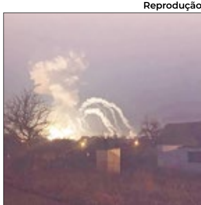
Possível arma americana

A Ucrânia destruiu pela primeira vez um sistema antiaéreo dentro do território reconhecido da Rússia, um ataque que analistas acreditam que tenha sido possível com o emprego de foguetes de precisão americanos. A