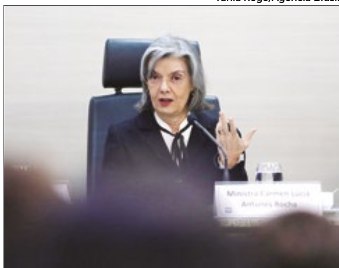
Cármen Lúcia conseguirá coibir fake news?