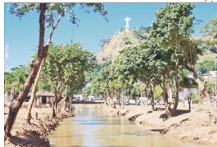
Estado ajuda na reconstrução da cidade

O Governo do Espírito Santo segue atuando no apoio à reconstrução da cidade de Mimoso do Sul, localizada na microrregião Central Sul, afetada por fortes chuvas no mês de março. O governador Renato Casagrande visitou novamente o município para anunciar mais R$ 38 milhões em repasses e investimentos diretos em ações de recuperação da infraestrutura, além da reforma e ampliação de uma escola estadual. Uma das ações é a retirada dos resíduos sólidos gerados após a enxurrada que afetou grande parte do município, levando destruição e prejuízo para a vida dos moradores. O Governo, por meio da Secretaria de Saneamento, Habitação e Desenvolvimento Urbano (Sedurb), vai aplicar R$ 6,5 milhões no transporte e a destinação desses resíduos sólidos, que foram depositados em uma área do Parque de Exposições da cidade. Estima-se que a quantidade de detritos retirados de comércios e residências afetadas chegue a 3,8 mil toneladas.