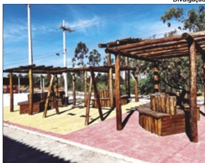
Portal na Serra de São Francisco, em Votorantim