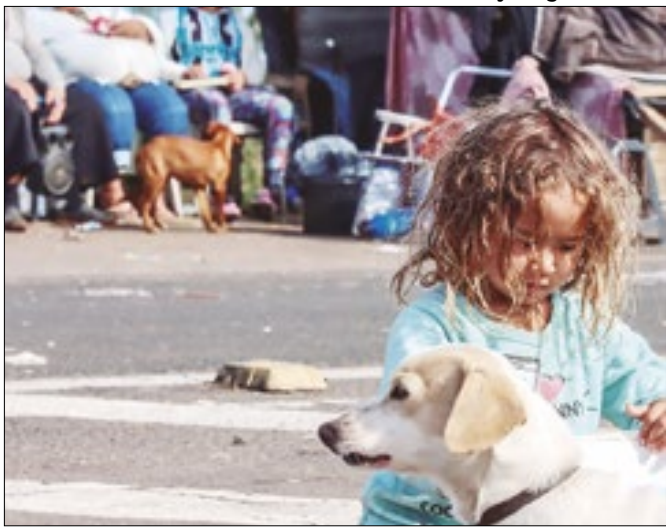
Segunda remessa do benefício foi liberada