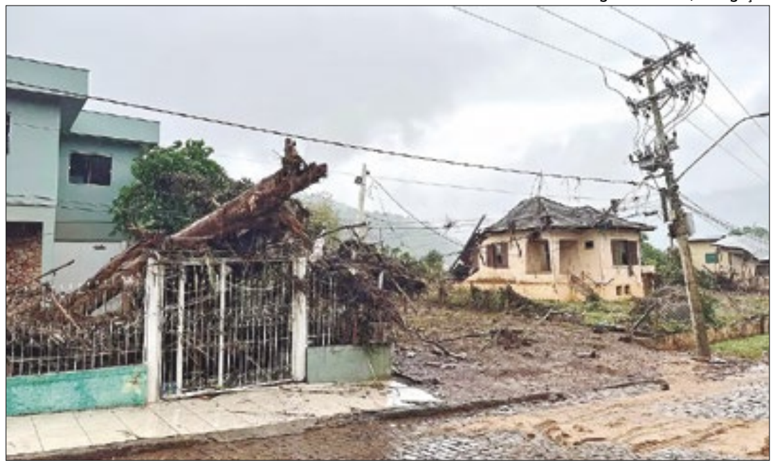
De R$ 20,71 bi em créditos extraordinários, R$ 6,41 bi já foram gastos

A partir desta terça-feira (4), a população poderá acompanhar os gastos federais destinados à reconstrução do Rio Grande do Sul por meio de um painel interativo lançado pela Secretaria de Orçamento Federal (SOF) do Ministério do Planejamento e Orçamento. O painel permite o monitoramento em tempo real da execução dos créditos extraordinários no Orçamento Geral da União, especificamente voltados para enfrentar a tragédia climática no estado.