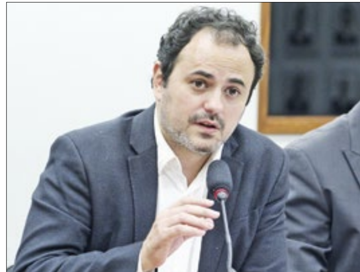
Glauber é acusado de agressão a um colega deputado