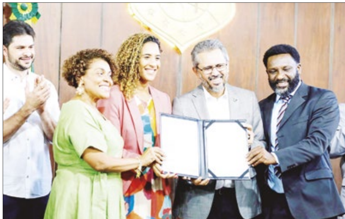
Foram entregues aproximadamente R$ 2,7 milhões em kits para igualdade racial

O acordo de cooperação com a União reforça políticas de igualdade