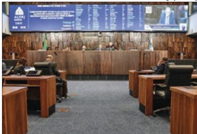
Reunião discutirá planos de contingência no estado