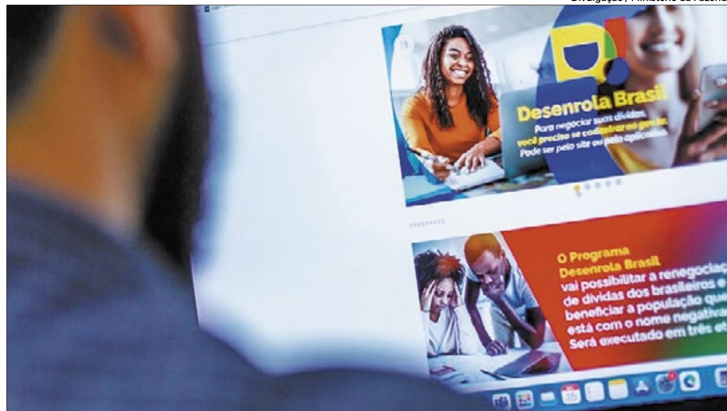
Estado fluminense contabilizou mais de 320 mil negociações que renderam mais de R$ 203 milhões

Antes do Desenrola, o total da dívida dessas pessoas somava mais de R$ 1,59 bilhão. Com os grandes descontos oferecidos pelo programa, cuja média nacional foi de 83%, mas que em diversos casos ultrapassaram 96%, o valor total negociado no Rio de Janeiro ultrapassou R$ 203,5 milhões. Em todo Brasil, o Desenrola beneficiou 15 milhões de pessoas com a negociação de R$ 53 bilhões em dívidas e reduziu a inadimplência entre a população que mais precisa de apoio.