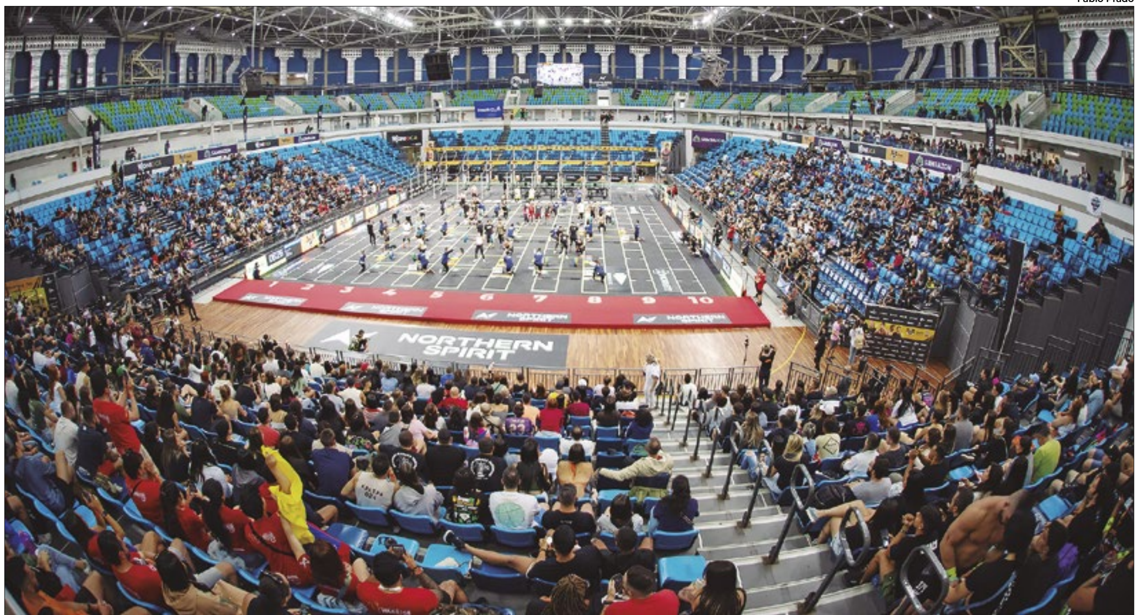
Semi final sul-americana aconteceu na Arena Carioca 1, no Rio