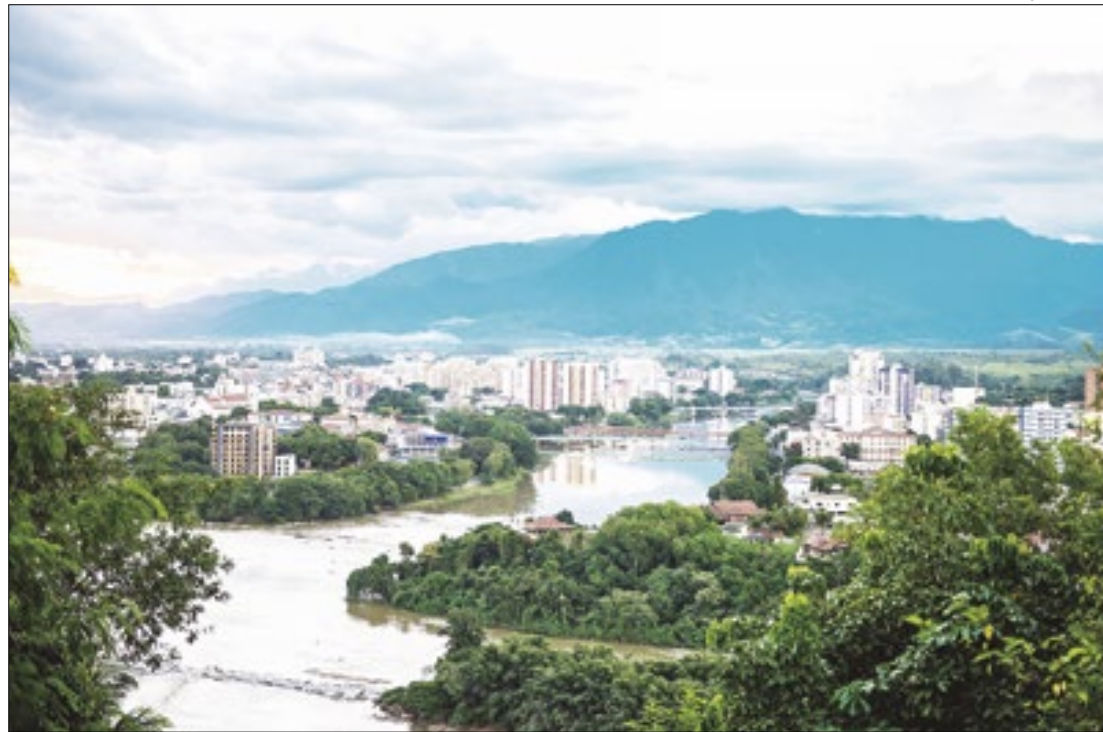
Serão soltos pelo menos 3,5 mil peixes no Rio Paraíba do Sul

Em alusão à "Semana do Meio Ambiente", a prefeitura de Resende vai receber uma ação de peixamento nesta terça-feira, dia 4. A atividade, que conta com o apoio da Prefeitura de Resende, faz parte da programação da Semana do Meio Ambiente e será realizada pela ArcelorMittal e o INEA (Instituto Estadual do Ambiente), a partir das 16h.