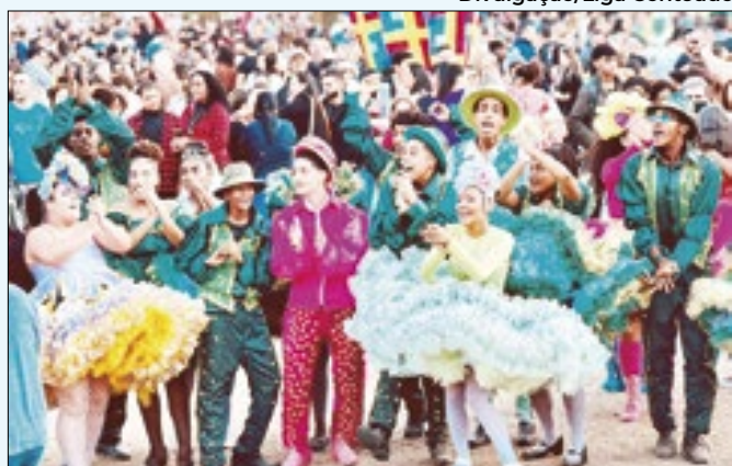
Arraiá do Amor acontece nos dois fins de semana