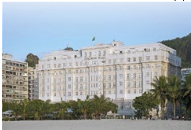
Disney fará grande evento no Copacabana Palace