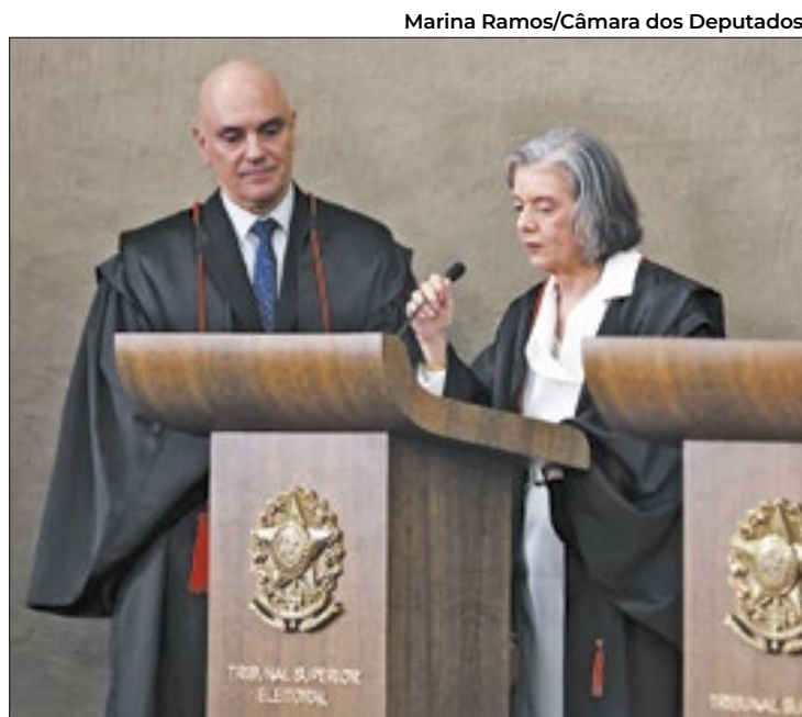
Marina Ramos/Câmara dos Deputados

O TSE é composto por sete ministros, sendo três do STF, dois do Superior Tribunal de Justiça (STJ) e dois advogados com notório saber jurídico, e