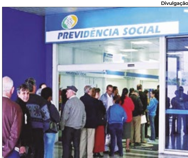
Crescimento célere do déficit previdenciário preocupa

No livro "A Reforma Inacabada – O futuro da Previdência Social no Brasil" – que assina, junto ao também economista especialista em Finanças Públicas e Previdência Social, Fabio Giambiagi, de naturalidade argentina – Tafner alerta para a tendência de expansão das