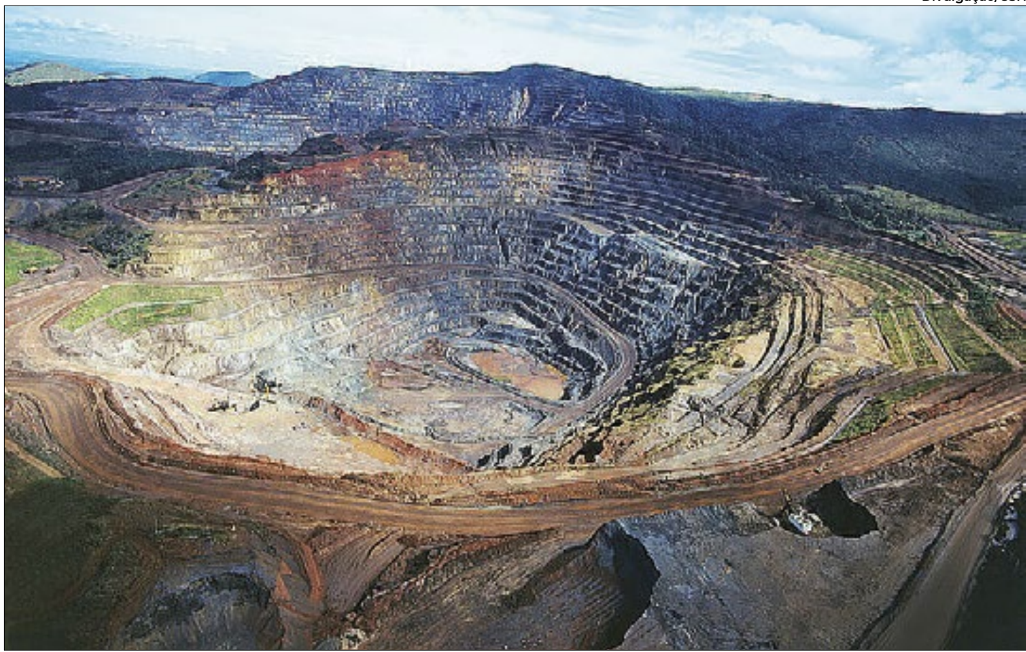
É da Casa de Pedra que vem o minério de ferro que abastece os altos-fornos da Usina Presidente Vargas, em Volta Redonda