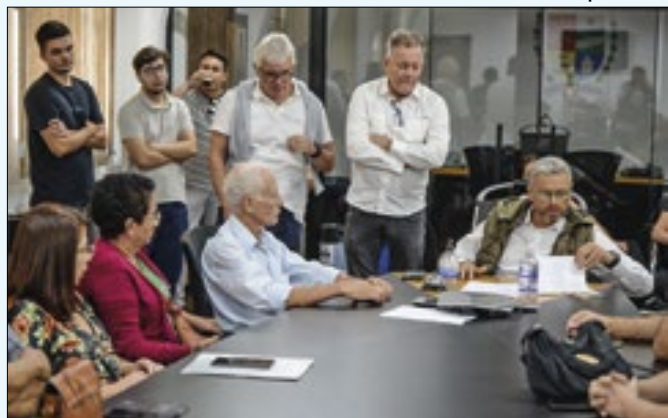
Reunião com executivo definiu os novos conselheiros