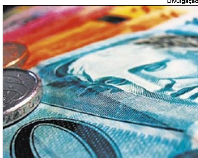
Catástrofe ambiental no RS afeta economia nacional