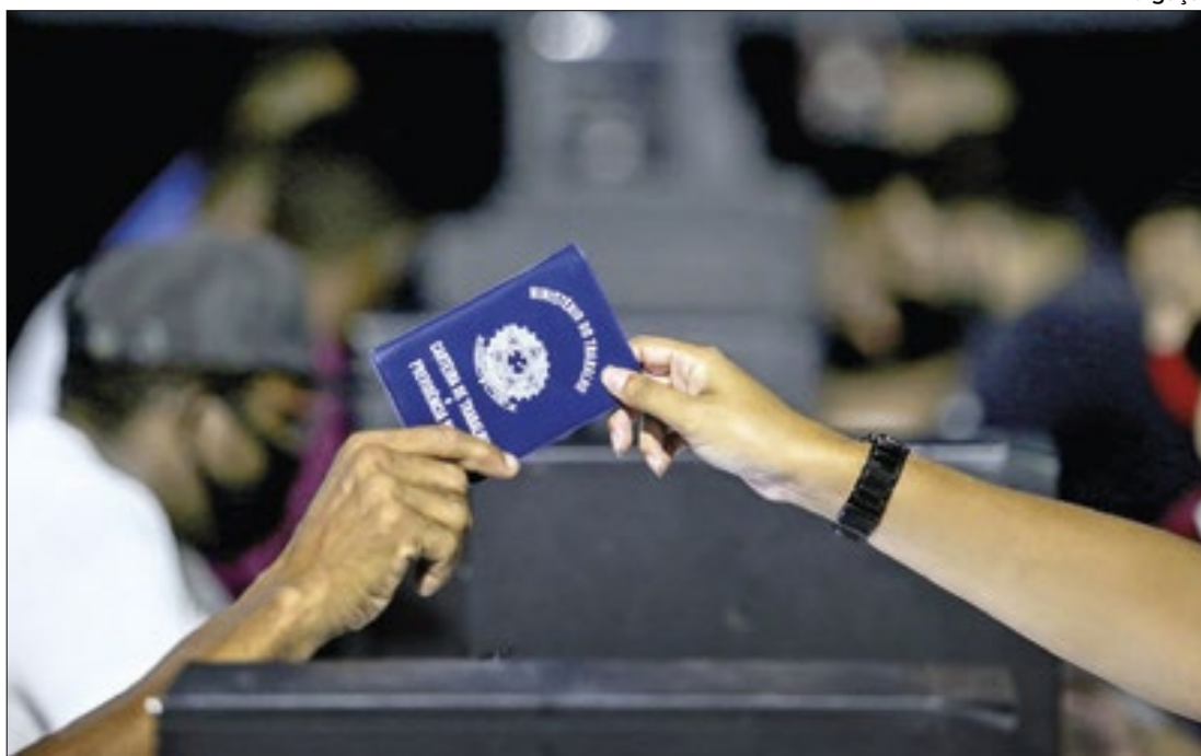
As oportunidades com carteira assinada estão distribuídas pelas diversas regiões do estado

risco à saúde, seguida por maus tratos, abandono, negligência, tortura física e insubstância afetiva. Violações ligadas à questão patrimonial também são bastante frequentes. Em vários casos, os filhos aparecem como os agressores.