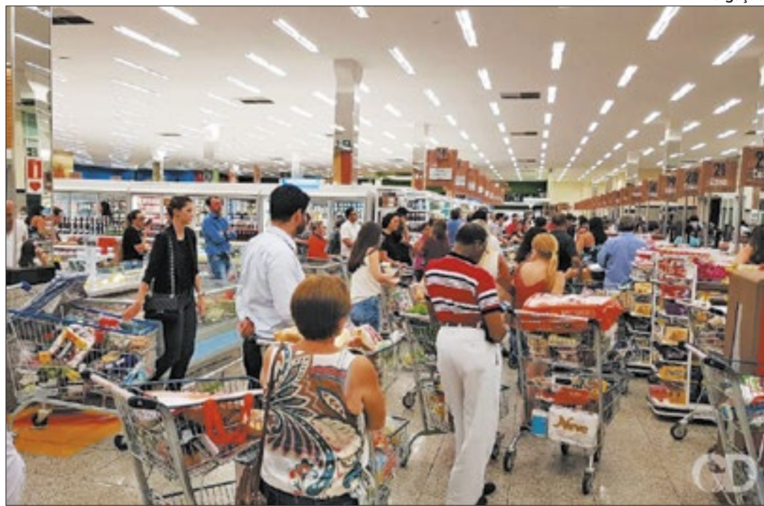
Mercado financeiro projeta avanço do indicador inflacionário e dos juros para 2024

A expectativa do mercado para a Selic (taxa básica de juros) avançou de 10% ao ano (a.a.) para 10,25% a.a. para