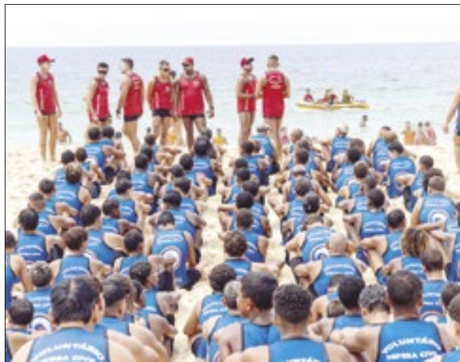
2ª etapa do projeto Body Surf Salva 2024 em Maricá