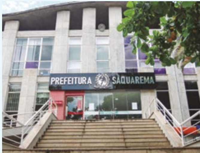
Sede da prefeitura municipal de Saquarema