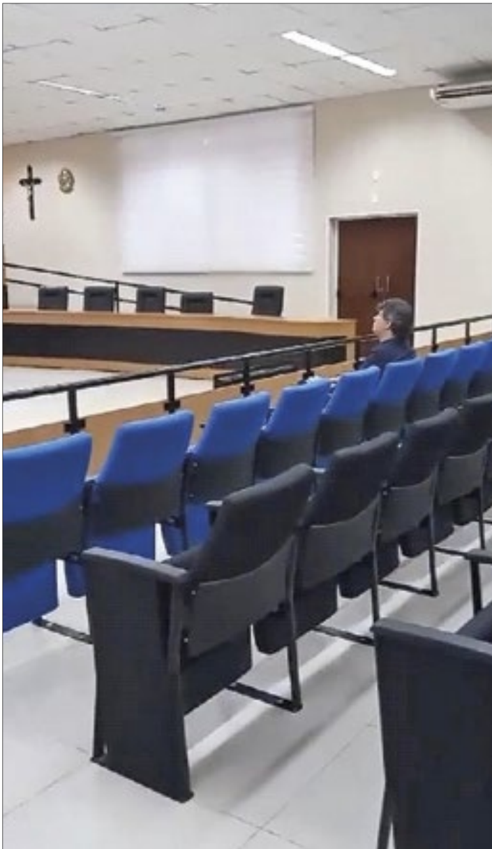
Plenário da Câmara vazio, na última semana

Entre os slides exibidos, um chamou a atenção do pré-candidato: o limite de gastos com pessoal, que há havia estourado o teto de 54% das receitas líquidas que determina a Lei de Responsabilidade Fiscal (LRF), não para de crescer: já está em 62,48%, o que significa, pela lei, improbidade administrativa.