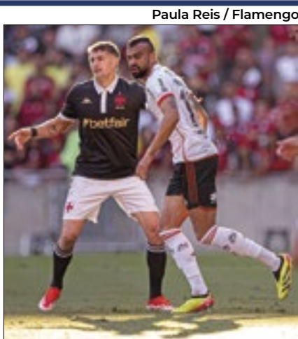
Torcedores se envolveram em brigas

A Polícia Militar (PM) prendeu no domingo (2) 31 suspeitos de participação em brigas entre torcedores antes do jogo Vasco e Flamengo, pelo Campeonato Brasileiro de Futebol masculino. Em Niterói, na região metropolitana do Rio, 12 membros de uma torcida organizada do Vasco foram conduzidos à delegacia após briga com flamenguistas. Nos arredores do Estádio do Maracanã, na zona norte da cidade do Rio, onde os times se enfrentaram, também houve confrontos entre torcedores. Mais 16 torcedores foram levados à delegacia, entre eles 11 membros de uma torcida organizada do Flamengo que, segundo a PM, só poderiam se reunir dentro do estádio. Em Mesquita, na Baixada Fluminense, houve tumulto próximo à estação de trem. Duas pessoas foram presas com bombas artesanais. Na Penha, na zona norte da capital, um torcedor do Flamengo foi preso com um revólver calibre 38 em seu carro.