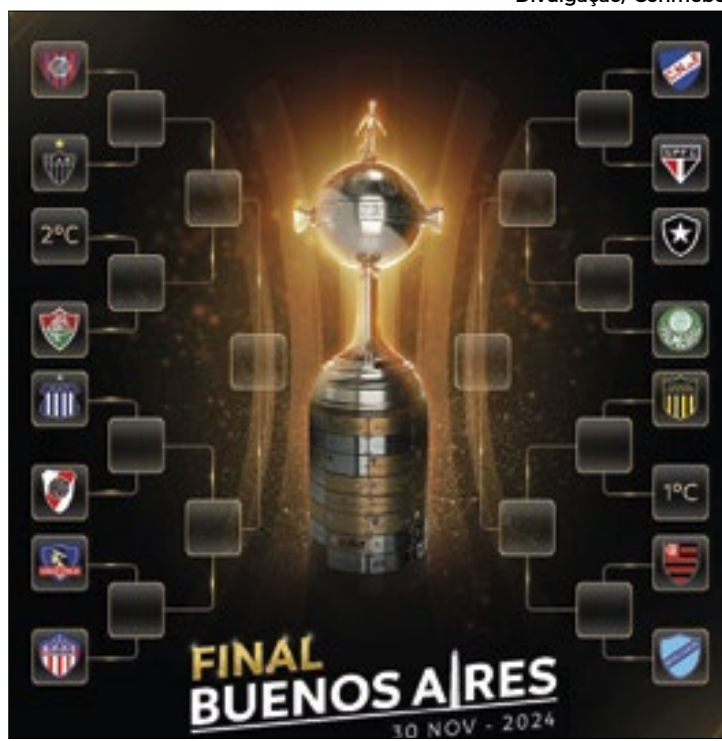
Assim ficaram os duelos pelas Oitavas da Libertadores

San Lorenzo (Argentina) x Atlético-MG; Nacional (Uruguai) x São Paulo; Flamengo x Bolívar (Bolívia); Colo-Colo