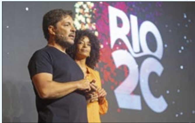
Evento acontece de 4 a 9 de junho, na Cidade das Artes