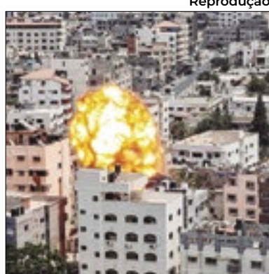
Proposta pelo fim da guerra

Um assessor do primeiro-ministro Binyamin Netanyahu confirmou no domingo que Israel aceitou os termos de acordo para parar a guerra na Faixa de Gaza proposto pelo presidente dos EUA, Joe Biden. Em entrevista ao jornal britânico The Sunday Times, o assessor de Relações Exteriores de Netanyahu, Ophir Falk, disse que a proposta de Biden "não é um bom acordo, mas queremos muito libertar os reféns, e por isso aceitamos".