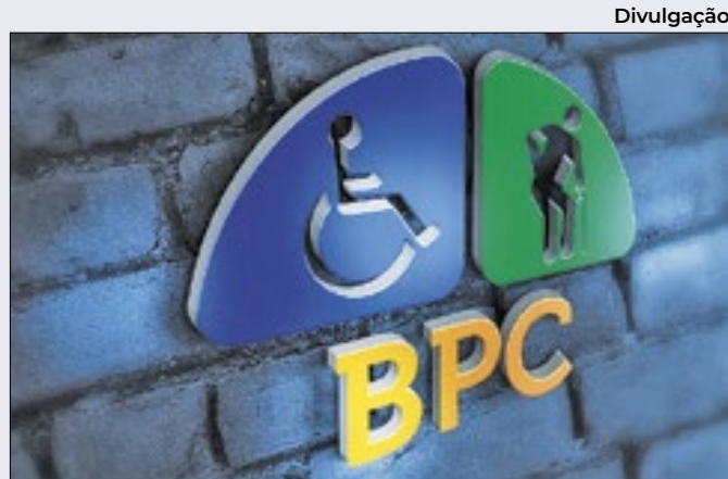
Ações judiciais ganhas por usuários pressionam BPC

Embora 'aposte' em um avanço mais expressivo para o PIB nacional em 2024 (2,2%), a XP, porém, adotou viés de baixa. Na avaliação de Margato, o impacto líquido negativo da situação no Rio Grande do Sul pode ficar entre 0,2 ponto percentual e 0,3 ponto do PIB.