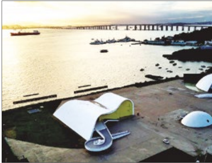
São João no Caminho Niemeyer terá diversas atrações