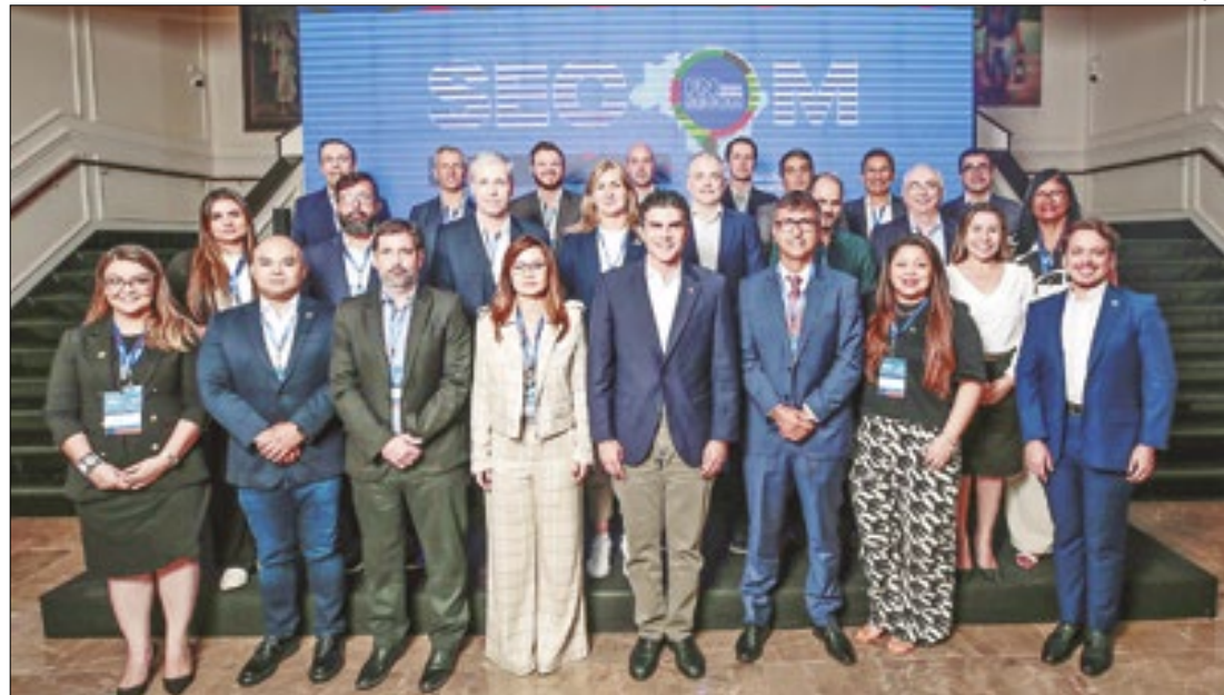
Depois do sucesso das reuniões realizadas na Bahia, Rio, Paraná e Belém, os secretários se reúnem em Brasília. Na foto, a última reunião realizada em Belém do Para. Ao centro o presidente do Fórum, André Curvello, com o governador do Pará Helder Barbalho

Outro ponto de destaque será a mesa redonda que vai explorar as tendências e perspectivas para as eleições