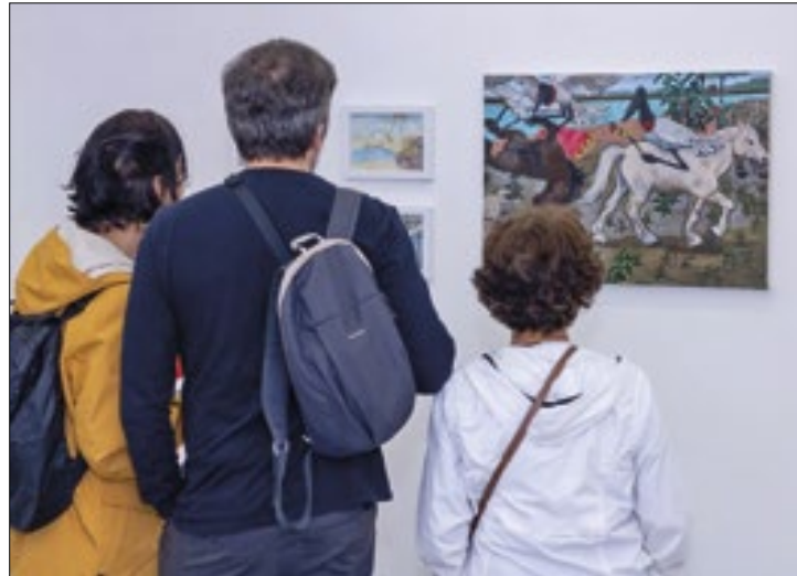
A nova galeria oferece espaço para artistas independentes