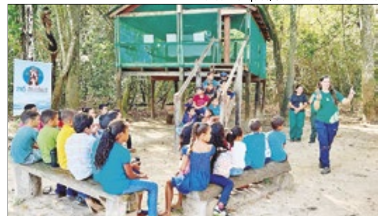
Estudantes aprenderam sobre as espécies de lontras