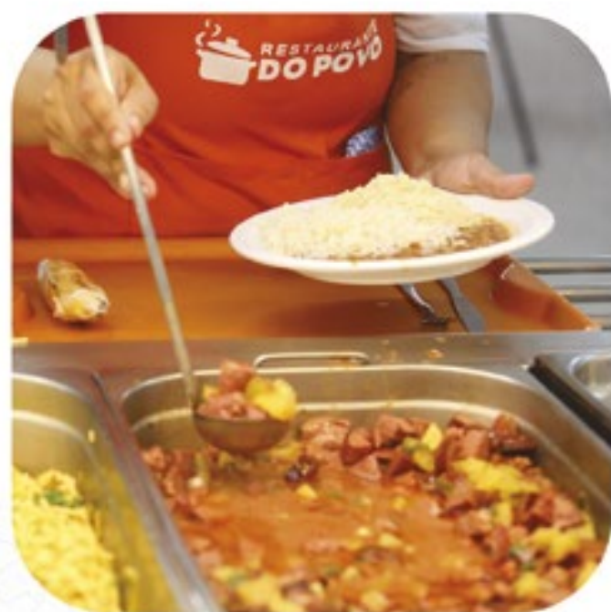
BARRA MANSÁ Entrega do Restaurante do Povo