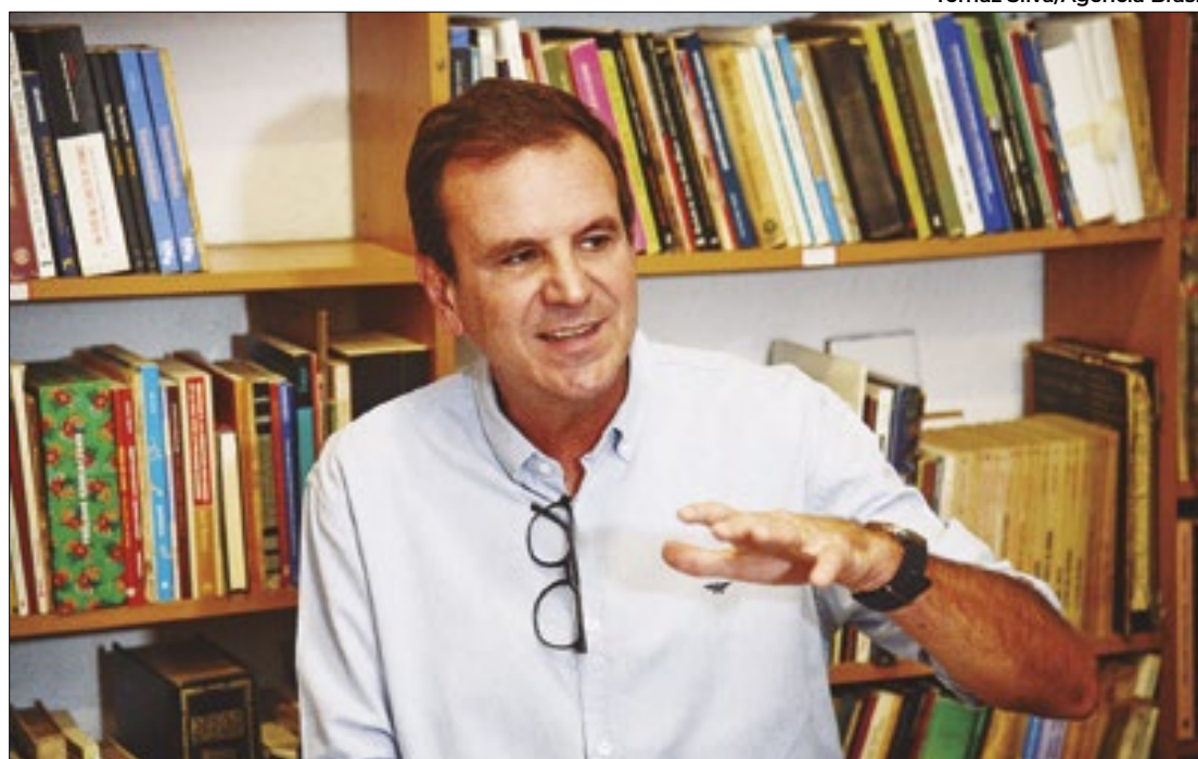
O PSD de Paes é o fiel da balança das eleições

Veja abaixo como está o quadro em cada capital: