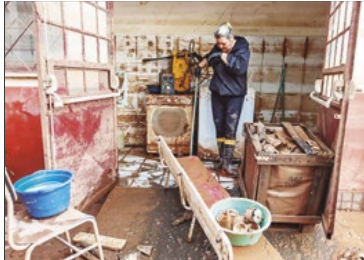
Mais de 47 mil famílias devem receber benefício

Regional, Waldez Góes, destacou a importância da rápida validação dos dados para que as famílias possam acessar o dinheiro e começar a reconstruir suas vidas. Góes também reforçou que o trabalho das prefeituras deve ser contínuo, alimentando o sistema constantemente para agilizar a liberação dos recursos.