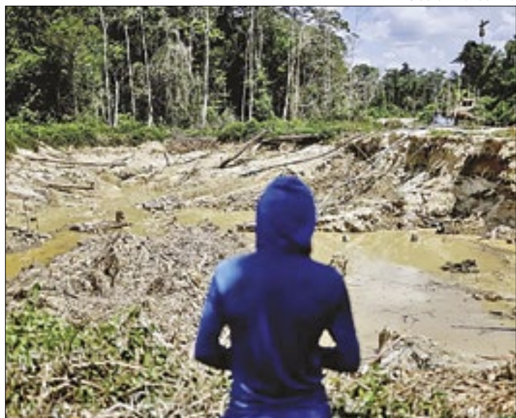
Reivindicação será feita em consulta aberta desde abril

O Movimento dos Atíngidos por Barragens (MAB) quer que as comunidades tradicionais sejam identificadas em mapas produzidos pelo Serviço Geológico do Brasil (SGB), órgão vinculado ao Ministério de Minas e Energia (MME). A reivindicação será apresentada em consulta pública que está aberta desde o dia 15 de abril. O SGB colhe contribuições para a construção do Plano Decenal de Mapeamento Geológico Básico (PlanGeo) 2025-2034.