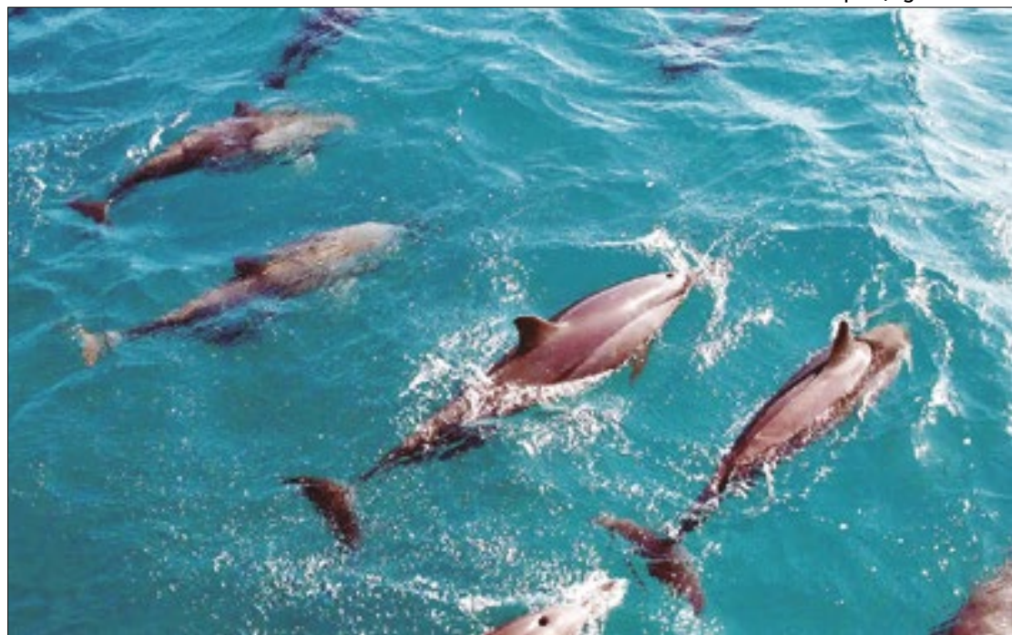
Pesquisadores de Santa Catarina buscam rotas focadas na fauna

“O turismo pode ser tanto um vilão nesse processo para a biodiversidade, quanto um aliado. Se feito de forma responsável, sustentável, respeitando a vida, as espécies que ocorrem naquele local, ele é um aliado, pois ajuda a valorizar