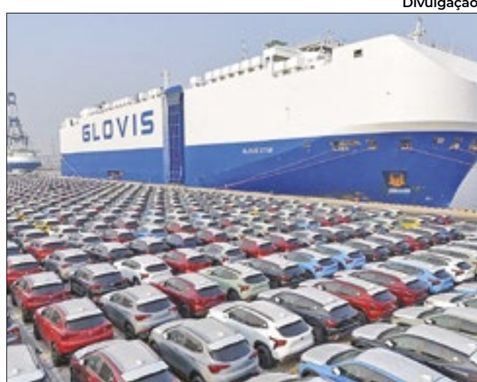
Interdição de veículos não tem prazo para terminar