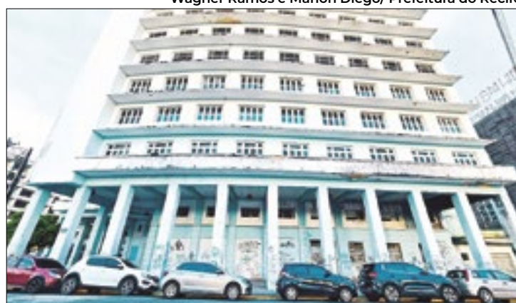
Terrenos serão destinados ao Instituto Federal de Educação