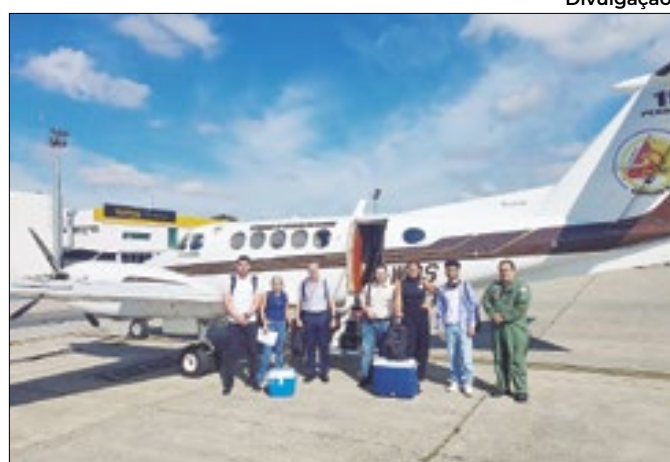
Rapidez no transporte garante que o órgão chegue