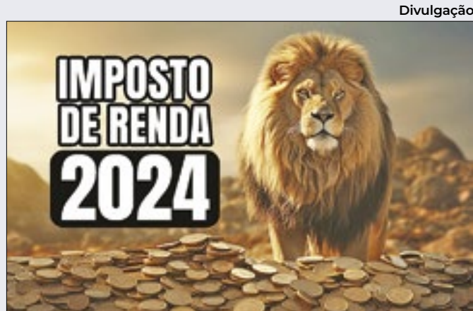
Divulgação Preenchimento prévio favoreceu resultado deste ano

Primeira etapa Embora a paralisação imobilize 1,2 mil contêineres (entre peças, componentes, carros a combustão e híbridos), o estudo, em sua primeira etapa, se ateve ao segmento automotivo, conforme admite o economista-chefe da CNC, Felipe Tavares, por meio de nota oficial.