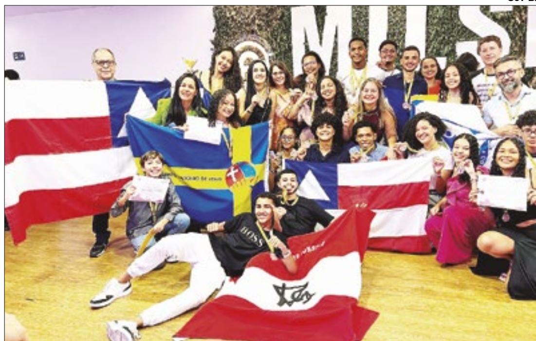
Projetos de estudantes baianos recebem reconhecimento na Expo Milset Brasil 2024

Projetos promovem a iniciação científica entre estudantes