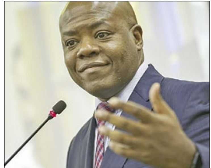
Anúncio foi feito sábado, em SP, pelo ministro Sílvio Almeida

Há também o projeto-piloto de trabalho digno e geração de renda voltado a pessoas LGBTQIA+ (Empodera+), incluindo preparação e ocupação no mercado de trabalho e visando à autonomia econômica e financeira. Para a execução do projeto, foram assinados na última quinta-feira (31) parcerias com a Fundação Jorge Duprat Figueiredo de Segurança e Medicina do Trabalho (Fundacentro) e o Banco do Brasil. Os recursos específicos para o projeto são