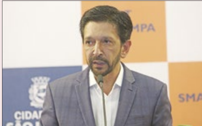
Outros conservadores tiram votos de Nunes