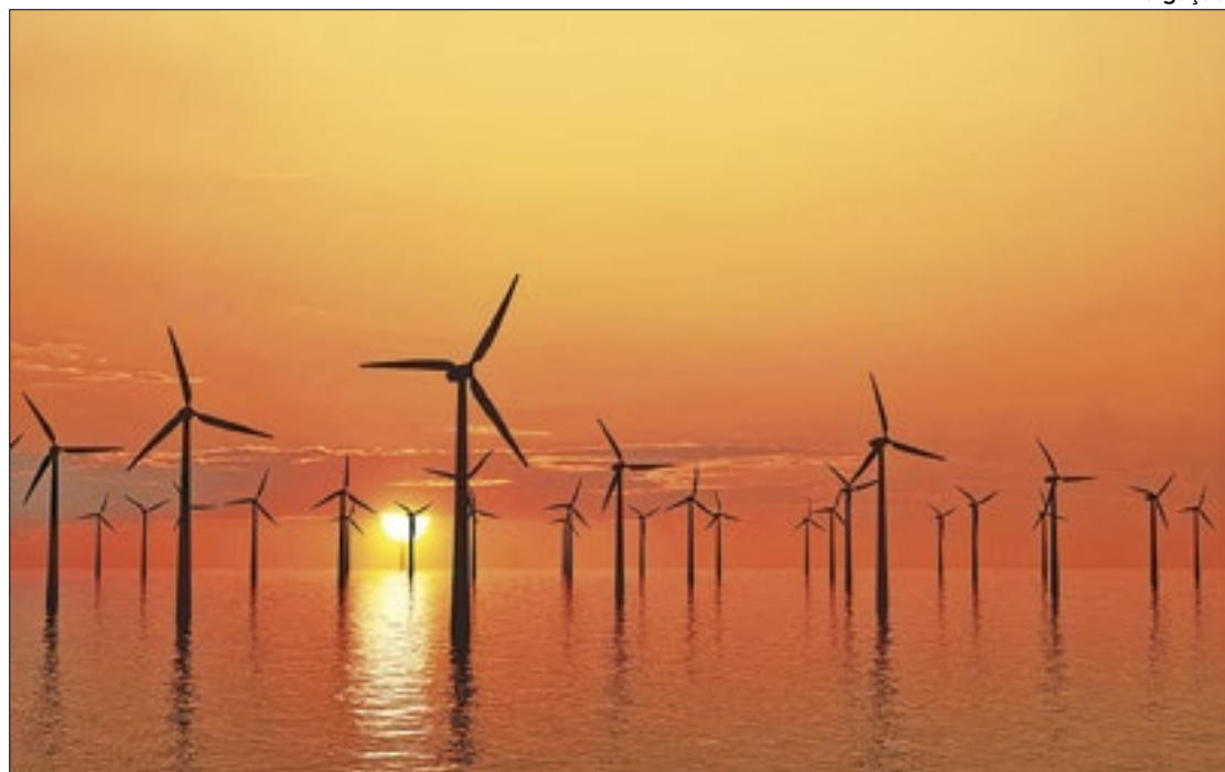
Expectativa é de que projetos renováveis devem impulsionar economia fluminense

Promovido por Firjan Senai, Sebrae RJ e Prefeitura Municipal de Macaé, o evento deve reunir representantes da indústria, de instituições e do Poder Público, em que serão debatidos temas como eficiência, transição e integração energética, visando meios para que esses projetos 'deixem o papel e se tornem realidade'.