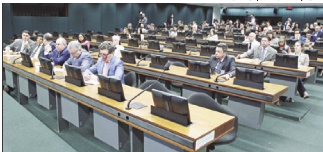
GT da Tributária fará seis reuniões esta semana

Na quarta-feira (5), também serão duas sessões. Uma sobre o cashback (sistema que devolverá parte da cobrança de impostos sobre água, gás e energia para a população mais carente), a cesta básica e a tributação sobre os demais alimentos. Na outra sessão, a discussão será sobre regimes diferenciados, profissões regulamentadas, serviços de educação e saúde, entre outros. A última sessão da semana será na quinta-feira (6), na qual os deputados devem discutir os regimes específicos e continuarão o debate sobre regimes diferenciados.