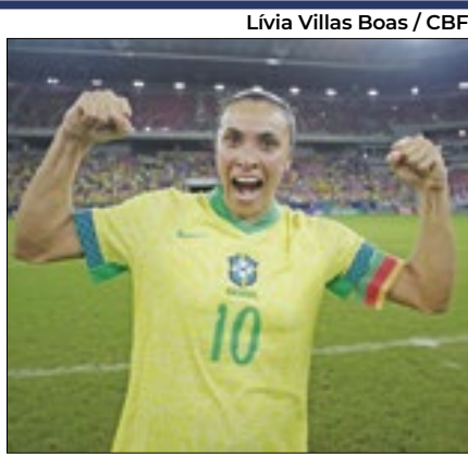
Marta está repensando aposentadoria

Com a confirmação da tão sonhada Copa do Mundo Feminina de Futebol no Brasil em 2027, a Rainha Marta passou a repensar em sua aposentadoria da Seleção Brasileira. Inicialmente, a melhor jogadora da história afirmou que essa seria sua última temporada jogando pela Seleção. Porém, aos 38 anos, Marta admitiu que pode prolongar sua passagem pela Seleção para realizar o sonho da Copa no Brasil.