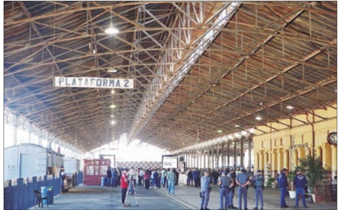
Governador Tarcísio de Freitas autorizou nesta quarta-feira (29), em Campinas

A cerimônia reuniu secretários estaduais, deputados, prefeitos e vereadores, além de executivos brasileiros e chineses do consórcio que vai implementar, operar e manter os três serviços da concessão do TIC Eixo Norte ao longo de 30 anos. A estimativa é de 672 mil passageiros transportados por dia quando o sistema estiver em plena capacidade. O TIC será o serviço expresso em 101 km de trilhos entre São Paulo e Campinas, com parada em Jundiaí, o empreendimento engloba ainda a implantação do Trem Intermetropolitano (TIM) entre Campinas e Jundiaí e a concessão da Linha 7-Rubi, atualmente operada pela Companhia Paulista de Trens Metropolitanos (CPTM) na ligação de Jundiaí até a capital. O TIC Eixo Norte irá beneficiar cerca de 15 milhões de pessoas em 11 municípios e gerar mais de 10,5 mil empregos, entre diretos, indiretos e induzidos.