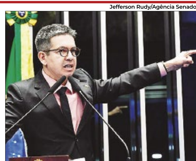
Líder quer “batalhões” contra os rugidos da oposição