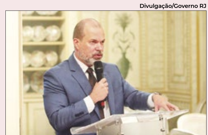
Secretário de Fazenda do Rio prevê obstáculos

Diz que o Congresso tem um “defeito de origem”, seu viés conservador. Frisa que o governo vence em temas importantes, como na pauta econômica, mas perde na de costumes e direitos humanos. “Marcamos ponto no sambarenredo e perdemos em alegoria”, ironiza.