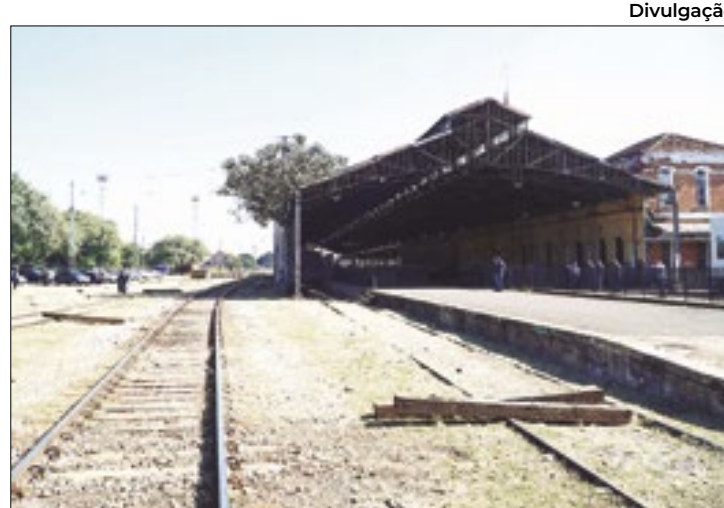
Trem Intercidades (TIC) Eixo Norte Estação de trem Campinas