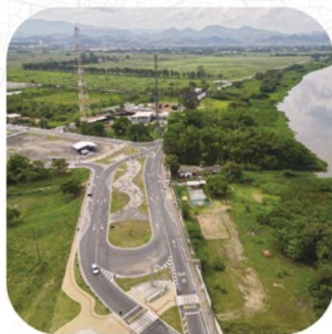
PORTO REAL Novo Acesso Leste: investimento na mobilidade urbana da cidade

A região do Médio Paraíba está com diversas novidades. Com o Governo Presente, continuamos investindo e levando mais qualidade de vida e desenvolvimento para todo o estado. Saiba mais: www.rj.gov.br