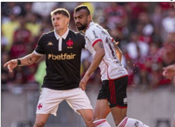
Flamengo aplicou uma virada histórica sobre o Vasco

Em tarde de extremos, os torcedores do Flamengo deixaram o Maracanã com sorriso de ponta a ponta, após verem o time aplicar um histórico 6 a 1 sobre o arquirrival Vasco da Gama. Pelo lado Cruzmaltino, a humilhação sofrida na estreia do técnico Álvaro Pacheco deixou a torcida sem muitas esperanças para o restante da temporada.