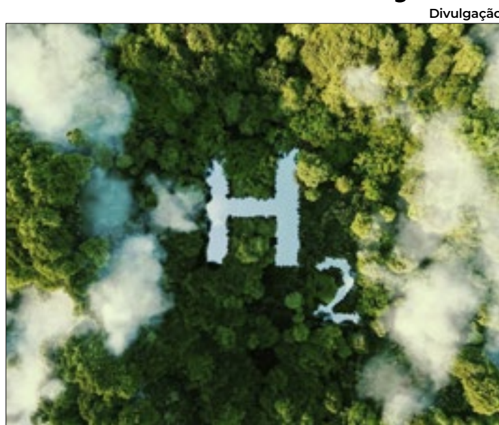
Divulgação Polímero é uma das apostas para produzir hidrogênio verde

A inovação, porém, admitem especialistas, enfrenta o desafio de superar os altos custos de produção da iniciativa. Segundo eles, 'quanto maior a concentração de nanotubos, menor a demanda de energia para a obtenção do hidrogênio verde'. Para melhor entendimento, explica-se que os nanotubos de carbono desse sistema possuem largura correspondente a um diâmetro de um fio de