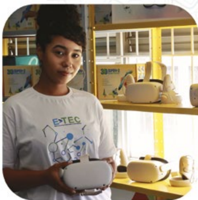
VOLTA REDONDA Inauguração da E-Tec: Escola de Novas Tecnologias e Oportunidades