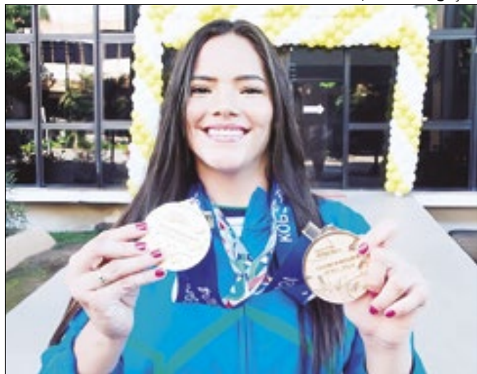
Recordista mundial, Wanna Brito desfilou em Macapá