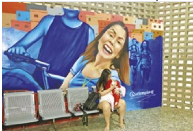
Unidade de saúde oferece 13 especialidades médicas