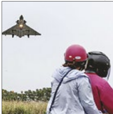
Foram avistados 38 aviões