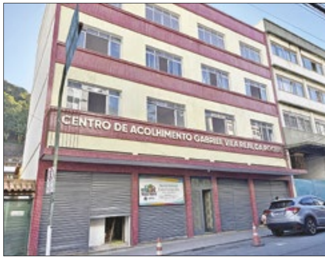
Centro de Acolhimento dos desabrigados das chuvas