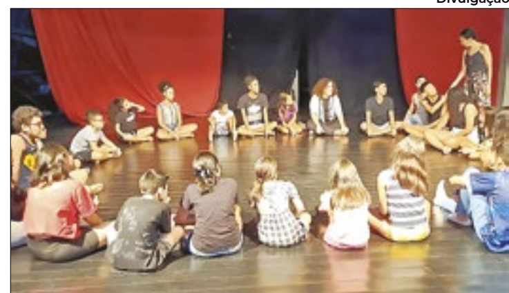
Projeto inclui a participação de pais e responsáveis