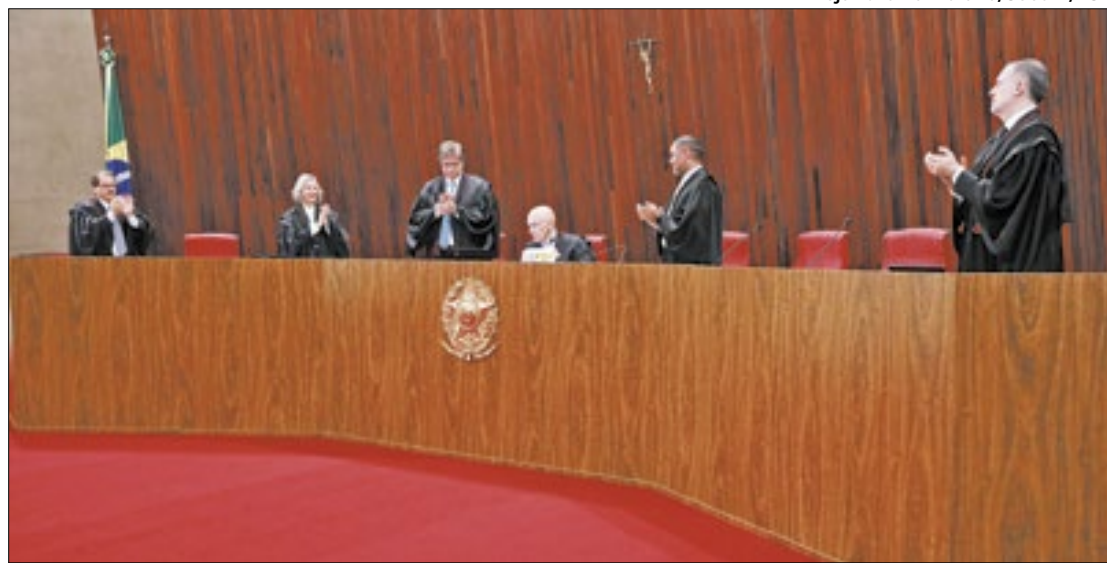
Moraes presidiu sua última sessão no TSE na quinta-feira (29)

Mesmo com as diferenças, Cármen Lucia irá lidar com a mesma onda de polarização que tomou conta do país nos últimos anos, mesmo em eleições para as prefeituras. Em São Paulo, por exemplo, o levantamento divulgado na quinta-feira (29) pelo Datafolha mostra um empate na liderança do pleito entre o deputado federal Guilherme Boulos (Pso) e o prefeito Ricardo Nunes (MDB).