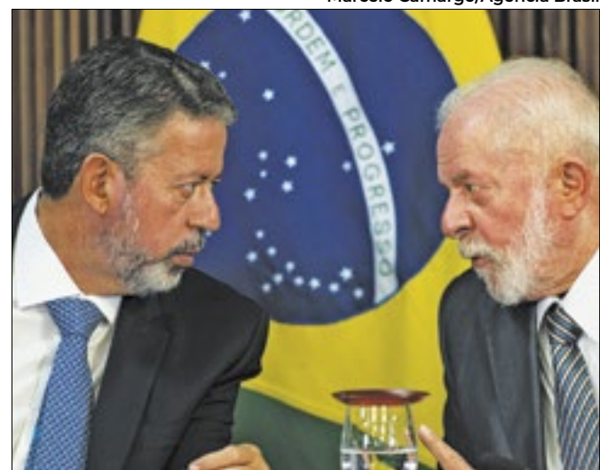
Presidente da Câmara Lira conseguiu o apoio de Lula