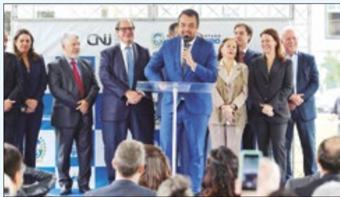
Iniciativa faz parte do projeto Solo Seguro Favela, do CNJ