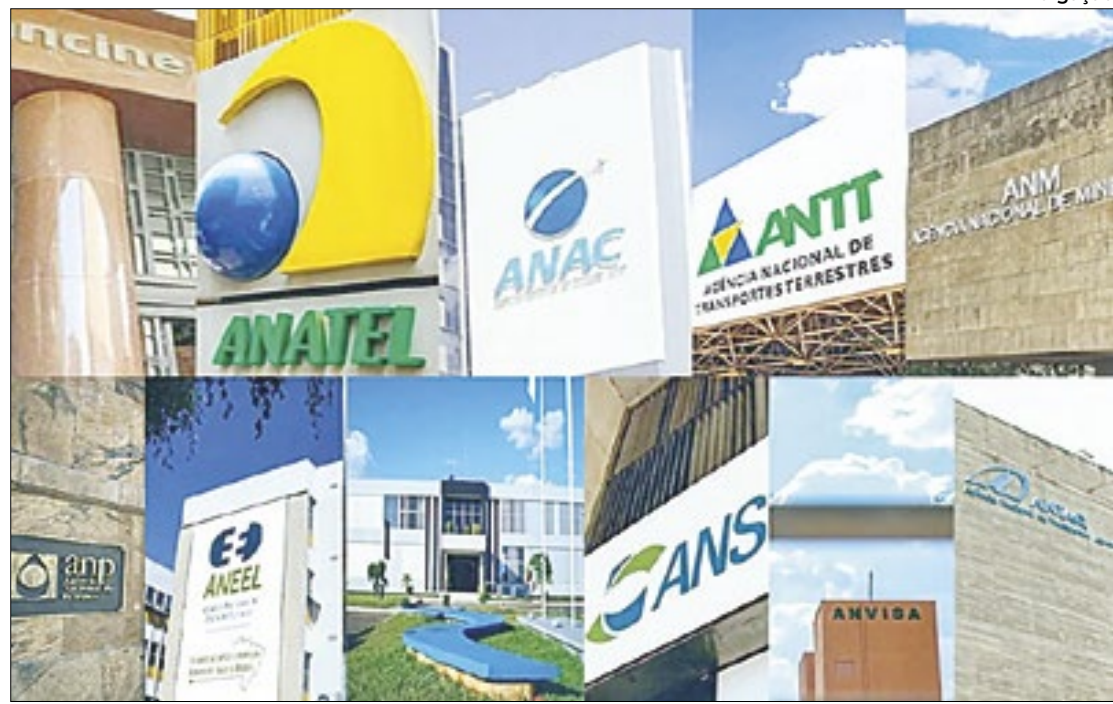
'Tesoura' do Executivo atingiu 'em cheio' capacidade operacional de reguladoras

Ainda segundo a nota, "como se não bastasse, atualmente, mais de 65% dos cargos do quadro de pessoal das Agências está vago, o que decorre de aposentadorias, exonerações e falecimento de servidores, sendo que o número de vagas au-