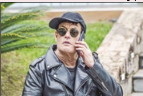
Sinônimo de risadas garantidas, o humorista Sérgio Mallandro volta às telas com o longa 'Mallandro - O Errado que Deu Certo'