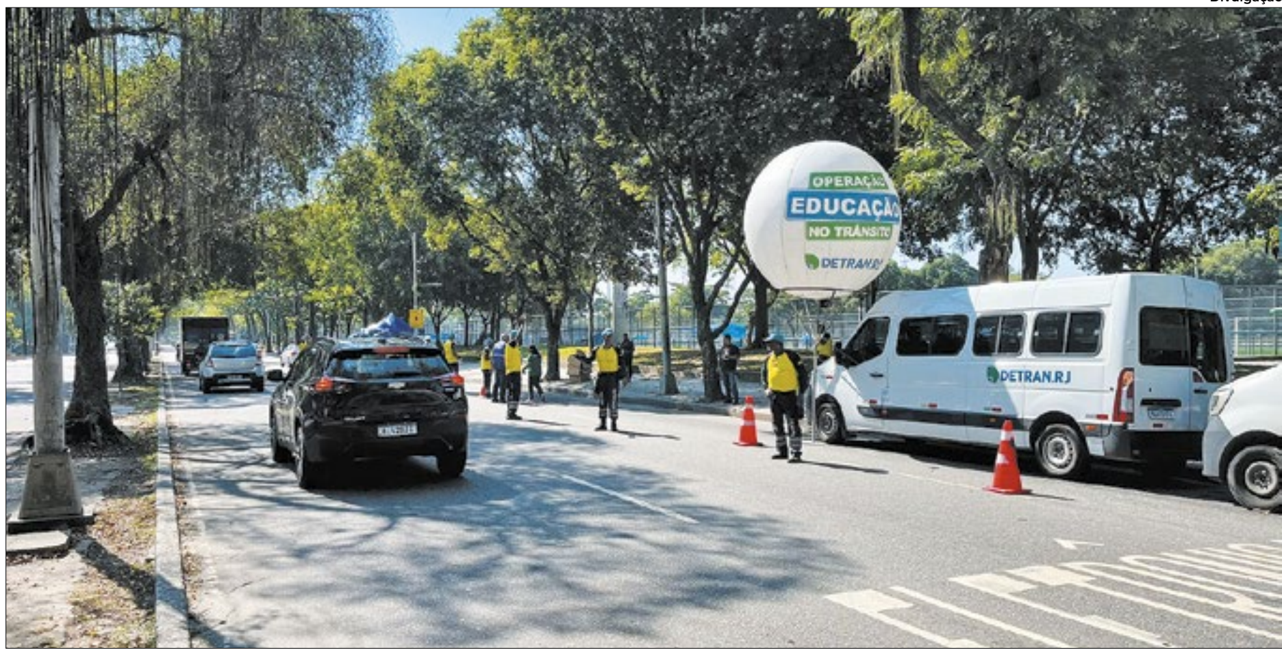
Ação promovida pelo Detran-RJ no Aterro do Flamengo. Entorno do Estádio Nilton Santos (Engenhão) também recebeu campanha de conscientização

Durante a mobilização, foram distribuídas antenas corta pipa, além de folders informativos. Coletes para mototaxistas e motofrentistas também foram distribuídos aos condutores presentes.