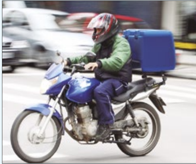
Vereador destaca importância de motoboys