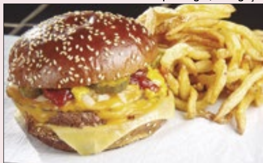
O hambúrguer do Encarnado é uma das opções do succulento roteiro que o Correio preparou pra você na data em que se celebra o famoso sanduíche