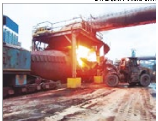
Drogas são incineradas na CSN

Em uma operação feita pela Polícia Civil foram incineradas, na quarta-feira, dia 29, pelo menos duas toneladas de drogas na Usina Presidente Vargas, da (CSN) Companhia Siderúrgica Nacional, em Volta Redonda, sul do Estado do Rio de Janeiro.