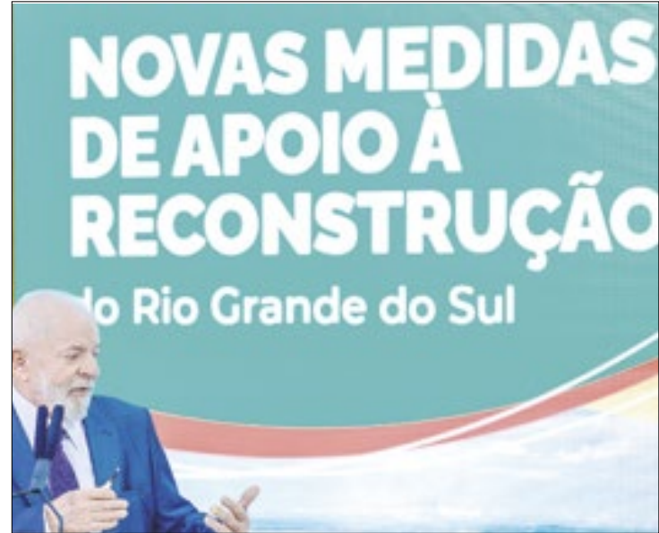
Lula: “É preciso recuperar o direito de o povo gaúcho respirar”