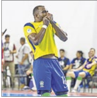
Brasil conhece rivais da Copa