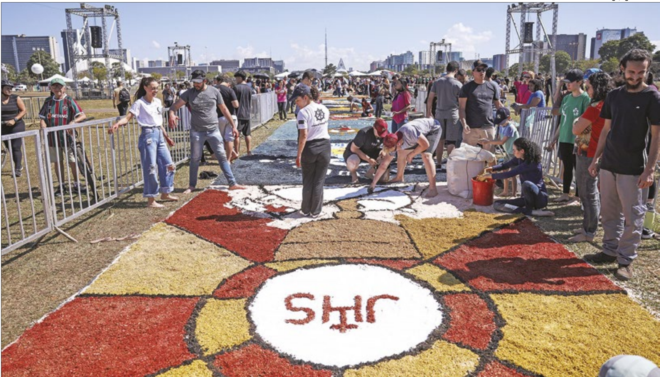
Fiéis confeccionam os tradicionais tapetes de Corpus Christi na Esplanada dos Ministérios, em Brasília. Tradição esta presente em outros municípios brasileiros