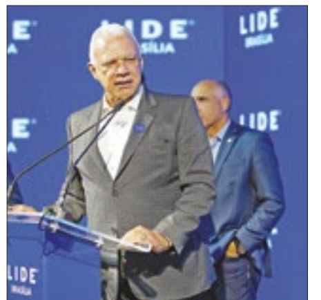
Secretário de Estado de Governo do Distrito Federal, José Humberto