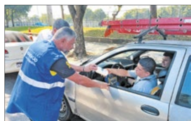
Brindes para os participantes do Aterro