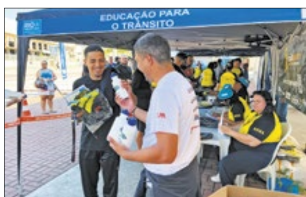
Brindes também foram oferecidos no Engenhão