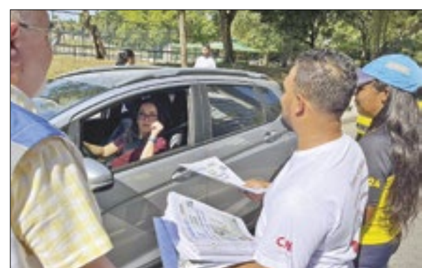
Condutora é abordada durante ação no Aterro