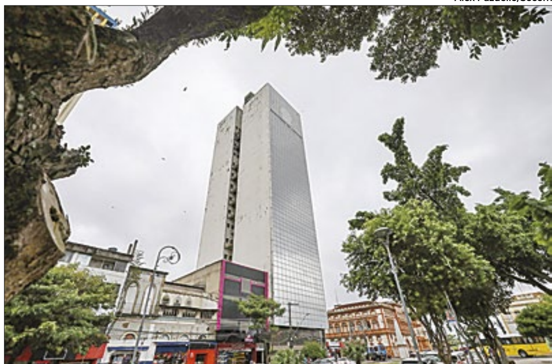
Complexo tem capacidade para até 85 famílias, podendo ser expandida para 128