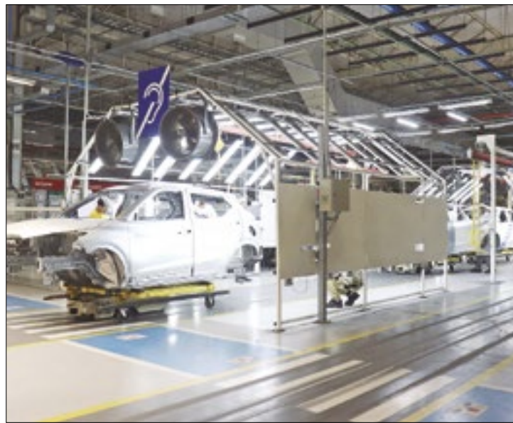
Fábrica de Resende tem 34 vagas de emprego

A fábrica de carros Nissan está com vagas de trabalho temporárias para a unidade de Resende: são 34 postos para os turnos de 7h às 19h e de 19h às 7h. Os interessados devem enviar currículo para contato@cp3empreendimentos.com.br. São as seguintes vagas que estão abertas: Quinze para mecânico de manutenção; quinze para eletricista industrial; duas para encanador industrial e duas para mecânico pneumático.