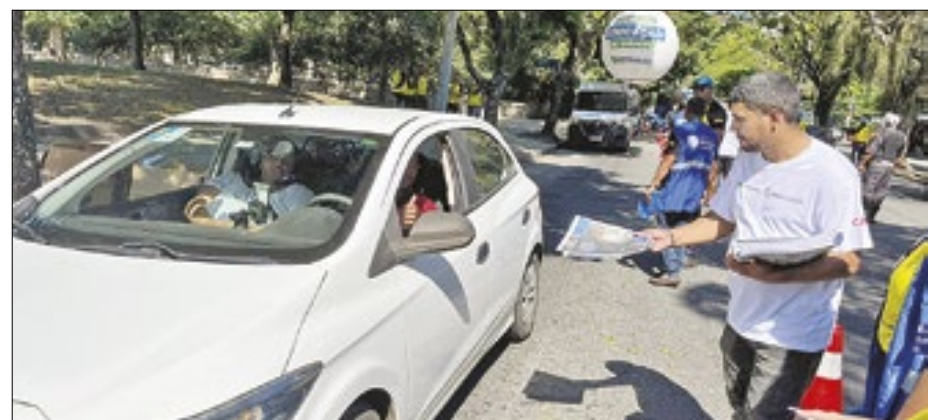
Motoristas abordados no Aterro recebem material informativo