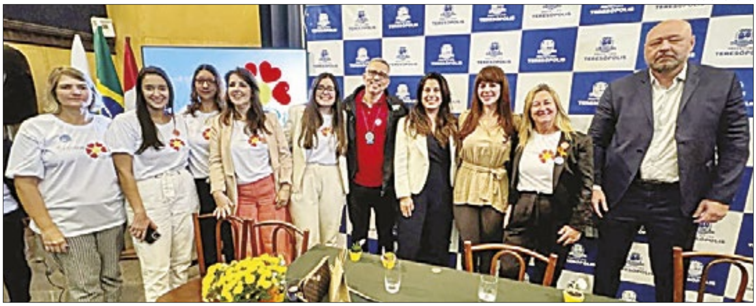
Programa que conta com participação das forças de segurança, em 2017, foi incluído na lista da Childhood Brasil

Segundo as diretrizes da Portaria 2.914/2011, consiste em adicionar duas gotas de hipoclorito de sódio a 2,5% (água sanitária) para cada litro de água filtrada e aguardar 30 minutos antes do consumo.