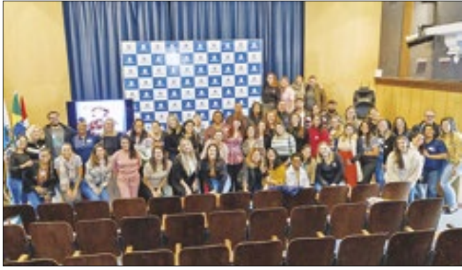
Celebração ocorreu no Teatro Municipal