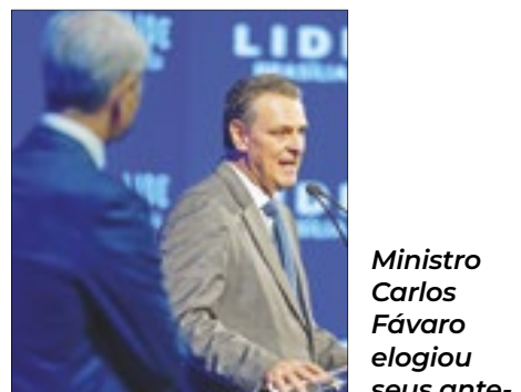
Ministro Carlos Fávaro elogiou seus antecessores