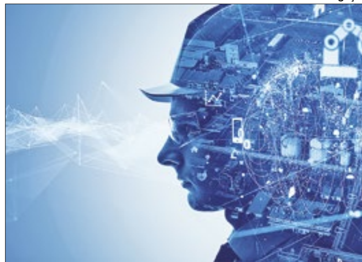
Programa visa renovação de maquinário industrial

Na avaliação do diretor de Desenvolvimento Industrial da CNI, Rafael Luchesi, "a depreciação acelerada é usada pelas principais economias do mundo, por conta da capacida-