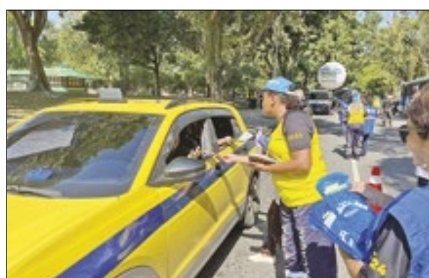
Táxi é abordado durante blitz educativa