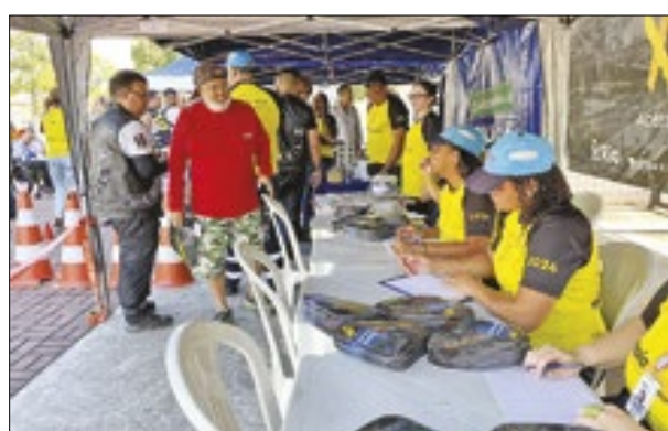
Participantes ganharam material educativo