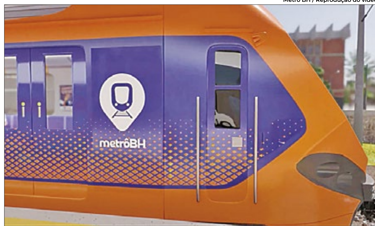
Metrô BH / Reprodução do vídeo

Modernização vai proporcionar mais conforto e regularidade