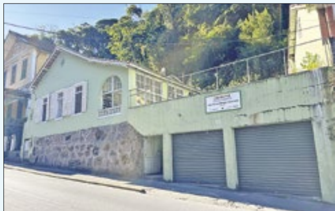
Centro de atendimento é inadequado, aponta MPRJ