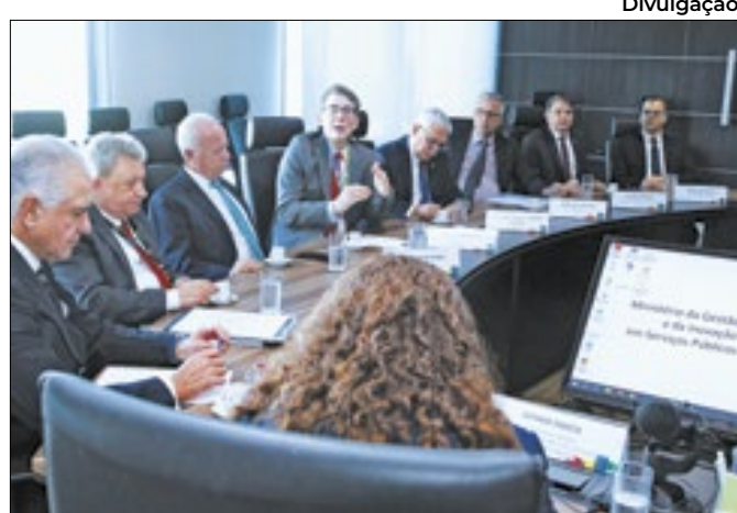
Encontro reuniu representantes de diversas empresas

Pedido visa a volta das perícias médicas e psicológicas ao interior