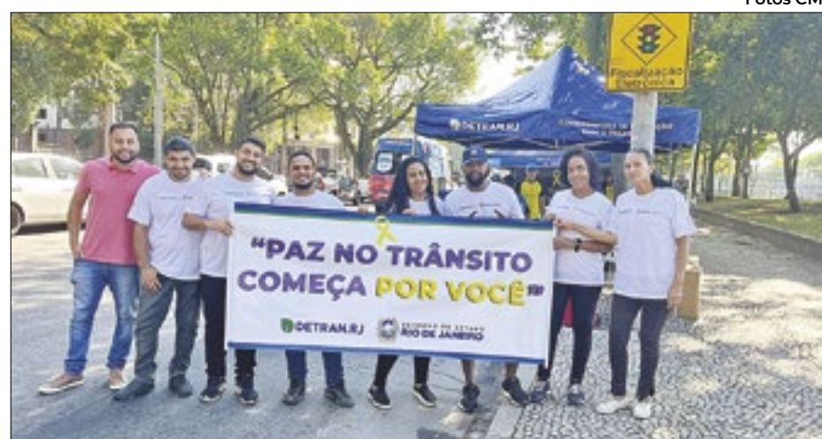
Equipe do Correio da Manhã na ação do Aterro do Flamengo