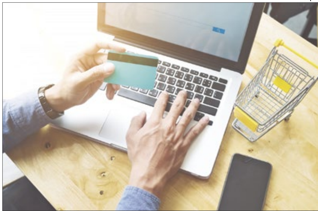
Compras de sites estrangeiros até US$ 50 serão taxadas em 20%

“Não estava prevista [a votação do Mover na Ordem do Dia]. Não foi possível ter o estudo devido do texto no âmbito do Senado Federal. Agora no começo da semana vou submeter aos líderes a ponderação do Projeto Mover. Vamos fazer uma ponderação de avaliação se é possível levar direito a medida ao plenário do Senado Federal, permitindo que, com algum tempo, os senadores e senadoras possam se debruçar sobre o projeto da melhor forma possível”, disse Pacheco.