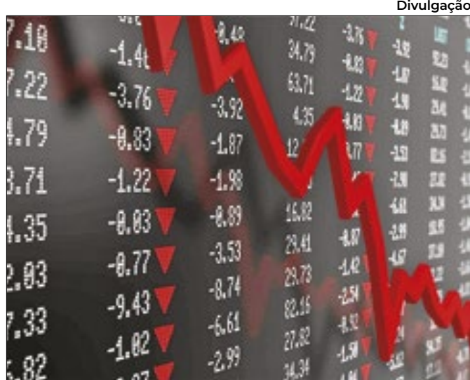
Combinação de fatores negativos derruba bolsa brasileira