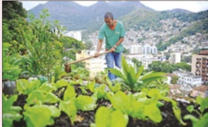
Agricultura feita de modo sustentável é o caminho