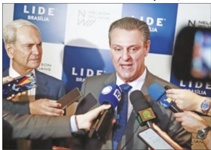
Fávaro: importação para evitar alta no preço do arroz

O ministro foi duro em seu discurso no Lide. Mas destacou que essa disseminação de informações falsas não foi feita pelos próprios agricultores. “É uma maldade que não tem cabimento. Infelizmente, eu fico com a impressão de que o inferno está virando um espaço pequeno diante de tanta maldade”, disse o ministro. Segundo ele, diante do drama das chuvas, pessoas espalharam que haveria colapso na