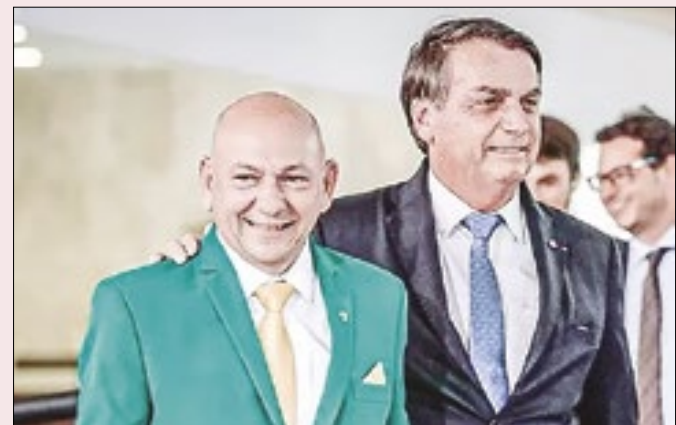
Empresário do setor de varejo convenceu Bolsonaro