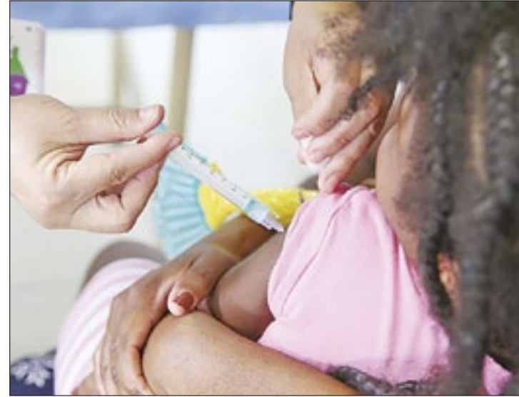
As vacinas estão disponíveis a toda população acima de 6 meses de idade

Os vírus influenza A e B são responsáveis por epidemias sazonais, os principais sintomas são febre, dor de garganta, tosse e dor no corpo. A vacinação é a forma mais eficaz de preven-