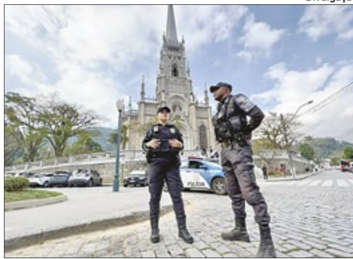
Petrópolis é uma das cidades mais seguras do estado

Um dos fatores que mais influencia na qualidade de vida é a segurança da população. "Existe um movimento migratório acentuado para Petrópolis, principalmente de cariocas se estabelecendo aqui. Isso mostra como nossa cidade é ambicionada por sua qualidade de vida. E queremos manter esse status