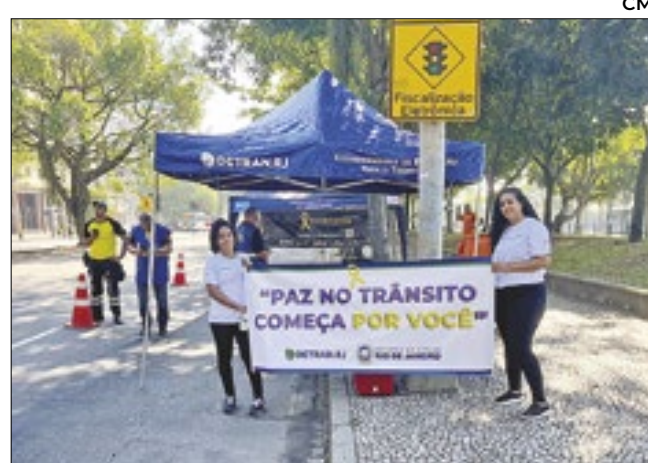
Ação Detran Maio Amarelo no Aterro do Flamengo