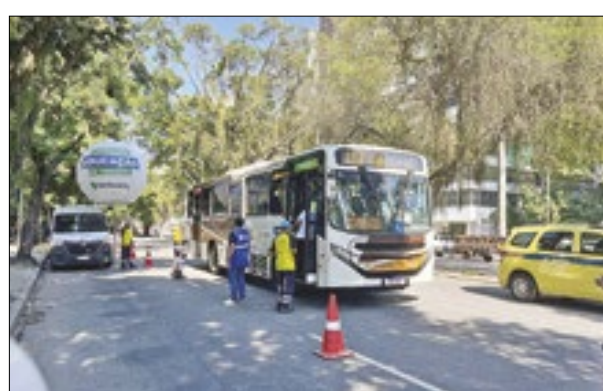
Motoristas de ônibus foram orientados