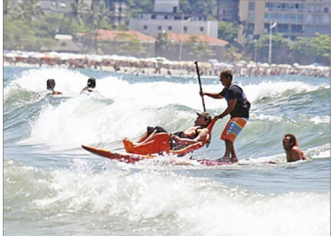
No ‘Dream Challenger’, pessoas com mobilidade reduzida podem surfar com inclusão