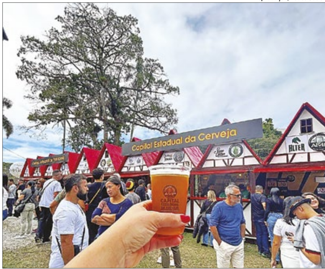
Cidade possui mais de 20 marcas de cerveja artesanais e promove eventos segmentados

Petrópolis já é considerada "Capital Estadual da Cerveja", um incentivo feito pelo Estado do Rio de Janeiro que regulamentou o setor e possibilitou a expansão de produtores independentes. Agora, com mais um título, que deu um reconheci-