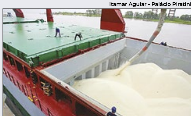
Primeiro leilão de importação deve ocorrer em 6 de junho

Entre as variáveis que tornaram 'fraco' o volume de negociações (R$ 14 bilhões), portanto, abaixo da média (R$ 17 bilhões) nos últimos 12 meses, o destaque ficou para o mercado de trabalho aquecido (criação de 240 mil vagas) e a decorrente pressão sobre a inflação.