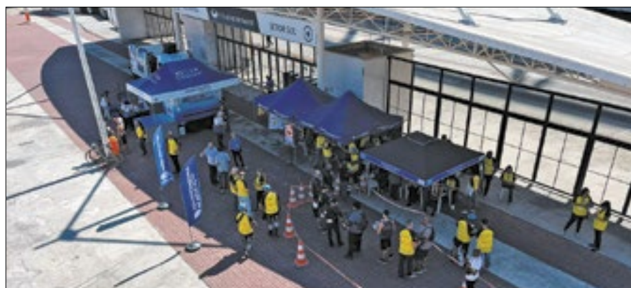
Evento foi do lado de fora do estádio Nilton Santos (Engenhão)