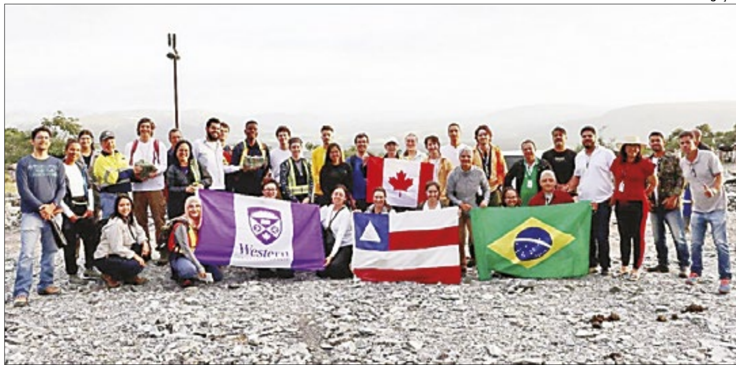
Ideia surgiu após experiência internacional de campo entre estudantes