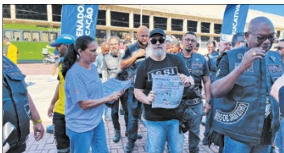
Ação realizada no Engenhão foi voltada para os motociclistas

Iniciativas aconteceram nas Zonas Norte e Sul, e tiveram apoio do Correio da Manhã