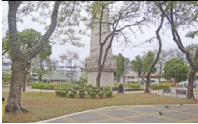
Volta Redonda fecha geração de empregos no azul