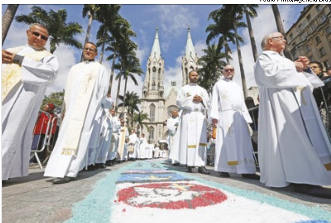
Em SP, uma missa campal da Solenidade de Corpus Christi foi celebrada na Praça da Sé

Em São Gonçalo, na região metropolitana do Rio, os fiéis mais uma vez fizeram o maior tapete do estado. Com dois quilômetros de extensão, já foi recorde na América Latina, lugar ocupado atualmente por Curitiba. “A gente vê muita alegria do povo que vem para preparar, organizar e deixar bem bonito aqui, celebrando Jesus Cristo”, comentou o bispo auxiliar da Arquidiocese de Niterói, dom Geraldo de Paula. A arquidiocese é composta de 14 cidades, entre elas, São