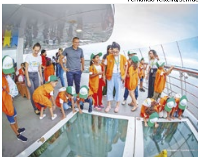
Grupo encerrou programação no Mirante Edileusa Lóz