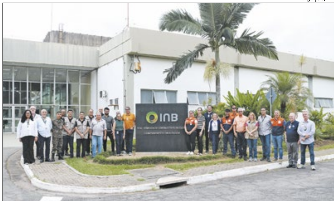
Comitê que reúne representantes de vários órgãos discute simulado de emergência nuclear