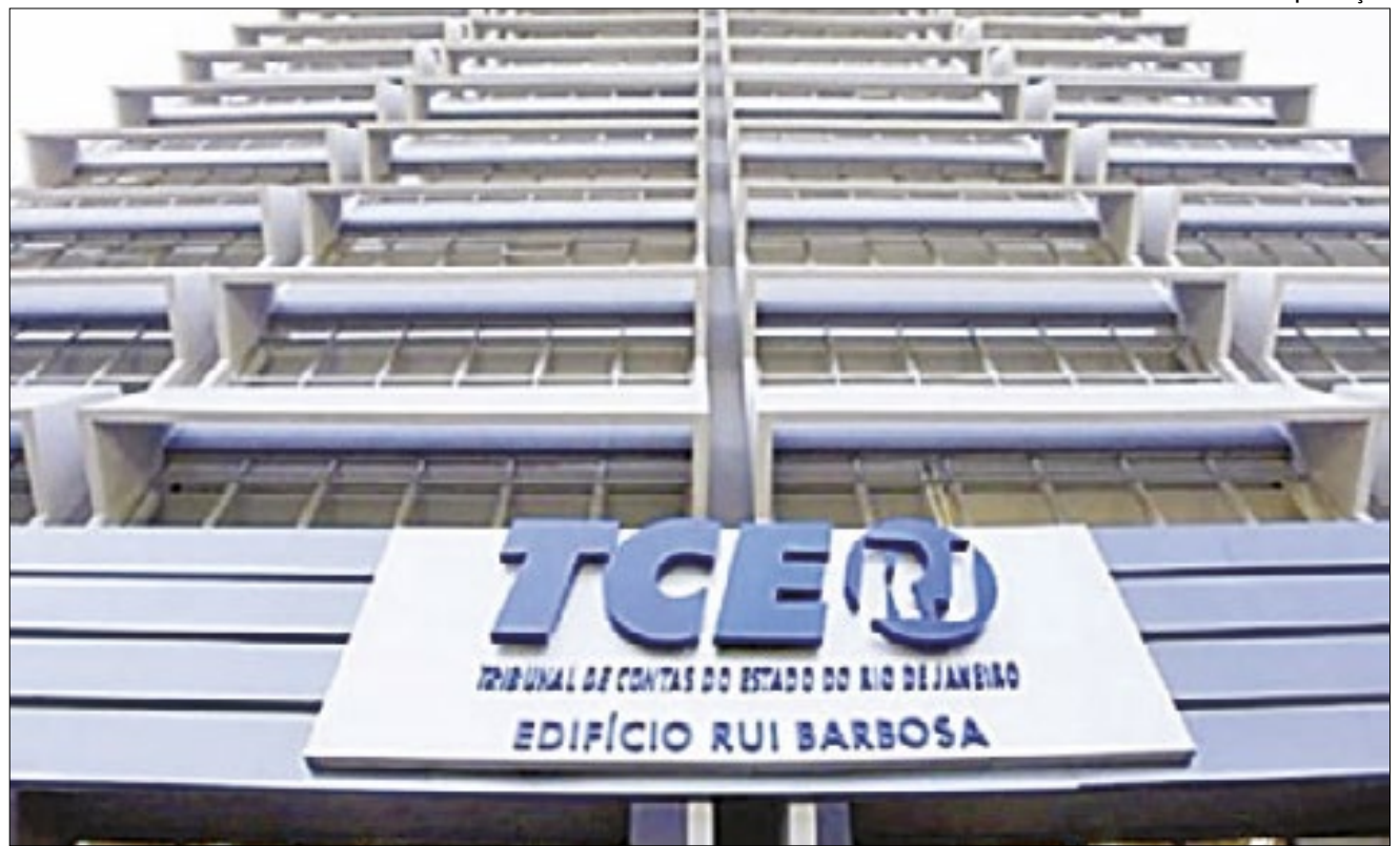
Todos os conselheiros seguiram o parecer favorável do relator, José Maurício de Lima Nolasco

rem pela não participação na prova, podem solicitar a devolução da taxa até o dia 09 de julho. Estão disponíveis 54 vagas para Ensino Superior + cadastro de reserva; 24 vagas para ensino médio; 21 vagas para ensino médio e 13 vagas para ensino fundamental.