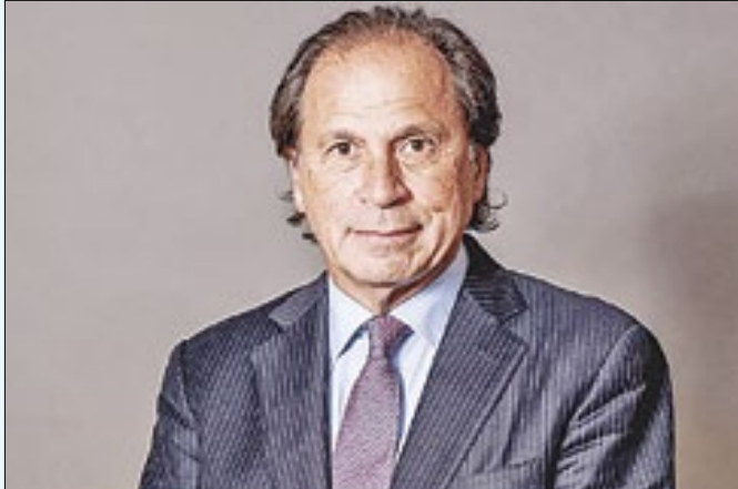
CSN de Steinbruch tem lucro de R$ 851 milhões no 4T23