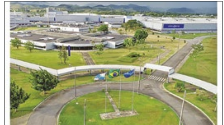
Fábrica de carro no município de Porto Real (RJ)