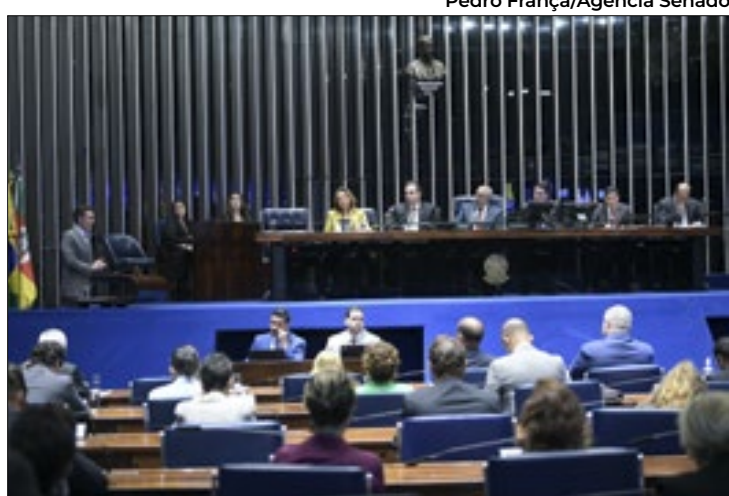
Senadores e governo discutiram questão climática

“Esse debate precisa começar a amadurecer a ideia de que precisaremos de medidas preventivas e efetivas para os desafios climáticos. Precisamos aprimorar a nossa capacidade de resposta aos eventos climáticos extremos”, afirmou Pacheco.