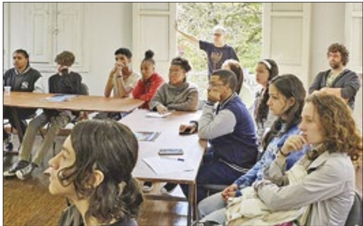
Primeira oficina de roteiro com os alunos do projeto