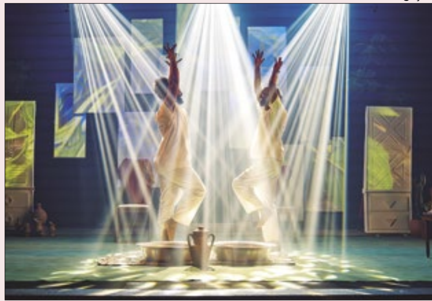
A premiada peça 'Angu' é um dos espetáculos do festival