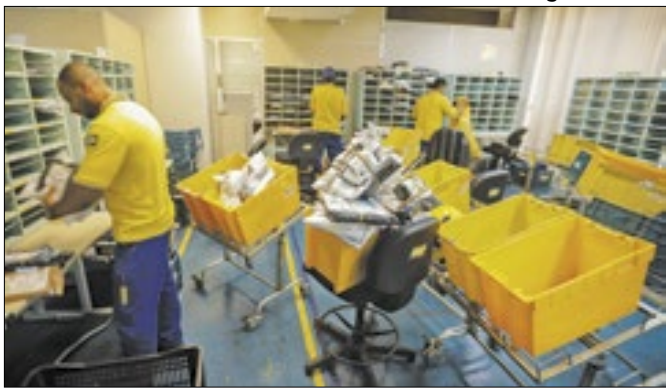
Unidade de distribuição dos Correios em Teresópolis