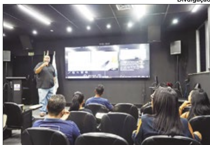
Ações sobre empreendedorismo serão nos dias 04 e 06/6