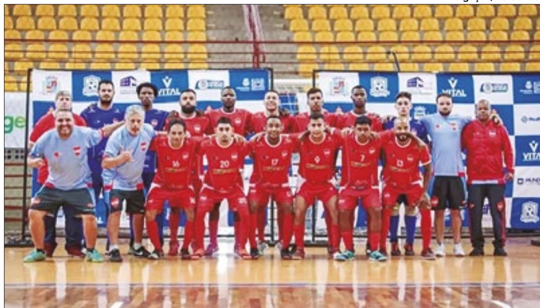
Elenco campeão da Copa Integração 2024 (sede: Santos Dumont)

Entre as ações realizadas pelos alunos da faculdade estão: