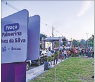
Espaço de lazer e esportes

A Prefeitura de Cachoeiras e o Governo do Estado, através da Secretaria de Estado das Cidades, inauguraram na última semana a Praça Palmeirinha Alves da Silva