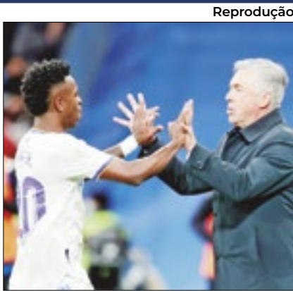
Vini Jr. melhorou com Ancelotti

Vinicius Jr. disse que não queria mudar de posição e Carlo Ancelotti precisou convencê-lo à mudança. Acostumado à ponta esquerda, Vini atuou por dentro no jogo de ida das quartas de final da Liga dos Campeões contra o Manchester City, enquanto Rodrygo ficou mais à esquerda. Ele assume que a alteração contribuiu para que ele evoluísse mais do que em outros anos. Hoje, ele é favorito à Bola de Ouro.