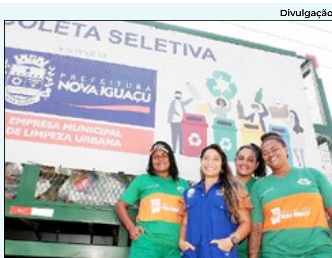
Coleta seletiva chega a todos os bairros da cidade