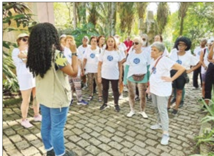
Idosos das casas de convivência Maria Haydée e Lolita Rodrigues trocam experiências e conhecem pontos turísticos

Idosos das oito Casas de Convivência do município estão participando de atividades enriquecedoras, com intercâmbio entre as unidades e visitas a pontos turísticos do Rio. Trinta pessoas participarão das atividades por vez, percorrendo o caminho de uma casa para outra e visitando pontos turísticos ou relevantes da casa a ser visitada. Essa iniciativa visa estimular a troca de experiências, promover o desenvolvimento cognitivo e criar memórias significativas.