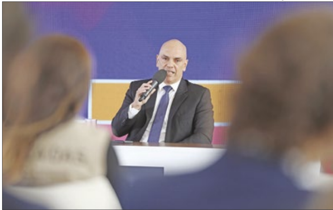
Alexandre de Moraes rejeitou o recurso da defesa de Jair Bolsonaro

Além de Bolsonaro, o seu vice na chapa que disputou a presidência em 2022, Walter Braga Netto, também foi condenado por abuso de poder político e econômico nas comemorações do Bicentenário da Independência, em 7 de setembro. O TSE avaliou que Bolsonaro discursou para apoiadores em um trio elétrico em Brasília após o desfile militar de 7 de setembro e no mesmo dia, foi ao Rio de Janeiro, onde subiu em um palanque em Copacabana que o Exército montou para as festividades, e teria usado esse espaço para se promover eleitoralmente, mesmo estando em cargo público. Ou seja, no entendimento do tribunal, o