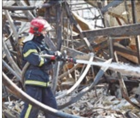
Kiev ataca radares russos

Perdendo terreno no norte e no leste de seu território, o governo da Ucrânia adotou uma nova e arriscada tática no seu combate assimétrico contra a Rússia, passando a atacar radares da rede de proteção contra mísseis nucleares do país vizinho. Como de costume, Kiev ainda não assume oficialmente a prática.