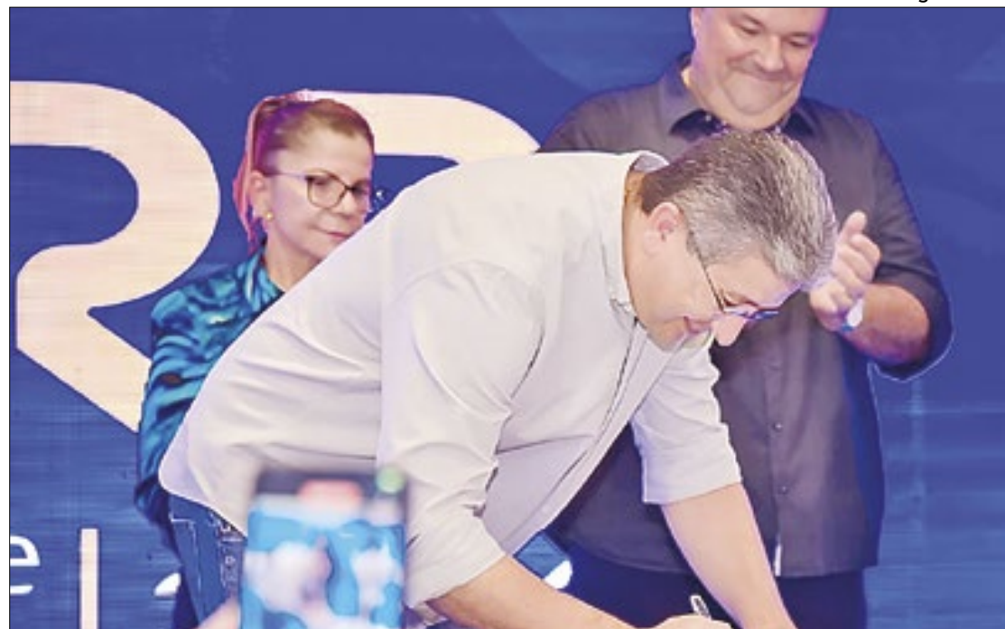
Programa foi lançado na abertura da edição 2024 da Feira da Indústria de Roraima