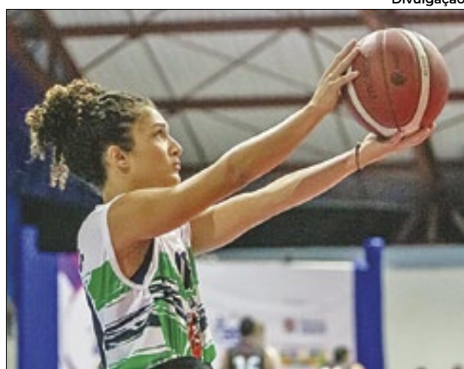
Atleta paralímpica foi convocada para a Seleção