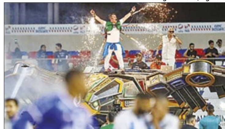
Evento conta com palco flutuante no Rio Guamá