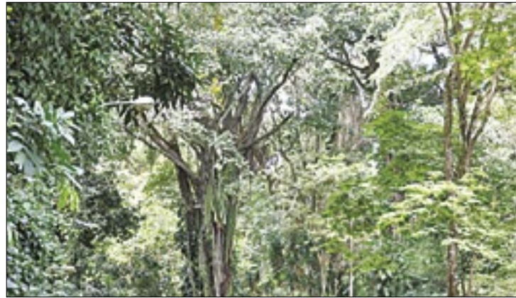
Medidas reduzem desmatamento da Mata Atlântica