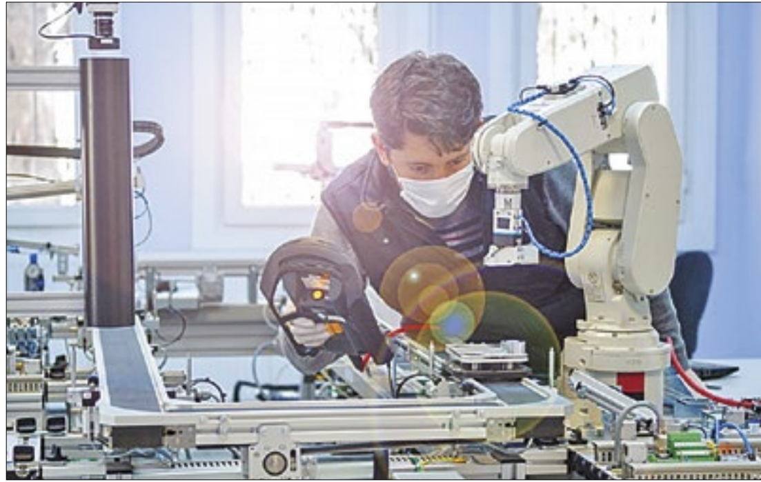
A participação da indústria maranhense nos R$ 124,980 bilhões do PIB estadual é alta

A participação da indústria nos R$ 124,980 bilhões do Produto Interno Bruto (PIB) do Maranhão tem ajudado na recuperação econômica do estado no período pós-pandemia, segundo dados do Instituto Maranhense de Estudos Socioeconômicos e Cartográficos (Imesc). Em comparação entre 2020 e 2021, o setor industrial maranhense registrou um crescimento de 9,5%, o que fortaleceu a confiança dos empresários locais. Uma pesquisa realizada pela