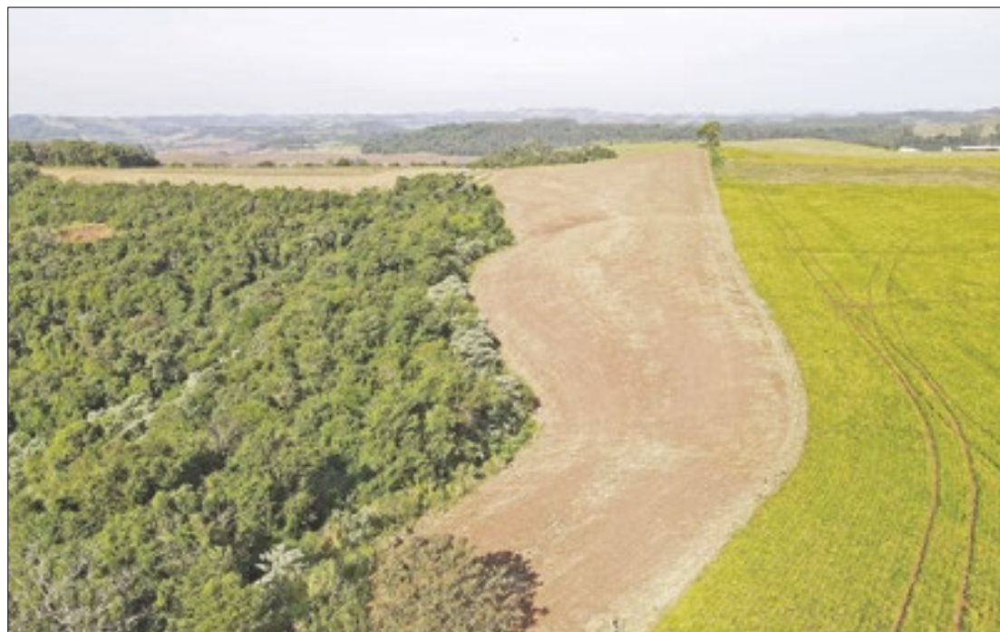
Operação no sudoeste do Paraná terminou com quase R$ 3 milhões em multas ambientais

O Atlas dos Remanescentes Florestais da Mata Atlântica, re-