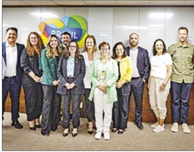
Os estados devem eleger produtos turísticos prontos