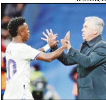
Vini Jr. melhorou com Ancelotti

Vinicius Jr. disse que não queria mudar de posição e Carlo Ancelotti precisou convencê-lo à mudança. Acostumado à ponta esquerda, Vini atuou por dentro no jogo de ida das quartas de final da Liga dos Campeões contra o Manchester City, enquanto Rodrygo ficou mais à esquerda. Ele assume que a alteração contribuiu para que ele evoluísse mais do que em outros anos. Hoje, ele é favorito à Bola de Ouro.