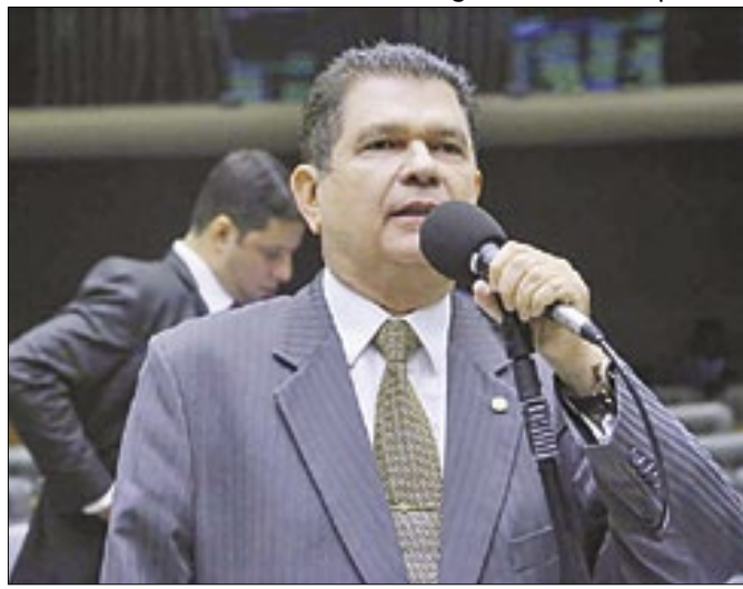
Benevides Filho: escalonamento das contribuições