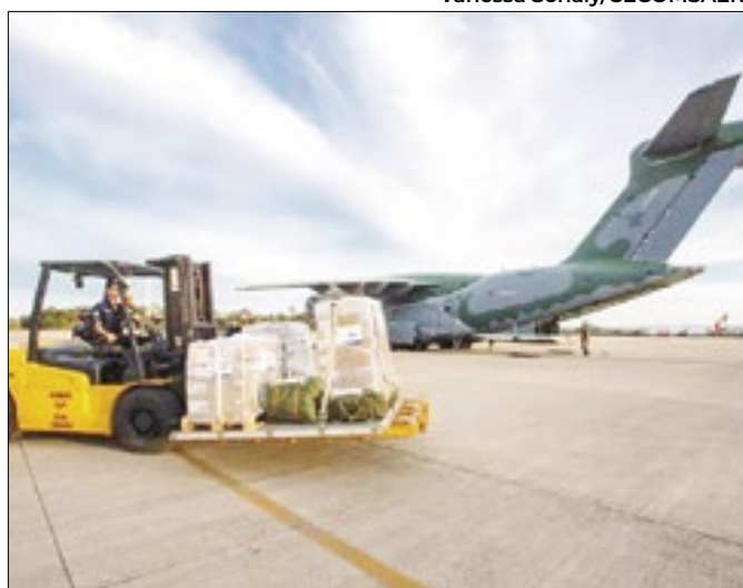
Itens foram entregues na Base Aérea de Canoas