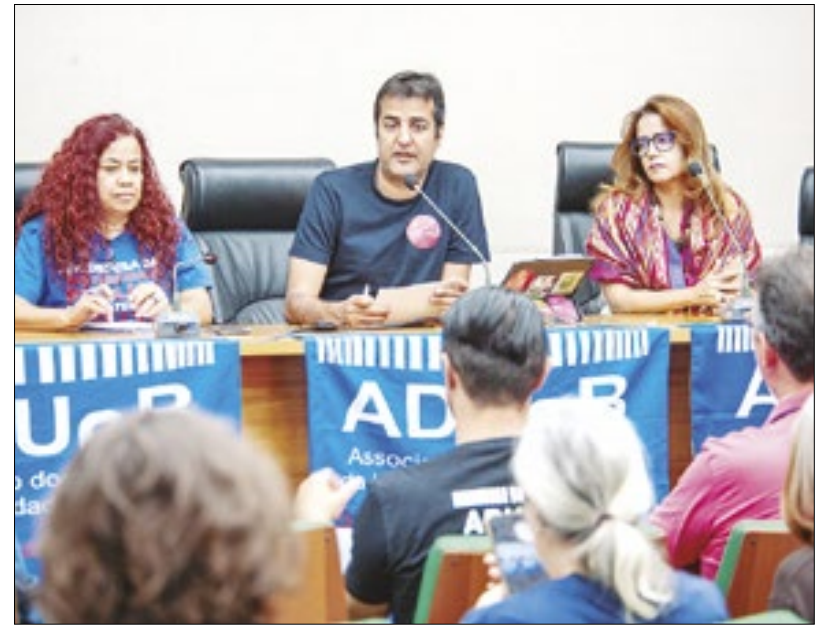
Grupo debateu desvalorização das universidades públicas