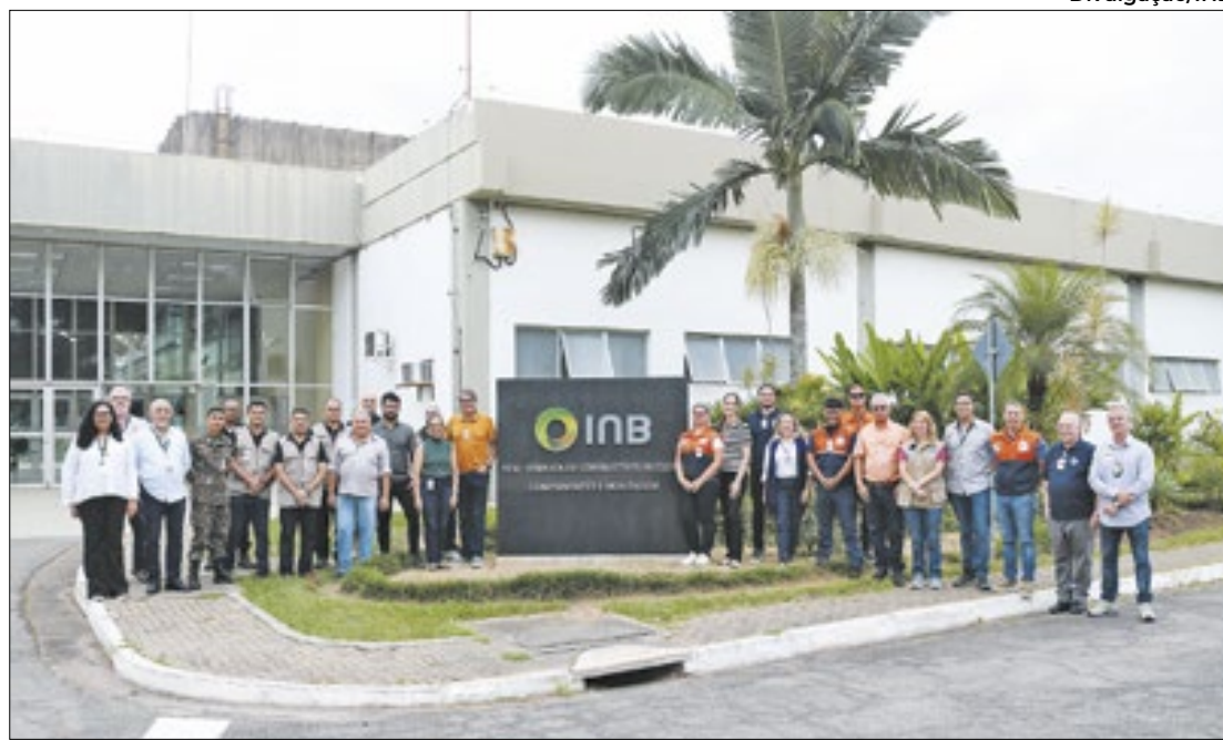
Comitê que reúne representantes de vários órgãos discute simulado de emergência nuclear

"É importante que aprendamos com as lições vindas do exercício do ano passado. Na reunião, várias instituições mostraram o que fizeram no exercício do ano passado, as melhorias que eles implementaram nas suas instituições, visando a atividade deste ano", contou Santos.