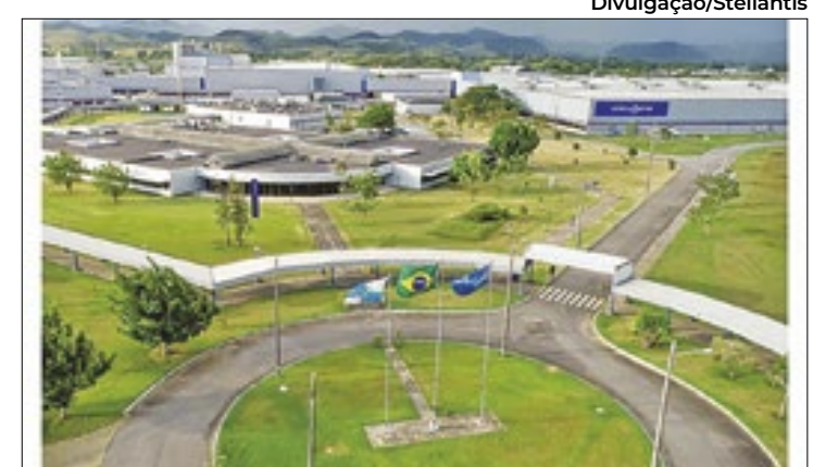
Fábrica de carro no município de Porto Real (RJ)

Já o CIEE colocou à disposição da população do Estado do Rio 1.219 oportunidades de estágio, 701 das quais para Ensino Superior e 518 para Ensino Médio, técnico e jovem aprendiz. Outras informações podem ser obtidas no site do CIEE.