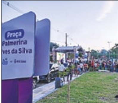
Espaço de lazer e esportes

A Prefeitura de Cachoeiras e o Governo do Estado, através da Secretaria de Estado das Cidades, inauguraram na última semana a Praça Palmeirinha Alves da Silva