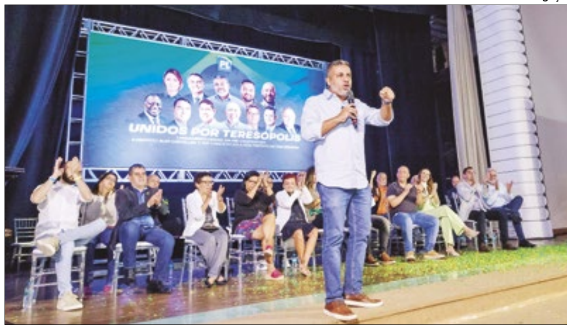
A aliança formada pelos parlamentares será nomeada como "Terê do Bem"

A segunda caminhada ocorrerá nesta terça-feira (28) na praça ao lado da escola municipal Ginda Bloch, encerrando na rua em frente à escola municipal Belkis Freny Morgado, todas com saída por volta das 14h.