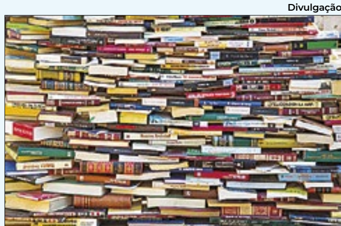
Projeto quer levar leitura para população

mais na garantia do respeito aos animais. Hoje já realizamos muitos procedimentos de castração na nossa clínica e vamos oferecer ainda mais serviços quando construirmos o hospital veterinário".