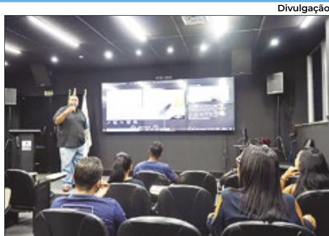
Ações sobre empreendedorismo serão nos dias 04 e 06/6