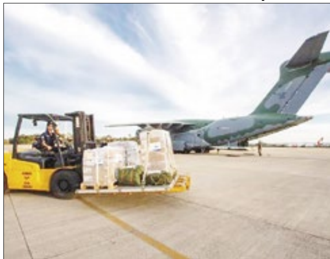
Itens foram entregues na Base Aérea de Canoas