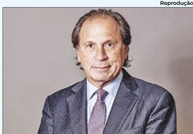
CSN de Steinbruch tem lucro de R$ 851 milhões no 4T23

estadual em 2018, e vereador pelo Rio em 2020, mas conseguiu se eleger no último pleito, com 41.932 votos. Além de pai do deputado federal Otoni de Paula, pré-candidato à prefeitura do Rio, ele também é pai de Renato de Paula.