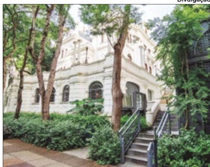
Livraria Cultura abre loja em casarão histórico