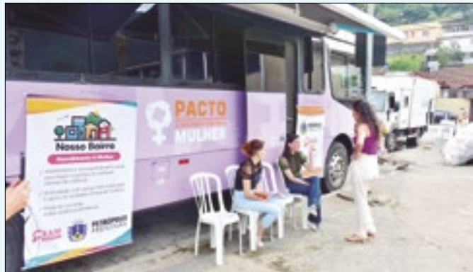
Ação percorrerá uma comunidade diferente no mês