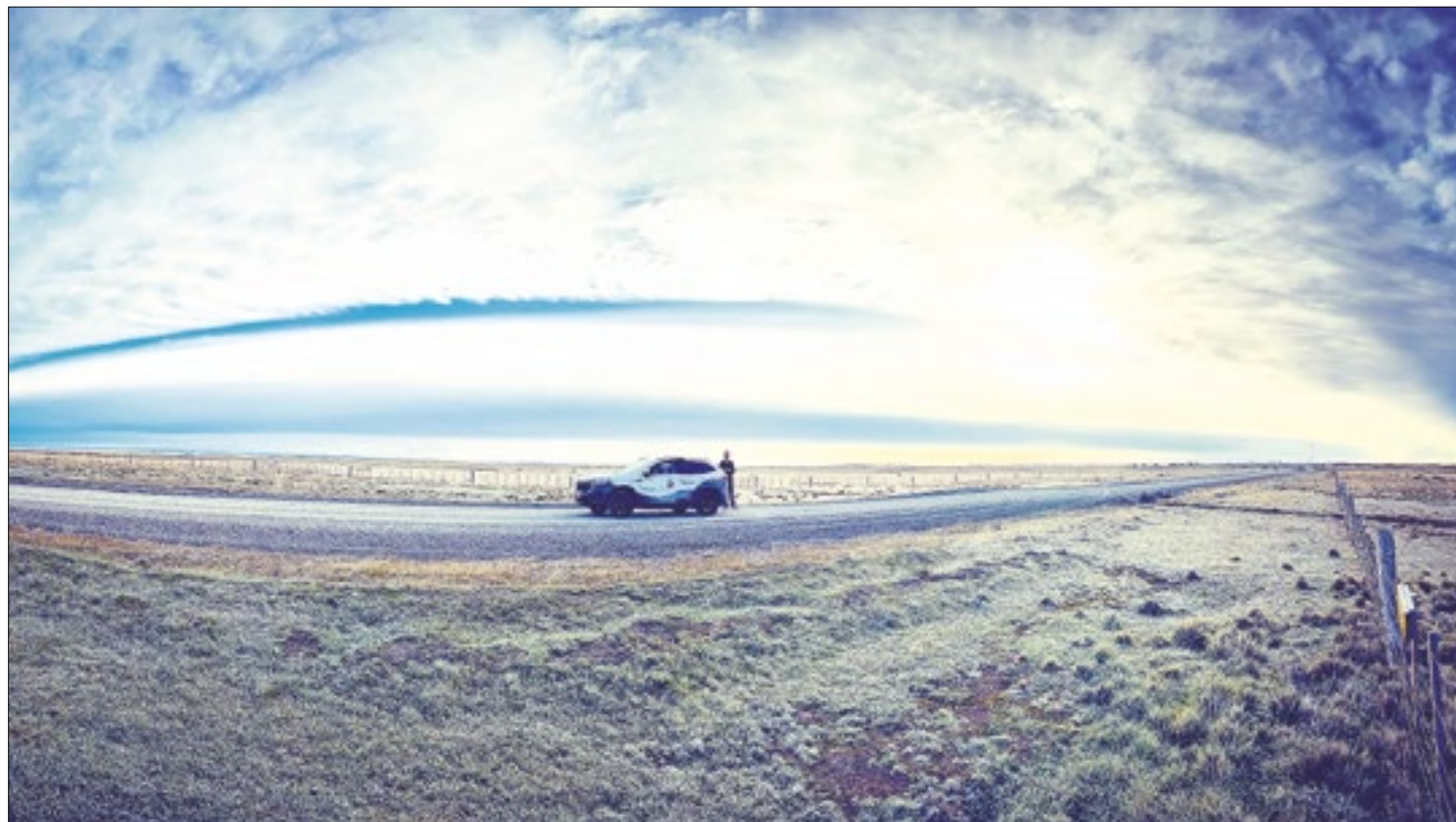
A Jornada ESG em um ponto da Patagônia argentina

Somente no Brasil, serão percorridos aproximadamente 15 mil km em 70 dias. O primeiro contato em solo canarinho foi em Pelotas, no Rio