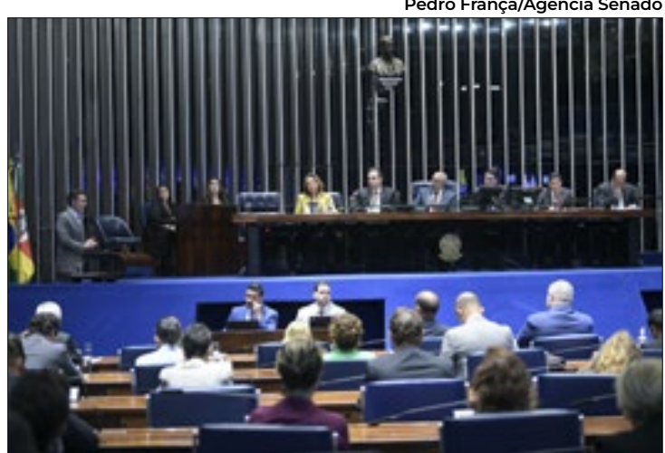
Senadores e governo discutiram questão climática

“Esse debate precisa começar a amadurecer a ideia de que precisaremos de medidas preventivas e efetivas para os desafios climáticos. Precisamos aprimorar a nossa capacidade de resposta aos eventos climáticos extremos”, afirmou Pacheco.