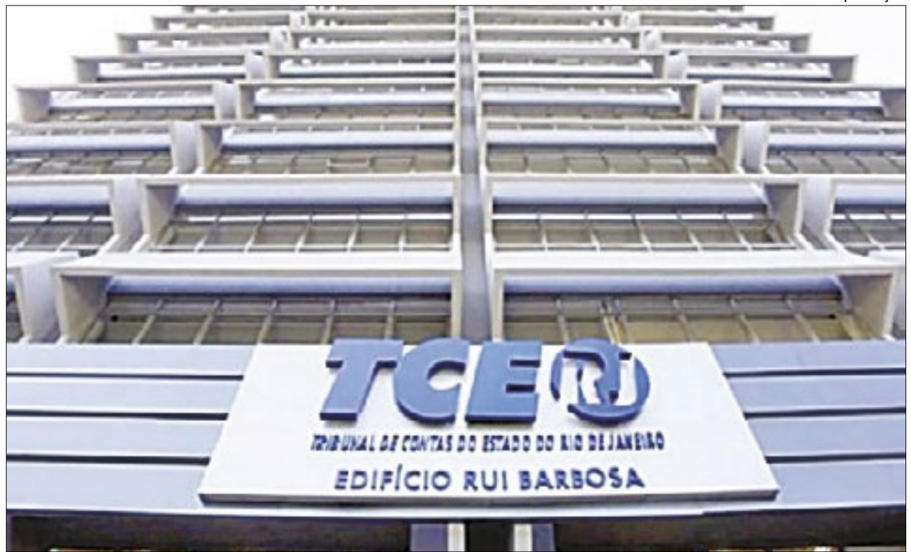
Todos os conselheiros seguiram o parecer favorável do relator, José Maurício de Lima Nolasco

rem pela não participação na prova, podem solicitar a devolução da taxa até o dia 09 de julho. Estão disponíveis 54 vagas para Ensino Superior + cadastro de reserva; 24 vagas para ensino médio; 21 vagas para ensino médio e 13 vagas para ensino fundamental.