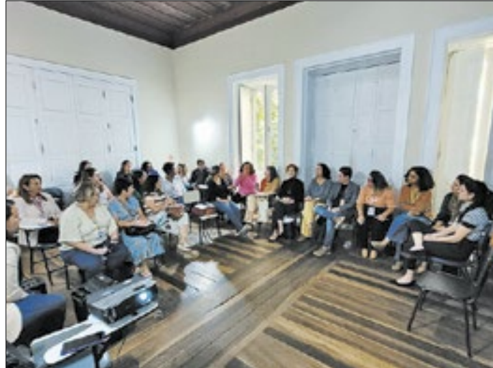
Amamenta Petrópolis recebe representantes da Fiocruz.

O projeto Amamenta Petrópolis, reconhecido por promover a amamentação nos Centros de Educação Infantil (CEIs) da cidade, recebeu representantes da curadoria da Fiocruz. O encontro foi organizado em três etapas e contou com a presença de membros das Secretarias de Saúde, Educação e Assistência Social. Durante a visita, foram apresentados os detalhes da premiação pela Mostra SUS Ideia SUS FIOCRUZ, realizada uma visita técnica ao CEI Boa Vista e à ESF do Boa Vista, e finalizado com uma oficina sobre as potencialidades e desafios do programa.