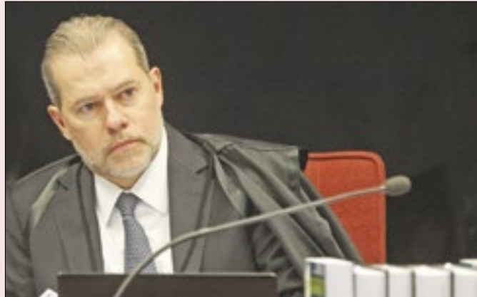
Anulações feitas por Toffoli devem se repetir