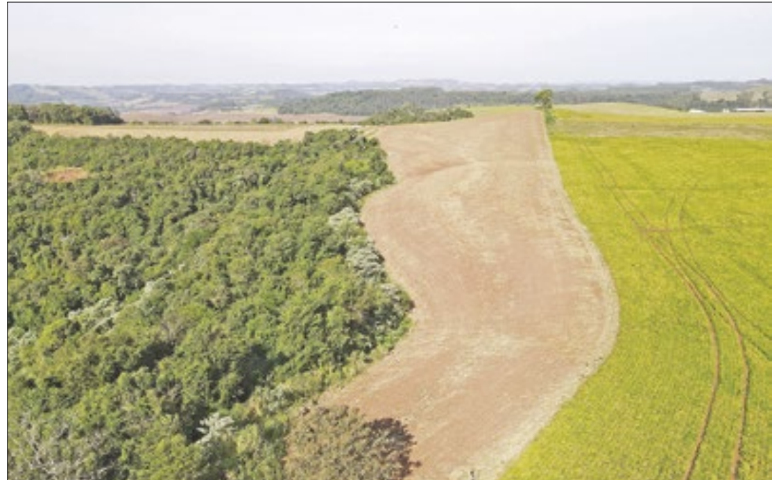
Operação no sudoeste do Paraná terminou com quase R$ 3 milhões em multas ambientais

O Atlas dos Remanescentes Florestais da Mata Atlântica, re-