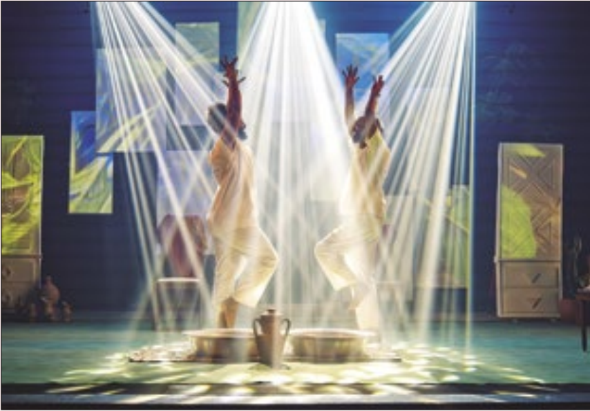
A premiada peça 'Angu' é um dos espetáculos do festival