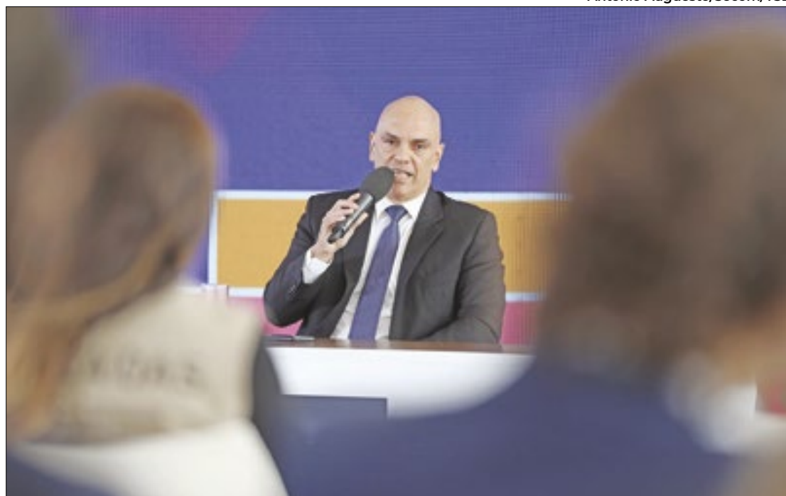
Alexandre de Moraes rejeitou o recurso da defesa de Jair Bolsonaro

Além de Bolsonaro, o seu vice na chapa que disputou a presidência em 2022, Walter Braga Netto, também foi condenado por abuso de poder político e econômico nas comemorações do Bicentenário da Independência, em 7 de setembro. O TSE avaliou que Bolsonaro discursou para apoiadores em um trio elétrico em Brasília após o desfile militar de 7 de setembro e no mesmo dia, foi ao Rio de Janeiro, onde subiu em um palanque em Copacabana que o Exército montou para as festividades, e teria usado esse espaço para se promover eleitoralmente, mesmo estando em cargo público. Ou seja, no entendimento do tribunal, o