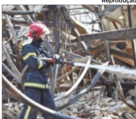
Kiev ataca radares russos

Perdendo terreno no norte e no leste de seu território, o governo da Ucrânia adotou uma nova e arriscada tática no seu combate assimétrico contra a Rússia, passando a atacar radares da rede de proteção contra mísseis nucleares do país vizinho. Como de costume, Kiev ainda não assume oficialmente a prática.