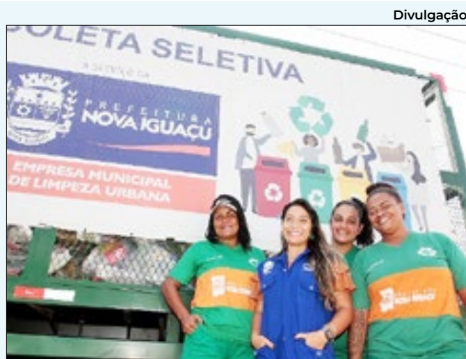
Coleta seletiva chega a todos os bairros da cidade