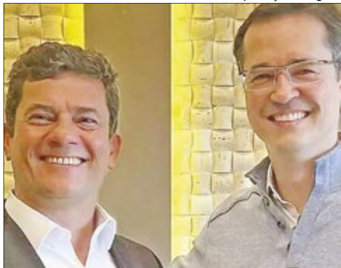
Suposto conluio pode anular Lava Jato