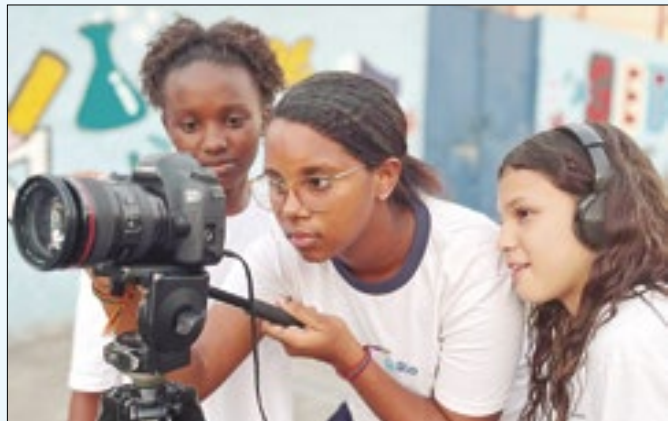
Alunas que vão representar o Brasil no evento