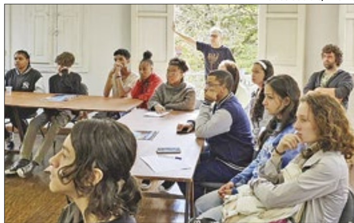
Primeira oficina de roteiro com os alunos do projeto