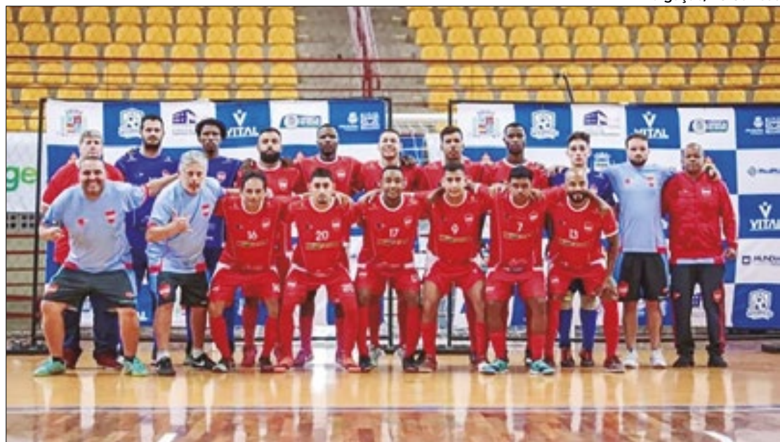
Elenco campeão da Copa Integração 2024 (sede: Santos Dumont)

Entre as ações realizadas pelos alunos da faculdade estão: