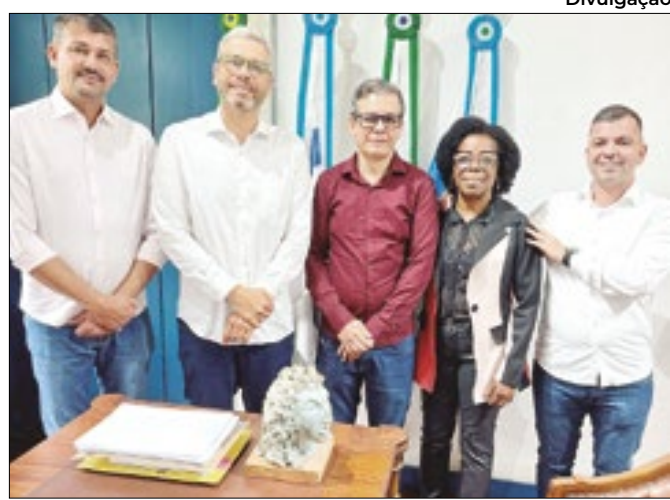
Posse de novo secretário do governo de Rodrigo Drable