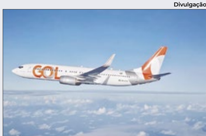
Plano financeiro da aérea prevê aumento de aeronaves

Principal estado produtor, São Paulo exibiu estabilidade, a R$ 3,68 o litro (preço mínimo de 2,99 o litro), enquanto o Ceará teve a maior alta percentual semanal (1,76%) e a maior queda (5,99%) foi verificada em Goiânia. O maior preço médio ocorreu no Amapá (R$ 4,99 o litro).