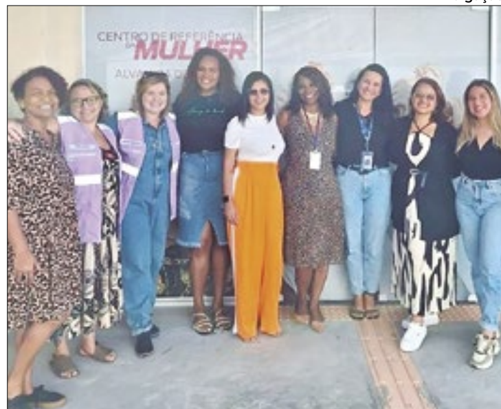
Evento reuniu equipe técnica e usuárias para um bate-papo

Os dias atuais foram contextualizados pelas usuárias presentes no evento que se descreveram como trabalhadoras, agentes sociais, donas de casa e