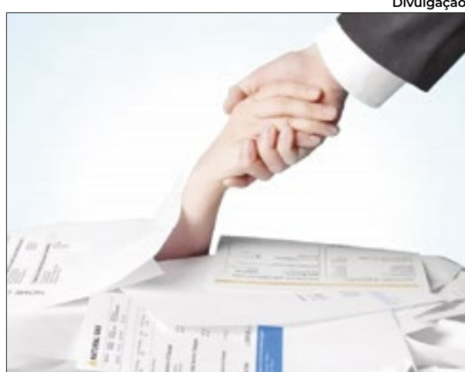
Número de pedidos mantém ascensão há cinco meses