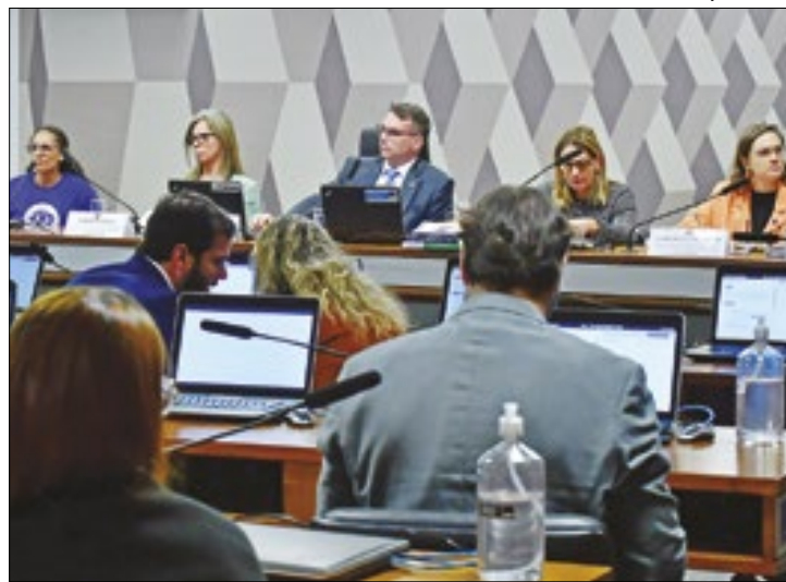
Quem defende diz que PEC não privatizará as praias

O texto, de relatoria do senador Flávio Bolsonaro (PL-RJ), declara que as áreas que atualmente são usadas pelo serviço público federal, as unidades ambientais federais e as áreas ainda não ocupadas permanecerão como propriedade