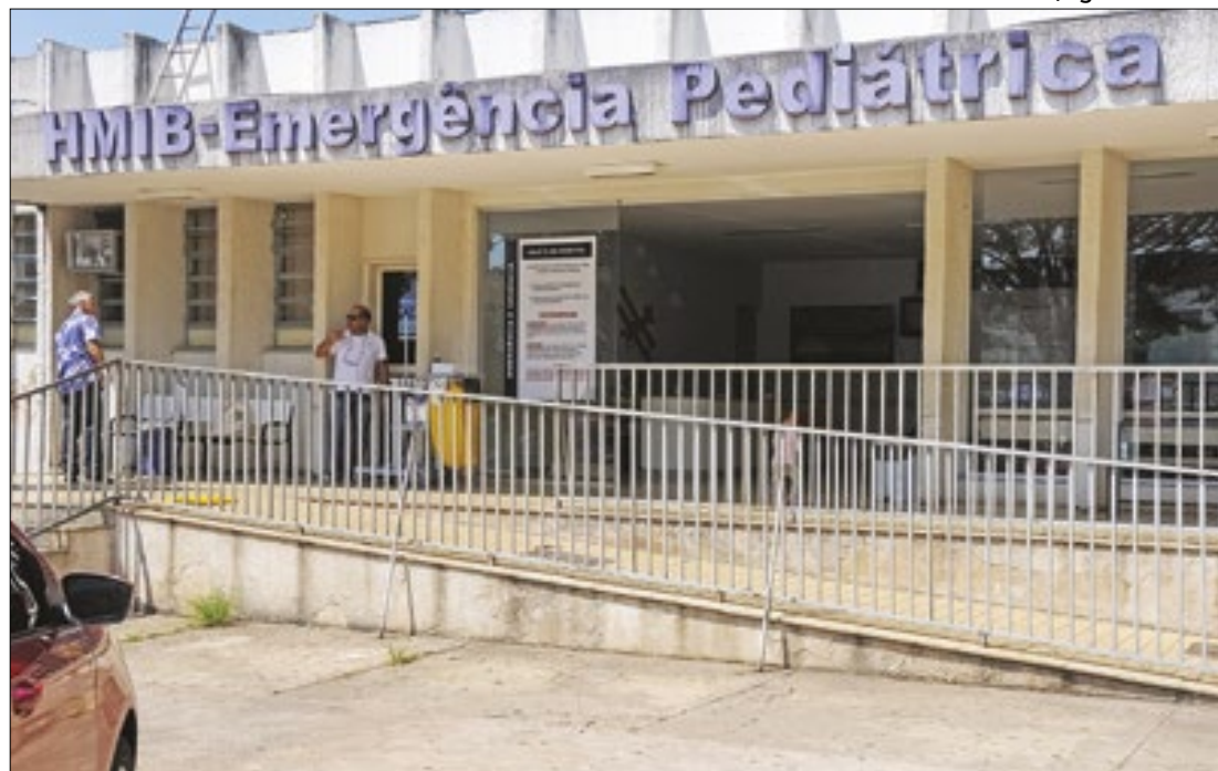
Dois crianças morreram no Hospital Materno Infantil de Brasília e outras três, no DF

O governador do Distrito Federal, Ibaneis Rocha, anunciou em suas redes sociais a contratação de 492 profissionais de saúde. A medida, divulgada no início da tarde da segunda-feira (27), prevê a nomeação imediata de 221 técnicos de enfermagem, 122 enfermeiros e 149 médicos. Na postagem, Ibaneis também enfatizou que continua empenhado em melhorar a assistência de saúde em toda a região do DF.