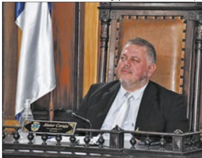
Programa visa democratizar o acesso às línguas