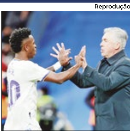
Vini Jr. melhorou com Ancelotti

Vinicius Jr. disse que não queria mudar de posição e Carlo Ancelotti precisou convencê-lo à mudança. Acostumado à ponta esquerda, Vini atuou por dentro no jogo de ida das quartas de final da Liga dos Campeões contra o Manchester City, enquanto Rodrygo ficou mais à esquerda. Ele assume que a alteração contribuiu para que ele evoluísse mais do que em outros anos. Hoje, ele é favorito à Bola de Ouro.