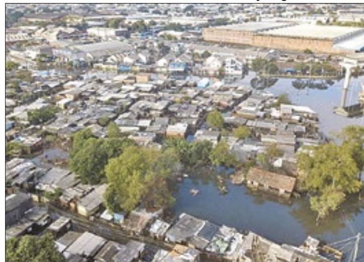
Bairro de Porto Alegre recebeu ajuda após 20 dias

Um protesto de moradores da região da Vila Farrapos, no Humaitá, na zona norte de Porto Alegre, fechou umas pistas da rodovia BR-290, a Freeway, próxima à Arena do Grêmio, durante a manhã desta segunda-feira (27). Eles pressionavam pela instalação de uma bomba móvel para drenar a água, que se acumula no bairro desde o dia 3 de maio.