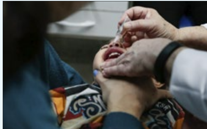
A meta é vacinar 236 mil crianças de 1 a 4 anos