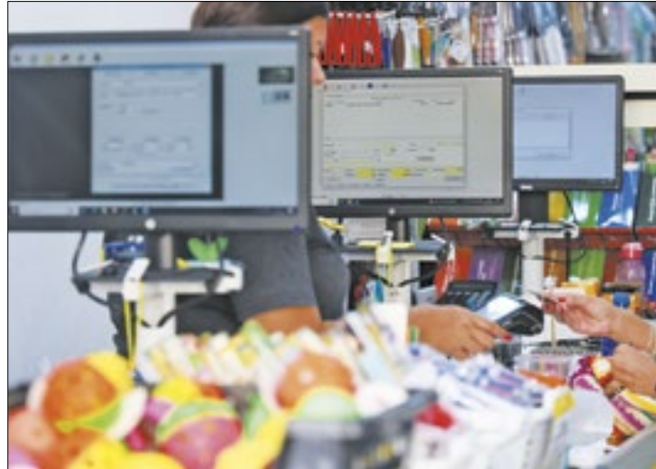
Governo atribuiu o crescimento a ações de incentivo

A arrecadação de Santa Catarina em abril alcançou R$ 4,6 bilhões, representando um aumento real de 13,9% em comparação ao mesmo mês do ano anterior. Este crescimento resulta das ações de incentivo do Governo do Estado junto ao setor produtivo, medidas para garantir segurança jurídica e fiscal aos investidores, além de atividades de fiscalização e combate à sonegação fiscal.