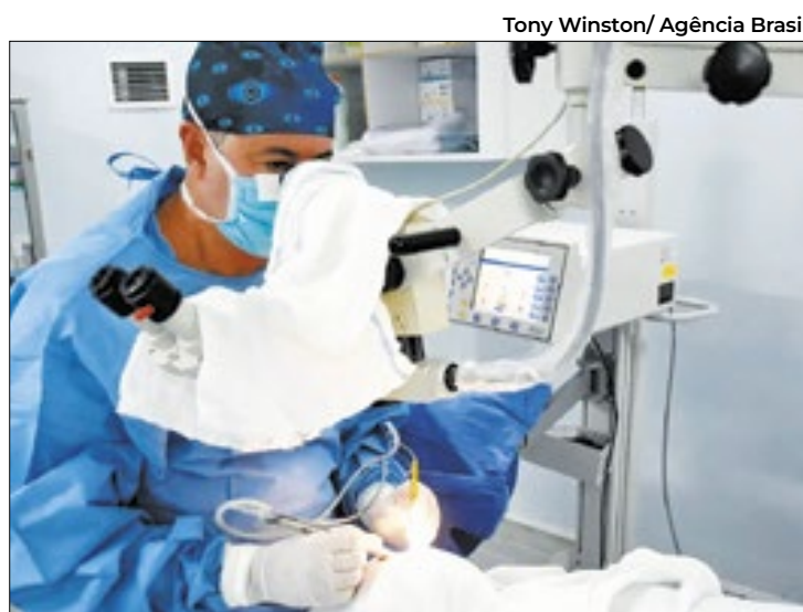
Alteração ocular é a principal causa de cegueira irreversível

O diagnóstico ou suspeita dessa condição ocorre durante exames oftalmológicos de rotina, incluindo o exame de fundo de olho, medição da pressão intrao-