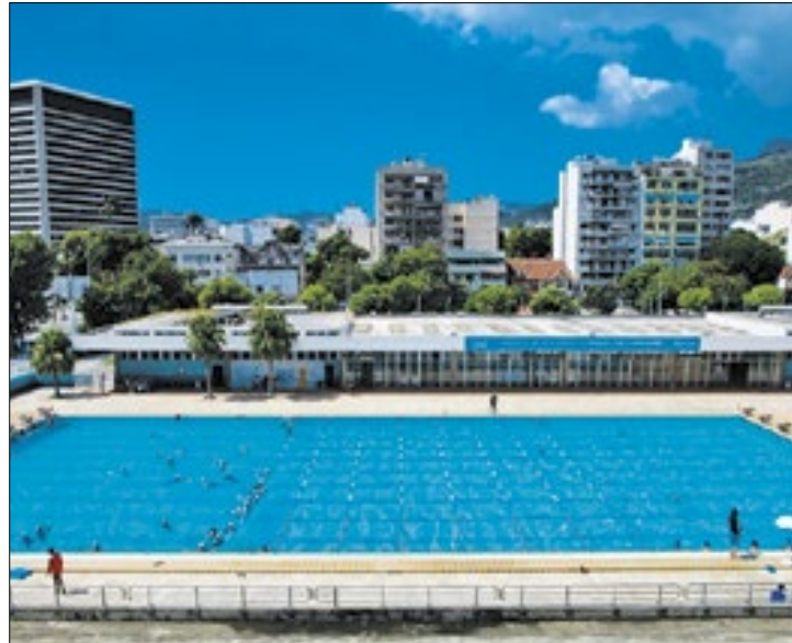
Governo do Rio

“O Governo do Rio tem grande satisfação em fomentar a realização deste projeto desenvolvido pelo Olga, uma referência no atendimento a pessoas com deficiência, por meio da Lei Estadual de Incentivo ao Esporte. Tornar iniciativas como esta em realidade é