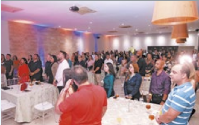
Empresários participam de encontro no interior do Rio