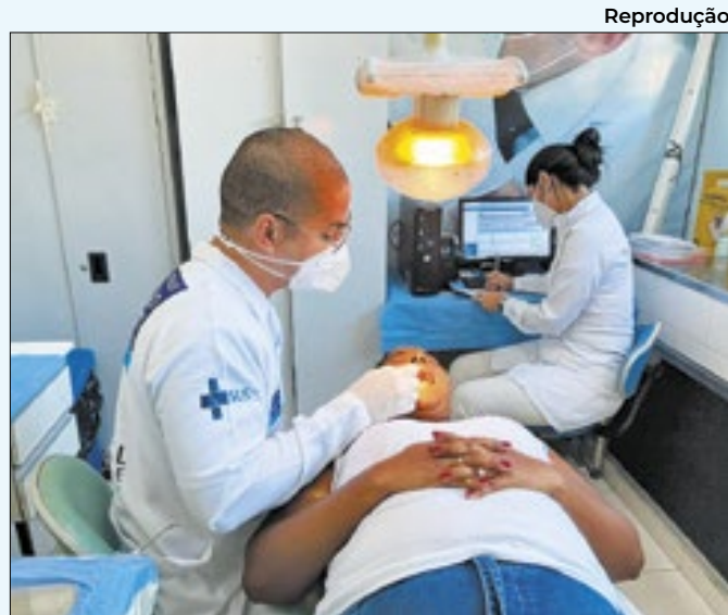
Programa Saúde para Todos em São João de Meriti