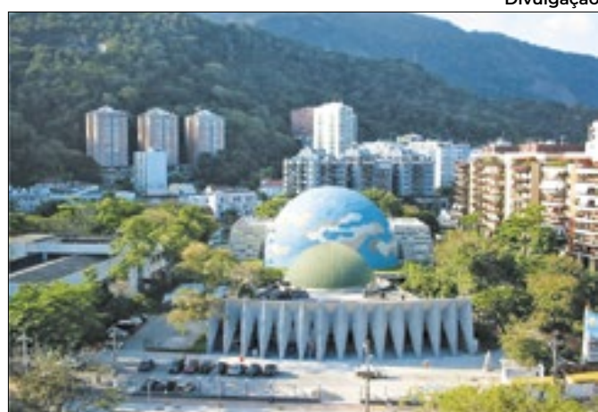
Evento acontecerá nesta terça-feira, dia 28 de Maio