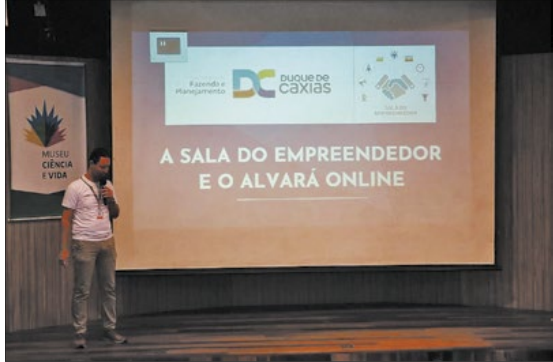
Celebração pelos cinco anos da Sala do Empreendedor aconteceu na última sexta-feira (24)

O prefeito Wilson Reis destacou a importância da sala de empreendedor para a cidade. "A sala do empreendedor vem para reforçar a nossa economia, com o empresário que aqui chega, dando assistência, tirando dúvidas e ajudando a cada processo. É através de iniciativas como essa que vemos o desenvolvimento dos empresários e de empresas do nosso município," declarou o prefeito.