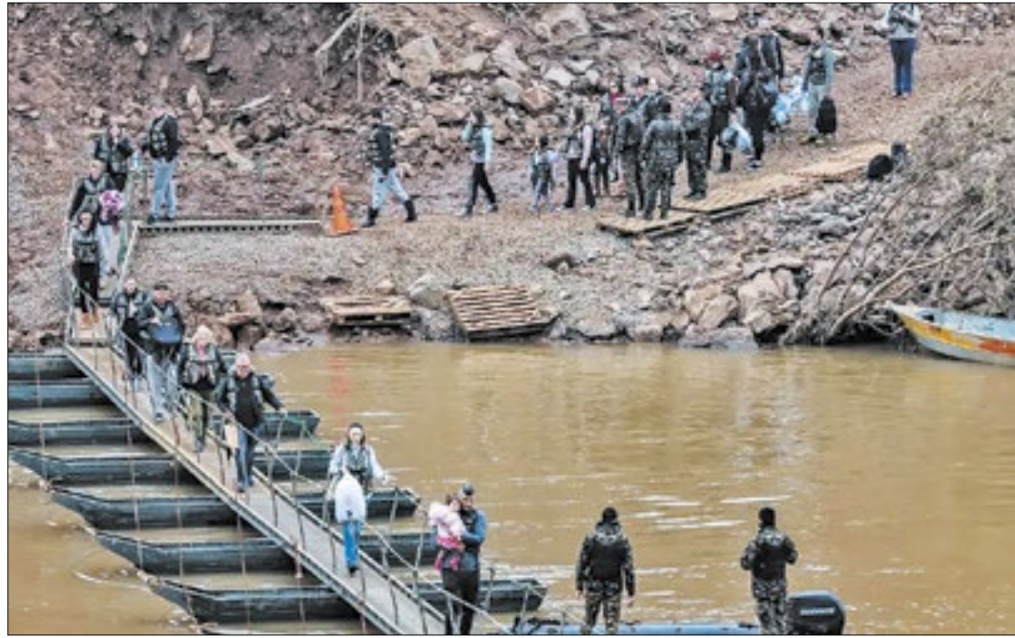
As pontes originais foram destruídas pelas correntezas das primeiras chuvas

As novas travessias estão sendo enviadas por unidades militares localizadas em São Borja (RS), Tubarão (SC) e Palmas (PR). Elas serão instaladas assim que as condições de segurança dos rios e climáticas permitirem. As passarelas que se romperam estavam situadas entre Lajeado e Arroio do