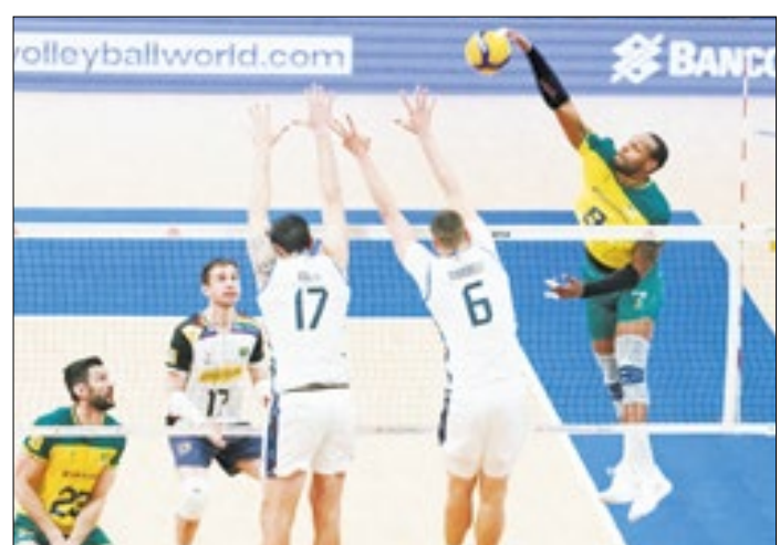
Cariocas se frustraram com o vôlei no Maracanãzinho

Na despedida da Liga das Nações do Rio de Janeiro, a Seleção Brasileira Masculina de Vôlei até saiu na frente, mas sofreu com atuações inconstantes de seus atletas e com um erro de arbitragem grotesco no Tie-Break, e acabou perdendo para os italianos de virada.