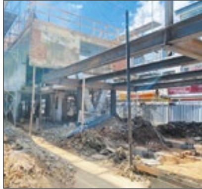
Espaço recebe revitalizações

A Prefeitura de Três Rios, por meio das Secretarias de Educação, Ciência e Tecnologia e a de Obras e Habitação, deu mais um passo para a conclusão das obras da Rodoviária Roberto Silveira. O local em