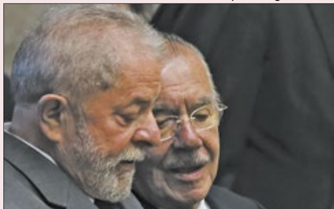
O PT de Lula apoiava o protecionismo de Sarney