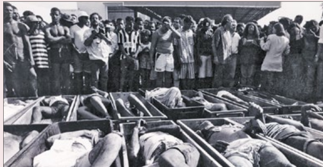
A Chacina de Vigário Geral foi em 1993, quando a favela foi invadida por um grupo de extermínio