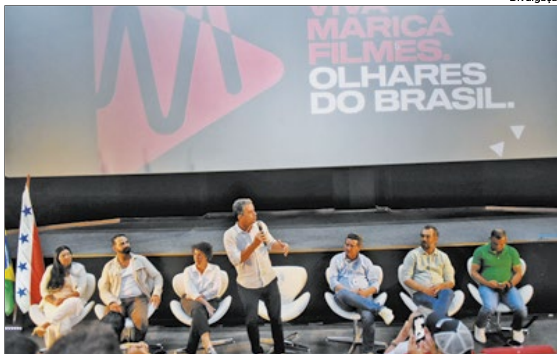
Prefeitura lança plataforma de streaming pública Maricá Filmes

A Prefeitura lançou nesta quinta-feira (23/05) a Maricá Filmes, a primeira plataforma de streaming pública do país com 65 obras, entre séries e longas-metragens. O aplicativo traz um catálogo repleto de atrações gratuitas, que está disponível para sistemas Android e IOS e também pode ser acessado na versão online www.maricafilmes.com.br . A iniciativa é uma encomenda tecnológica do Instituto de Ciência, Tecnologia e Inovação de Maricá