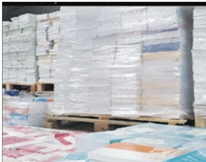
Material deverá ser entregue até esta terça-feira