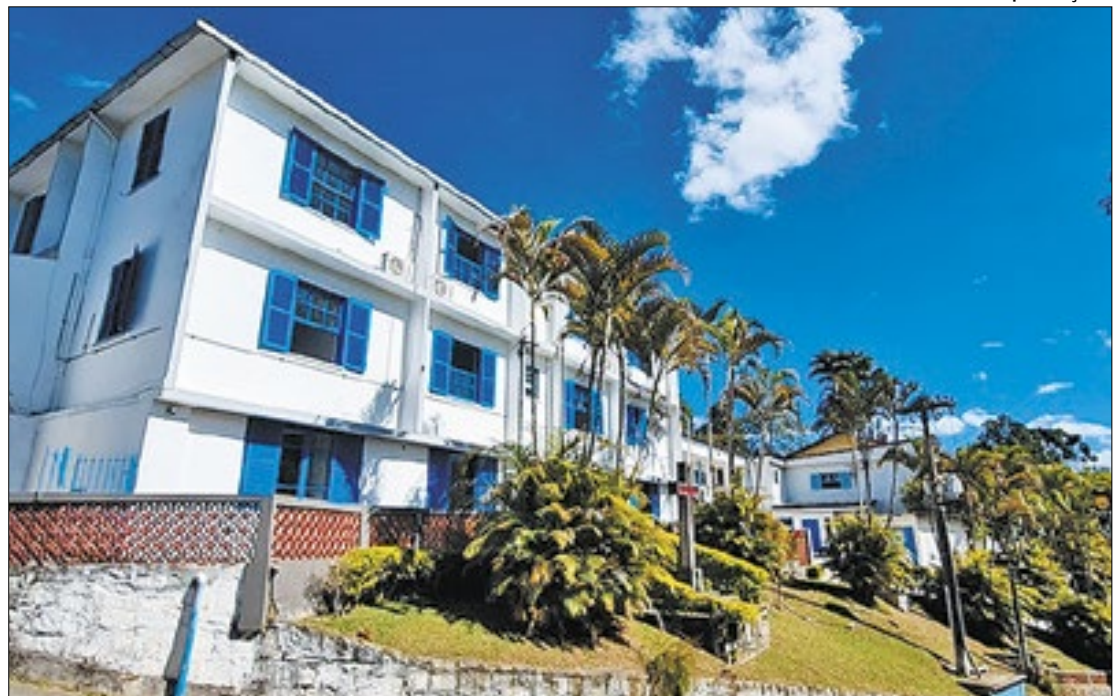
Beneficência Portuguesa implantará 'Classificação de Risco' na ala pediátrica

Desde abril, as unidades de urgência e emergência, tanto públicas quanto privadas, têm observado um aumento significativo nos atendimentos pediátricos em Teresópolis. O número mensal de atendimentos, que anteriormente variava entre 750 e 950, triplicou para