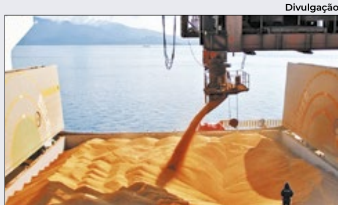
Preço do cereal deverá ter preço tabelado ao consumidor

O programa de crédito às empresas gaúchas deverá contar com um montante avaliado em R$ 7,5 bilhões, que poderão alavancar R$ 52 bilhões em novos financiamentos, a taxas de juros subsidiadas ou isentos, como é o caso de empréstimos concedidos no âmbito do Pronaf.