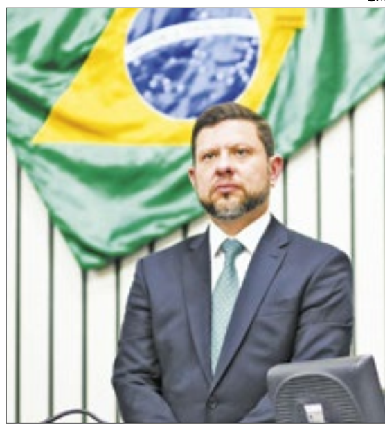
O secretário de Estado da Casa Civil do Rio foi homenageado na Alece pela contribuição para o Estado do Ceará