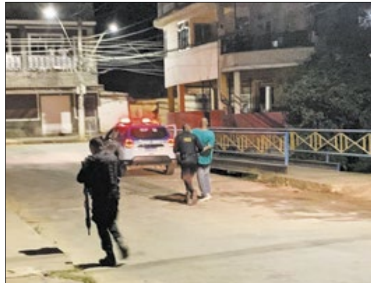
Polícia Militar conduzindo um dos suspeitos até a viatura

Os agentes, ao chegarem no local, flagraram os homens fugindo de carro e o outro a pé que, inclusive, atirou na direção dos policiais, com uma pistola calibre 9mm, mas foi preso. Já o suspeito que estava na direção de um Voyage, foi detido na saída do bairro.