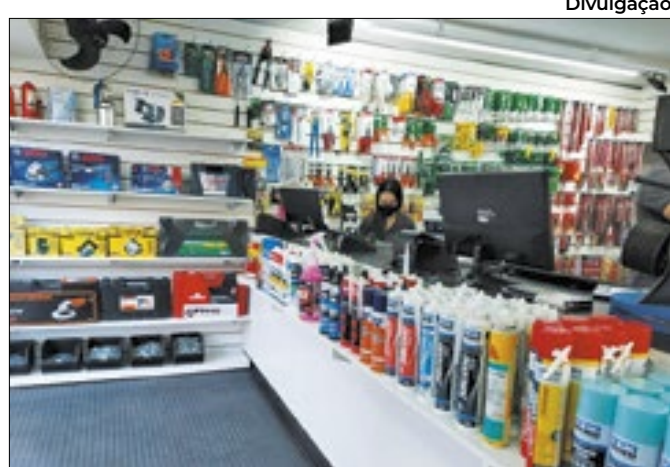
Unidade fica em Barra Mansa, no Centro