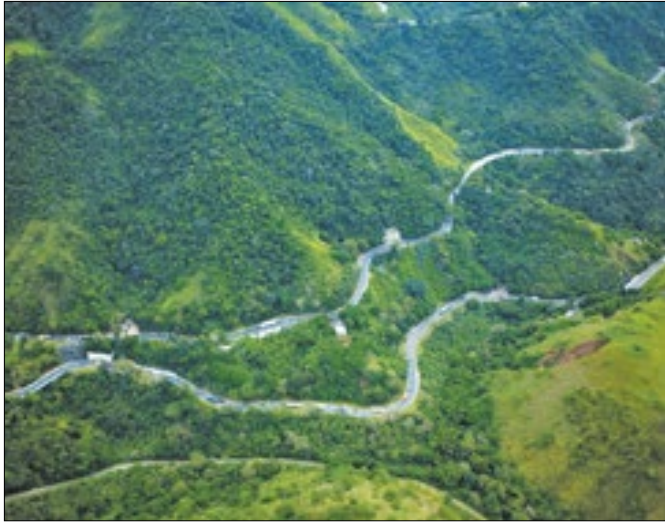
Obras na Serra das Araras iniciam em junho