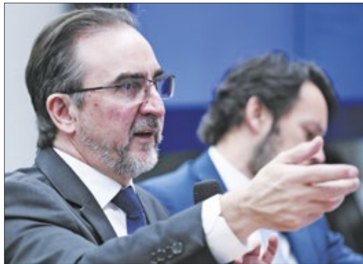
GT irá ouvir Appy esta semana