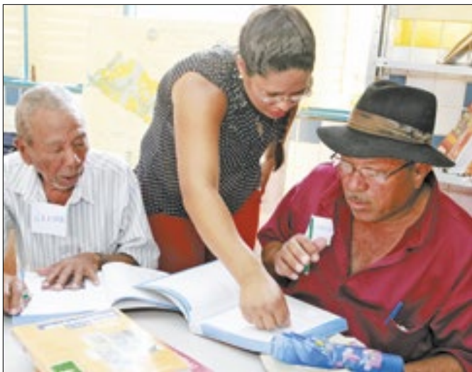
A maior redução foi entre pessoas acima de 15 anos