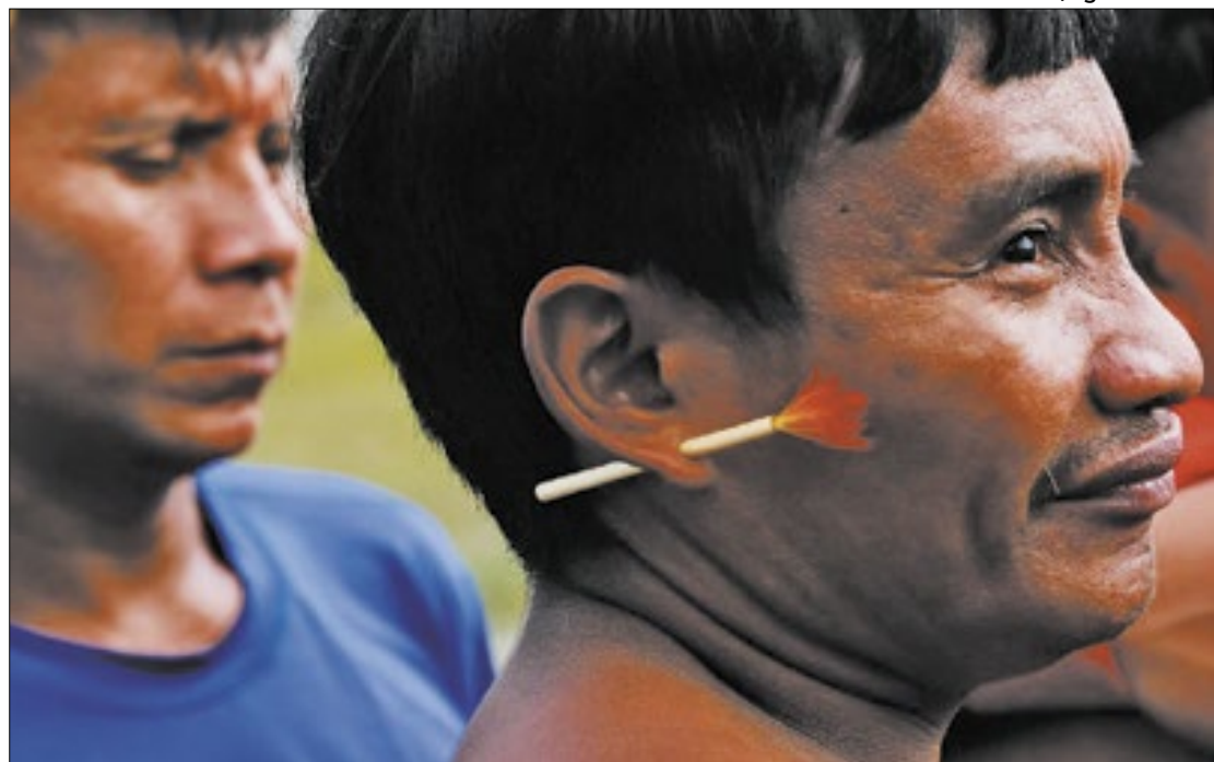
Crise humanitária de cerca de 27 mil indígenas na região causou uma comoção nacional

"Nos corresponde também escutar as outras partes, os representantes do povo yanomami e outros povos indígenas também, para corroborar as informações, impressões e vamos seguir dando continuidade a essas medidas provisórias abert-