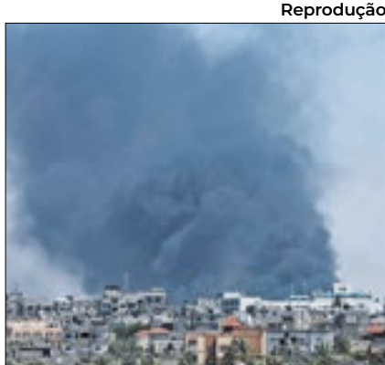
Cidade de Rafah foi bombardeada

Israel bombardeou a cidade de Rafah, no sul da Faixa de Gaza, neste sábado (25), um dia após a CIJ (Corte Internacional de Justiça) determinar que o país cesse suas ofensivas militares nesta região. Ataques aéreos e disparos de artilharia também atingiram outras áreas no sul (Khan Yunis), no centro (Deir Al-Balah e Nuseirat), e no norte (Jabalia e Cidade de Gaza) do território palestino, segundo a agência AFP.