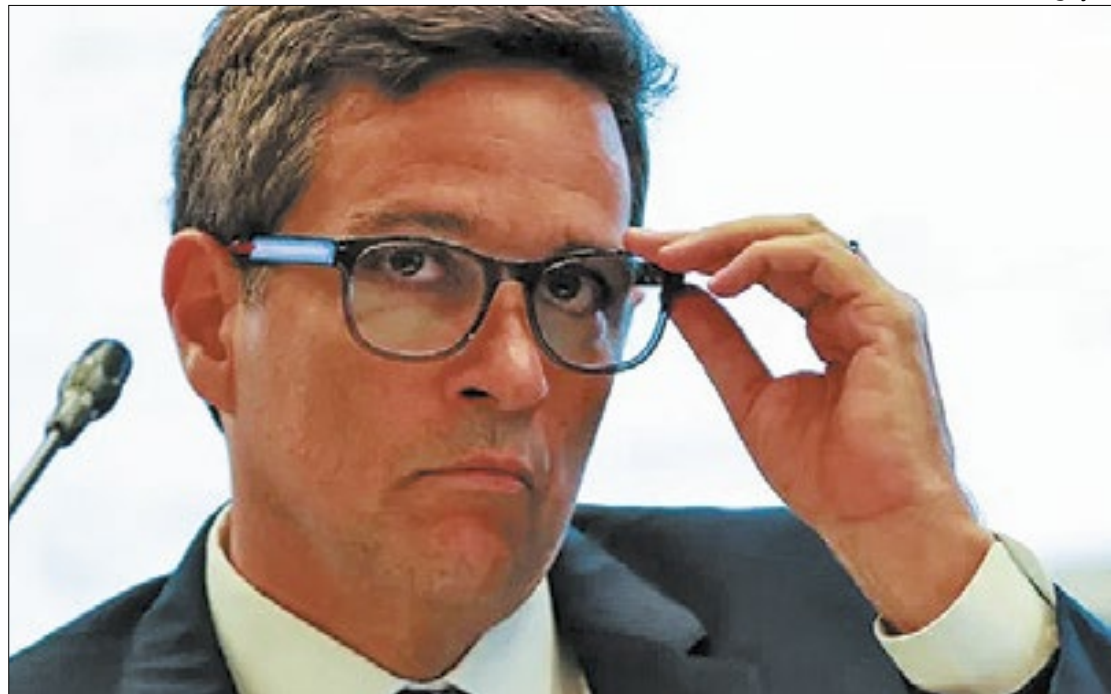
Divulgação BC: efeito climático devastador sobre economia gaúcha deve impor ônus inflacionário

É o que adverte o presidente do Banco Central (BC), Roberto Campos Neto, ao fazer um diagnóstico sintético da situação do estado: "Apesar de a safra de arroz já ter sido colhida, teve o problema de o solo ser danificado, de a logística ser danificada... aveia, arroz e trigo são as coisas que mais afetam o IPCA", ao ressaltar 'ainda não ser possível dimensionar o impacto dos alagamentos'.