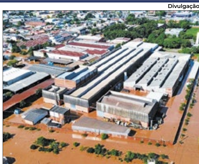
Divulgação Créditos para reconstruir RS serão isentos de juros

Alerta é do presidente do BC, Campos Neto, ante o impacto da tragédia