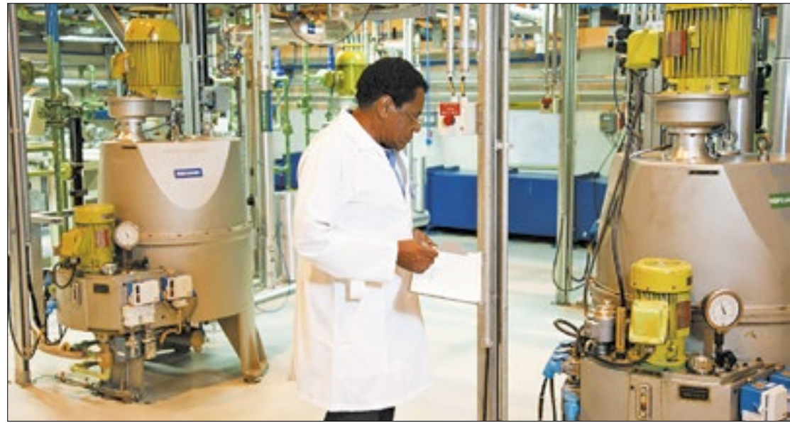
Fábrica de Resende produz combustível para usinas nucleares de Angra dos Reis