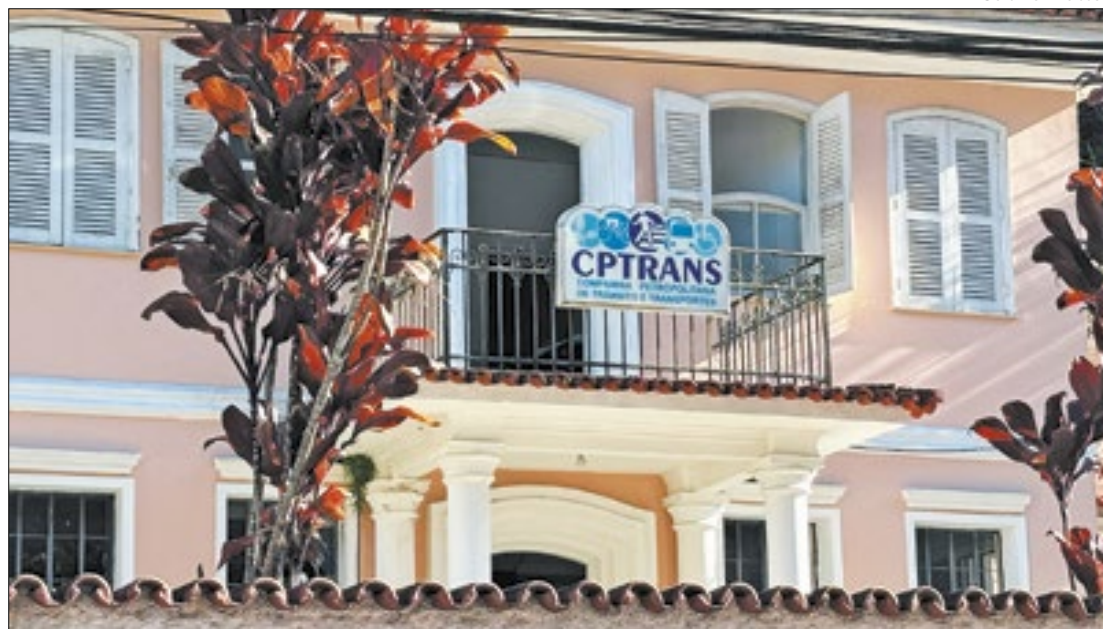
Sede da Companhia Petropolitana de Trânsito e Transportes, na rua Alberto Tôres