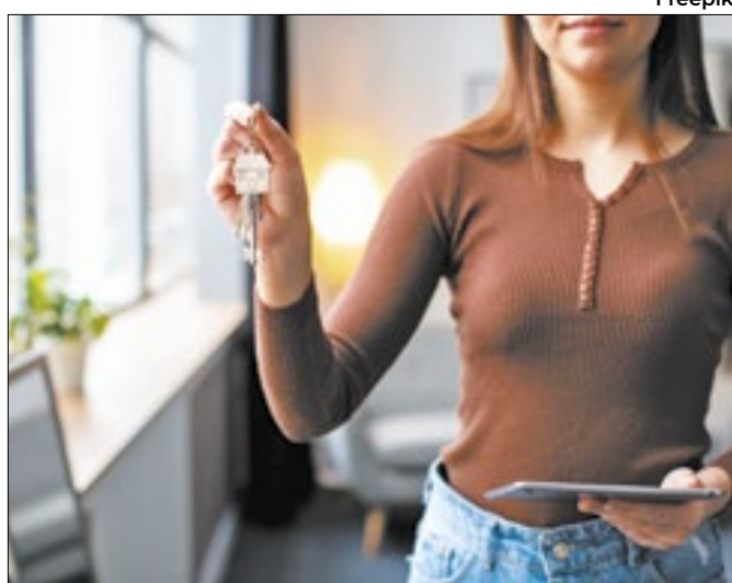
Construtoras notam mais buscas pelos mais jovens