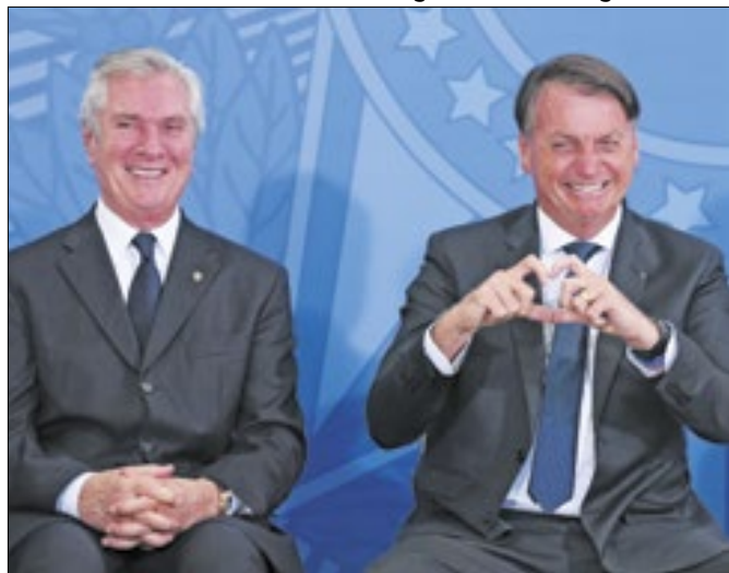
Collor é que abriu o mercado para importados