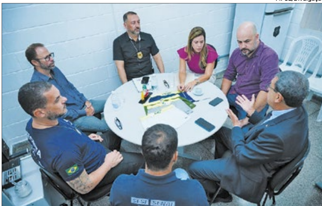
Ministério Público, Receita Federal, Secretaria de Justiça e Senai participam do projeto

Parceria une esforços para reinserir internos no mercado de trabalho