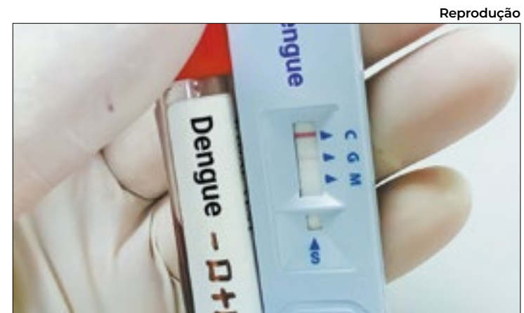
Exames foram feitos em laboratórios particulares