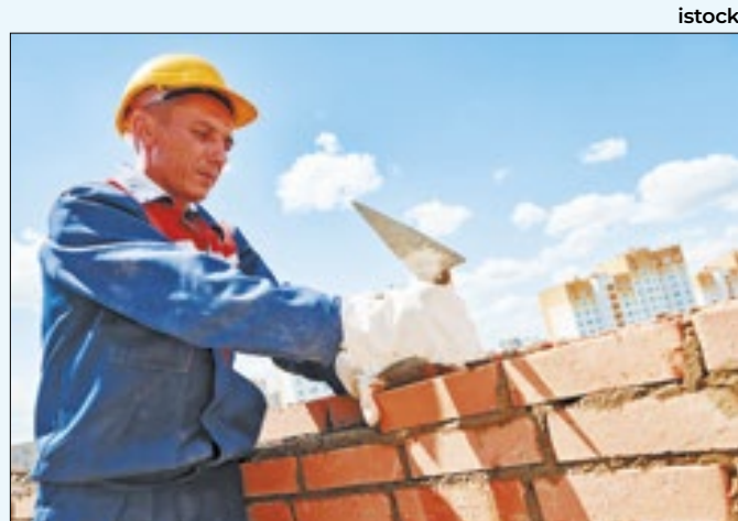
Cargos oferecem benefícios além do salário

sejável NR35 ou NR12 e ser morador de Barra do Pirai ou Pirai. Currículos atualizados devem ser enviados até terça (28) para o e-mail humaniza.vagas@yahoo.com.