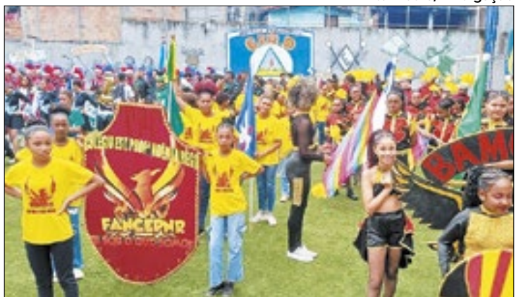
Evento promove integração e mensagem de harmonia