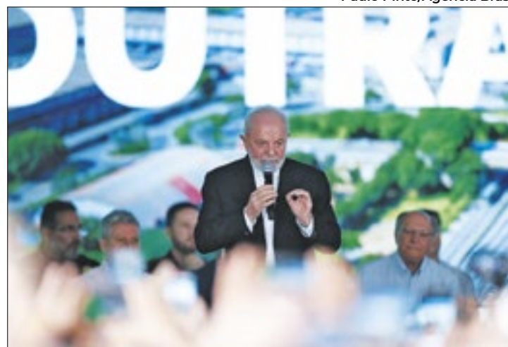
Cerimônia com o presidente aconteceu no sábado

O presidente Lula inaugurou, na manhã de sábado (25), duas obras na rodovia federal Presidente Dutra, no município de Guarulhos (SP): o novo trevo Jacu-Pêssego, no km 213, e a pista marginal no sentido São Paulo, entre o km 209,5 e o km 211,8, do trevo de Bonsucesso.