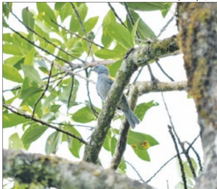
Unidade de conservação ambiental no distrito de Amparo

O estudo técnico ambiental necessário para o projeto foi conduzido pela Secretaria de Meio Ambiente, com o apoio do Governo do Estado do Rio de Janeiro. A proposta da Unidade de Conservação abrange uma área pública de mais de um milhão de metros quadrados e visa implementar medidas cruciais para a preservação da biodiversidade local, protegendo tanto a fauna quanto a flora. Além disso, a criação da uni-