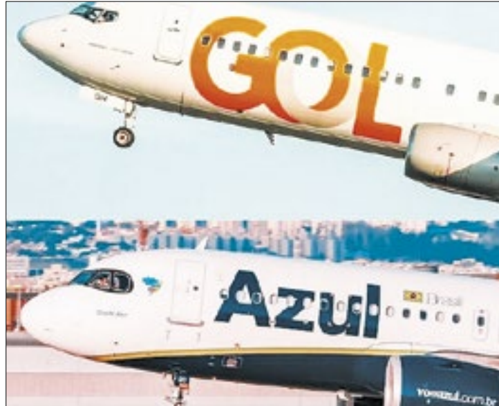
Divulgação Mercado reage positivamente à provável fusão de aéreas

Tal comportamento, segundo relatório enviado a clientes por analistas do Itaú BBA, reflete o uma antecipação, por parte do mercado, de uma possível fusão por completo entre as companhias, tendência reforçada pela entrada da Gol no regime de recuperação judicial nos Estados Unidos. "Observamos que este acordo não depende de aprovação antitruste. Além disso, esta notícia poderá aumentar a percepção dos investidores