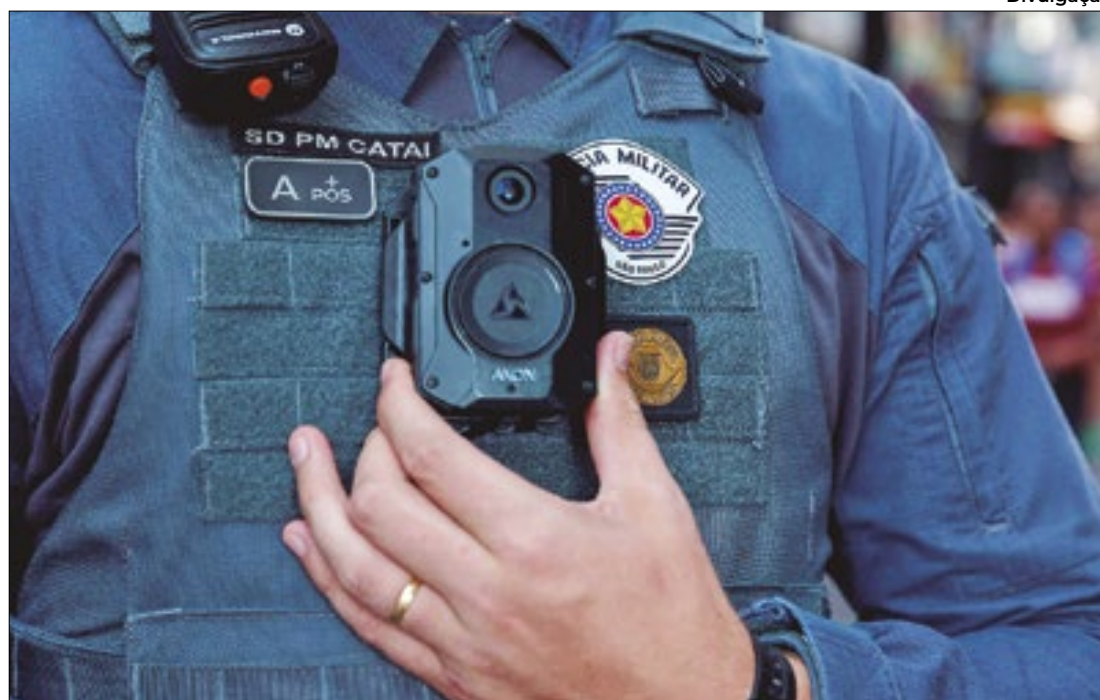
Governo paulista ampliará número de câmeras corporais usadas pela PM

Edital prevê contratação de mais 12 mil equipamentos portáteis