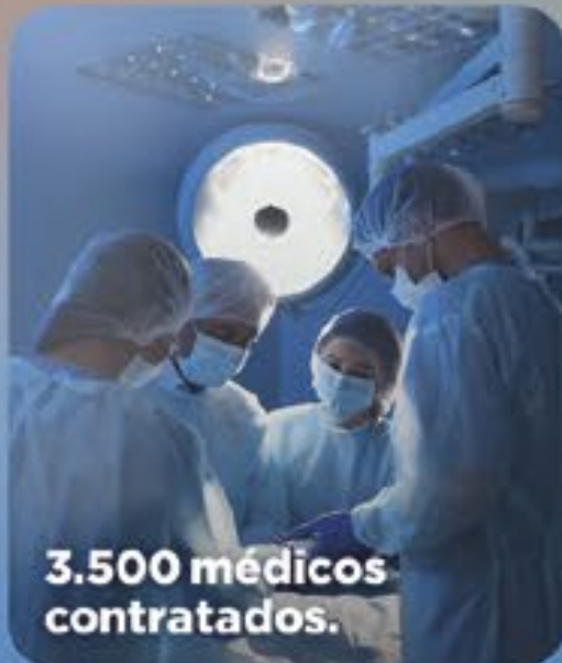
3.500 médicos contratados.