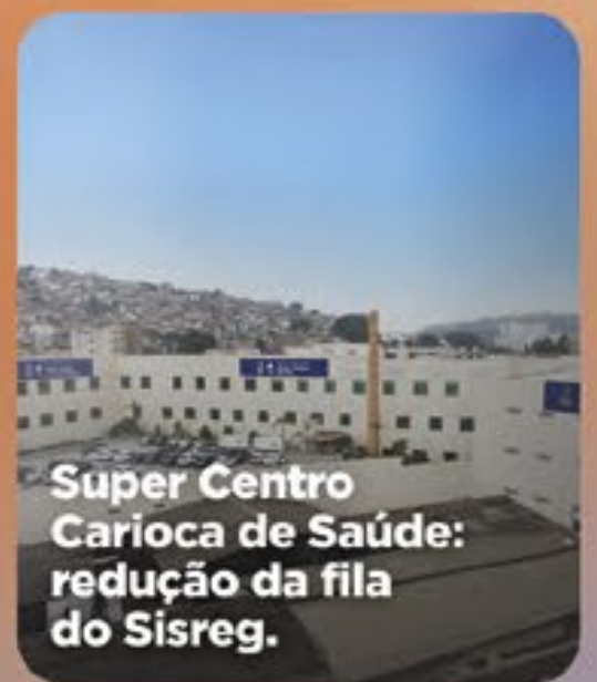
Super Centro Carioca de Saúde: redução da fila do Sisreg.