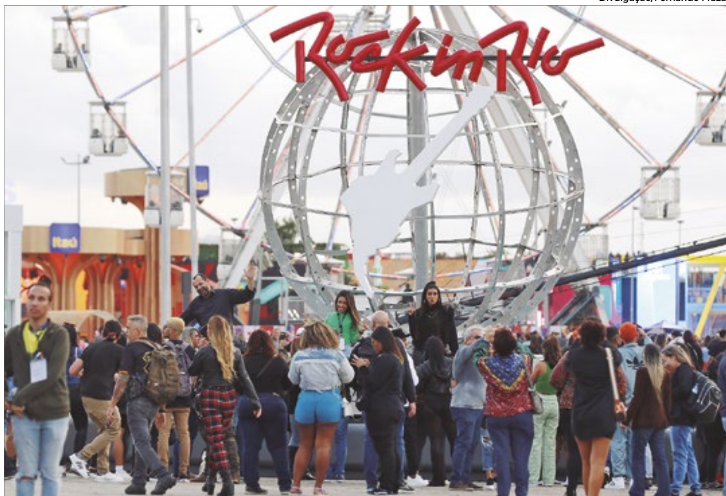
Maiores festival de música do mundo comemora seus 40 anos na próxima edição. Rock in Rio acontece em setembro de 2024, no Parque Olímpico do Rio de Janeiro

Já no dia 14 de setembro é a vez do Imagine Dragons comandar o festival, com o Palco Mundo recebendo também OneRepublic, Zara Larsson e Lulu Santos, enquanto no Sunset NX Zero será o headliner. O palco ainda recebe James, Kingfish e Penelope com Pato Fu. No New Dance Order DJ Snake encerra a noite, que também conta com apresentações