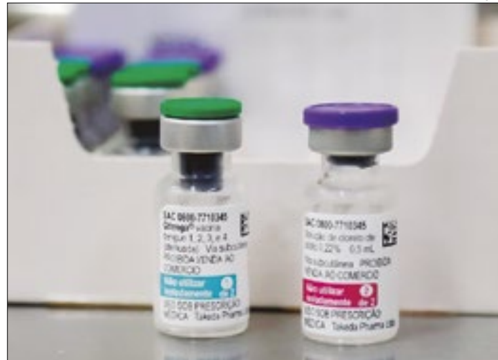
Mais 130 mil doses foram aplicadas na primeira etapa

A campanha de vacinação contra a dengue para este público-alvo começou no dia 23 de fevereiro e, até o final da primeira etapa, aplicou mais de 130 mil doses do imunizante. A partir desta quinta-feira, crianças e adolescentes podem ir até uma unidade