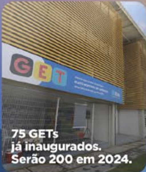
75 GETs já inaugurados. Serão 200 em 2024.