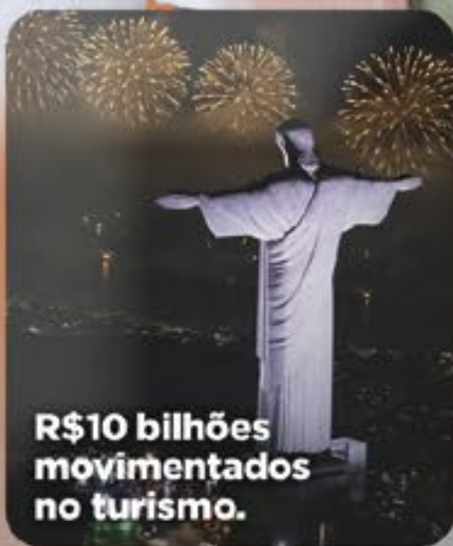
R$10 bilhões movimentados no turismo.