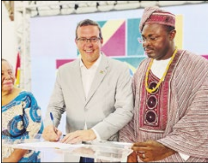
Acordo estreita laços entre Macapá e Ouidah