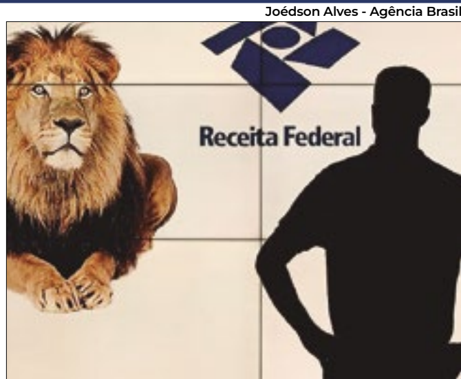
'Leão' abre consulta aos declarantes do Imposto de Renda

Segundo relatório, saldo negativo subiu de R$ 9,3 bi para R$ 14,5 bi