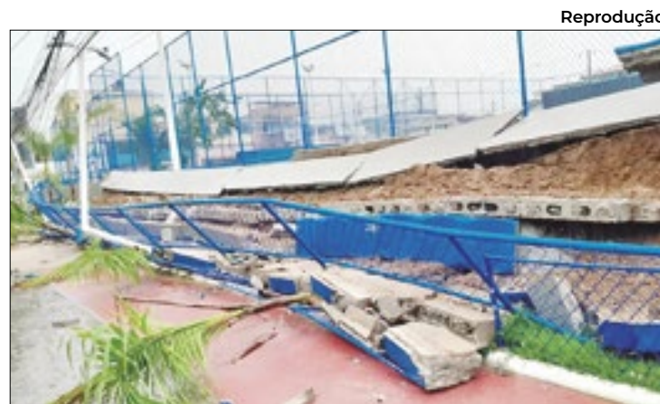
Estrutura em Salvador cede três meses após inauguração

Atualmente, o Hub possui seis pré-contratos assinados com empresas como AES Brasil, Casa dos Ventos, Cactus Energia, Fortescue e Voltalia, além de uma empresa que ainda não divulgou seu nome. Outros contratos estão em negociação, com mais de 35 Memorandos de Entendimento assinados. Os investimentos dos pré-contratos totalizam mais de US$ 8 bilhões até 2030, com mais de 500 hectares já reservados no Setor 2 da ZPE Ceará.