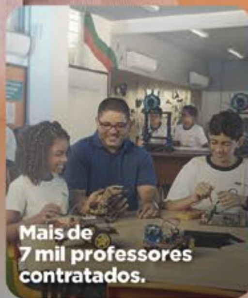
Mais de 7 mil professores contratados.