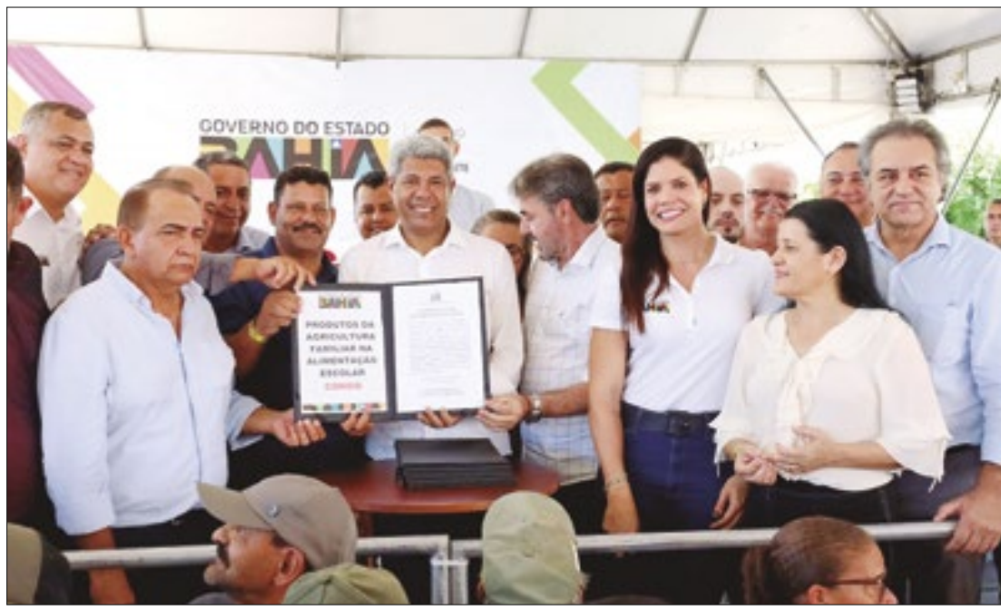
Estudantes da rede pública passam a ter produtos da agricultura familiar na alimentação

O edital é uma iniciativa global para enfrentar desafios ambientais, focando em biodiversidade, mudanças climáticas, degradação da terra e águas internacionais. As organizações interessadas devem demonstrar sua qualificação para realizar os serviços descritos no Termo de Referência, incluindo dados gerais e antecedentes da instituição, destacando atividades e produtos relacionados ao edital.