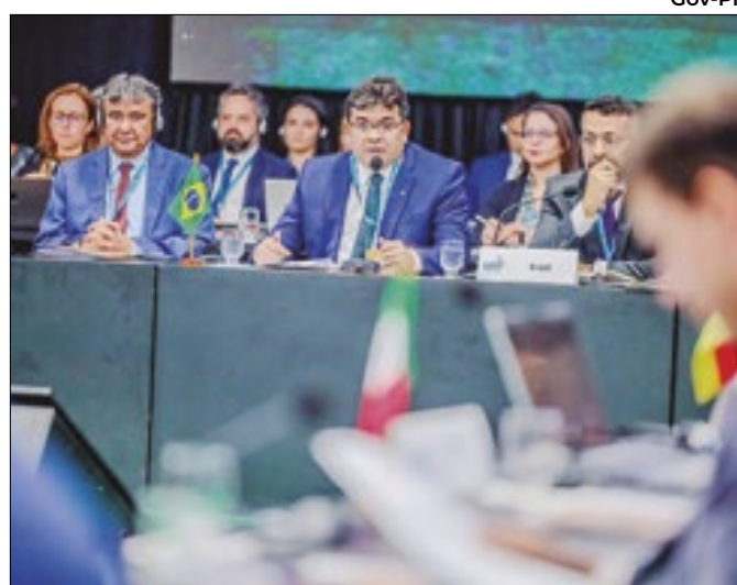
Reunião da G20 reúne 52 delegações em Teresina