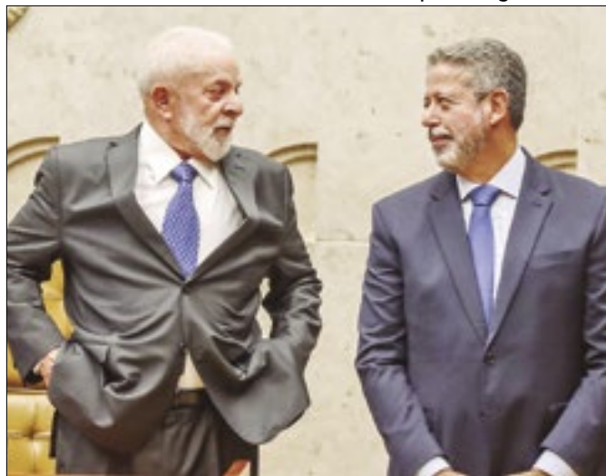
Presidente e deputado apresentam suas armas