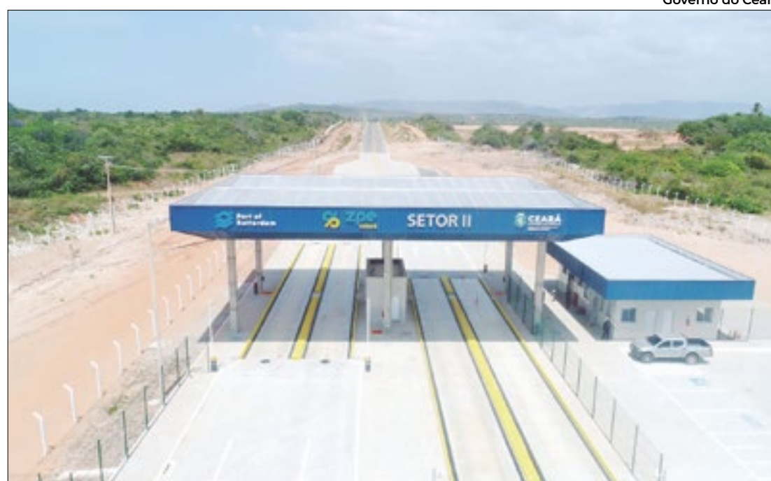
Infraestrutura visa acelerar instalação de unidades de produção no Complexo do Pecém

Estrutura no Complexo do Pecém está pronta para investimentos