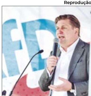
Maximilian Krah é da AfD

O principal candidato do partido de extrema direita alemão Alternativa para a Alemanha (AfD) ao Parlamento Europeu, Maximilian Krah, disse ao jornal italiano La Repubblica no sábado (18) que nem todos os membros da SS, organização paramilitar nazista, eram criminosos. A fala só foi reportada na terça, quando Marine Le Pen, líder da ultradireita francesa, anunciou que não iria mais participar de uma coalizão com a AfD no Parlamento.