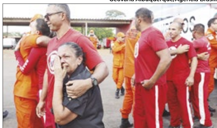
Militares retornaram após 15 dias de missão no RS