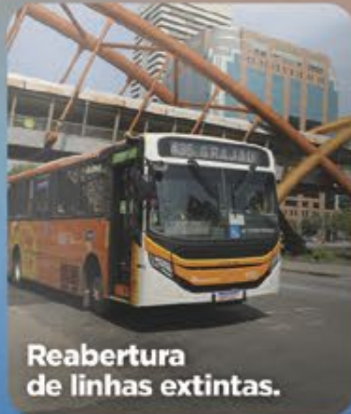
Reabertura de linhas extintas.