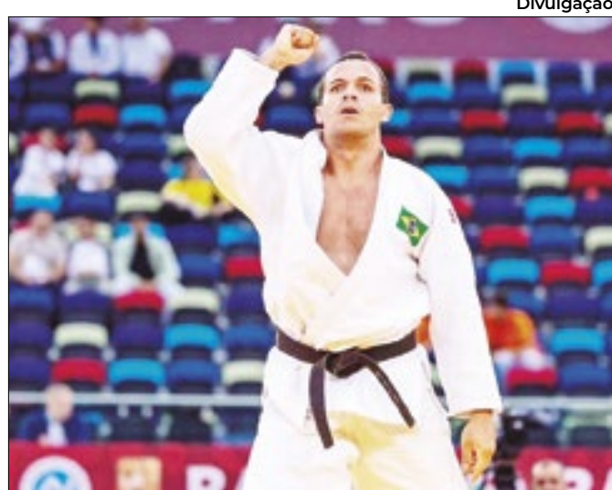
Arthur Cavalcante foi ouro no judô paralímpico