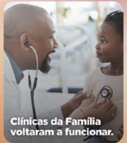
Clínicas da Família voltaram a funcionar.