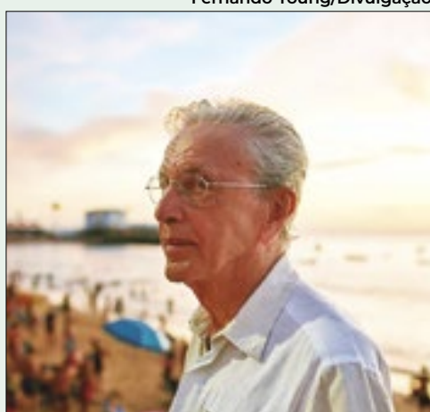
Caetano Veloso lista sua vasta trajetória cinéfila em livro lançado na noite de terça-feira em evento que lotou o Teatro Clara Nunes, na Gávea