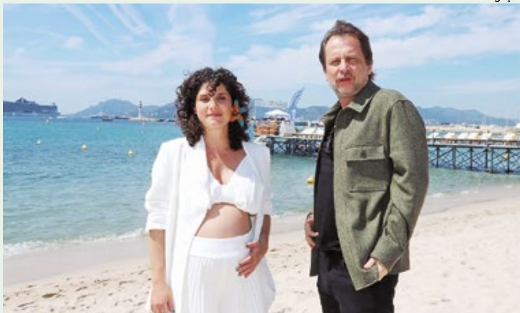
Gabriela e Eryk filmaram a cosmogonia da selva na visão de Davi Kopenawa