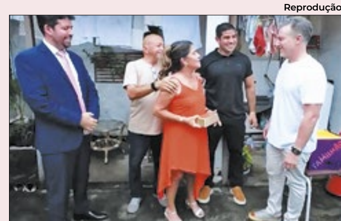
Professora recebe, no Maranhão, prêmio de Huck

Mas o grande chamariz é o prêmio — um certificado de barra de ouro no valor de R$ 1 milhão. A entrega é feita pelo próprio Huck, que vai à casa dos premiados ou os recebe no palco de seu programa de TV. Os vencedores são definidos em sorteios da Loteria Federal.