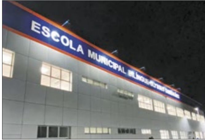
Escola fica localizada em Imbariê, no terceiro distrito