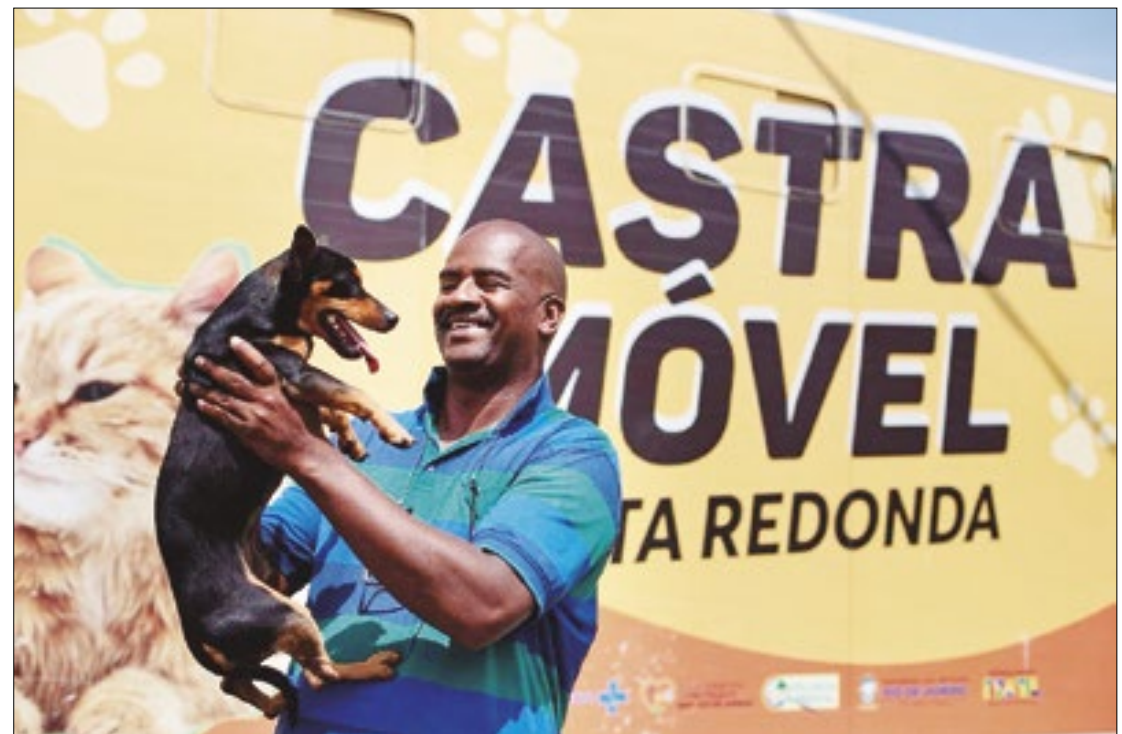
Projeto já é uma realidade em muitas cidades da região Sul Fluminense

Mesmo sem os castramóveis, Barra Mansa também