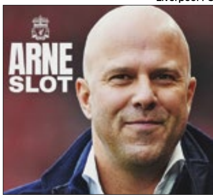
Arne Slot substituirá Klopp no Liverpool

Arne Slot será o próximo comandante do Liverpool. O holandês assumirá o cargo formalmente em 1º de junho, conforme anunciado pelo clube. O contrato é válido até o meio de 2027. Slot tinha vínculo com o Feyenoord por mais uma temporada, mas os clubes chegaram a acordo para liberação. De acordo com a Sky Sports, a multa foi de 7,7 milhões de libras (R$ 49,9 milhões na cotação atual).