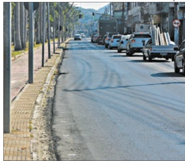
Estrutura da ciclovia da Beira Rio é alvo de reclamações

De acordo com o Atlas da Acidentalidade no Transporte, projeto desenvolvido pelo Programa Volvo de Segurança no Trânsito (PVST) para determinar o tamanho da acidentalidade nas rodovias federais brasileiras, a maioria absoluta das causas de acidentes de trânsito tem sua origem no fator humano. A ultrapassagem em local restrito, a realização de conversão em local proibido, circulação de veícu-