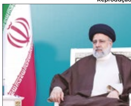
Ebrahim morreu no domingo

O presidente Lula (PT) e líderes de outros países lamentaram a morte do presidente iraniano, Ebrahim Raisi, após a queda de um heli-