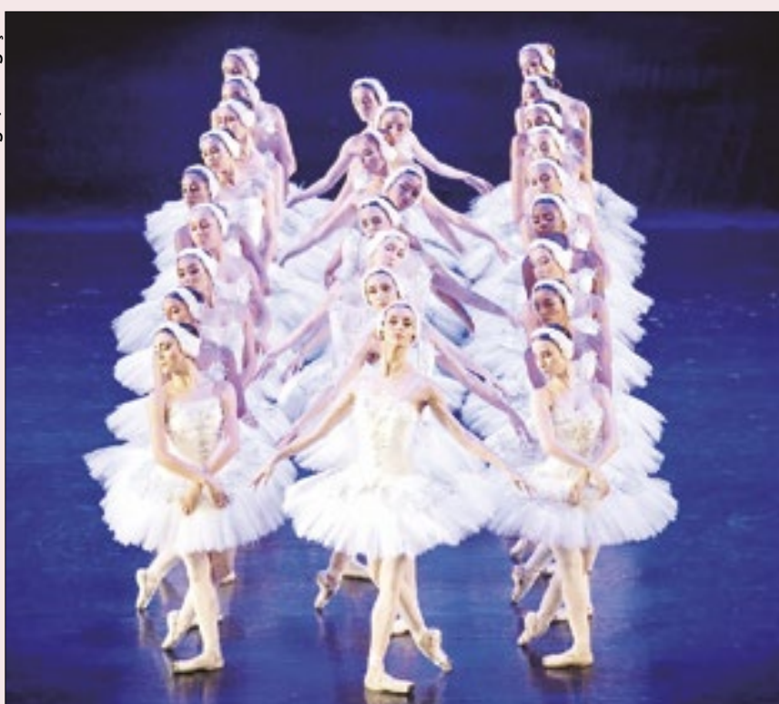
O lago dos Cisnes

O Theatro Municipal do Rio recorre ao 'Lago dos Cisnes', a coreografia clássica de Marius Petipa e Lev Ivanov para a música de Tchaikovski, para abrir sua temporada de dança. O espetáculo fica em cartaz até o próximo domingo