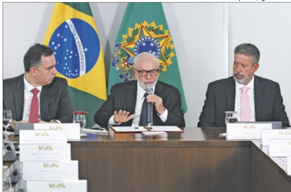
Acordo entre governo e Congresso garante votação da desoneração

Após uma série de negociações e medidas no Congresso, a Advocacia-Geral da União (AGU) acionou o Supremo Tribunal Federal (STF) para derrubar a desoneração da folha. O pedido foi acatado pelo ministro Cristiano Zanin e a Suprema Corte começou a votar a possível derrubada da medida. Porém, após o acordo