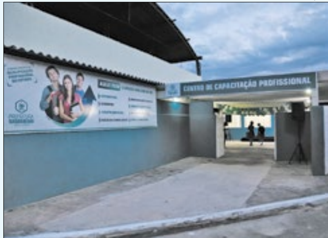
Saquarema disponibiliza curso de Mecânica de Motores