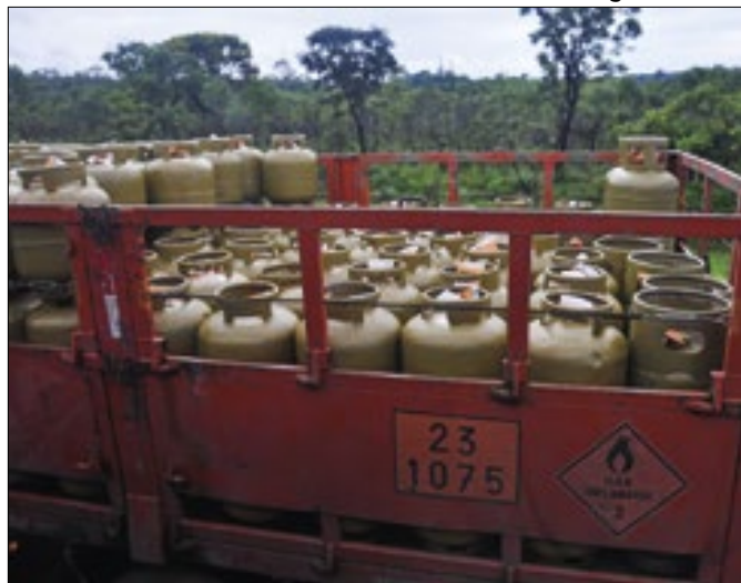
Casback devolverá 100% do CBS sobre o botijão de gás