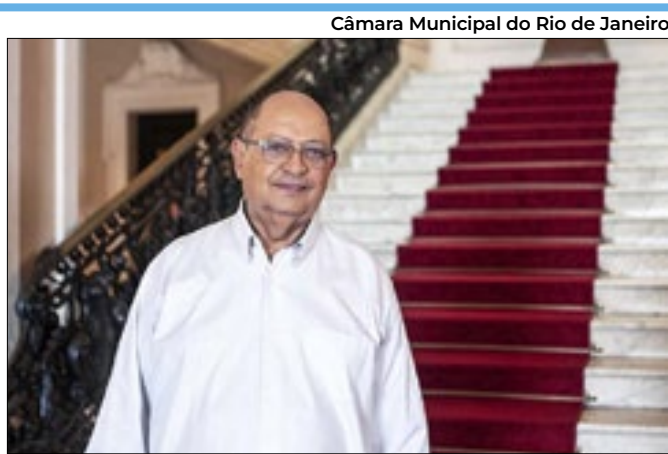
Câmara Municipal do Rio de Janeiro

O professor deixa legado de 40 anos dedicados a política.