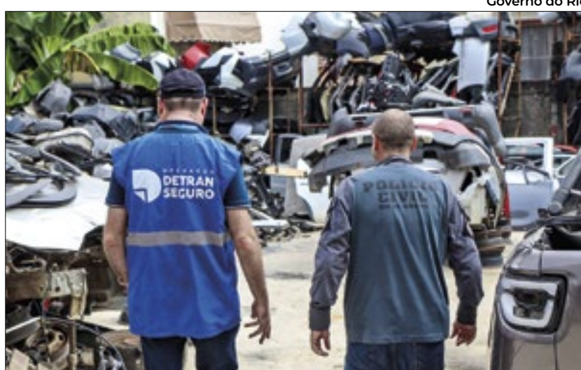
Governo do Rio