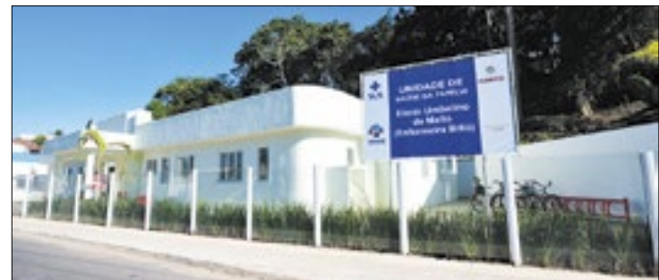
Relatório será apresentado durante audiência pública