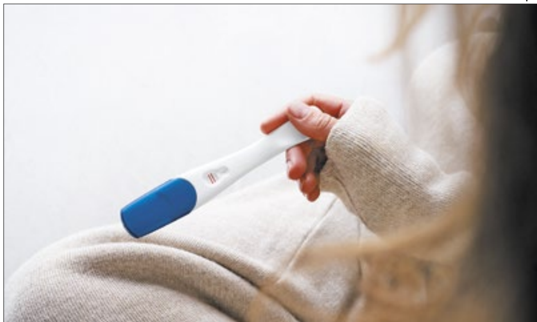
Assistolia fetal é um método de interrupção da gravidez

“Optar pela atitude irreversível de sentenciar ao término uma vida humana potencialmente viável fere princípios basilares da medicina e da vida em socieda-