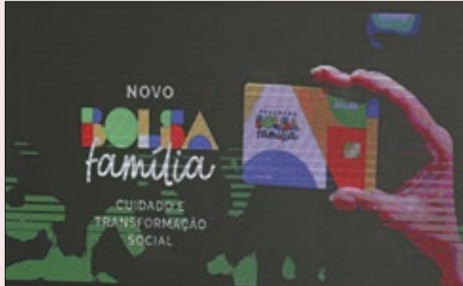
Devolução será a partir do Cadastro Único