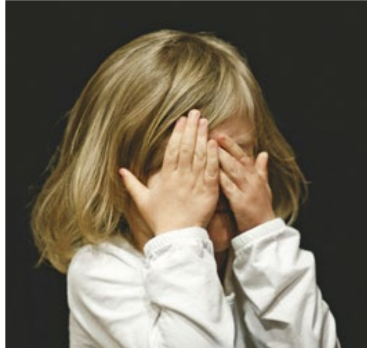
Brasil está em 2º lugar no ranking mundial de exploração sexual de jovens, perdendo apenas para a Tailândia

Os números também mostram que, a cada 24 horas, 320 crianças e adolescentes são exploradas sexualmente no Brasil. Contudo, o índice pode ser ain-