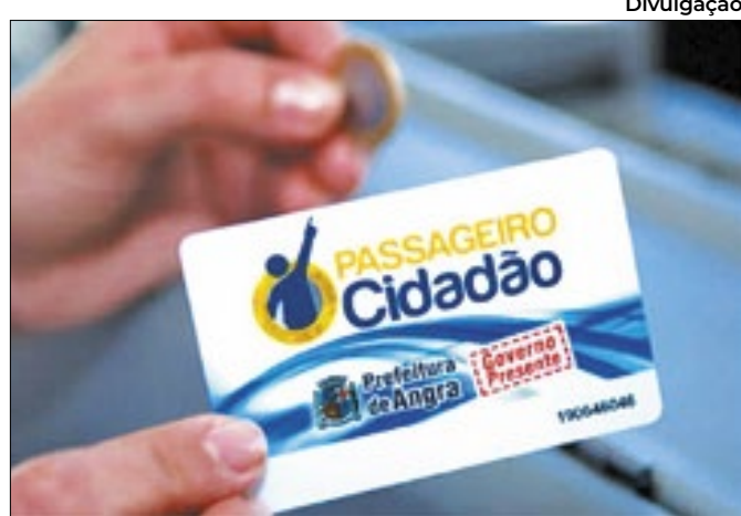
Agendados de agosto a dezembro terão nova data