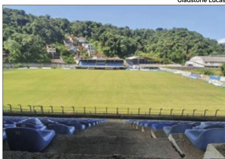
Estádio Atilio Marotti, casa dos dois clubes que estão representando a cidade