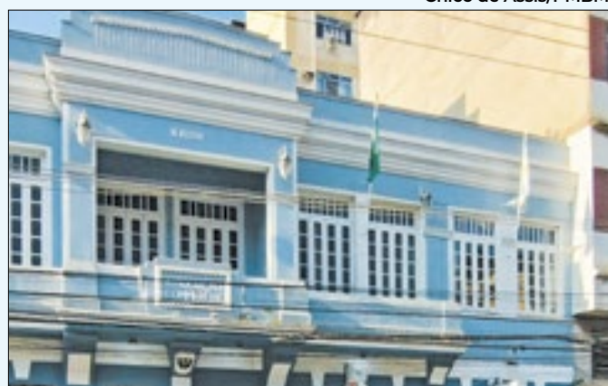
Chico de Assis/PMBM

aproximadamente 65.400 moradores são contemplados com esse benefício. Para aqueles que não se inscreveram, ainda existem 60 vagas abertas todos os dias.