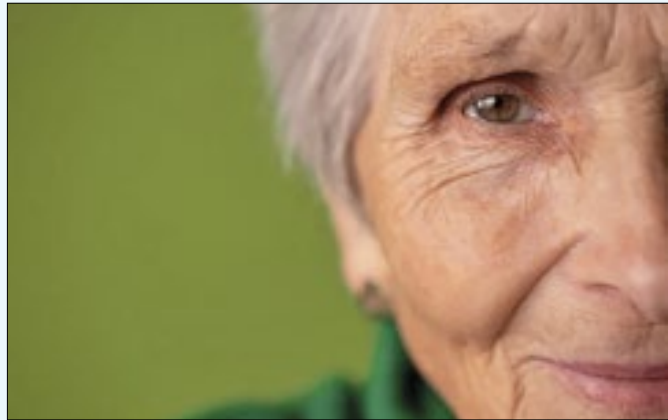
Combate à violência contra idosos em Petrópolis