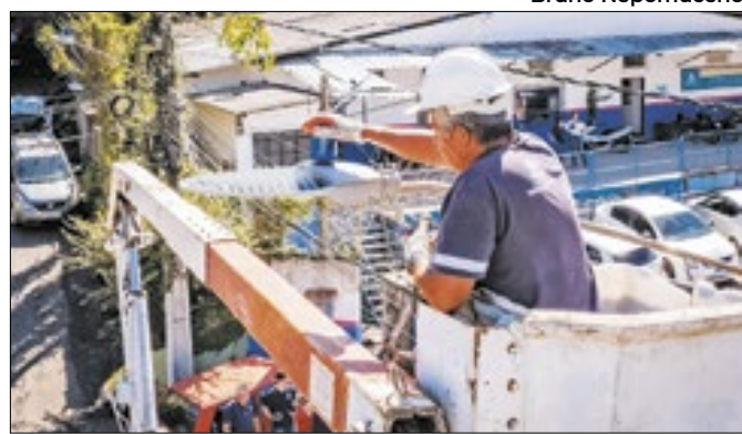
Equipes da prefeitura instalando o 'Smart Lighting'