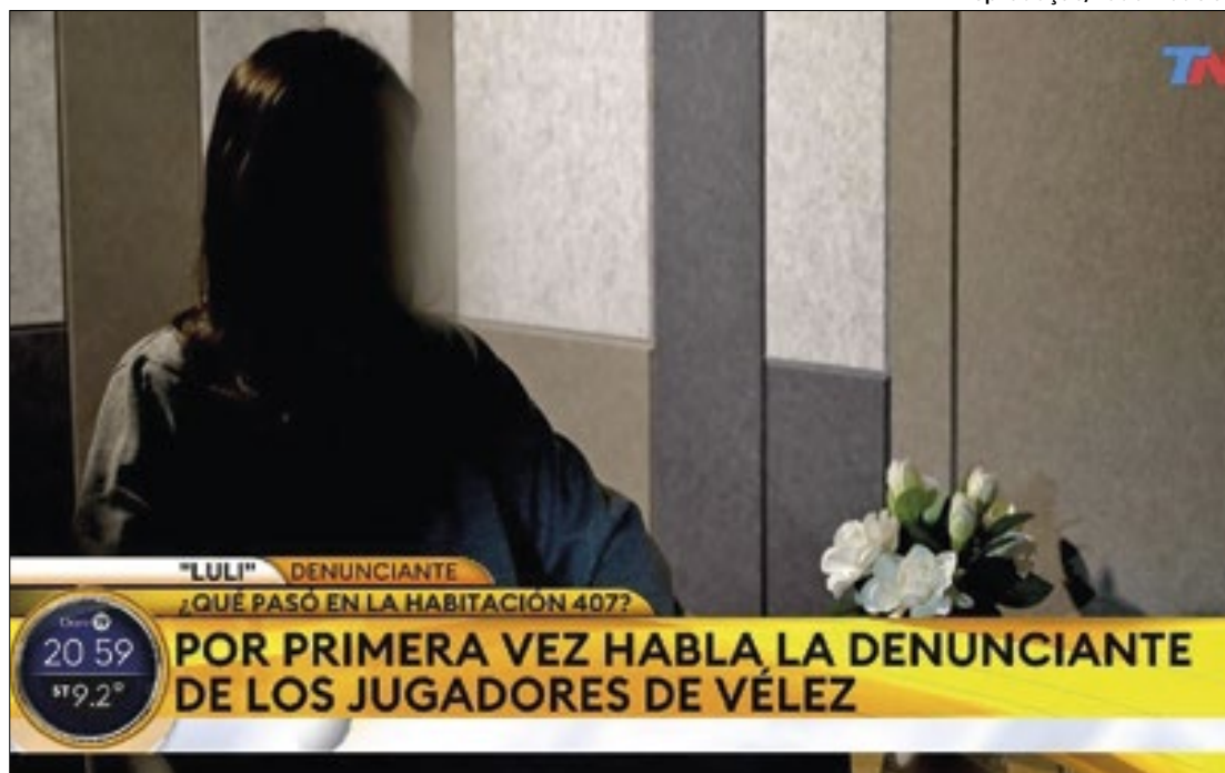
Vítima do abuso sexual pediu justiça após falar pela primeira vez com a TV na Argentina

Florentín e Cufre podem pegar até 20 anos de prisão, segundo o jornal argentino Olé. Os dois respondem por