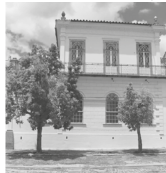
Local foi tombado