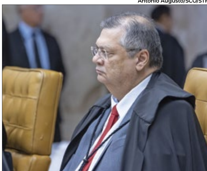
Dino criticou as “diversas nulidades” da Lava Jato

Em maio de 2023, quando estavam na 8ª Turma do TRF-4, os desembargadores teriam “passado por cima” de uma determinação do ministro Dias Toffoli ao aprovar a suspensão do então