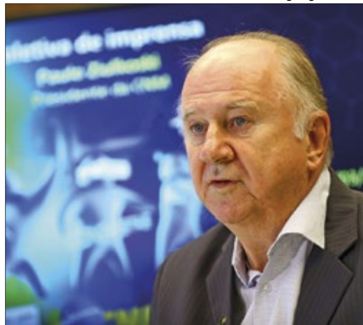
Ziulkoski detalhou pauta da Marcha dos Prefeitos

Parlamentares afirmam ter um acordo sobre a desoneração de 17 setores da economia já fechado. Entretanto, faltam os detalhes da transição para reoneração dos municípios, que durante o evento, devem pressionar os poderes para uma decisão que beneficie as prefeituras.