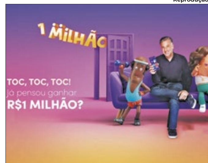
Site do programa destaca prêmio oferecido