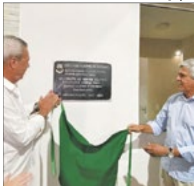
Inauguração de espaços sociais

A Prefeitura de Cantagalo, através da Secretaria Municipal de Cultura, turismo, Esporte, Certames e Lazer, realizou, na última semana, a inauguração do Centro Cultural Professora Amélia Thomaz, da Sala de Espetáculos Rafael Silva Carvalhaes