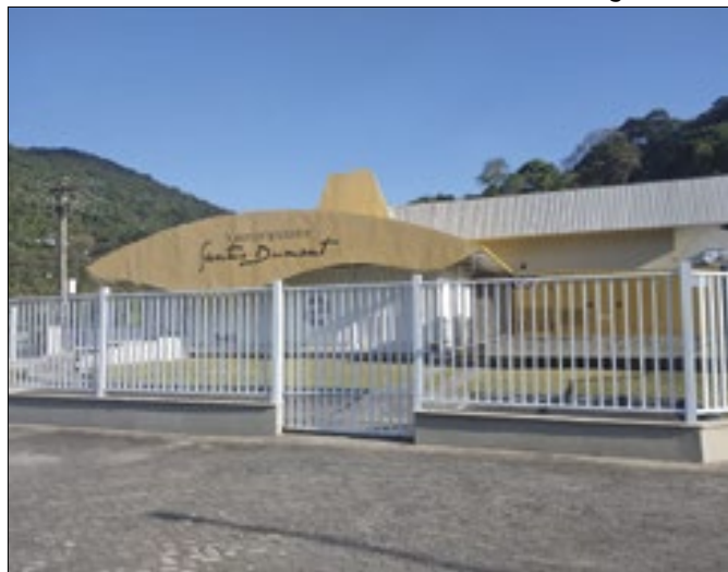
Dois estudantes na sede foram contemplados