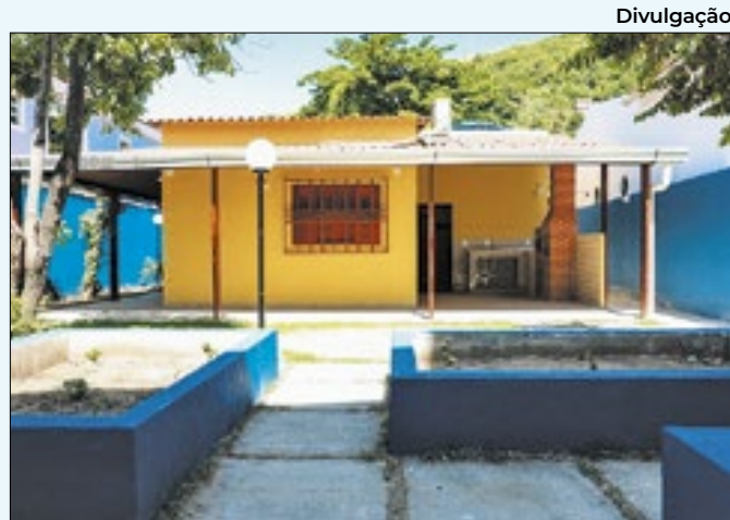
Novas instalações ficam no bairro da Coreia

Caxias, Wilson Reis, falou da importância de continuar investindo em educação e melhorias para os alunos da rede de ensino. A gente acredita que a educação é a chave para mudar vidas e investir em novas escolas é investir em um futuro melhor," declarou.