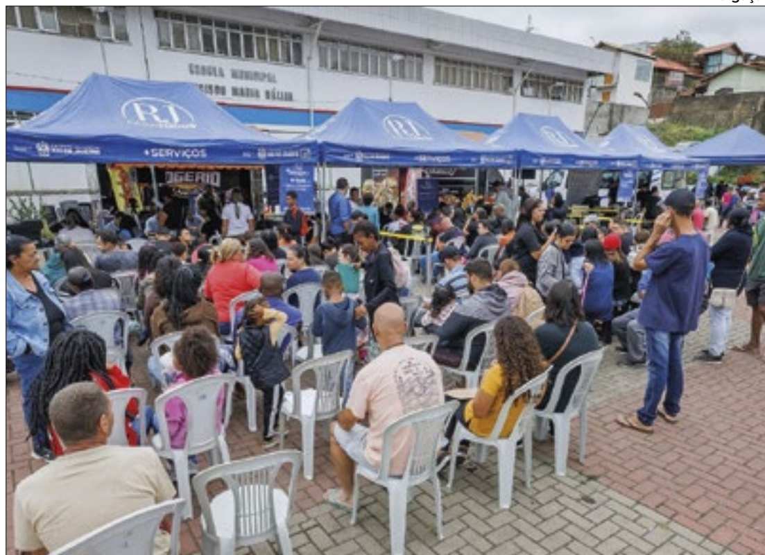
Projeto acessível é fruto da parceria do Estado com a prefeitura municipal

Entre os serviços, emissão de CPF e carteira de identidade; isenção para certidões de nascimento, casamento e óbito; habilitação para casamento; carteira de trabalho digital e balcão de empregos e orientações sobre direitos do consu-