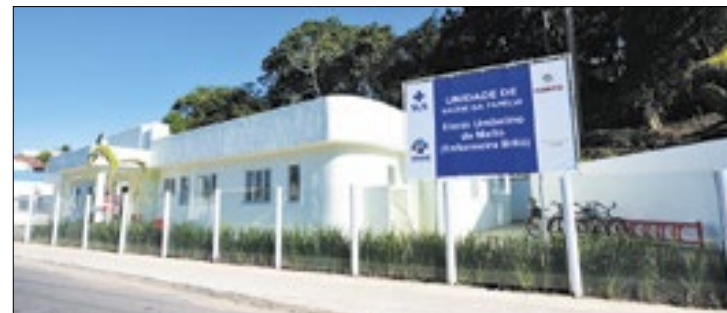
Relatório será apresentado durante audiência pública