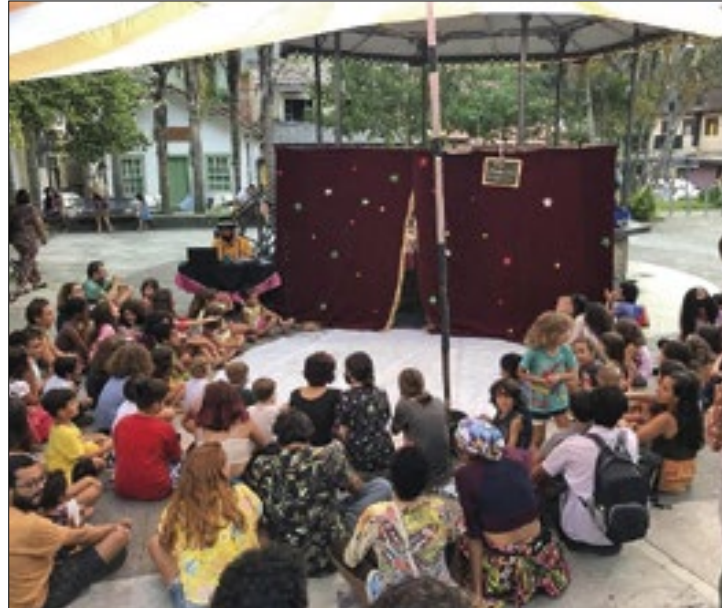
Evento, conta com parceira do Governo do Estado

do evento são os Grupos de Trabalho (GT's), que acontecem no sábado.