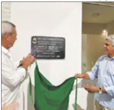
Inauguração de espaços sociais

A Prefeitura de Cantagalo, através da Secretaria Municipal de Cultura, turismo, Esporte, Certames e Lazer, realizou, na última semana, a inauguração do Centro Cultural Professora Amélia Thomaz, da Sala de Espetáculos Rafael Silva Carvalhaes