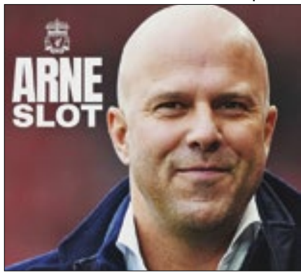
Arne Slot substituirá Klopp no Liverpool

Arne Slot será o próximo comandante do Liverpool. O holandês assumirá o cargo formalmente em 1º de junho, conforme anunciado pelo clube. O contrato é válido até o meio de 2027. Slot tinha vínculo com o Feyenoord por mais uma temporada, mas os clubes chegaram a acordo para liberação. De acordo com a Sky Sports, a multa foi de 7,7 milhões de libras (R$ 49,9 milhões na cotação atual).