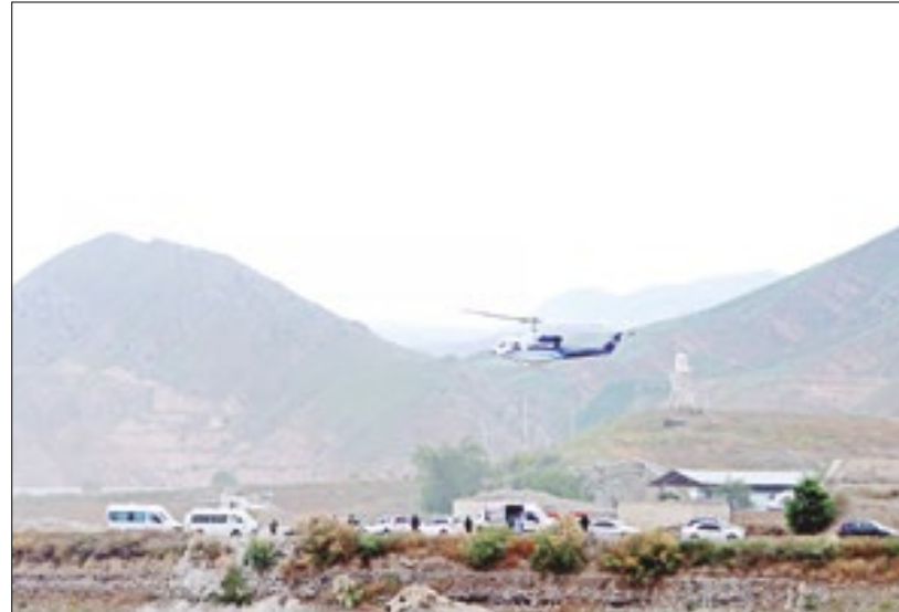
Equipamento usado por comitiva era obsoleto

Por evidente, não é possível colocar na conta do estado de manutenção do Bell 212 usado por Raisi a tragédia a esta altura. Pelas informações disponíveis, se não houve alguma ação externa contra a aeronave, ela se encontrava em um local montanhoso e com baixa visibilidade o pesadelo de qualquer piloto