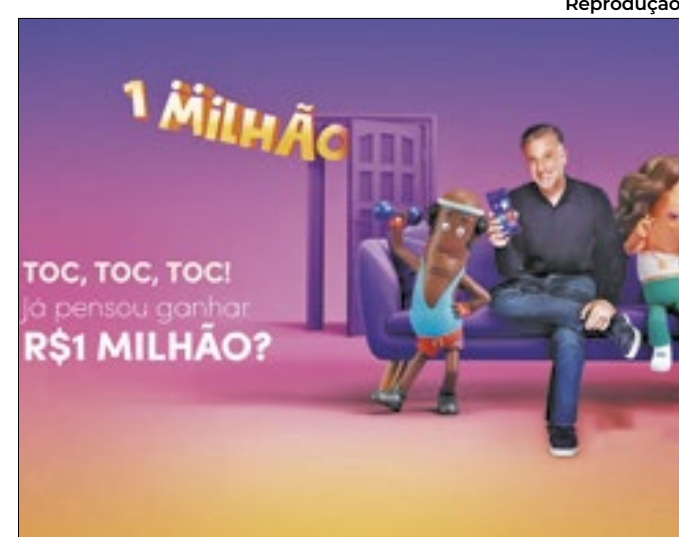
Site do programa destaca prêmio oferecido