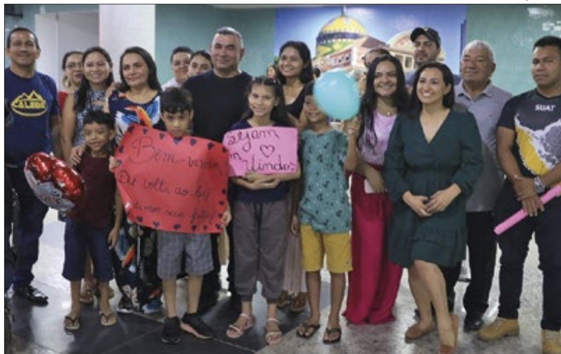
Famílias foram ao aeroporto reencontrar os 60 amazonenses que foram realocados

Os voos comerciais saíram de Florianópolis e desembarca-