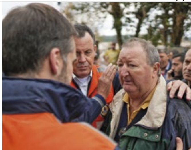
Ministério lança recomendações emergenciais