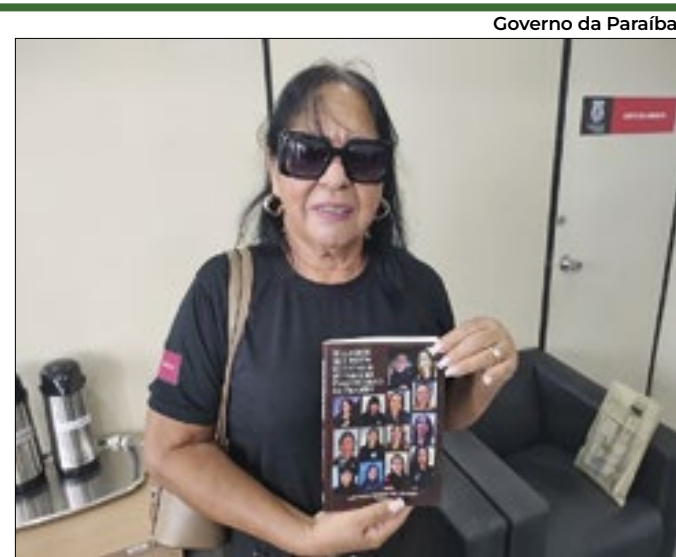
Coletânea inédita reúne relatos de profissionais da área