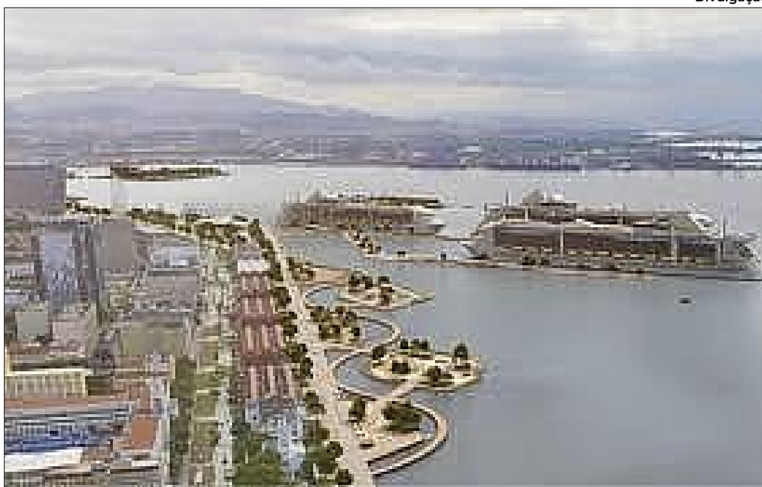
Projeto de parque na região portuária do Rio prevê praças flutuantes

Eduardo Paes fez anúncio com apresentação nas redes sociais