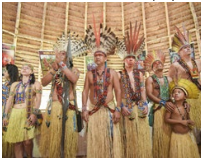
Evento permite imergir nos costumes indígenas