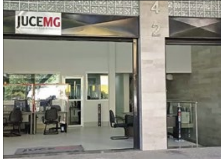
Novos negócios registrados em todo o estado

A abertura de empresas em Minas Gerais alcançou o melhor desempenho dos últimos seis anos no mês de abril, com a marca de 9.021 novos empreendimentos registrados no período. O número equivale a 300 empresas abertas por dia, superando em 27,6% a média de 2023, que foi de 235 constituições empresariais diárias. Os dados compõem o último relatório mensal da Junta Comercial do Estado de Minas Gerais (Jucemg), entidade vinculada à Secretaria de Estado de Desenvolvimento Econômico (Sede-MG), responsável por movimentações como abertura, alterações e encerramentos empresariais. "Os números refletem o trabalho do Governo de Minas, que facilita, desburocratiza e faz com que o ambiente de negócios seja o mais livre possível. Minas Gerais é hoje um grande atrativo não só no Brasil, mas internacionalmente, para qualquer empresa que busca um lugar para produzir,