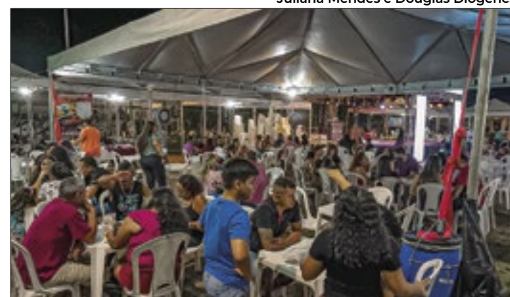
Feira vai também é ponto para apresentações culturais

A Agrotins 2024, maior feira de tecnologia agropecuária do Norte do Brasil, alcançou um novo marco ao registrar R$ 4,24 bilhões em movimentação financeira até o meio-dia do último sábado (18). O evento, que teve como tema Bioeconomia, também quebrou recordes de público e expositores. Ao longo de cinco dias, foram 232 mil visitantes e 1.096 expositores, representando uma variedade de empresas, instituições e produtores. O governador do Tocantins, Wanderlei Barbosa, celebrou o sucesso da feira e ressaltou sua importância. A Agrotins 2024 encerrou suas atividades no sábado à noite, consolidando-se como uma referência no setor agropecuário da região.