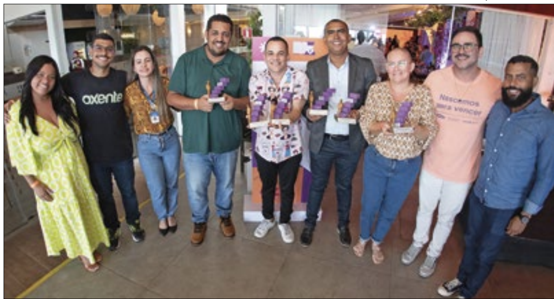
Os educadores foram premiados nas categorias ensino, ensino médio e EJA

Quatro professores da rede estadual de ensino foram reconhecidos no Prêmio Educador Transformador, uma iniciativa do Sebrae em parceria com o Instituto Significare e Bett Brasil. A premiação valoriza projetos educacionais inovadores e alinhados à Educação Empreendedora.