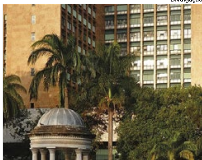
Ordem de início foi assinada e mobilização das obras