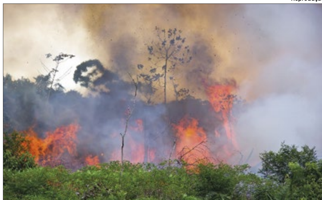
Dado foi divulgado pela Confederação Nacional dos Municípios

Diante disso, o presidente reforçou que 2.474 municípios não receberam recurso finan-