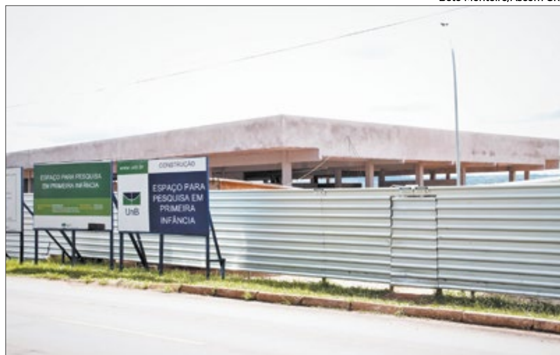
Creche deve atender ao menos 100 crianças e teve investimento de R$ 5,2 milhões

O Centro de Educação da Primeira Infância (CEPI) na Universidade de Brasília (UnB) está previsto para ser inaugurado em agosto. A unidade deverá atender cerca de 100 crianças, abrangendo a faixa etária de zero a cinco anos. O local contará com quatro salas de aula, um centro de atividades lúdicas e será totalmente adaptado às necessidades das crianças.