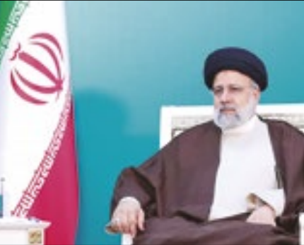
Ebrahim morreu no domingo

O presidente Lula (PT) e líderes de outros países lamentaram a morte do presidente iraniano, Ebrahim Raisi, após a queda de um heli-