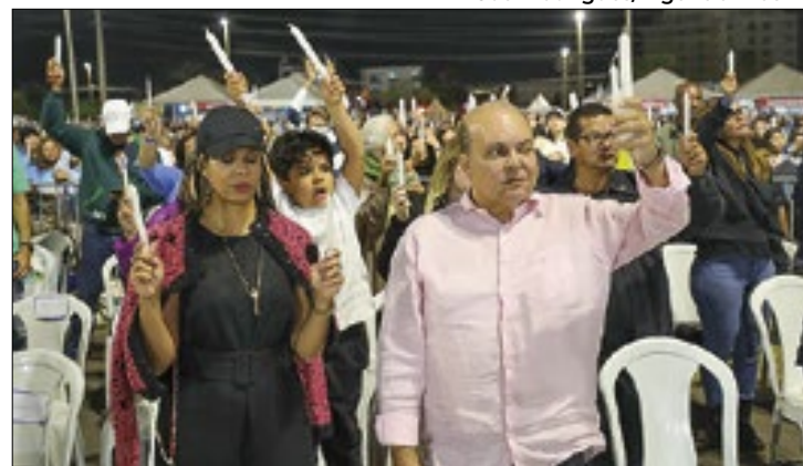
Governador e primeira-dama prestigiaram a missa