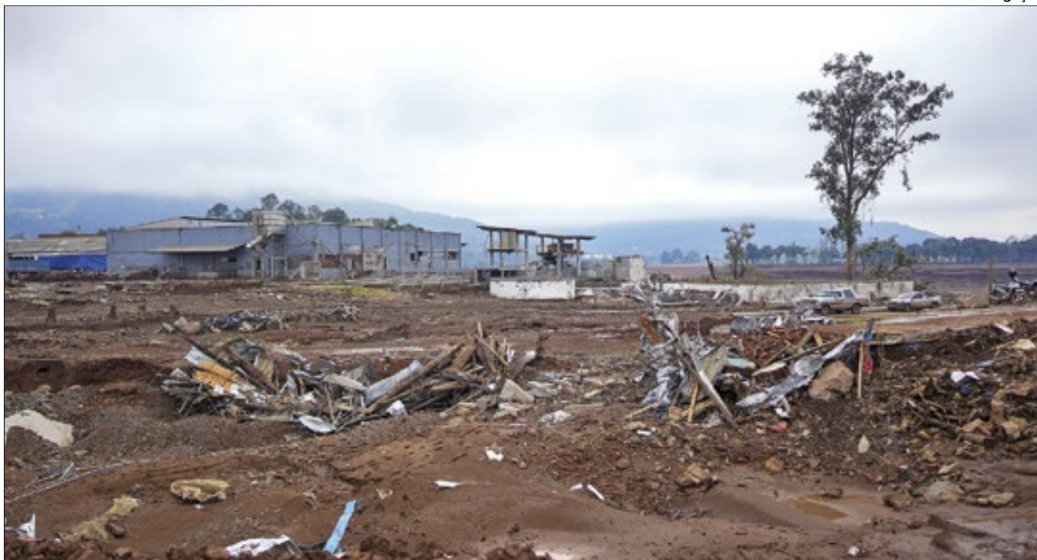
Cidades do Vale do Taquari contabilizam estragos e repensam futuro

para o Quadro Próprio do Magistério realizado em junho de 2023. Na sequência, eles serão convocados para apresentação dos documentos exigidos para assinatura do termo de posse e podem se apresentar para divisão das aulas nos Núcleos Regionais de Educação.