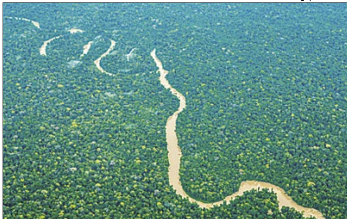
Ibama discute impactos da exploração de petróleo na Bacia do Foz do Amazonas

A recusa da Petrobras em acatar as demandas do Ibama tem aumentado as preocupa-