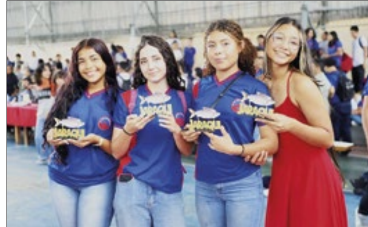
Evento apresentou 26 curtas de alunos estaduais