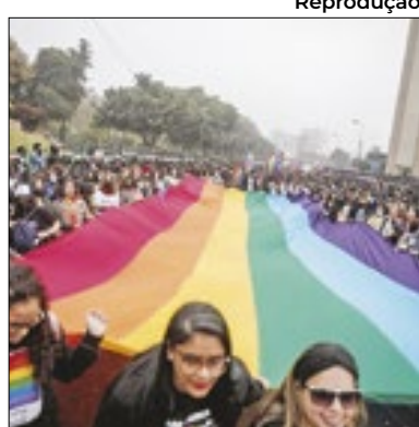
Nova classificação no país

O governo do Peru publicou um decreto que passa a considerar como doença mental a transexualidade e transtornos de identidade de gênero. Organizações LGBTQIA+ alertam que a decisão pode incentivar as chamadas terapias de conversão. Divulgado na sexta pelo Ministério da Saúde, o documento atualiza o Peas (Plano Essencial de Saúde), que determina os benefícios do cidadão ao aderir a um seguro de saúde público, privado ou misto.