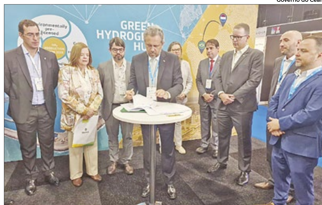
Agenda internacional contou com reuniões com empresas e autoridades do setor

Governo assina Memorando de Entendimento com Eletrobras