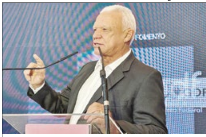
Secretário de Governo, José Humberto Pires, abre a 1ª Exporide, que contempla 12 municípios do Entorno do DF

O encontro integra as ações finais da primeira etapa do Programa Integrado de Desenvolvimento Regional e Transformação Digital das Cadeias Produtivas e Municípios da Ride-DF e Entorno, lançado em novembro do ano