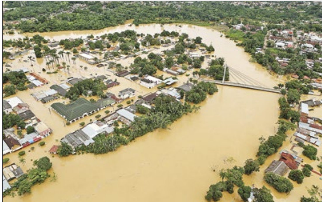
O plano visa uma adequação dos governos às mudanças no clima

rie de chuvas fortes que atingiu o estado em menos de um ano. Como mostrou a Folha, pelo menos desde 2023 o risco de tragédia já era detectável na capital, Porto Alegre.