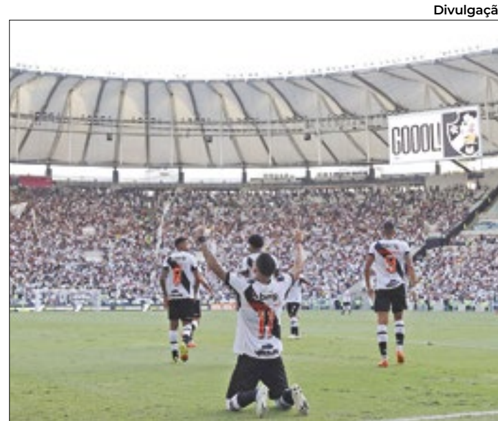
Regras também valem para outros locais de competições

A lei sugere ainda a criação de peças publicitárias para divulgação do seu conteúdo. Além disso, as instruções de como agir em caso de importu-