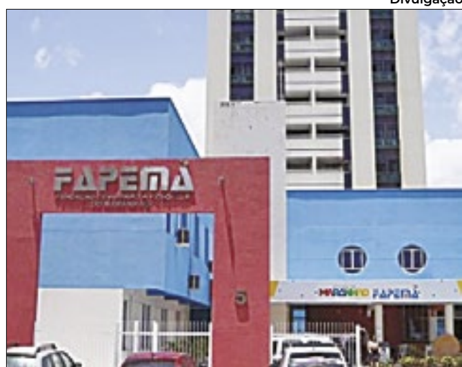
Chamada busca unir universidade e comunidades