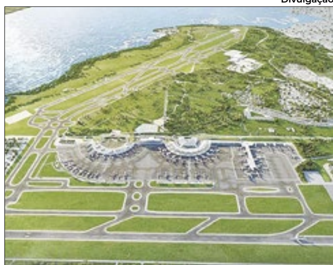
Aumento de 4,38% está previsto em contrato