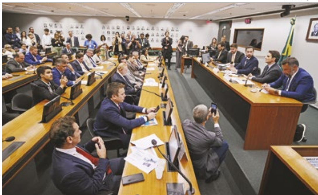
Ministro Celso Sabino esteve na Comissão de Turismo da Câmara

Sabino ainda informou aos parlamentares que o MTur lançou uma campanha de sensibilização para incentivar o reagendamento de viagens ao Rio Grande do Sul e que o Salão Nacional do Turismo, marcado para agosto, no Rio de Janeiro (RJ), terá como foco a promoção de atrativos gaúchos, a fim de estimular a procura da região por turistas.