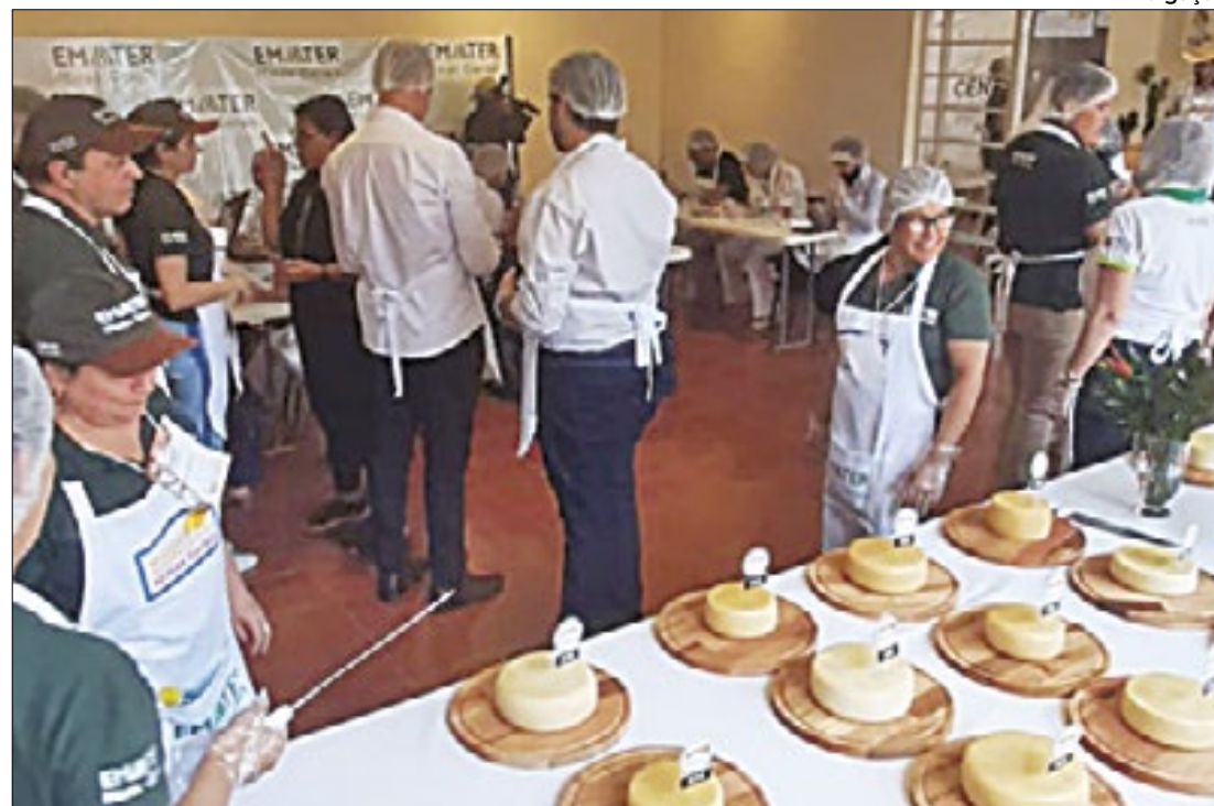
Começa a temporada dos concursos regionais de queijos artesanais de Minas Gerais

Competições são etapas classificatórias para o Estadual