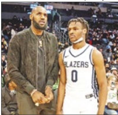
Bronny sonha em chegar à NBA

Bronny, filho de LeBron James, comentou que não compartilha o mesmo sentimento do pai sobre jogarem juntos na NBA. Bronny foi sincero ao afirmar que nunca sonhou em jogar com Lebron, apesar do pai já ter falado sobre essa possibilidade algumas vezes.