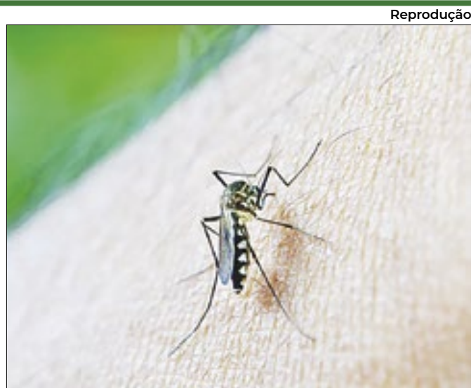
Ações a curto, médio e longo prazo