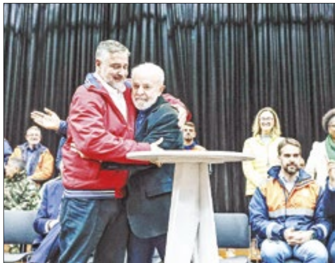
A cara de Eduardo Leite resume a contrariedade