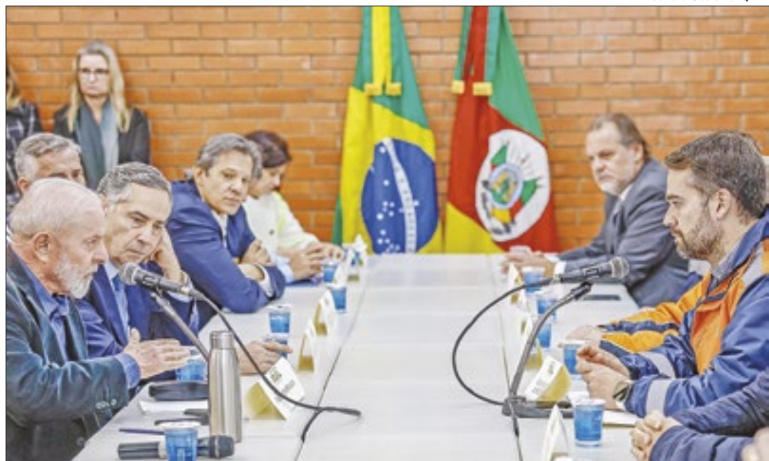
Lula anunciou as medidas de ajuda no Rio Grande do Sul

A última atualização da Defesa Civil do Rio Grande do Sul, nesta quarta-feira, contabilizou 149 mortos, 108 desaparecidos e 806 feridos. Ao todo, foram atingidos 449 municípios que deixaram mais de 538 mil pessoas desalojadas.