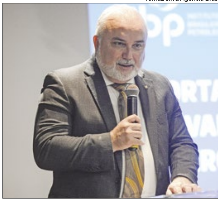
Saída de Prates gerou queda nas ações da Petrobras

Apesar de a estatal ter informado em nota que recebeu, na noite desta terça-feira (14), uma solicitação de desligamento que partiu de Prates e que foi aceita pelo Conselho de Administração da Companhia, o próprio