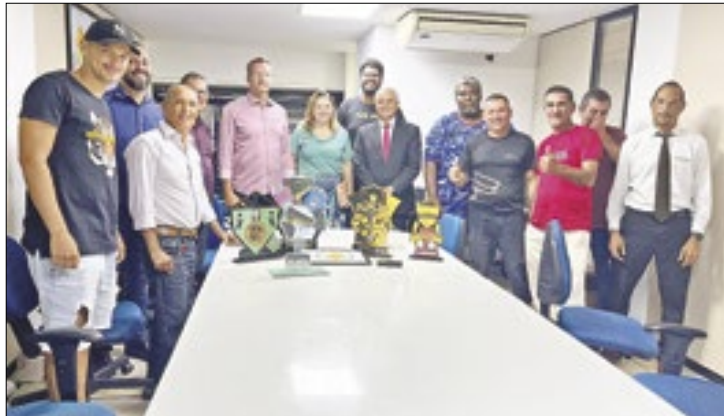
Encontro ocorreu no Instituto Brasília Ambiental