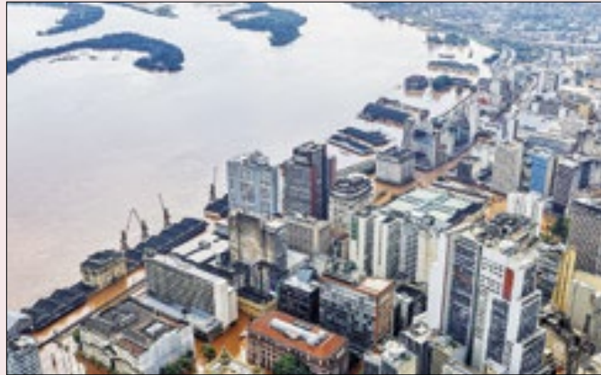
Busca de votos ou solidariedade humana?