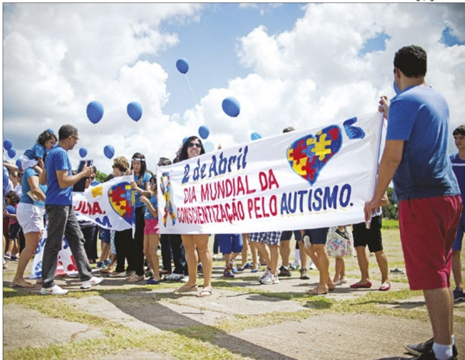
Autistas lutam contra preconceito e discriminação. Na foto, manifestação no Dia Mundial da Conscientização