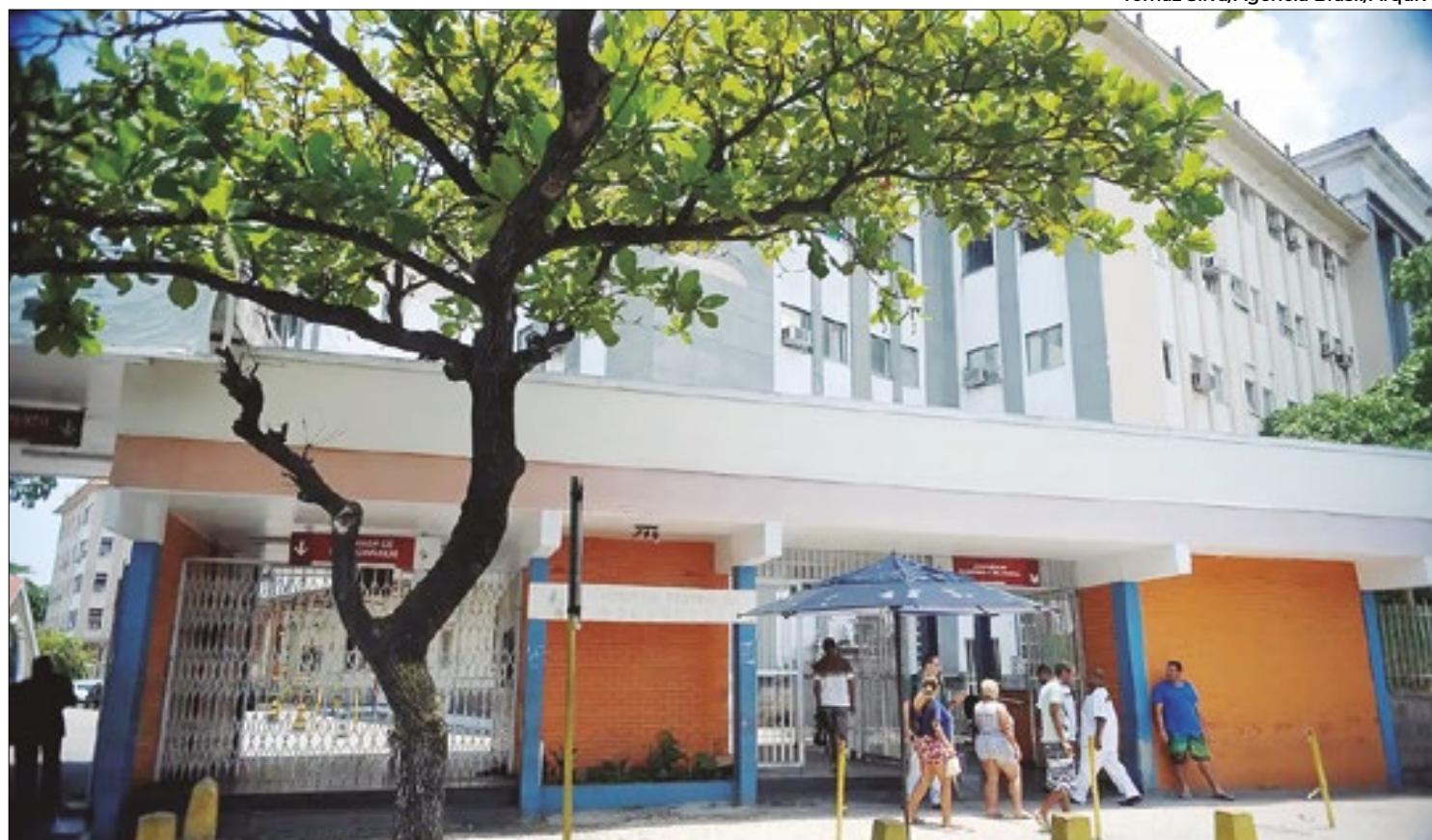
Paralisação dos servidores é por tempo indeterminado. Governo não teria oferecidos nenhum reajuste

No ano passado, outro incêndio destruiu a sala de anatomia patológica do Hospital Federal Carlos Fontes, em Jacarepaguá, embora sem registro de nenhuma consequência mais grave. Nesta semana, foi registrado mais um episódio relacionado à deterioração da