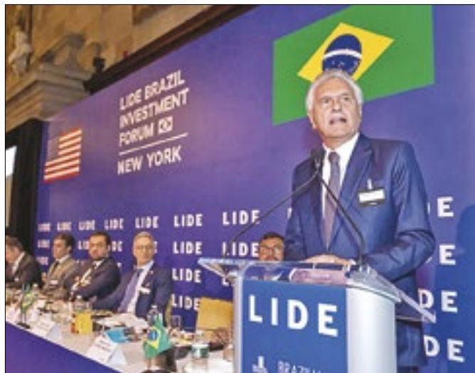
Gestor citou adequação da legislação à realidade local