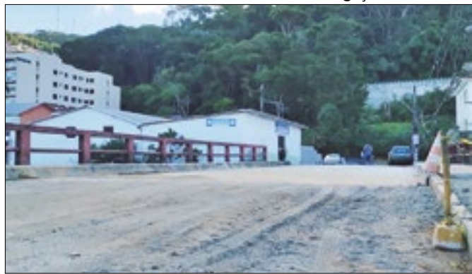
Trecho da Rua Doutor Aleixo com obra finalizada