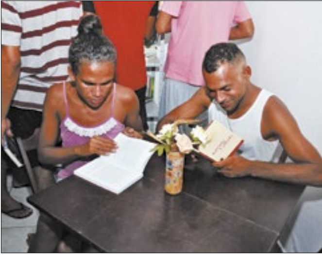
Biblioteca Acolhedora foi inaugurada na última semana