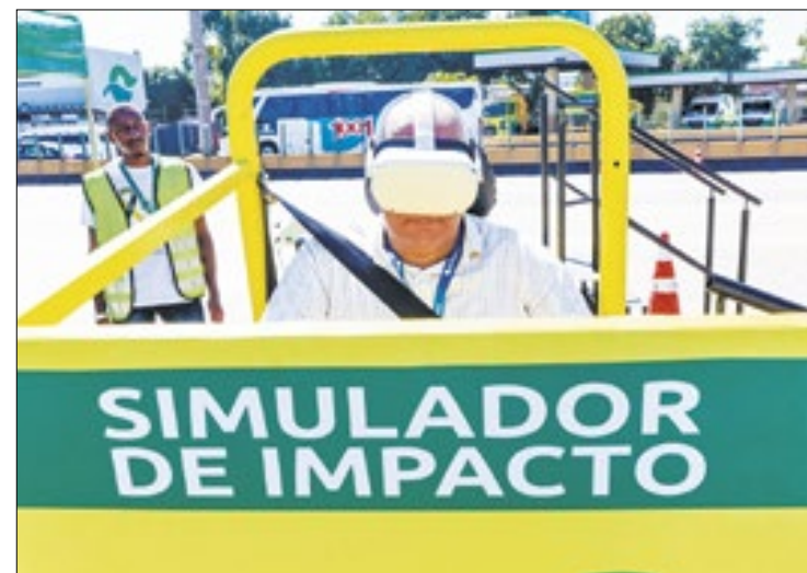
Alunos sentem os impactos de uma batida de carro

ser usado em quem estiver nos bancos da frente e de trás. Vou passar tudo que me ensinaram para os meus pais”.