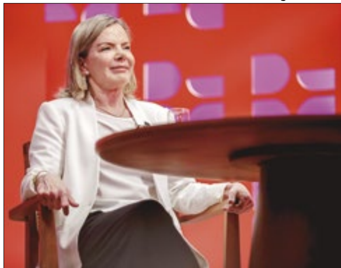
Gleisi Hoffmann seguirá "comentando geral"...