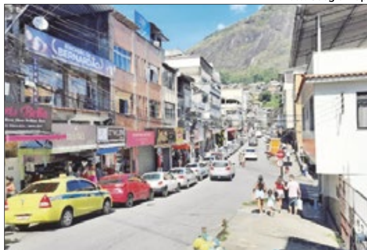
Polo de Moda Íntima de Nova Friburgo é o maior no RJ

Conhecida por seu grande destaque no polo de moda íntima, Nova Friburgo se tornou ao longo dos anos referência, com relevância nacional. De acordo