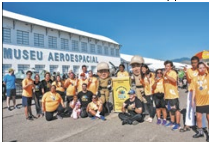
Evento no Museu foi cancelado em razão da enchente