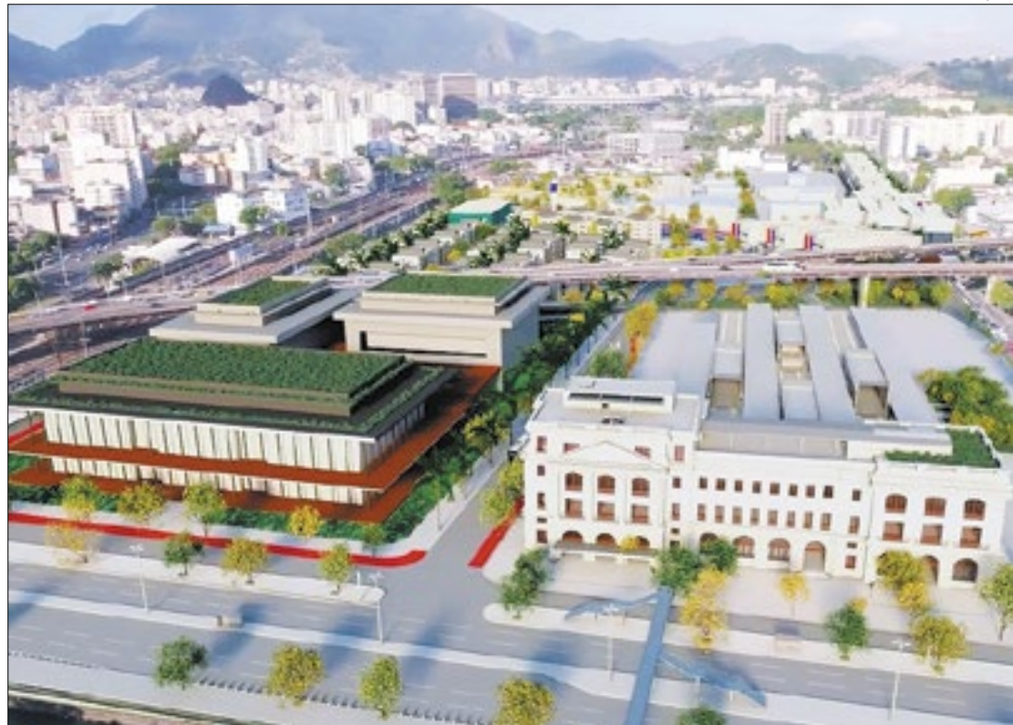
Projeto prevê também conjunto habitacional e Cidade do Samba para escolas da Série Ouro

Foi assinado na última sexta-feira (10), a cessão da antiga Estação Ferroviária Leopoldina, na Avenida Francisco Bicalho, no Santo Cristo. Com a celebração do termo, o município pode agora dar andamento ao processo licitatório para a restauração do prédio histórico, também conhecido como Estação Barão de Mauá, em homenagem ao pioneiro do transporte ferroviário no Brasil. Prefeitura do Rio e União assinaram ainda o termo de guarda do terreno da estação, de cerca de 125 mil metros quadrados, onde serão erguidos empreendimentos com 700 unidades habitacionais, equipamentos públicos de Saúde e Educação, um centro de convenções e a Fábrica do Samba, com 14 galpões para abrigar as agremiações da Série Ouro. Participaram do evento o prefeito Eduardo Paes e a ministra da Gestão e da Inovação em Serviços Públicos (MGI), Esther Dweck, entre outras autoridades.