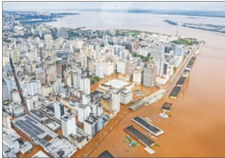
Ricardo Stuckert / PR

O crédito extraordinário também será usado para a reconstrução de parte da infraestrutura rodoviária, para ações