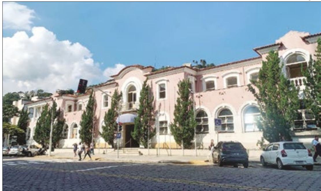
Apresentações na Reforma protestante e na Festa da cerveja serão investigadas pelo TCE