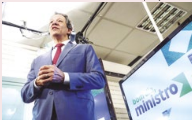
Pressão sobre Haddad teria garantido ganhos