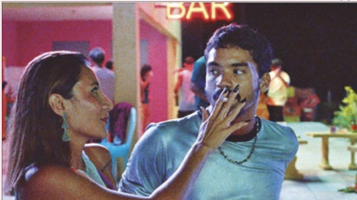
'Motel Destino', de Karim Aïnouz, está concorrendo na competição oficial do festival de Cannes