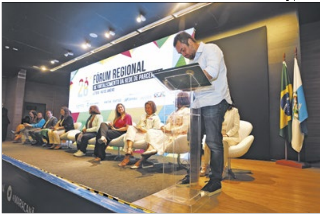
Castro fechou acordo durante o Fórum Regional de Fortalecimento da Rede de Parcerias

dade. Localizado na Rua Umbelina Simões, 101, o novo espaço representa não apenas um prédio renovado, mas o compromisso da Prefeitura de garantir o bem-estar e a dignidade daqueles que já tanto contribuíram para o desenvolvimento de Saquarema.