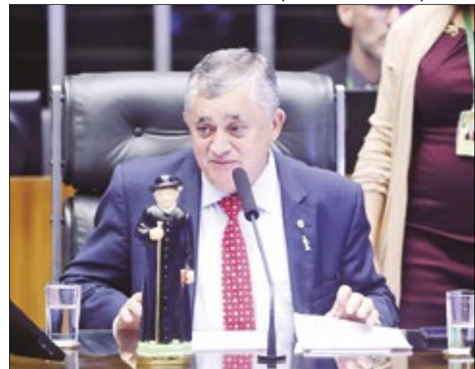
Guimarães diz que promessas serão cumpridas