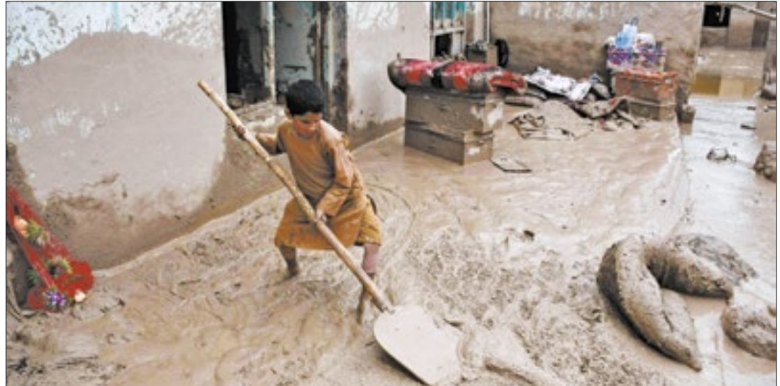
O Talibã disse ter enviado ajuda para a população

Na aldeia de Karkar, na província de Baghlan, os moradores realizaram funerais para os mortos em decorrência das