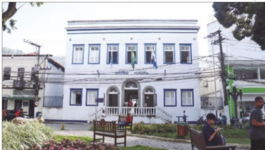
Ana Luiza Rossi/CSF

Os monitores de educação especial e berçaristas terão uma carga horária de 35 horas semanais, totalizando 175 horas mensais. Os inspetores de alunos trabalharão 40 horas semanais, somando 200 horas mensais. Já os professores MG-4 (Docente I) terão uma carga de 22,3 horas semanais, equivalente a 112,3 horas mensais, enquanto os professores MG-2 (Docente II) cumprirão