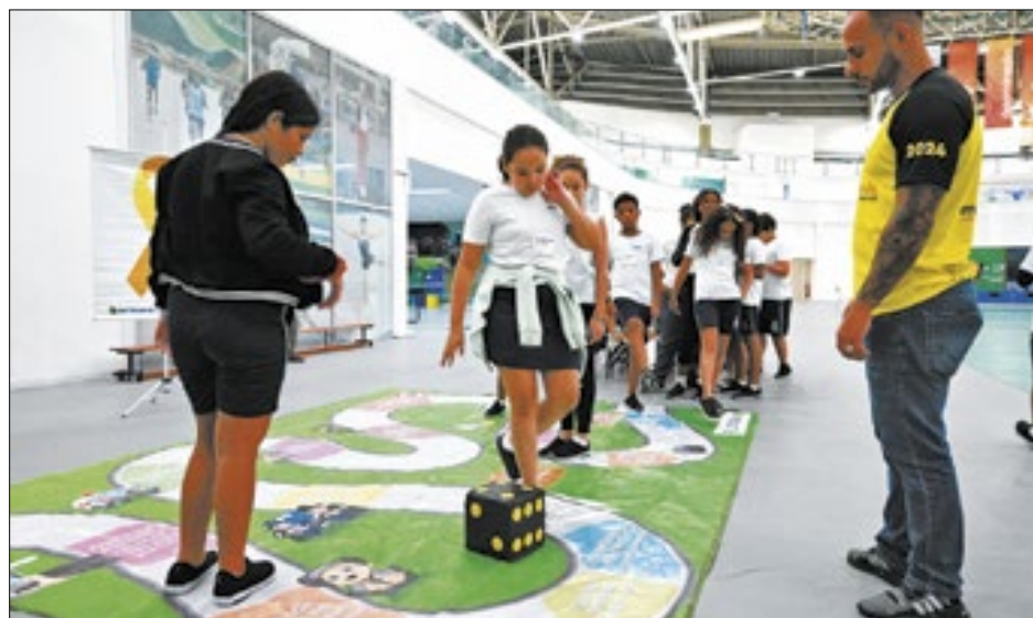
Ação educativa maio amarelo mistura jogos com a vida real