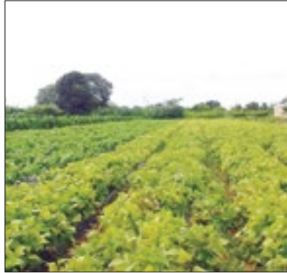
Ação promove sustentabilidade

A Prefeitura de Cantagalo, através da Secretaria de Desenvolvimento Agropecuário, está distribuindo sementes de hortaliças, para produção de hortas domésticas e comunitárias. Esse programa tem por objetivo estimular o cultivo e o consumo de hortaliças, resultando no aumento da qualidade de alimentação da população. Além disso, a ação visa incentivar o maior contato e interação do cidadão com a natureza.