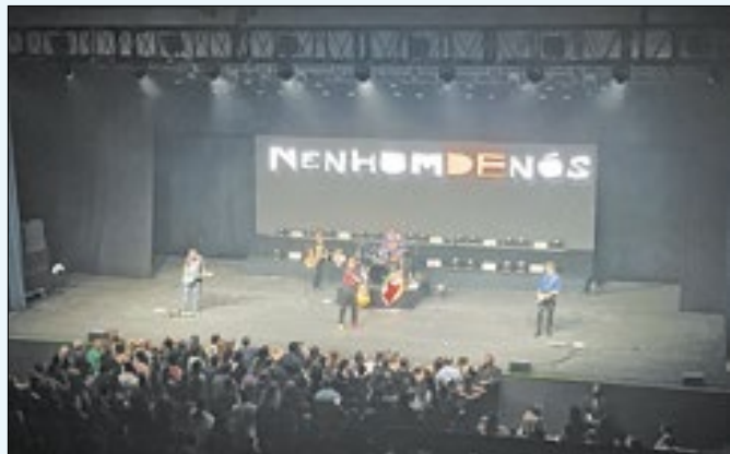
Grupo tocou com a bandeira do RS no palco