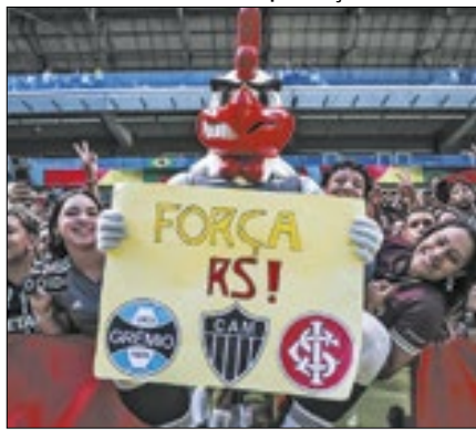
Galo faz treino aberto na Arena MRV