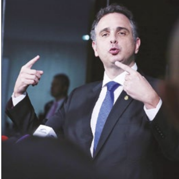
PEC é de autoria do presidente da Casa, Rodrigo Pacheco.

os servidores teriam direito ao benefício por atividades jurídicas realizadas antes mesmo do ingresso no serviço público. Segundo Casalecchi, essas informações não estão disponíveis na base de dados oficiais mantidos pela administração pública.