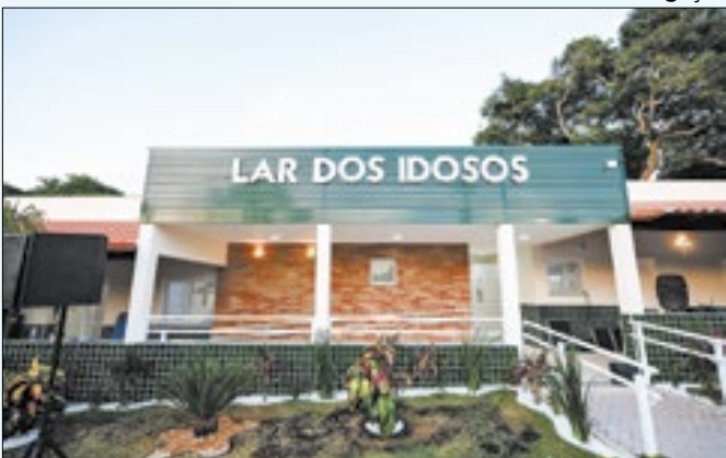
Lar dos Idosos de Saquarema foi reinaugurado