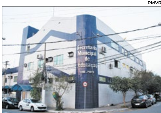
Prefeitura de Volta Redonda abre processo seletivo