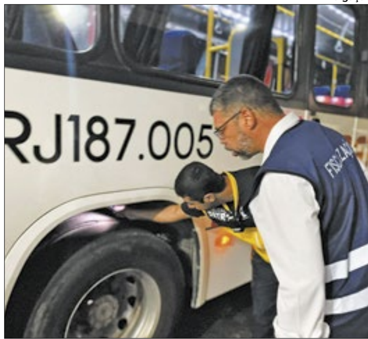
Jari acompanha fiscalização de ônibus feita pelo Detro

O deputado e os agentes do Detro também estiveram em dois pontos de Barra Mansa: na Região Leste e na Rodoviária Municipal. Já no primeiro ônibus fiscalizado, da linha 714, que sai do bairro 9 de Abril, foi identificado pneu careca, bancos soltos e porta traseira com