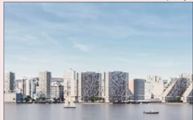
Proposta prevê torres na orla do Guaíba