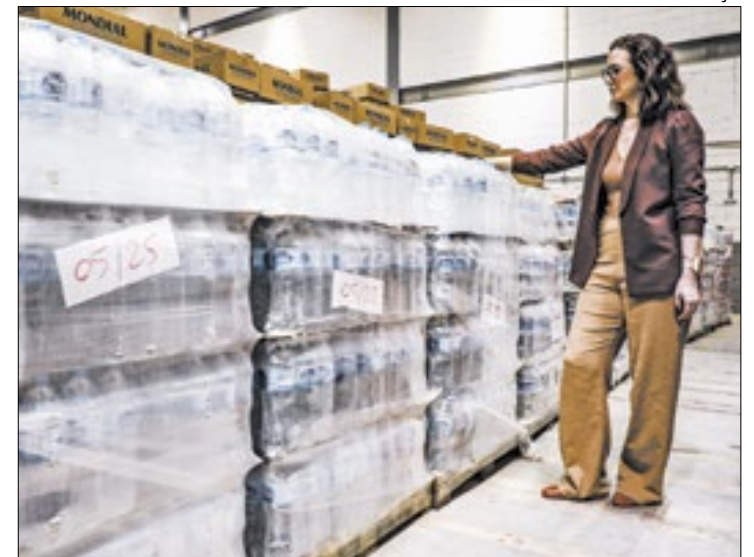
RioSolidario doa itens emergenciais para o Rio Grande do Sul