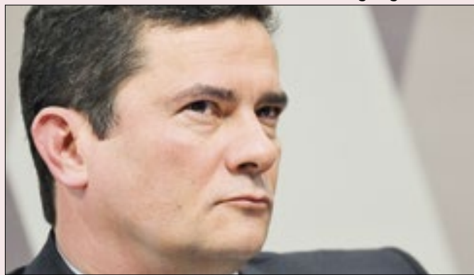
Ação que pode cassar mandato de Moro vai para TSE