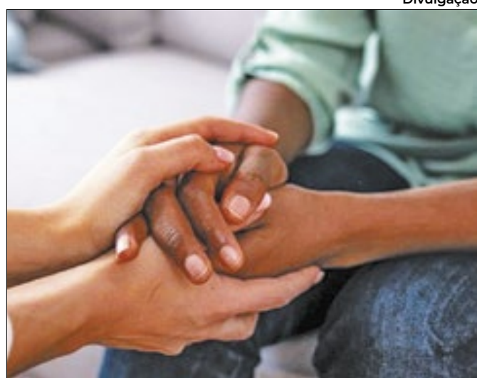
Projeto é voltado para profissionais da segurança pública