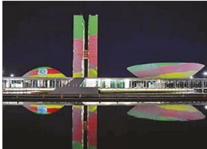
Congresso recebe projeção com bandeira gaúcha, em reverência aos eventos que atingem o Rio Grande do Sul