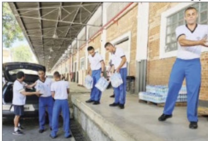
Doações seguiram para as cidades gaúchas