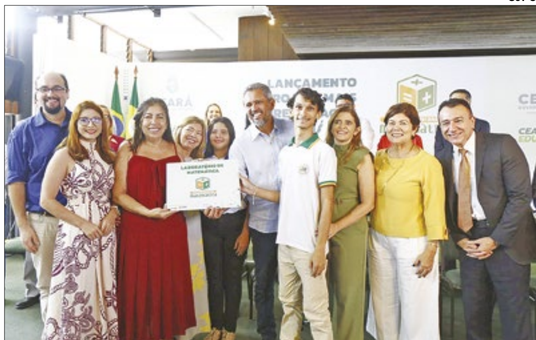
Projeto Mais Aprendizagem Matemática foca em estratégias para fortalecer o ensino

Investimento é para o programa Mais Aprendizagem Matemática