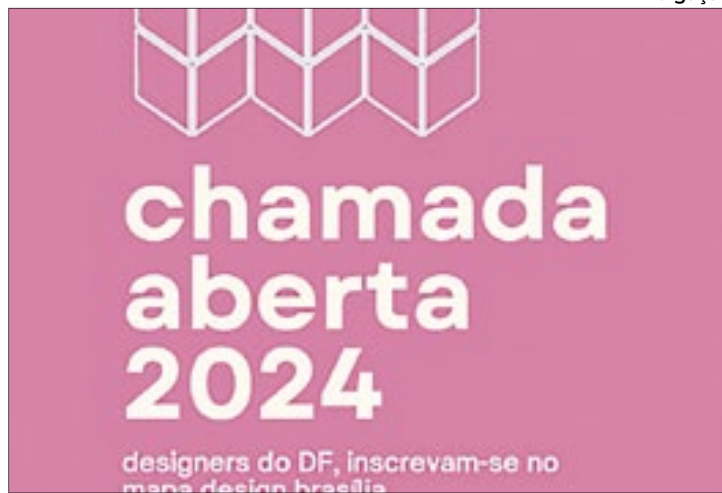
Cartaz divulgado faz chamada para a inscrição para o Mapa Design Brasília

os municípios atingidos, cuja lista é atualizada e fica disponibilizada para consulta pública em seu Diário Oficial.