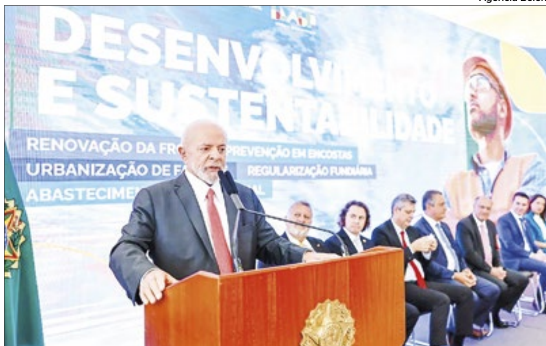
Presidente Lula anunciou o fomento de R$ 272 milhões para a capital do estado

Do total de recursos aprovados, R$ 133,56 milhões serão