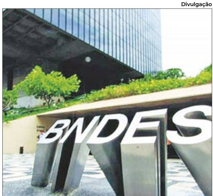
Desembolsos do banco de fomento no 1T24 subiram 22%

"É um resultado extraordinário, mostra que a fotografia anterior era boa, mas que o filme era muito melhor. Quando chegamos, havia uma certa passividade,