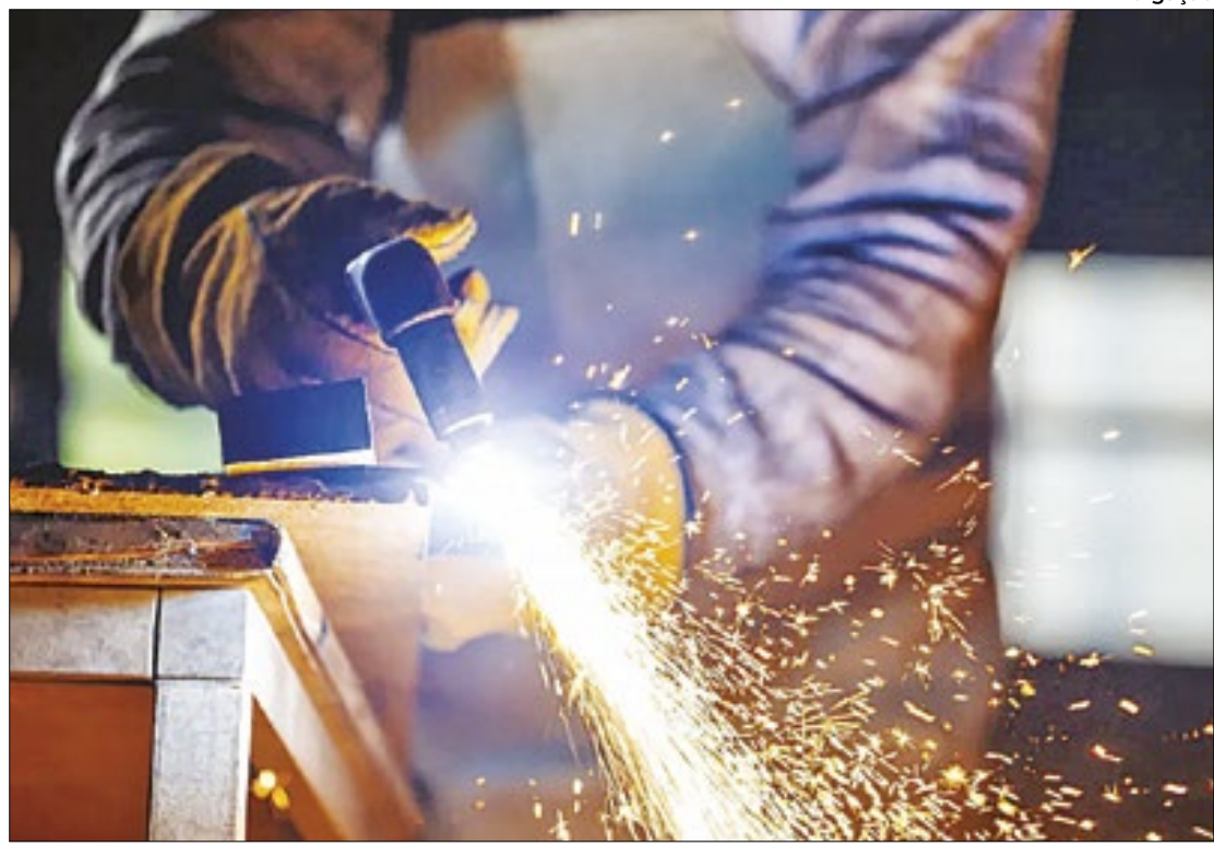
A despeito do lento afrouxamento monetário, retomada da indústria segue firme no país