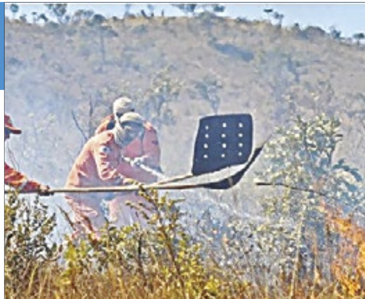
Brigadistas apagam fogo no cerrado do DF, que teve redução de queimadas ano passado