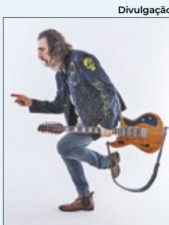
Autor de incontáveis sucessos entre 1980 e 1990, Lobão celebra os 50 anos do clássico 'Vida Bandida' com show no Circo Voador, palco que ele chama de 'segunda casa'