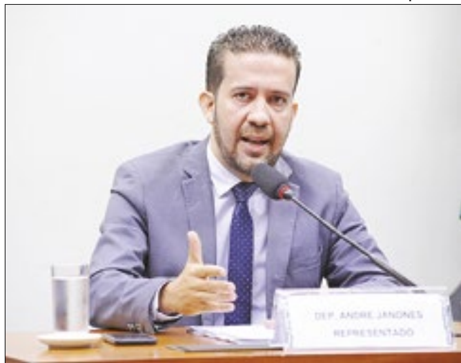
Janones chamou o ex-presidente de "bandido fujão".