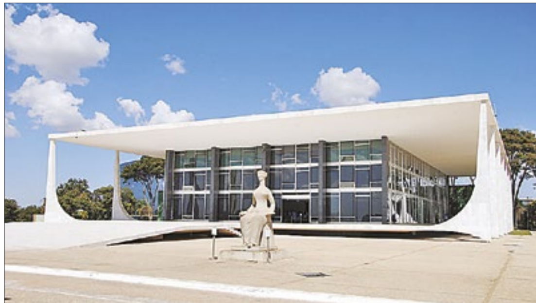
Decisão foi mantida pelo STF nesta quinta-feira (9), após 8 votos a 3

Por 8 votos a 3, o Supremo Tribunal Federal (STF) decidiu manter, nesta quinta-feira (9), os dispositivos da Lei das Estatais que restringem a indicação de políticos para cargos em conselhos e diretorias de empresas públicas.