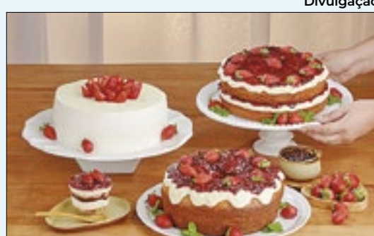
Entre cafés, almoços e mimos em forma de bolo e doce, confira o roteiro que o Correio preparou para você surpreender a mamãe neste domingo