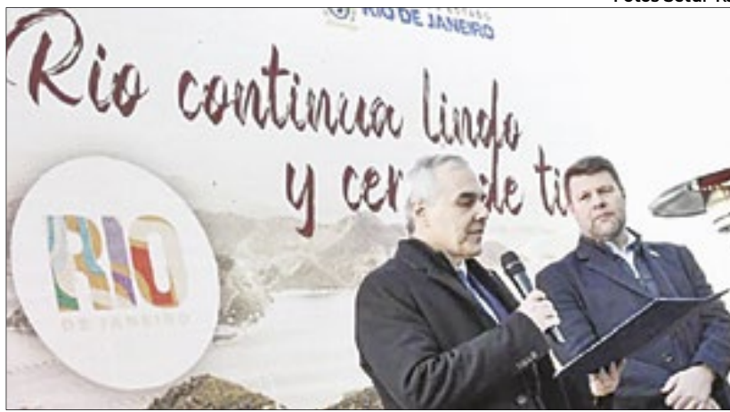
Em seu discurso, o embaixador do Brasil no Chile, Paulo Pacheco, destacou as belezas e potencialidades do estado do Rio

“O Chile é o segundo maior emissor de turistas ao Rio de Janeiro, atrás apenas da Argentina. Em 2023, recebemos 215 mil chilenos no Rio, o equivalente a 18% do fluxo total de turistas estrangeiros que estiveram aqui. É um número bom, mas com potencial imenso para crescimento. É justamente isso que estamos buscando com esse evento de promoção do Rio de Janeiro aqui