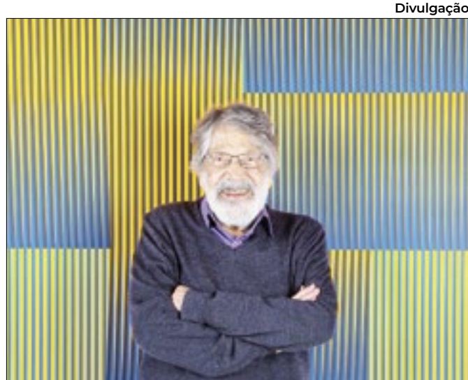
Carlos Cruz-Diez explora o universo cromático