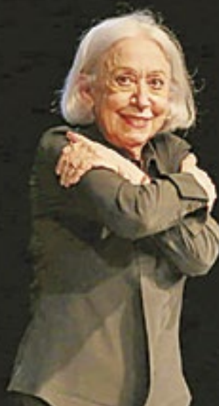
Fernanda Montenegro durante a leitura de 'A Cerimônia do Adeus'