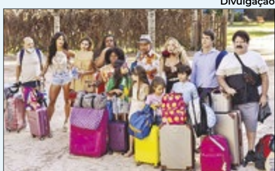
Em cartaz nos cinemas desde março, 'Os Farofeiros 2' tornou-se o maior fenômeno de bilheteria deste semestre, sendo assistido por quase 1,9 milhão de pessoas