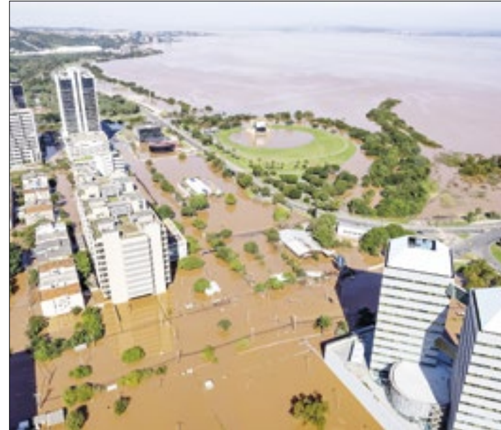
Estimativa inicial do governo estadual pode ser superior

Ainda de acordo com o governador, os cálculos, bem como as ações já delineadas para responder à situação de calamidade pública no estado serão detalhados ainda hoje (9). "Vamos detalhar as ações projetadas que contemplariam as nossas necessidades."