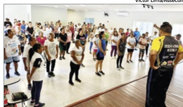
Prática melhora flexibilidade, equilíbrio e coordenação

O projeto, concebido no ano passado pelo Ministro Luis Felipe Salomão e implementado pelas Corregedorias dos Tribunais estaduais, visa reduzir o sub-registro civil, facilitar o acesso à documentação básica e reintegrar à cidadania milhões de brasileiros que permanecem “invisíveis” na sociedade por falta de certidão de nascimento. Por meio de colaborações com cartórios extrajudiciais e entidades públicas, o projeto facilita a obtenção da documentação, essencial para o exercício dos direitos de educação, saúde, previdência, assistência governamental, entre outros. O foco da campanha são as populações indígenas, pessoas em situação de rua, migrantes, refugiados e a população carcerária.