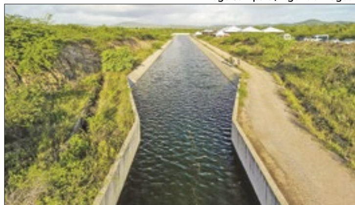
Ampliação visa beneficiar 240 mil habitantes de Alagoas