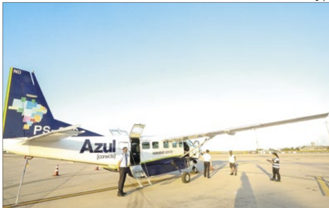
Programa 'Voa Maricá' inicia voos com destino a São Paulo

Na última segunda-feira (06/05) foi realizado o primeiro voo de Maricá com destino a São Paulo (Viracopos - Campinas), pelo programa Voa Maricá, que é um programa da Prefeitura de Maricá para as operações com avião da Azul Connect. A primeira decolagem foi realizada para transportar autoridades e convidados, mas a partir desta terça-feira (07/05), a população já estará utilizando o serviço.