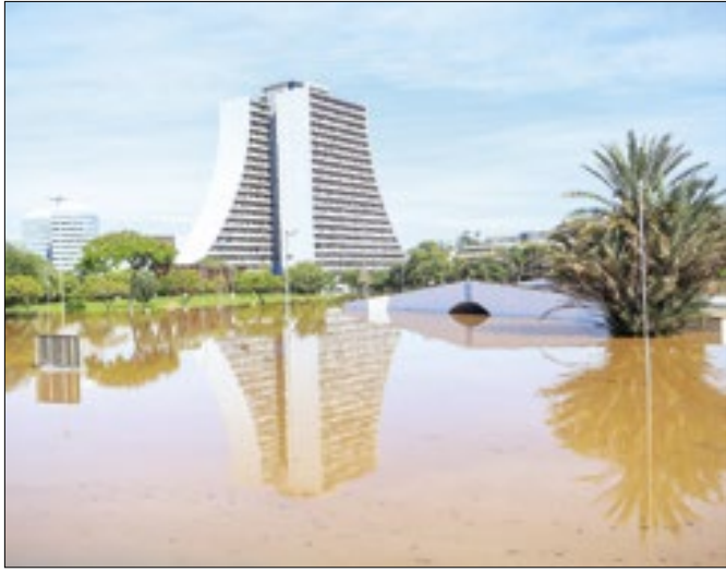
Folha de pagamento do TRE será processada em BSB