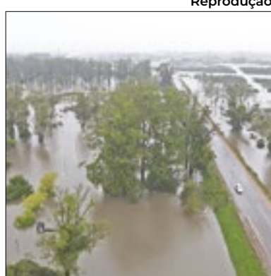
Mais de 1.300 desabrigados

Mais de 1.300 pessoas estão desabrigadas no Uruguai por causa de inundações causadas por tempestades na fronteira com o Brasil, relata a imprensa local. Três rodovias foram fechadas e a falta de energia elétrica afeta ao menos 3.200 moradias. No domingo (5), o Inumet (Instituto Uruguaio de Meteorologia) alertou para a chegada de tempestades fortes, com acúmulo entre 150 e 250 milímetros de água.