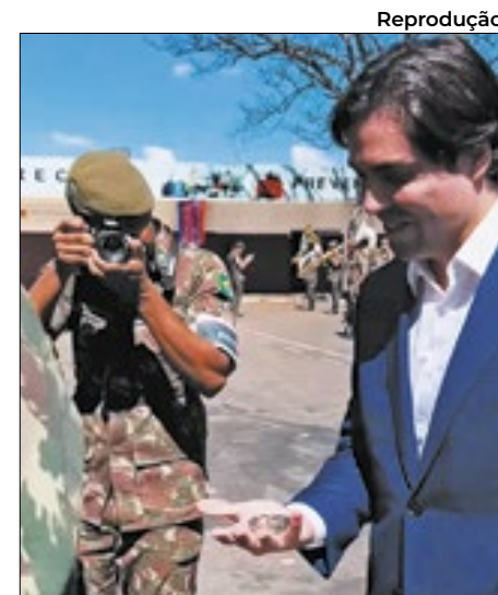
serviços prestados ao Batalhão e à Logística Militar Terrestre.