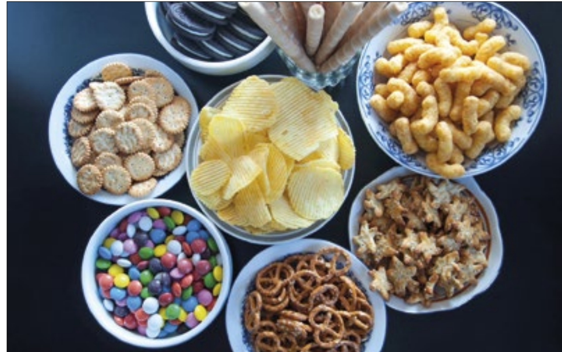
Conclusão foi feita por pesquisadores da USP

Os especialistas avaliaram os dados de quase 16 mil adultos que não tinham diagnóstico de depressão no início do estudo. Os voluntários informaram, por meio de questionários