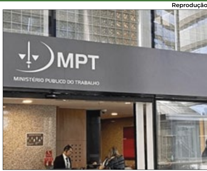
Iniciativa é do Ministério Público do Trabalho (MPT)