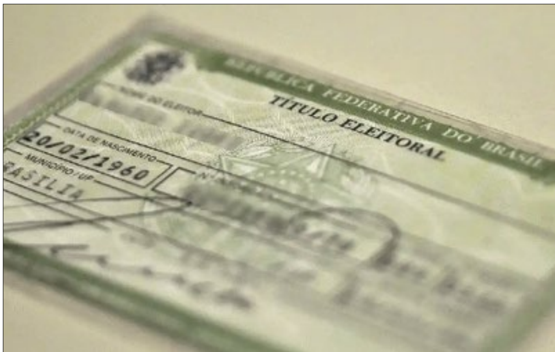
Para realizar a atualização cadastral, é necessário ter a biometria em dia