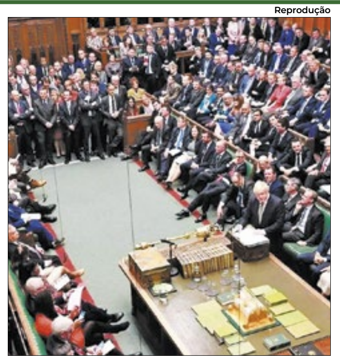
Onda populista deve chegar ao Reino Unido em breve