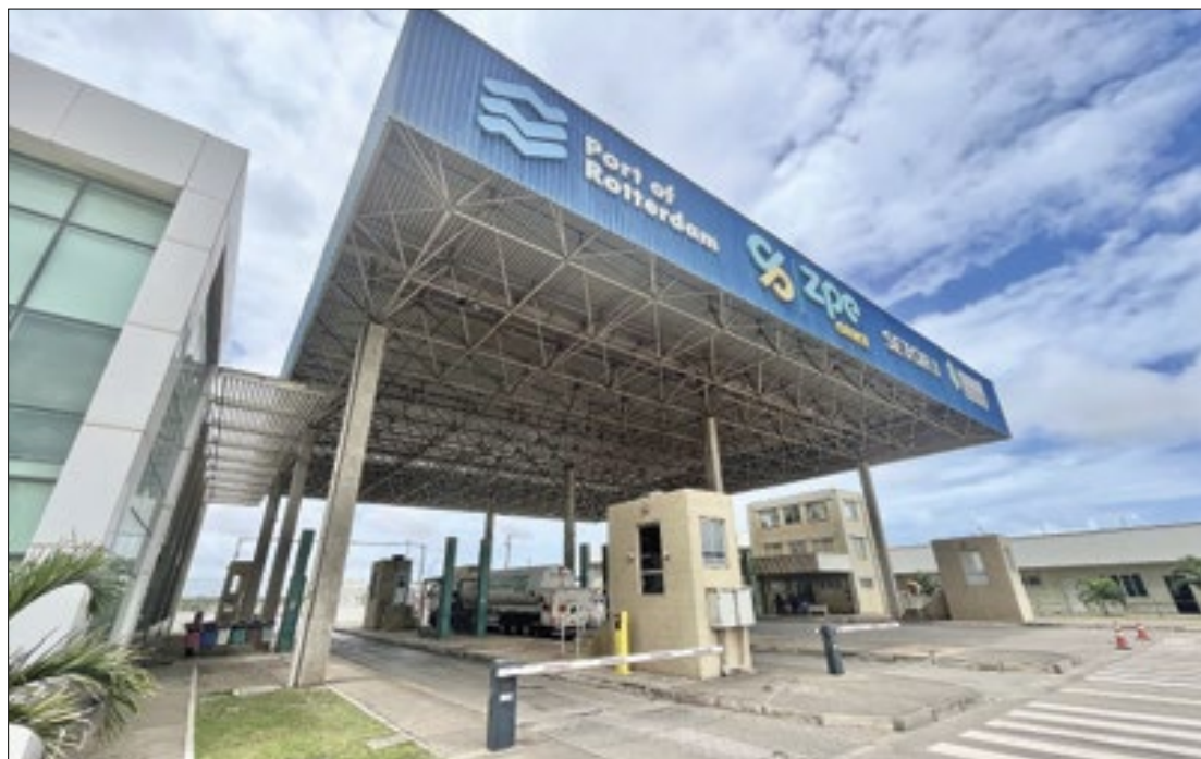
No primeiro trimestre de 2024, a ZPE CE movimentou cerca de 2.377.621 toneladas de cargas

“Alcançar essa marca histórica diz muito sobre o trabalho de excelência que é desempenhado por todos que fazem parte da ZPE Ceará. Temos um time comprometido com a segurança e celeridade de nossas