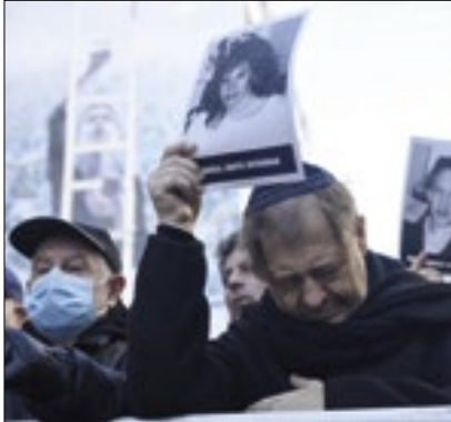
Associação Israelita é o alvo

Uma ameaça de bomba feita por telefone mobilizou efetivos da Polícia Federal e da Polícia Civil para o prédio da Amia, a Associação Mutual Israelita Argentina, em Buenos Aires, na segunda. A informação é do