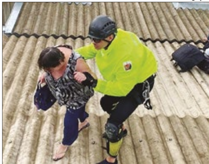
Polícia Militar de SC resgata 722 pessoas e 92 animais