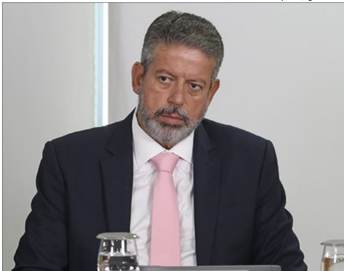
Arthur Lira convocou “sessão com efeito administrativo” durante análise de vetos

Para ajustar e negociar quais vetos devem ser incluídos na cédula de votação e quais devem