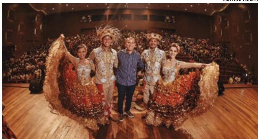
Evento contará com o concurso de 28 quadrilhas juninas