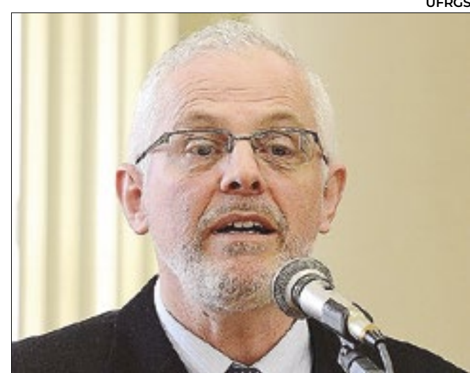
Para Menegat, é preciso recuperar matas