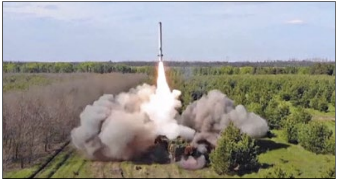
Militares russos mostram força em forma de ameaça

Ele também afirmou que os serviços de inteligência de Moscou estão apurando relatos de que a França já enviou soldados de sua Legião Estrangeira à Ucrânia. Combatem pelo país vizinho mercenários de diversas nações, inclusive o Brasil, mas não há até aqui nenhum envio oficial de tropas