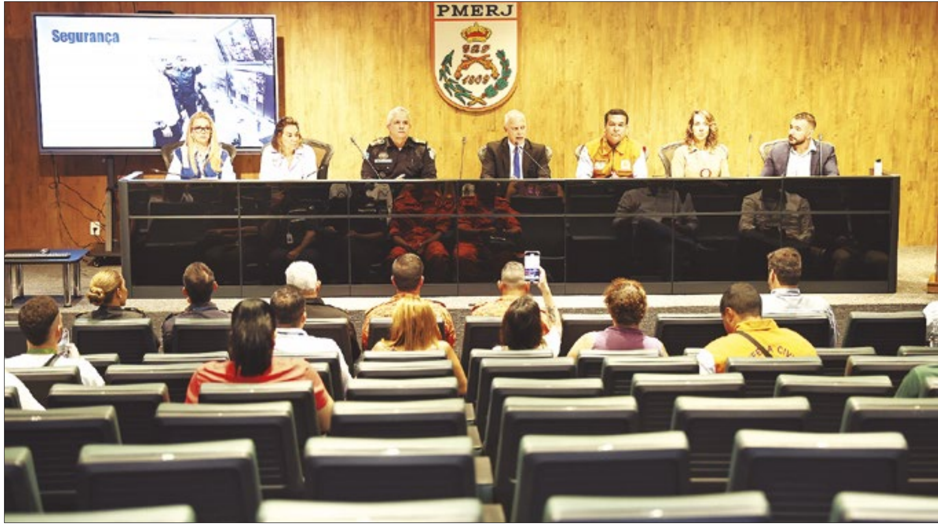
Cúpula da segurança pública do Rio, junto com as secretarias de Saúde, Mulher e Cedae, divulgaram o balanço das ações para o show

Entre as ações de tecnologia utilizadas está o Centro Integrado de Comando e Controle Móvel, que foi instalado na Praça do Lido. O caminhão de comando possibilitou o auxílio imediato às equipes de agentes espalhadas pela orla para combater possíveis ações criminosas. Com investimento de R$ 8,6 milhões, o carro possui 30 câmeras vinculadas a um avançado sistema de reconhecimento facial e drones que sobrevoaram a orla, com imagens a longo alcance com câmeras de