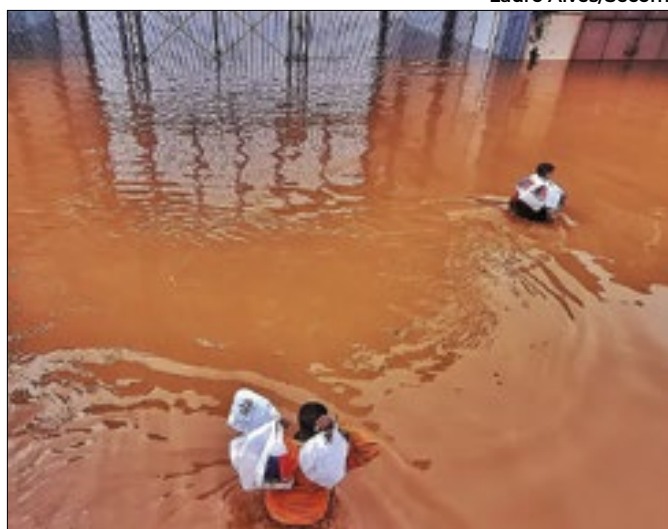
Pátio Brasil recebe cobertores e doações em dinheiro