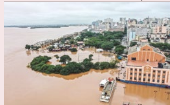
Água do Guaíba inundou a capital gaúcha