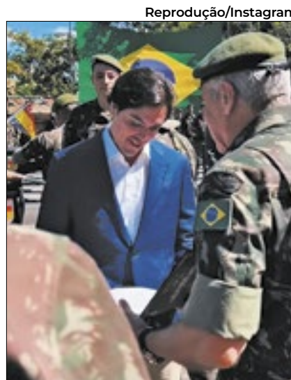
Logístico na cerimônia de entrega da Medalha do Mérito Batalhão Tenente-General Nacion, em reconhecimento aos relevantes