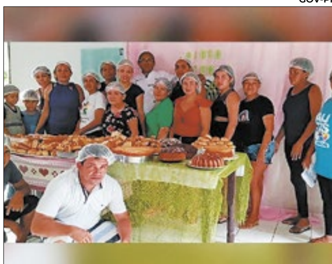
Seduc investe em educação para reduzir evasão escolar