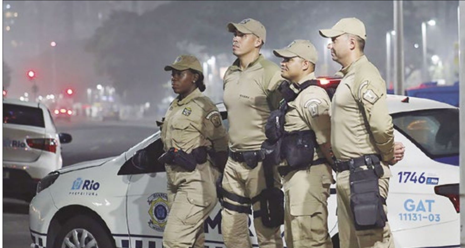
Equipes aplicaram 366 multas de trânsito e removeram 156 veículos estacionados irregularmente

As equipes também aplicaram 366 multas de trânsito e removeram 156 veículos estacionados irregularmente. Nas fiscalizações de táxis e veículos de aplicativos, um foi