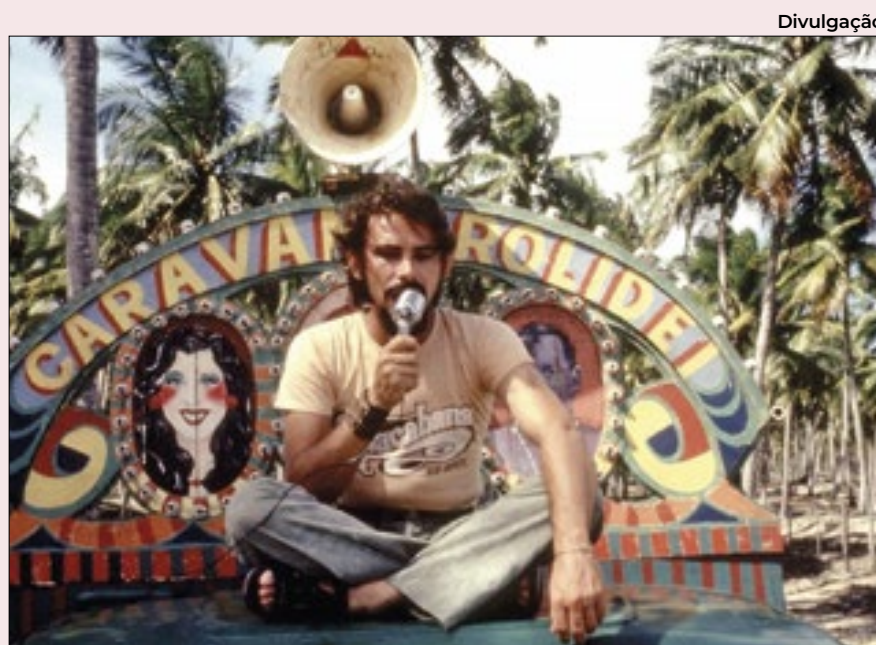
José Wilker vive Lorde Cigano em 'Bye Bye Brasil', um clássico nacional