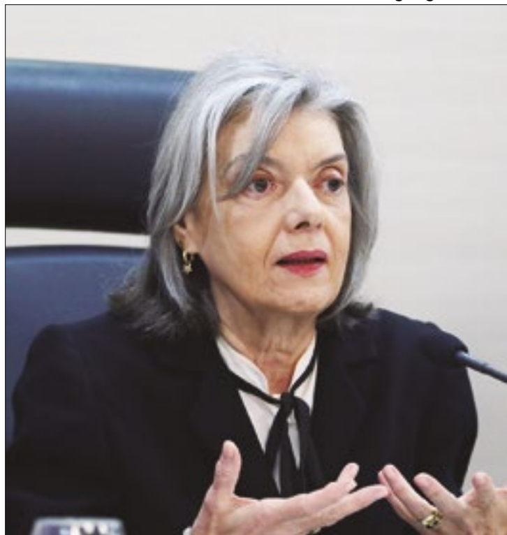
Carmén Lúcia já presidiu o TSE em 2012

Como presidente do TSE, Alexandre de Moraes teve uma gestão marcada com uma eleição polarizada, ameaça de golpe de estado no país, a ine-