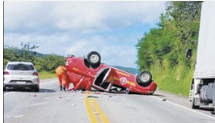
A equipe é especialista em situações de catástrofes