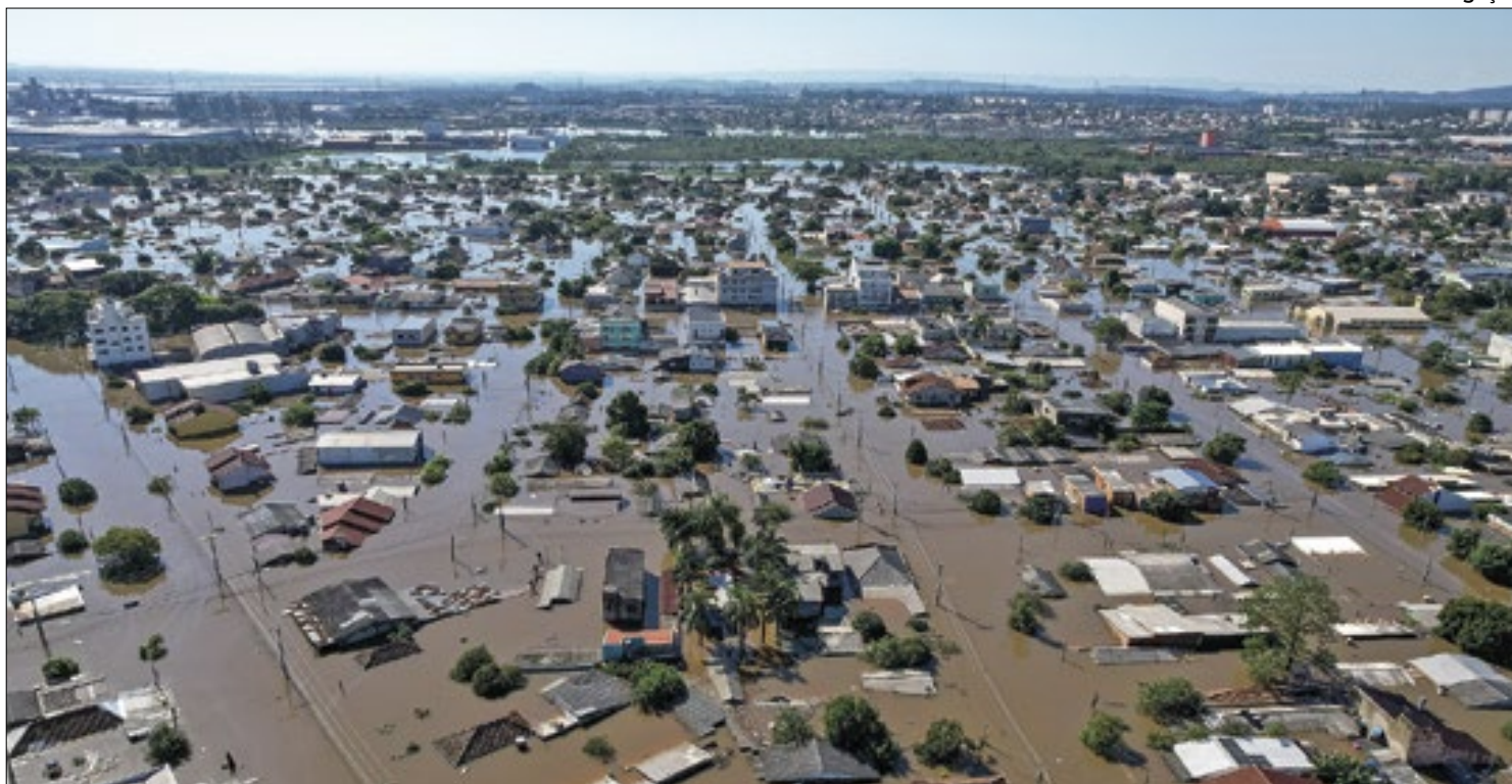
85 mortes, mais de 201 mil pessoas fora de casa, feridos somam 339 e há 134 desaparecidos no estado

Pesquisadores do LABBEP da UEL vão desenvolver um projeto para estudar bactérias super-resistentes a antibióticos em criatórios e hospitais veterinários. O investimento para o projeto, de R$ 1,3 milhão, é resultado da aprovação do edital 52/2022 do CNPq.