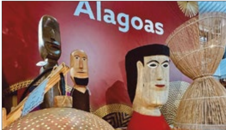
DF vai receber 500 artistas de 23 estados durante evento