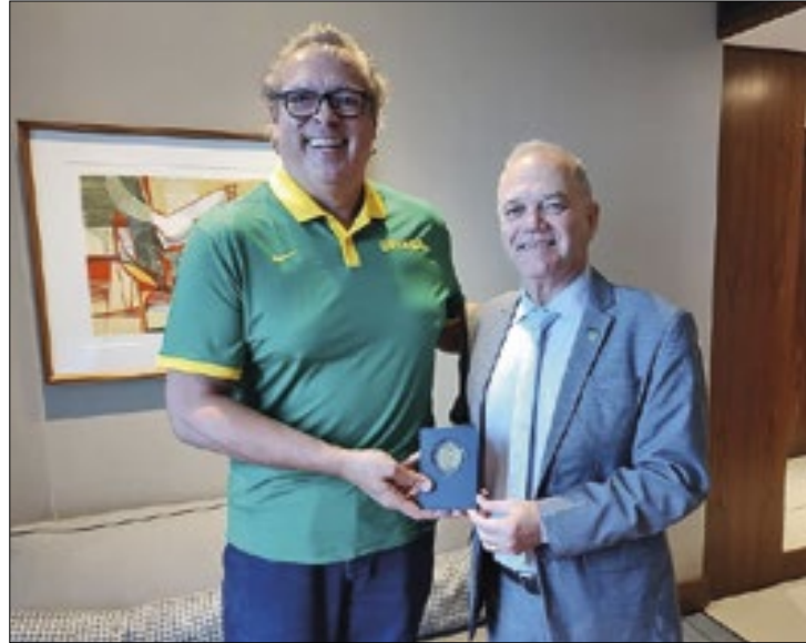
Na figura de Guy Peixoto Jr, CBB está em conflito com a LNB

Os principais clubes se fecharam em torno da LNB e a CBB restou organizar uma competição de segunda linha, com apenas nove equipes. Foi neste contexto que o