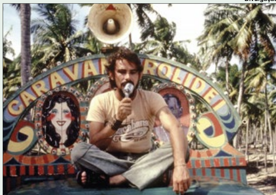
José Wilker vive Lorde Cigano em 'Bye Bye Brasil', um clássico nacional