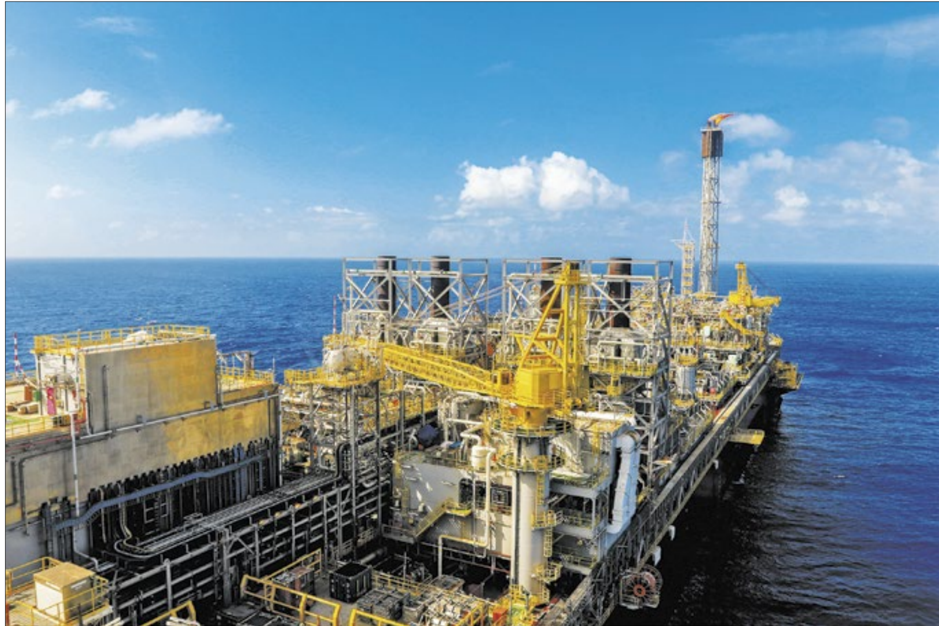
Vista aérea do navio-plataforma P-71, instalado no campo de Itapu, no pré-sal da Bacia de Santos