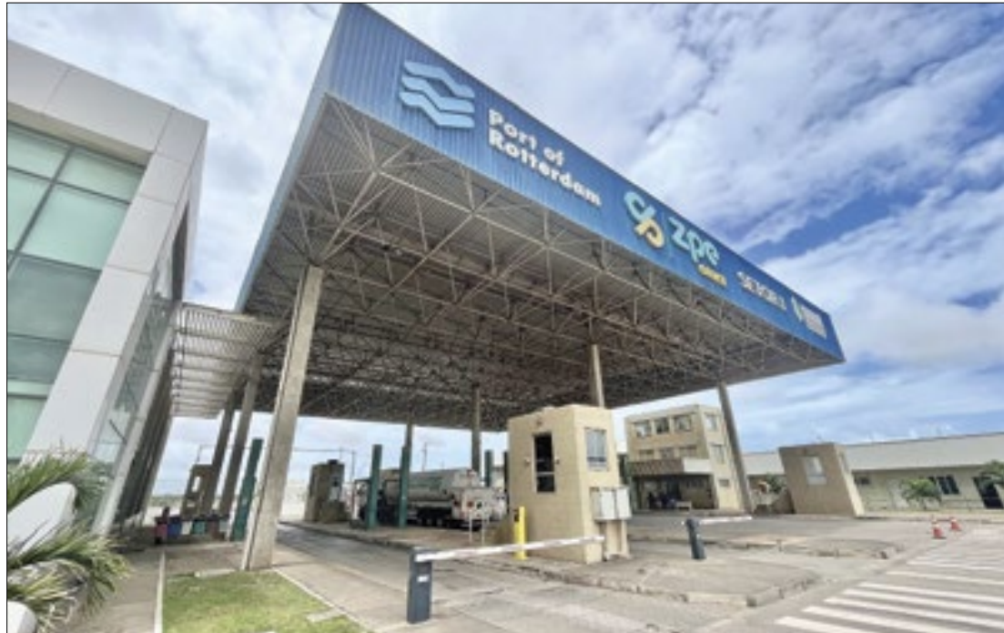
No primeiro trimestre de 2024, a ZPE CE movimentou cerca de 2.377.621 toneladas de cargas

“Alcançar essa marca histórica diz muito sobre o trabalho de excelência que é desempenhado por todos que fazem parte da ZPE Ceará. Temos um time comprometido com a segurança e celeridade de nossas