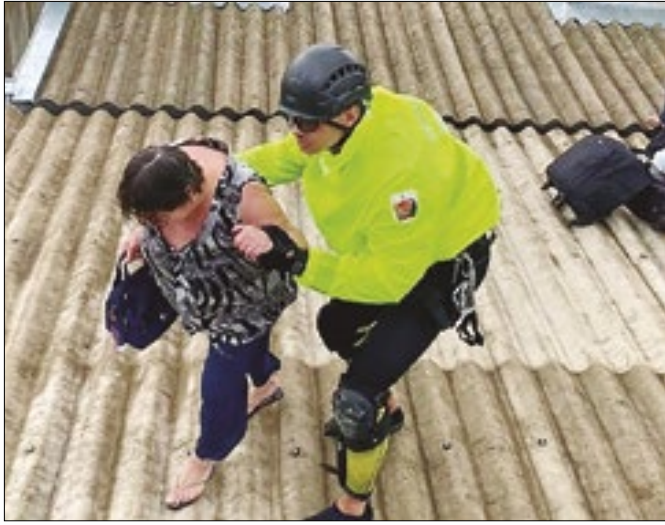
Polícia Militar de SC resgata 722 pessoas e 92 animais