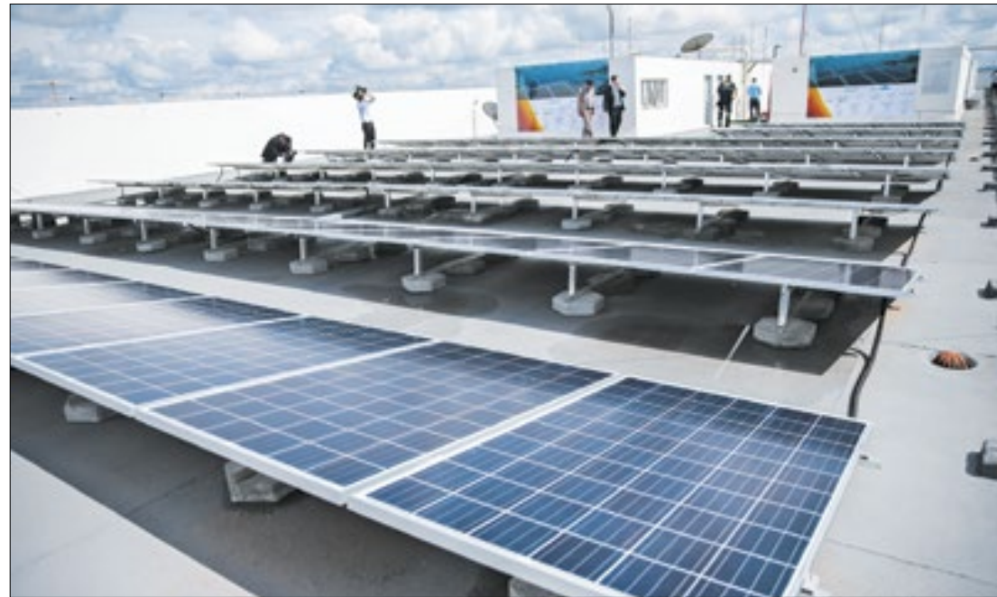
A análise foi feita pela Agência Internacional de Energia (AIE)

O estudo desconsidera, portanto, os custos de capital da