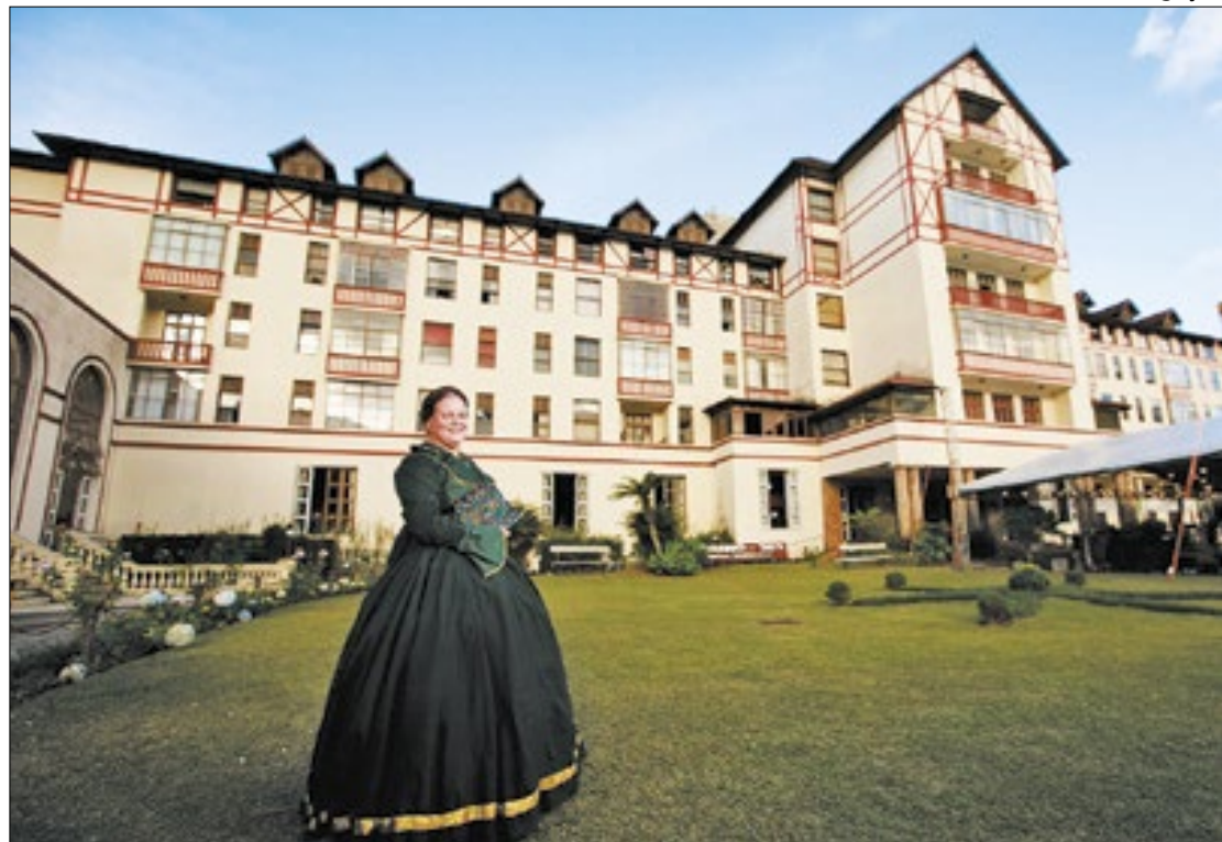
Festival Di Teresa começa nesta quinta-feira, dia 09, na cidade de Teresópolis

Em Teresópolis, o poder público municipal acredita e investe nesta estratégia. Tanto que desta quinta, 09, até domingo, 12 de