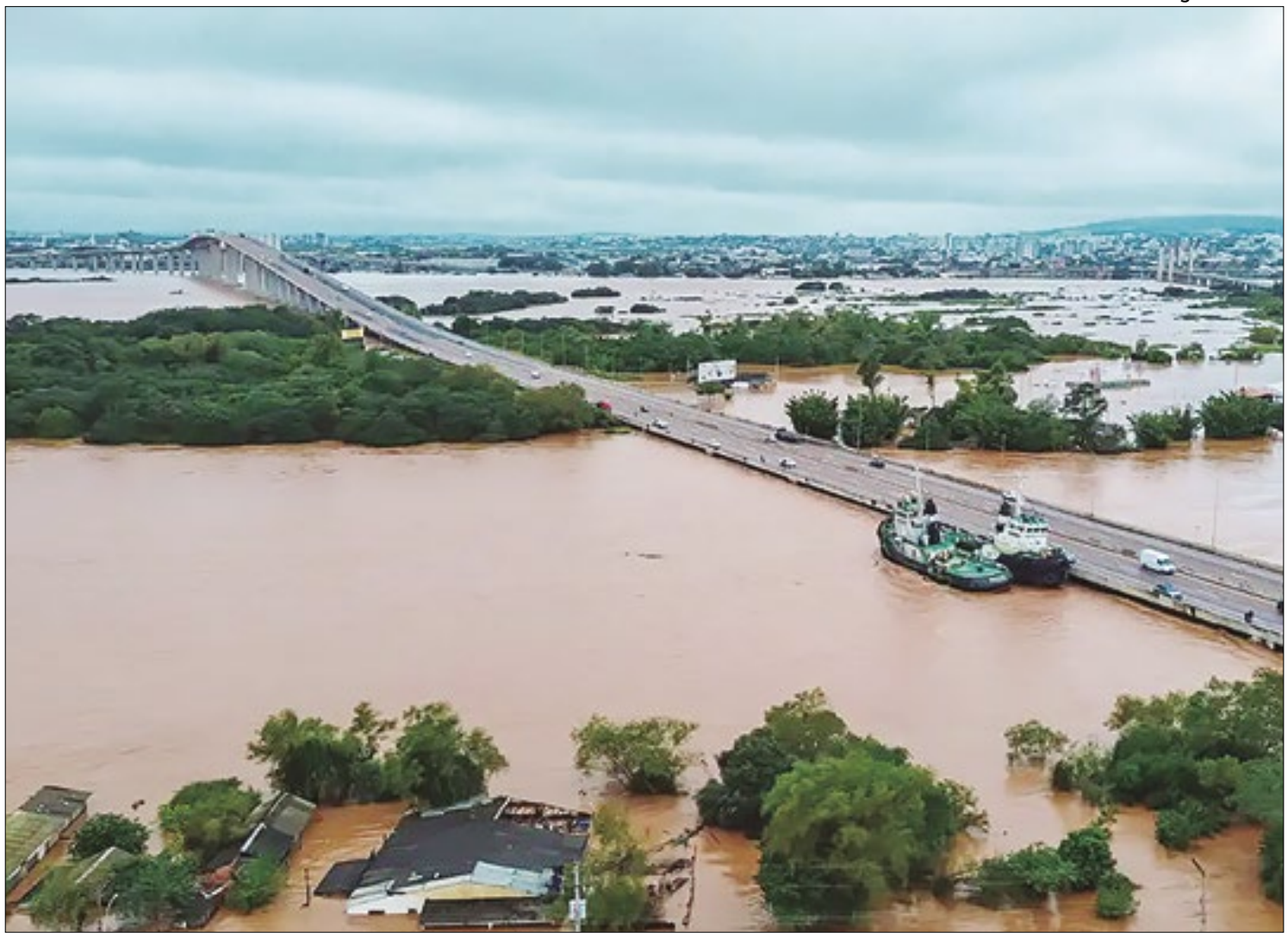
Segundo a Defesa Civil, cidades estão debaixo d'água após chuvas; Governo Federal decreta estado de emergência

menor de 18 anos, deverá ter em mãos a cópia do RG e CPF do responsável legal. O curso Operador de Computador vai acontecer no período noturno, das 18h às 22 horas, no Polo Senai, em Resende (RJ).