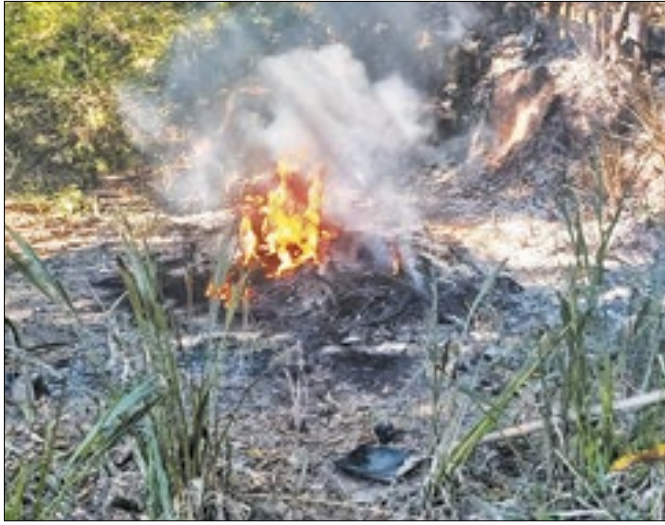
Homem foi detido na ação e encaminhado para BO