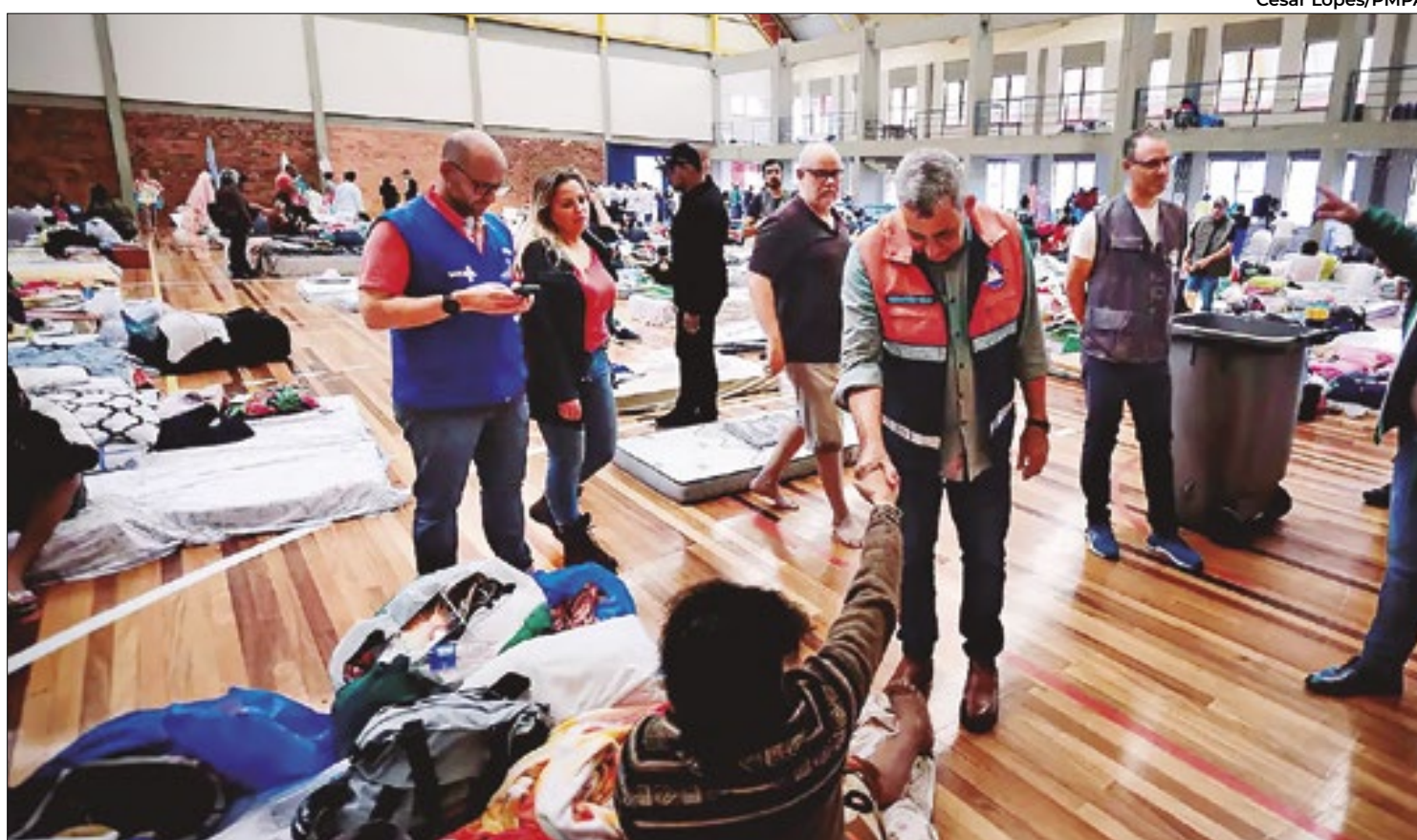
Somente na capital gaúcha, mais de 9 mil pessoas estão em abrigos

Porto Alegre esvazia bairros após falha em sistema de escoamento