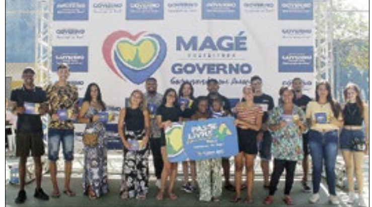
Ao todo, 200 estudantes receberam o benefício

"A gente sabe das dificuldades que os estudantes enfrentam com o traslado. Além disso, o impacto é muito significativo na vida dos jovens e, consequentemente, no desenvolvimento da cidade", afirmou.