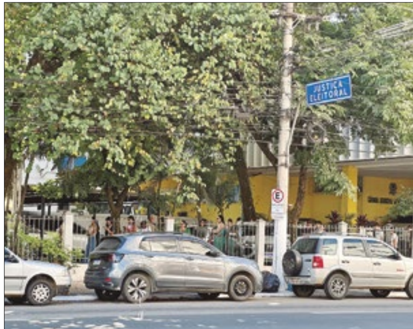
Eleitores enfrentam fila no Cartório de Volta Redonda

A reta final para regularizar a situação do título eleitoral movimentou os cartórios de Volta Redonda e de Barra Mansa, nesta segunda-feira, dia 06, assim como em outros municípios da região do Médio Paraíba. A data-limite para pedir diversos serviços eleitorais termina nesta quarta-feira, dia 08, e como já é praticamente um costume, inúmeros eleitores deixaram a atualização para a última hora.