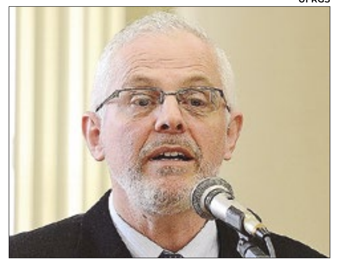
Para Menegat, é preciso recuperar matas