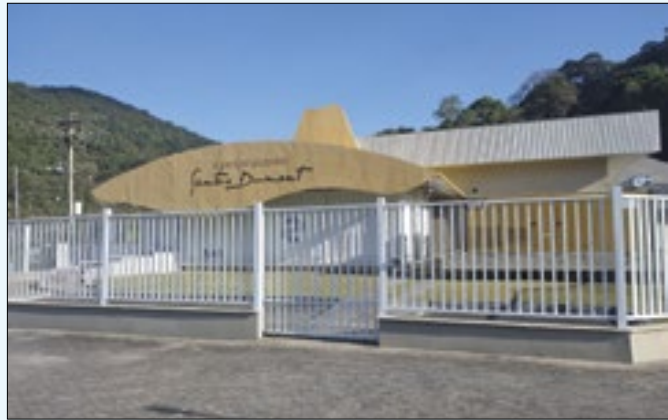
Supercomputador Santos Dumont no LNCC