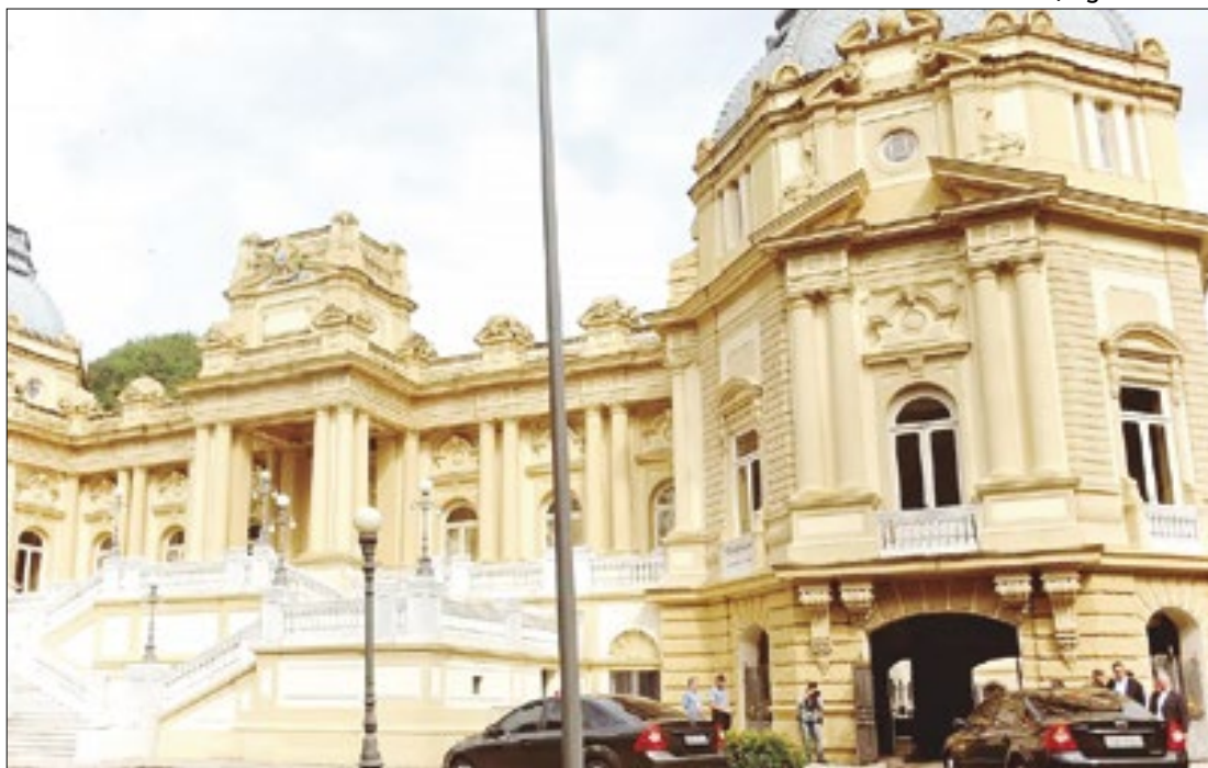
Dias Toffoli concedeu liminar em favor do Rio na ação impetrada por Cláudio Castro

ram substituídas no município, o que representa 54% dos mais de 66 mil pontos planejados. Além do Ilumina São Gonçalo, obras de infraestrutura que estão sendo realizadas pela Secretaria de Desenvolvimento Urbano no Pacheco e no Sacramento.