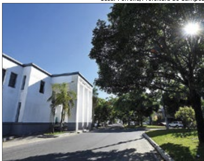
Medida visa substituir convocados desistentes ou inaptos