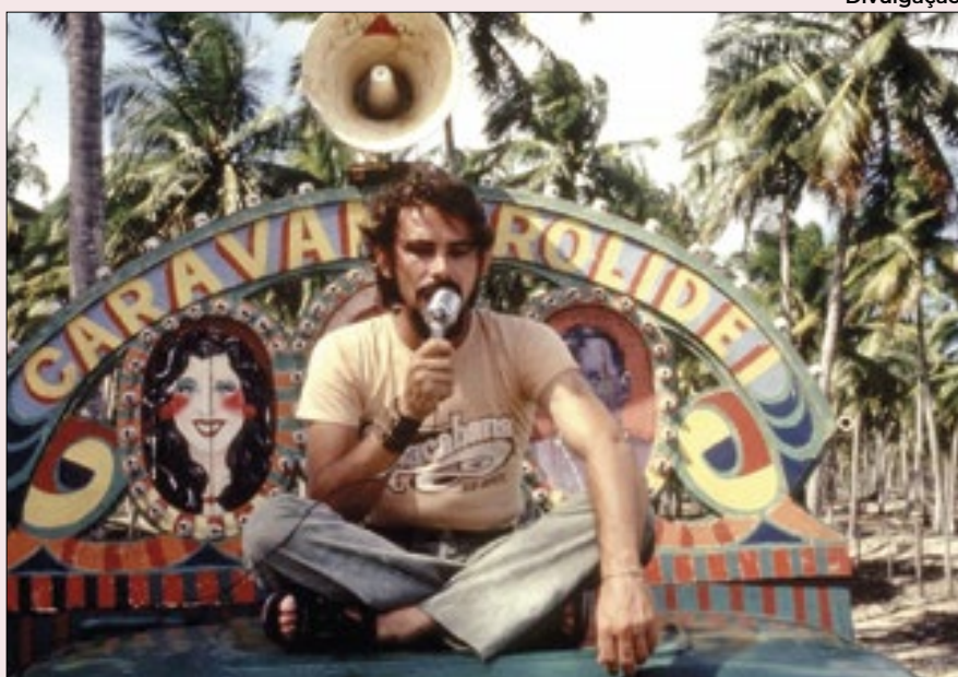
José Wilker vive Lorde Cigano em 'Bye Bye Brasil', um clássico nacional