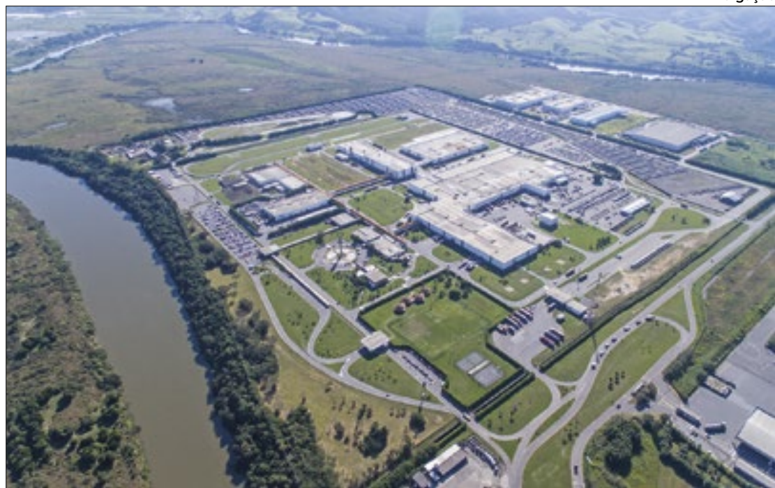
Fábrica da Volks Caminhões e Ônibus em Resende coloca novos projetos em prática

Já a japonesa Nissan anunciou que ampliará seu plano de