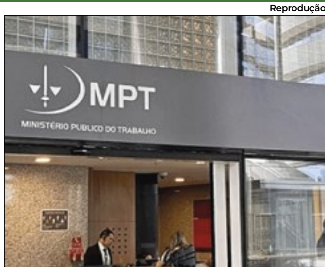
Iniciativa é do Ministério Público do Trabalho (MPT)