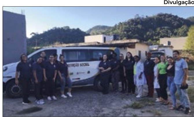
Secretaria de Assistência Social e Direitos Humanos