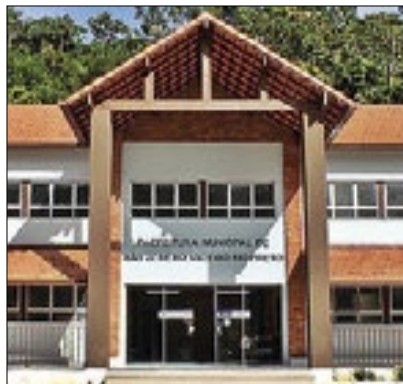
Ascom/ São José

A Secretaria de Família, Ação Social, Cidadania e Habitação de São José, anunciou que os beneficiários do Aluguel Social devem comparecer entre os dias 09 e 31 de maio das 9h30 às 15h, na sede, para realizarem a atualização de seus dados. Para efetuar a ação é necessário portar documentos de identificação, laudo de Interdição do imóvel atingido entre outros. O não comparecimento no período mencionado acarretará em suspensão do benefício.