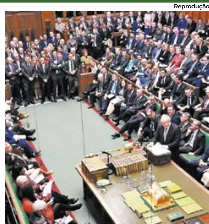
Onda populista deve chegar ao Reino Unido em breve