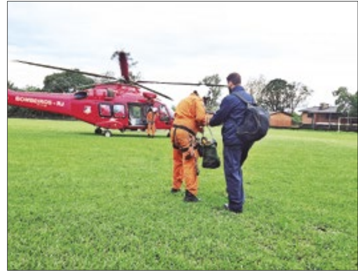
Bombeiros e policiais civis dão cobertura em resgates no Sul

O programa tem como embasamento a Portaria do Ministério da Educação (MEC) nº 1.495, de 02 de agosto de 2023, que dispõe sobre a adesão e a pactuação de metas para a ampliação de matrículas em tempo integral no âmbito do Programa Escola em Tempo Integral.