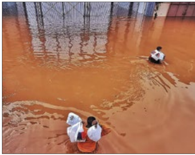
Pátio Brasil recebe cobertores e doações em dinheiro