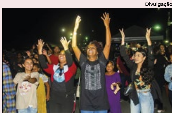
O público aproveitou os shows no Paço Municipal