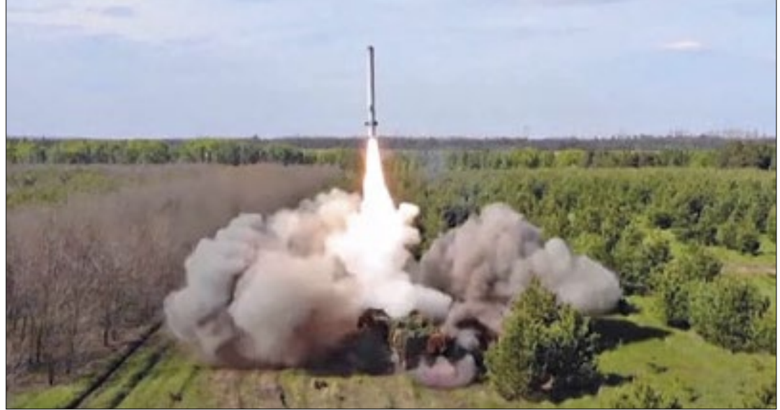
Militares russos mostram força em forma de ameaça

Ele também afirmou que os serviços de inteligência de Moscou estão apurando relatos de que a França já enviou soldados de sua Legião Estrangeira à Ucrânia. Combatem pelo país vizinho mercenários de diversas nações, inclusive o Brasil, mas não há até aqui nenhum envio oficial de tropas