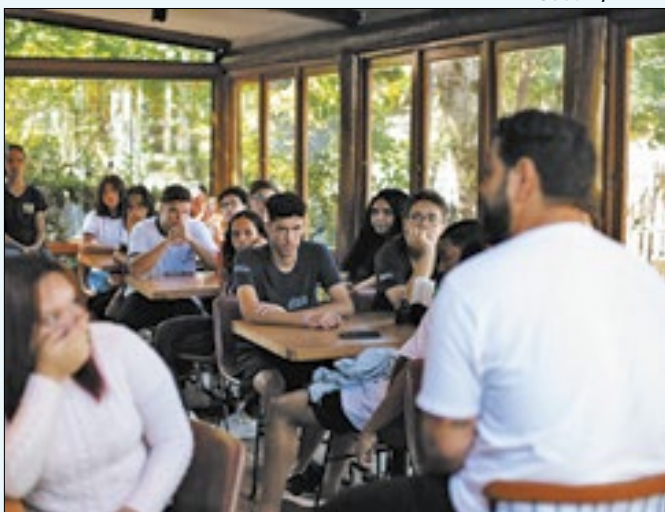
Jovens já participaram das primeiras oficinas