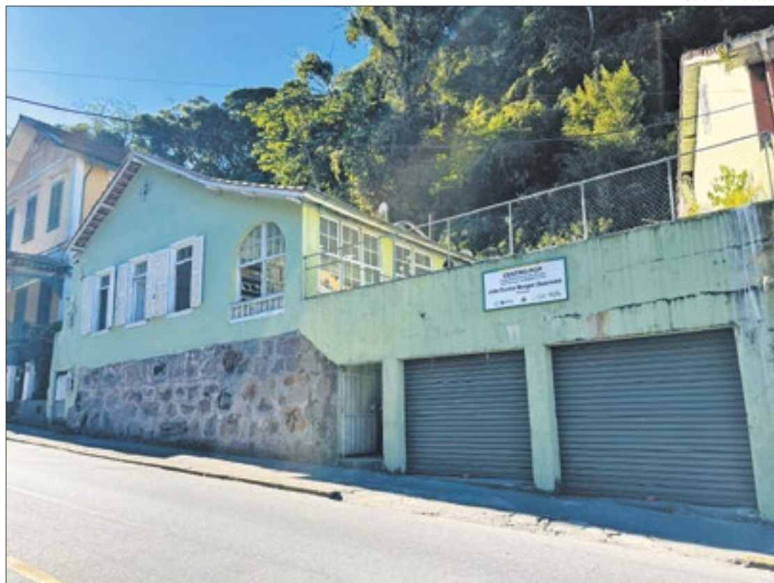
O MPRJ sugere que seja utilizados recursos do Fundo de Assistência Social em novo imóvel

Os resultados técnicos, constataram que imóvel não possui