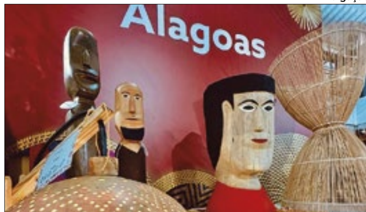
DF vai receber 500 artistas de 23 estados durante evento