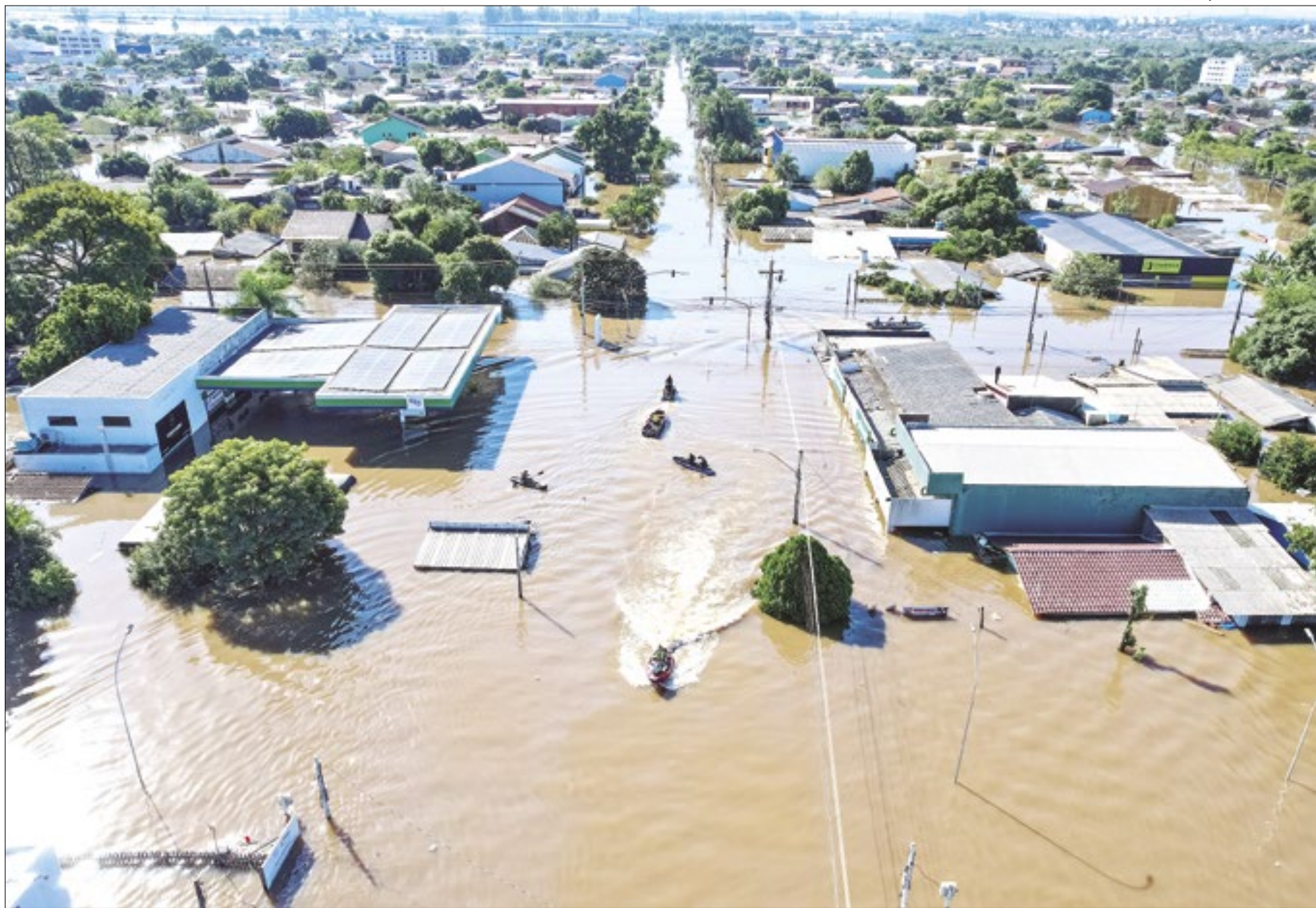
Situação do bairro Mathias Velho, em Canoas. Equipes do Corpo de Bombeiros durante ação de resgate no local