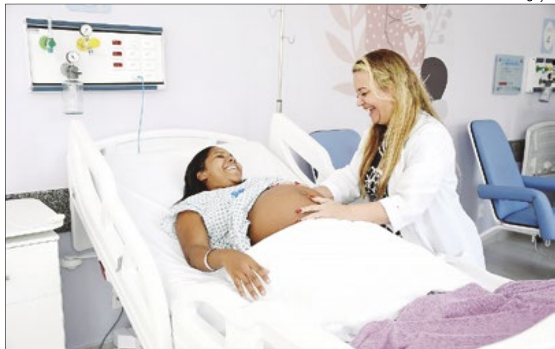
Hospital Iguassú Maternidade Mariana Bulhões completou 1 mês de atendimentos

Uma das prioridades estabelecidas pela Secretaria Mu-