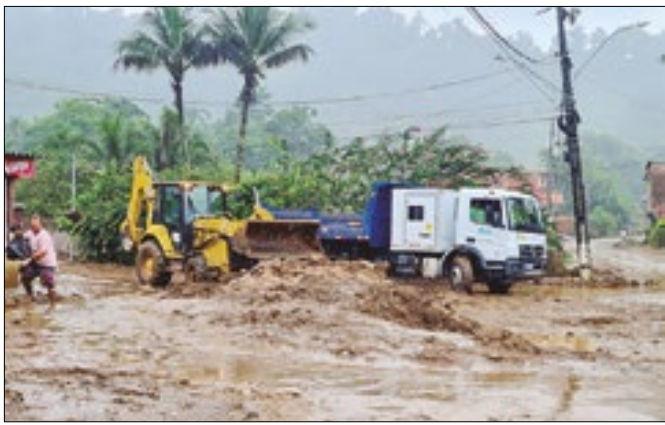
Fortes chuvas devastaram o Bracuí em 2023