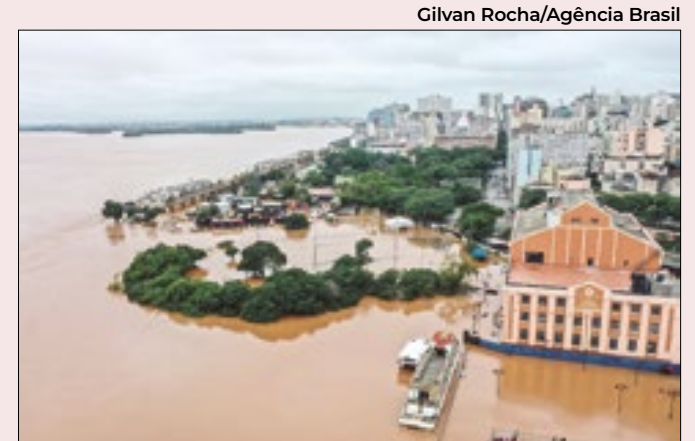
Água do Guaíba inundou a capital gaúcha

Para ele, margens do lago Guaíba, que banha Porto Alegre, deveriam passar por recuperação ambiental, com a criação de corredores ecológicos; a construção de prédios no local teria que ser interrompida. “Nossa água vem do Guaíba, que precisa ser cuidado”, diz.