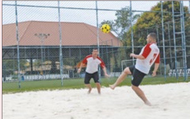
Inscrições abertas para os Jogos Firjan SESI do Trabalho