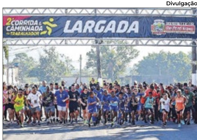
Evento contou com a presença de cerca de 150 pessoas