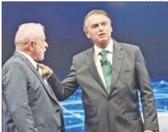
Como fica polarização Lula/Bolsonaro?