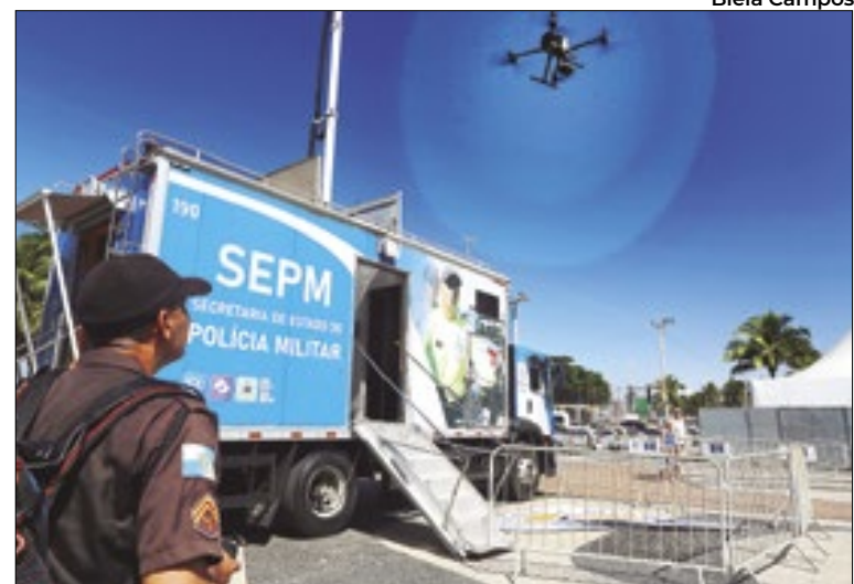
Mais de 5 mil policiais militares e civis estarão no evento