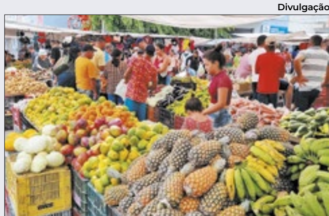
Alta de indicadores econômicos cedeu à estabilidade

Para analistas, a queda de comercialização do setor de máquinas só não é maior, pelo fato de usinas de cana e os produtores de algodão, citros e frutas apresentarem hoje uma situação considerada 'mais confortável' para investimentos em seu maquinário.