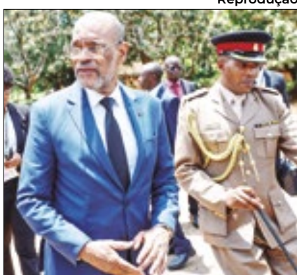
Nova gestão no Haiti

Merchan anunciou a sua decisão a Trump na abertura de uma nova audiência do julgamento, em Nova York. Segundo o juiz, o magnata violou a ordem de não insultar testemunhas, jurados ou membros do tribunal.