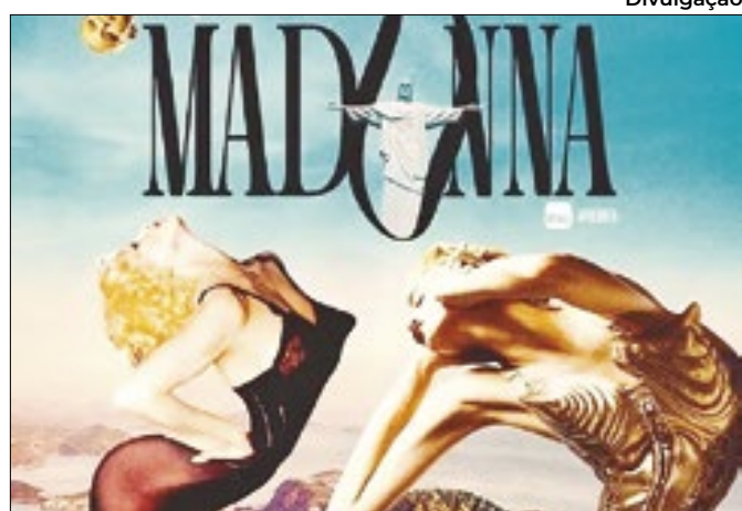
Show encerrará a turnê mundial da Rainha do Pop