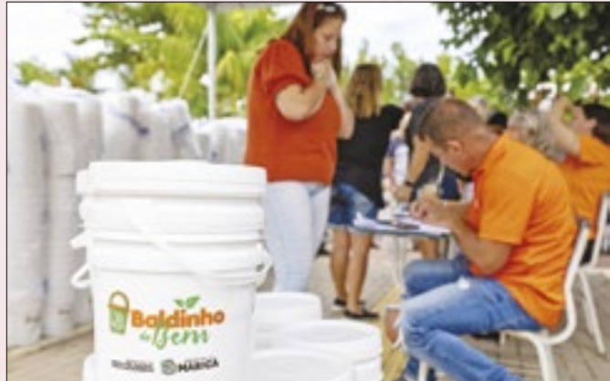
Dois projetos do município foram classificados