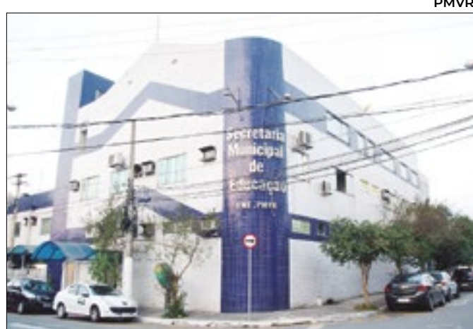
Prefeitura de Volta Redonda terá processo seletivo