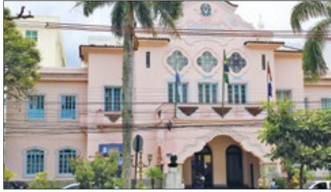
Evento reconhece dedicação das mulheres rurais