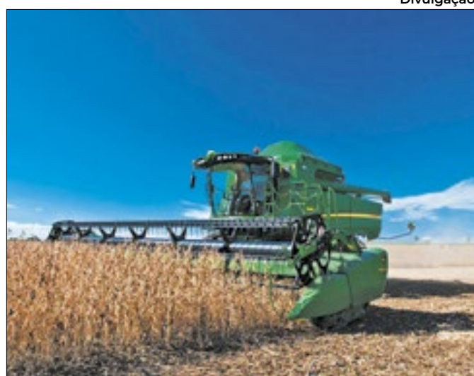
Preço elevado de colheitadeira não assusta investidor