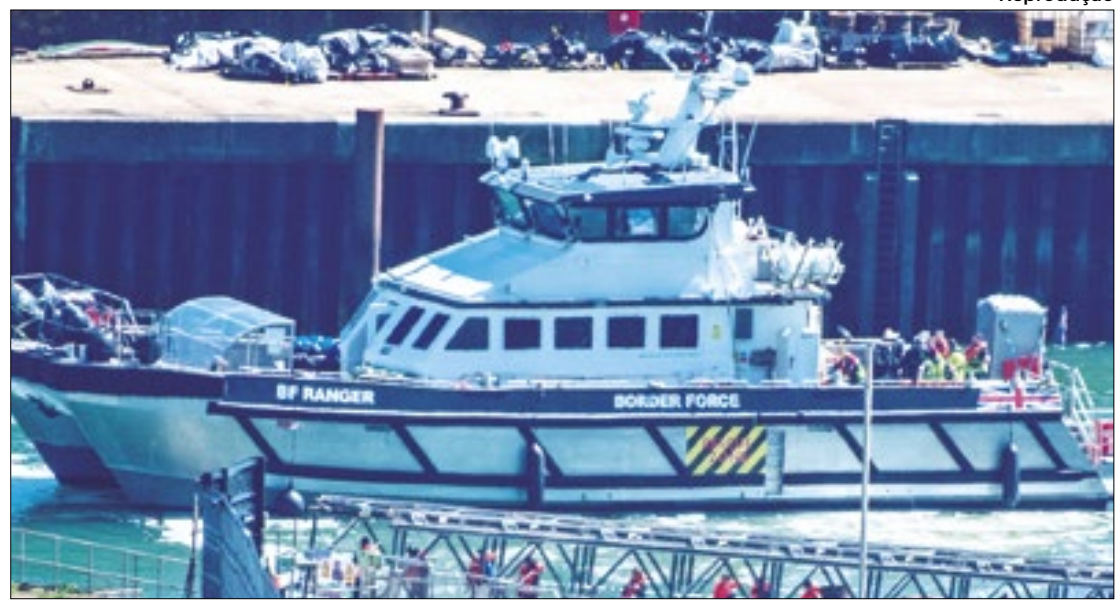
Deportações devem começar no Reino Unido antes de julho

No meio da disputa, os militares que conduziam outro