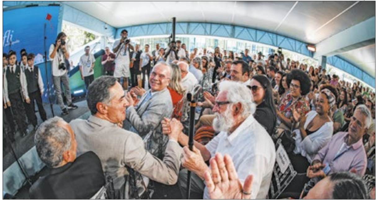
Luís Roberto Barroso cumprimenta o filósofo Leonardo Boff na abertura do Flipetrópolis