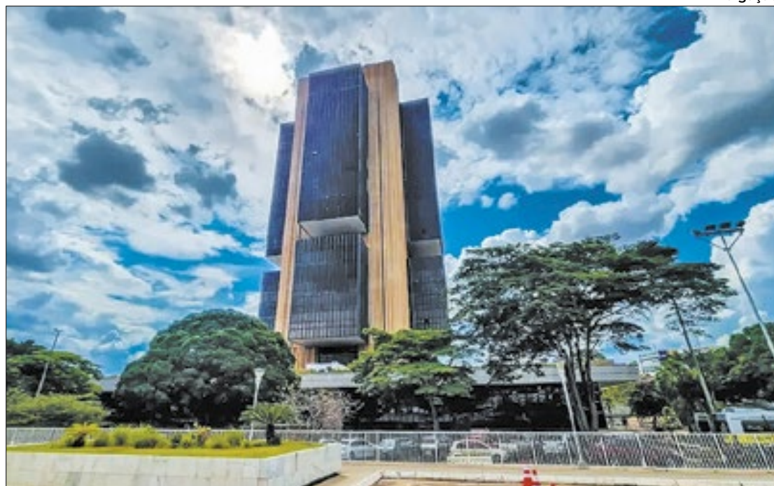
Conjunto de incertezas (internas e externas) reforça menor ímpeto de cortes pelo BC

do mercado, ao repercutirem dados do Cadastro Geral de Empregados e Desempregados (Caged) do Ministério do Trabalho, que dão conta de um saldo positivo de 244.315 vagas formais (carteira assinada) em março último, o que pressupõe um mercado de trabalho 'aquecido', melhor resultado para o mês, desde que iniciou a série