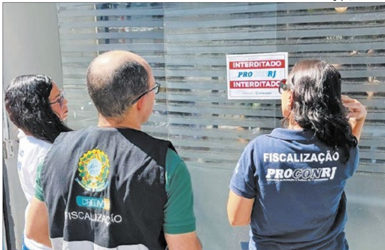
Procon-RJ interdita clínica e hospital veterinários durante operação de fiscalização

Estão abertas as inscrições para a 8ª Feira Eco-Ostras. A ação visa valorizar a pesquisa e o desenvolvimento do pensamento científico nas escolas. As unidades escolares têm até o dia 30 de maio para cadastrar os trabalhos na iniciativa. A previsão é de que o evento seja realizado em julho.