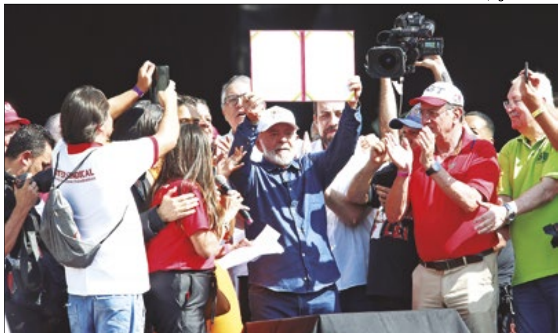
Em ato no dia do trabalhador, presidente Lula sanciona isenção do imposto

"Fizemos alianças políticas para governar e, até hoje, todos