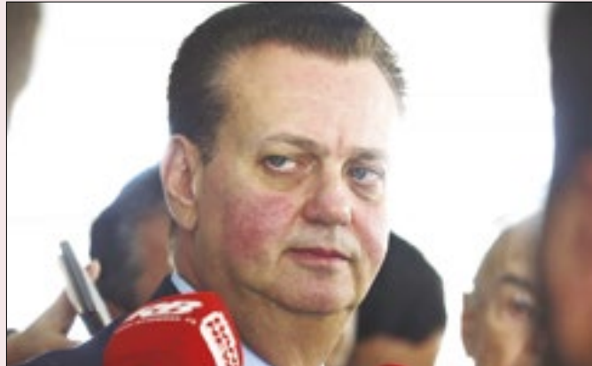
Kassab pode ser peça fundamental do futuro político