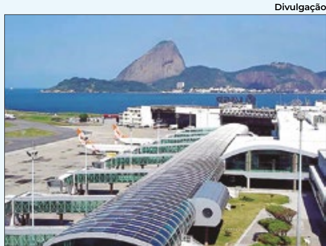
Agentes vão orientar turistas no Santos Dumont e Galeão

“Esse coro massivo irá ecoar pelo local da apresentação, demonstrando a nossa paixão pela Rainha do Pop. Será um momento poderoso e emocionante que certamente tocará o coração de Madonna”, finaliza a publicação.