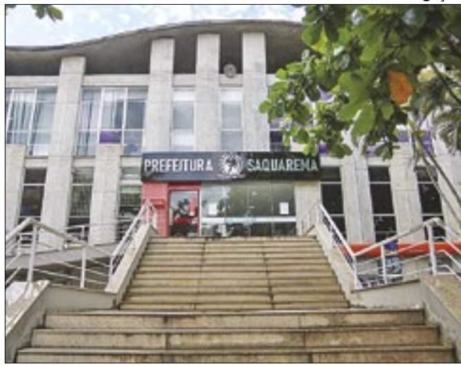
Saquarema acumula a geração de 2.067 empregos