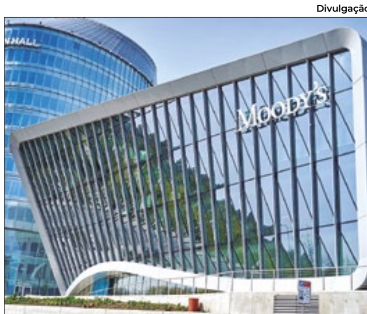
Divulgação Melhoria de nota de crédito do país é a 1ª desde 2018

Em relatório, a agência diz avaliar que as possibilidades para o crescimento real do PIB (Produto Interno Bruto) do Brasil são mais robustas do que antes da pandemia de Covid-19, citando as reformas estruturais que foram colocadas em prática de lá para cá nos últimos governos, o que reduz as incertezas em relação à direção futura das políticas públicas do país.