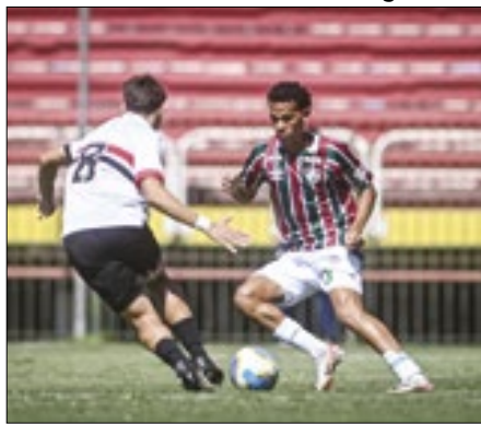
Flu vence o São Paulo no Raulino