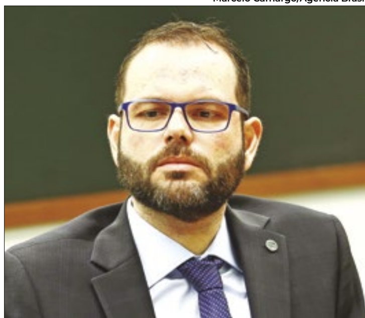
Senador Jorge Seif pode ter o mandato cassado.

Os partidos também apontam o suposto financiamento irregular da campanha por meio da participação do senador em uma feira promovida pelo Sindi-