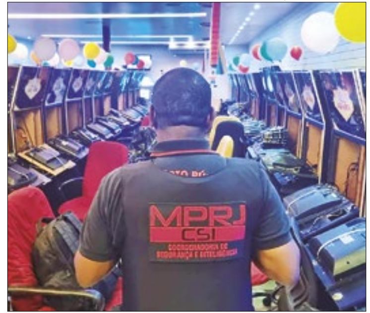
Policiais cumpriram mandados em 14 endereços