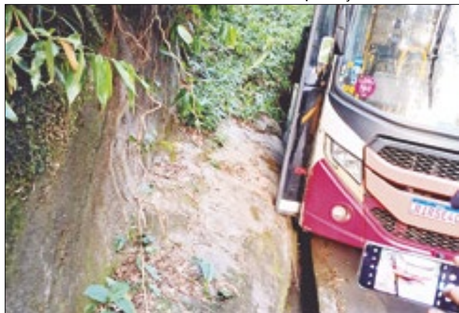
Ônibus da Petro Ita se envolve em acidente