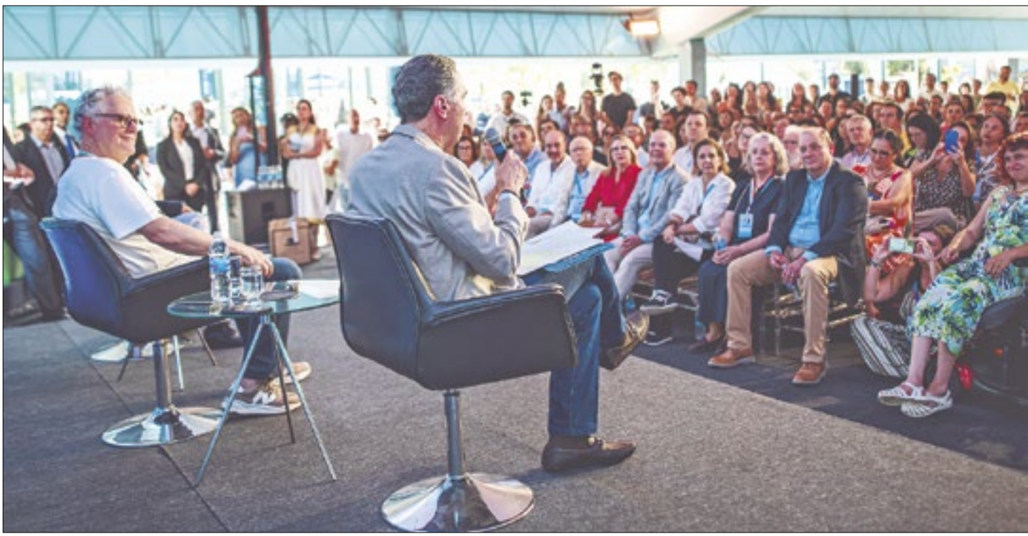
Primeira mesa do Flipetrópolis com o ministro Barroso, Sérgio Abranches e o desembargador Guilherme Grandinetti

Petrópolis para o Cis-Serra possibilitará a melhoria da atuação em cada local de abrangência, já que cada município apresenta suas necessidades e particularidades. O Cis-Serra desempenha um papel de grande importância para a Região Serrana e tem como objetivo o fortalecimento dos serviços de saúde atuando em conjunto para sanar necessidades e promover um maior acesso da população na rede pública de saúde", disse.