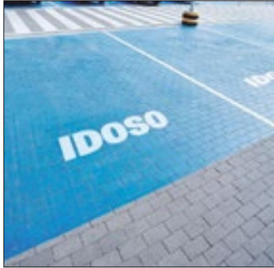
Acesso é através do aplicativo

A Prefeitura de Três Rios, através da Secretaria de Transporte e Mobilidade, disponibiliza, por meio do aplicativo "Carteira Digital", a possibilidade de idosos com mais de 60 anos e PCD (Pessoa com Deficiência Física) emitirem a "Credencial Especial" para ter o direito de estacionar em vaga preferencial no município. O documento é emitido com a logomarca da Prefeitura de Três e deve ficar visível no para-brisa do carro para ter direito à vaga especial.