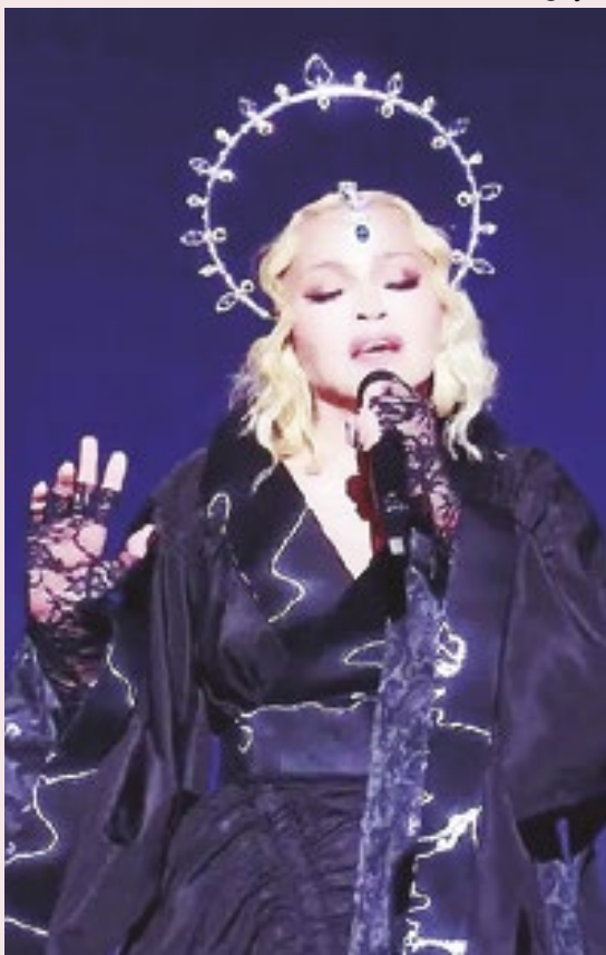
Madonna usa vários figurinos e cenários na 'Celebration Tour'

O palco em que Madonna vai subir para se apresentar na praia de Copacabana já está quase pronto. A montagem dos equipamentos oficiais da turnê deve ser concluída na tardes desta quinta-feira