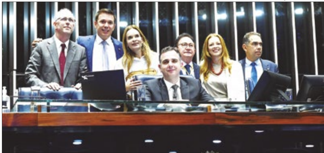
Senadores e representantes do setor de eventos

Além de limitar os gastos do projeto, garantindo que ele fosse prorrogado, o projeto reduziu o número dos chamadas Classifi-