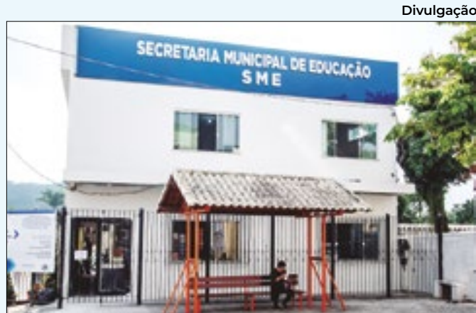
Secretaria Municipal de Educação de Pinheiral

em papel A4 em letra de fôrma. Caso o texto seja ilegível, a poesia será desclassificada. Mais detalhes sobre as regras do concurso estão disponíveis no site da Prefeitura.