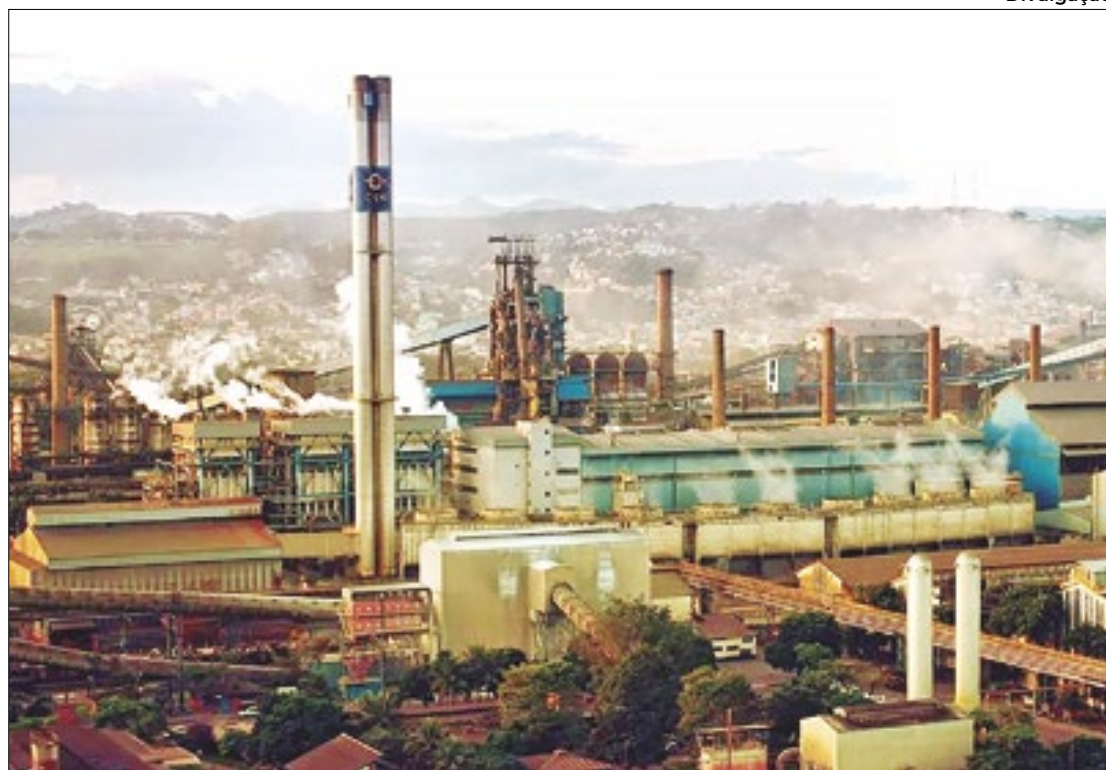
CSN é condenada pelo MPF em caso que resultou na morte de menino há cerca de 20 anos

Vera Lúcia também deve remover as edificações que estejam na faixa marginal de pro-