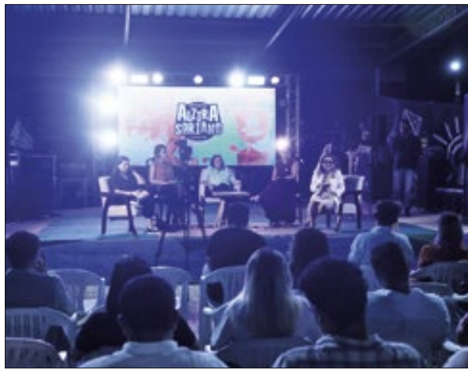
Foi assinada a ordem de serviço para estátua de Alzira