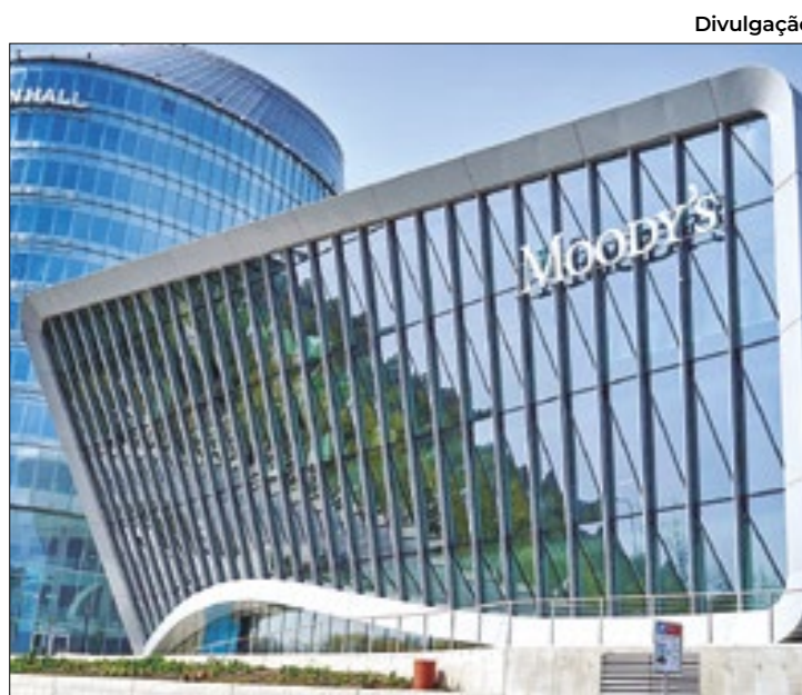
Divulgação Melhoria de nota de crédito do país é a 1ª desde 2018

Em relatório, a agência diz avaliar que as possibilidades para o crescimento real do PIB (Produto Interno Bruto) do Brasil são mais robustas do que antes da pandemia de Covid-19, citando as reformas estruturais que foram colocadas em prática de lá para cá nos últimos governos, o que reduz as incertezas em relação à direção futura das políticas públicas do país.