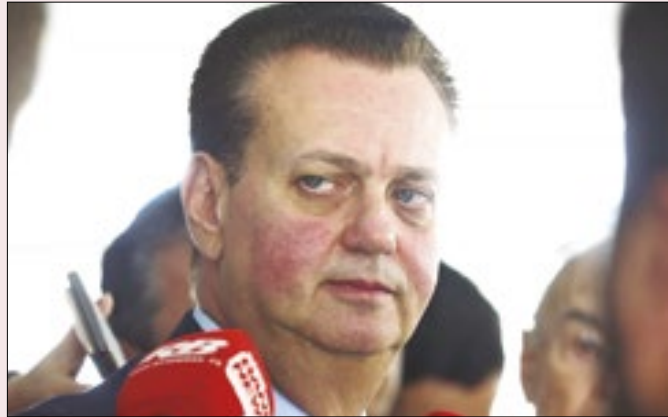
Kassab pode ser peça fundamental do futuro político