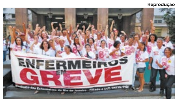
Estudo diz que reajuste salarial foi a principal reivindicação