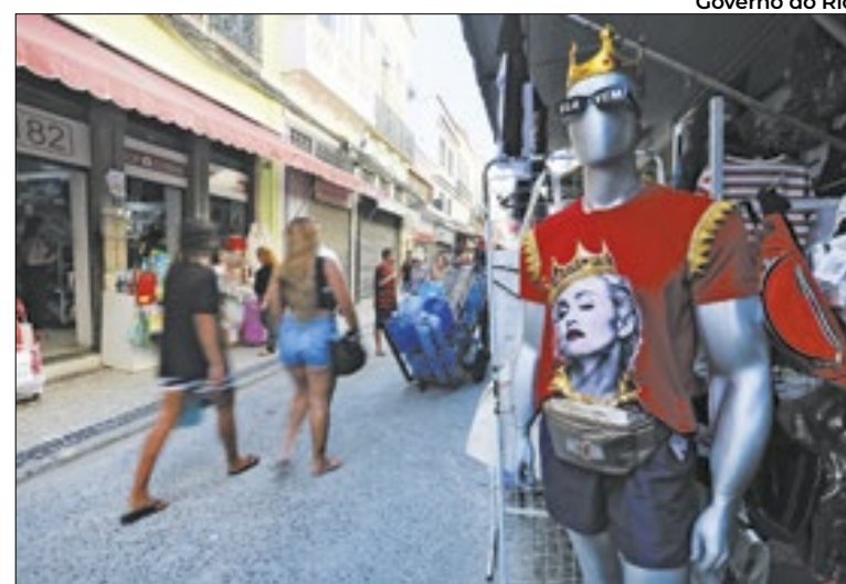
Madonna se apresenta dia 4, sábado, em Copacabana