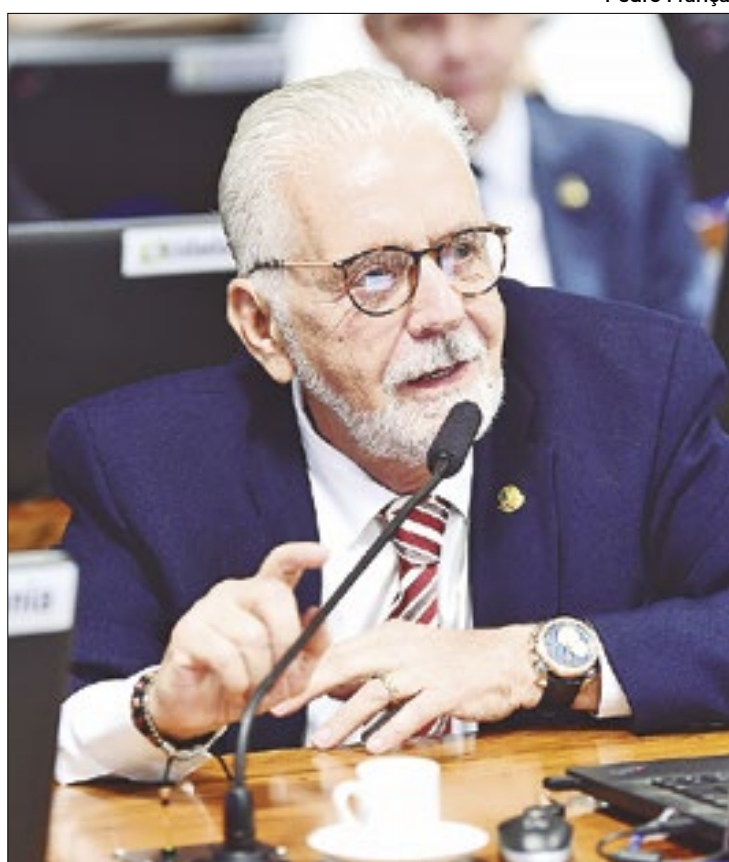
Jaques Wagner defende desoneração para municípios

O foco da negociação deve vir para contribuir com os municípios. O senador destacou que muitos municípios receberam verbas federais por meio de emendas parlamentares e também para obras do Programa de Aceleração do Crescimento