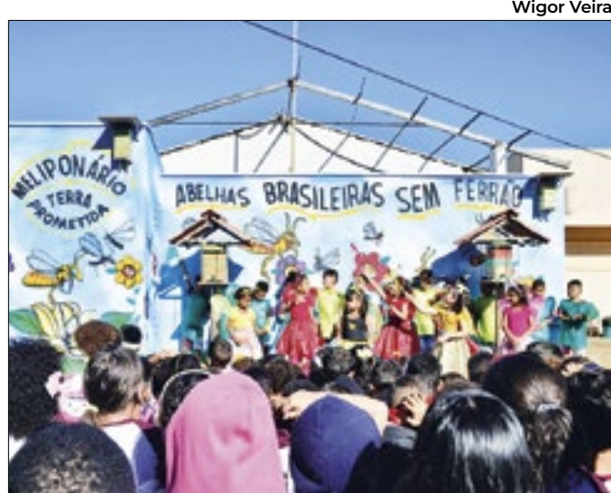
Concurso premiou os melhores projetos pedagógicos