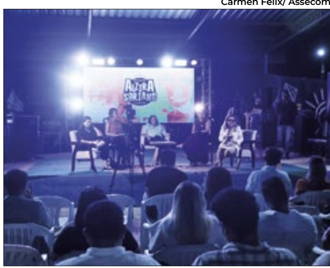
Foi assinada a ordem de serviço para estátua de Alzira