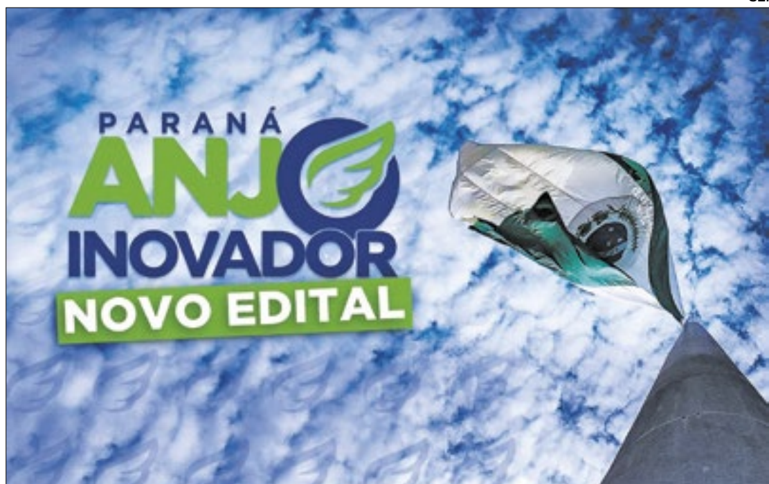
Estado publica novo edital para investimento de até R$ 20 milhões em startups

O Governo do Estado, por meio da Secretaria da Inovação, Modernização e Transformação Digital (SEI), publicou o novo edital do programa Paraná Anjo Inovador, que vai destinar até R$ 20 milhões em subsídio para empresas paranaenses enquadradas por lei como startups. O prazo para inscrições dos projetos vai até o dia 07 até 27 de maio. O Paraná Anjo Inovador é o maior programa do Brasil de incentivo financeiro com recurso público destinado a startups. Este segundo edital irá selecionar até 80 startups para receberem um aporte financeiro de até R$ 250 mil para o desenvolvimento de produtos, serviços e processos inovadores. Serão apoiados projetos com os seguintes temas: Cidades Inteligentes; Esportes; Inovação Social; Educação Inclusiva; Apoio à Inovação para Micro e Pequenas Empresas; Combate às Mudanças Climáticas; Segurança Alimentar; e Agricultura Sustentável. O secretário da Inovação, Marcelo Rangel, explica que o objetivo do Anjo Inovador é apoiar o empreendedor que está começando seu projeto e que tenha uma solução inovadora. “Muitos projetos acabam ficando pelo meio do caminho justamente pela falta de dinheiro. O Paraná é um celeiro da inovação e temos