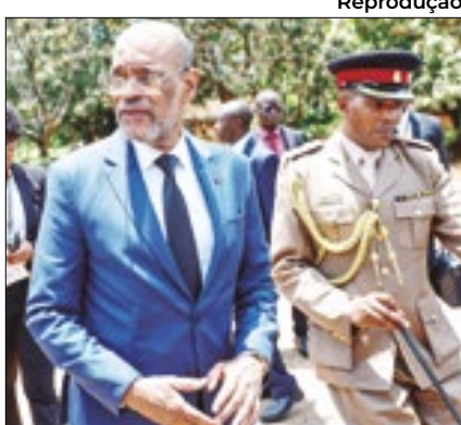
Nova gestão no Haiti

O governo transitório que assumiu o comando do Haiti após a renúncia do então primeiro-ministro Ariel Henry nomeou nesta terça-feira (30) os novos líderes do país. O ex-ministro do Esporte Fritz