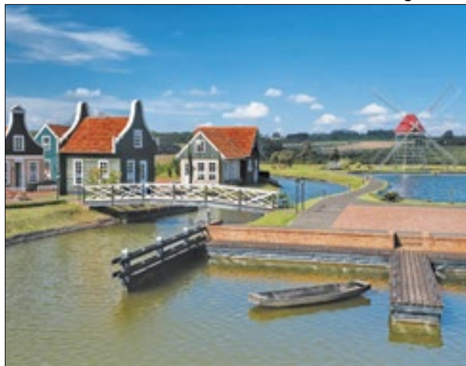
Parque histórico em Carambei