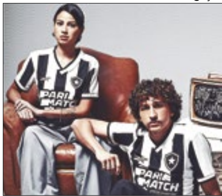
Uniforme do Fogão já está à venda

A Reebok divulgou o uniforme I do Botafogo para a temporada. A campanha celebra os 130 anos do Glorioso e irá homenagear o passado e projetar o futuro a cada nova peça revelada. A campanha é dividida em três atos. O primeiro foi o lançamento da camisa I e dos uniformes de treino. O segundo ato será o uniforme II, e o terceiro ato será o uniforme III, que serão lançados nos próximos meses.