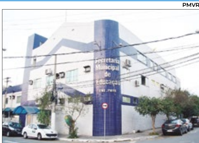
Prefeitura de Volta Redonda terá processo seletivo