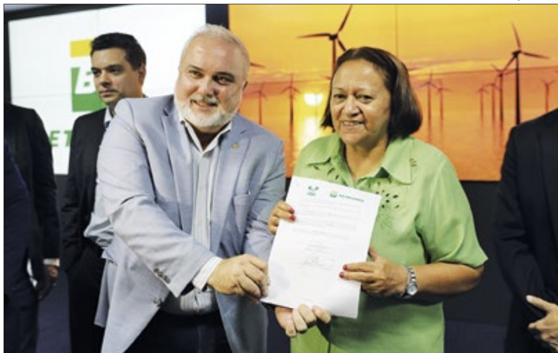
Governo do RN entra em ciclo de investimentos para crescimento econômico

O projeto piloto proposto pela Petrobras visa estabelecer conceitos sobre a infraestrutura para a produção offshore, testar práticas e o manejo ambiental.