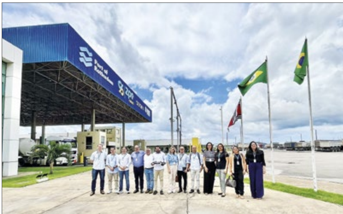
Hub de Hidrogênio Verde visa transformar o Pecém em um fornecedor global de combustível

Representantes da academia e dos setores público e privado se reuniram na sede da Zonas de Processamento de Exportação (ZPE) Ceará, nesta segunda-feira (29), para discutir a qualificação da mão de obra local em vista dos investimentos previstos para o Ceará nos próximos anos, incluindo as oportunidades geradas pelo Hub de Hidrogênio Verde do Complexo do Pecém.