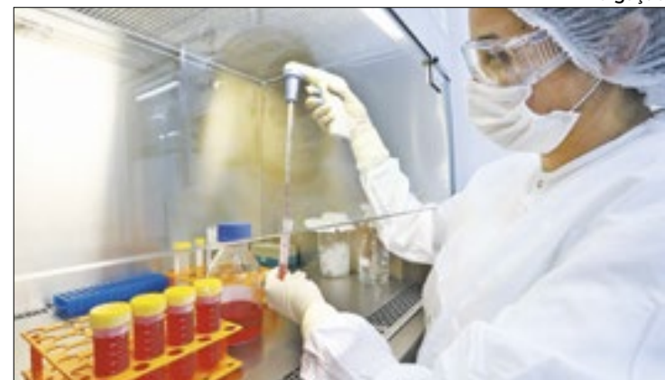
Fortalecimento e popularização da ciência no Sul