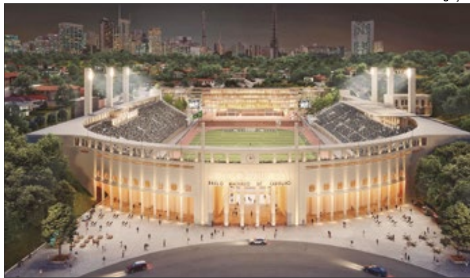
Arena Mercado Livre Pacaembu está no centro de uma grande polêmica em São Paulo

As obras nos estádios também romperam com cabos de internet e linha telefônica e internet, diz o documento.