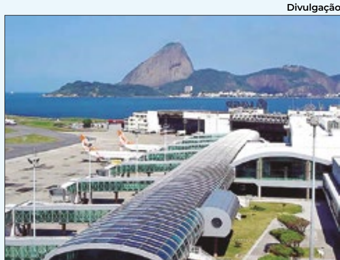
Agentes vão orientar turistas no Santos Dumont e Galeão

“Esse coro massivo irá ecoar pelo local da apresentação, demonstrando a nossa paixão pela Rainha do Pop. Será um momento poderoso e emocionante que certamente tocará o coração de Madonna”, finaliza a publicação.