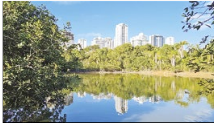
Parque Ecológico Águas Claras será beneficiado