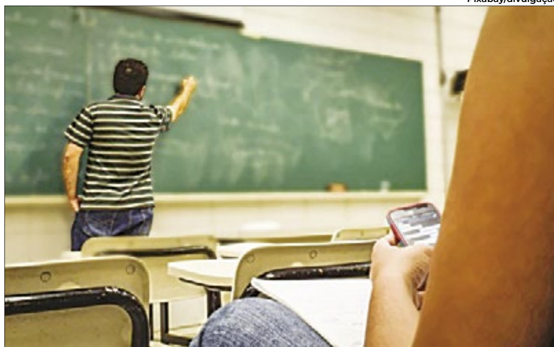
Instituição de ensino identificou dez alunos responsáveis pelos atos racistas

Colégio também criou um Comitê de Diversidade e Inclusão