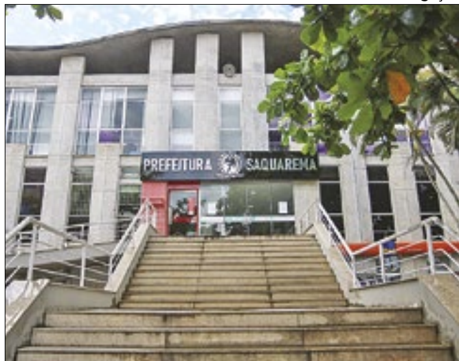
Saquarema acumula a geração de 2.067 empregos