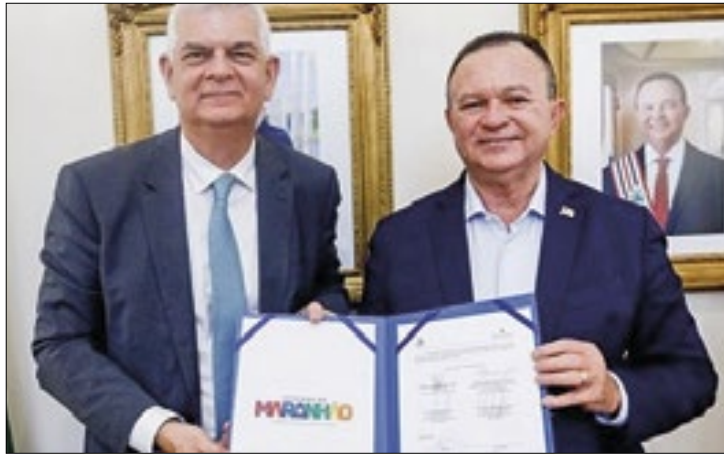
Estado avança na corrida de energética sustentável