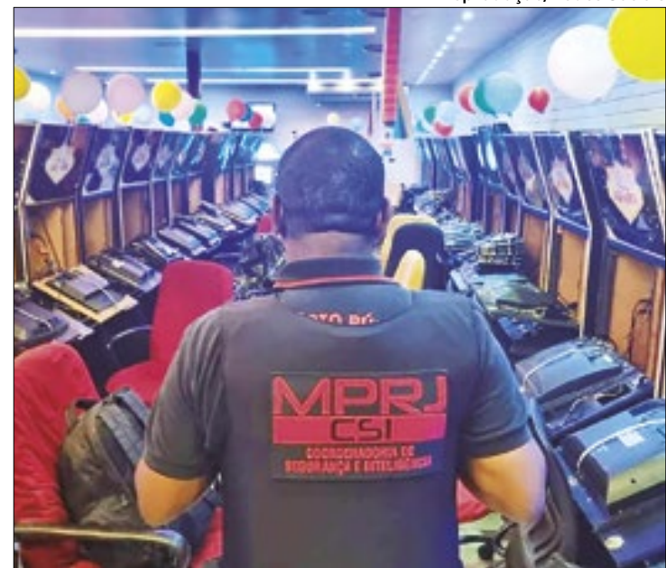
Políciais cumpriram mandados em 14 endereços