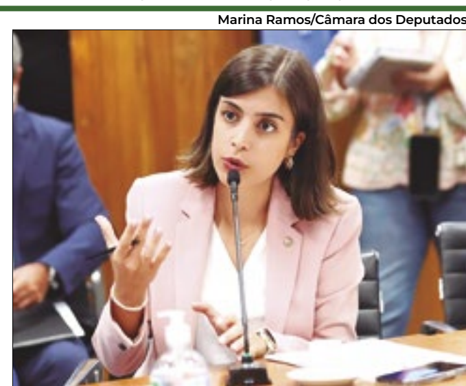
Deputada cresceu 8,5 pontos desde dezembro