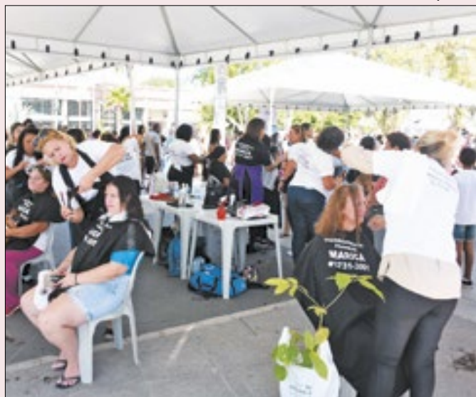
Maricá vai promover festa pelo Dia do Trabalhador