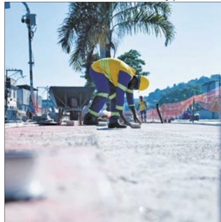
MUVI terá 18 quilômetros de extensão