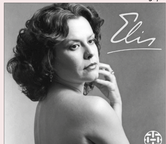
Um single com uma gravação rara de Elisa Regina cantando 'Para Lennon & McCartney' marca o retorno do selo Trama às atividades como gravadora