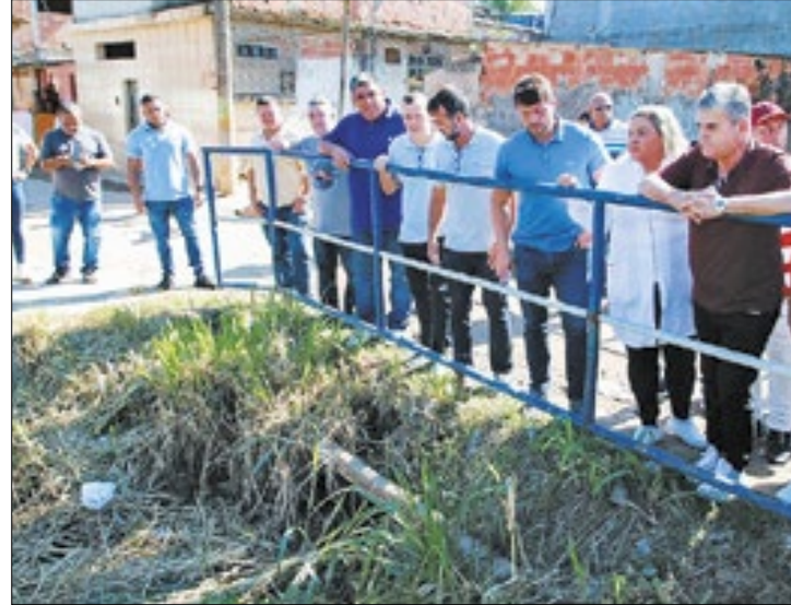
Obras foram iniciadas no último sábado (27)

têm por objetivo o controle de inundações, promovendo melhoria da qualidade de vida dos moradores da região.