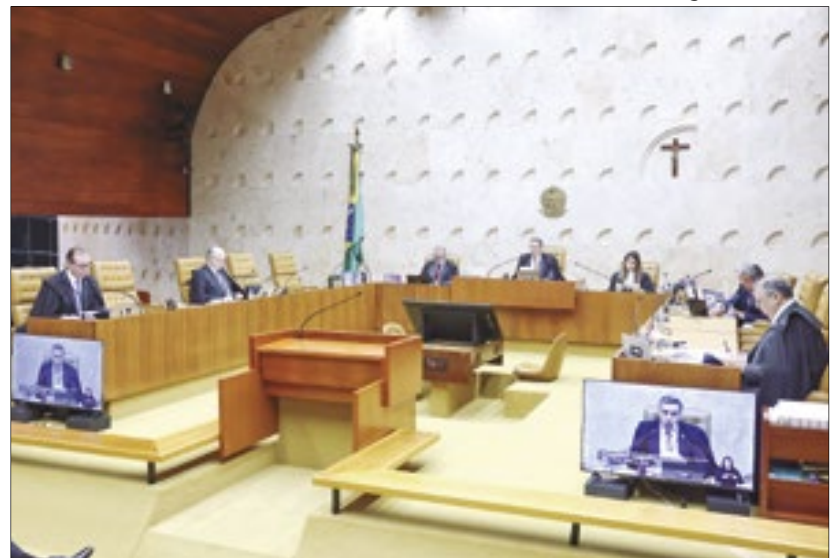
Cinco ministros são favoráveis para suspender desoneração

O ministro Luiz Fux pediu vista no julgamento sobre a suspensão ou não da desoneração da folha. Porém, o placar está 5 a 0 pela decisão do ministro Cristiano Zanin, que acatou solicitações da AGU para suspender alguns trechos do projeto de lei aprovado no Congresso. O objetivo do Supremo Tribunal Federal é resolver a questão até 20 de maio, quando começará, em Brasília, a Marcha dos Prefeitos.