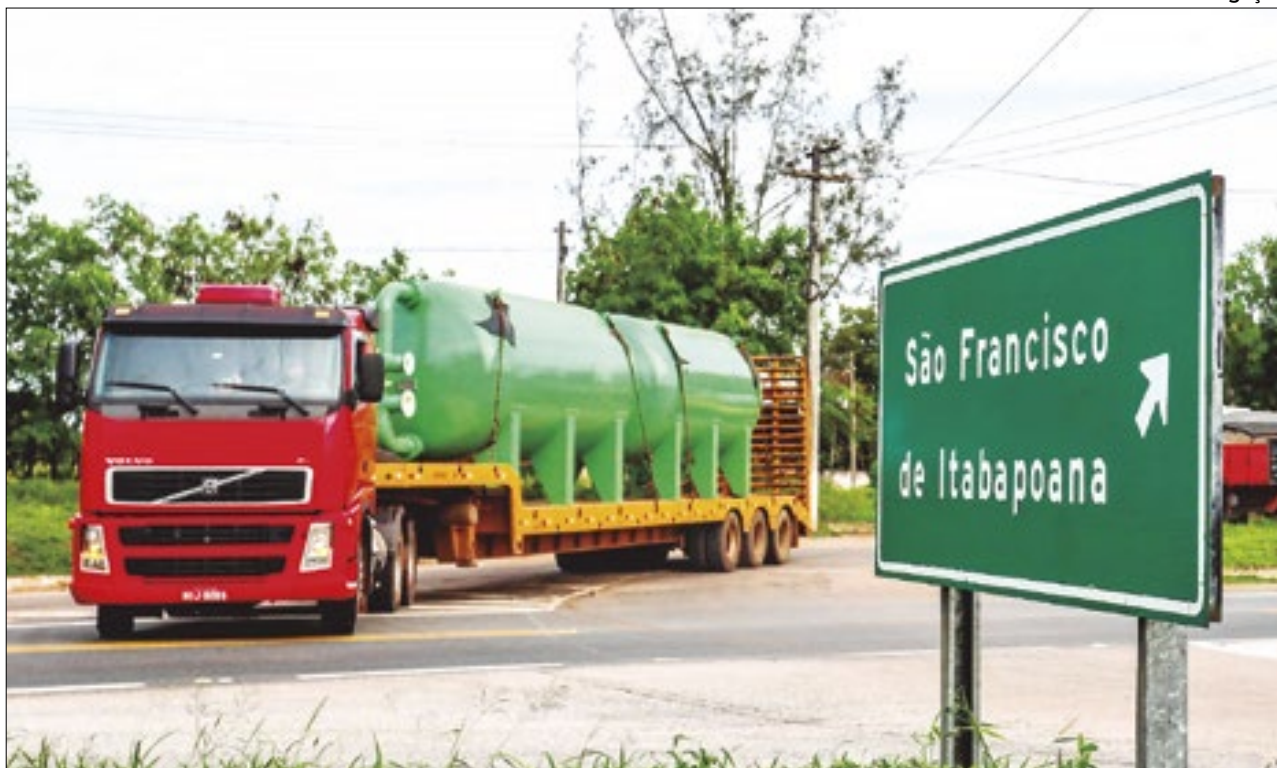
Filtros zeólitas são capazes de remover o ferro e o manganês encontrados na água bruta

vou, nesta segunda-feira (29/04), em segunda discussão. A medida segue para o governador Cláudio Castro. O objetivo é em dez anos conseguir reduzir à metade o índice estadual de mortes por grupo de veículo e o índice de mortes por grupo de habitantes no âmbito do Estado.