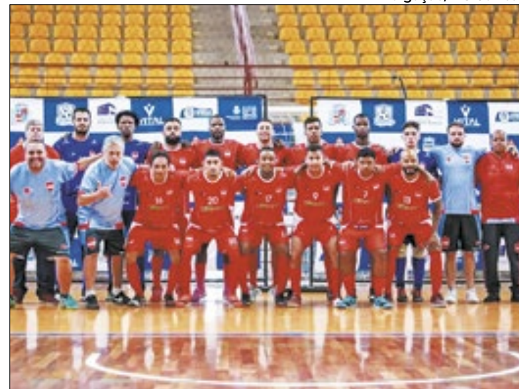
Neste início do ano, o clube reformulou o elenco de futsal

O clube de Petrópolis garantiu a vaga na Supercopa após ter sido campeão da Copa TV Integração na sede de Santos Dumont, em Minas Gerais, no início de abril. A partida do título foi disputada contra o Ressaquinha. Após a partida terminar empatada em 2x2 no tempo normal, o EC Corrêas