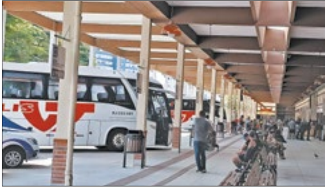
Projeto para proibir a venda de álcool no local foi vetado