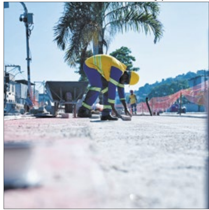
MUVI terá 18 quilômetros de extensão