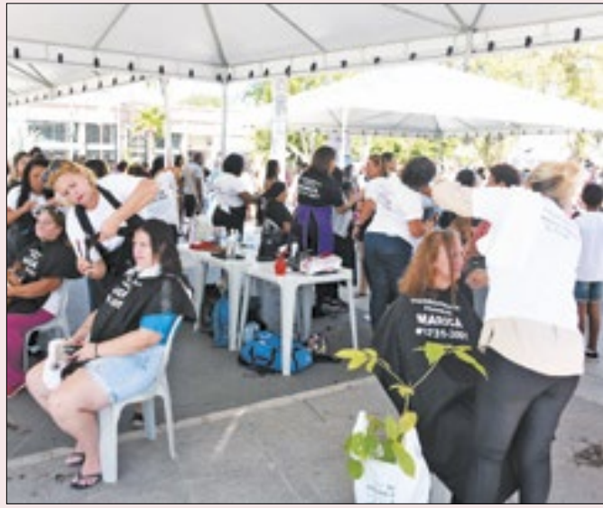
Maricá vai promover festa pelo Dia do Trabalhador