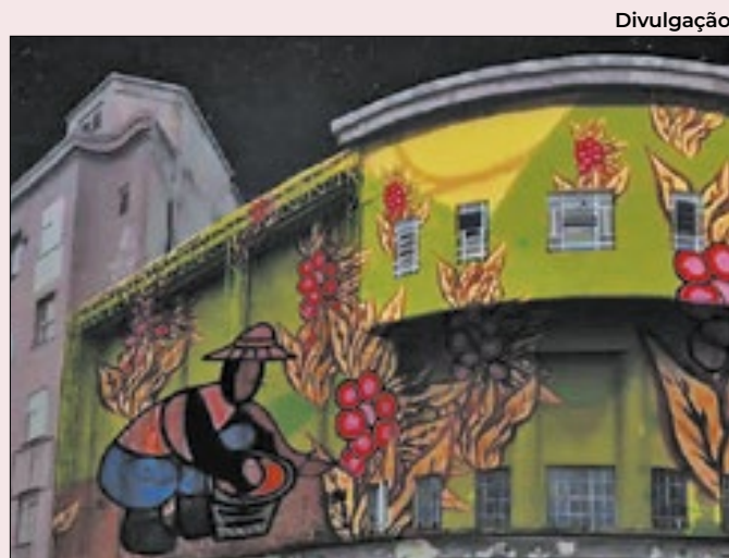
Nova Iguaçu vai receber evento inédito de projeção 3D