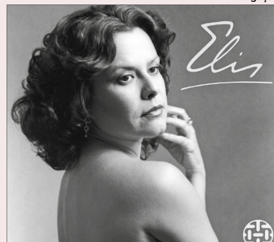
Um single com uma gravação rara de Elis Regina cantando 'Para Lennon & McCartney' marca o retorno do selo Trama às atividades como gravadora