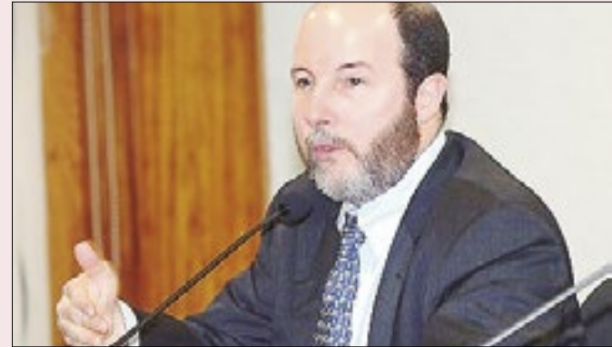
Armínio Fraga doou R$ 100 mil para Tabata em 2022