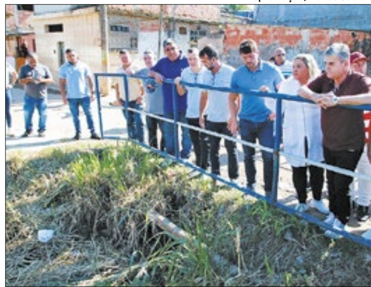
Obras foram iniciadas no último sábado (27)

têm por objetivo o controle de inundações, promovendo melhoria da qualidade de vida dos moradores da região.