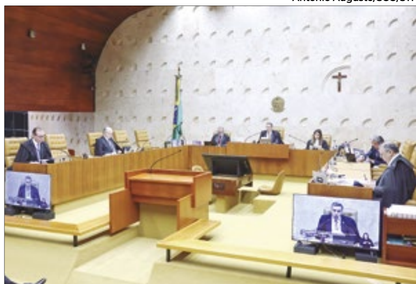
Cinco ministros são favoráveis para suspender desoneração

O ministro Luiz Fux pediu vista no julgamento sobre a suspensão ou não da desoneração da folha. Porém, o placar está 5 a 0 pela decisão do ministro Cristiano Zanin, que acatou solicitações da AGU para suspender alguns trechos do projeto de lei aprovado no Congresso. O objetivo do Supremo Tribunal Federal é resolver a questão até 20 de maio, quando começará, em Brasília, a Marcha dos Prefeitos.