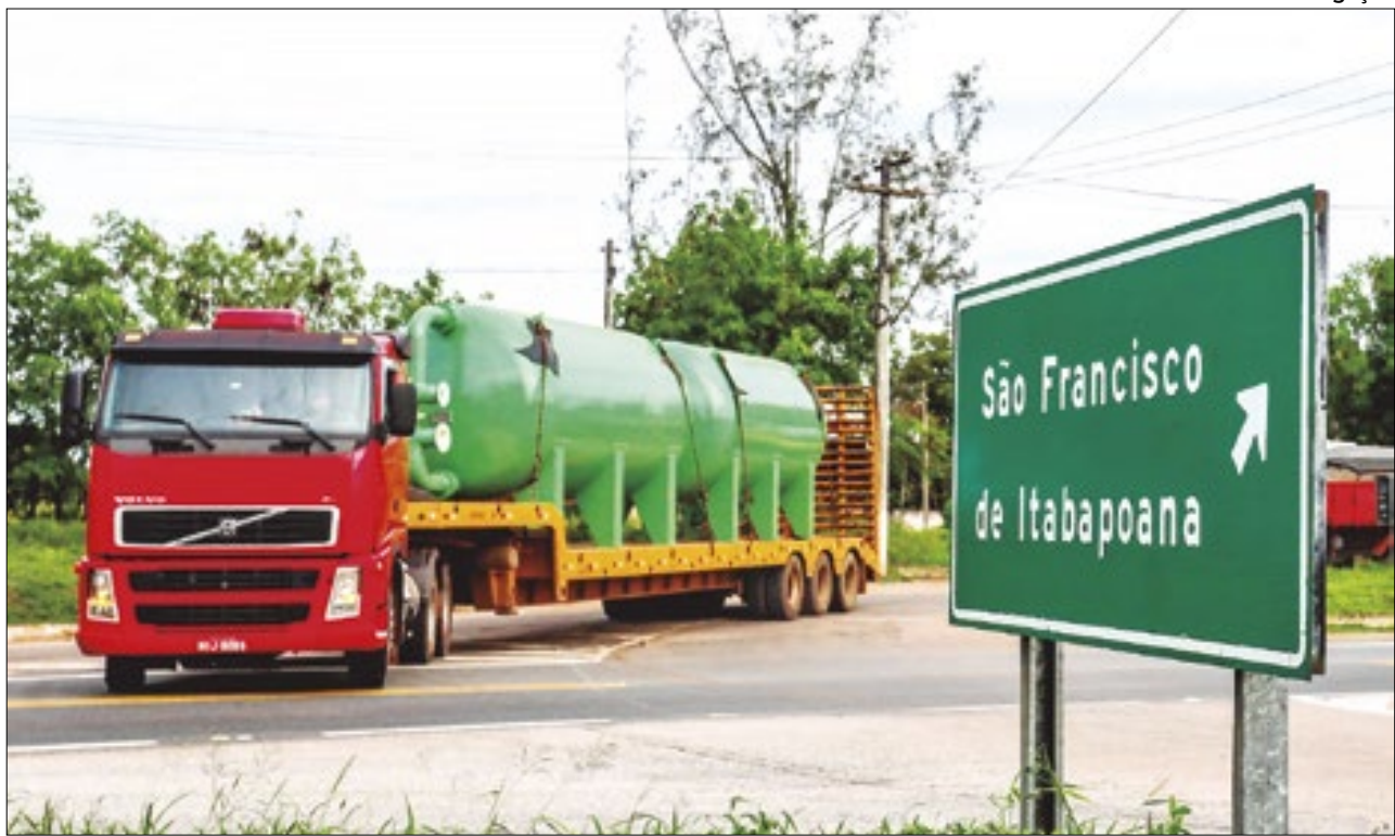
Filtros zeólitas são capazes de remover o ferro e o manganês encontrados na água bruta

vou, nesta segunda-feira (29/04), em segunda discussão. A medida segue para o governador Cláudio Castro. O objetivo é em dez anos conseguir reduzir à metade o índice estadual de mortes por grupo de veículo e o índice de mortes por grupo de habitantes no âmbito do Estado.