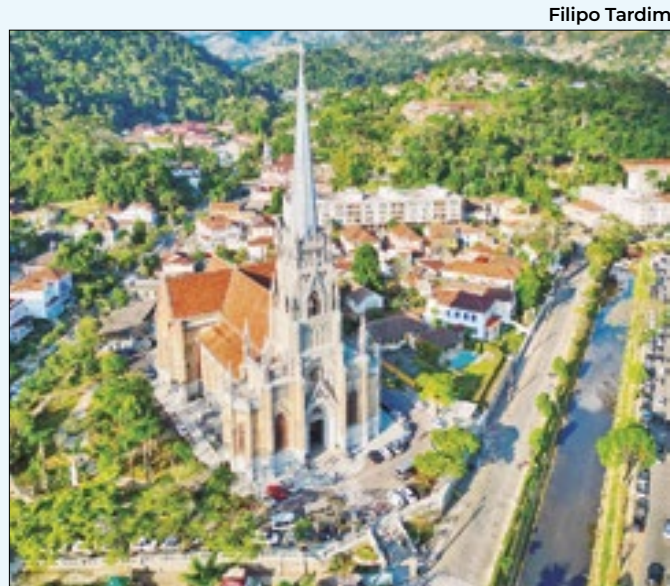
Imagem aérea da Catedral São Pedro de Alcântara

informados os seguintes dados: nome do servidor, matrícula, tipo de contrato, nível, cargo, data de admissão, órgão, carga horária, situação (ativo, reativado ou exonerado) e valor bruto do salário. Não são discriminados o valor do salário bruto, os descontos, bonificações e salário líquido.