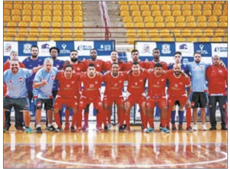
Neste início do ano, o clube reformulou o elenco de futsal

O clube de Petrópolis garantiu a vaga na Supercopa após ter sido campeão da Copa TV Integração na sede de Santos Dumont, em Minas Gerais, no início de abril. A partida do título foi disputada contra o Ressaquinha. Após a partida terminar empatada em 2x2 no tempo normal, o EC Corrêas