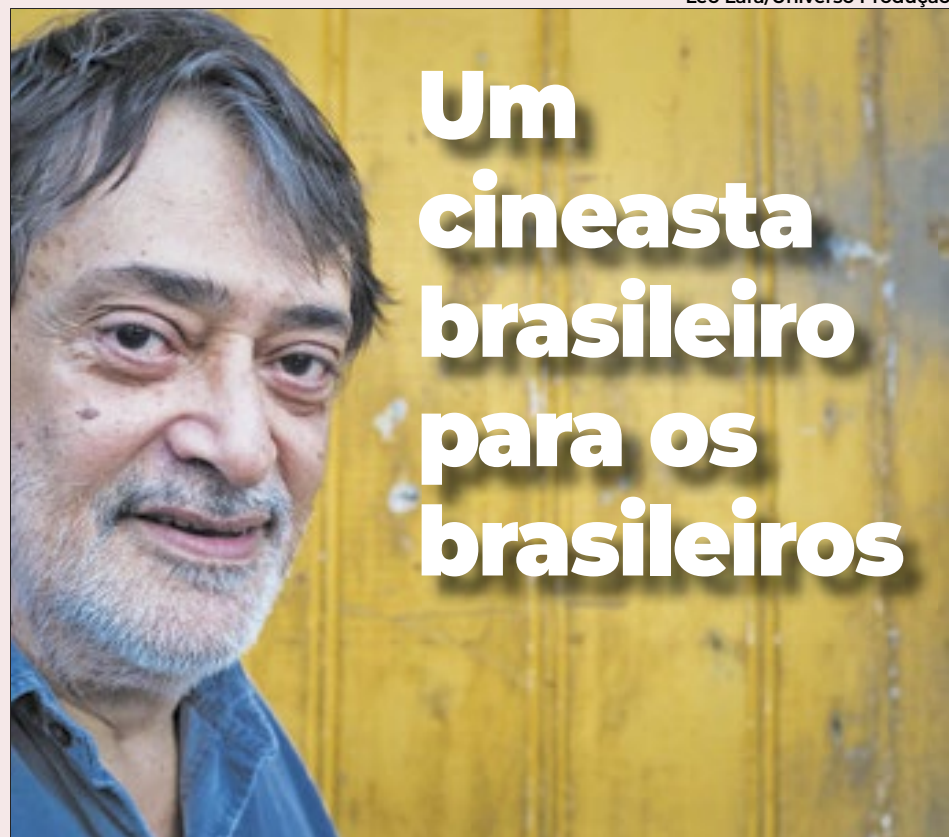
Walter Lima Jr: 'Eu não consigo me livrar do Brasil dentro de mim'

Um dos maiores mestres da direção no país, ativo desde o Cinema Novo, Walter Lima Jr. ganha retrospectiva na Caixa Cultural