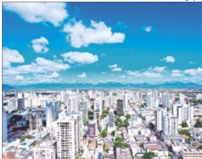
Campos recebeu selo durante evento em São Paulo