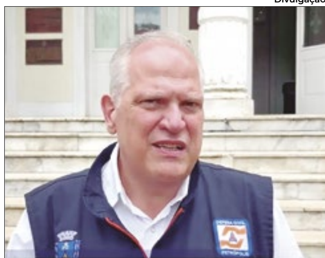
Gabinete de Bomtempo aumenta salários e reduz cargos