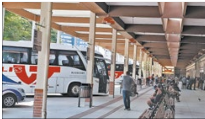
Projeto para proibir a venda de álcool no local foi vetado