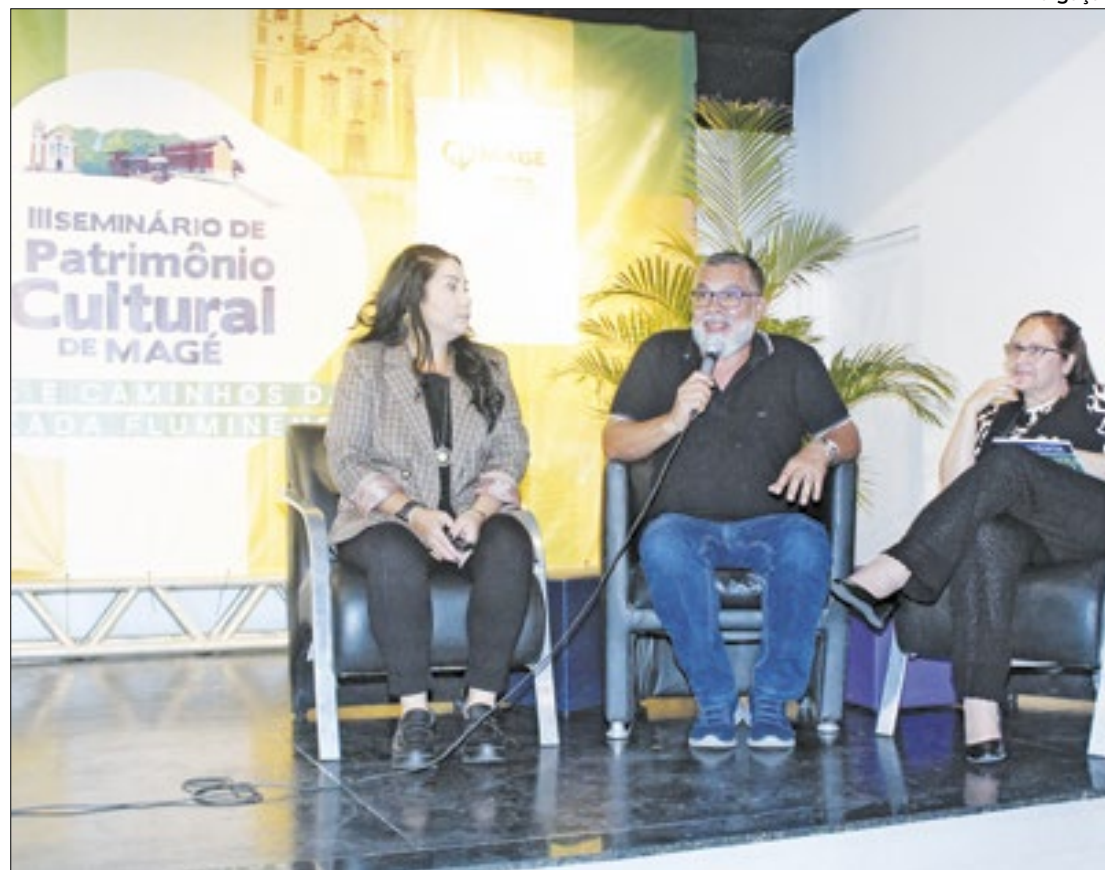
Evento foi realizado durante dois dias, através da Secretaria de Cultura e Turismo de Magé

"Acho que o maior legado que podemos deixar para a posteridade é o legado do conhecimento. O conhecimento sempre será libertador e dará autonomia às pessoas. O objetivo