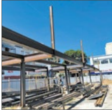
Espaço passa por revitalizações

Por meio da Secretaria Municipal de Obras, Infraestrutura e Habitação, a Prefeitura de Três Rios está reformando por completo a Rodoviária Roberto Silveira, popularmente conhecida como Rodoviária Velha, localizada no centro. Com ritmo acelerado e reforço no contingente de trabalho, as obras registram avanços diários. A reestruturação visa preparar o espaço para ser transformado na nova sede da Secretaria Municipal de Educação, Ciência e Tecnologia.