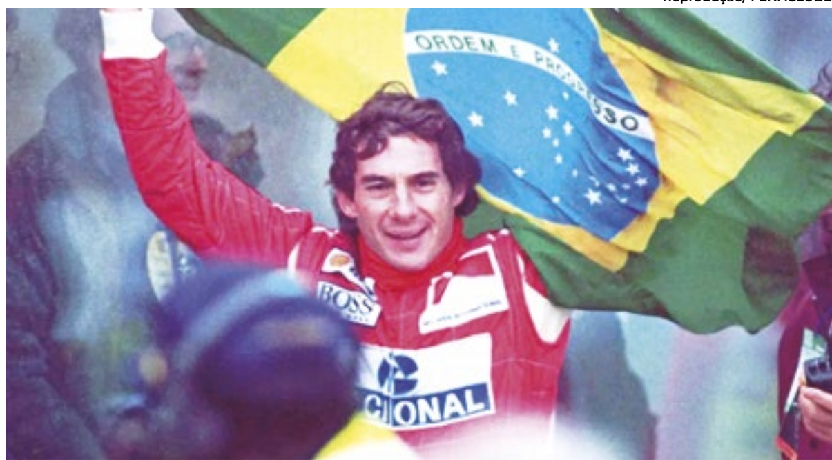
Morte de Ayrton Senna completa 30 anos nesta quarta-feira, 1º de maio

Nesta quarta-feira (1º), a morte de Ayrton Senna, lenda brasileira das pistas, completa 30 anos. Desde o acidente fatal na curva Tamborello, naquele 1º de maio de 1994, no GP de San Marino, em Ímola, na Itália, o legado do ídolo nacional se espalhou para dentro e fora das pistas. Desde então, o Brasil presta suas mais que merecidas homenagens, enquanto lamenta a saudade e dúvida se jamais terá outro ídolo como Senna.