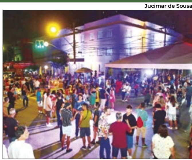
Evento ocorre desde 2003 no município