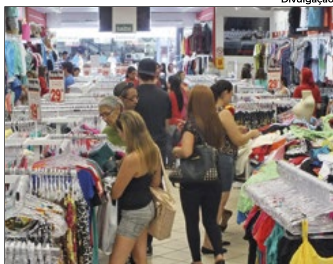
Avanço da renda do consumidor determinou alta do índice