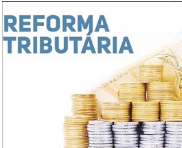
Entidades manifestam preocupação com exceções

Durante evento realizado pela Fiesp (federação das indústrias de São Paulo) nesta segunda (29), o secretário da reforma tributária, Bernard Appy, disse que o projeto acaba com benefícios fiscais equivalentes a 2% do PIB (Produto Interno Bruto), cerca de R$ 200 bilhões,