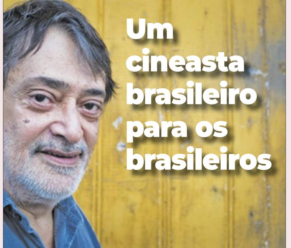
Walter Lima Jr.: 'Eu não consigo me livrar do Brasil dentro de mim'

Um dos maiores mestres da direção no país, ativo desde o Cinema Novo, Walter Lima Jr. ganha retrospectiva na Caixa Cultural