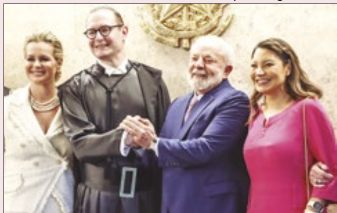
Decisão de Zanin pode agravar crise