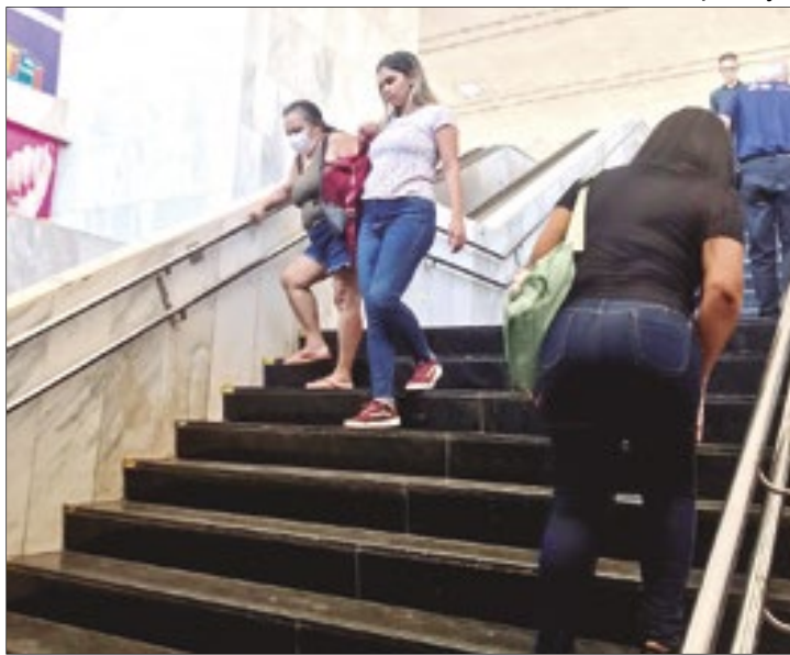
Passageiros prejudicados pela falta de acessibilidade na estação do metrô na Rodoviária do Plano Piloto