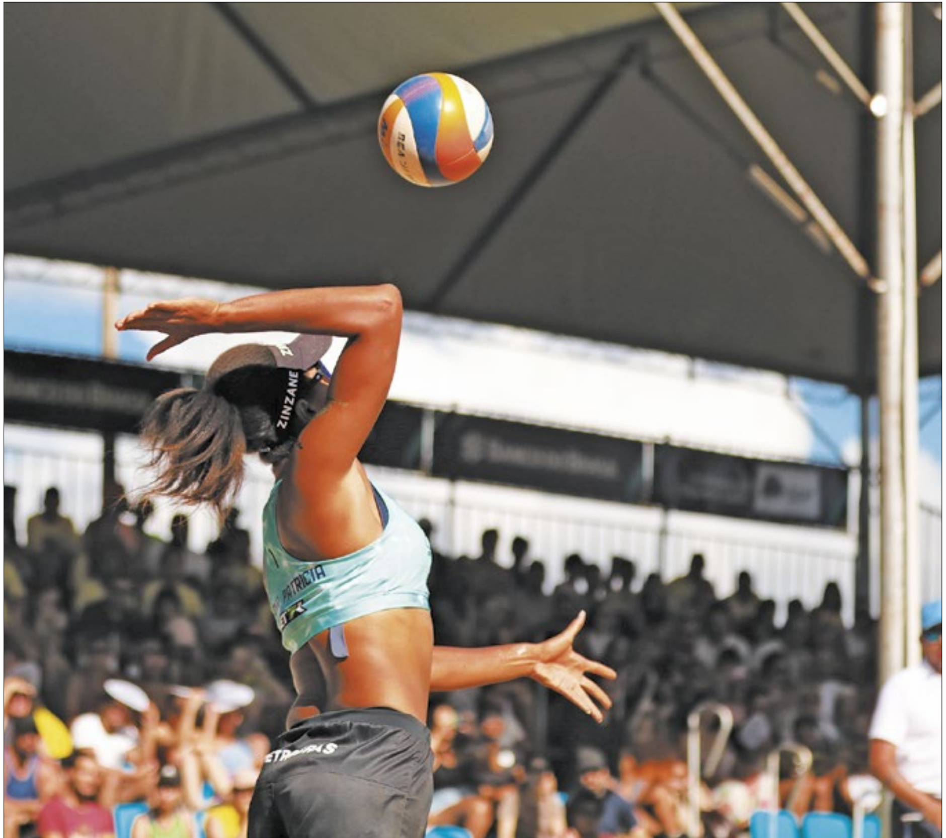
O Brasil hoje é considerado um dos países com mais força no vôlei de praia mundial