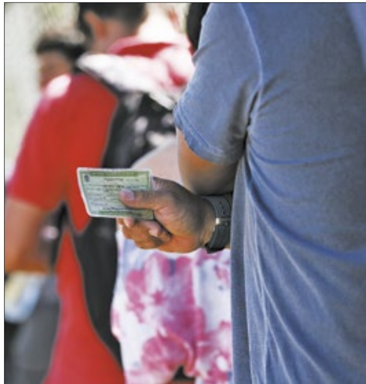
Sem título eleitoral, eleitor não poderá votar

Porém, o TSE esclarece que mesmo que o eleitor que não tenha a biometria cadastrada na Justiça Eleitoral poderá votar normalmente no pleito deste