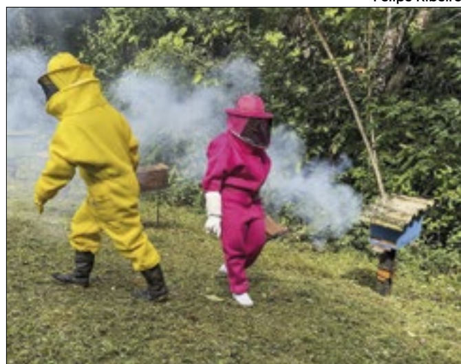
Mais de 30 toneladas de mel foram produzidas