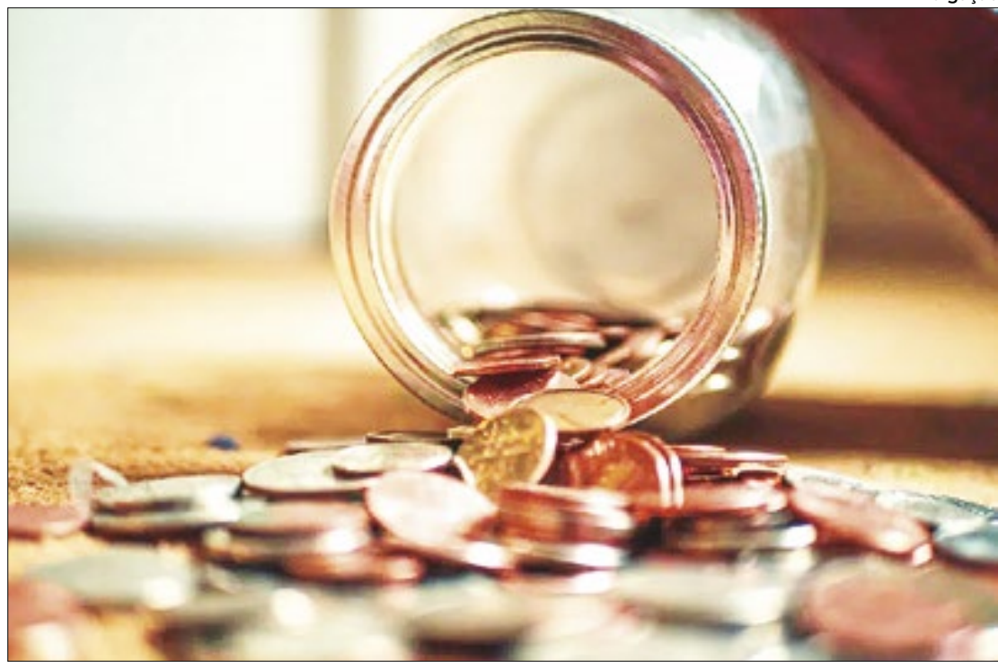
Déficit das contas públicas de março é o pior para o mês, desde o ano passado

exibiram alta real de 8,5% em março, no comparativo anual, e crescimento real de 8,9% no primeiro trimestre do ano (1T24). Já as despesas (já descontada a inflação), aumentaram 4,3% em março, com variação positiva de 12,7% no 1T24.