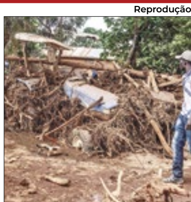
Ao menos 45 morreram

Ao menos 45 pessoas morreram no rompimento de uma barragem na madrugada desta segunda-feira (29) em uma cidade ao noroeste de Nairóbi, capital do Quênia. O incidente aconteceu no momento em que o