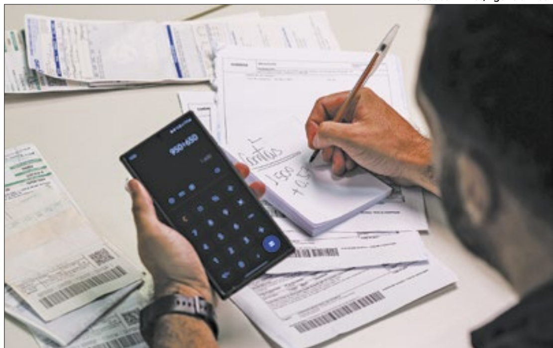
Se desoneração for suspensa, contribuição volta a ser com alíquota de 20% sobre a folha

Devido à polêmica causada entre os poderes com a medida, o governo federal estuda encontrar uma solução para o impasse com municípios em torno da reoneração da folha de pagamentos. O objetivo é resolver o tema até 20 de maio, quando começará em Brasília a Marcha dos Prefeitos. Uma ala do governo propõe uma progressão da contribuição previdenciária dos municípios con-