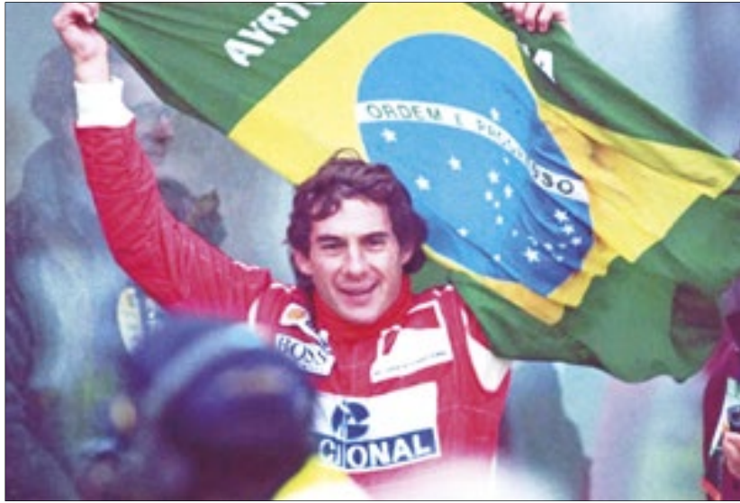
Morte de Ayrton Senna completa 30 anos nesta quarta-feira (1º)

Nesta quarta-feira (1º), a morte de Ayrton Senna, lenda brasileira das pistas, completa 30 anos. Desde o acidente fatal na curva Tamborello, naquele 1º de maio de 1994, no GP de San Marino, em Ímola, na Itália, o legado do ídolo nacional se espalhou para dentro e fora das pistas. Desde então, o Brasil presta suas mais que merecidas homenagens, enquanto lamenta a saudade e dúvida se jamais terá outro ídolo como Senna.