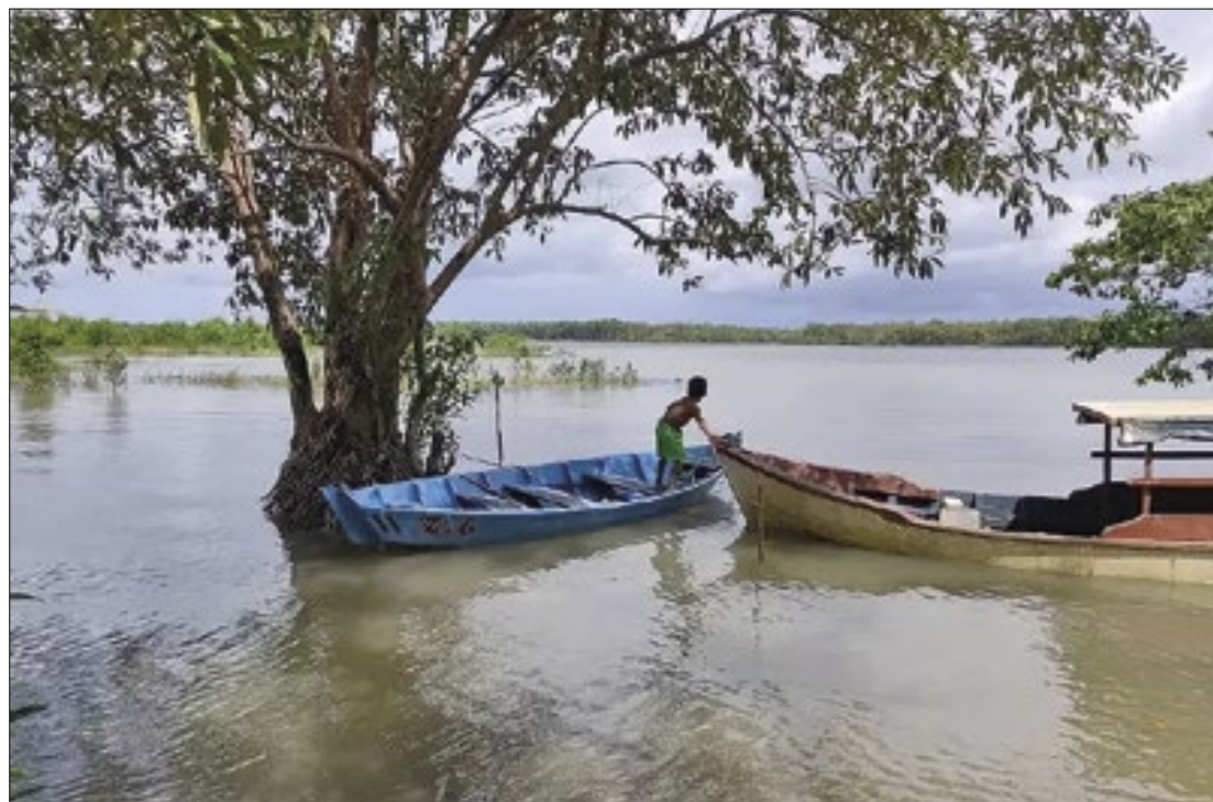
Ilha ficava localizada dentro da Reserva Extrativista (Resex) Marinha Mestre Lucindo

Um laudo científico da Universidade Federal Rural da Amazônia (UFRA), solicitado pela Polícia Civil em 2023, apontou que o sumiço da ilha foi causado pela erosão provocada pela passagem de lanchas, que transitavam em alta velocidade pelo rio Cajutuba, onde a ilha estava localizada. O local gradualmente erodiu até ficar completamente submerso. O estudo foi comprovado por imagens de satélite, registradas ao longo de quatro décadas, além do relato dos moradores que vivem nas proximidades. Através das imagens, foi possível observar o progressivo encolhimento da ilha ao longo dos anos até seu completo desaparecimento em 2016.