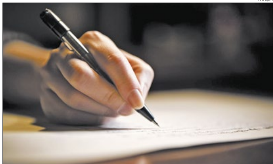
Prova vai acontecer no próximo domingo em todo o território nacional

Além da densidade populacional, foram considerados como critérios de seleção das localidades a facilidade de acesso às cidades e o raio de influência microrregional do município. O ministério pretende aumentar a representatividade da força de trabalho a partir da aprovação dos candidatos, com diferentes perfis socioeconômicos, demográficos e territoriais,