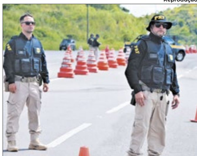
Teste aos condutores com carteira C, D e E