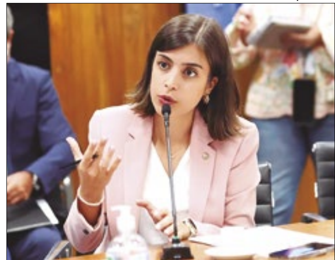
Deputada cresceu 8,5 pontos desde dezembro