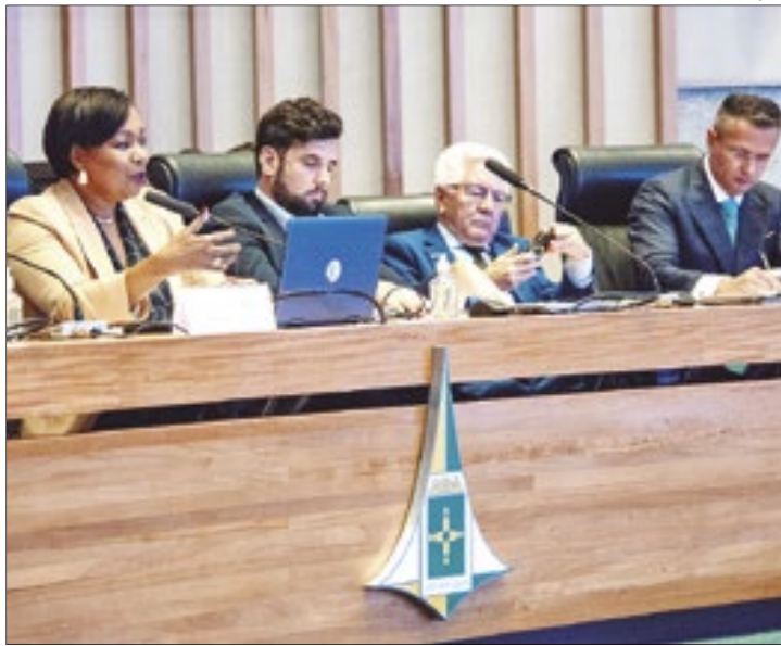
Reunião sobre Ciência e Tecnologia, realizada no plenário da Câmara Legislativa do DF nesta segunda-feira (29)

GDF a criação de uma unidade da Polícia Civil para o atendimento especializado às pessoas com Transtorno do Espectro do Autista (TEA), sobretudo na emissão de documentos de identificação.