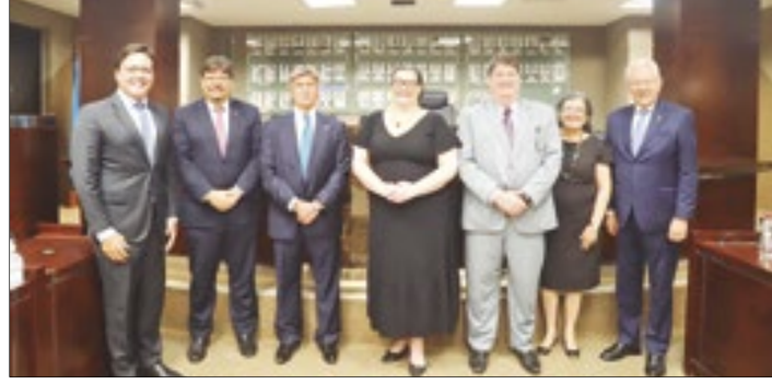
Ministro do STF, Luiz Fux (3º) esteve entre os homenageados pelo Ministério Público do Espírito Santo

“A Constituição atribui poderes a órgãos públicos que são responsáveis por zelar pelos valores estruturantes desse território, cujas demandas dos seus habitantes