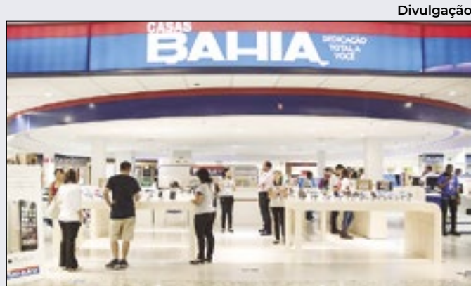
Pedido de recuperação da varejista animou mercado

Embora o IE-COM – que mede a expectativa de vendas para os próximos três meses – tenha aumentado 5,5 pontos (92,5 pontos), o Icom em abril sofreu influência de três fatores limitantes, como: competição, demanda insuficiente e custo financeiro.