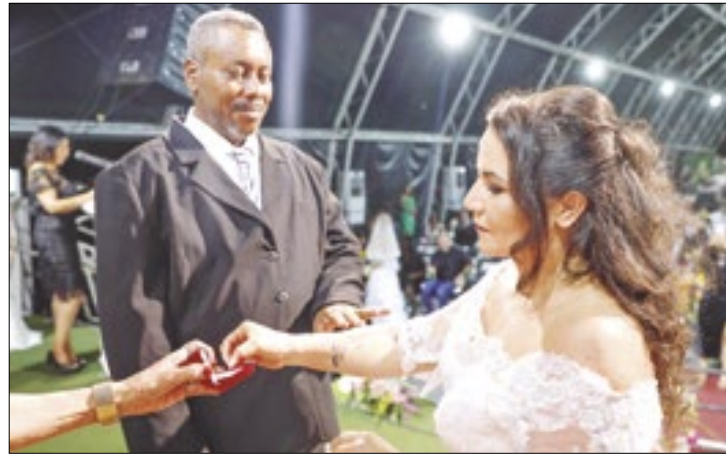
Evento foi celebrado no Pontão do Lago Sul