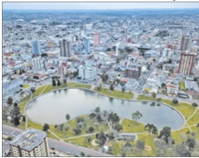
III Seminário de Violência Política na próxima sexta