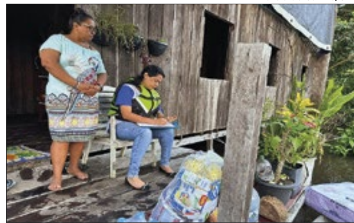
Cerca de 20 famílias foram assistidas no Rio Araguari