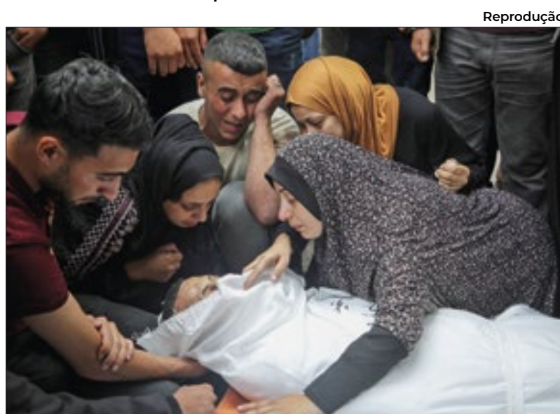
Existe a expectativa por um acordo para uma trégua

A expectativa é que os negociadores cheguem a um acordo antes que Tel Aviv intensifique ainda mais os bombardeios à Rafah. Após diversos pedidos do governo israelense para desocupar o norte de Gaza desde o início do conflito, em outubro, a cidade, ao sul, está superlotada e abriga mais de 1,5