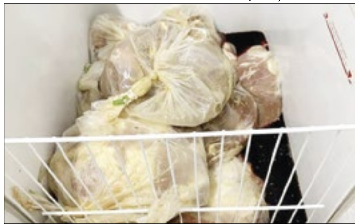
Foram encontradas carnes impróprias para o consumo