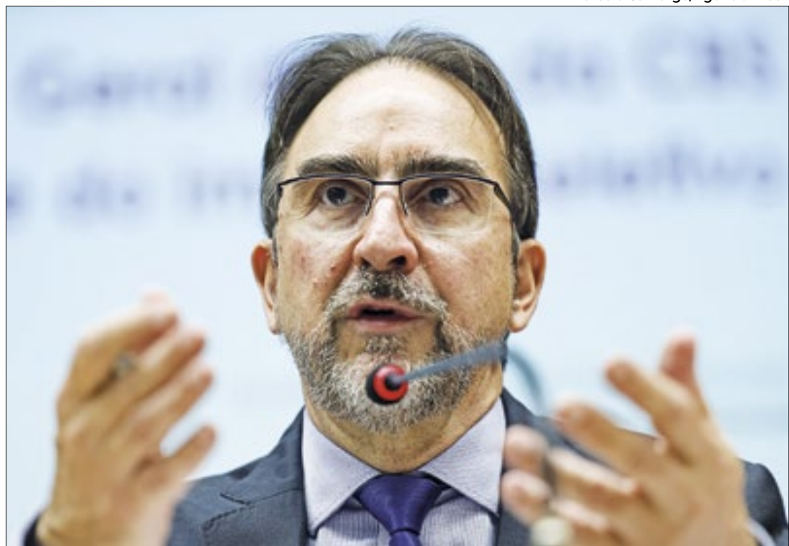
Segundo Bernard Appy, alíquota geral terá redução de 7,5%