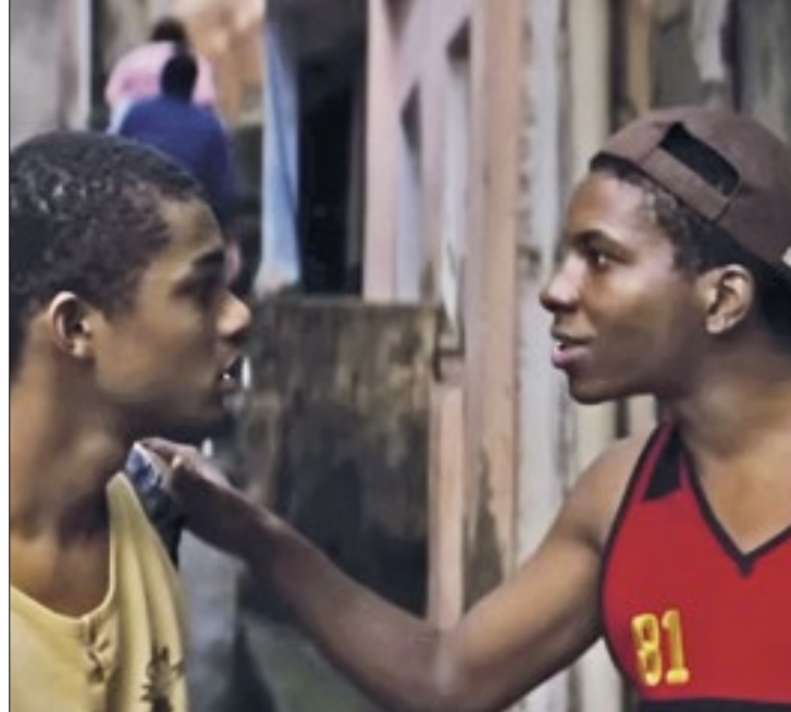
Sessão de estreia apresenta o longa "Nosso Sonho"