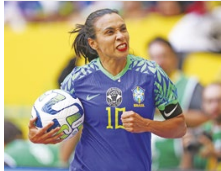
Jogadora se despede da Seleção nos Jogos Olímpicos