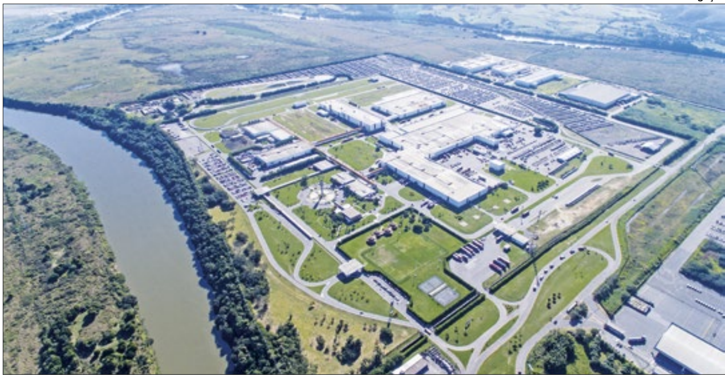
Fábrica da Volks Caminhões e Ônibus em Resende anuncia projetos para moradores do município

movimentando a comunidade e localidades vizinhas. A festividade vai seguir até o dia 1º de maio, Dia do Trabalhador, com a Missa Sertaneja. Os shows vão acontecer na Praça 1º de Maio, no mesmo bairro, com diversos grupos que fazem parte da moda sertaneja raiz.