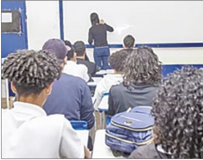
Projeto permite a convocação de até 15 mil professores