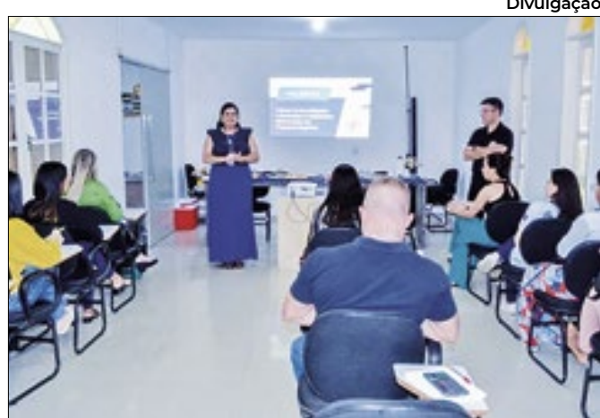
Empreendedores se reuniram na manhã de ontem (25)