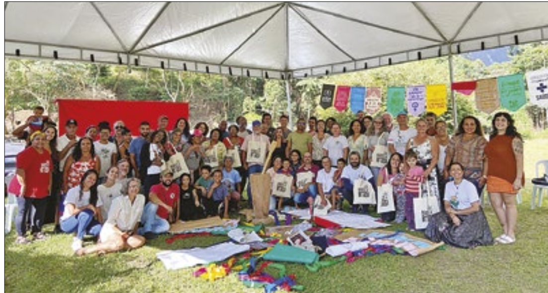
Projeto impactou outras regiões, como Corrêas, Alto da Serra e o Contorno, na BR-040

AUÁ Hostel e CEI Therezinha de Jesus Lima, por meio da Secretaria Municipal de Educação de Petrópolis.