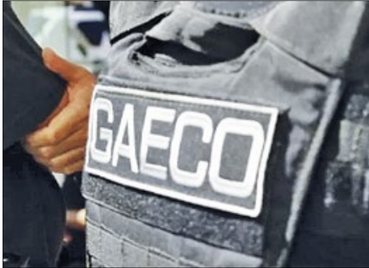
Ministério Público está indo a fundo nas investigações contra a milícia

O Ministério Público do Rio de Janeiro deflagrou na quinta-feira (25) uma operação contra integrantes de uma milícia, entre eles estão policiais civis e militares.