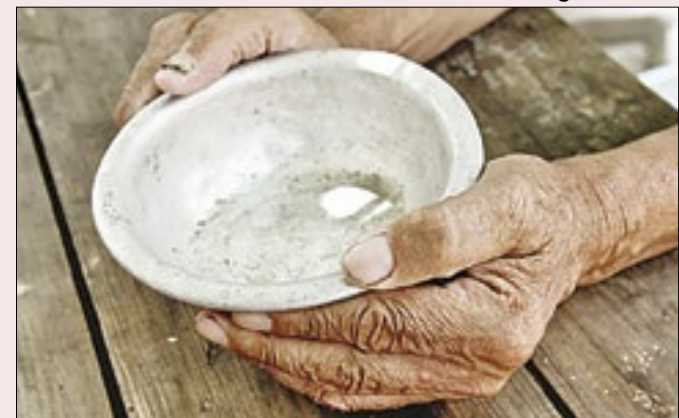
IBGE: fome entre pretos e pardos