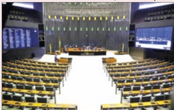
O presidente da Câmara passa a receber R$ 981