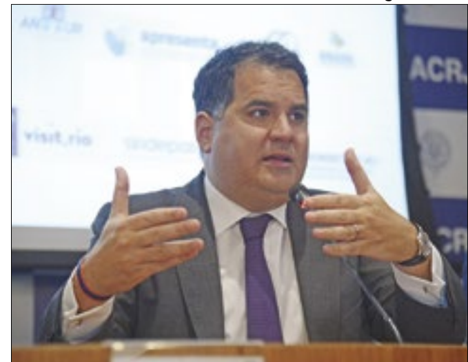
Bichara: mudança também afetará mais pobres