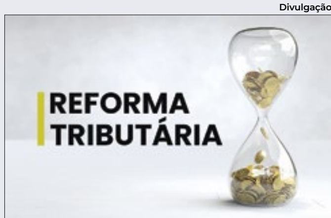
Revisão tributária não implica ganho ao contribuinte

Na contramão da confiança do setor, o Índice Nacional de Custo da Construção – M (INCC-M) cresceu 0,41% em abril, patamar bem acima da variação 0,24% do mês anterior. Tal expansão, porém, sinalizaria viés de estabilização, tendo em vista a taxa de 3,48%, dos últimos 12 meses.