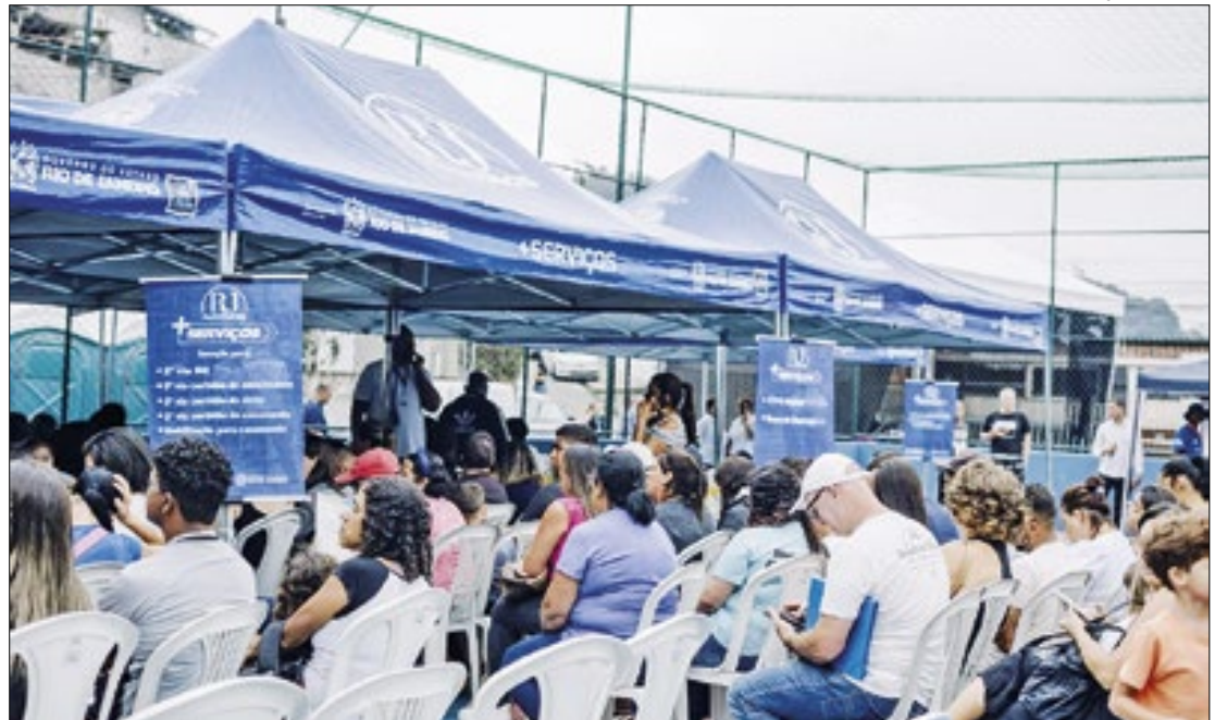
Diversos serviços gratuitos são oferecidos à população no Programa RJ Para Todos

O Governo do Estado realiza no sábado (27), em Teresópolis, mais uma edição do programa RJ para Todos + Serviços, da Secretaria de Estado de Governo em parceria com a Prefeitura de Teresópolis. Na estrutura, que será montada na Praça Samuel Macário, no centro de Bonsucesso, a população terá acesso serviços gratuitos, como emissão de carteira profissional digital e documento de identidade; poderá fazer habilitação para casamento; conseguir isenção para certidões de casamento, nascimento e óbito; encaminhamento para postos de trabalho, no balcão de empregos; e ainda esclarecer dúvidas sobre direitos do consumidor. O atendimento será das 9h às 15h. Para garantir atendimento de forma organizada, as senhas serão distribuídas até às 13h.