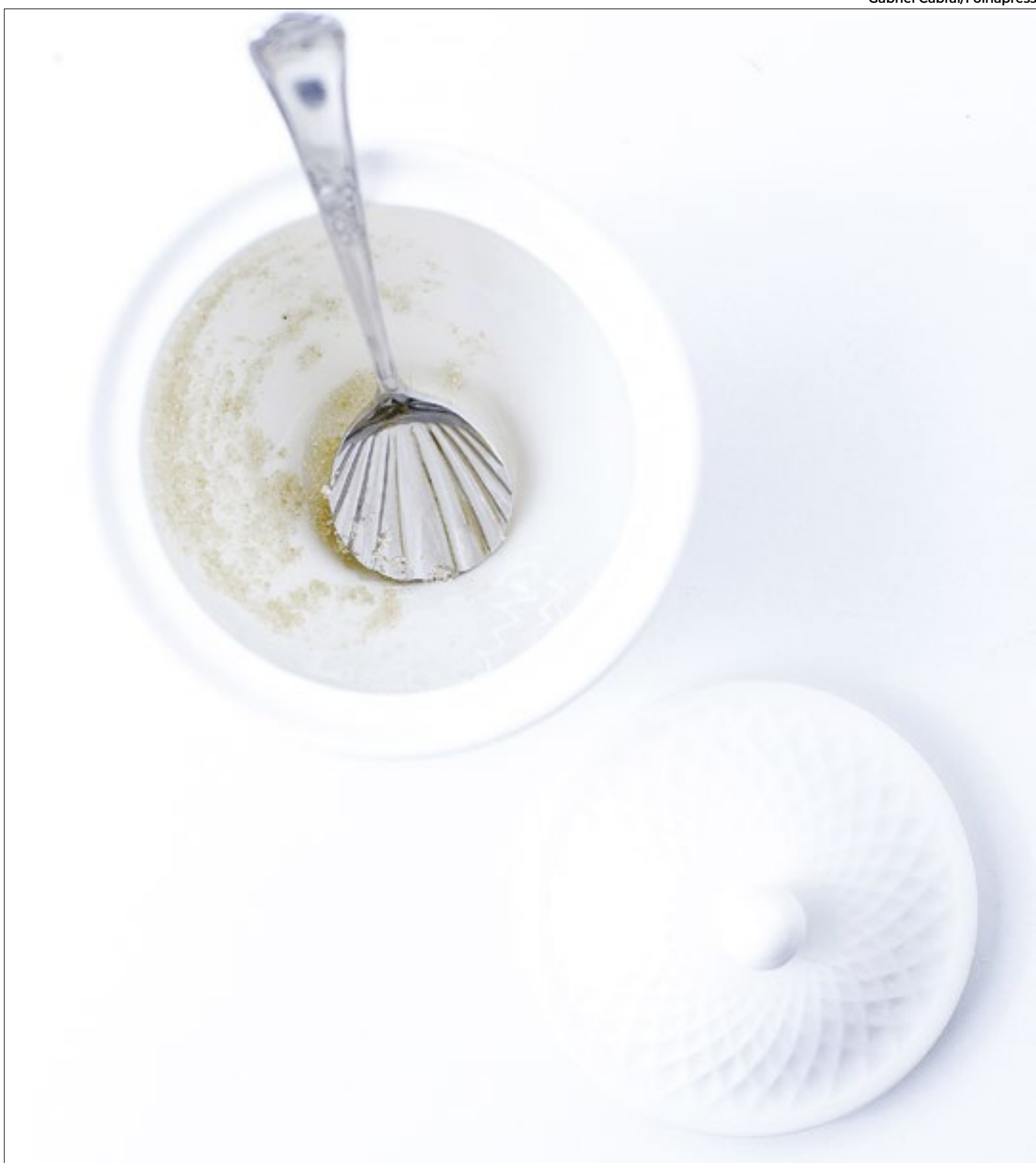
Entenda as diferenças entre açúcares e adoçantes naturais e descubra quais podem levar mais ou menos sabor à cozinha

que, desde então, nunca foi comprovado que a substância tem o mesmo efeito em seres humanos. Além disso, proporcionalmente, o consumo humano diário de adoçantes é imensamente inferior ao que foi utilizado na pesquisa com os roedores.