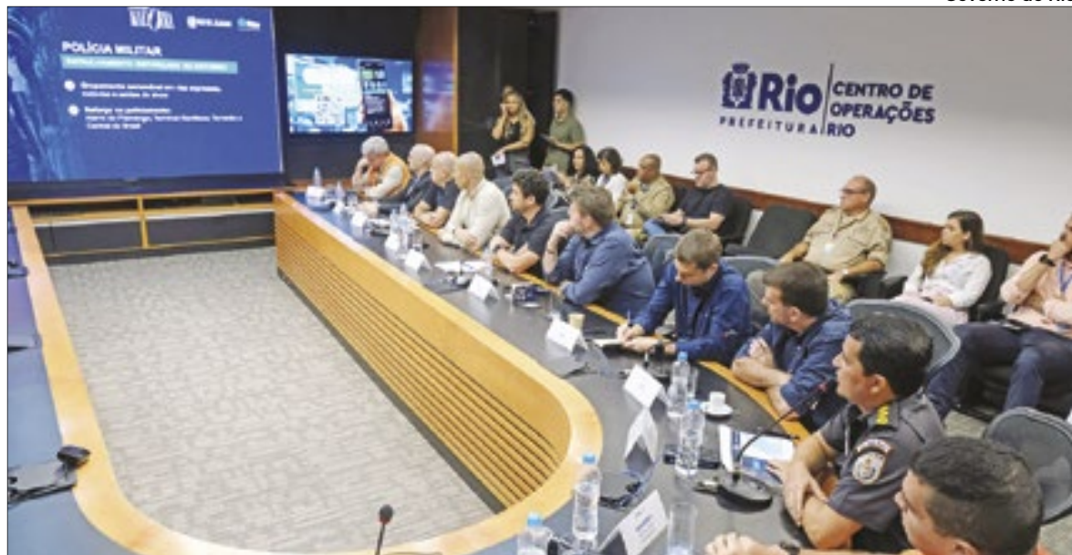
Esquema e logística foram divulgados pelas autoridades estaduais e municipais

O Governo do Estado e a Prefeitura do Rio divulgaram, de forma conjunta, logística operacional e o esquema de segurança para o show de Madonna, em Copacabana, marcado para 4 de maio. A operação especial de segurança começa no dia 29 de abril e vai até o dia 6 de maio. A Polícia Mi-