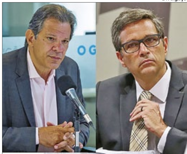
Fazenda reage às posições críticas do presidente do BC

Tudo por conta das declarações do dirigente monetário sobre o impacto econômico desastroso da ‘frouxidão’ fiscal e suposto desprezo pelas regras da política monetária, que têm servido para ‘segurar’ a queda mais célere da Selic nos próximos meses. A perspectiva agora é que a taxa deva cair somente 0,25 ponto percentual, e não mais em meio ponto percentual.