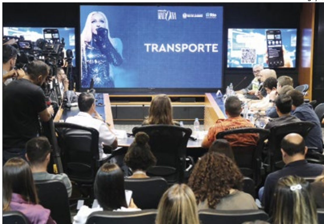
Governo do Estado e Prefeitura anunciam operação logística e de segurança para o show

“Nosso efetivo e infraestrutura de equipamentos foram plane-