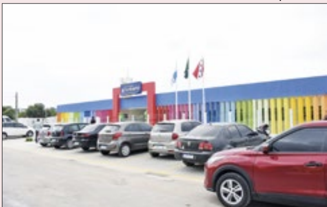
Unidade em São José do Imbassai vai atender 167 alunos