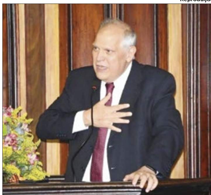
Bomtempo em 15 dias para prestar esclarecimentos

“[...] a continuidade do presente processo de contra-