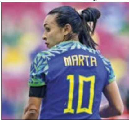
Marta vai se aposentar da Seleção

Marta se despediu e confirmou sua aposentadoria da seleção brasileira feminina ao final de 2024. Este será seu último ano com a camisa do Brasil. A jogadora seis vezes melhor do mundo disse que está tranquila com a decisão. Marta também comentou sobre o otimismo com a equipe para seguir seu legado. Ela vê um "ambiente fértil" com atletas jovens, promissoras e em desenvolvimento para passar o bastão.