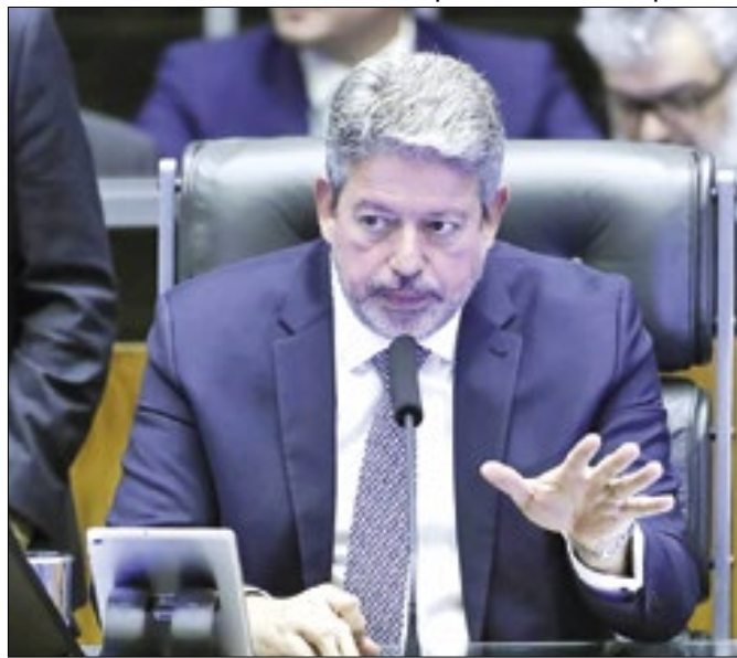
Aumento foi publicado no Diário Oficial da Câmara