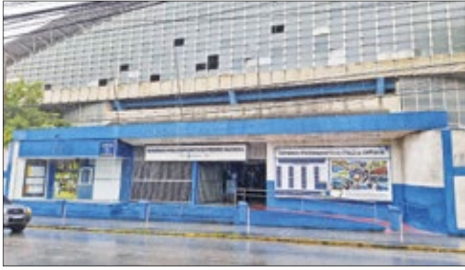
Ginásio Poliesportivo Pedro Rage Jahara