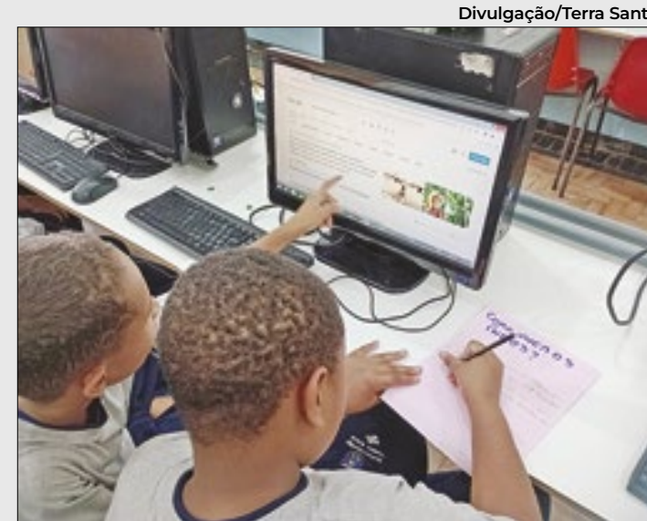
Projeto Social Terra Santa Petrópolis

Criado em 2001, o projeto é desenvolvido em parceria com a Secretaria de Assistência Social do município, e atende 70 crianças de 6 até 12 anos. “O trabalho desenvolvido tem como objetivo o fortalecimento de vínculos e acontece por meio de oficinas com temas baseados nos interesses, demandas e potencialidades das crianças”, explica a coorde-