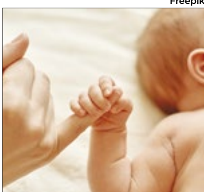
Estudo publicado na The Lancet

Estudo publicado na revista britânica The Lancet mostra que, até 2100, apenas seis (3%) entre 204 países terão níveis sustentáveis de nascimentos para reposição sustentável da população. São eles: Samoa, Somália, Tonga, Nigéria, Chad e Tajikistão. O trabalho analisa os dados entre 1950 e 2021 e faz a projeção para 2050 e 2100. A pesquisa é fruto da parceria do grupo de estudo internacional Global Burden of Diseases.