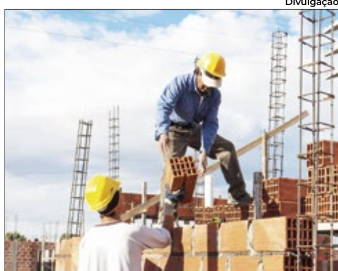
Expectativa negativa derrubou neutralidade de indicador