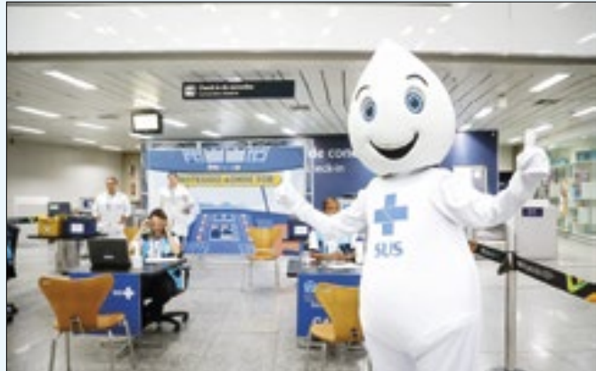
Vacinação contra gripe no Galeão vai até dia 2 de maio