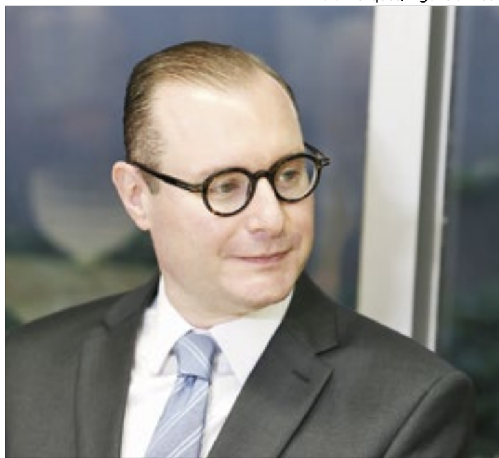
Cristiano Zanin foi escolhido por Lula ao cargo de ministro

O ministro do Supremo Tribunal Federal (STF) Cristiano Zanin concedeu liminar para suspender a desoneração de impostos sobre a folha de pagamento de 17 setores da economia e de determinados municípios.