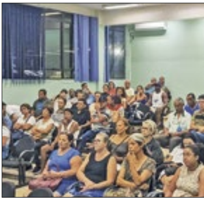
Encontro reuniu comerciantes

A Prefeitura de Três Rios, por meio da secretaria de Serviços Públicos e Agricultura, esteve reunida nesta semana com os feirantes da cidade. O encontro serviu para discutir e dar andamento ao projeto da prefeitura que entregará barracas padronizadas ao grupo. Mais de 65 comerciantes participaram da reunião, a ocasião permitiu que todos os feirantes pudessem articular solicitações, propor alternativas, discutir e ouvir as propostas do poder público.