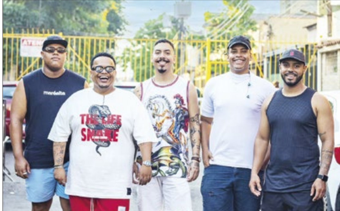
Grupo Chega na Moral será uma das atrações do Baixada em Foco, no Parque do Gericinó

O interesse do cantor pelo pagode começou aos 13 anos. Filho da backing vocal Maristela Failde, comprou um tantã e começou a tocar e compor suas próprias canções, passando a divulgá-las na internet, o que lhe ajudou a fazer