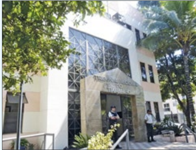
Nova audiência será realizada em maio