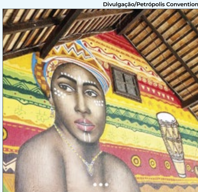
Festa celebra a memória negra em Petrópolis

concreta de que poderá ser colocado em prática. O encontro, que aconteceu no auditório da UNIFASE, em Petrópolis, foi realizado em parceria com o Ministério Público do Estado do Rio de Janeiro, Rede Ser.ra e Vigilantes da Chuva.