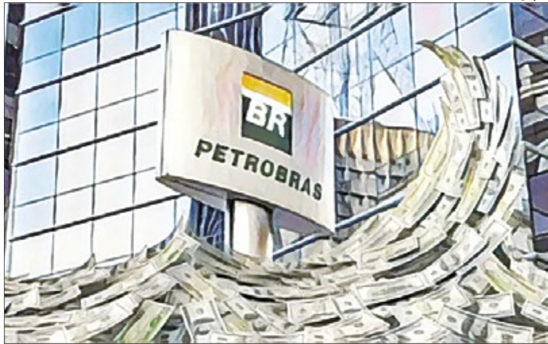
Petroleira volta a levar a sério compromissos firmados junto aos seus acionistas

A determinação da petroleira representa uma reviravolta, só explicável pela urgência do calendário eleitoral, pois esta havia anunciado, ainda no mês passado, que reteria a totalidade da remuneração extraordinária referente a 2023, que