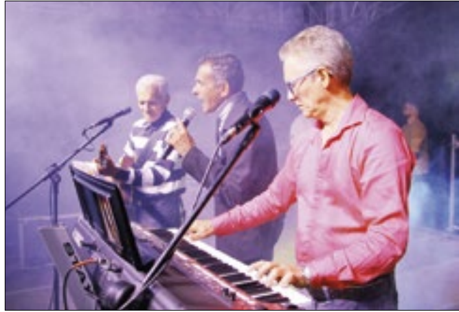
As comemorações seguirão até o dia 1º de maio