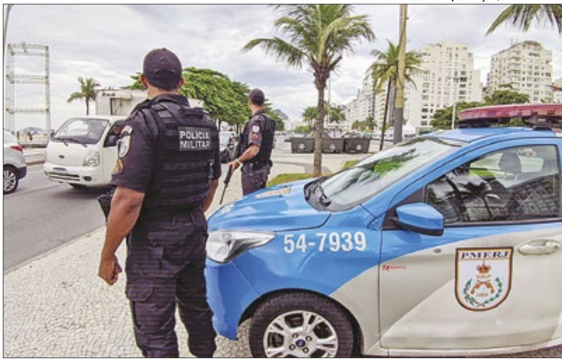
Estado do Rio registrou o menor número de roubos de cargas dos últimos 26 anos

uma. Participaram da ação integrantes das secretarias de Urbanismo, da Cidade Sustentável, de Habitação e Assentamentos Humanos e de Trânsito e Engenharia Viária, juntamente com operários da autarquia de Serviços de Obras de Maricá (Somar), entre outros agentes públicos.