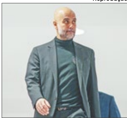
Guardiola quer presidir o Barça

Pep Guardiola revelou que tem planos de ser presidente do Barcelona no futuro. Ele deixou escapar seus planos para o futuro durante uma participação em um documentário sobre Aitana Bonmatí, vencedora do Prêmio Laureus. Aitana expressou o desejo de ser diretora esportiva do Barcelona e de ter Guardiola como técnico. Mas o treinador revelou pensar em se candidatar à presidência dos culés.