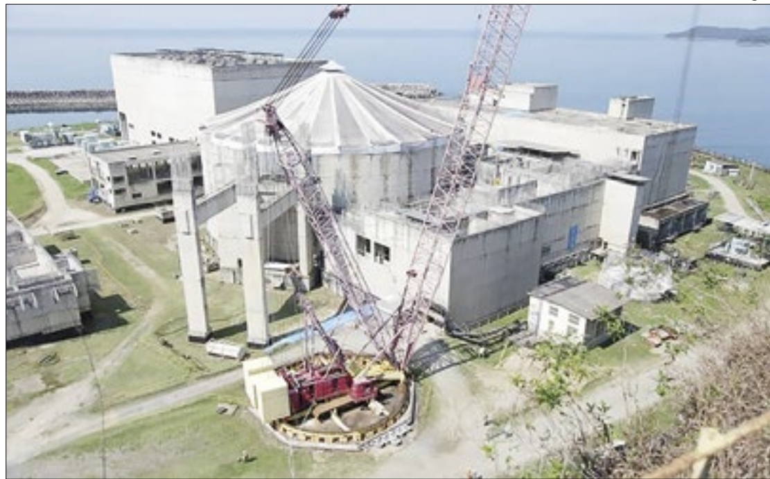
Prazo ampliado é para atender empresas interessadas

A Eletronuclear prorrogou até o próximo dia 17 de maio a consulta pública sobre licitação para conclusão das obras da Usina Nuclear Angra 3. Os documentos da consulta pública continuam disponíveis no site da empresa e são referentes aos serviços de Engenharia, Gestão de Compras e Construção (EPC, em inglês), incluindo a Matriz de Risco e outros complementos contratuais.