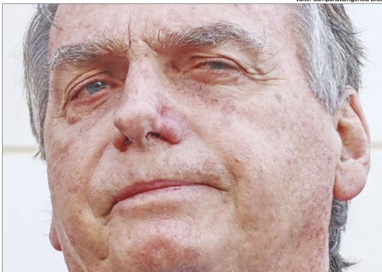
Valter Campanato/Agência Brasil

“Efetivamente, a situação fática permanece inalterada, não havendo necessidade de alteração nas medidas cautelares já determinadas”, concluiu o ministro, que decidiu por manter Bolsonaro proibido de se ausentar do país e de manter contato com investigados pela trama golpista contra o processo eleitoral de 2022.