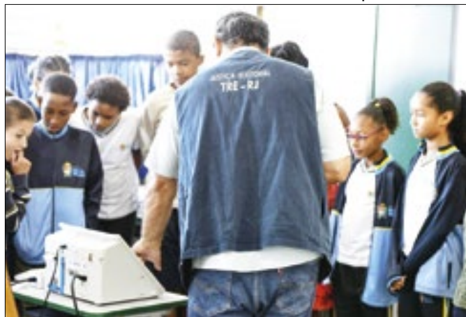
Palestra falou sobre eleições e importância do voto