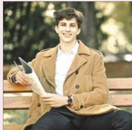
Jovem talento do piano internacional, o croata Jan Nikovich abre nesta quinta o Festival Pianíssimo no Copacabana Palace