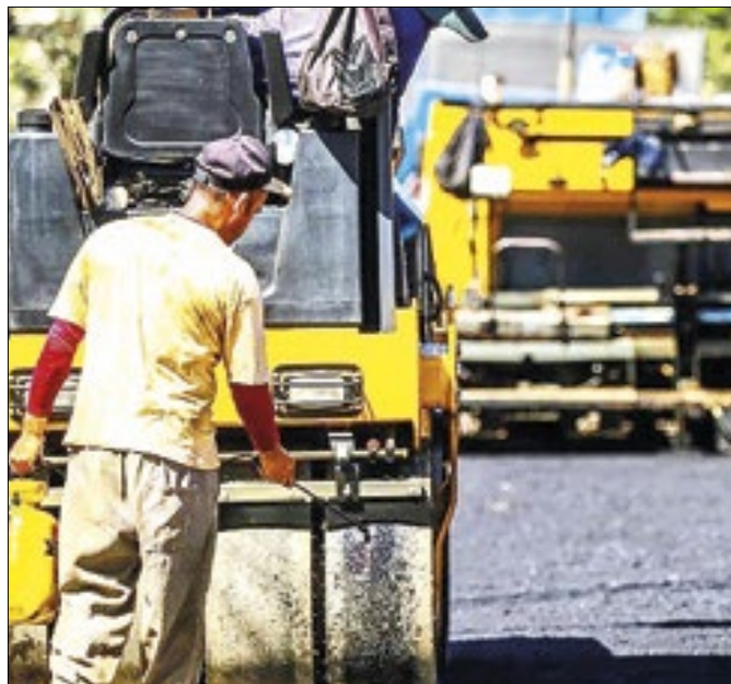
A rua Breno de Souza Alves está em nova etapa do asfalto