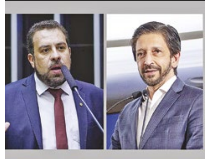
Pesquisa mostra que Boulos e Nunes estão na frente