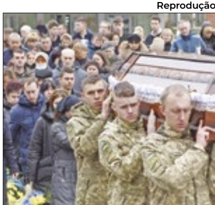
Jogo de azar é rara distração

O presidente da Ucrânia, Volodymyr Zelenski, decretou a proibição de jogos de azar online nas Forças Armadas do país, durante o período do regime da lei marcial. A proibição busca combater as