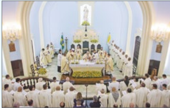
Celebração pelos 75 anos do seminário