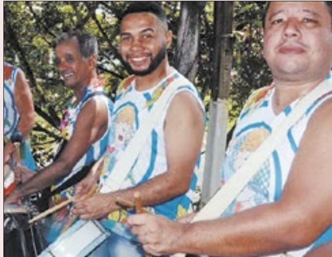
Magé promove diálogo com a comunidade do samba