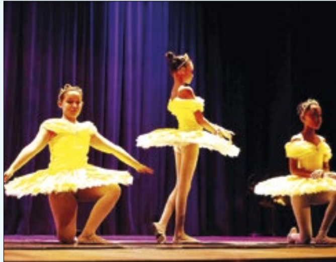
Iniciativa terá participação de profissionais e amadores