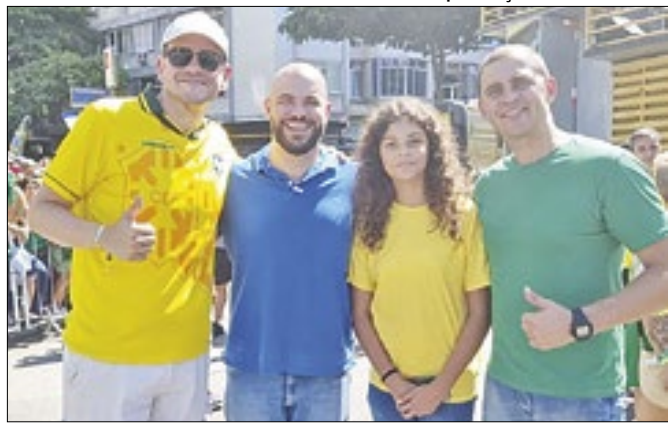
Pré-candidatos à Prefeitura de Petrópolis