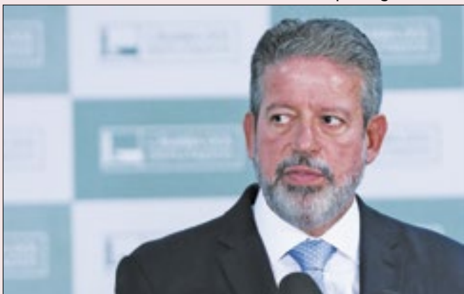
Lira teme desaparecer após presidência