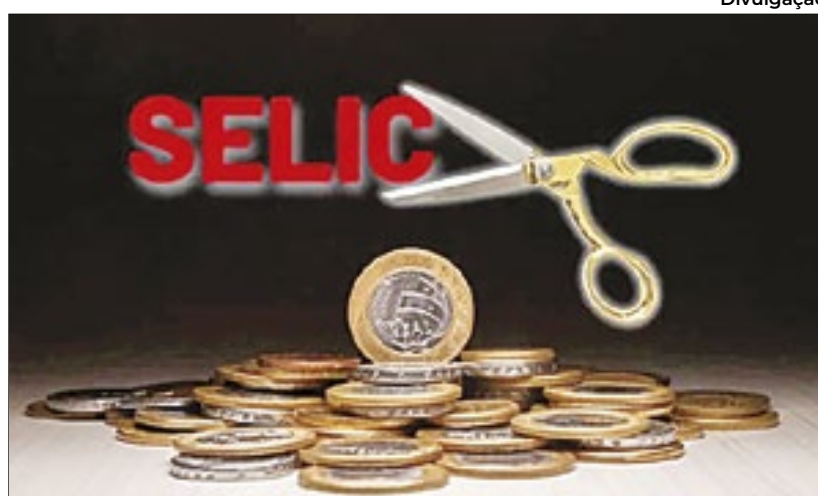
Redução futura da taxa básica 'esbarra' em gastos federais