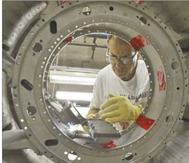
Queda setorial decorre de avaliação negativa da economia

Segundo a escala, que varia de 0 a 100 pontos, valores acima de 50 pontos indicam confiança