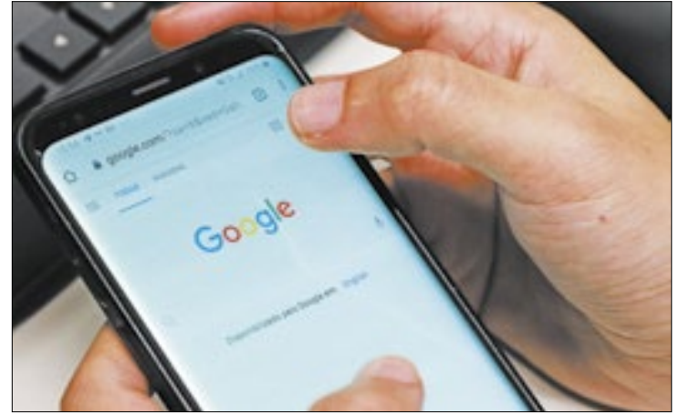
Google irá restringir todo tipo de propaganda política