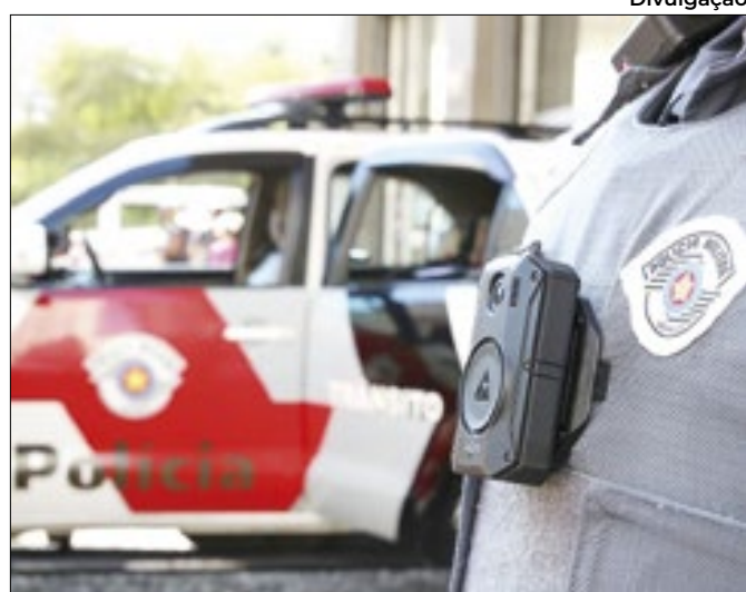
Divulgação Planejamento do Governo para uso dos equipamentos