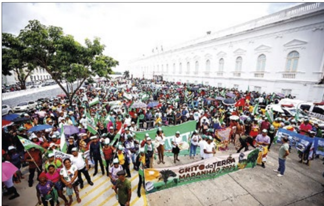
O anúncio de programas e políticas para agricultura familiar do Maranhão

Durante o Grito da Terra Maranhão 2024 (GTM 24), realizado nesta terça-feira (24), o governo do Maranhão anunciou uma série de programas e políticas em apoio à agricultura familiar. O evento, que reuniu milhares de agricultores e agricultoras de todo o estado em São Luís, destacou investimentos nos setores de educação, desenvolvimento econômico e social, além de ações voltadas para a regularização fundiária.