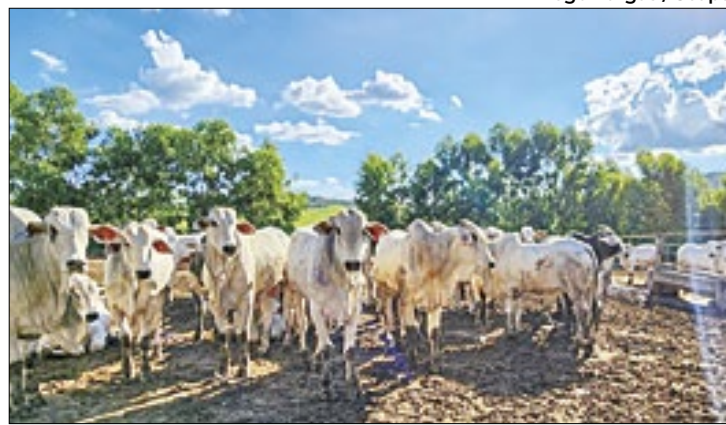
Estado busca chancela de área livre de febre aftosa