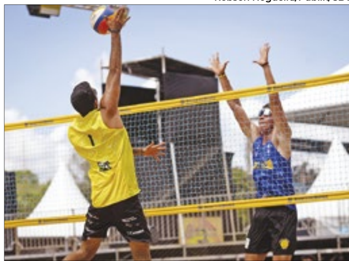
Parque da Cidade recebe torneios de vôlei de praia entre os dias 24 de abril e 5 de maio