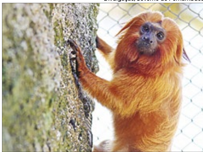
Zoo de Brasília está com uma nova atração. Agora, visitantes poderão conhecer o novo micário do local

TCDF CONTRA O ASSÉDIO MORAL – Pesquisa espontânea realizada nos Tribunais de Contas do país revelou que 35% dos participantes afirmam ter sofrido assédio moral no local de trabalho e quase metade deles (47,6%) disseram ter presenciado outra pessoa da instituição sofrendo com uma conduta abusiva. Ainda segundo a pesquisa, feita pelo Instituto Rui Barbosa, 15,7% dos participantes responderam já ter sofrido assédio sexual na instituição em que atuam e, 21,8% afirmaram já ter presenciado uma pessoa sofrendo assédio sexual.