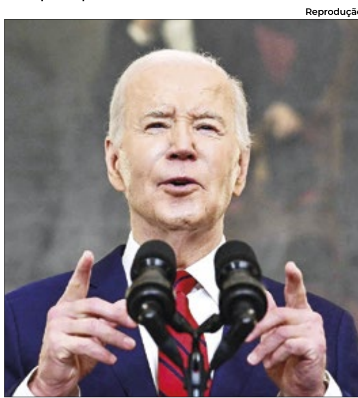
Defensores do veto dizem que TikTok leva risco à segurança nacional dos EUA

defensores do projeto é que a relação da China com a ByteDance pode trazer riscos à segurança nacional, uma vez