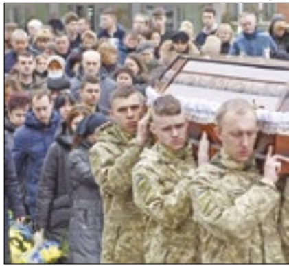
Jogo de azar é rara distração

O presidente da Ucrânia, Volodymyr Zelenski, decretou a proibição de jogos de azar online nas Forças Armadas do país, durante o período do regime da lei marcial. A proibição busca combater as