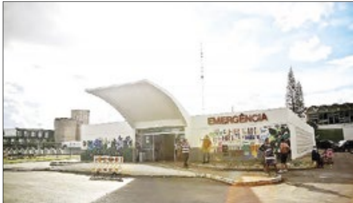
Gestante morreu após ter atendimento recusado