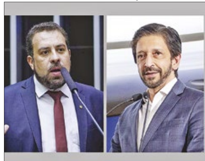
Pesquisa mostra que Boulos e Nunes estão na frente