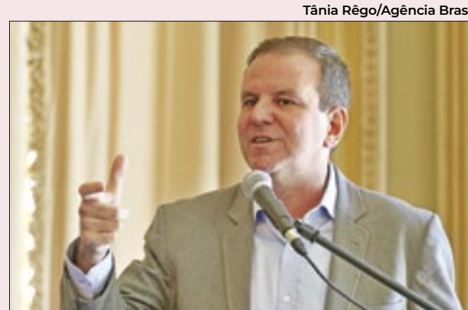
Prefeito do Rio venceria no segundo turno

Preferido por 76,2% dos paulistanos que votaram em Bolsonaro, Nunes não pode abrir mão desses eleitores, mas tenta emplacar a imagem de um síndico, menos ligado a questões ideológicas. Até porque, lá, o ex-presidente perdeu a disputa para Lula em 2022.