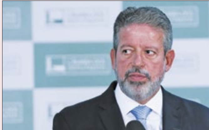
Lira teme desaparecer após presidência