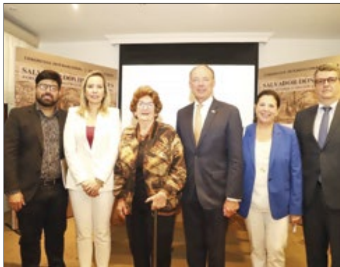
Embaixadores destacam potencial turístico da Bahia