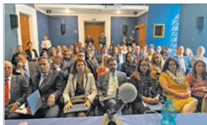
Curso "Combate ao Crime Organizado - Novos Paradigmas na Era da Hiperconectividade"

quentes os episódios de quebras e até mesmo incêndio em veículos da Nova Faol. Mesmo com tantos problemas, a empresa ainda vai operar no município por pelo menos dez anos. O contrato de concessão foi assinado no mês passado pelo prefeito Johnny Maycon.