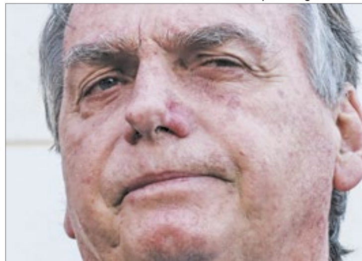
Ex-presidente passou dois dias na embaixada, em Brasília

“Efetivamente, a situação fática permanece inalterada, não havendo necessidade de alteração nas medidas cautelares já determinadas”, concluiu o ministro, que decidiu por manter Bolsonaro proibido de se ausentar do país e de manter