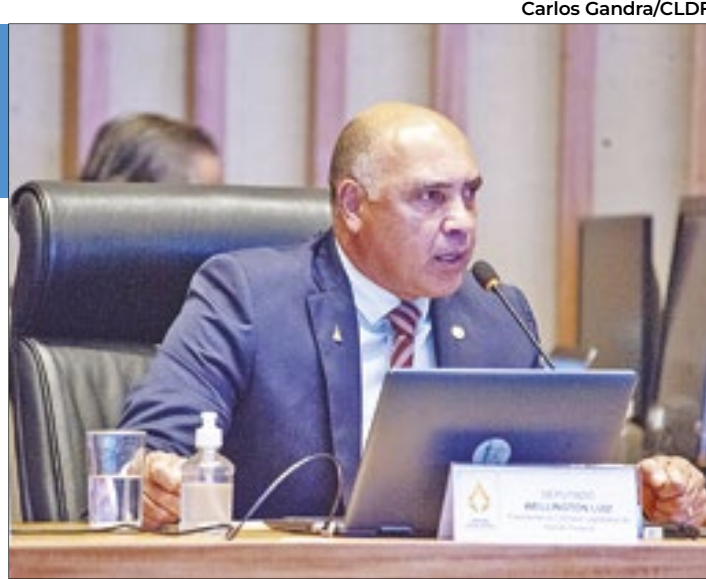
Presidente da Câmara Legislativa do Distrito Federal (CLDF), deputado Wellington Luiz (MDB)

A proposta é de autoria do deputado Wellington Luiz (MDB) e adequa o DF ao calendário nacional. Também facilita a vida dos servidores que até então precisavam trabalhar no feriado do dia 1º de janeiro para a realização do evento de posse. O texto agora deve aguardar 10 dias de interstício para a votação em segundo turno.