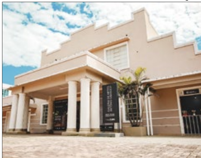
Edifício de 1938 já foi sede da prefeitura do município