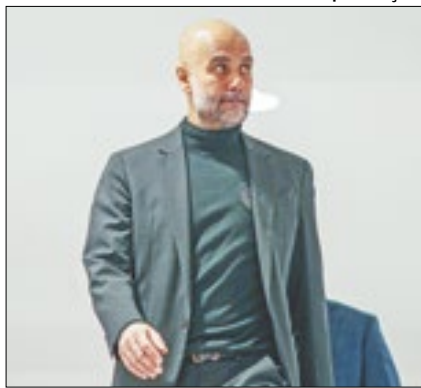
Guardiola quer presidir o Barça

Pep Guardiola revelou que tem planos de ser presidente do Barcelona no futuro. Ele deixou escapar seus planos para o futuro durante uma participação em um documentário sobre Aitana Bonmatí, vencedora do Prêmio Laureus. Aitana expressou o desejo de ser diretora esportiva do Barcelona e de ter Guardiola como técnico. Mas o treinador revelou pensar em se candidatar à presidência dos culés.