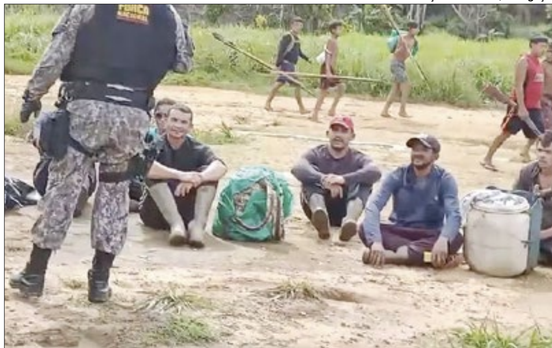
Indígenas conduziram 12 garimpeiros até os agentes da Força Nacional

Além disso, a Terra Yanomami, com 9,6 milhões de hectares, enfrenta surtos de malária e desnutrição entre os indígenas. A situação levou o território a entrar em estado de