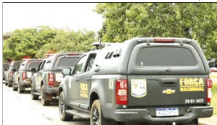
Grupo atuará na segurança externa do presídio federal