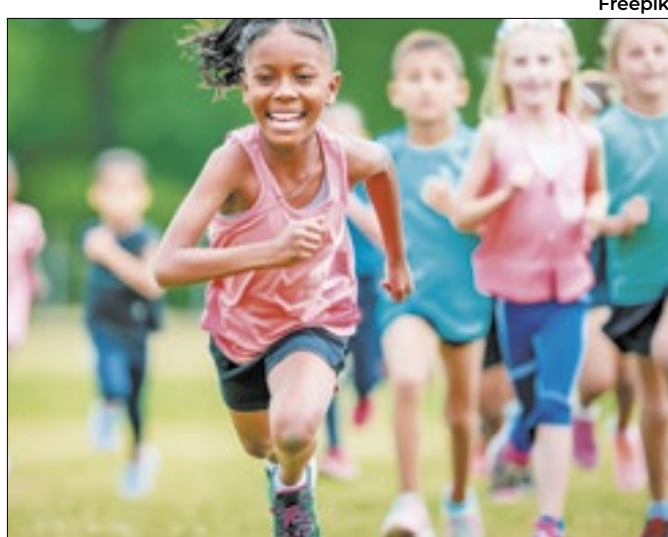
Dados são da Sociedade Brasileira de Pediatria (SBP)