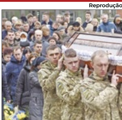
Jogo de azar é rara distração

A polícia foi acionada após dez minutos da saída deles. A fuga aconteceu durante um exercício, como confirmou o exército britânico. Há relatos de colisão entre os bichos e carros. Um deles foi visto coberto de sangue.