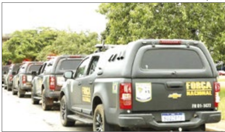
Grupo atuará na segurança externa do presídio federal