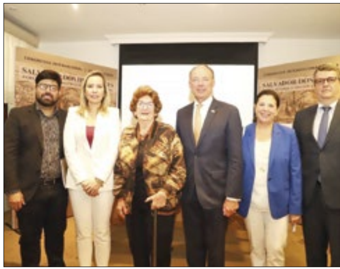
Embaixadores destacam potencial turístico da Bahia