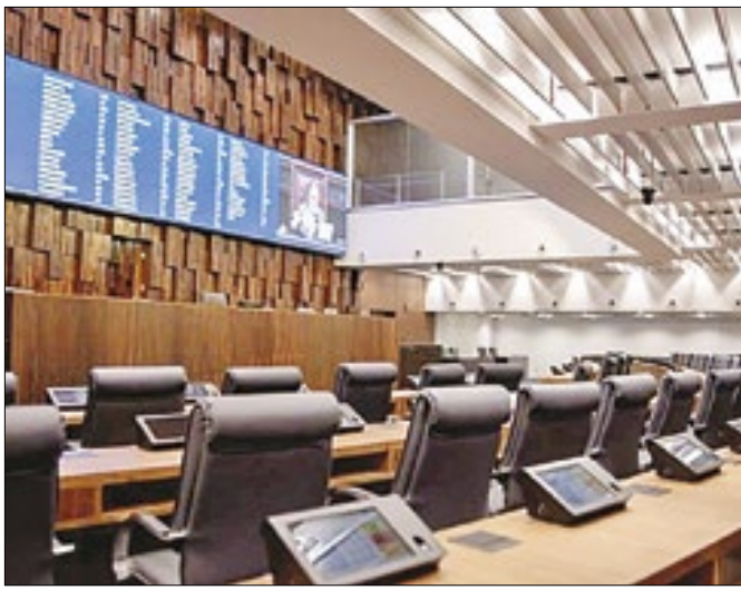
Plenário da Assembleia Legislativa do Rio