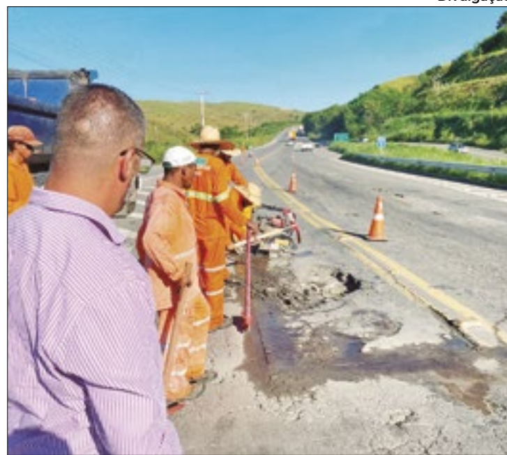
Obras recuperam asfalto e sinalização em rodovia

“A manutenção da Rodovia do Contorno é uma luta antiga nos nossos mandatos no legislativo. Viemos relatando, periodicamente, ao DNIT, que em poucos anos de uso a