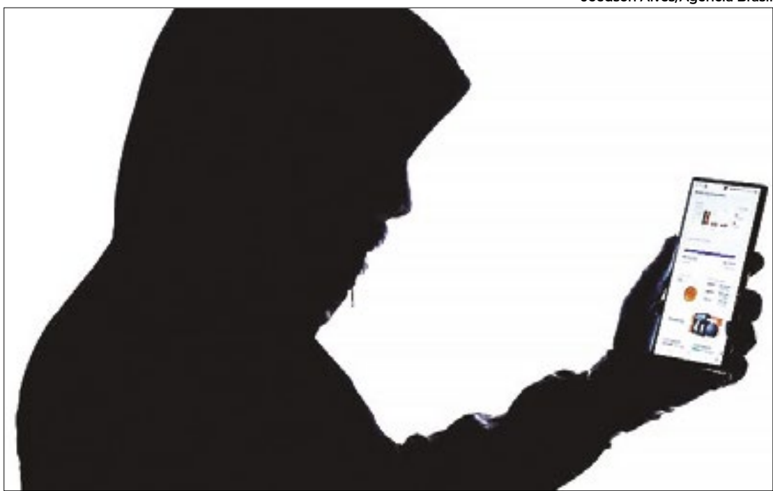
Foram registrados 18.065 casos de janeiro a fevereiro de 2024, um aumento significativo