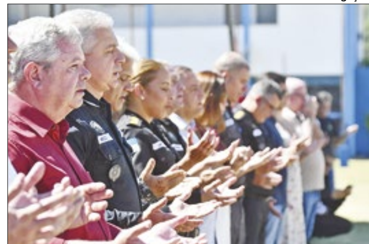
Missa e procissão marcaram o dia de São Jorge em Niterói