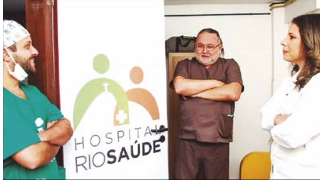
Programa já atendeu mais de 800 pacientes em diversas modalidades cirúrgicas

"Nosso propósito é atender e acabar com esse sofrimento. A saúde pública tem que ser atendida de forma diferenciada. Uma paciente que tem indicação de histerectomia, por exemplo, fica sofrendo com sangramentos e dores por muito tempo, isso precisa