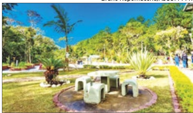
O Horto ocupa uma área de 10 mil metros quadrados