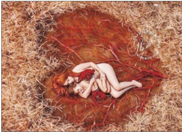
Graziela Bragança foi premiada no concurso Encontro Nacional Fotografia de Família

O concurso aconteceu no início deste ano, mas o evento com