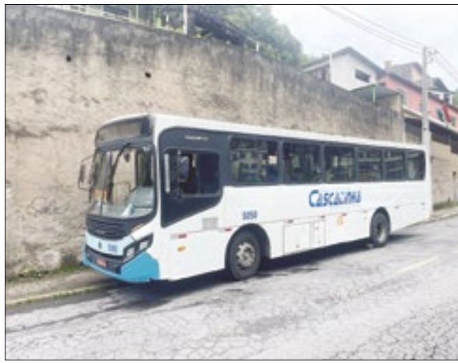
Empresa atente mais de 30 linhas em Petrópolis