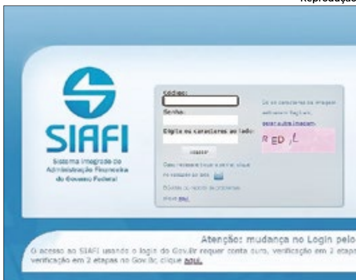
Página de entrada do Siafi do governo federal

Até o momento, a investigação aponta que ao menos 16 senhas de servidores foram utilizadas por terceiros não autorizados, utilizando CPFs e até mesmo se-