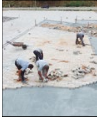
Espaço social e sustentável

Recentemente, a Prefeitura de Levy Gasparian iniciou a obra de construção da Praça Ecológica no bairro Reta. No local a equipe realiza a instalação do piso intertravado. A praça será um local onde a população terá contato com a natureza, com várias espécies de plantas e árvores. Para a diversão, será construída uma área kids, outra de convivência e academia da saúde diferenciada. No local também será implantado um espelho d'água e um espaço para exposição de artesanato.