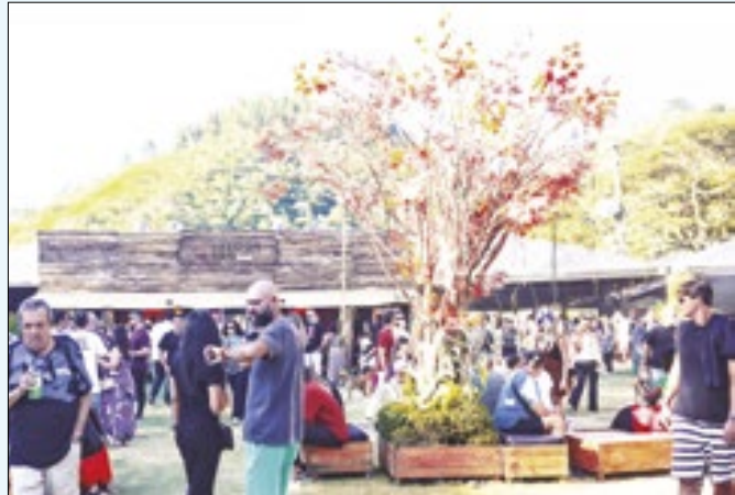
Saloon BBQ está em sua quarta edição em Itaipava