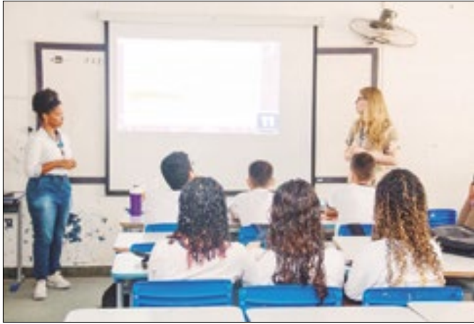
Alunos assistem palestra em colégio na Praia do Frade