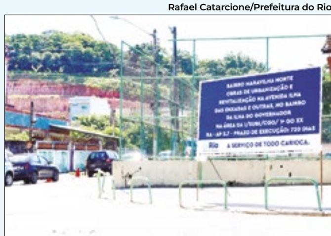
Rafael Catarcione/Prefeitura do Rio

postos funcionam das 8h às 16h. Os candidatos devem levar RG, CPF, PIS e currículo para fazer a inscrição. Pessoas com deficiência têm a opção de enviar o currículo para o e-mail vagaspcd.smte@gmail.com ou comparecer ao CIAD.