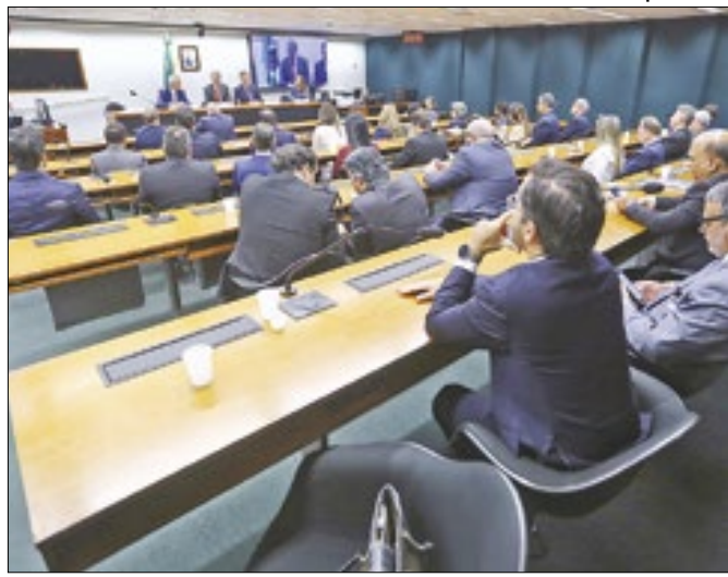
Projetos já tramitam na Comissão de Tributação