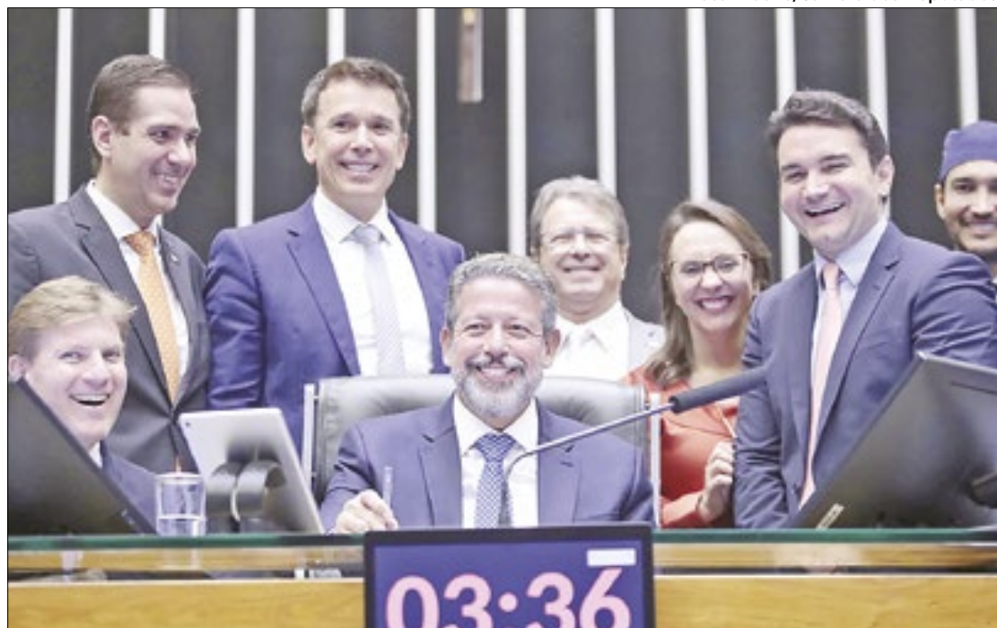
Lira e deputados comemoram aprovação do Perse

deu a importância da manutenção do projeto para garantir até 2026 a proteção do turismo nacional. “Quando a gente fala do Perse, a gente não fala de um benefício, falamos do setor que mais foi impedido de funcionar durante a pandemia de covid-19. E que foi o setor que, no último ano, mais gerou emprego para o Brasil”, defendeu a deputada.