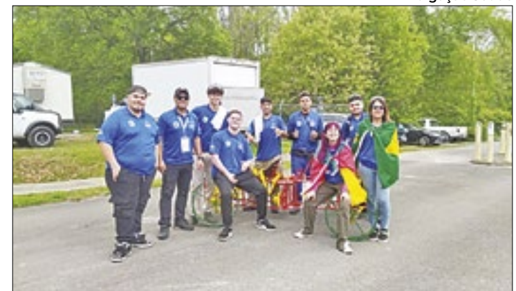
Equipe de Bagé conquistou o segundo lugar no Pit Crew