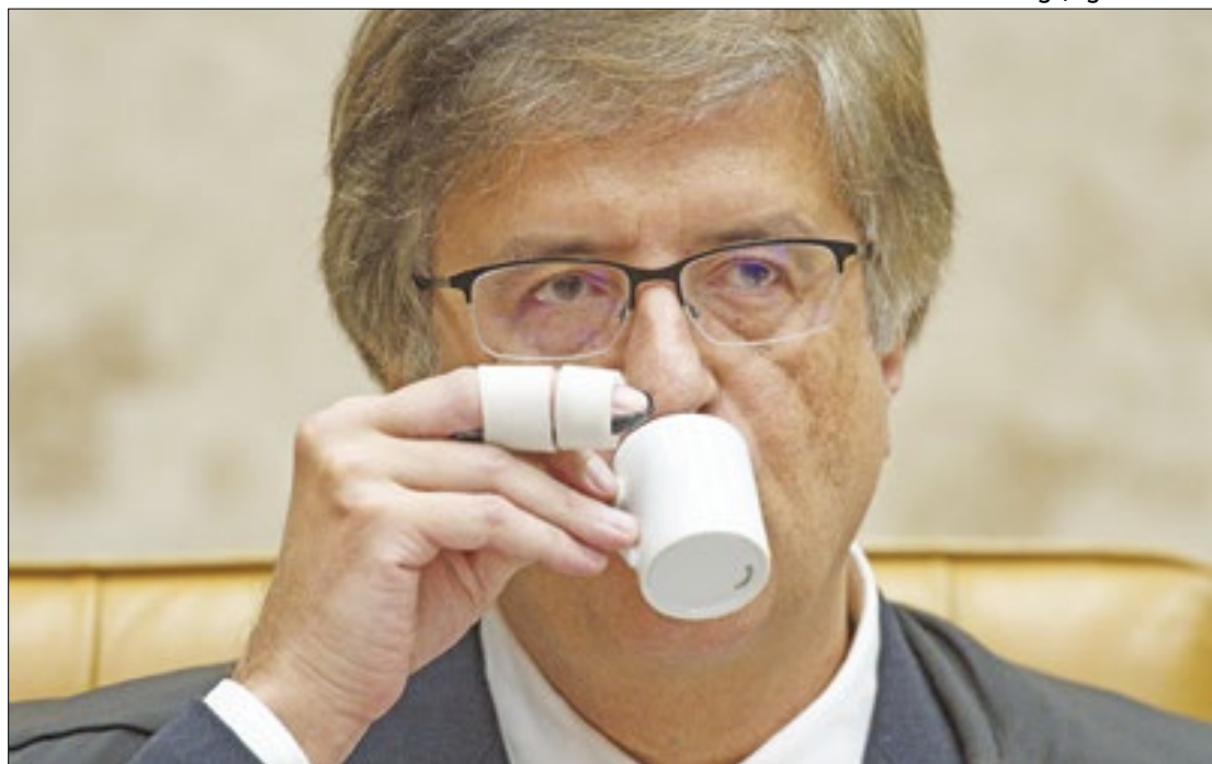
Gonet: cautela sobre eventual acusação

diu mais apuração da polícia. “É relevante saber se algum certificado de vacinação foi apresentado por Jair Bolsonaro e pelos demais integrantes da comitiva presidencial, quando da entrada e permanência no território norte-americano. Ao menos seria de interesse apurar se havia, à época, norma no local de entrada da comitiva nos EUA impositiva para o ingresso no país da apresentação do certificado de vacina de todo estrangeiro, mesmo que detentor de passaporte e visto diplomático. A notícia é relevante para a avaliação dos tipos penais incidentes no episódio”, escreveu Gonet.