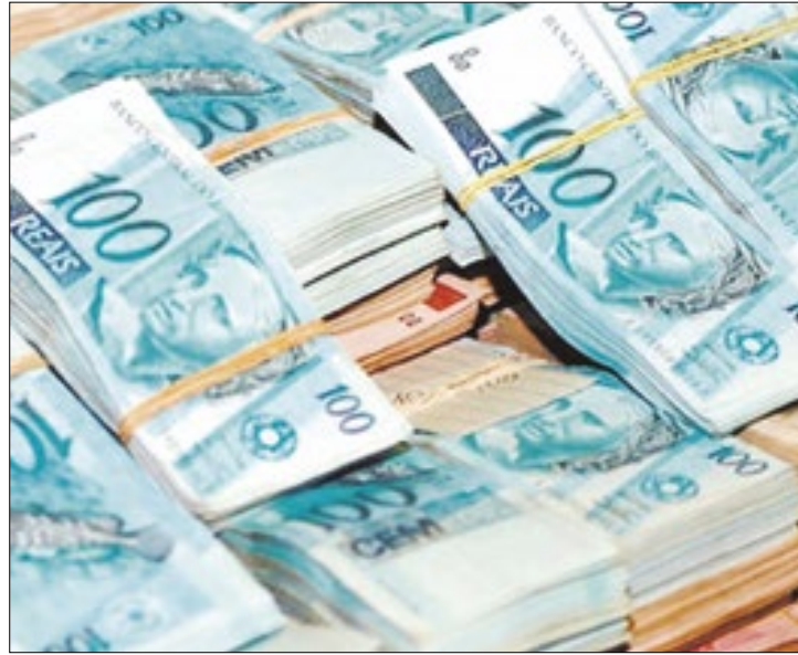
Aperto tributário crescente determinou alta da arrecadação

Entre os fatores para o desempenho favorável, o Ministério da Fazenda destacou o retorno da tributação do PIS/Cofins sobre combustíveis e pela tributação de fundos exclusivos, conforme prevê a Lei 14.754, de 12 de dezembro de 2023. No caso específico