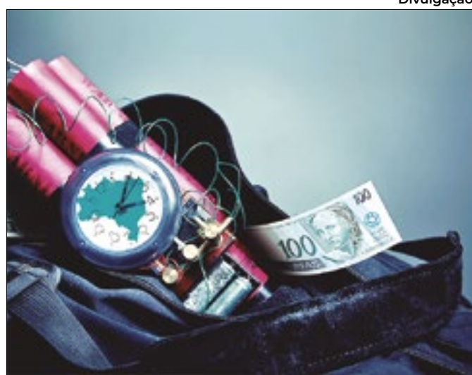
Questão pendente dos precatórios data dos anos 80

Enquanto IPCA sobe para 3,71%, Selic vai a 9,5% a.a. e PIB atinge 2,02%