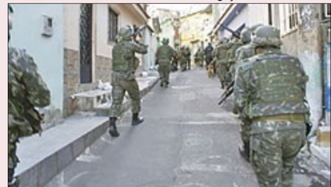
Contratação ocorreu durante operação na Maré