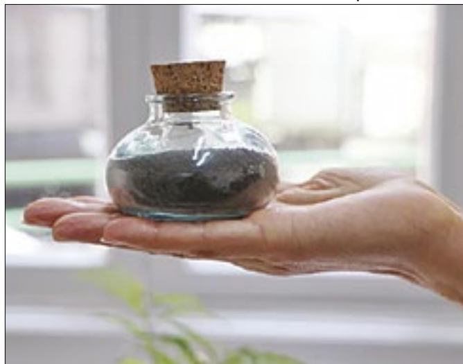
Contribuição promove estudos de fenômenos naturais