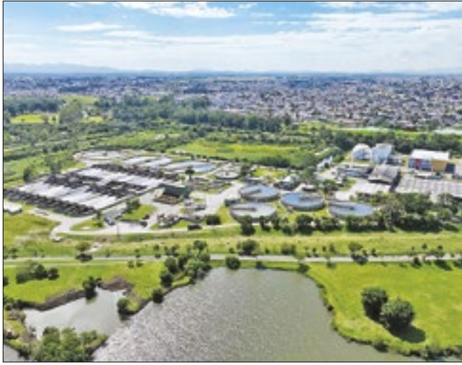
Sanepar avança na entrada no mercado livre de energia