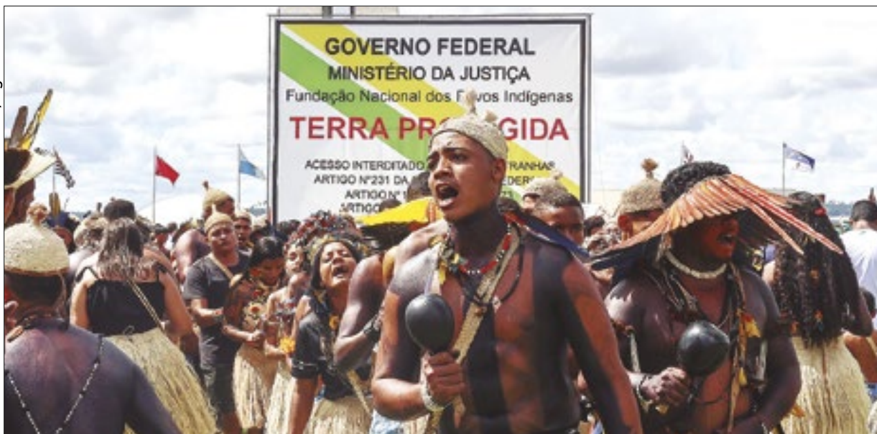
Tribos vão acampar no Congresso Nacional para pressionar a discussão do projeto

A 20ª edição do Acampamento Terra Livre (ATL), maior mobilização indígena do país, trouxe novamente à tona a discussão sobre o Marco Temporal da demarcação de terras indígenas. Esse é o principal tema e palavra de ordem do