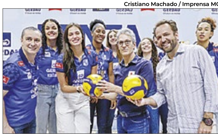
As campeãs da Superliga Feminina de Vôlei

Além dessa conquista, ela é responsável por atender inúmeras ocorrências de salvamento.