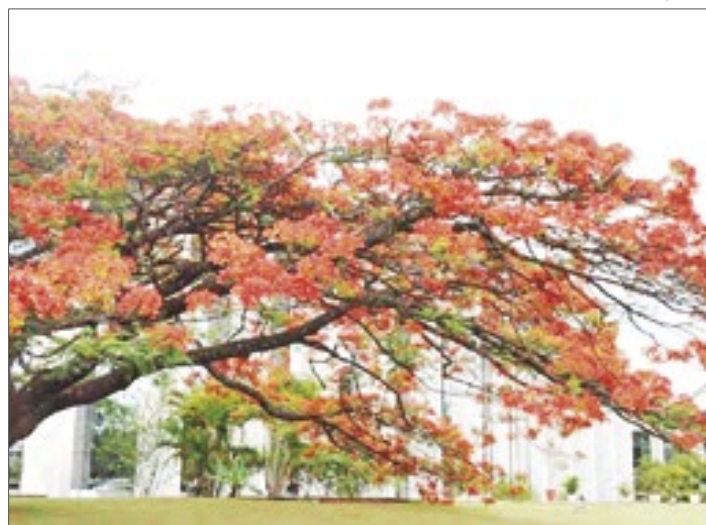
Flamboyant do TJDF foi imortalizada através do artista Rafael Cerqueira que doou um quadro para o tribunal

o quadro “Flamboyant do TJDF”, uma tela de 110 x 80 cm, na técnica acrílico sobre tela. A árvore tombou em setembro de 2021 após uma luta contra fungos em seu tronco.