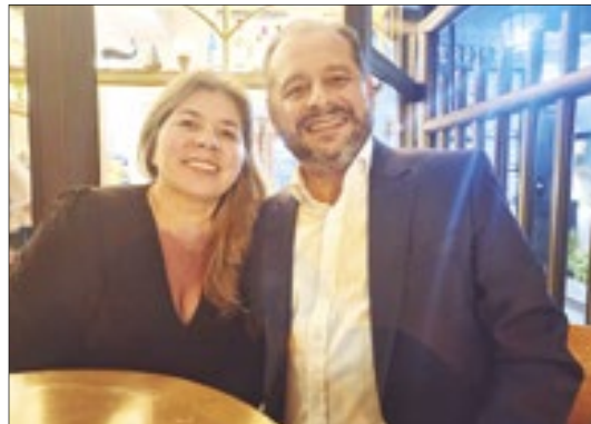
Adilson Faria, secretário de Estado de Planejamento e Gestão, e sua esposa