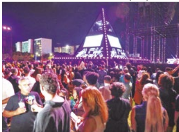
Alok arrastou multidão para a Esplanada dos Ministérios, sem registro de incidentes graves