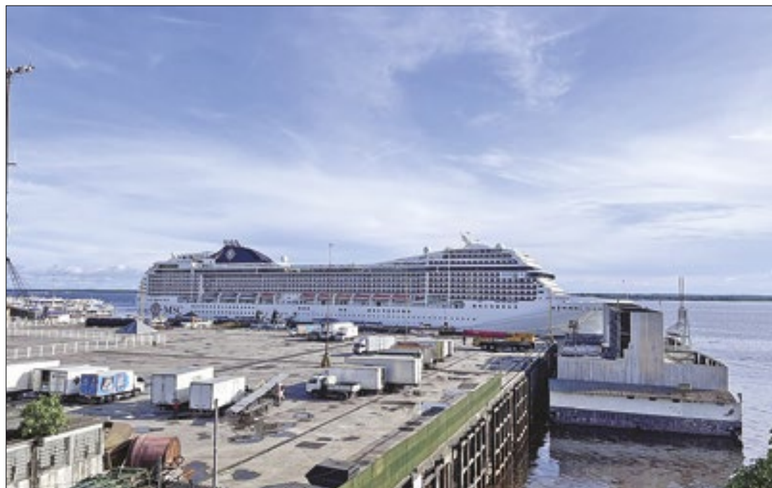
Entre 2023 e 2024, 17 navios passaram por Manaus, dos quais quatro estrearam na cidade

registrou o maior impacto econômico na história de Manaus, com mais de 23 mil turistas. O fluxo de estrangeiros gerou uma receita de cerca de R$ 20 milhões. Além disso, os navios movimentaram aproximadamente R$ 7 milhões em serviços diversos, o que totalizou uma movimentação econômica de quase R$ 139 milhões. Em contraste, a temporada anterior (2022-2023) gerou uma movimentação estimada em R$