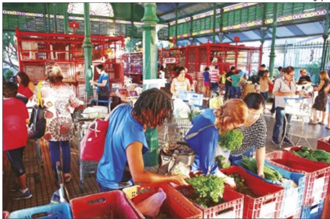
Piora fiscal está bem precificada, mediante o avanço da inflação e dos juros

De acordo com dados divulgados, nesta terça-feira (23), pelo boletim Focus, de igual forma, também cresceu a expectativa em relação ao PIB (Produto Interno Bruto), que manteve a trajetória ascendente, passando de 1,95% para 2,02%, ante à perspectiva de alta de 1,85%, há quatro