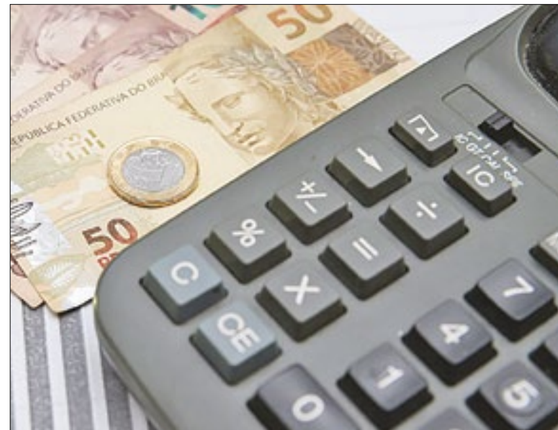
Questão pendente dos precatórios data dos anos 80