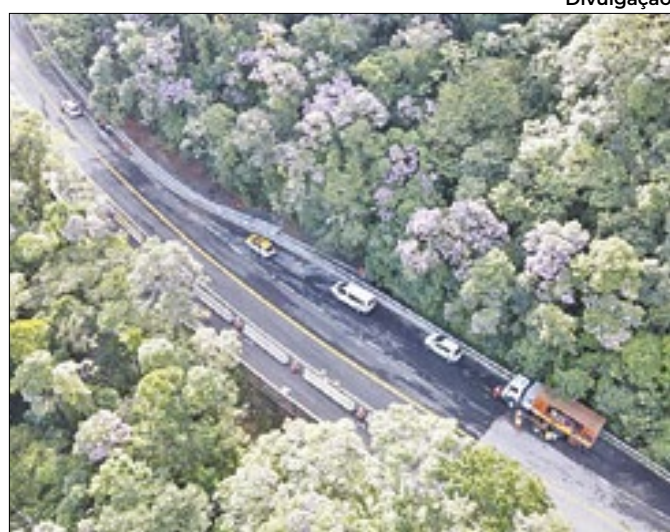
Obras previstas na PPP vão melhorar os acessos a Mogi