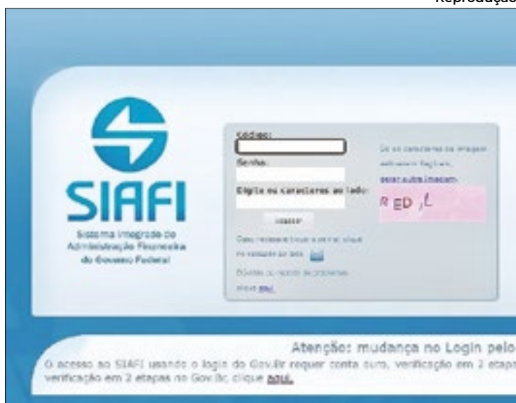
Página de entrada do Siafi do governo federal

Até o momento, a investigação aponta que ao menos 16 senhas de servidores foram utilizadas por terceiros não autorizados, utilizando CPFs e até mesmo se-