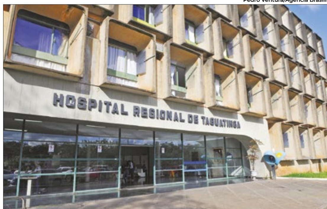
Após ter atendimento recusado no Hospital Regional de Taguatinga, grávida morreu

Um lobo-guará invadiu uma casa em Naviraí (MS), a 360 quilômetros de Campo Grande, no centro da cidade. O animal chegou a ir até a cozinha da residência e, em seguida, correu para o banheiro, assustado. O lobo-guará foi resgatado pela Polícia Militar Ambiental (PMA).