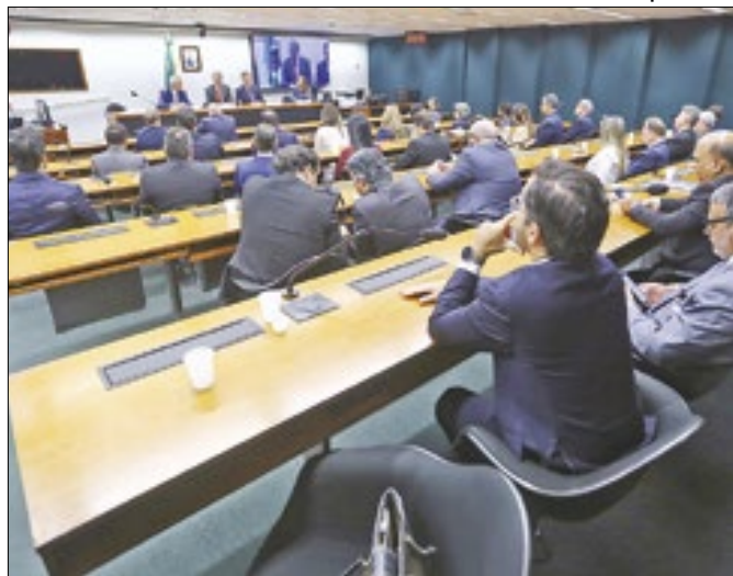
Projetos já tramitam na Comissão de Tributação