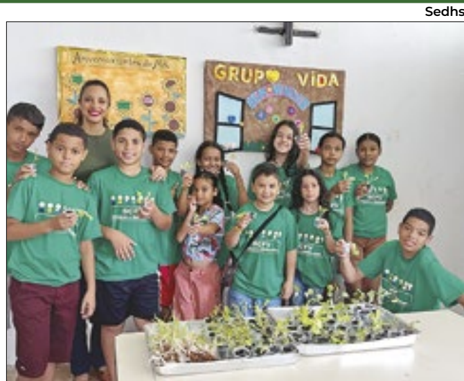
São atendidos crianças e adolescentes, de 7 a 14 anos

Um bebê e uma mãe morreram; familiares alegam negligência