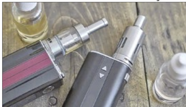
Órgãos devem recolher dispositivos em desacordo com a lei