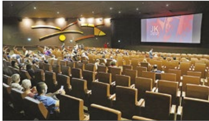
Cinema brasileiro será divulgado na Mostra Ocupação