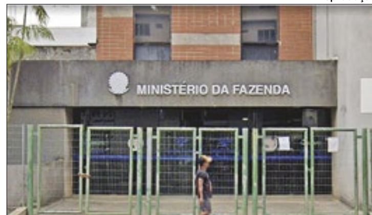
Dupla escalou grade para roubar os fios das câmeras