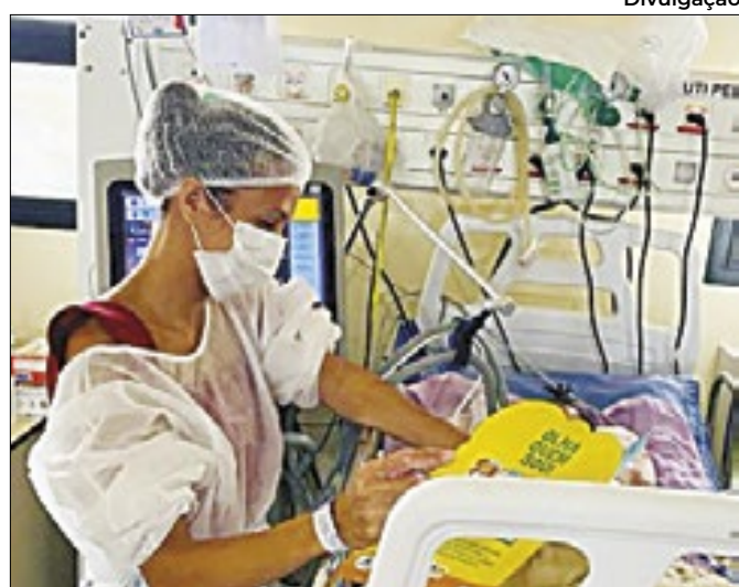
Pais e filhos fortalecem os laços em pediatria