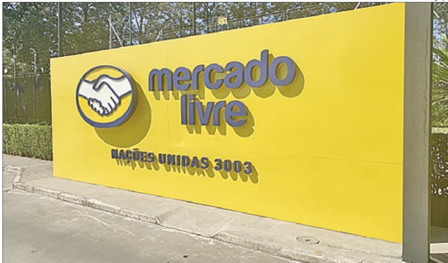
Em encontro com governador de São Paulo, Mercado Livre assina aporte de investimentos bilionários no estado

O Estado de São Paulo terá um aporte de investimentos significativos esse ano. Aliás, não só significativo mas um verdadeiro recorde de R$ 1 bilhão de reais vindos da gigante do varejo online, o Mercado Livre. O anúncio do novo investimento no estado aconteceu na última terça-feira (23), no Palácio dos Bandeirantes na capital paulista. Após a reunião entre o governador Tarcísio de Freitas e autoridades da gestão paulista com Fernando Yunes, vice-presidente sênior e líder do Mercado Livre no Brasil, e executivos da gigante latino-americana de comércio eletrônico e serviços financeiros, o martelo dos novos investimentos da gigante que planeja ampliar ainda mais sua capilaridade no país foi batido. “A diversificação da economia de São Paulo ganha um impulso ainda maior neste ano com a confirmação do investimento recorde do Mercado Livre em nosso estado. Estes R$ 8 bilhões representam a confiança de uma das maiores plataformas globais de tecnologia na transformação digital e nas medidas de desburocratização que