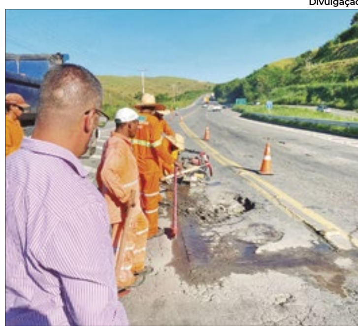
Obras recuperam asfalto e sinalização em rodovia

"A manutenção da Rodovia do Contorno é uma luta antiga nos nossos mandatos no legislativo. Viemos relatando, periodicamente, ao DNIT, que em poucos anos de uso a