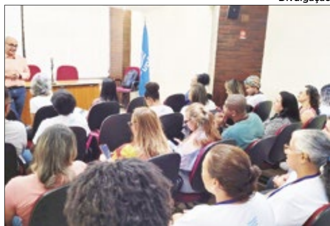
Evento reuniu profissionais e alunos da Firjan SENAI