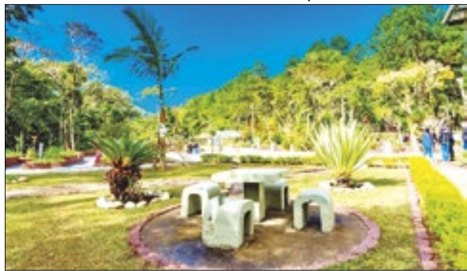
O Horto ocupa uma área de 10 mil metros quadrados