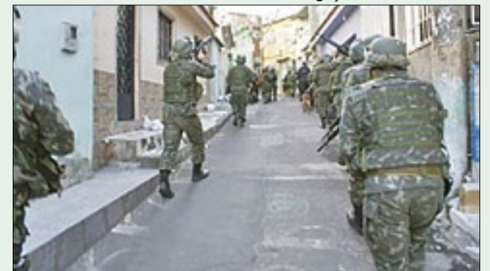
Contratação ocorreu durante operação na Maré