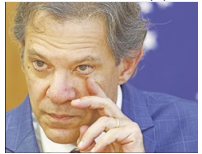
Haddad participou da reunião que definiu o texto