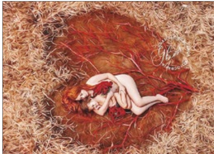
Graziela Bragança foi premiada no concurso Encontro Nacional Fotografia de Família

O concurso aconteceu no início deste ano, mas o evento com