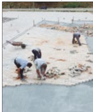
Espaço social e sustentável

Recentemente, a Prefeitura de Levy Gasparian iniciou a obra de construção da Praça Ecológica no bairro Reta. No local a equipe realiza a instalação do piso intertravado. A praça será um local onde a população terá contato com a natureza, com várias espécies de plantas e árvores. Para a diversão, será construída uma área kids, outra de convivência e academia da saúde diferenciada. No local também será implantado um espelho d'água e um espaço para exposição de artesanato.