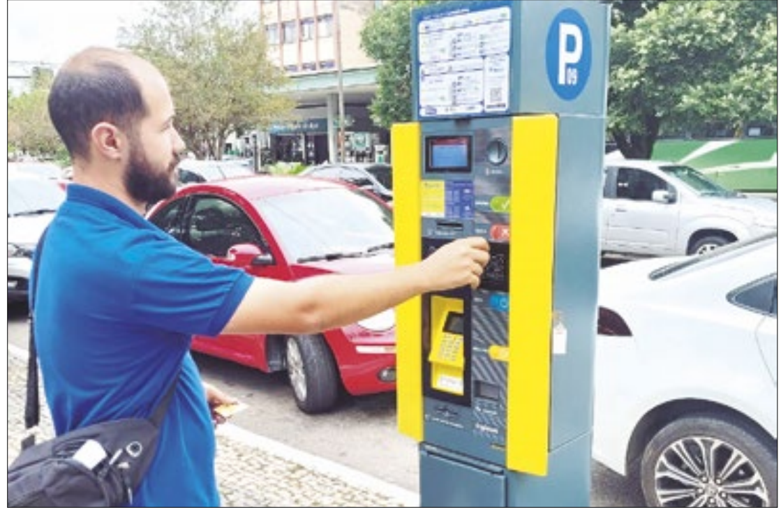
Parquímetros voltam às ruas da Vila Santa Cecília, Amaral Peixoto e Aterrado

Os novos parquímetros aceitarão como forma de pagamento cartões de crédito e de débito, além das tradicionais moedas. Os equipamentos contam com um painel demonstrando a forma de usar. No final da operação, um ticket é emitido, comprovando o pagamento realizado.