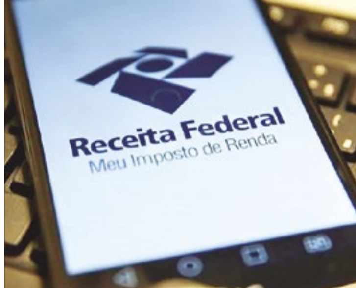
Contribuintes devem ficar atentos em links enviados na época da declaração do IR

Com a temporada de declaração do Imposto de Renda em pleno vapor, os contribuintes precisam estar em alerta não apenas para garantir a precisão das informações enviadas ao leão, mas também para se proteger dos golpes cada vez mais sofisticados, que de maneira falsa, usam o nome da Receita Federal para roubar informações pessoais e financeiras dos contribuintes.