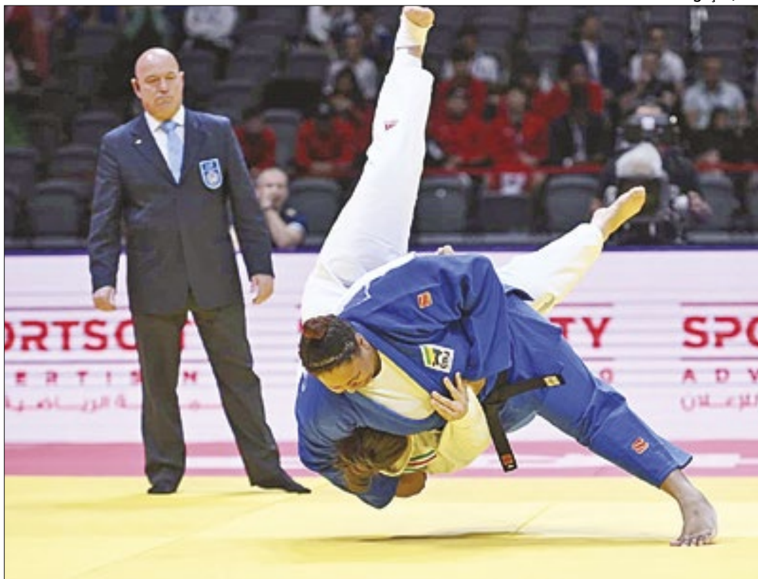
Campeonato vale vaga para os Jogos Olímpicos Paris 2024

ões, locais assim também criam cidadãos fortes que aprendem sobre valores como amizade e respeito ao próximo. É bom estar numa casa onde há acesso a esporte de qualidade", afirmou o medalhista de ouro nas Olimpíadas de Barcelona, em 1992.