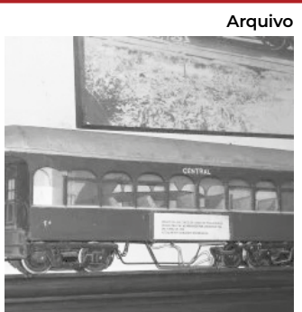
Museu Ferroviário de Miguel Pereira