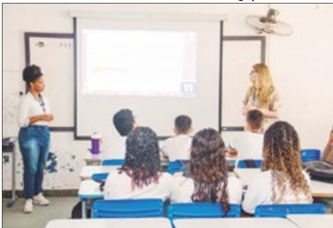
Alunos assistem palestra em colégio na Praia do Frade