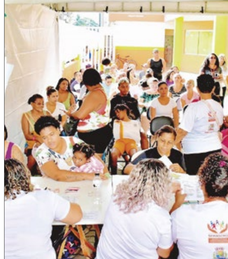
Belford Roxo realizou mais uma edição do Cidadania em Ação

Os serviços disponibilizados foram: Cadastro Único, Bolsa Família, isenção da segunda via da identidade; certidão de nascimento e certidão de casamento, certificado militar, certidão de óbito, retificação de certidões, casamento civil, cartão do SUS, vaga legal, passe interestadual, agendamento Riocard sênior, corte de cabelo, beleza, vacinas, aferição de pressão e glicose, vale social, primeira e segunda via de CPF/retificação, BPC/LOAS, agendamento para carteira de identidade, realização de preventivo, vacina, pesagem