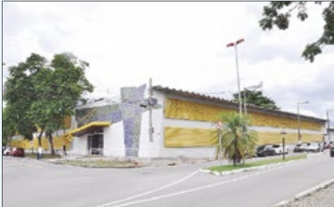
Postos de saúde de Resende participarão de mutirão