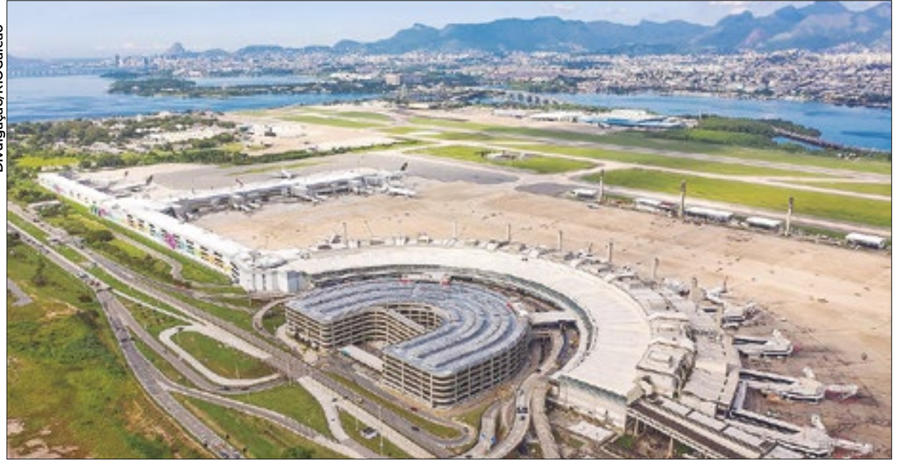
Galeão já identificou aumento das ofertas de voo de Azul e Gol para o início de maio, em virtude do show

O show gratuito da cantora Madonna está chegando ao Rio de Janeiro, e o impacto já pode ser visto nas viagens programadas à cidade. Nos dias próximos à apresentação,