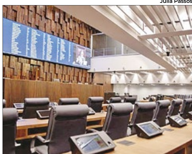
Plenário da Assembleia Legislativa do Rio