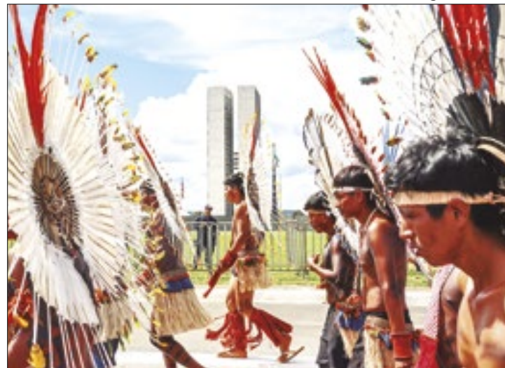
Indígenas marcharam até o Congresso

que a medida pode causar revisões de reservas já demarcadas, para verificar se elas aconteceram depois da Constituição ou não.