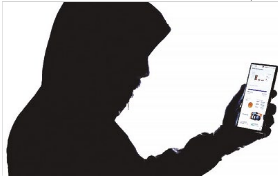
Foram registrados 18.065 casos de janeiro a fevereiro de 2024, um aumento significativo