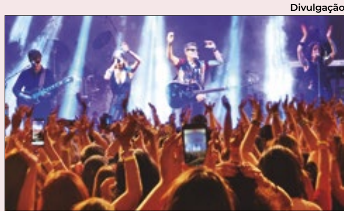
Blitz se apresenta no dia 30/04 em Caxias

do em que deixou de atuar de forma amadora e hoje, já consegue ver os resultados com o crescimento do seu empreendimento. "Estou conseguindo reformular a minha padaria, elaborar produtos diferenciados e principalmente, trabalhar com menos desperdício", declarou.