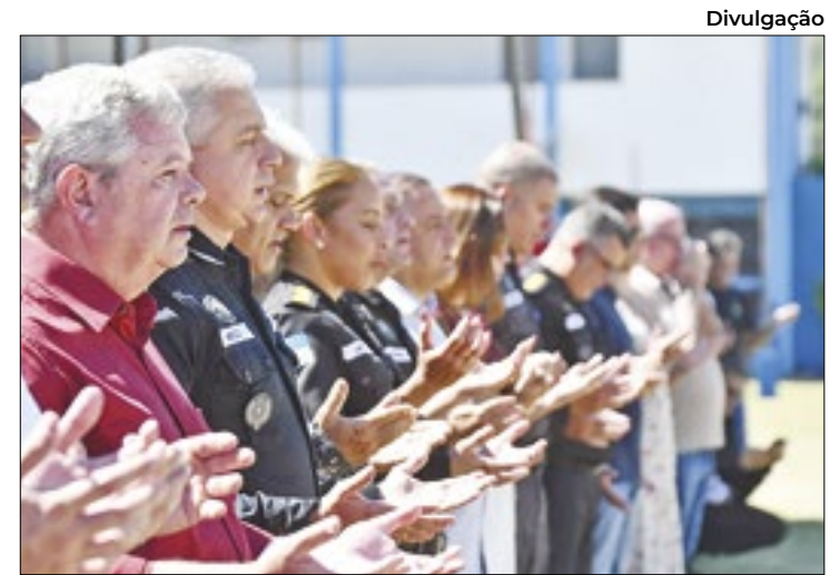
Missa e procissão marcaram o dia de São Jorge em Niterói

“O Cria é um programa criado pela Secretaria de Turismo e Cultura, cujo objetivo é iniciar o cidadão dentro das artes. Com um público diversificado, atendemos desde crianças a idosos. O atual ciclo que se encerra em março atendeu um total de 345 pessoas em três equipamentos de cultura. Foi muito satisfatório poder acompanhar a trajetória dos alunos e sua evolução. Esperamos que, no novo ciclo, ampliemos ainda mais nossas turmas, espalhando arte por toda a cidade”, afirmou.