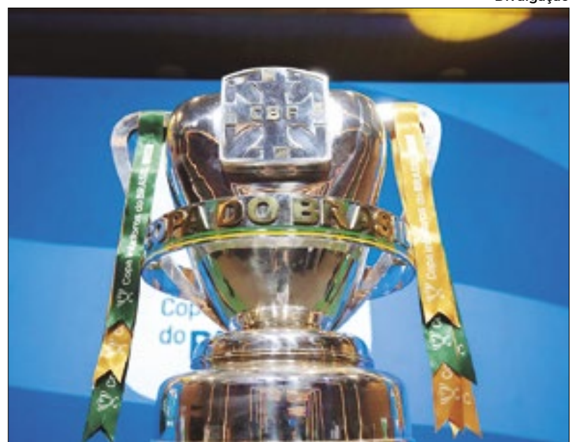
Terceira rodada está programada para o início e fim de maio