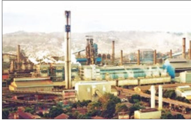
CSN divulgará números do primeiro trimestre de 2024