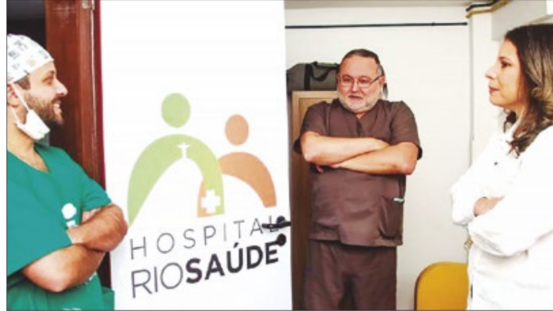
Programa já atendeu mais de 800 pacientes em diversas modalidades cirúrgicas

"Nosso propósito é atender e acabar com esse sofrimento. A saúde pública tem que ser atendida de forma diferenciada. Uma paciente que tem indicação de histerectomia, por exemplo, fica sofrendo com sangramentos e dores por muito tempo, isso precisa