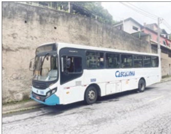
Empresa atente mais de 30 linhas em Petrópolis