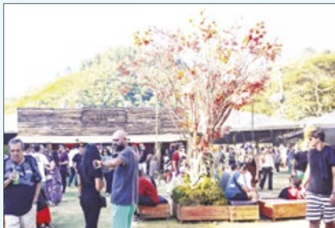
Saloon BBQ está em sua quarta edição em Itaipava