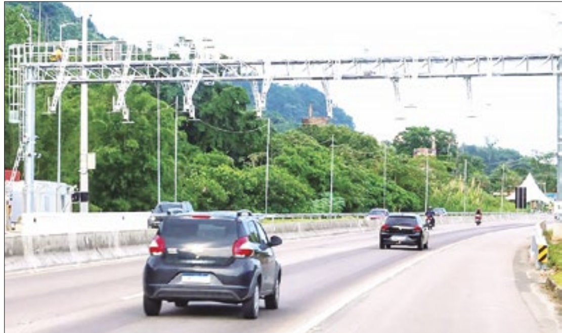
Sistema de cobrança de pedágio automático gera polêmica e justiça suspende multas

A CCR RioSP informou, por meio de nota à imprensa, que adota as providências para prestar os esclarecimentos necessários ao poder judiciário sobre o “bom funcionamento e confiabilidade do sistema do free flow” no trecho da BR-101 (Rio-Santos). A informação foi divulgada por conta de uma liminar que suspendeu, na semana passada, as multas aplicadas contra os cerca de 32 mil usuários da rodovia.