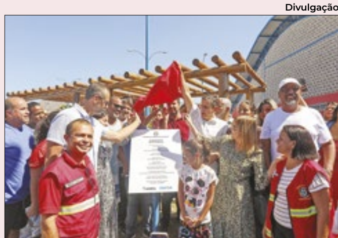
Complexo possui 5.200m² e fica em São Bento da Lagoa

bleia Legislativa do Estado do Rio de Janeiro (Alerj), sancionada pelo governador Cláudio Castro e publicada no Diário Oficial do Executivo, na última sexta-feira (19/04). A medida vale para os documentos de fornecedores de produtos ou serviços e de instituições financeiras e similares.