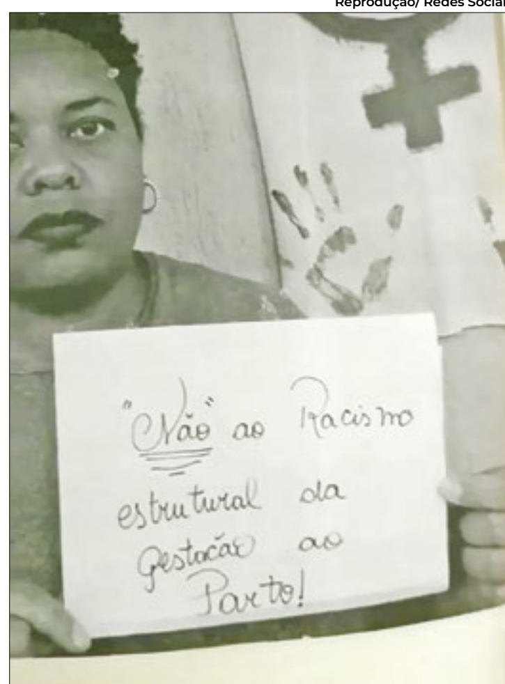
A realidade para mulheres negras nesse cenário é pesada

O Portal de Boas Práticas em Saúde da Mulher, da Criança e do Adolescente, ressalta que adolescentes, mulheres solteiras, de baixo nível socioeconômico, de minorias étnicas, mulheres negras e pobres e as que vivem com HIV são particularmente propensas a experimentar abusos, desrespeito e maus-tratos.