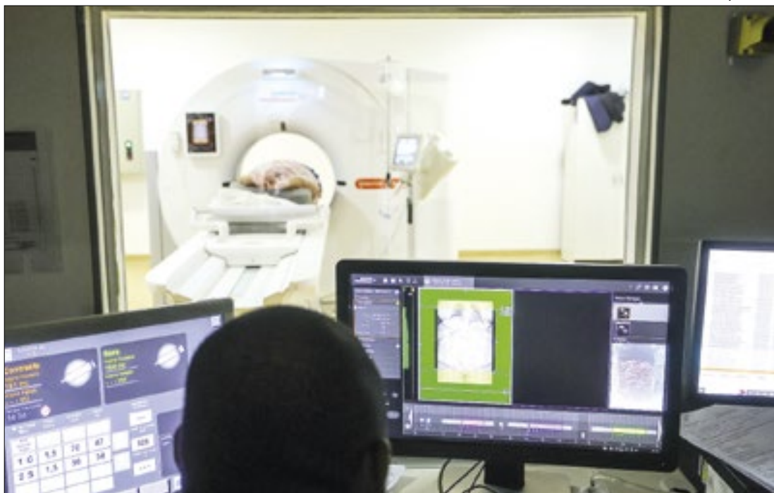
Unidade colabora para que a população possa prevenir ou identificar doenças precocemente

A Prefeitura de Cabo Frio convoca uma nova leva de aprovados do Concurso Público de 2020 que estavam aguardando o exame médico. O edital de chamamento dos 133 candidatos que concluíram a etapa de documentação já está disponível no site oficial do município.