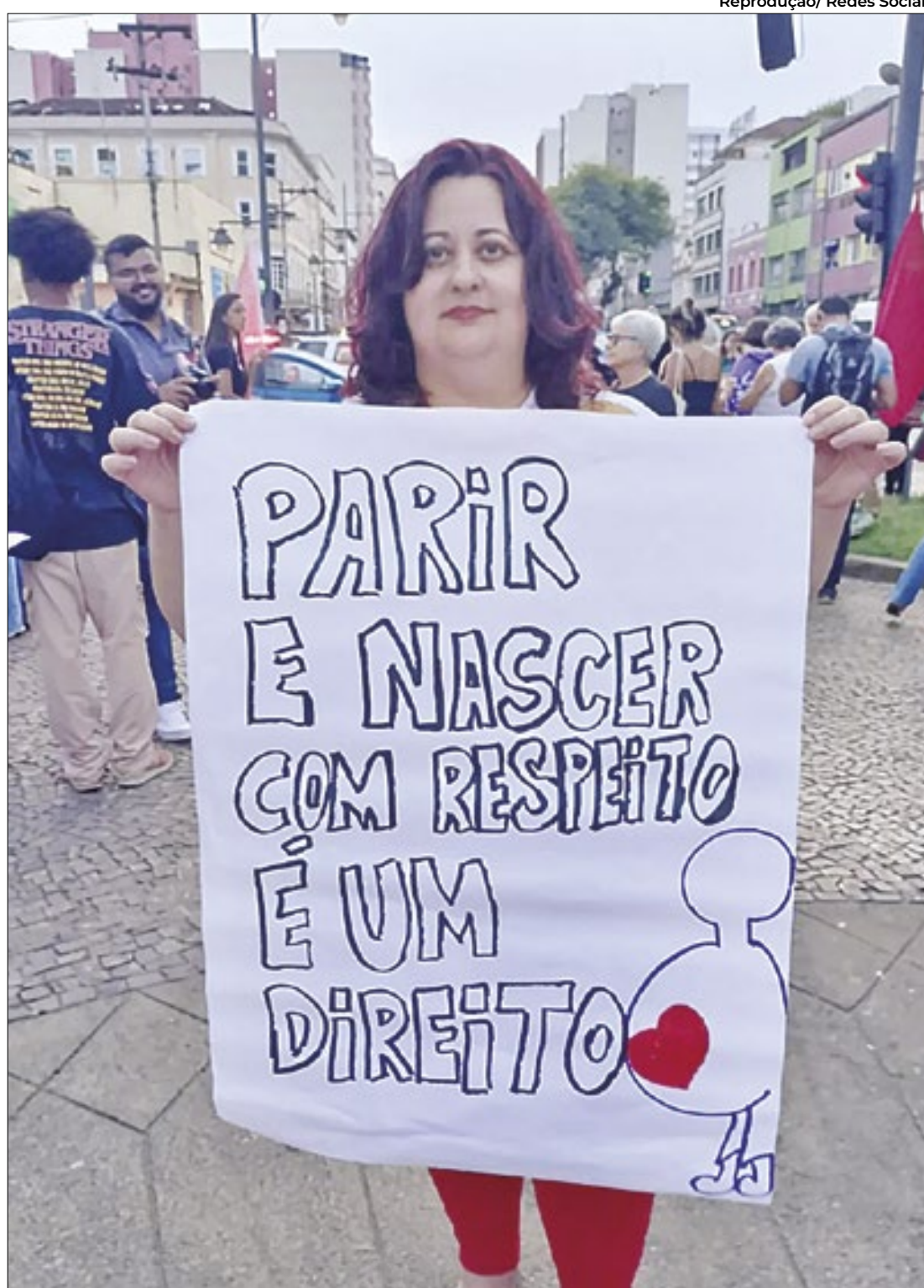
Os efeitos da violência causam traumas e cicatrizes emocionais nas vítimas

“ No mundo inteiro, mulheres sofrem abusos, desrespeito e maus-tratos durante o parto.”