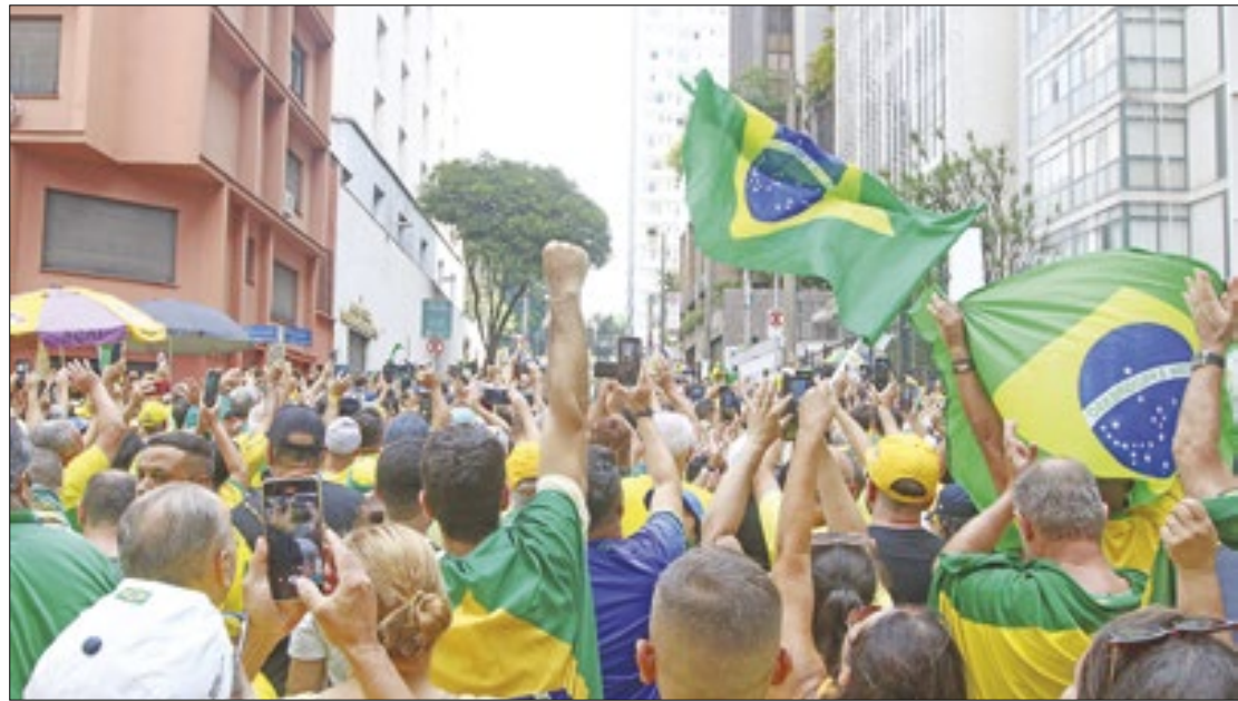
Ato na Paulista em fevereiro reuniu milhares de pessoas