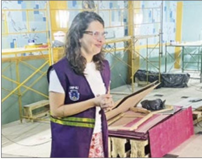
Fiscalização aconteceu na última quarta-feira (17)