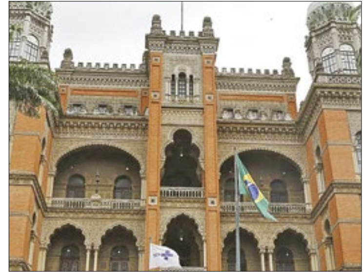
Fiocruz aprova 56 dos 143 projetos para as ações

Feira da Agricultura Familiar Data: Sábado (20/04) Horário: das 8h às 14h Local: Rua dos Lírios, s/n, em frente à Praça do Barroco (Itaipuaçu)