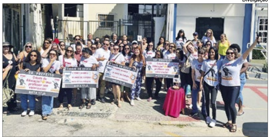
Manifestação foi formada por professores de nível I

A insatisfação dos professores é motivada pelo descumprimento dessas determinações, que foram estabelecidas em 2015 e têm validade até o fim deste ano.