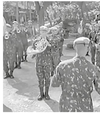
Banda do 32º Batalhão