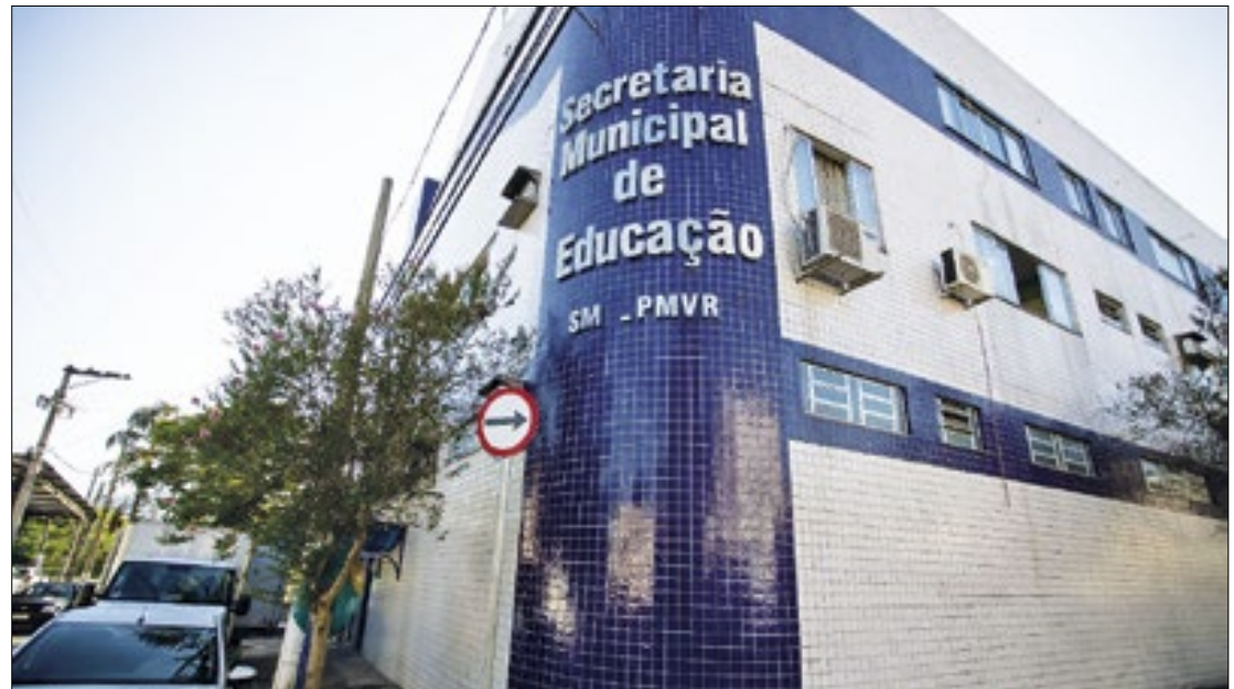
Prefeitura abriu em caráter de urgência contratação de cuidadores na área educacional