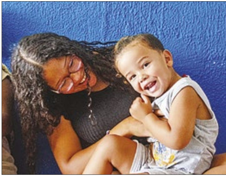
Ação vai permitir o reconhecimento precoce e diferenciado

No mês de conscientização do Autismo, a Prefeitura de Japeri por meio da Secretaria Municipal de Saúde (Semus), realiza parceria com o Complexo Estadual de Regulação (CER) para atendimento e definição do diagnóstico de crianças e adolescentes com suspeita de Transtorno do Espectro Autista (Tea).