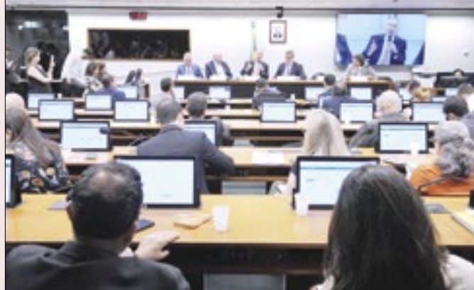
Projetos foram apresentados em comissão da Câmara