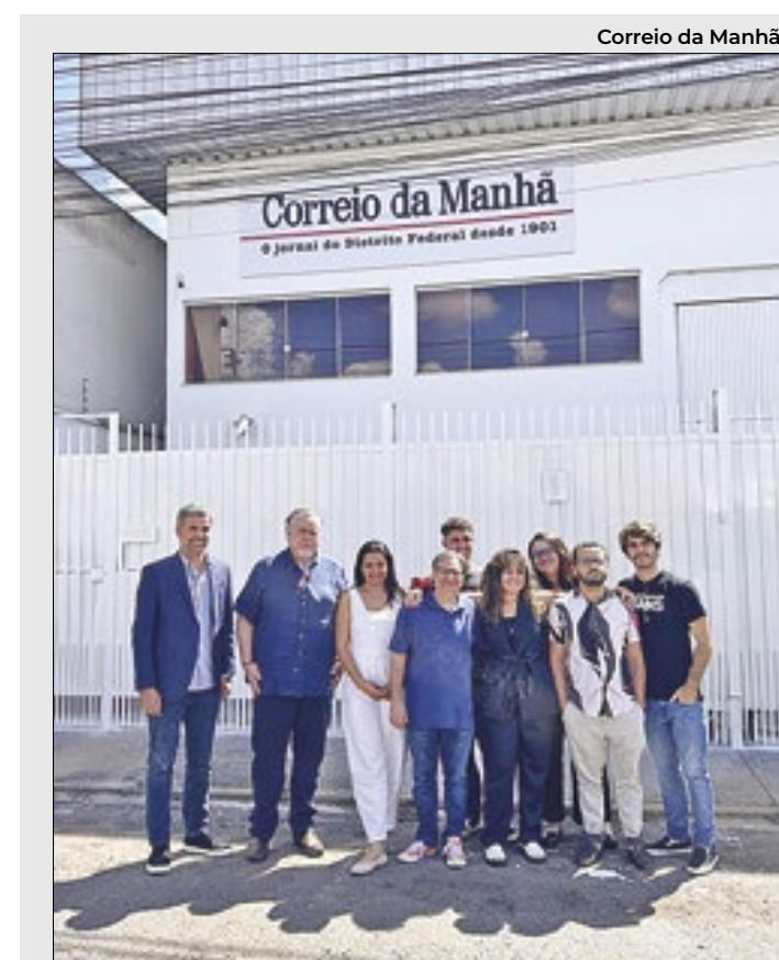
A equipe do Correio, em frente à sede em Brasília