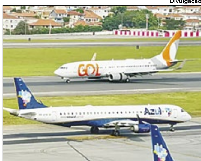
Holding Abra Group serviria como 'fiel' da transação