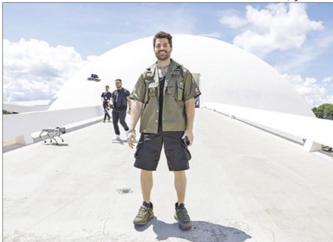
O DJ Alok é a grande atração da festa

No entanto, o ponto alto das comemorações será o aguardado show do DJ Alok, programado para o sábado (20), às 22h. A apresentação única será realizada em um palco em formato de pirâmide, com participações especiais. O DJ aproveitará o momento para lançar seu novo