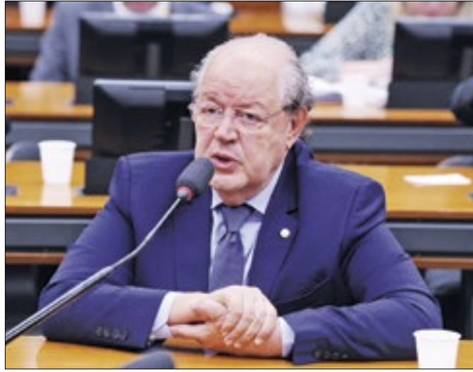
Haully teme que regulamentação saia do controle