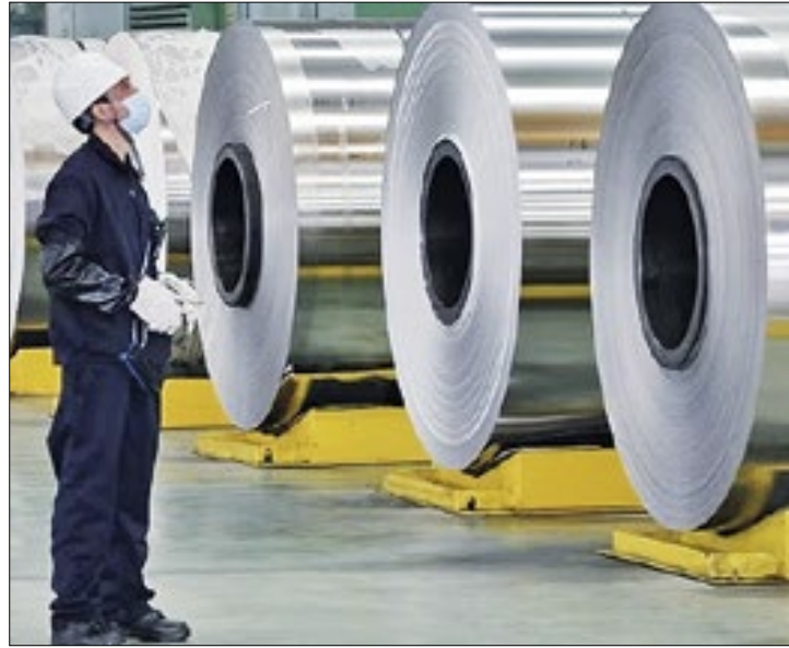
Tributação do aço é questão polêmica ainda sem solução

Formada por dez ministérios, a Camex levará em conta o fato de que um setor inteiro hoje corre o sério risco de fechamento em série de empresas, seguido de demissões em massa. Ao mesmo tempo, a Câmara