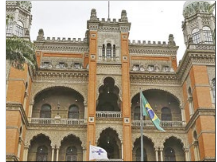
Fiocruz aprova 56 dos 143 projetos para as ações

Feira da Agricultura Familiar Data: Sábado (20/04) Horário: das 8h às 14h Local: Rua dos Lírios, s/n, em frente à Praça do Barroco (Itaipuaçu)