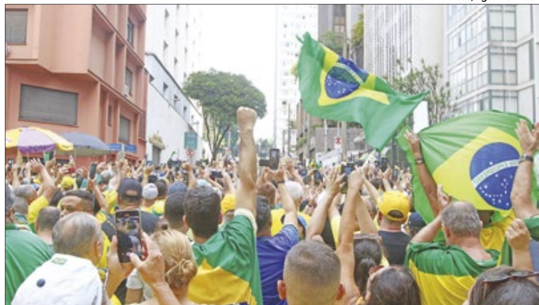
Ato na Paulista em fevereiro reuniu milhares de pessoas

O advogado se referiu ao tenente-coronel Mauro Cid, o coronel do Exército Marcelo Câmara e o ex-assessor de assuntos