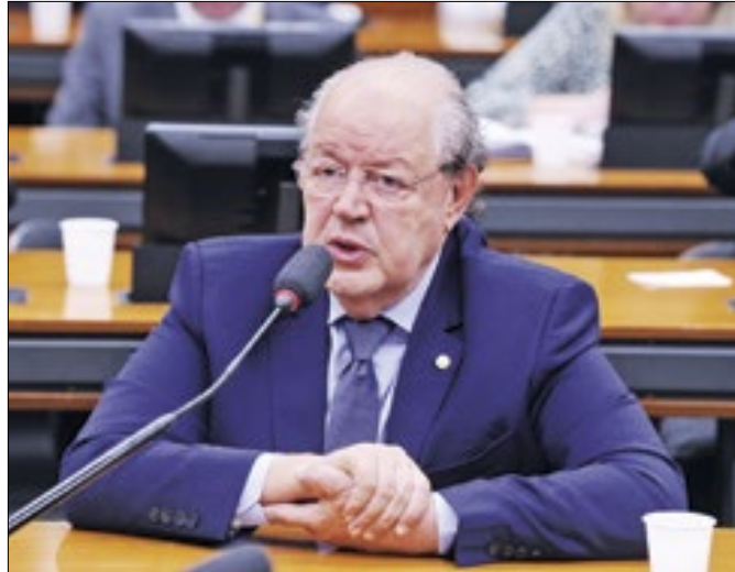
Haully teme que regulamentação saia do controle