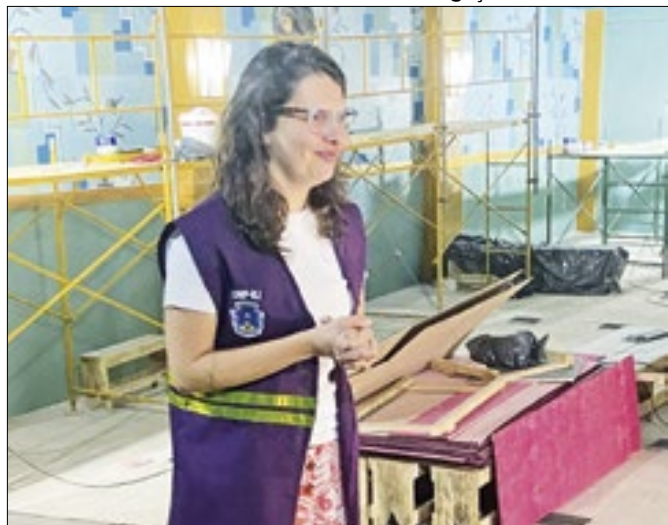
Fiscalização aconteceu na última quarta-feira (17)