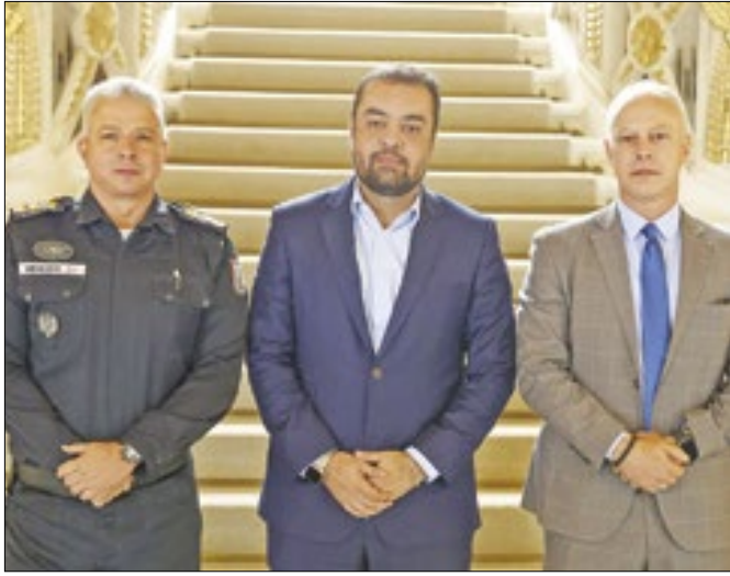
Coronel Marcelo de Menezes (e) é o novo secretário de PM