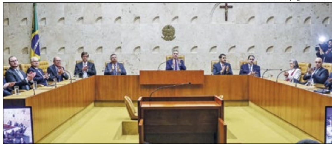
Deputados dos EUA abrem novo capítulo contra o STF

Além de acusar o Judiciário brasileiro de censura contra o X, o relatório afirma que os governos