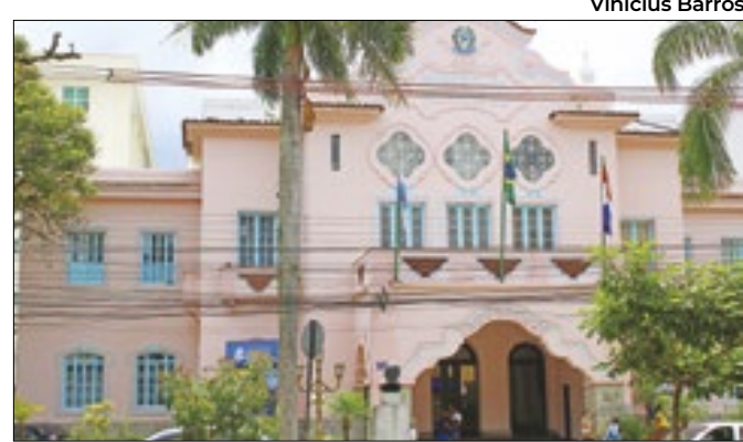
Prefeitura Municipal de Teresópolis (PMT)