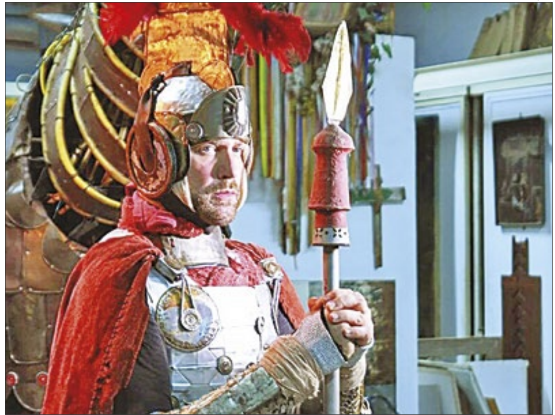
Performance de "Salve Jorge" será um dos destaques da festa em Nova Iguaçu

"É importante o Festival de Artes nos eventos do calendário da cidade como a