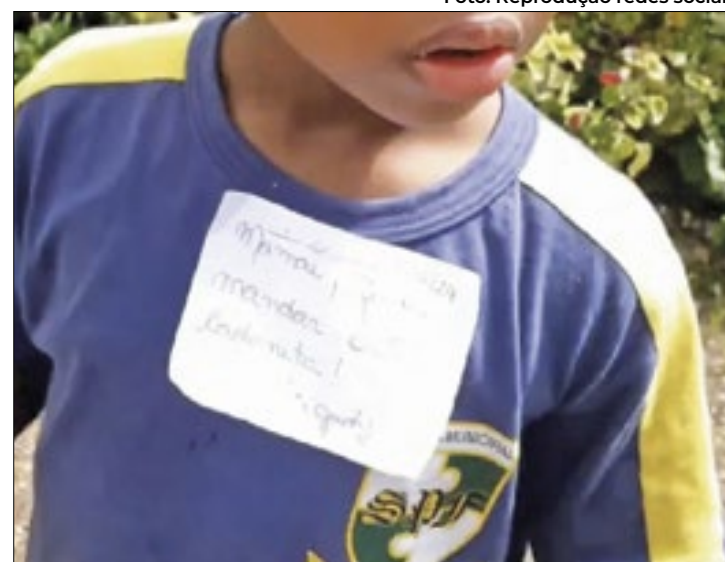
O caso foi denunciado nas redes sociais pela vereadora

“Ouvir da criança como ele se sentiu causou na gente indignação e revolta. O espaço escolar é onde a criança precisa estar segura, onde os pais e filhos tenham confiança. Constrangimentos e humilhação não podem fazer parte do espaço pedagógico”, disse a vereadora. No vídeo compartilhado nas redes sociais, a vereadora