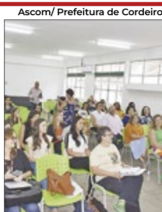
trilha para educação

A Secretaria de Educação de Cordeiro está realizando a "Trilha Formativa" para diretor geral e adjunto, orientador pedagógico, orientador educacional e agente de pessoal. A trilha visa fornecer um conjunto de competências e conhecimentos necessários para liderar e administrar efetivamente instituições de ensino. Assim, a formação consiste em um momento de reflexão sobre as práticas de ensino, tendo em vista a recomposição das aprendizagens dos estudantes da rede, a partir das necessidades identificadas pela secretaria.