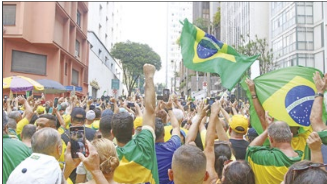
Ato na Paulista em fevereiro reuniu milhares de pessoas

O advogado se referiu ao tenente-coronel Mauro Cid, o coronel do Exército Marcelo Câmara e o ex-assessor de assuntos