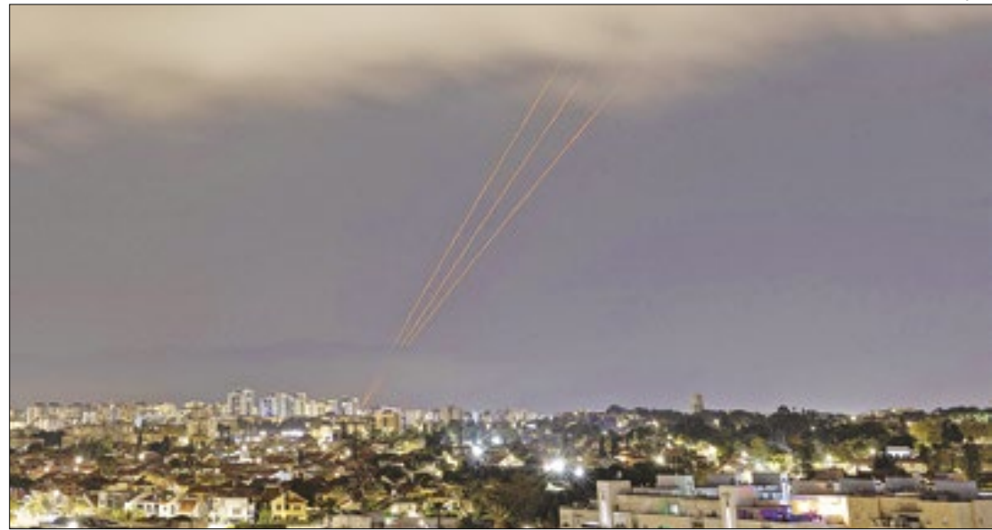
Ânimos se acirraram ainda mais com ataque do Irã a Israel

As ameaças de Teerã relacionadas à sua política nuclear não são inéditas. Em 2021, o então ministro da inteligência do país disse que a pressão oc-