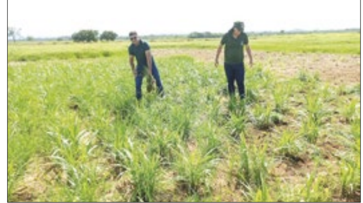
Capim BRS Kurumi propicia mais nutrição para o gado