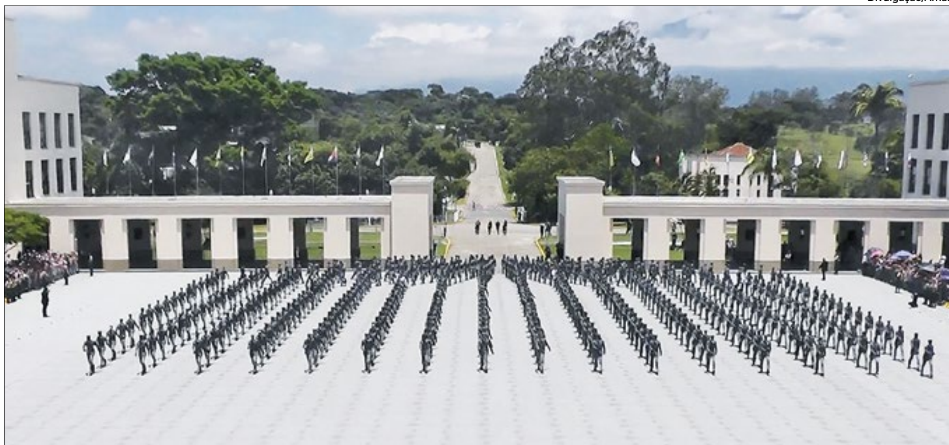
História da Aman tem início ainda em 1810, com a criação da Academia Real Militar

No mesmo dia, 24 de abril, às 19 horas, haverá a apresentação da Banda Sinfônica do Batalhão de Comando e Serviços—Batalhão Agulhas Negras, no tradicional Teatro