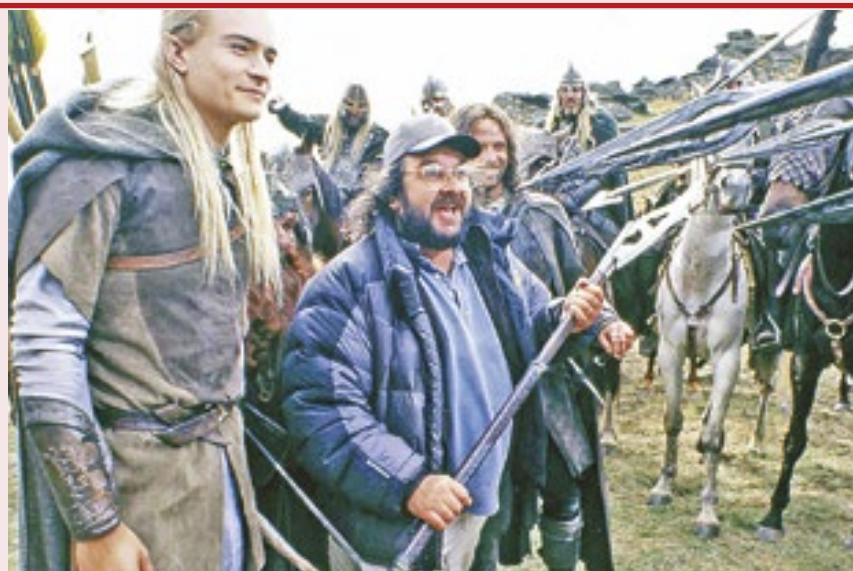
Peter Jackson nos sets de 'O Senhor dos Anéis': cineasta pode renovar sua investida no universo Tolkien

Diretor por trás da franquia 'O Senhor dos Anéis', Peter Jackson invade os streamings com seus documentários e adaptações da obra de J.R.R. Tolkien