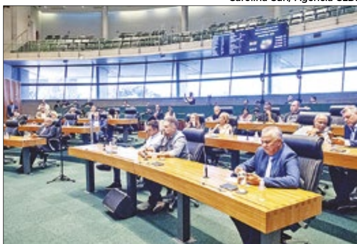
Entidades como o Sinduscon-DF participam do debate

Deputados distritais realizaram o segundo debate, de um total de quatro, sobre o Plano de Preservação do Conjunto Urbanístico de Brasília (PP-CUB). A comissão geral foi presidida pelo deputado Thiago Manzoni (PL).