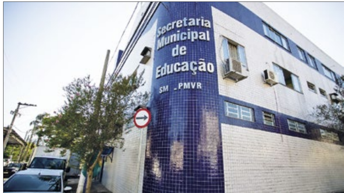
Prefeitura abriu em caráter de urgência contratação de cuidadores na área educacional