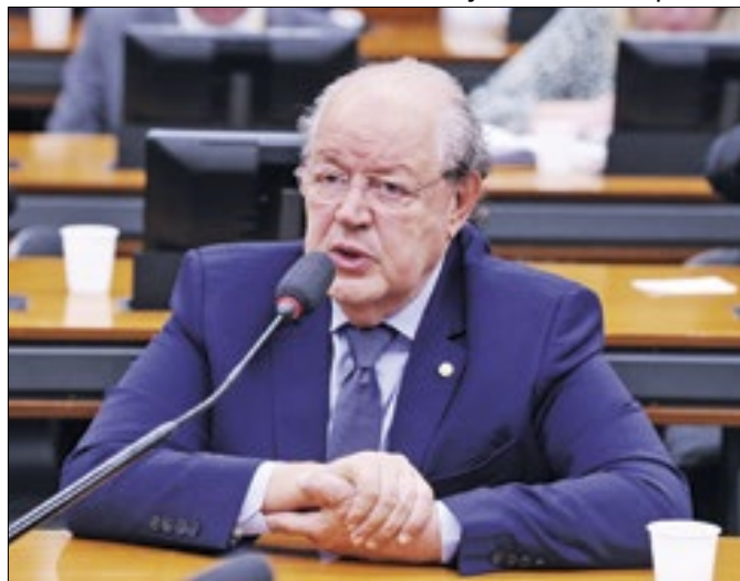
Haully teme que regulamentação saia do controle