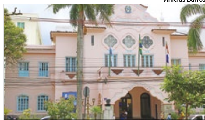
Prefeitura Municipal de Teresópolis (PMT)