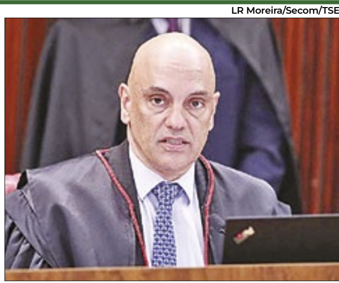
Decisões são fundamentadas, diz Moraes