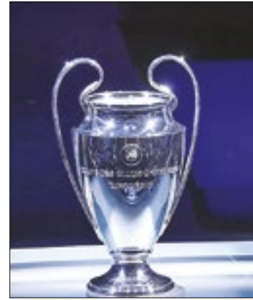
Veja datas da Champions