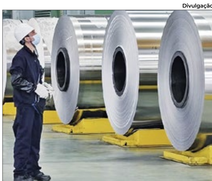
Divulgação Tributação do aço é questão polêmica ainda sem solução

Formada por dez ministérios, a Camex levará em conta o fato de que um setor inteiro hoje corre o sério risco de fechamento em série de empresas, seguido de demissões em massa. Ao mesmo tempo, a Câmara