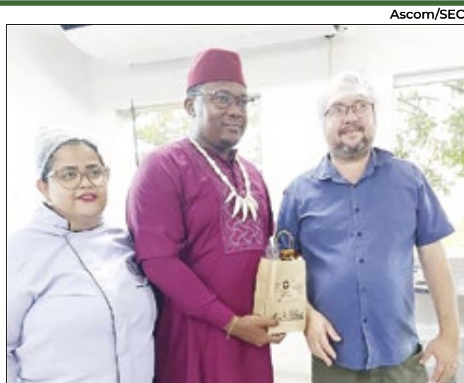
Representantes conhecem modelo de educação