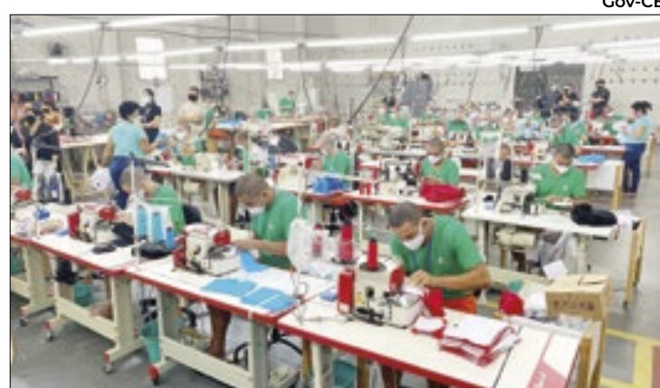
Selo premia iniciativas de inserção para detentos

O acordo será publicado nos Diários Oficiais de ambos os estados e vigorará até a transferência definitiva do código fonte.