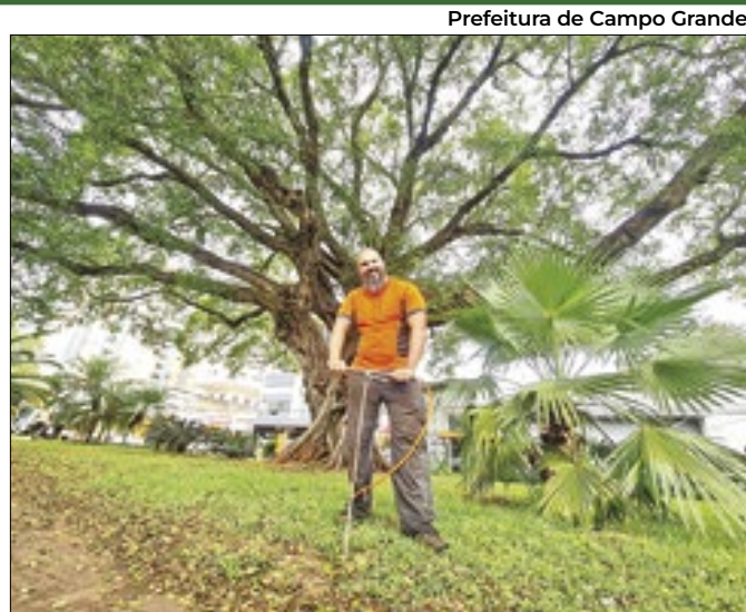
Prefeitura de Campo Grande

Deputados distritais vão realizar quatro reuniões sobre o tema