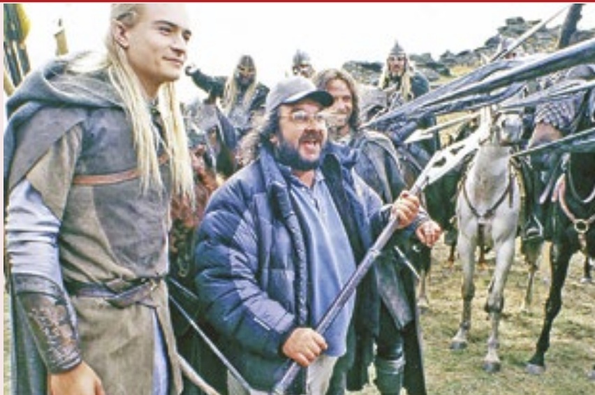
Peter Jackson nos sets de 'O Senhor dos Anéis': cineasta pode renovar sua investida no universo Tolkien

Diretor por trás da franquia 'O Senhor dos Anéis', Peter Jackson invade os streamings com seus documentários e adaptações da obra de J.R.R. Tolkien