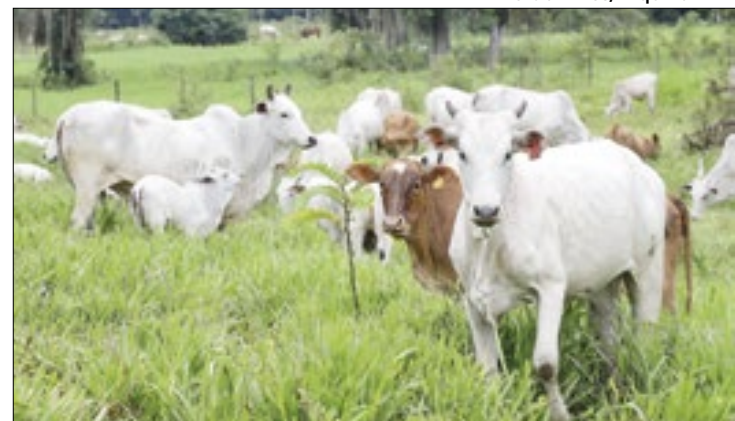
Atualização obrigatória começa em 1º de maio