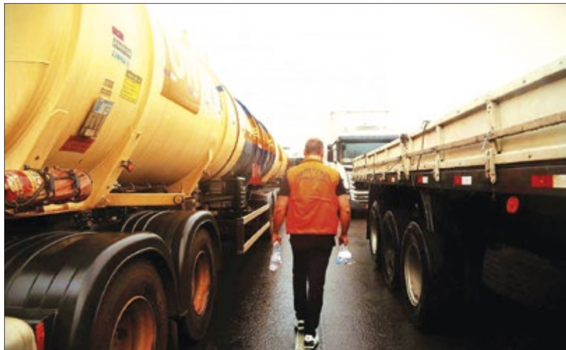
Estado registra 30 municípios afetados pelas chuvas e sete em situação de emergência

Quanto aos danos e prejuízos, chegaram a 194 pessoas desalojadas, sendo 20 no município de Biguaçu, duas pessoas em Imbituba, duas pessoas desalojadas em Tubarão, 120 desalojadas em Paulo Lopes, e já em Palhoça 50 desalojados e 11 desabrigados. Por meio de ação integrada, os trabalhos da equipe da SDC foram desenvolvidos de forma ágil e eficaz, atendendo prontamente às necessidades da população afetada pelas chuvas nos municípios. Em Palhoça, no dia 15 de abril, a Secretaria garantiu o fornecimen-