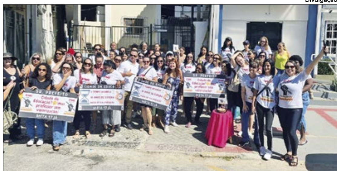
Manifestação foi formada por professores de nível I

A insatisfação dos professores é motivada pelo descumprimento dessas determinações, que foram estabelecidas em 2015 e têm validade até o fim deste ano.