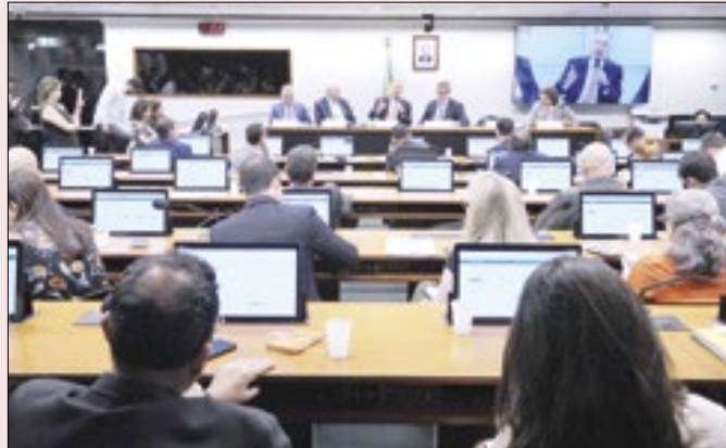
Projetos foram apresentados em comissão da Câmara