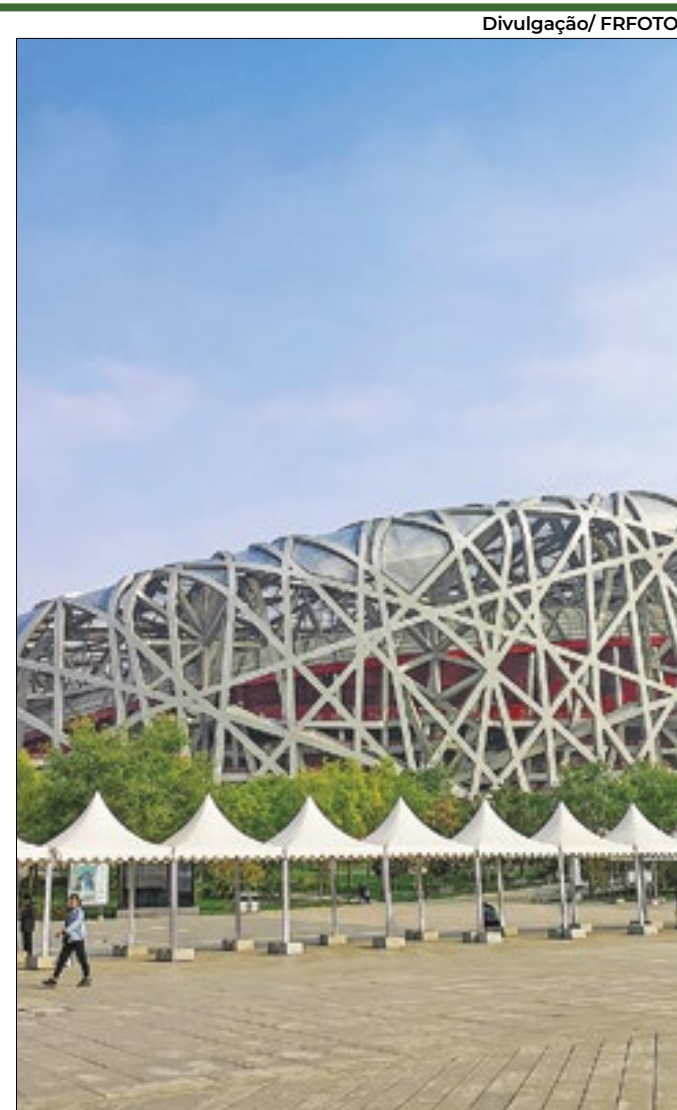
Ninha do Pássaro, estádio dos Jogos Olímpicos de 2008