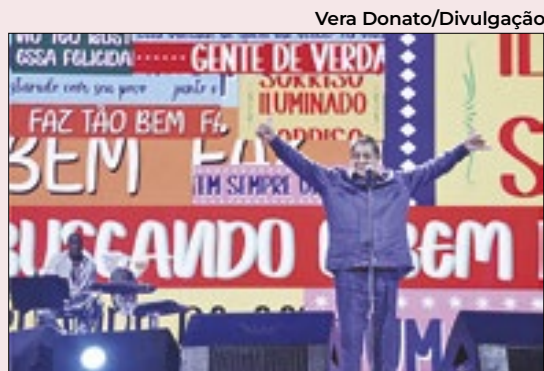
Zeca Pagodinho (foto) e Ana Carolina são as atrações deste fim de semana no TIM Noites Cariocas