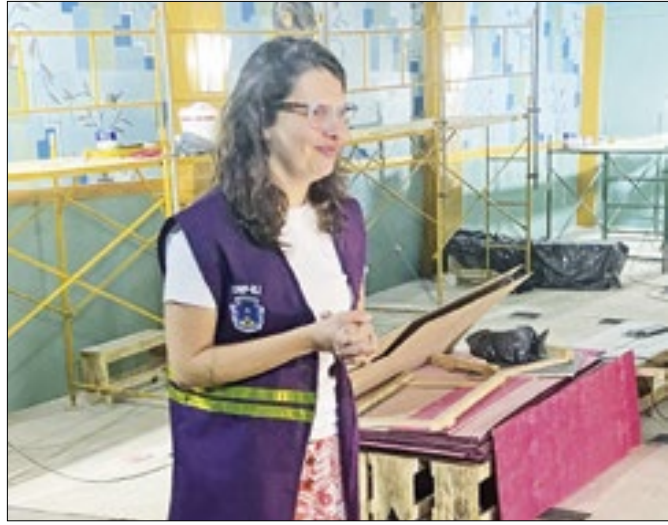
Fiscalização aconteceu na última quarta-feira (17)