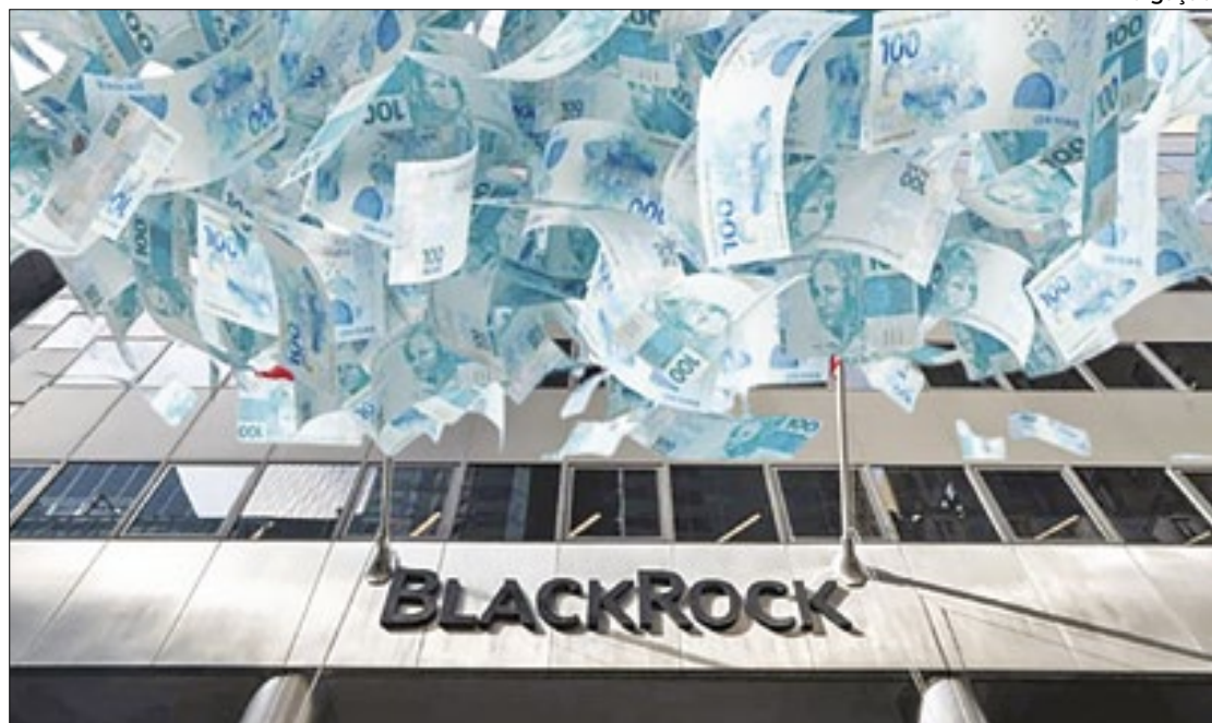
Mercados do México e da Índia passaram a ser mais atrativos para investidor externo

A perspectiva, para a gestora, é de que o Federal Reserve (Fed) – o bc ianque – aplique este ano, no máximo, dois cortes de juros, em sintonia com a persistente inflação dos EUA. Nesse contexto, a executiva avalia que o 'cenário favorece