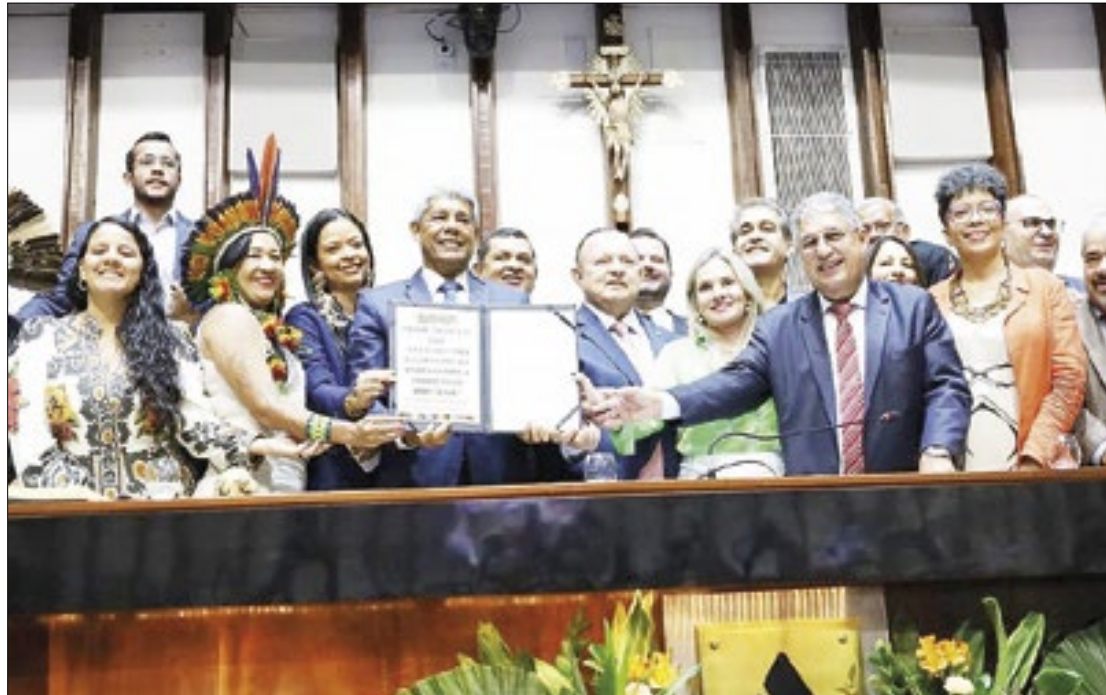
Projeto de lei prevê igualdade salarial entre professores indígenas e não indígenas

“Esse é um marco histórico e impactante para a comunidade educacional indígena na Bahia. Com a aprovação desse projeto de lei, a carreira desses profissionais ganha uma nova estrutura e reconhecimento, possibilitando que eles tenham acesso ao ensino superior e todas as garantias e direitos necessários para exercerem seu trabalho com dignidade e qualidade. É uma conquista que, certamente, trará benefícios significativos para a educação indígena como um todo”, pontuou a secretária estadual da Educação em