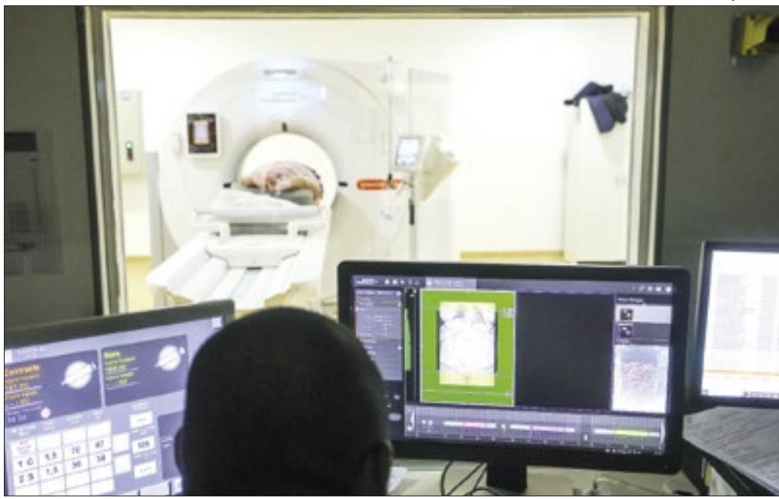
Unidade colabora para que a população possa prevenir ou identificar doenças precocemente

A Prefeitura de Cabo Frio convoca uma nova leva de aprovados do Concurso Público de 2020 que estavam aguardando o exame médico. O edital de chamamento dos 133 candidatos que concluíram a etapa de documentação já está disponível no site oficial do município.