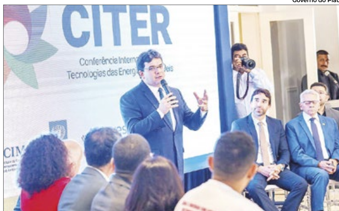
Conferência abordará tecnologias de energias renováveis na transição energética global

Evento internacional é o primeiro promovido pelo Brasil