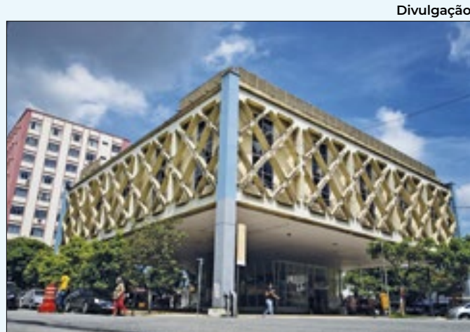
Evento acontece embaixo da Biblioteca Municipal

será aberto ao público e começa às 9h. O repertório da dupla inclui famosos temas do Jazz e do Blues, além de adaptações de canções do pop nacional e internacional.