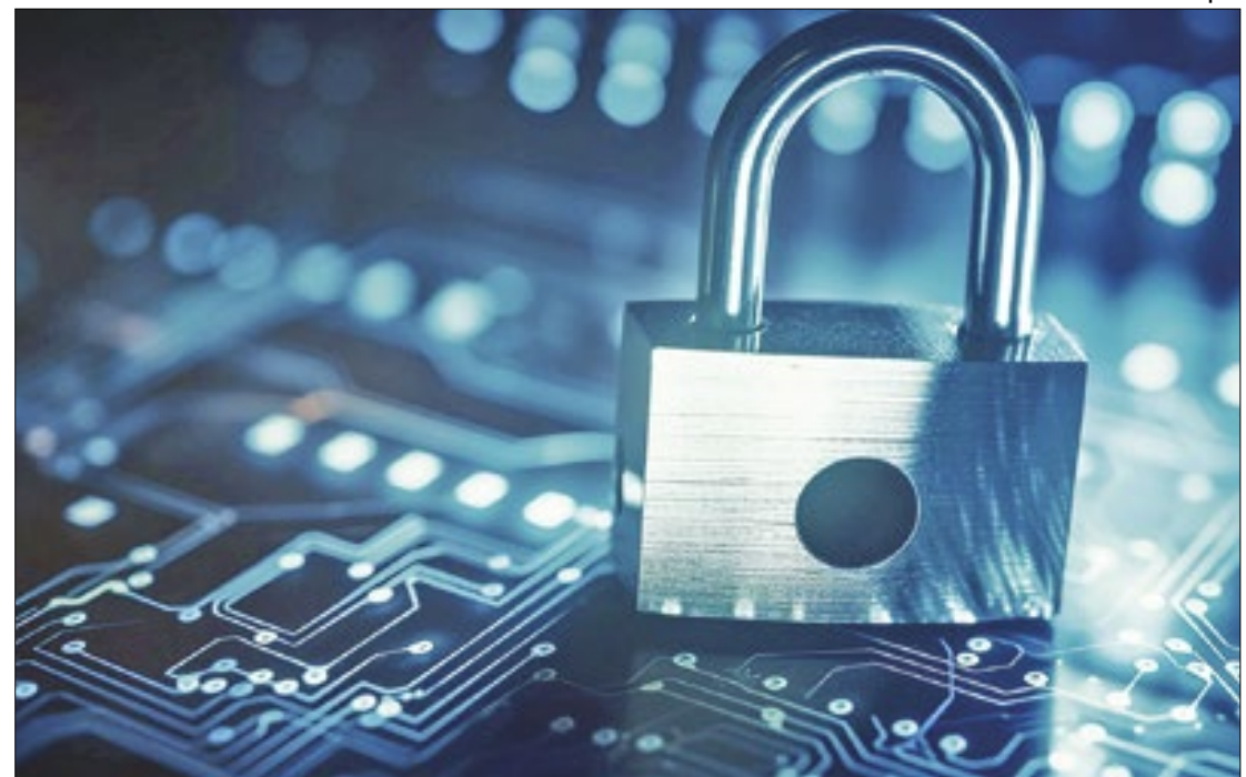
Além de proteger clientes, previsão é que investimento ajude instituições

A pesquisa ainda aponta que a segurança cibernética é prioridade estratégica para 100% dos bancos entrevistados, que focarão investimentos em arquitetura, infraestrutura e ferramentas especializadas para detecção e respostas a ameaças cibernéticas.