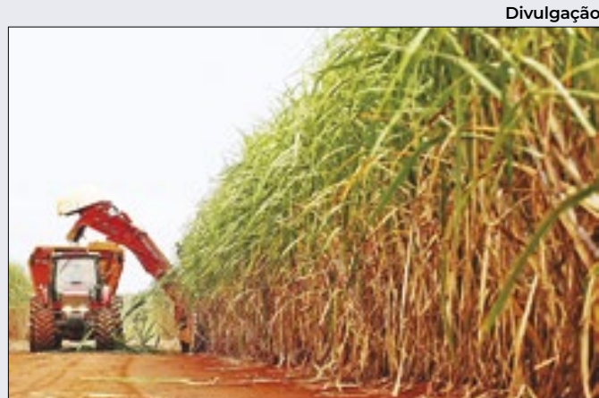
Produção de cana bate novo recorde histórico

Caso a 'ajuda federal' vá adiante, a União pleiteia um eventual assento no conselho de administração da nova companhia aérea, que 'importaria' um monopólio do transporte aéreo de passageiros no país, passível de veto pelo Cade (Conselho Administrativo de Defesa Econômica).