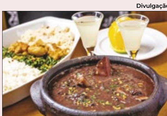
Uma das melhores maneiras de celebrar São Jorge é saboreando uma feijoada. Confira nosso roteiro