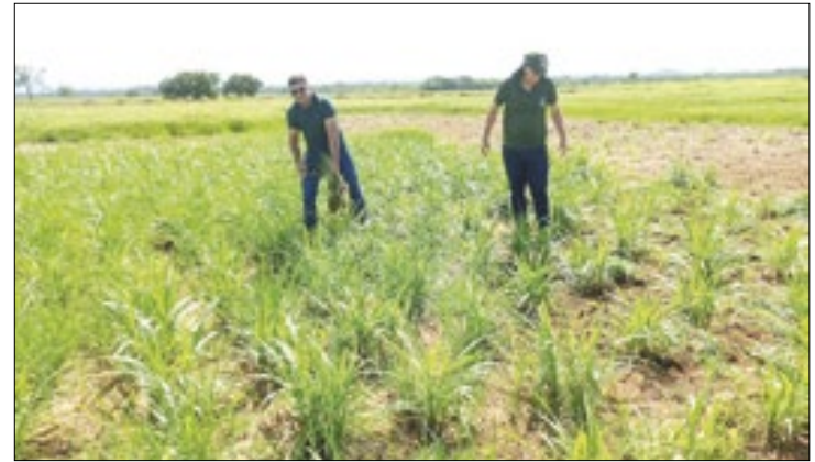
Capim BRS Kurumi propicia mais nutrição para o gado