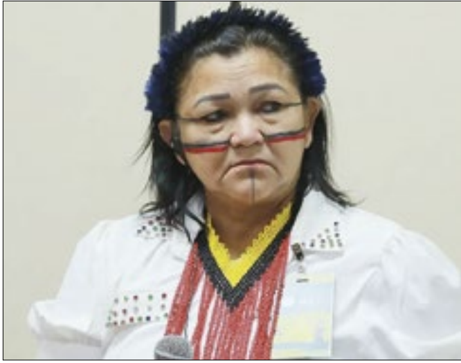
Tonkyre já ganhou o prêmio Alma da Ruralidade