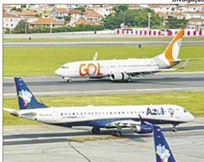
Holding Abra Group serviria como 'fiel' da transação