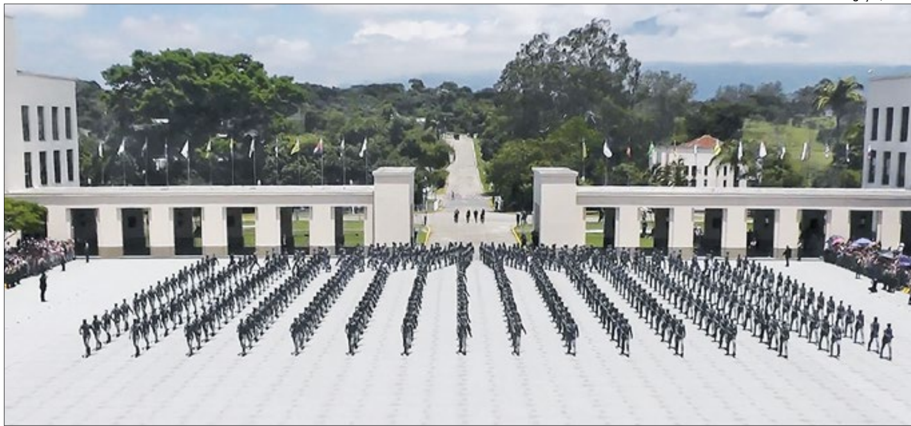
História da Aman tem início ainda em 1810, com a criação da Academia Real Militar

No mesmo dia, 24 de abril, às 19 horas, haverá a apresentação da Banda Sinfônica do Batalhão de Comando e Serviços—Batalhão Agulhas Negras, no tradicional Teatro