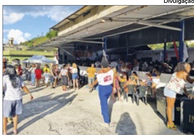
A programação contará com homenagem a São Jorge