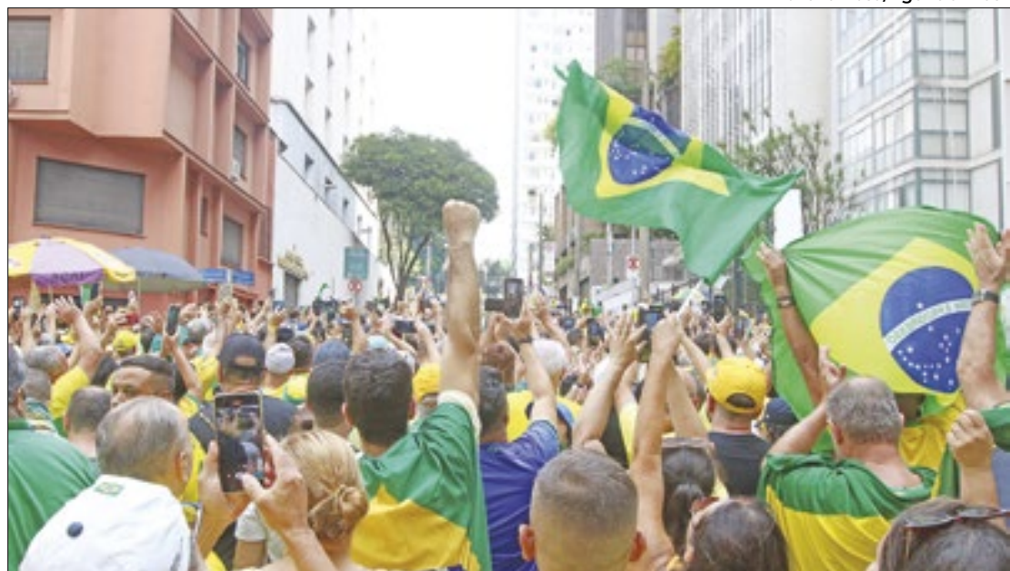
Ato na Paulista em fevereiro reuniu milhares de pessoas