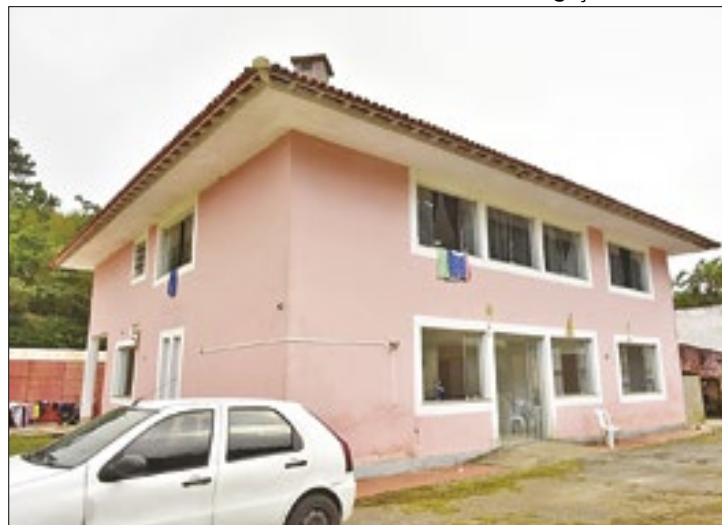
Prédio alugado pela Prefeitura no Independência

Vale ressaltar que em março, a 2ª Promotoria de Justiça de Tutela Coletiva do Núcleo Petrópolis solicitou, com urgência, que a Justiça determinasse que a cidade fornecesse, em até 48 horas, um lugar adequado e seguro como abrigo temporário das famílias que estavam alojadas na Escola Alto Independência após perderem suas casas.