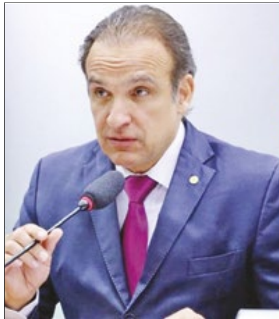
Deputado federal Hugo Leal e deputado estadual Yuri Moura

O deputado estadual Yuri Moura (PSOL) também afirmou que estará em Brasília na próxima semana, buscando respostas da Agência Nacional de Transportes Terrestres (ANTT) e do Ministério dos Transportes. Recentemente, o parlamentar lançou um vídeo nas redes sociais com duras críticas à Concessionária de Rodovias S.A. (Concer), concessionária que administra há anos a BR-040.