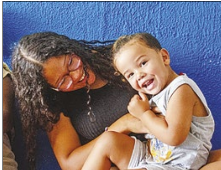
Ação vai permitir o reconhecimento precoce e diferenciado

pliação da linha de cuidados voltada para esses pacientes. Os atendimentos serão realizados, no primeiro Centro Estadual de Diagnóstico para o Transtorno do Espectro Autista (CedTEA) do Rio de Janeiro, inaugurado na última sexta-feira, (05), no bairro da Gávea, dando assistência aos