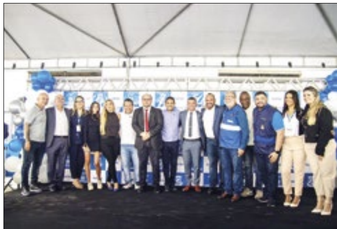
Diversas autoridades participaram da cerimônia