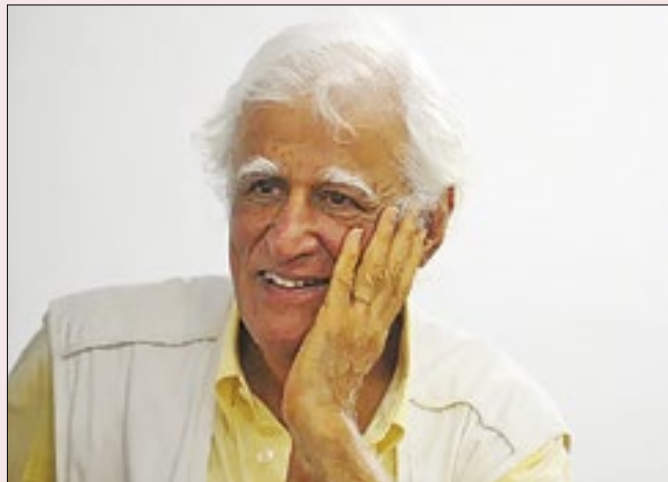
Escola bilíngue se chamará Ziraldo Alves Pinto