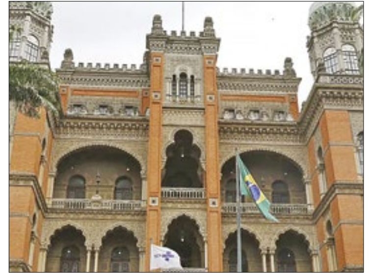
Fiocruz aprova 56 dos 143 projetos para as ações

Feira da Agricultura Familiar Data: Sábado (20/04) Horário: das 8h às 14h Local: Rua dos Lírios, s/n, em frente à Praça do Barroco (Itaipuaçu)