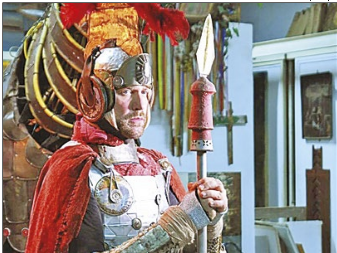
Performance de "Salve Jorge" será um dos destaques da festa em Nova Iguaçu

"É importante o Festival de Artes nos eventos do calendário da cidade como a