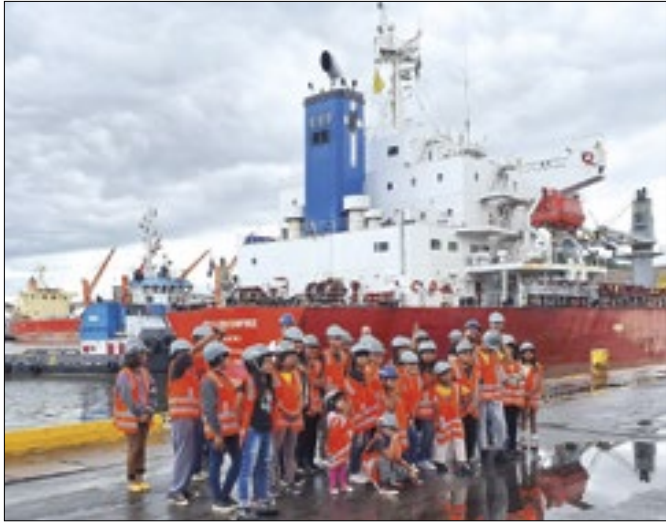
Estudantes indígenas visitam o Porto