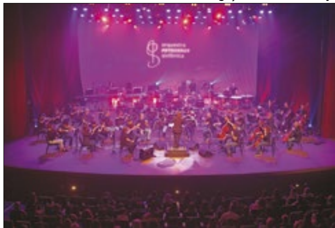
Marcelo Bonfá se apresentará junto à orquestra