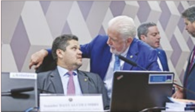
Wagner relatará DPVAT na CCJ de Alcolumbre