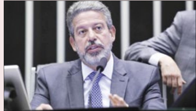
Arthur Lira, presidente da Câmara