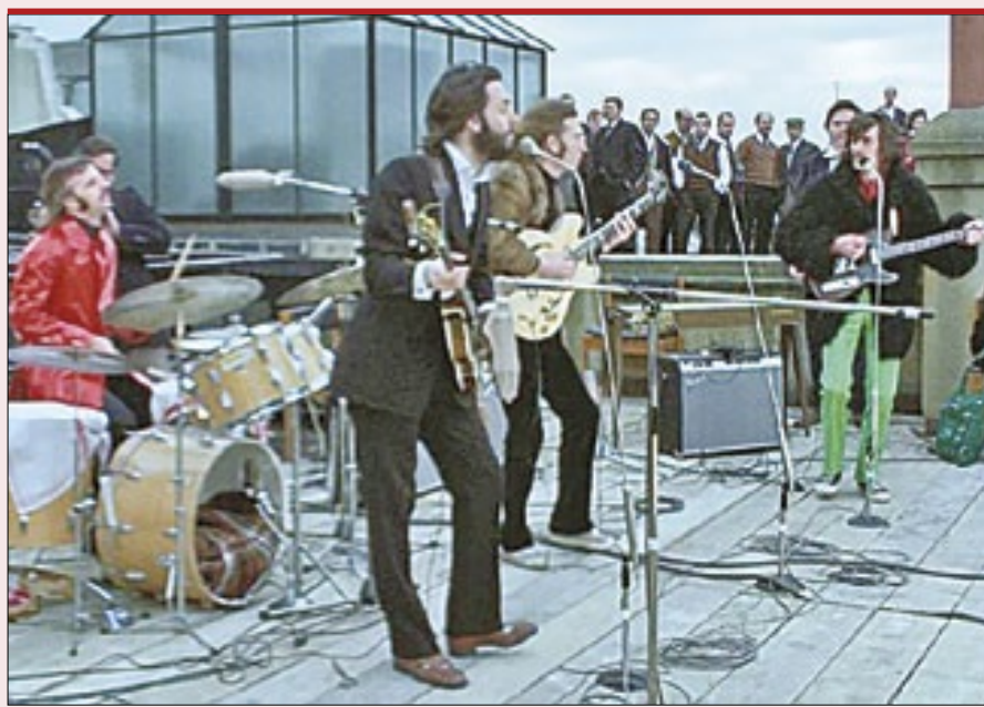
Paul, John, George e Ringo na histórica apresentação no terraço da Apple