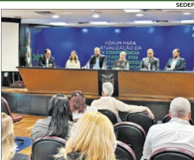
Conferência Nacional da Pessoa com Deficiência