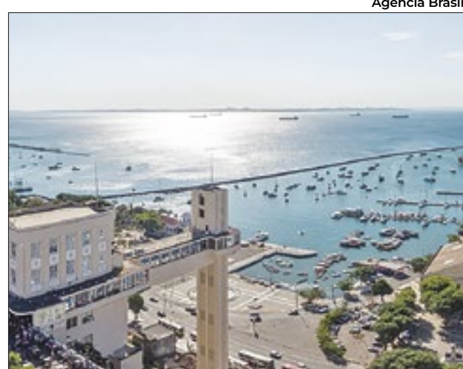
Evento apresenta cases de sucesso no Nordeste