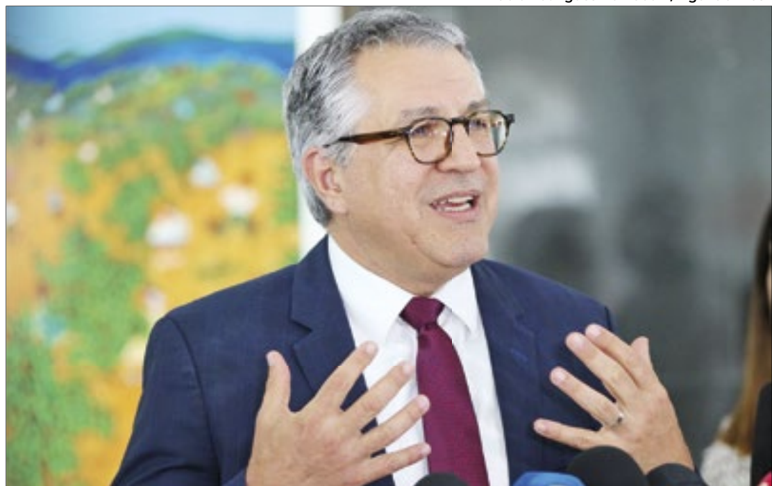
Ministro Alexandre Padilha é alvo das insatisfações de Lira e do Centrão

A medida não foi vista com bons olhos pelos parlamentares, especialmente da oposição. Membros do governo declararam que a mudança não significa que o ministério terá poder para alterar os valores ou o destino das emendas, mas somente ficar informado da situação. Porém, os líderes de Centrão ainda articulam para derrubar a portaria, com o entendimento de que ela dá mais poderes a Alexandre Padilha, de acordo com informações do jornal Folha de S. Paulo. O poder Executivo nega que a portaria tenha sido elaborada com esse objetivo.