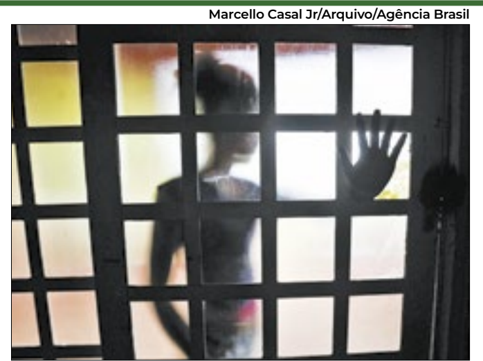
País registrou 45.994 casos de estupro de vulnerável em 2021