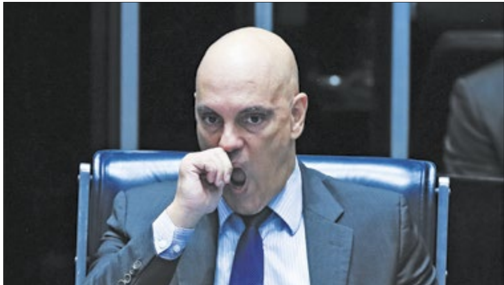
Ministro do Supremo Tribunal Federal esteve com Arthur Lira e Rodrigo Pacheco

Preocupado com o clima cada vez mais intenso de beligerância com o Judiciário, especialmente com o Supremo Tribunal Federal (STF) e o Tribunal Superior Eleitoral (TSE), o ministro Alexandre de Moraes foi de surpresa ao Congresso