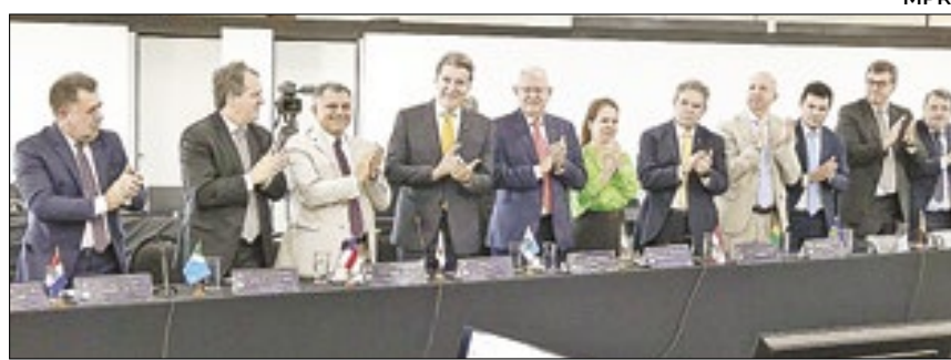
A eleição foi feita por aclamação durante a 3ª Reunião Ordinária do colegiado