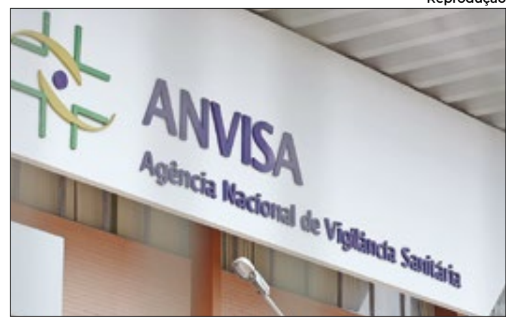
Órgão controlador aprova ou não vacinas e remédios