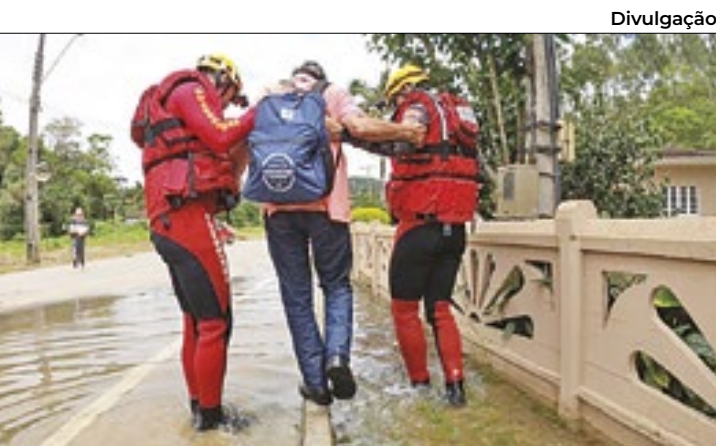
Bombeiros atendem 150 chamados em 67 municípios

O Programa Lição de Casa, coordenado pelas secretarias de Obras Públicas e da Educação, concluiu mais três obras em escolas estaduais de Condor, Guaíba e Vacaria. Os investimentos são de mais de R$ 1 milhão. Em Condor, foram destinados quase R$ 227 mil para reparos na quadra de esportes da Escola Estadual de Ensino Médio Agostinha Dill. A obra foi executada pela Lira Construções e Locações de Máquinas, fiscalizada pela 14ª Coordenadoria Regional de Obras Públicas (Crop), de Santo Ângelo, e concluída no início de abril. Maior escola estadual do município, a Agostinha Dill fica na rua Duque de Caxias, 273, no Centro, e conta com 375 alunos.