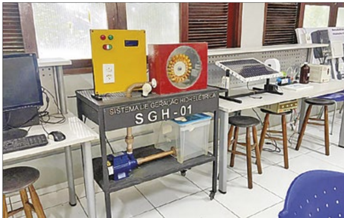
Projeto desenvolve bancada didática para pesquisa e ensino em hidrogênio verde

Aguiar explica, que até o momento, as bancadas existentes para trabalhar com hidrogênio verde lidam principalmente com pequenas quantidades ou servem apenas de forma ilustrativa para demonstrar o potencial do hidrogênio, sem abordar aspectos de como pode ser tratado com a termodinâmica. Isso porque o hidrogênio verde é extremamente interdisciplinar, envolvendo áreas como en-