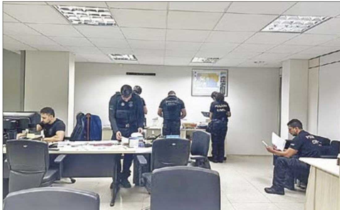
Operação buscou encontrar mais provas e investigar se outras pessoas estão envolvidas