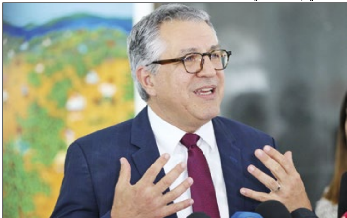
Ministro Alexandre Padilha é alvo das insatisfações de Lira e do Centrão

A medida não foi vista com bons olhos pelos parlamentares, especialmente da oposição. Membros do governo declararam que a mudança não significa que o ministério terá poder para alterar os valores ou o destino das emendas, mas somente ficar informado da situação. Porém, os líderes de Centrão ainda articulam para derrubar a portaria, com o entendimento de que ela dá mais poderes a Alexandre Padilha, de acordo com informações do jornal Folha de S. Paulo. O poder Executivo nega que a portaria tenha sido elaborada com esse objetivo.