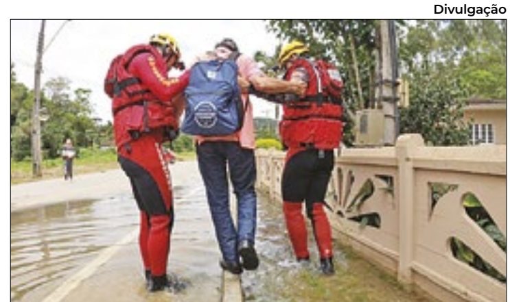
Bombeiros atendem 150 chamados em 67 municípios

O Programa Lição de Casa, coordenado pelas secretarias de Obras Públicas e da Educação, concluiu mais três obras em escolas estaduais de Condor, Guaíba e Vacaria. Os investimentos são de mais de R$ 1 milhão. Em Condor, foram destinados quase R$ 227 mil para reparos na quadra de esportes da Escola Estadual de Ensino Médio Agostinha Dill. A obra foi executada pela Lira Construções e Locações de Máquinas, fiscalizada pela 14ª Coordenadoria Regional de Obras Públicas (Crop), de Santo Ângelo, e concluída no início de abril. Maior escola estadual do município, a Agostinha Dill fica na rua Duque de Caxias, 273, no Centro, e conta com 375 alunos.