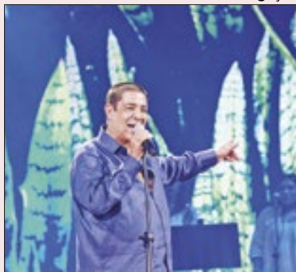
Zeca Pagodinho lança nas plataformas 'Ogum', que antecede o lançamento do DVD de 40 anos de carreira