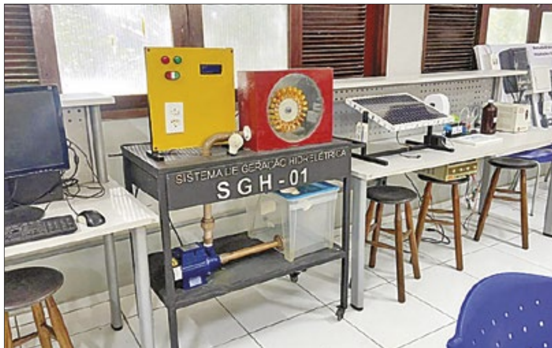
Projeto desenvolve bancada didática para pesquisa e ensino em hidrogênio verde

Aguiar explica, que até o momento, as bancadas existentes para trabalhar com hidrogênio verde lidam principalmente com pequenas quantidades ou servem apenas de forma ilustrativa para demonstrar o potencial do hidrogênio, sem abordar aspectos de como pode ser tratado com a termodinâmica. Isso porque o hidrogênio verde é extremamente interdisciplinar, envolvendo áreas como en-