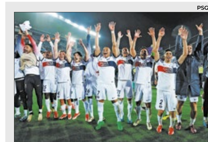
Mbappé ‘chamou a responsabilidade’ e lidera o PSG

“Se não tiver nenhuma lesão séria, quero estender o máximo possível. Amo jogar futebol e se puder quero ir até aos 39 anos”.