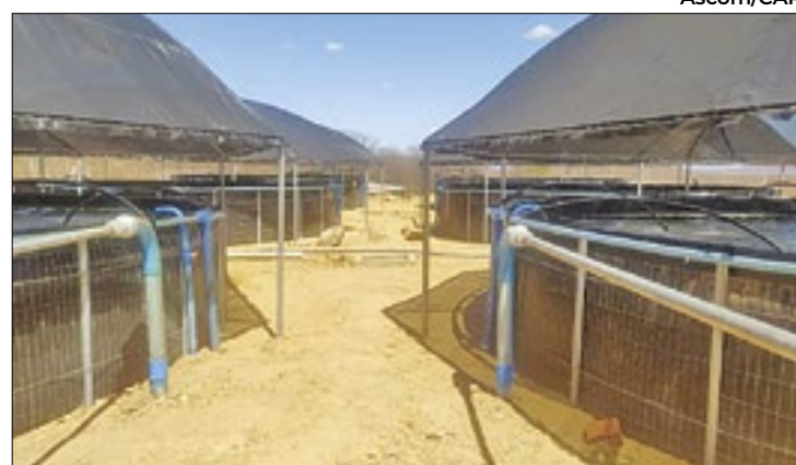
Comunidade investe em modernização da pesca

Além do suporte da Secretaria Executiva da Indústria, o governo estadual tem implementado políticas específicas para o setor, através do FDI operado pela Agência de Desenvolvimento do Estado do Ceará (Adece).