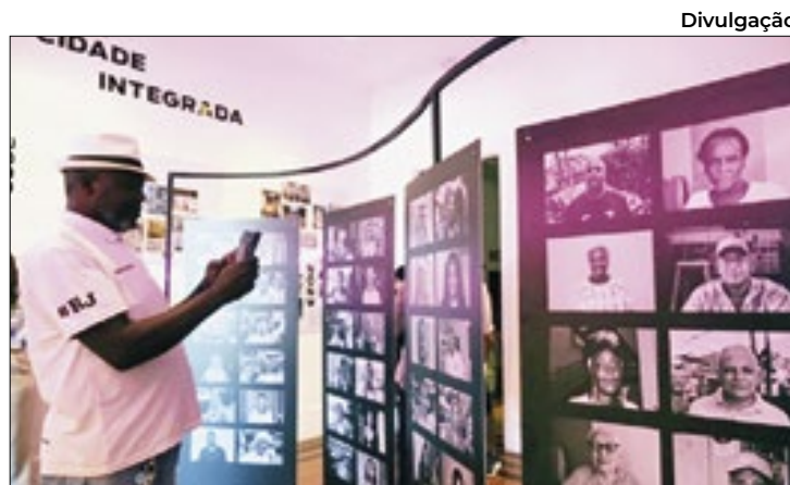
Pavão-Pavãozinho e Cantagalo na Casa G20

Isso viabilizou a participação da empresa na concorrência promovida pela prefeitura de São Paulo em 2015. Essas duas pessoas integravam o quadro societário da UpBus. Já na Transwolff (TW), entre os anos de 2008 e 2023, dez denunciados "constituíram e integraram uma organização criminosa e utilizaram o grupo econômico TW/Cooperpam para cometer os crimes".