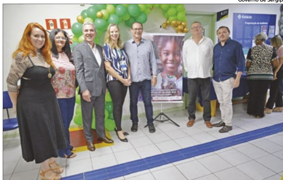
Programa promove a formação de educadores para implementação em escolas

Com apoio do Banco Central, o projeto irá capacitar estudantes