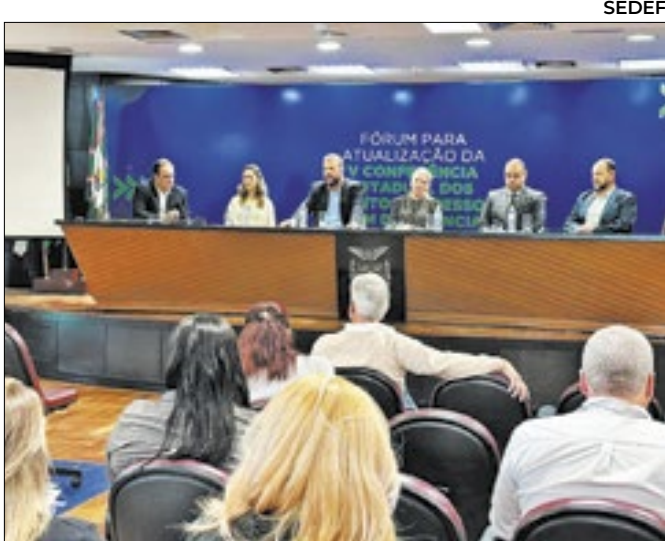
Conferência Nacional da Pessoa com Deficiência