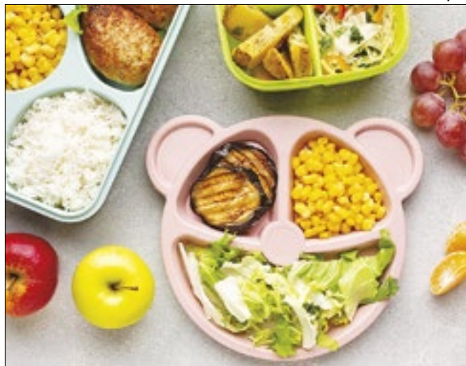
Alimentação infantil não é consenso