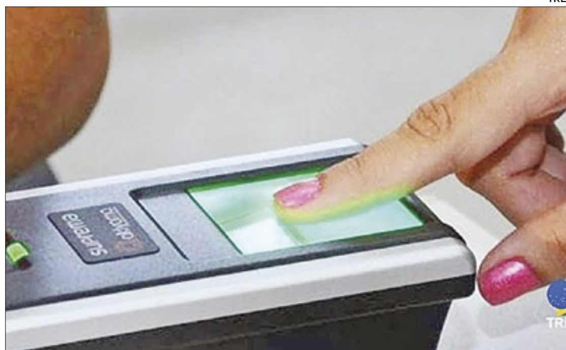
Candidato que se recusar a ter a biometria recolhida será eliminado

O procedimento será feito por um dos fiscais presentes no local da prova e a coleta acontecerá durante a realização do exame. No mesmo edital, o ministério confirmou os horários das provas, que serão realizadas em dois períodos,