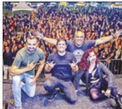
A Faixa Etária se apresenta sexta-feira, às 22h

Uma das principais atrações é a Banda Faixa Etária, de Niterói, que toca na sexta-feira, às 22h. Os números comprovam a importância de os governos municipais apoiarem os eventos de motociclistas, os maiores indutores do turismo regional. A Faixa Etária já tem shows agendados em Angra, Penedo, Cabo Frio e Cordeiro, entre outras cidades do Rio, e Aventureiro e Andrelândia, em Minas Gerais.