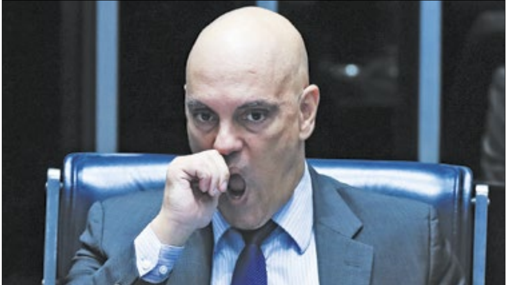
Ministro do Supremo Tribunal Federal esteve com Arthur Lira e Rodrigo Pacheco

Preocupado com o clima cada vez mais intenso de beligerância com o Judiciário, especialmente com o Supremo Tribunal Federal (STF) e o Tribunal Superior Eleitoral (TSE), o ministro Alexandre de Moraes foi de surpresa ao Congresso