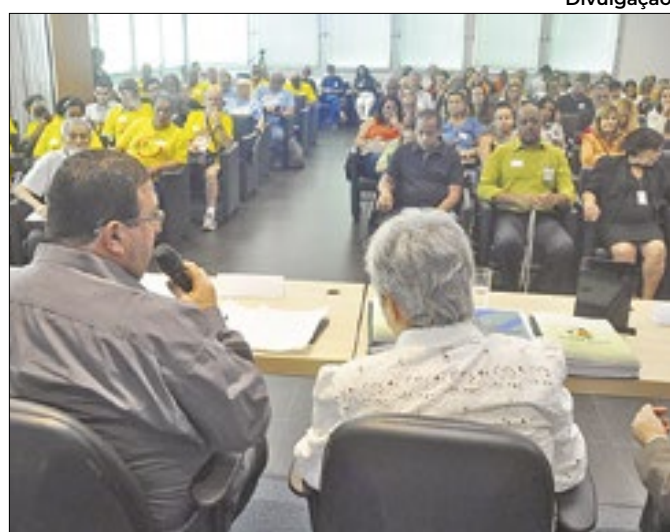
Publicação foi entregue pela Rede Ibero-Americana