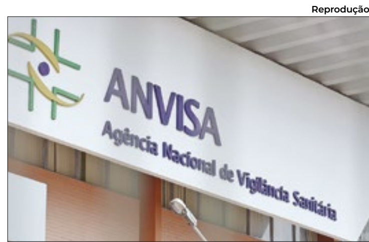
Órgão controlador aprova ou não vacinas e remédios