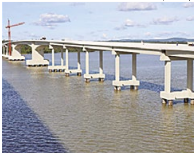
Estrutura de 1.488 metros vai favorecer agronegócio