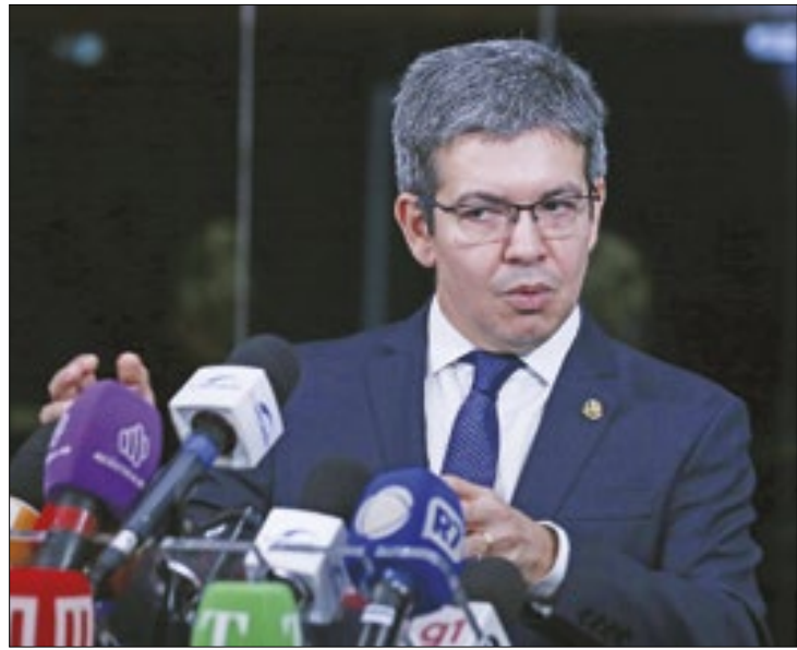
Randolfe foi o relator do projeto de isenção do IR

Relatado pelo próprio líder do Governo no Congresso, senador Randolfe Rodrigues