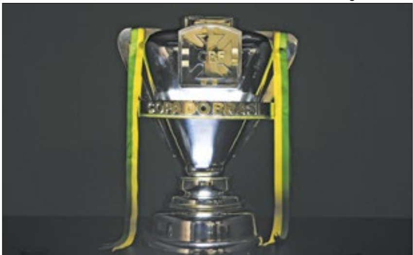
Jogos e datas foram definidos em sorteio na sede da CBF, no Rio

Os confrontos da terceira fase da Copa do Brasil 2024 foram sorteados na quarta-feira (17), na sede da CBF, na Barra da Tijuca, localizada na Zona Oeste do Rio de Janeiro. Além dos jogos, foram confirmadas