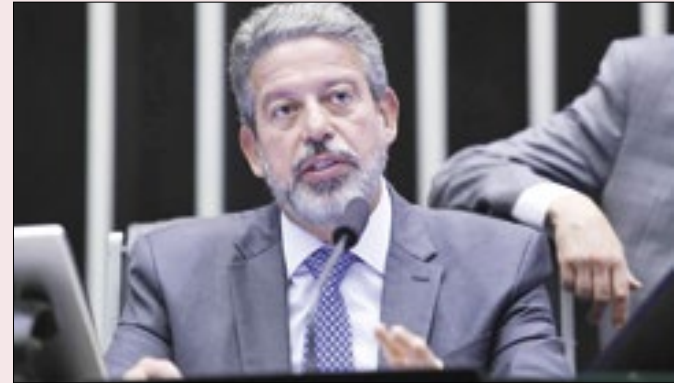
Arthur Lira, presidente da Câmara