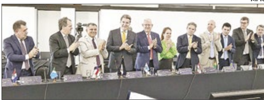
A eleição foi feita por aclamação durante a 3ª Reunião Ordinária do colegiado