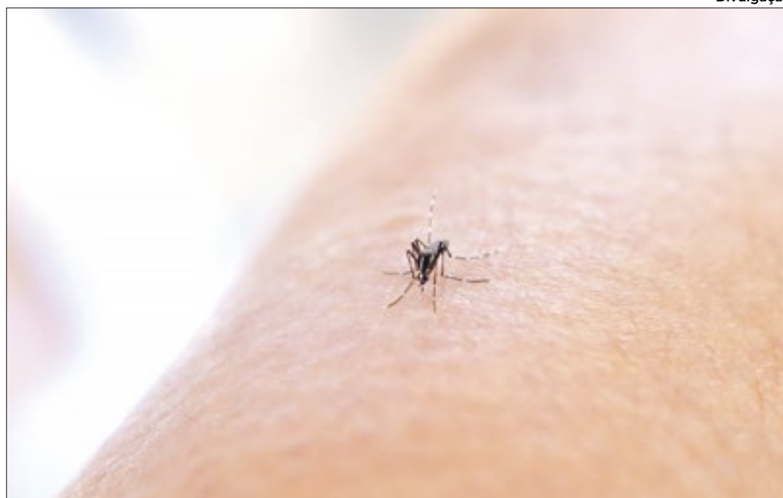
Boletim Panorama da Dengue aponta que número de casos prováveis de dengue caiu

A nova edição do boletim Panorama da Dengue, divulgado pela Secretaria de Estado de Saúde (SES-RJ), mostra que o Estado do Rio saiu do nível 3 do plano de contingência da secretaria, para o nível 2. Apesar da redução progressiva no número de casos prováveis registrados no estado ao longo das últimas três semanas, quatro regiões: Serrana, Metropolitana I (Baixada Fluminense e Rio de Janeiro), Baixadas Litorâneas e Norte Fluminense, ainda apre-