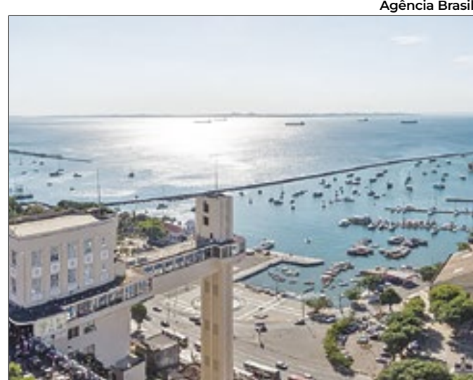
Evento apresenta cases de sucesso no Nordeste