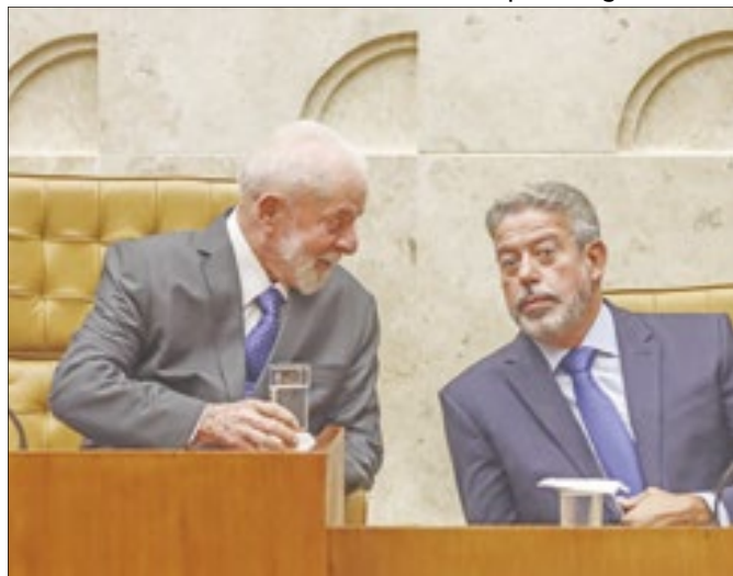
Lira vai tornando mais difícil a vida de Lula