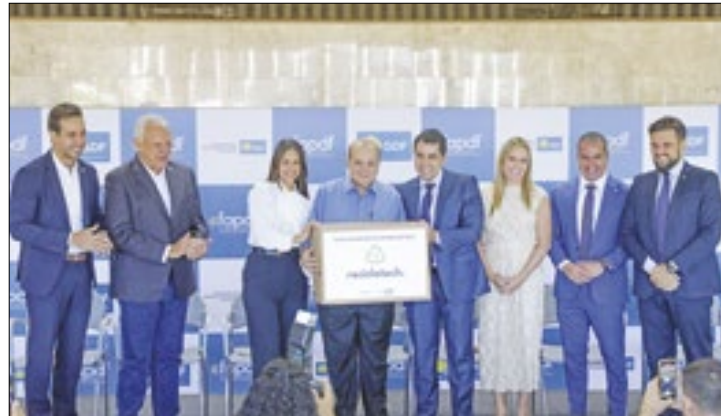
Ao todo, 300 computadores serão doados para o IgesDF