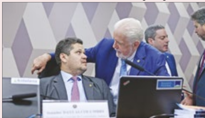
Wagner relatará DPVAT na CCJ de Alcolumbre