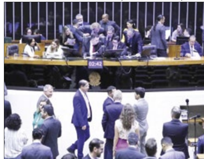
Sessão do Congresso em que orçamento foi aprovado