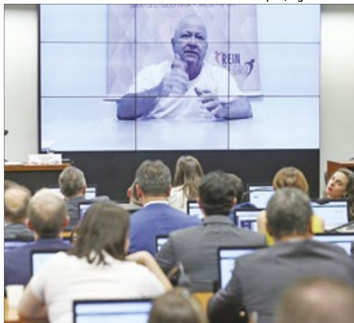
Prisão do deputado Chiquinho Brazão foi mantida

O deputado Bruno Ganem, que também é pré-candidato a prefeito pela cidade de Indaiatuba (SP), disse que não poderia assumir a relatoria da cassação de Brazão porque precisa seguir com seus planos para a pré-can-