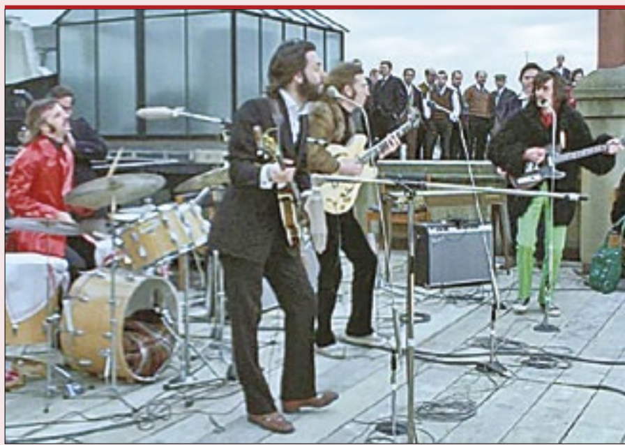
Paul, John, George e Ringo na histórica apresentação no terraço da Apple