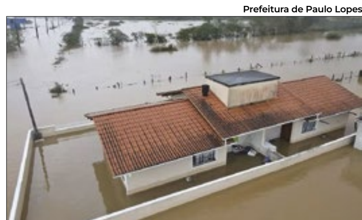
Prefeitura de Paulo Lopes

“As agências de fomento, de desenvolvimento e os bancos italianos têm um portfólio grande de empresas que são clientes e que buscam atuação fora da Itália. É muito importante que posicionemos o Rio Grande do Sul para que os investidores também olhem para nós”, disse Leite. O governador também destacou que o Rio Grande do Sul é uma porta de entrada para a América do Sul e para mercados relevantes. “Existem muitos aspectos do nosso Estado que favorecem investimentos de empresas italianas, então trouxemos o nosso portfólio de investimentos em infraestrutura na área de concessões. A Itália tem empresas de infraestrutura importantes, inclusive que já têm atuação no Brasil”, acrescentou.