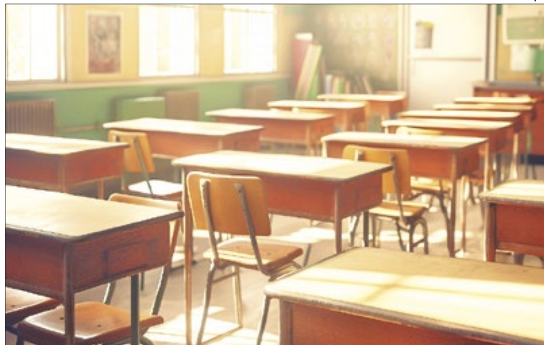
Mobilização do governo completa um ano neste mês de abril

Um balanço da operação no período compreendido entre 6 de abril de 2023 e janeiro deste ano mostra um total de 9.486 denúncias recebidas, sendo 12 tentativas de ataque e sete efe-