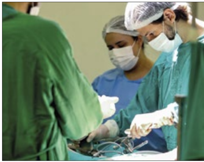
Morador de Porto Velho vai receber transplante ósseo