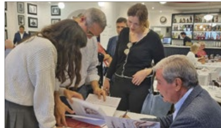
Mais um sucesso: foram vendidos 43 livros "Música no Museu 25 anos, uma vida" no lançamento no Firentina-Lisboa. Na foto, o autor durante autógrafos