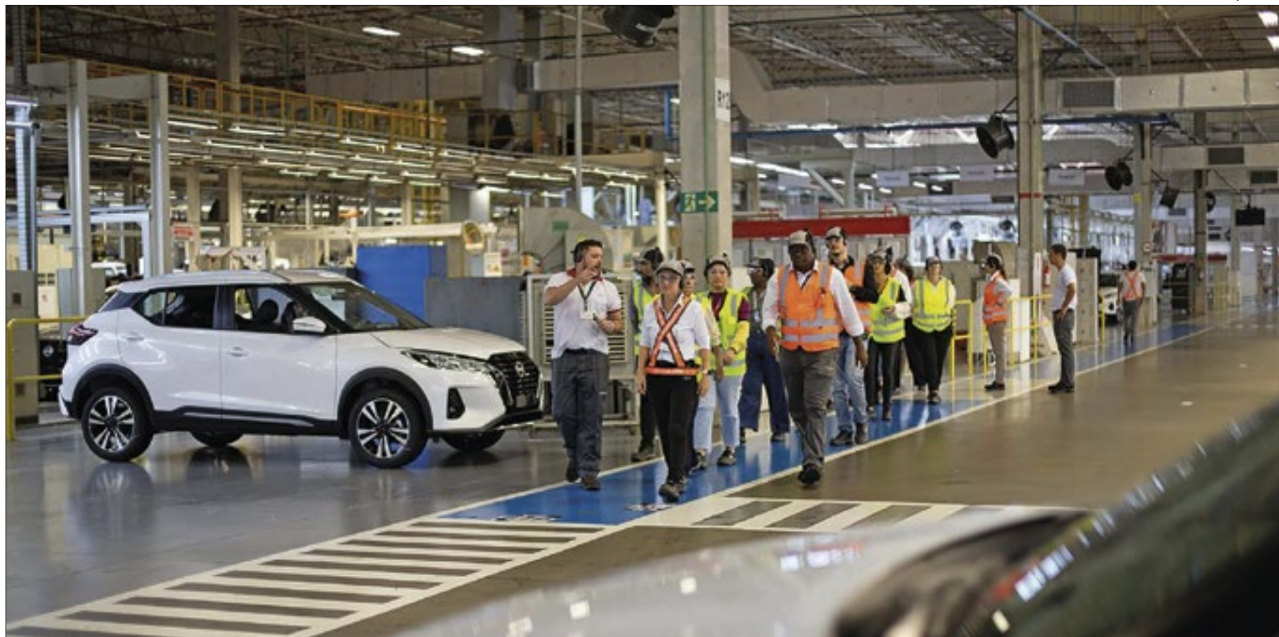
Empresa alia tecnologia à humanização em sua fábrica no complexo industrial de Resende, no sul do Rio de Janeiro