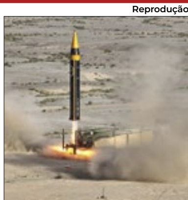
Top-15 entre potências

O ataque do Irã a Israel no final de semana foi uma breve exibição da capacidade militar iraniana. Apesar de viver sob sanções há anos, o país está entre as 15 principais potências militares do mundo.