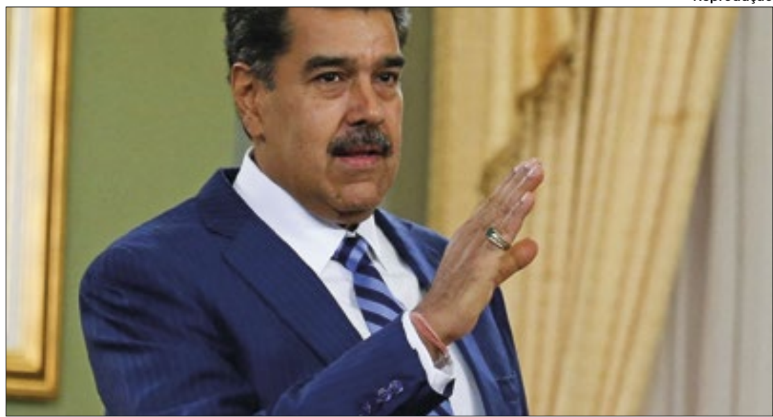
Ação venezuelana foi em apoio ao México

O conflito que escalou para a ruptura de relações diplomáticas começou com um comentário do presidente mexicano, Andrés Manuel López Obrador. Foi quando ele falou sobre a violência política no Equador