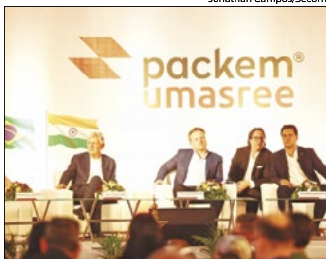
Recicladora inaugura fábrica de big bags na Índia