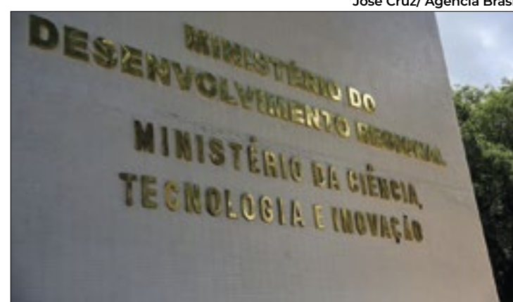
Ministério quer encomenda tecnológica ainda neste ano