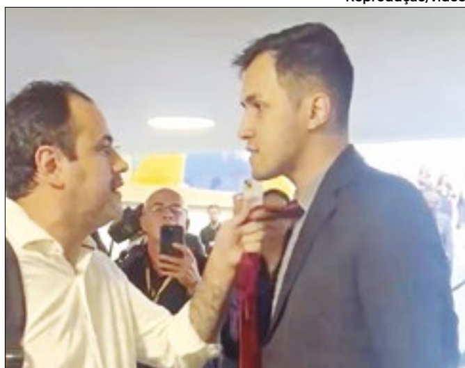
Deputado empurrou e chutou militante do MBL