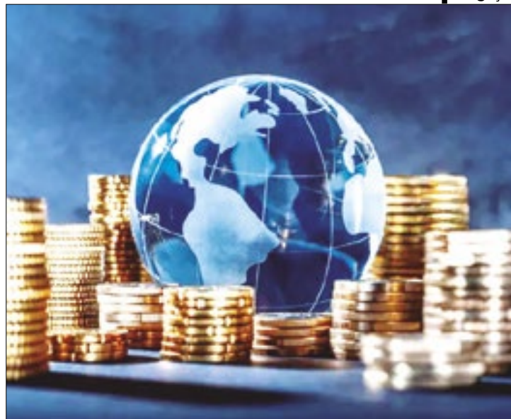
Avanço da economia brasileira não alcança média externa

Em comparação com a América Latina e o Caribe, o desempenho do Brasil é ligeiramente acima da média prevista para este ano na região, de alta