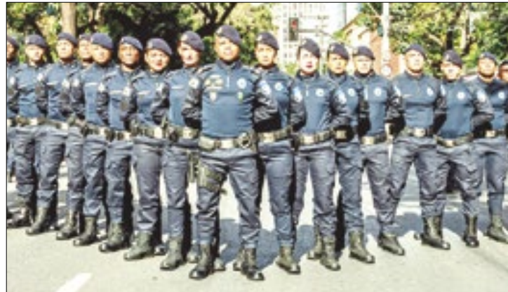
Guardas municipais de BH recebem qualificação