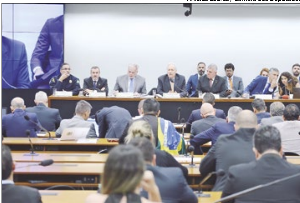
Foi a primeira ida de Lewandowski na Comissão de Segurança

O ministro da Justiça, Ricardo Lewandowski, declarou, nesta terça (16), na sua primeira ida à Comissão de Segurança Pública da Câmara como ministro de Estado, que o veto parcial do presidente Lula ao projeto de lei das saidinhas partiu da sua pasta. Lewandowski também comentou na audiência sobre a prisão dos fugitivos de Mossoró (RN) e justificou a escolha do procurador-geral de São Paulo Luiz Sarubbo para a Secretaria Nacional de Segurança Pública.