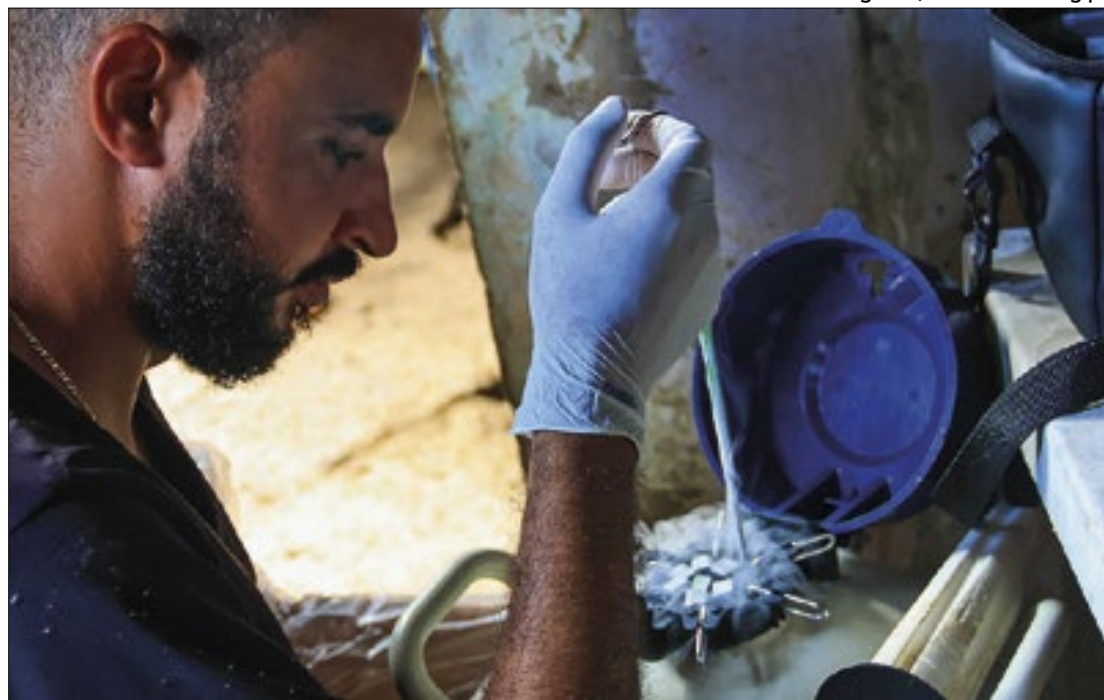
A tecnologia garante melhoramento genético de rebanho leiteiro e de corte