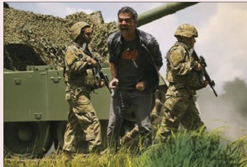
No papel de um correspondente de guerra, Wagner Moura tem um dos melhores desempenhos de sua carreira