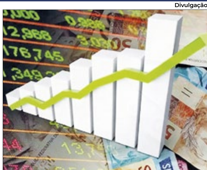
Indicador da economia exhibe avanço moderado

Há 15 semanas em 9% ao ano, taxa básica aumenta para 9,13% ao ano