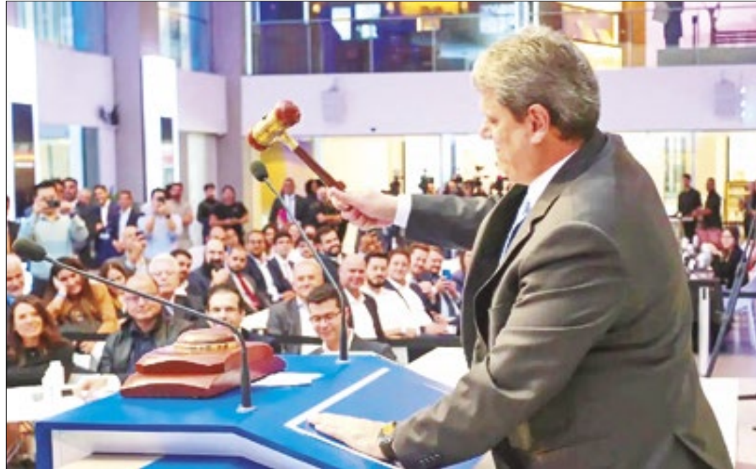
Leilão de concessão de rodovias do Lote Litoral do estado foi realizado ontem (16)