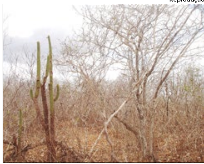
Ibama apresenta desafios por recuperação do bioma