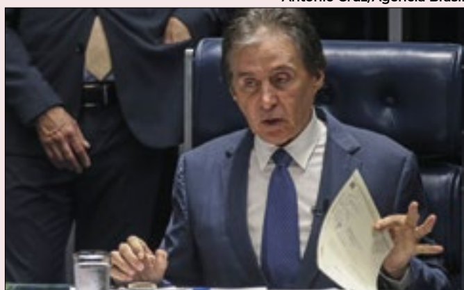
Para Eunício, apetite de Lira não tem limite