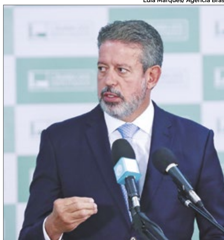
Lira prepara outras retaliações ao governo

A sessão também foi adiada porque o governo federal aguarda que o Senado Federal analise o Projeto de Lei Complementar