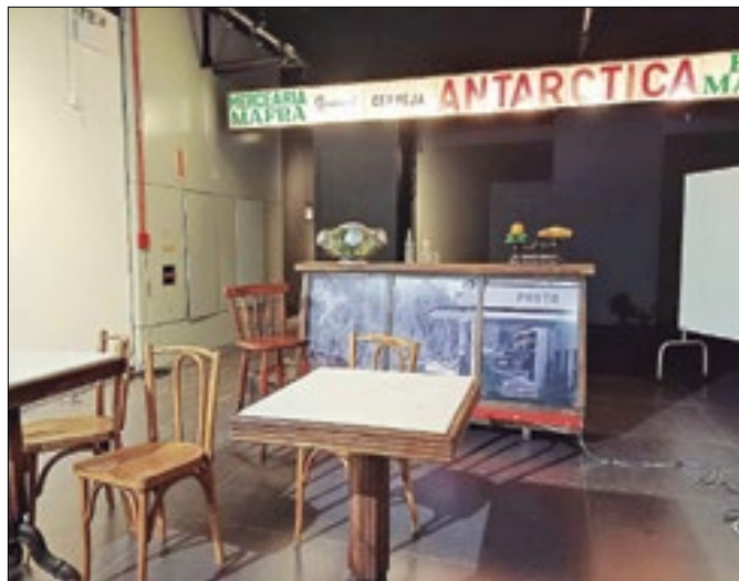
Exposição com peças cenográficas