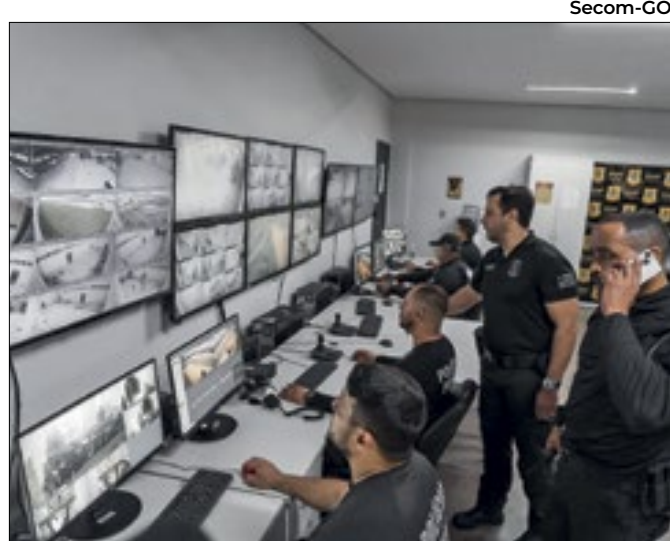
Homicídios dolosos no estado recuaram 24%