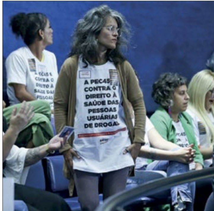
Manifestantes protestaram contra o projeto de lei

O relator da PEC, senador Efraim Filho (União Brasil- PB ), disse que a expectativa é