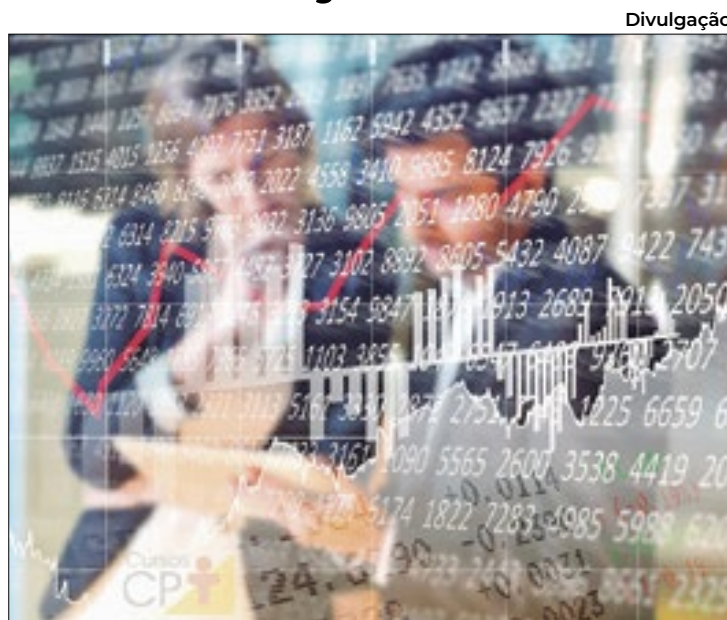
Mercado questiona o futuro da política monetária

Enquanto o impasse não é desfeito, cresce o temor da reedição do ‘descompromisso’ com a meta, relativizada pelo então presidente do BC, Alexandre Tombini, durante a gestão Dilma Rousseff, seguida da queda dos juros e reeleição (será por que?) da ‘presidenta’.