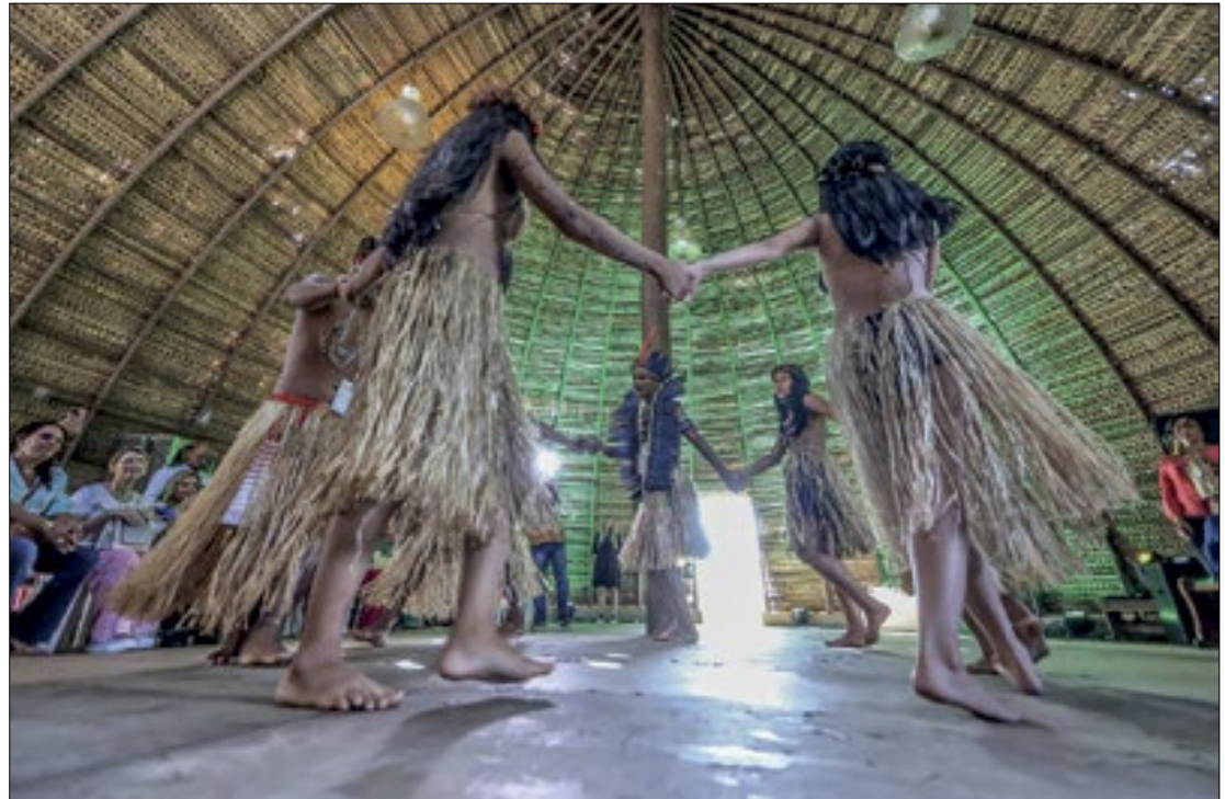
Evento terá apresentações musicais, dança, fotografia, exibição de filmes e exposição

"Nossa meta é incentivar a produção artística indígena de grande porte, contribuindo para experiências dos estudantes em um contexto mais amplo que o da produção feita em sala de aula. Essa iniciativa vai de encontro ao que diz a Re-