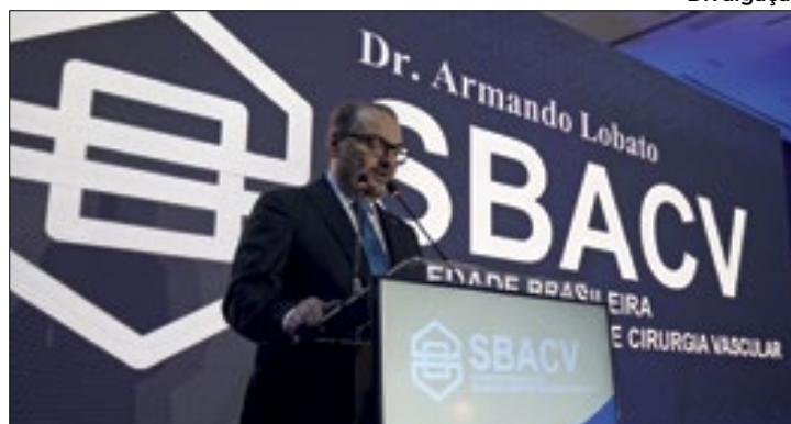
Presidente da SBACV pede atenção com a diabetes

De acordo com a Sociedade Brasileira de Angiologia e Cirurgia Vasculares (SBACV), o número médio diário de amputações no Brasil tem aumentado significativamente nos últimos anos, e a tendência é de continuar crescendo caso não haja uma educação com informação adequada e conscientização da população. Em 2020, essa média foi de 75,64, aumentando para 79,19 em 2021. Dados coletados de fontes como o Ministério da Saúde revelaram que, durante esse período de dois anos, um total de 56.513 brasileiros foram submetidos a procedimentos de amputação dos membros inferiores.