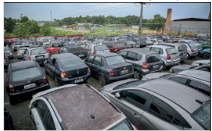
Leilão oferece ao todo 479 veículos, entre carros e motos