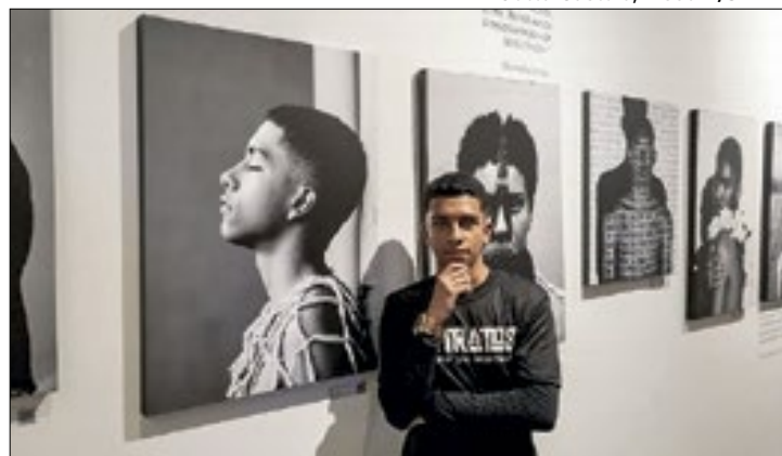
Jovens do Sol Nascente registram faces da comunidade