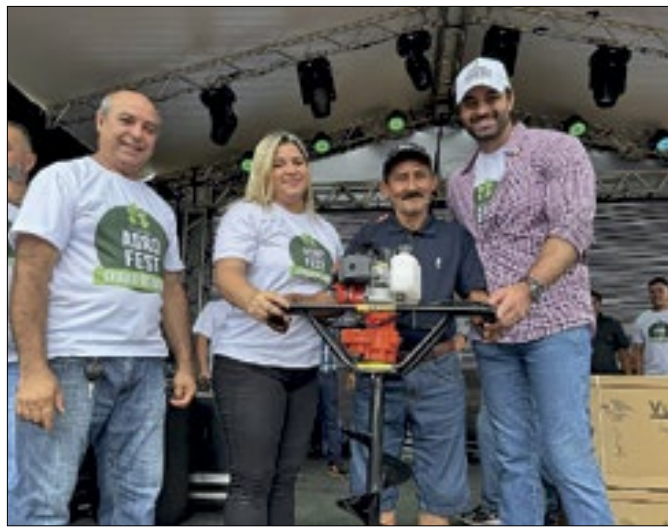
Iniciativas vão abranger os 16 municípios do estado