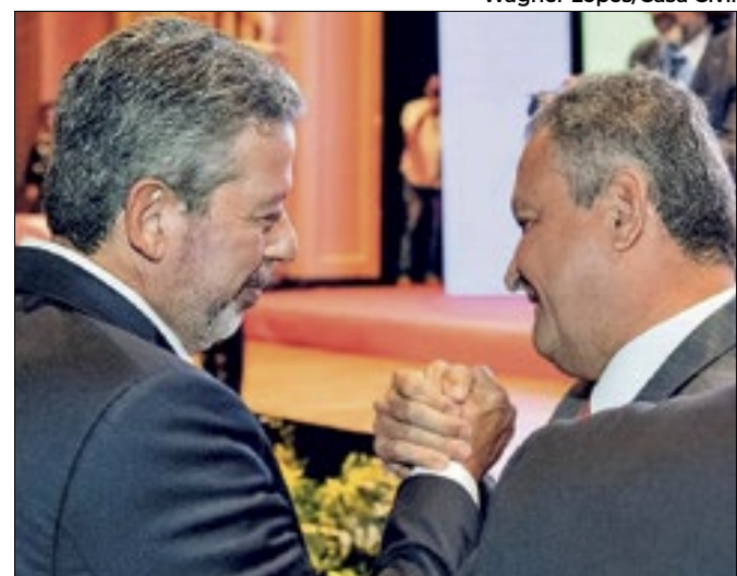
Lira e Costa: conversa e negociações