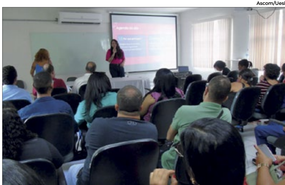
A Universidade Estadual do Sudoeste da Bahia abre portas para inclusão de pessoas trans

O Sport Club, time de futebol de Pernambuco doou camisetas e ingressos para a moeda social Capiba, em parceria com a prefeitura do Recife. A moeda digital Capiba incentiva a realização de desafios relacionados aos serviços municipais, possibilitando a troca por prêmios e produtos.