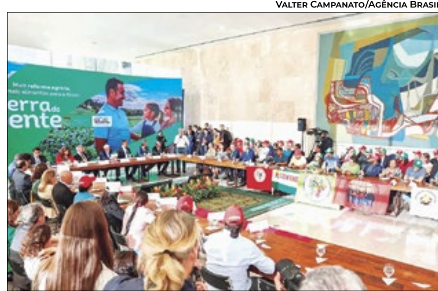
PROGRAMA PREVÊ NOVAS FORMAS DE DESTINAÇÃO DE ÁREAS RURAIS

enfrentar um velho problema. Eu pedi ao [ministro] Paulo Teixeira que fizesse um levantamento, com a ajuda dos governadores, das secretarias que cuidam das terras em cada estado, com o pessoal do Incra nos estados, para gente ter noção de todas as terras que podiam ser disponibilizadas para assentamento nesse país”, afirmou