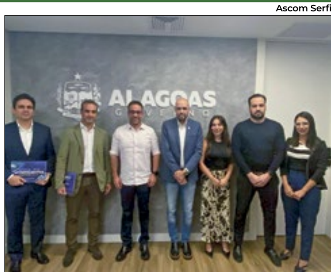
Reunião reforçou o potencial econômico do estado

Universidade baiana desenvolve políticas afirmativas para inclusão