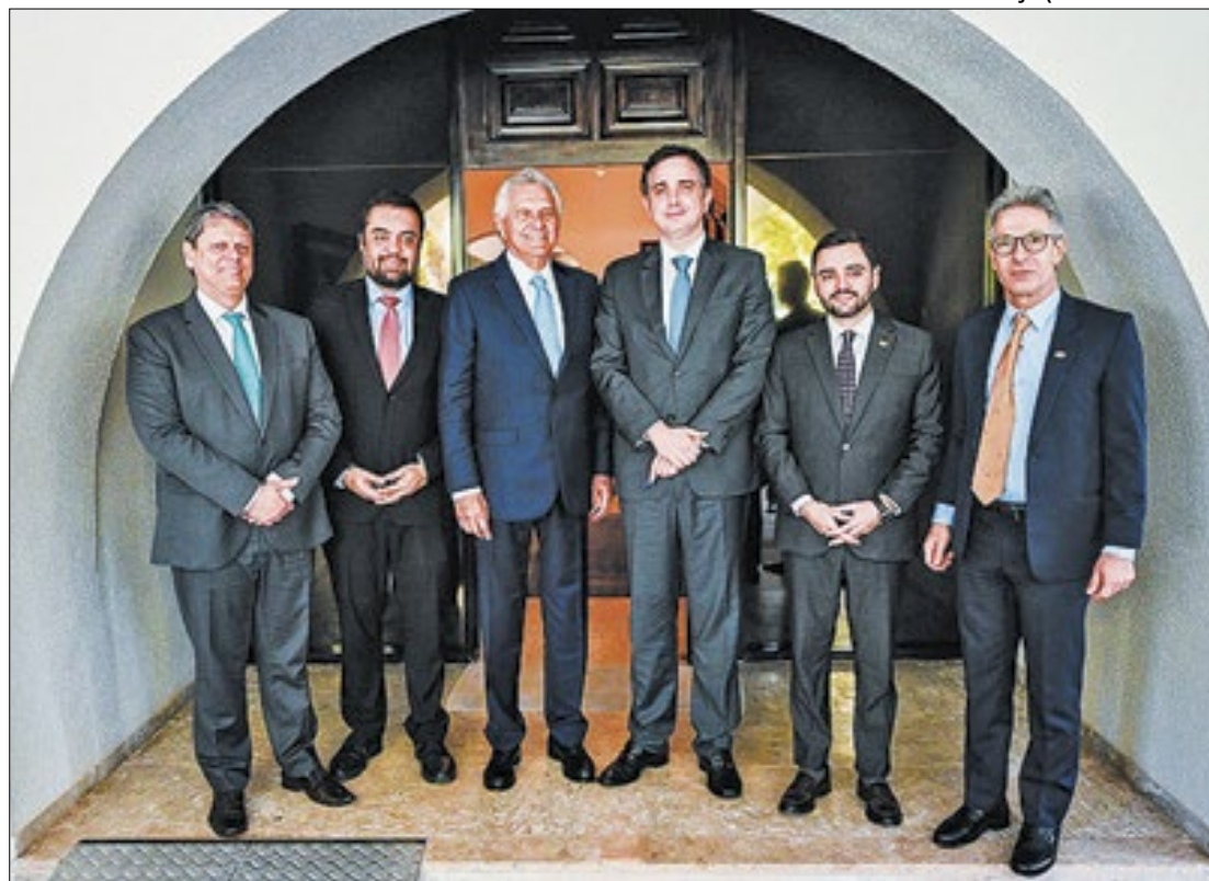
Estiveram os governadores de MG, RJ, SP, RS e GO.

Caiado destacou que a proposta é que as dívidas sejam corrigidas pela inflação medida pelo IPCA mais 1%.