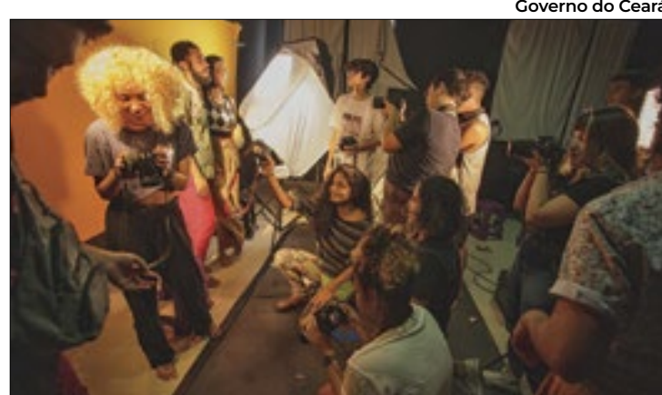
Governo do Ceará

A condição imprópria é atribuída a fatores como a presença de coliformes fecais, indicando poluição bacteriana, e outros contaminantes, que podem representar riscos à saúde dos banhistas.