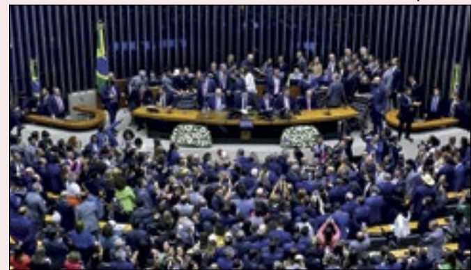
Congresso vai se reunir para analisar vetos de Lula