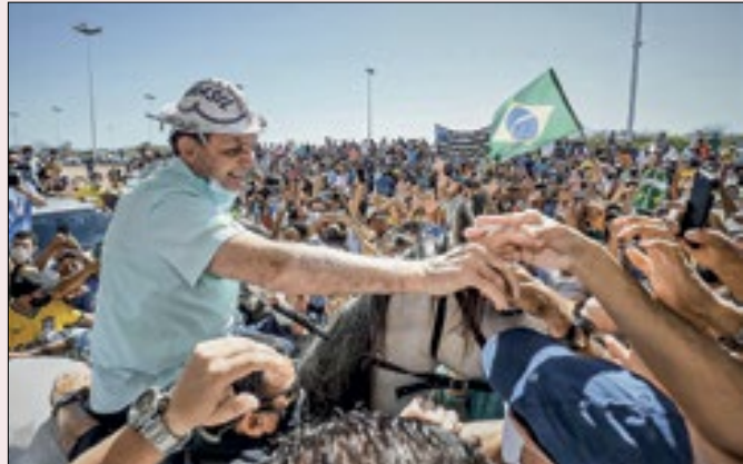
Bolsonaro teria força como cabo eleitoral