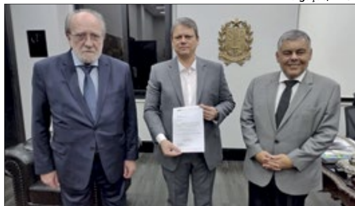
Tarcísio recebeu a lista tríplice no sábado