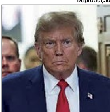
Trump esteve em tribunal

Donald Trump se apresentou a um tribunal de Nova York ontem por supostamente comprar o silêncio de uma atriz pornô durante a campanha eleitoral de 2016. O caso é o primeiro julgamento penal de um ex-presidente dos Estados Unidos. O candidato do Partido Republicano para as eleições presidenciais deste ano saudou apoiadores que o aguardavam na saída da Trump Tower.