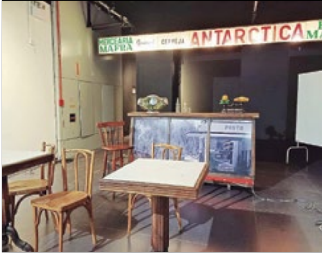
Exposição com peças cenográficas