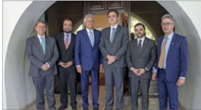
Reunião foi realizada em Brasília nesta segunda-feira

“O presidente Rodrigo Pacheco quis ouvir os estados que têm uma dívida mais expressiva para desenhar uma proposta em conjunto com a União e fazer uma mediação”, declarou Cláudio Castro, que participou do encontro ao lado dos governadores Tarcísio de Frei-