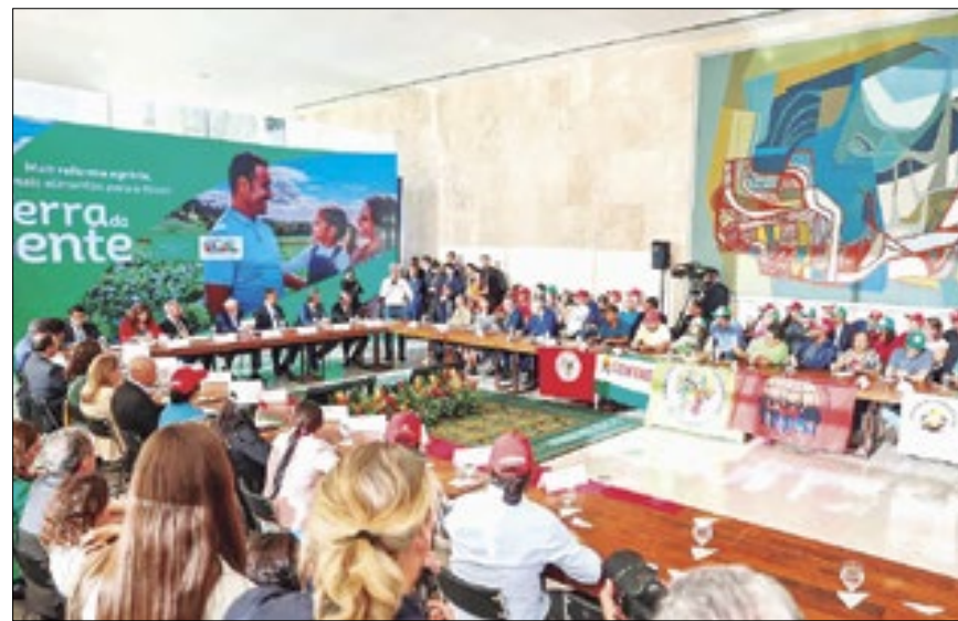
PROGRAMA PREVÊ NOVAS FORMAS DE DESTINAÇÃO DE ÁREAS RURAIS

Segundo números do Instituto Nacional de Colonização e Reforma Agrária (Incra), no Brasil, 89 mil imóveis