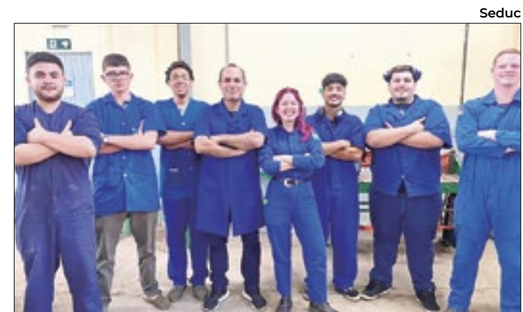
Equipe é formada por estudantes do curso técnico

Os produtos com foco na operação Ambiente Seguro são regulamentados pelo Imetro e, portanto, devem exibir o selo de conformidade do Instituto, que é a evidência de que foram testados e atendem aos requisitos mínimos de segurança. O Imetro e os órgãos delegados regularmente monitoram o mercado, seja realizando periodicamente operações especiais ou mesmo as fiscalizações rotineiras com o intuito de promover a segurança dos produtos comercializados no Brasil. Consumidores que identificarem produtos sem o selo do Imetro no mercado formal devem realizar denúncias à Ouvidoria pelo telefone 0800 643 5200 ou pelo e-mail: ouvidoria@imetro.sc.gov.br