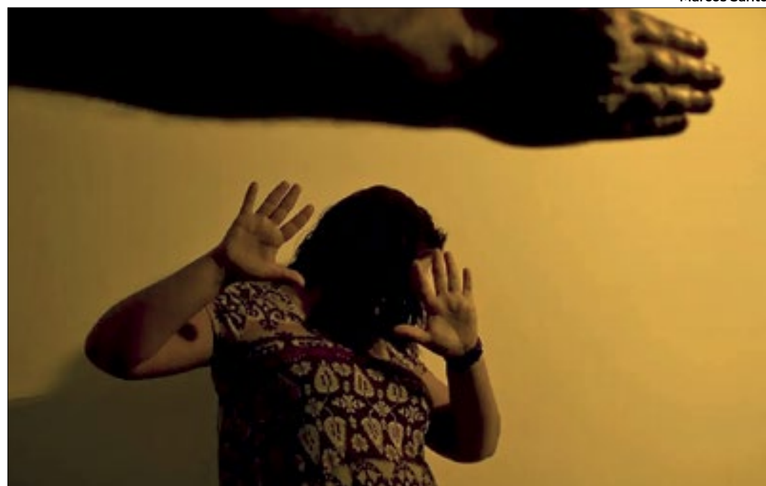
Tentativas de feminicídio cresceram 12,5% e casos com morte tiveram queda de 50%

Casos ocorreram em Sol Nascente, Asa Norte e São Sebastião