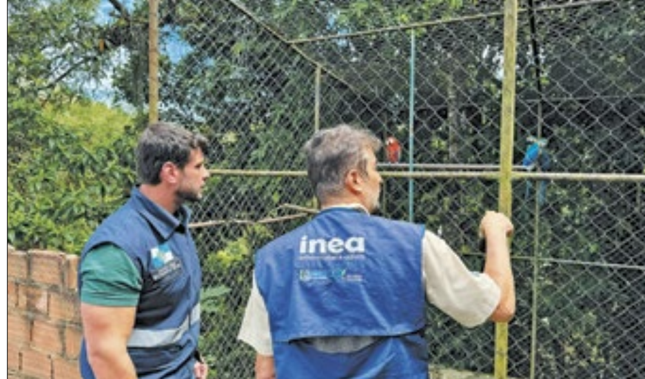
Entre as espécies encontradas há papagaios ameaçados de extinção

“O tráfico de animais silvestres é um crime cruel e muito lucrativo para os bandidos. Seremos incansáveis no combate! É uma determinação do gover-