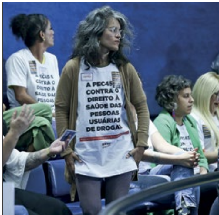
Manifestantes protestaram contra o projeto de lei

O relator da PEC, senador Efraim Filho (União Brasil- PB), disse que a expectativa é