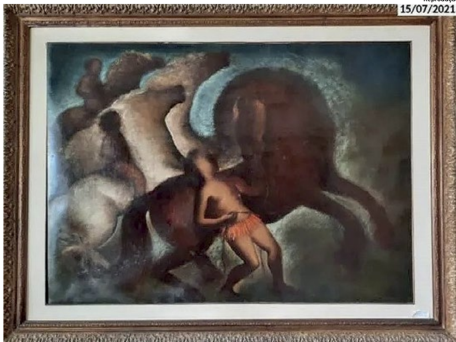
Quadro da série “Cavalos”, de Orlando Teruz, é um dos que estão no leilão

Apesar disso, segundo o IPHAN, o monitoramento não impede a ocorrência do leilão, apenas retém temporariamente lotes específicos para análises quanto ao pertencimento das