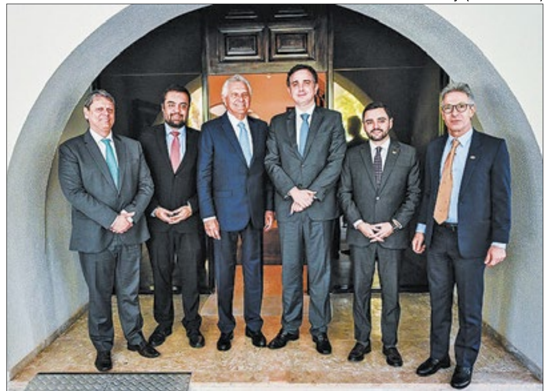
Estiveram os governadores de MG, RJ, SP, RS e GO.

Caiado destacou que a proposta é que as dívidas sejam corrigidas pela inflação medida pelo IPCA mais 1%.