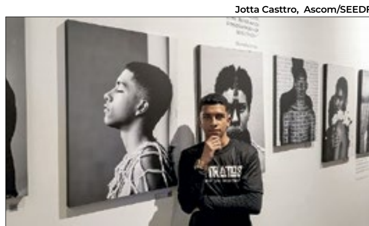
Jovens do Sol Nascente registram faces da comunidade