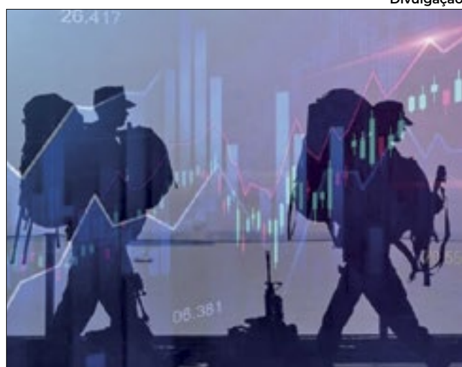
Divulgação Instabilidade externa põe em risco ciclo de baixa dos juros