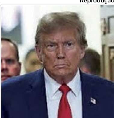
Trump esteve em tribunal

Donald Trump se apresentou a um tribunal de Nova York ontem por supostamente comprar o silêncio de uma atriz pornô durante a campanha eleitoral de 2016. O caso é o primeiro julgamento penal de um ex-presidente dos Estados Unidos. O candidato do Partido Republicano para as eleições presidenciais deste ano saudou apoiadores que o aguardavam na saída da Trump Tower.