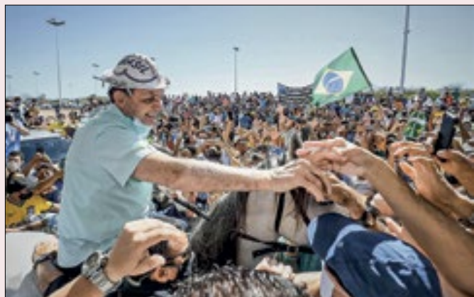
Bolsonaro teria força como cabo eleitoral