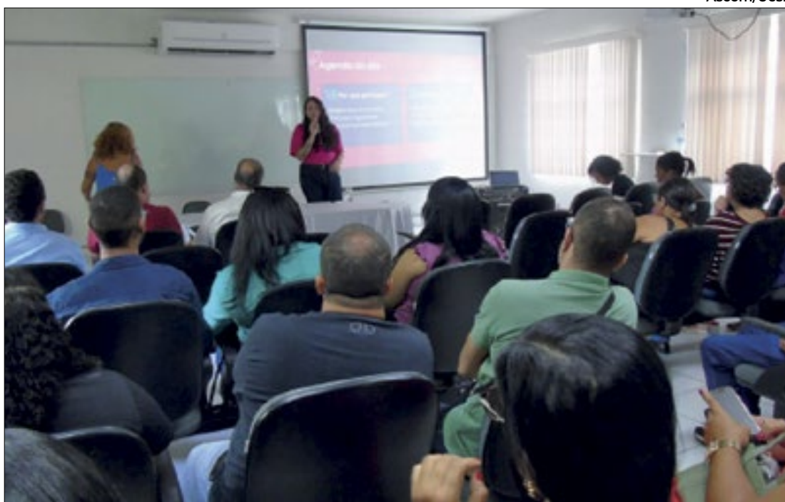
A Universidade Estadual do Sudoeste da Bahia abre portas para inclusão de pessoas trans

Universidade baiana desenvolve políticas afirmativas para inclusão