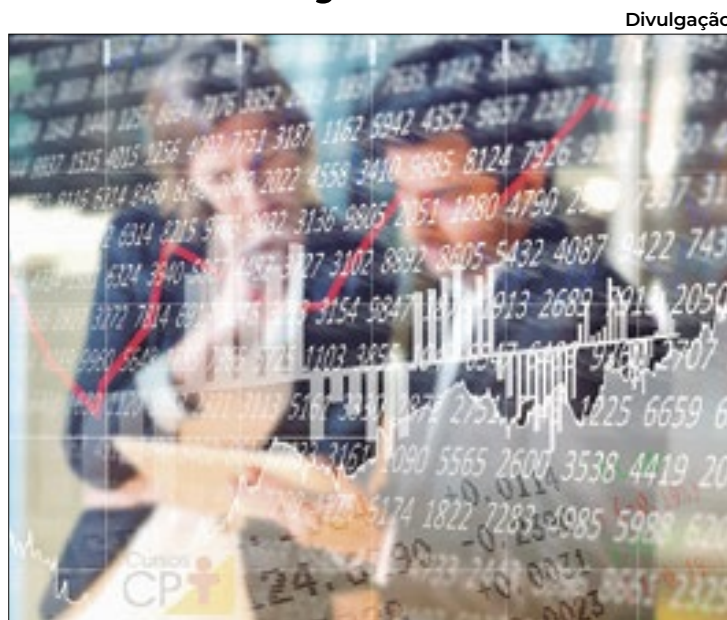
Mercado questiona o futuro da política monetária

Enquanto o impasse não é desfeito, cresce o temor da reedição do ‘descompromisso’ com a meta, relativizada pelo então presidente do BC, Alexandre Tombini, durante a gestão Dilma Rousseff, seguida da queda dos juros e reeleição (será por que?) da ‘presidenta’.