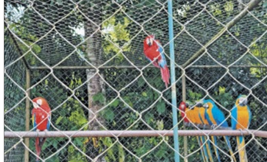
Alguns animais precisam ser encaminhados para cuidados veterinários

As denúncias de crimes ambientais em todo o Estado do Rio de Janeiro podem ser feitas, inclusive de forma anônima, pelo www.rj.gov.br/ouverj/manifestacoes . O contato com a Ouvidoria do Inea também pode ser feito pelo telefone: (21) 2334-5974.