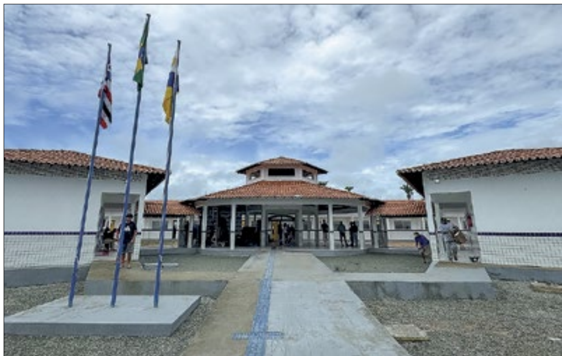
Governo do Maranhão

Segundo dados do Censo Demográfico 2022, divulgados Instituto Brasileiro de Geografia e Estatística (IBGE), Serrano é o município mais negro do Brasil. No último ano, 58,74% da população serranense se au-