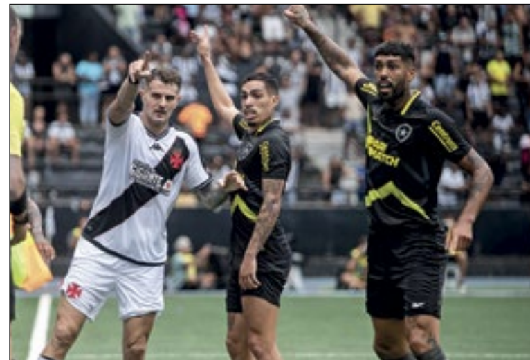
Argentinos são maioria dos estrangeiros do Brasileirão 2024