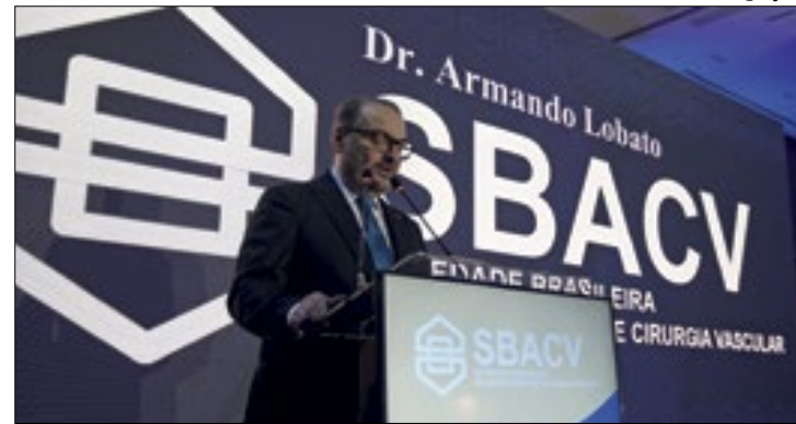
Presidente da SBACV pede atenção com a diabetes

De acordo com a Sociedade Brasileira de Angiologia e Cirurgia Vascular (SBACV), o número médio diário de amputações no Brasil tem aumentado significativamente nos últimos anos, e a tendência é de continuar crescendo caso não haja uma educação com informação adequada e conscientização da população. Em 2020, essa média foi de 75,64, aumentando para 79,19 em 2021. Dados coletados de fontes como o Ministério da Saúde revelaram que, durante esse período de dois anos, um total de 56.513 brasileiros foram submetidos a procedimentos de amputação dos membros inferiores.