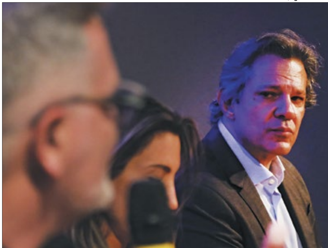
Fernando Haddad: dificuldades em fechar as contas públicas

preocupa muita gente, e com razão. Preocupa o Ministério da Fazenda, mais do que qualquer outro ministério. Se você pegar os dados de 2015 para cá, temos um déficit estrutural nas nossas contas primárias. Não é uma coisa nova, não é uma coisa boa. O Brasil está crescendo menos por causa disso. Nosso esforço é colocar ordem nisso”, garantiu Haddad.