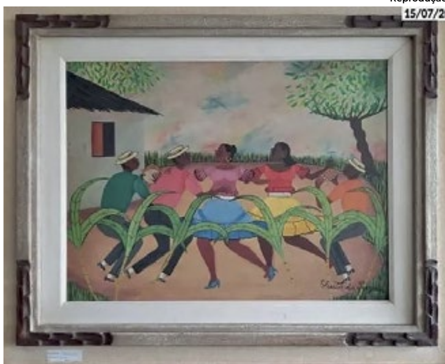
Obra de Heitor dos Prazeres

obras a acervos tombados — bens roubados e procurados. “Destacamos ainda que o IPAHN não possui prerrogativa para a suspensão do leilão”, explicou.