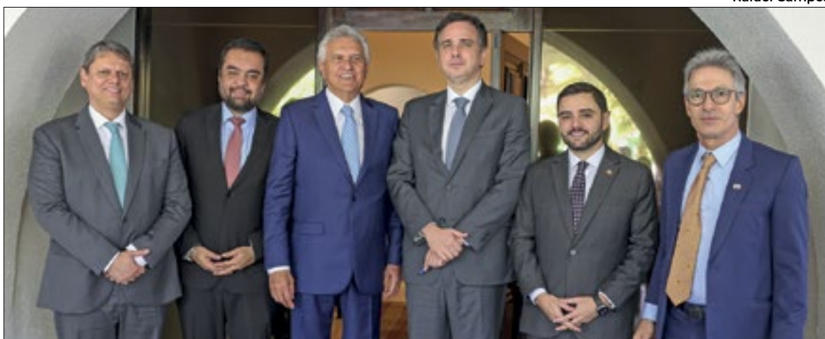
Da esquerda para a direita: Tarcísio de Freitas (SP), Cláudio Castro (RJ), Ronaldo Caiado (GO), Rodrigo Pacheco (presidente do Senado), Gabriel de Souza (vice-governador do RS) e Romeu Zema (MG)

O governador Cláudio Castro, junto com os governadores de São Paulo, Goiás, Minas Gerais e o vice-governador do Rio Grande do Sul, se reuniu com o presidente do Senado, Rodrigo Pacheco, nesta segunda (15), em Brasília, para avançar em um modelo de proposta, a ser apresentada no Congresso Nacional,