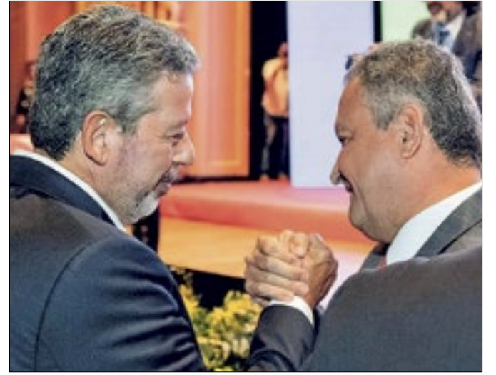
Lira e Costa: conversa e negociações