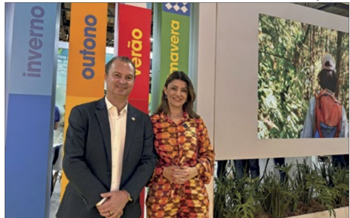
Santa Catarina marca presença na WTM Latin America 2024 e mostra potencial turístico

Durante os três dias de feira, a Setur terá uma agenda com muitas reuniões e ações com grande importância para