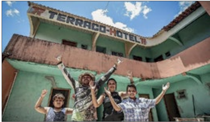
Do Nordeste, o estado foi o que mais reduziu a pobreza