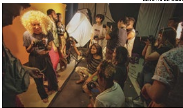
Governo do Ceará

A condição imprópria é atribuída a fatores como a presença de coliformes fecais, indicando poluição bacteriana, e outros contaminantes, que podem representar riscos à saúde dos banhistas.