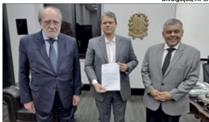
Tarcísio recebeu a lista tríplice no sábado