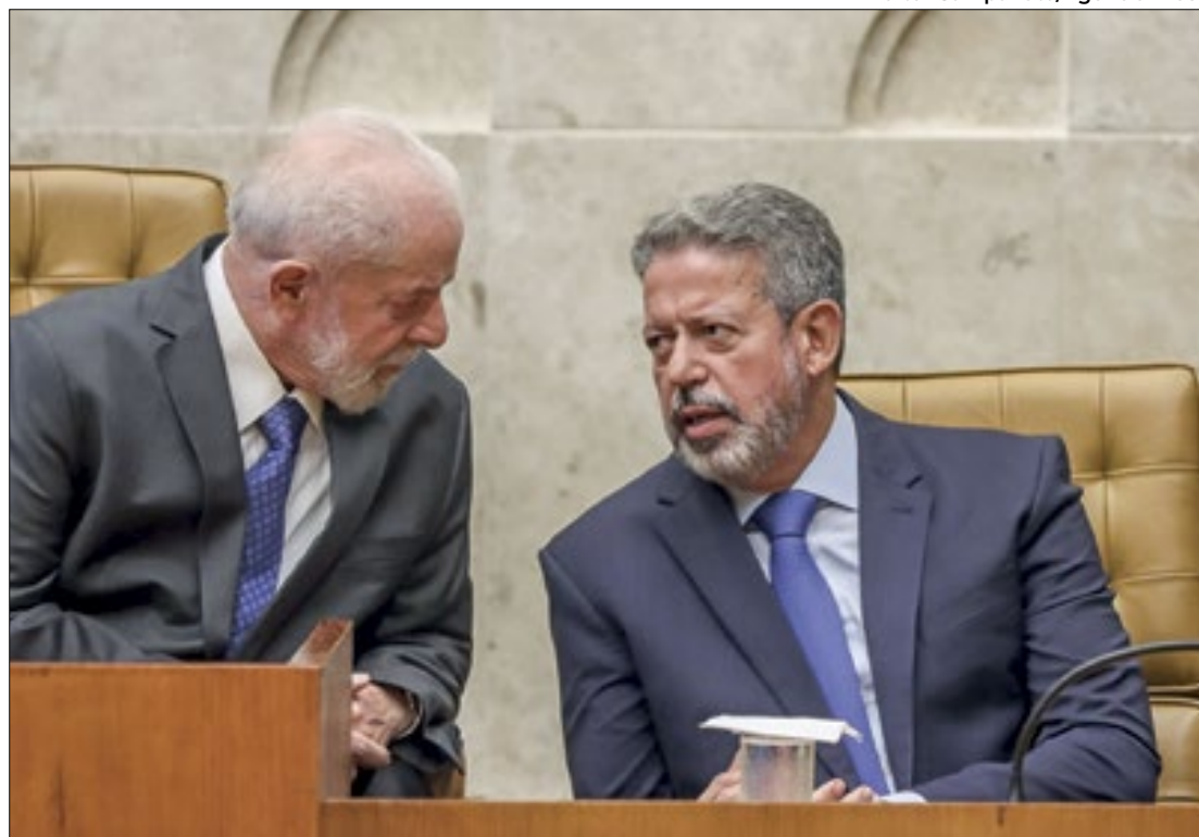
Lira pode impor derrota a Lula para demonstrar força

Em decorrência do entendimento entre o presidente da Câmara dos Deputados Ar-