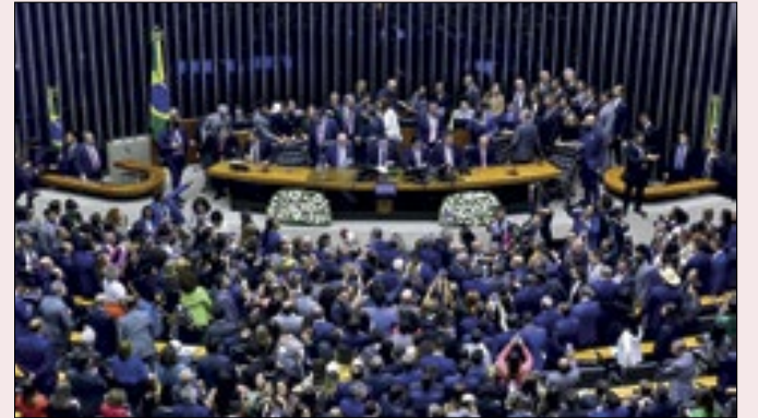
Congresso vai se reunir para analisar vetos de Lula