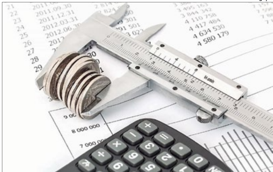
No Projeto de Lei de Diretrizes Orçamentárias de 2025, governo dá ‘marcha a ré’ na meta fiscal

Ao mesmo tempo, a ministra rechaçou a ideia de que, também, estaria sendo revista a meta fiscal para este ano, acen-