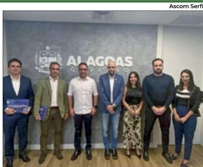
Reunião reforçou o potencial econômico do estado