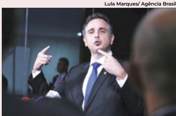
Enquanto Lira morde, Pacheco assopra

Alguns interpretam que o número ainda expressivo dos favoráveis à soltura - 136 deputados - demonstraria a força, diante do tamanho e da repercussão do que representa o assassinato de Marielle. Mas a reação de Lira demonstra que ele ficou incomodado.