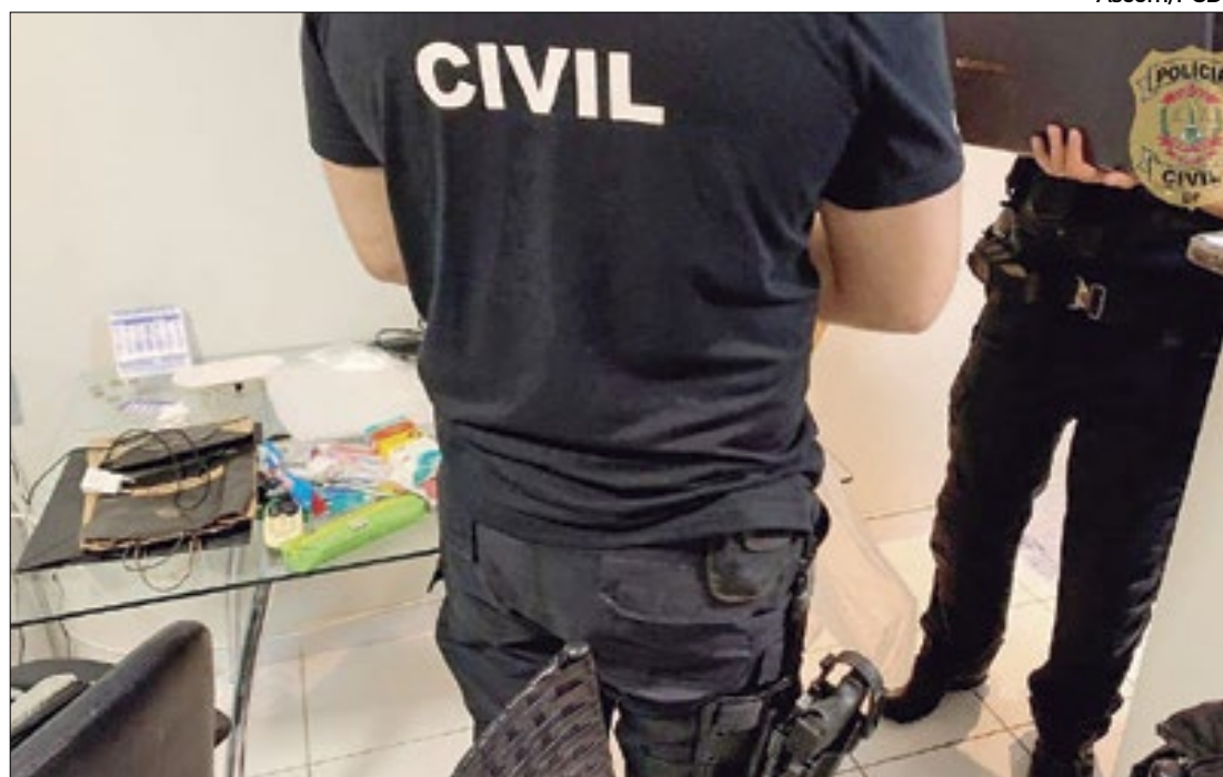
Contas bancárias dos investigados tiveram bloqueio judicial de mais de R$ 11 milhões

Institutos Filantrópicos desviram mais de R$ 27 milhões