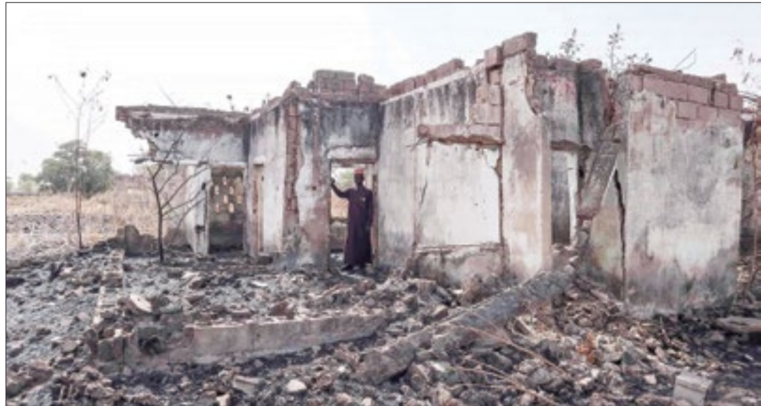
Familiares das vítimas culpam omissão dos governos

A hashtag da qual surgiu o grupo de pressão pela libertação das sequestradas foi compartilhada ao redor do mundo depois do crime, inclusive por gente como a vencedora do Nobel da Paz Malala Yousofzai e a então primeira-dama dos Estados Unidos, Michelle Obama.