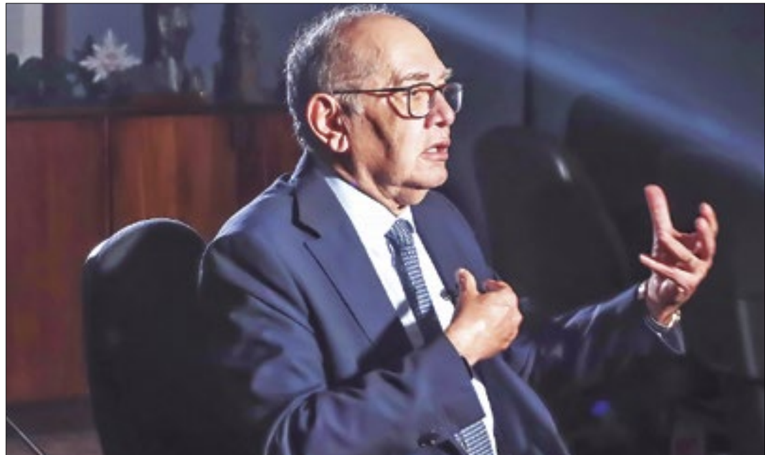
Ampliação foi proposta pelo ministro Gilmar Mendes, relator do caso

Com seis votos favoráveis, a surpresa do julgamento até o momento é o voto favorável do presidente da Corte, ministro Luís Roberto Barroso, que inicialmente era contrário à medida. Após o texto voltar de um pedido de vista de Barroso, o ministro concordou com o relator de que