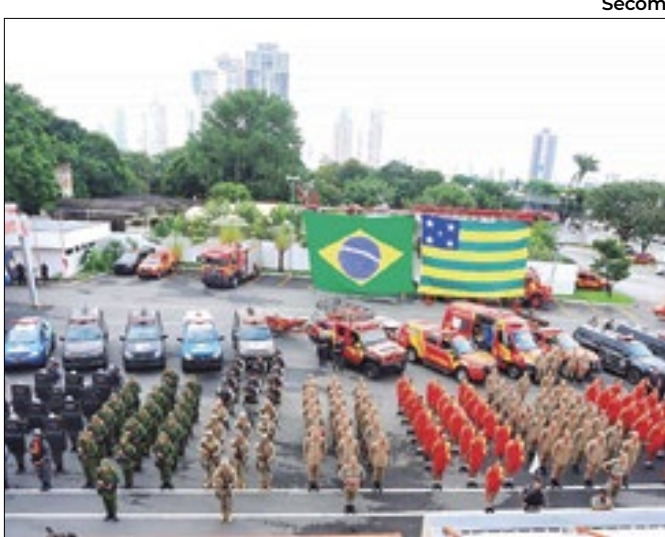
Roubo de carga registrou maior queda, de 92%