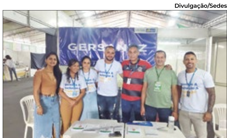
Servidores orientaram sobre segurança alimentar

Se condenados, os investigados responderão pelos crimes de Associação Criminosa, Estelionato, Falsificação de Documento e Lavagem de Dinheiro, podendo pegar até 24 anos de prisão.