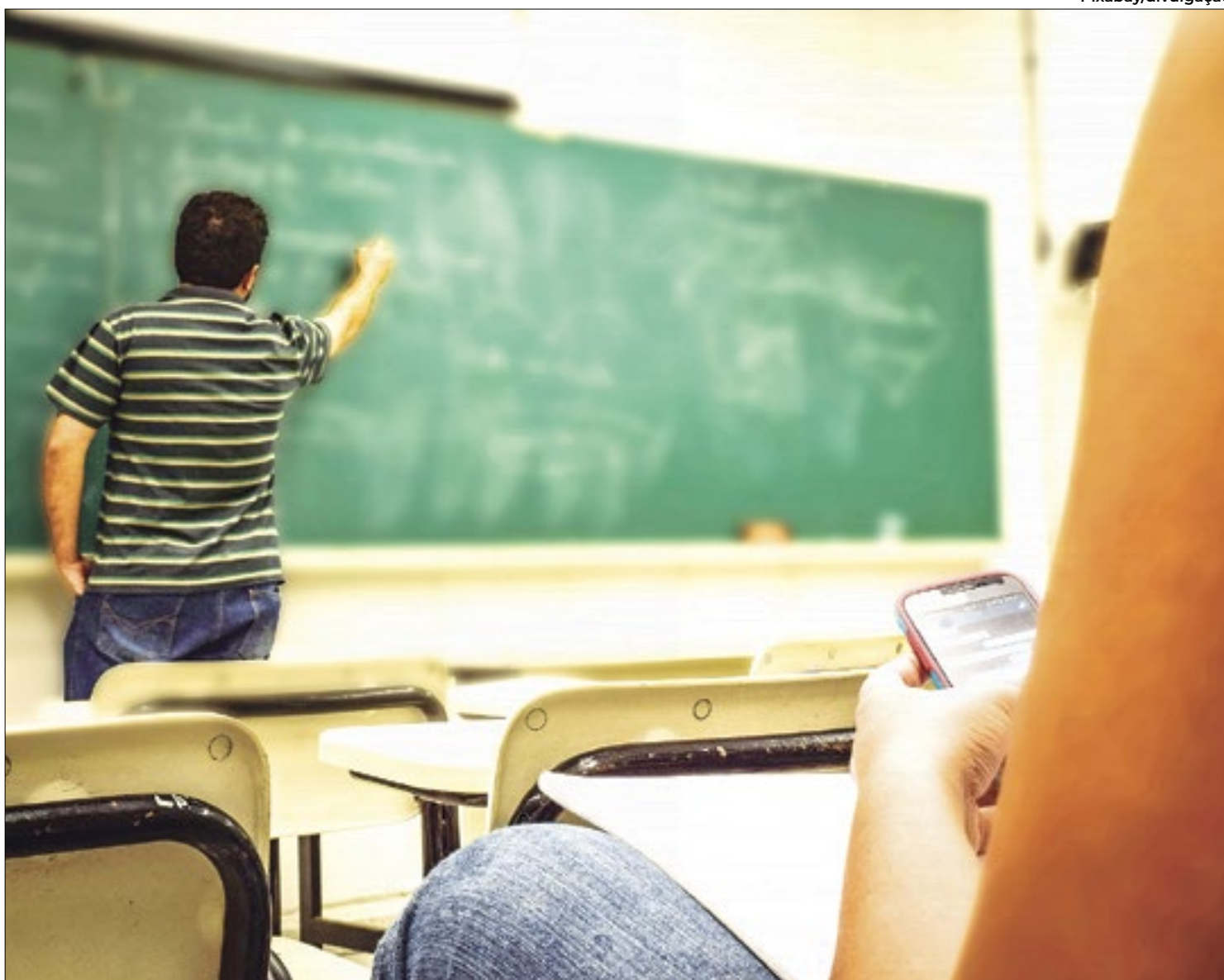
Caso gerou repercussão nas duas escolas