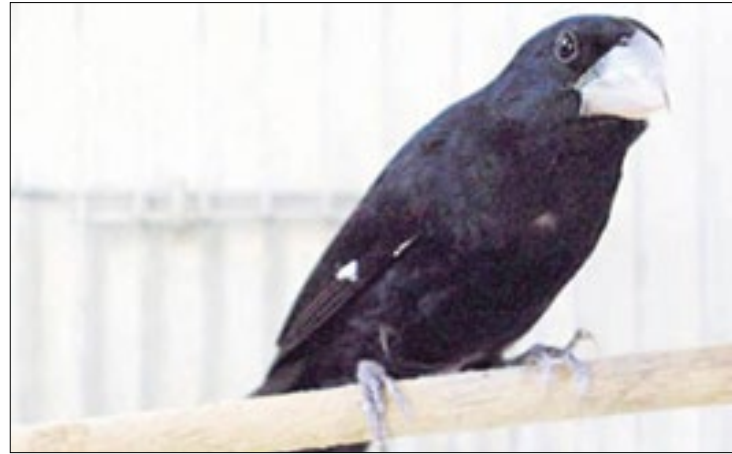
Santa Catarina reforça medidas de biossegurança