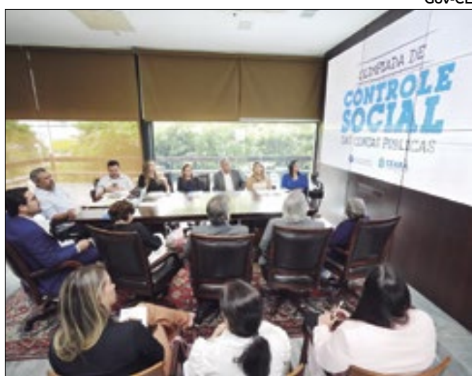
Projeto estimula o conhecimento sobre gestão pública

Litoteca Intercultural busca integrar saberes geológicos e culturais