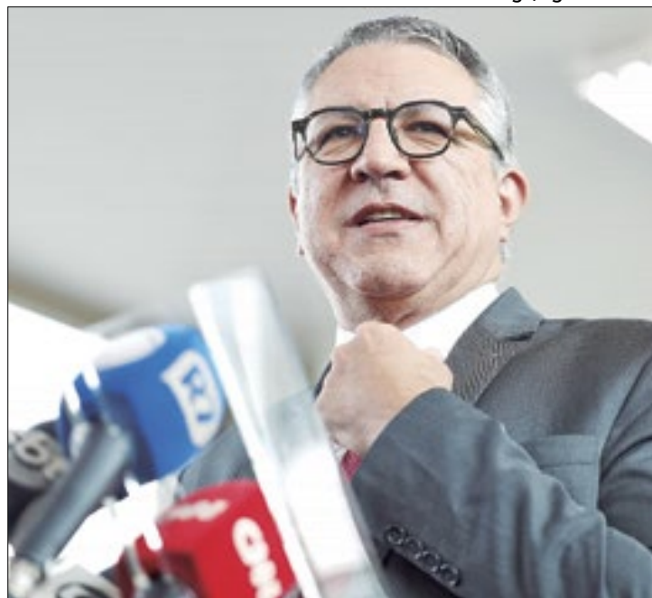
Padilha diz que "não vai descer ao mesmo nível" que Lira

A resposta do ministro veio após críticas públicas de Lira ao ministro. No dia seguinte após a Câmara determinar a manutenção da prisão do deputado