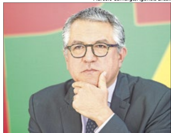
Ministro é alvo de presidente da Câmara