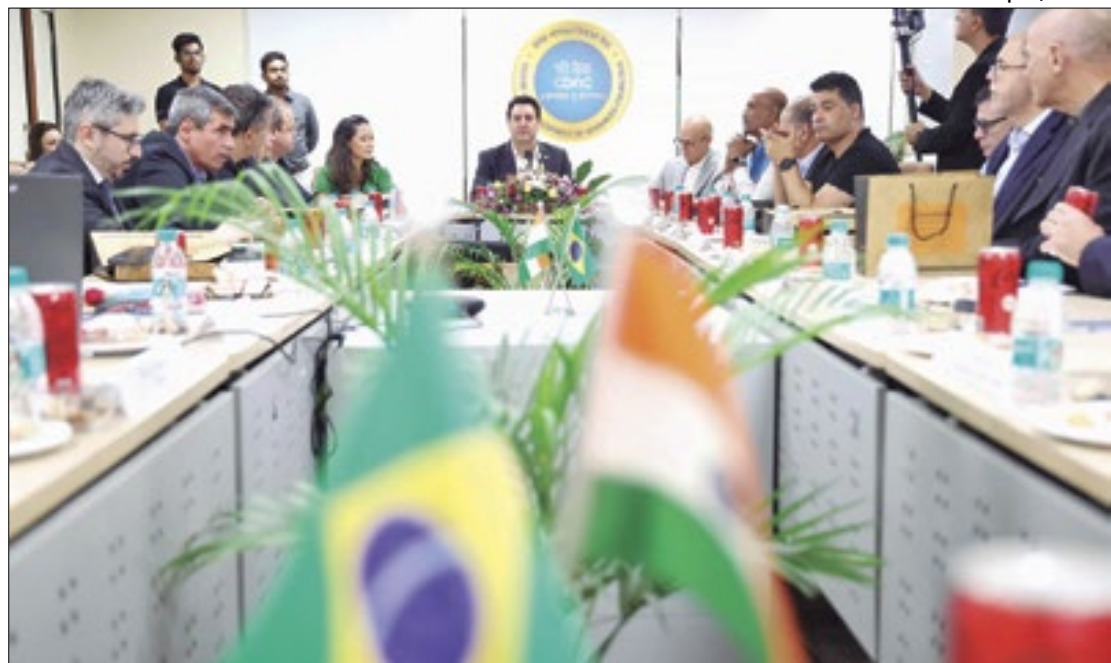
Parceria com a Índia: Governo quer levar supercomputadores para as universidades

Na sede do C-DAC, em Pune, Ratinho Junior e a comitiva paranaense visitaram o Supercomputador Airawat, um dos maiores do mundo em inteligência artificial para empresas. O governador des-