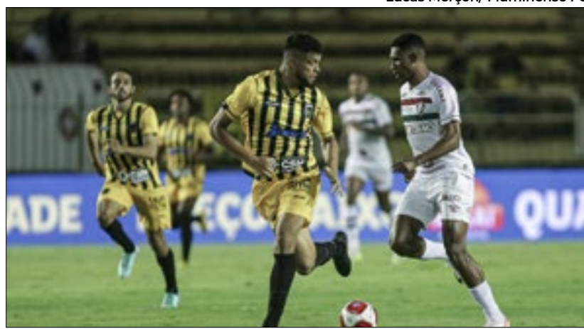
Volta Redonda é um dos destaques desta edição da Série C