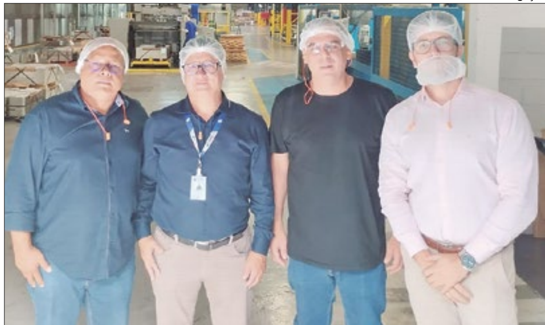
Parlamentar aproveitou para conhecer detalhes técnicos do processo de transformação da matéria prima