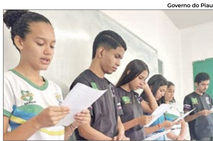
Projeto visa desenvolver habilidades de produção textual

Todo o material da Litoteca será coletado durante as aulas de campo, acompanhadas por estudantes do Instituto de Geologia da UFBA e representantes das comunidades tradicionais do território.