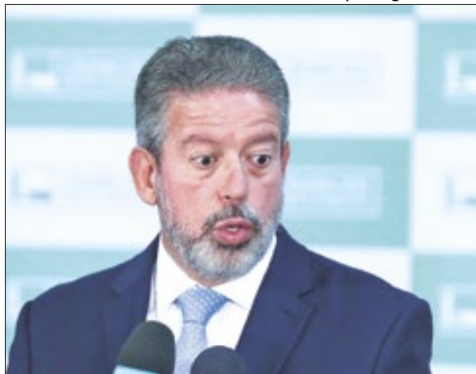
Incômodo de Lira foi significativo