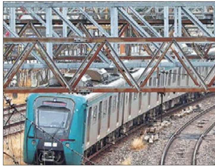
Ticket do trem aumentou para R$ 7,10 e metrô para R$ 7,50

“A Tarifa Social é um compromisso da minha gestão do qual não abro mão. Esse benefício reduz o peso do transporte no bolso do trabalhador, funcionando como uma política pública de transferência direta de renda. Ela também tem valor para o dinamismo da economia, reduzindo custos para o empregador, garantindo a manutenção e a geração de mais empregos”, afirmou Castro.