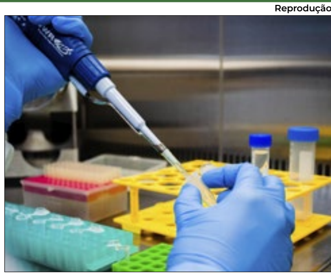
Também serão oferecidos outros atendimentos