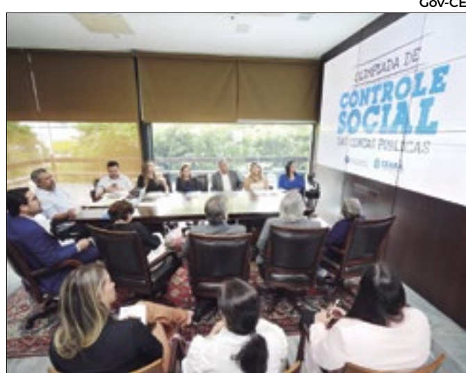
Projeto estimula o conhecimento sobre gestão pública

Litoteca Intercultural busca integrar saberes geológicos e culturais