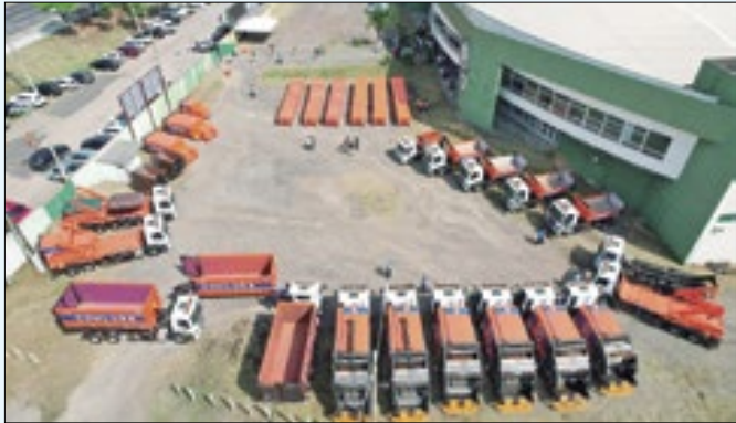
Veículos serão utilizados em Realengo e Bangu