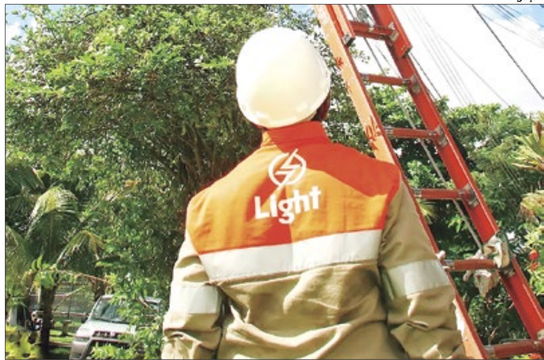
Acordos celebrados dão 'novo' fôlego à recuperação de concessionária