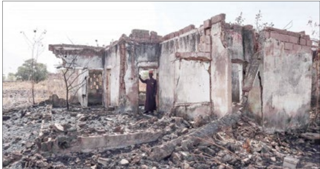
Familiares das vítimas culpam omissão dos governos

A hashtag da qual surgiu o grupo de pressão pela libertação das sequestradas foi compartilhada ao redor do mundo depois do crime, inclusive por gente como a vencedora do Nobel da Paz Malala Yousafzai e a então primeira-dama dos Estados Unidos, Michelle Obama.