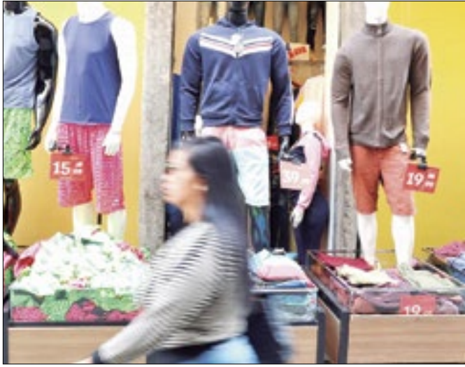
Na passagem mensal, crescimento foi de apenas 0,3%