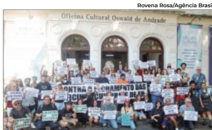
Houve manifestações nas três oficinas culturais da capital

O planejamento da concessionária prevê até 13 frentes trabalhando simultaneamente, em faixas de até 500 metros, para conseguir cumprir toda a obra no prazo de dois anos.