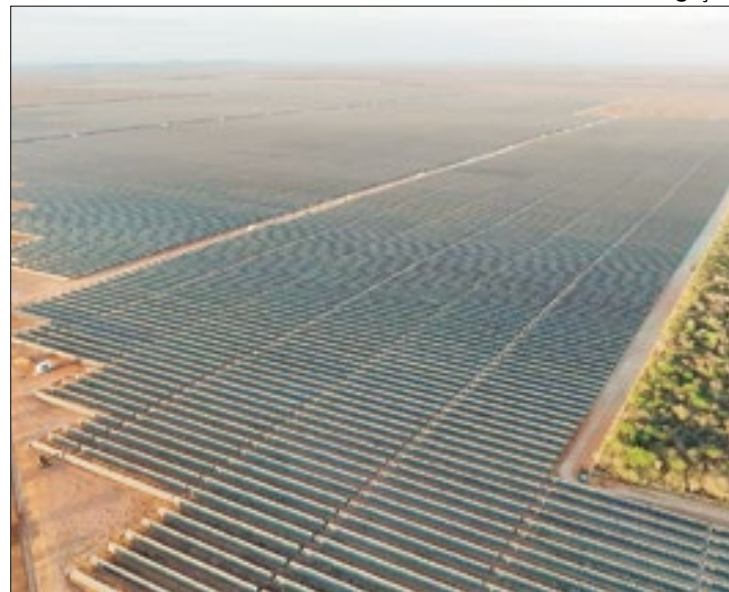
Proximidade com linhas de transmissão definiu localização

Construída para atender, principalmente, um dos maiores consumidores de energia do Brasil, a usina entrou em operação no início de março. Trata-se