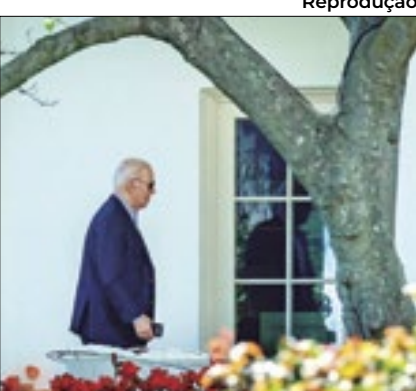
EUA emitem nota de apoio

Os Estados Unidos e a União Europeia condenaram o ataque aéreo do Irã contra Israel neste sábado (13). O governo do presidente Joe Biden emitiu um comunicado em