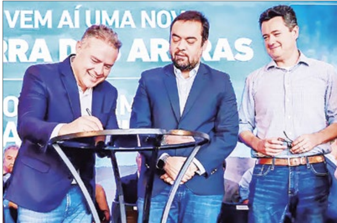
Ministro dos Transportes, Renan Filho também assinou o termo de serviço das obras

“Temos a redução de acidentes, a melhoria da fluidez e a diminuição de reclamações das nossas rodovias. Essa obra vai conseguir atingir em cheio esses três indicadores”, enfatizou Vitale.