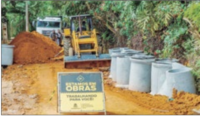
Obra na Rua México, em Albuquerque, em Teresópolis