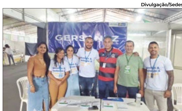
Servidores orientaram sobre segurança alimentar

Após passar pelas comissões temáticas, o texto seguirá para votação em plenário.