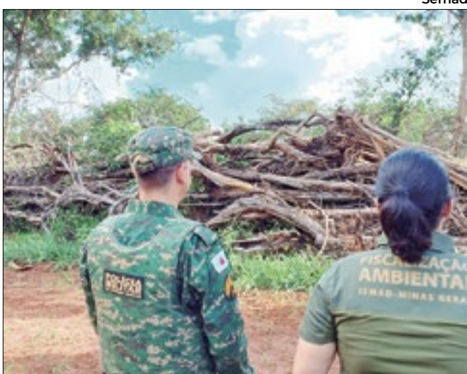
Ao todo, 20 alvos foram fiscalizados