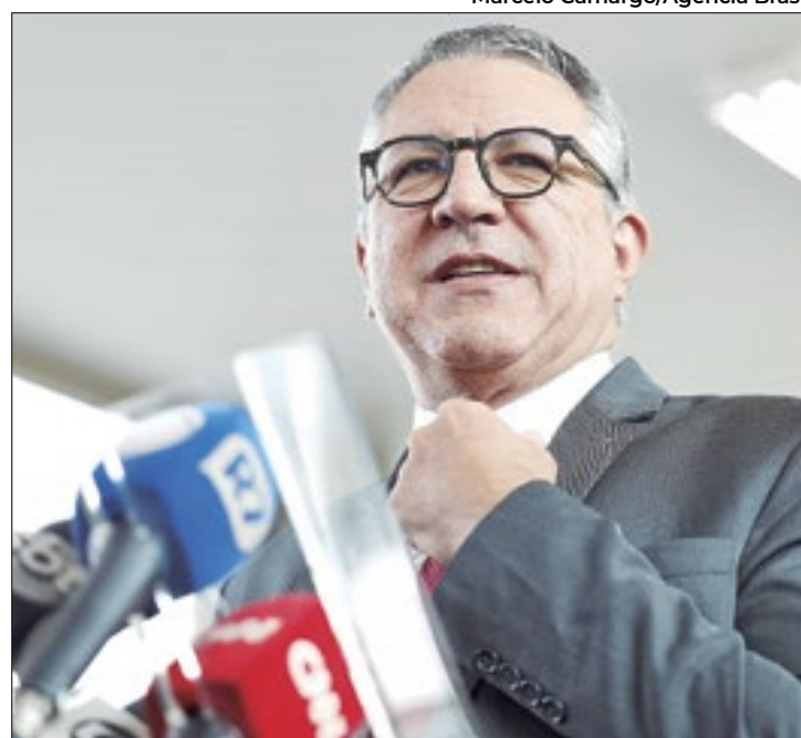
Padilha diz que "não vai descer ao mesmo nível" que Lira

A resposta do ministro veio após críticas públicas de Lira ao ministro. No dia seguinte após a Câmara determinar a manutenção da prisão do deputado