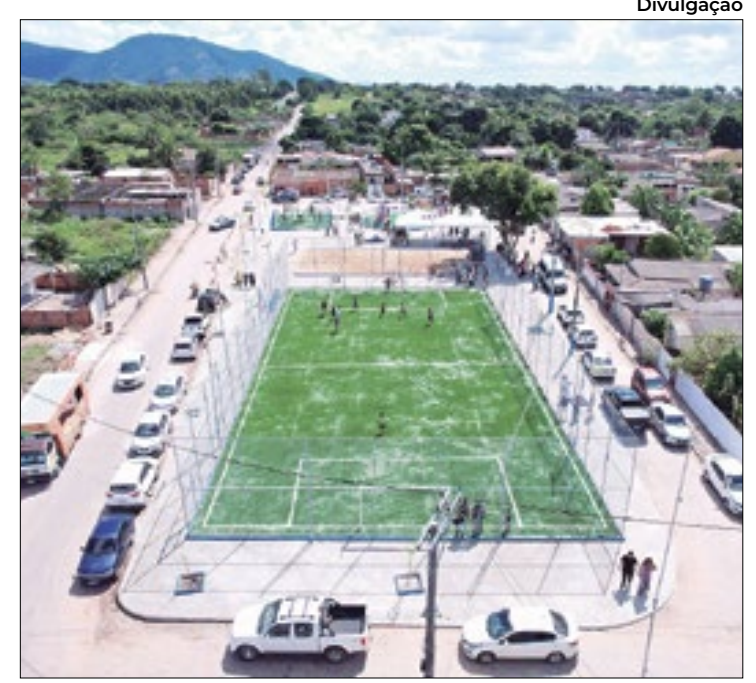
Localidades como Ururai, Tapera e Serrinha receberão obras

Para combater o coronavírus, a população deve tomar as doses das vacinas disponíveis para os gonçalenses com mais de seis meses e higienizar - sempre que possível - as mãos com água e sabão ou álcool em gel. Este hábito evita muitas outras doenças, principalmente as respiratórias.