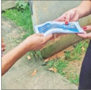
Revisão de valor vai até hoje

Em Três Rios, vence nesta segunda-feira, dia 15, os carnês do Imposto Predial e Territorial Urbano (IPTU). O prazo é válido para o contribuinte que optar pela taxa única, com 15% de desconto, e para quem optar por pagar parcelado em até nove meses. De acordo com a Secretaria de Fazenda, Finanças e Desenvolvimento Econômico, quem discordar do valor cobrado, pode solicitar revisão do cadastro para o exercício de 2024 até hoje.