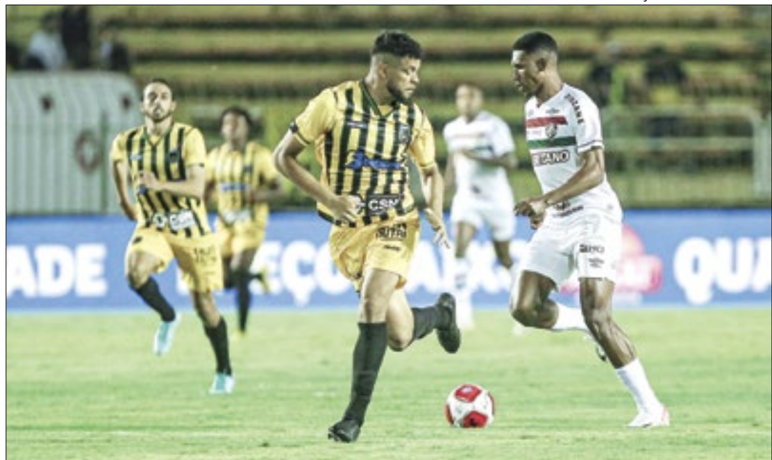
Volta Redonda é um dos destaques desta edição da Série C

a fase final serão divididos em dois grupos com quatro participantes em cada, que jogam entre si em turno e retorno. Os dois melhores de cada grupo sobem para Segunda Divisão. Já os dois melhores de cada uma das chaves decidem o título.