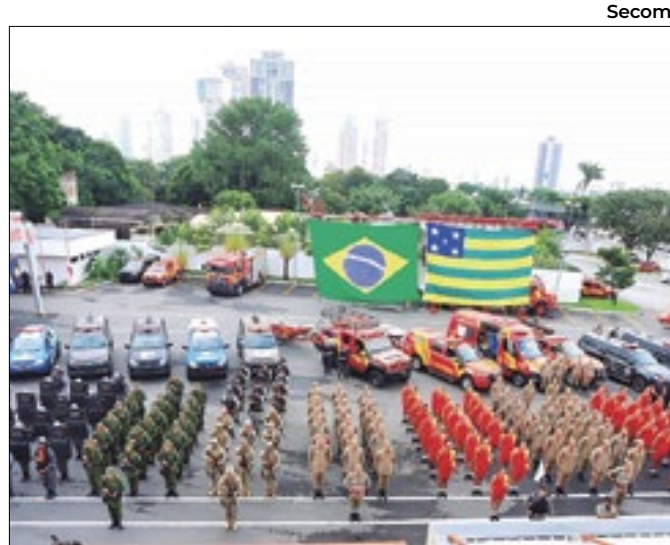
Roubo de carga registrou maior queda, de 92%

Totens conectam ponto de ônibus com central de atendimento