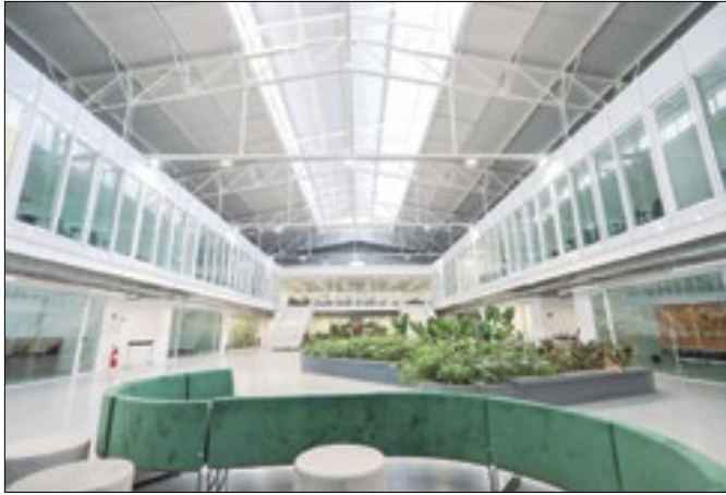
Porto Maravally já tem a IMPA Tech