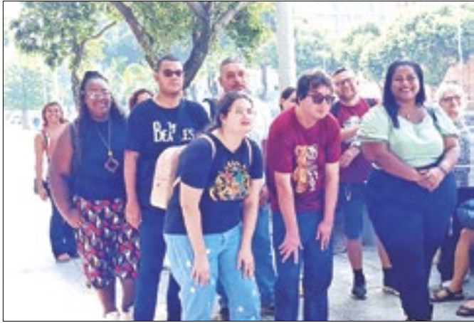
Professores da Rede Municipal participaram de oficina