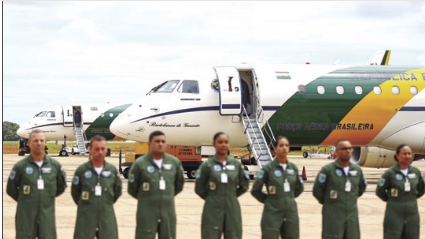
FAB se pôs à disposição para resgatar brasileiros no Oriente Médio

Mesmo assim, o representante do Gabinete de Guerra israelense, Benny Gantz, afirmou que o Irã pagará na hora