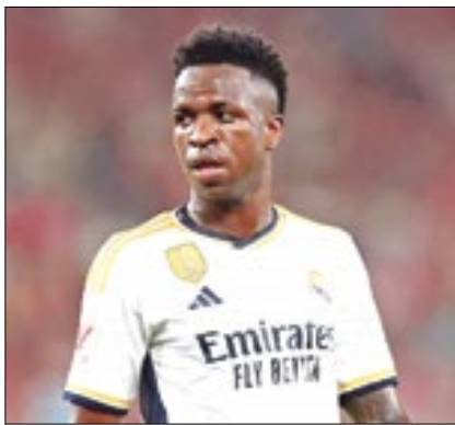
Vini Jr. foi elogiado pelo técnico

Técnico do Real Madrid, Carlo Ancelotti exaltou a "humildade" de Vinicius Jr por ter atuado em uma posição diferente e ajudado Rodrygo no empate entre Real Madrid e Manchester City. Na Liga dos Campeões, Vini Jr atuou mais centralizado e deixou o lado esquerdo do ataque para Rodrygo. A mudança foi algo treinado por Ancelotti e deu muito certo, dando mais liberdade para o companheiro brasileiro do clube.