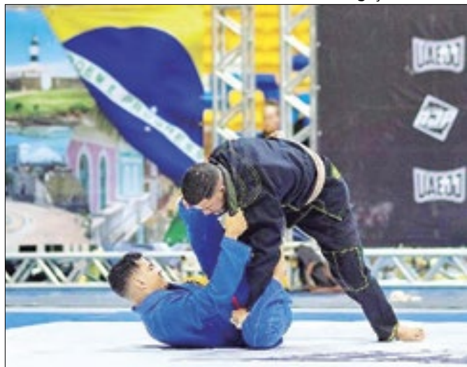
Complexo Esportivo Tarumã recebeu 620 atletas