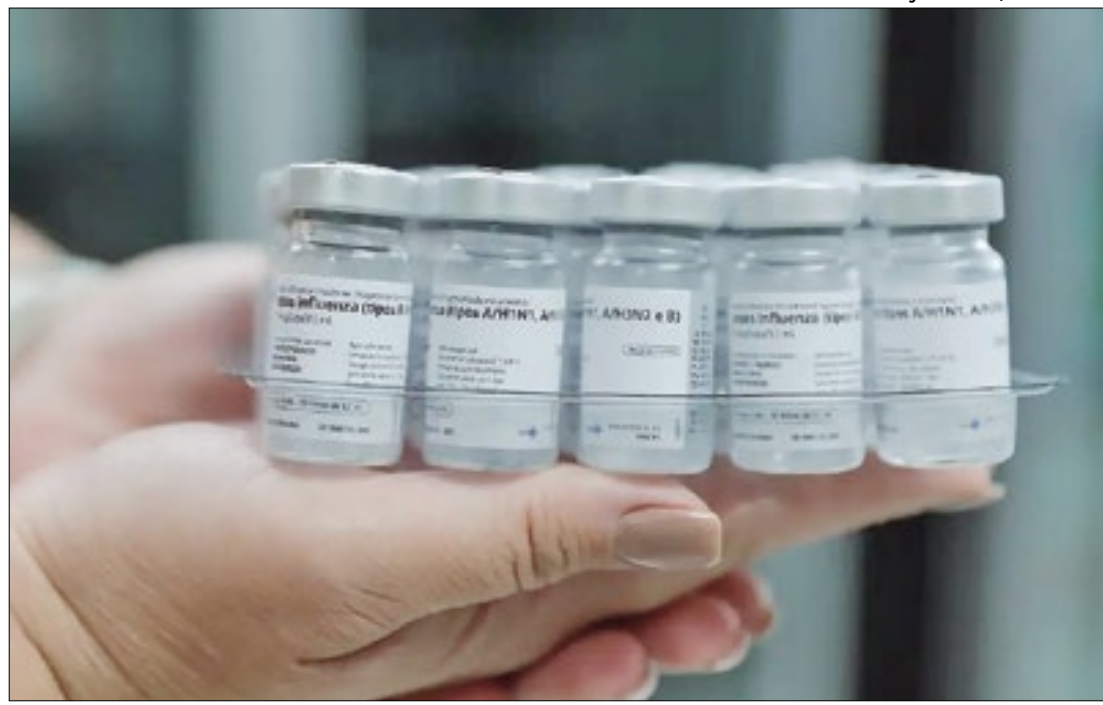
Mais de 2 milhões de doses foram disponibilizadas para serem aplicadas nos postos

Já ponto turístico é o local de interesse “onde os turistas visitam tipicamente pelo seu valor natural ou cultural inerente ou exposto, significado histórico, beleza natural ou construída, proporcionando lazer e diversão”.