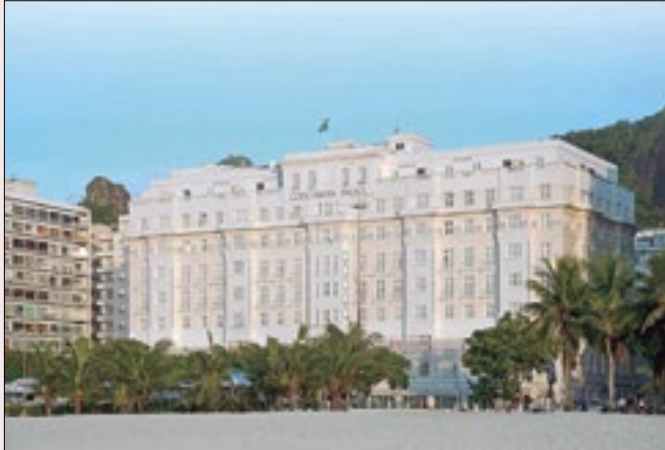
Hotéis deverão se adaptar as novas regras