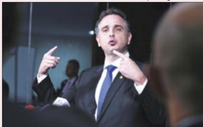
Enquanto Lira morde, Pacheco assopra