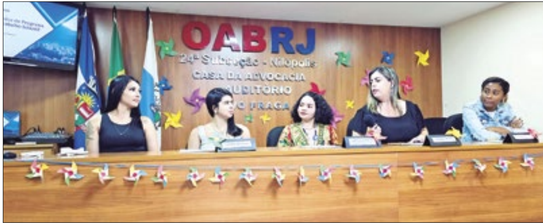
Programa Estadual do Trabalho Infantil (PETI) foi destaque da capacitação