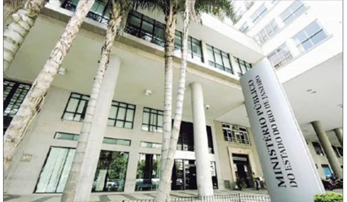
Decisão foi com base em ação movida pelo GAECO/MPRJ que investiga atos ilícitos

MPRJ, a compra fraudulenta dos respiradores ocorreu no ano de 2020, no contexto de um grande esquema de corrupção, com a finalidade principal de desviar recursos públicos da saúde, na época destinados especificamente para o combate à pandemia de covid-19. Os equipamentos foram adquiridos por um valor unitário de R$ 110 mil, totalizando R$ 990 mil. No entanto, conforme apurado, o Hospital Municipal de Carmo sequer possuía condições de instalar e operar os respiradores. Fora isso, de acordo com os critérios da Organização Mundial de Saúde, considerando-se o quantitativo populacional, a necessidade de aparelhos para a cidade era de apenas dois respiradores.