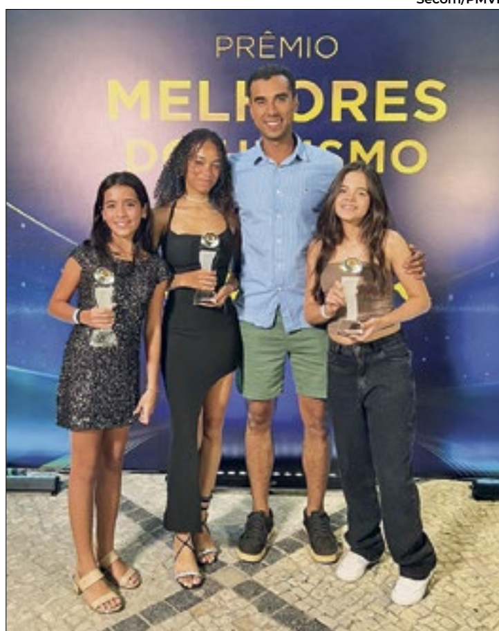
Atletas receberam troféus do 'Melhores do Hipismo 2023'