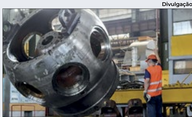
Altas de preços e de volume 'puxaram' resultado

Uma terceira variável para o comportamento positivo das cotações seria a competitividade acirrada entre o minério de ferro e a sucata de aço, uma vez que as margens de lucro seguem apertadas. Já o carvão metalúrgico e o coque subiram 3,36% e 2,5%, respectivamente.