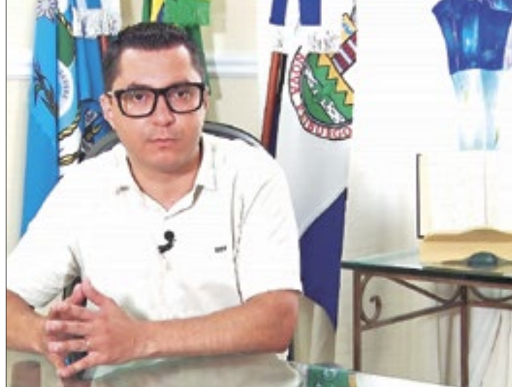
A licitação prevê uma concessão de 30 anos

A limpeza urbana em Friburgo é um desafio persistente. As ruas da cidade revelam problemas nos bairros, como o mato alto, que tomam conta das calçadas e representam um perigo para os