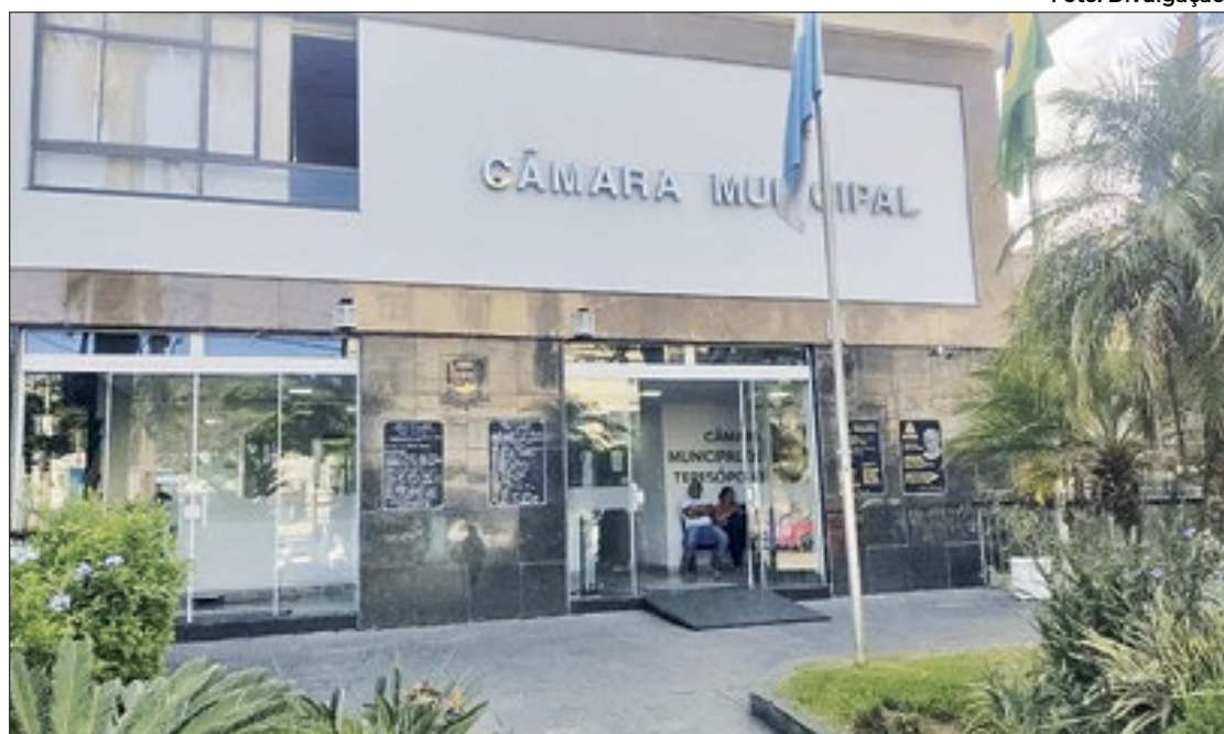
Os apoios estratégicos têm o potencial de moldar o cenário político da cidade

Em apoio à pré-candidatura de prefeito de Teresópolis, Ma-