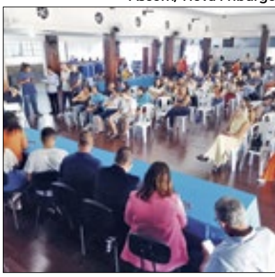
Objetivo é garantir acessibilidade

A Prefeitura de Nova Friburgo, por meio da Secretaria de Assistência Social Direitos Humanos, Trabalho e Políticas Públicas para a Juventude, iniciou a entrega das carteiras de identificação da pessoa com transtorno autista.