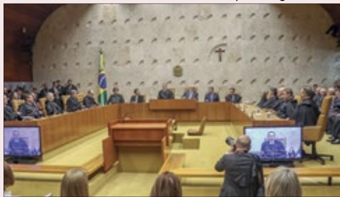
STF: sede do mais forte dos três poderes