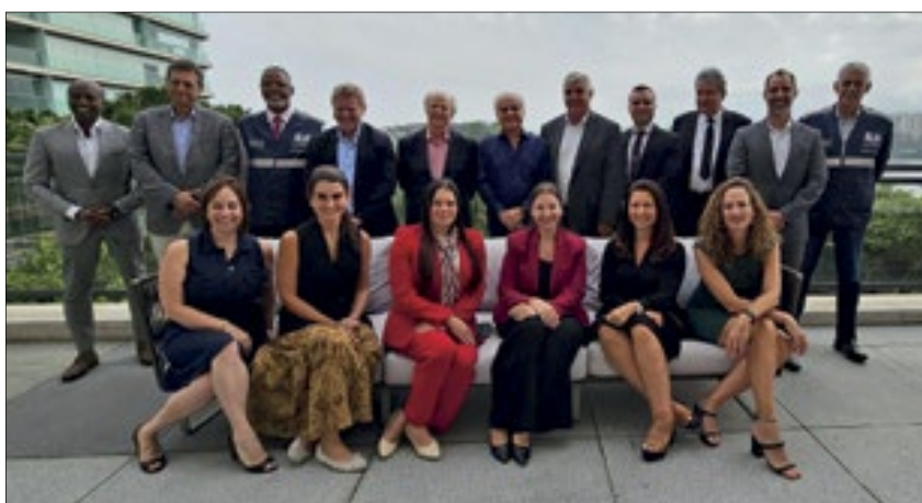
Neste mês, o Grand Hyatt, na Barra da Tijuca, foi o palco do encontro mensal dos diretores e gerentes gerais dos hotéis 5 estrelas do Rio