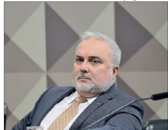
Executivo: crise com ministro de Minas e Energia