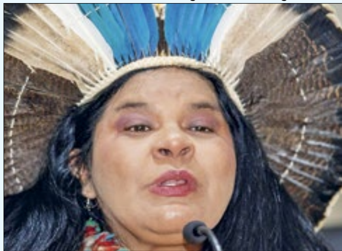
Ministra foi a primeira indígena a receber honraria