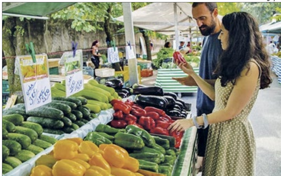
Aos poucos, indicador de inflação continua avançando, ao longo do ano

Tal 'marcha batida' do índice inflacionário foi acompanhada pelo avanço 'módico' do PIB (Produto Interno Bruto), de 1,89% para 1,90%, em contraste com o 'marasmo' percentual dos anos seguintes: em 2%,