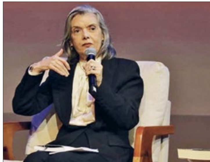
Ministra Cármen Lúcia é presença confirmada

Mais de 60 escritores petropolitanos, nacionais e internacionais estão confirmados para o 1º Festival Literário Internacional de Petrópolis – Flipetrópolis, que será realizado entre os dias 1º e 5 de maio, no Palácio de Cristal. A edição de estreia do Festival traz o tema "Arte, Literatura, Liberdade e Educação" e vai homenagear as autoras Ana Maria Machado e Conceição Evaristo e tem como patrono Juliano Moreira psiquiatra negro, que revolucionou o tratamento de pessoas com transtornos mentais no Brasil e lutou para combater o racismo científico, tendo falecido em 1933, em Petrópolis. Grandes autores, como Carla Madeira, Djamilia Ribeiro, Itamar Vieira Junior, Jamil Chade, Jeferson Tenório, Leonardo Boff, Andrea Pachá, Lívia Sant'Anna Vaz, Bruna Lombardi,