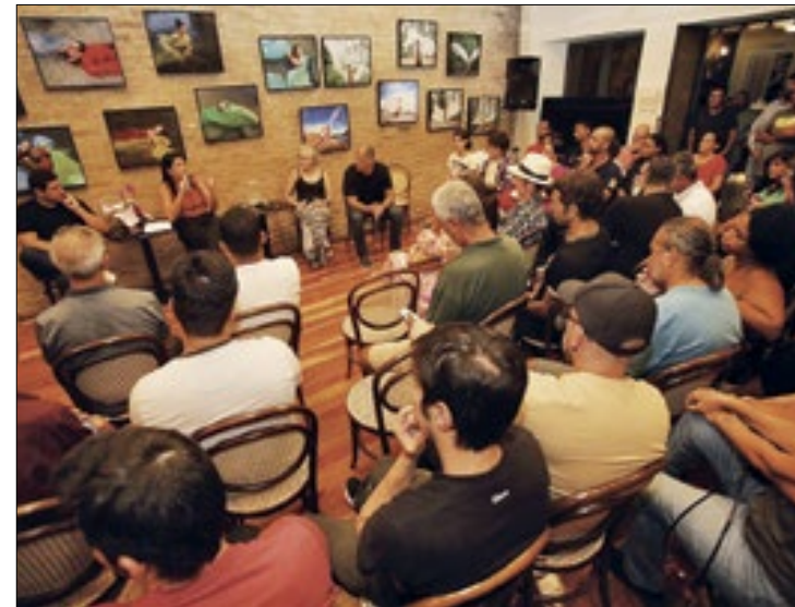
Encontros vão debater ações voltadas às vertentes artísticas