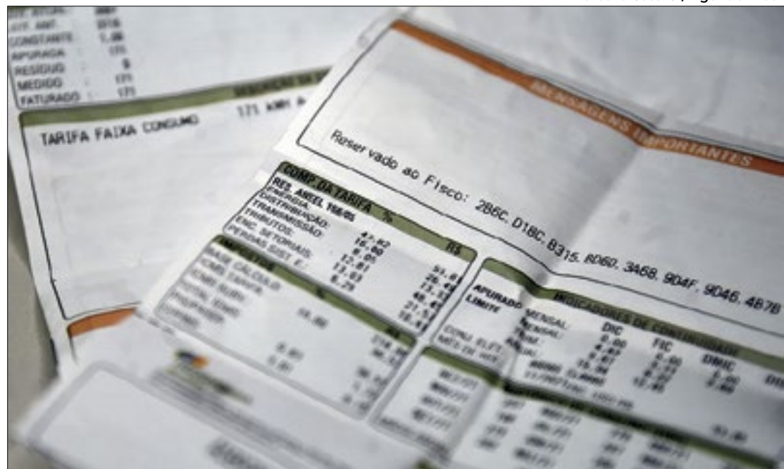
Lei prevê a separação da taxa de iluminação pública nas contas de energia elétrica