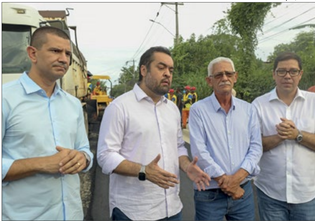
Cláudio Castro durante vistoria nas obras do bairro Bom Retiro, em São Gonçalo

A Prefeitura de Itaboraí entregou a obra de reforma e revitalização da Praça Lindolpho Rodrigues de Souza, no bairro da Jacuba. O local ficou por muitos anos sem receber qualquer manutenção. A praça foi reformada, atendendo a uma antiga reivindicação da comunidade.