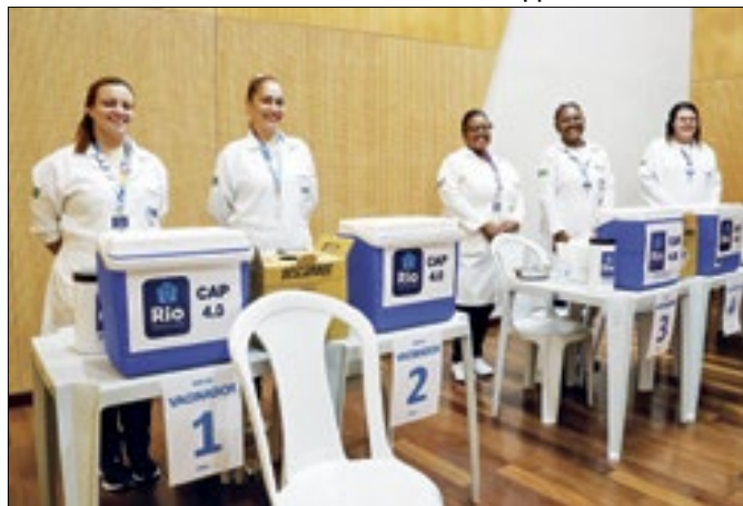
Imunização acontece na Sala Multiuso 3