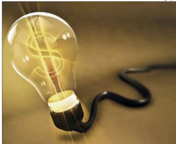
Alívio temporário poderá ficar mais caro para o consumidor

Defendida com 'ardor' pelo titular do Ministério de Minas e Energia (MME), Alexandre Silveira, a matéria legislativa foi assinada pelo presidente da República, a despeito de resistências de alguns setores governamentais. Do ponto de vista do