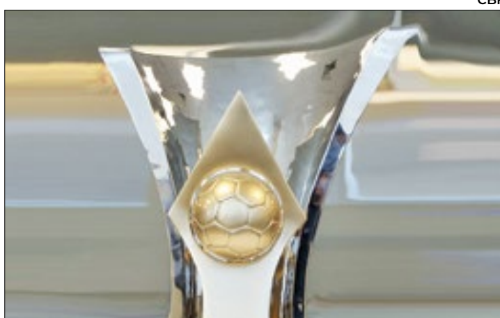
Taça deste ano está com a disputa bem acirrada

O Brasileirão começa neste fim de semana e, no que depender dos estaduais, será uma briga acirrada. Dos 20 participantes, nove focam campeões de seus Estados. Quatro foram vice-campeões. Apenas Corinthians e Botafogo não chegaram nas fases decisivas.