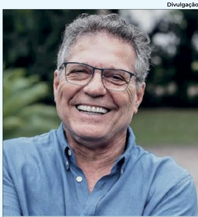
Empresário apoiou a cidade após a tragédia

do COMSEA (Conselho Municipal de Segurança Alimentar e Nutricional Sustentável) e torcemos para que seja acatada pelo Poder Executivo e se torne lei. Essa medida é um passo para garantir a segurança nutricional e também para fortalecer o trabalho dos pequenos agricultores, que têm papel fundamental no município", destaca a parlamentar.