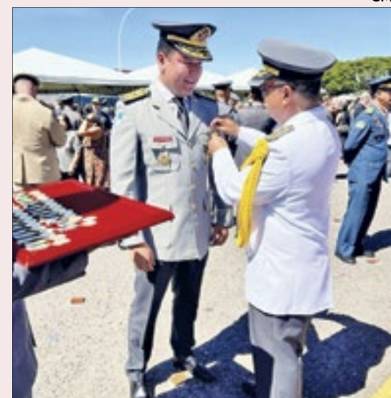
O Comandante Geral do Corpo de Bombeiros do Rio, Cel Leandro Monteiro, foi agraciado em Brasília-DF, nesta terça-feira (9), com a Medalha Murilo de Holanda. Leandro agradeceu a homenagem pela comandante geral dos Bombeiros da capital federal, Cel BM Mônica de Mesquita Miranda