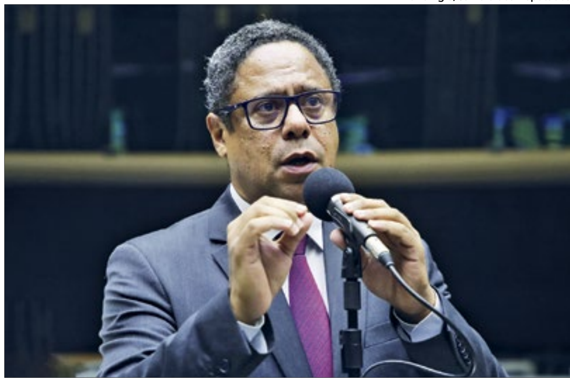
Anúncio sobre a mudança de relatoria do projeto foi divulgada por Arthur Lira

A discussão quanto ao tema voltou à tona após a polêmica envolvendo o ministro do Supremo Tribunal Federal (STF), Alexandre de Moraes, e o dono da rede social "X" (ex-Twitter), o bilionário Elon Musk. Desde o último domingo (7), o bilionário vem atacando o ministro do Supremo Tribunal Federal (STF) Alexandre de Moraes