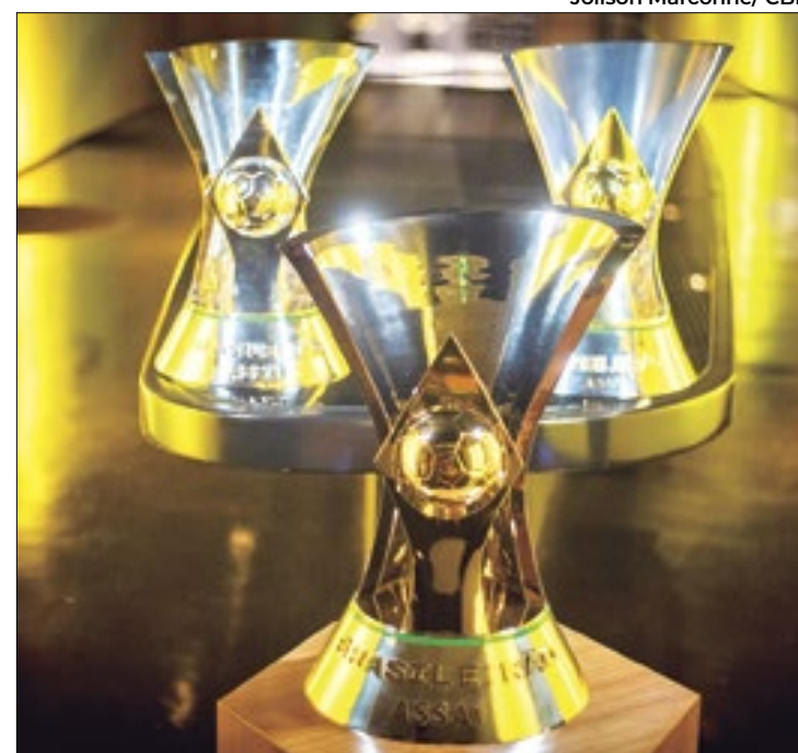
'Racha' na formação de uma liga brasileira pode ser menos lucrativa para os clubes envolvidos