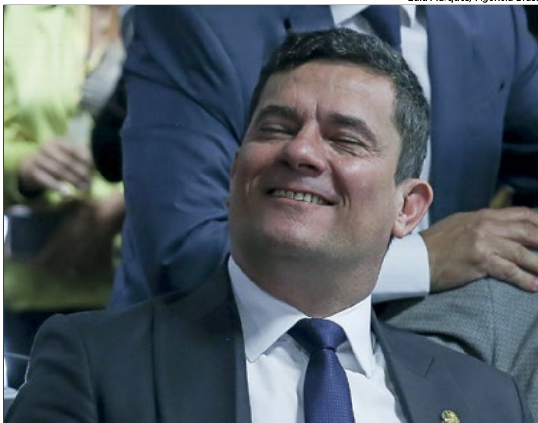
Moro mantém o mandato, mas decisão final será o TSE

O desembargador, indicado pelo presidente Luiz Inácio Lula da Silva ao cargo, considerou que Moro foi beneficiado por ter feito uma pré-campanha à Presidência pelo Podemos, na qual gastou mais de R$ 2 milhões do fundo partidário. Depois, Moro desistiu de disputar o cargo. No ano seguinte, segundo as acusações, ao concorrer ao Senado Federal teria obtido vantagem indevida em relação aos outros candidatos