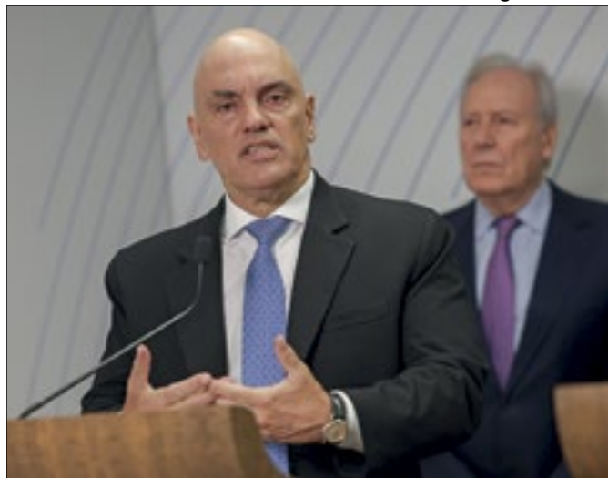
Se Moraes extrapola, quem o segura?