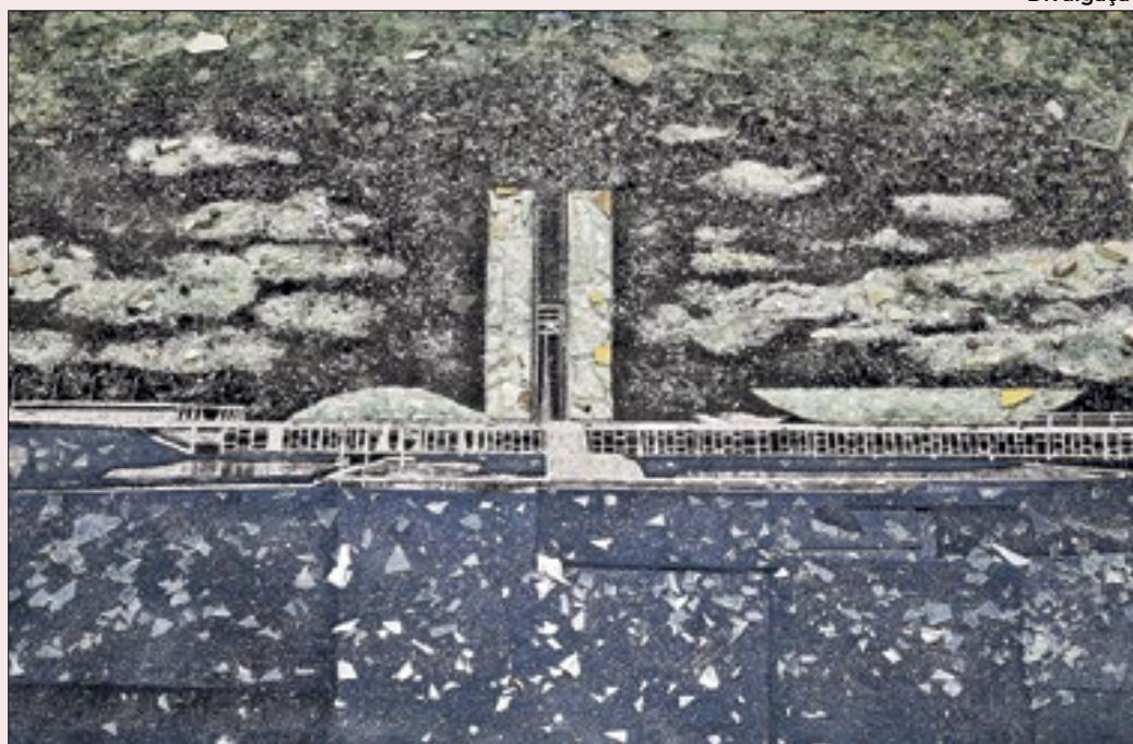
'8 de Janeiro de 2023', obra de Vik Muniz