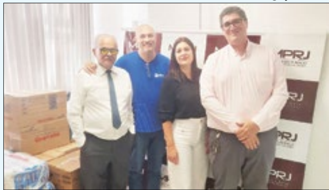
Arrecadação de donativos para as vítimas das chuvas