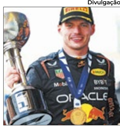
Max ganhou mais um GP

Vencedor do GP do Japão, Max Verstappen destacou que tudo contribuiu para mais um triunfo, o terceiro em quatro corridas em 2024. Ele admitiu que teve dificuldade em manter a liderança em certo momento e que se sentiu ameaçado apenas nas largadas, quando chegou a ficar lado a lado com Sergio Pérez. Verstappen destacou que o desgaste dos pneus pôde ser melhor controlado graças a um clima mais ameno, com o sol entre as nuvens.