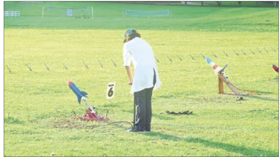
Mostra Brasileira de Foguetes ensina astronáutica e astronomia e reúne várias escolas

Os estudantes podem lançar os foguetes até o dia 17 de maio. Para validar a participação, as escolas precisam enviar, de 18 a 31 de maio de 2024, as