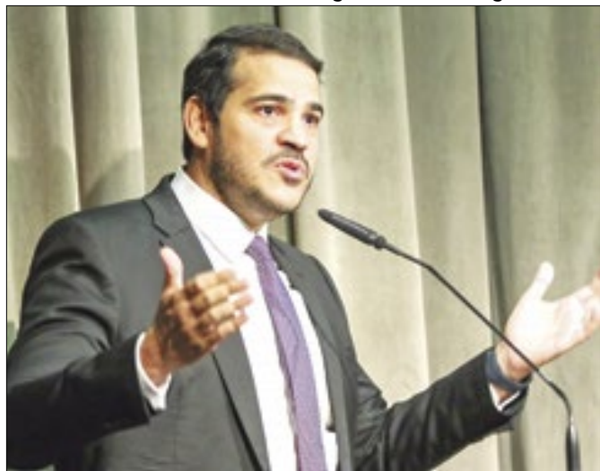
Batista, Messias faz a interlocução com os evangélicos