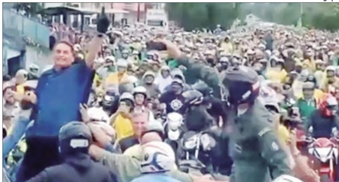
Bolsonaro em Maceió na semana passada

Publicadas pelo jornal The New York Times, dos Estados Unidos, as imagens na embaixada pareciam demonstrar que Bolsonaro, após a retenção do passaporte, temia a possibilidade de prisão e foi buscar refúgio na representação húngara. Bolsonaro nega. Disse que se hospedou na embaixada para tratar de temas de interesse dos dois países.