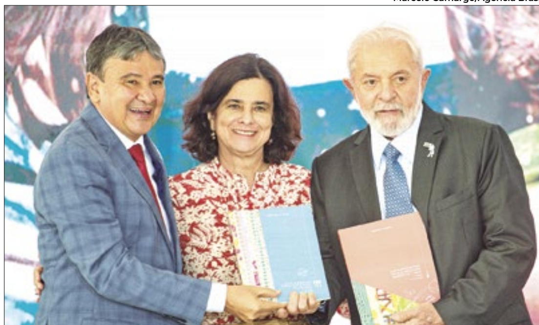
Wellington e Nísia estão na mira das mudanças ministeriais

No momento, há diversas mexidas no tabuleiro da Esplanada dos Ministérios em cogitação. De acordo com informações da colunista Monica Bergamo, da Folha de S. Paulo, o atual ministro de Relações Institucionais, Alexandre Padilha, pode ir para o Ministério da Saúde, substituindo a ministra Nísia Trindade, que