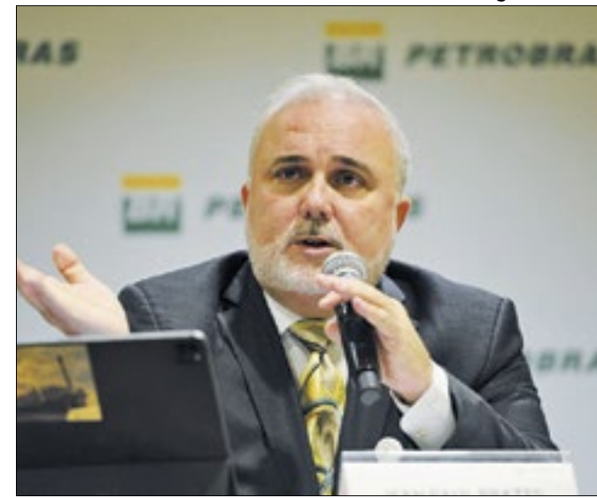
Presidente é alvo de fritura no governo