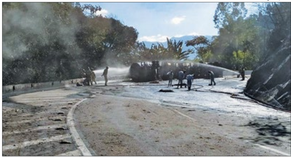
Pista estreita e sinuosa da subida da serra é uma das causas de inúmeros acidentes

Como informado pela própria Concer, em novembro de 2020, o atual trecho que liga a Baixada Fluminense e a cidade de Petrópolis é antigo e sinuoso. “Em 2019, a subida da Serra de Petrópolis ficou completamente interditada por 35 horas no total. Foram 18 ocorrências de maior complexidade no período que interromperam o fluxo de tráfego pelo equivalente a quase um dia e meio. Panes mecânicas, secas e elétricas, desatrelamentos e derramamentos de carga, acidentes e quedas de árvores estão entre as causas dos frequentes transtornos, agravados pela pista estreita e sinuosa”.