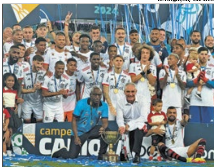
Tite chamou o elenco do Nova Iguaçu para a foto da final

go parecia pouco interessado no jogo. O resultado foi um primeiro tempo sonolento, de baixíssimo nível técnico e poucas emoções.