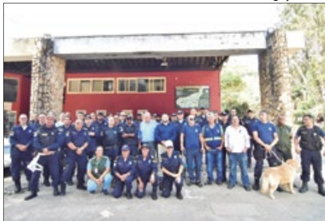
Posto da 2ª Inspetoria da Guarda Civil Municipal