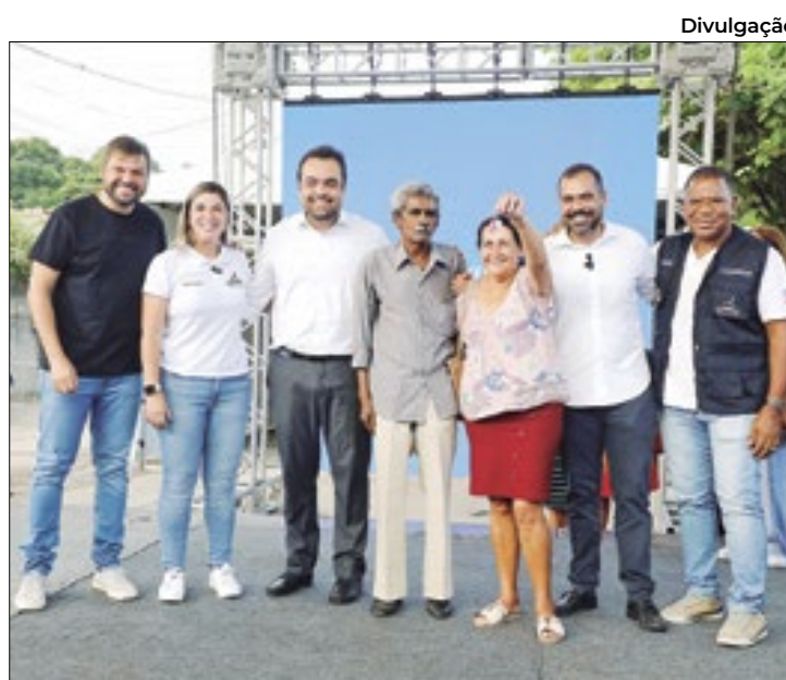
Cerimônia marcou a entrega das chaves para os moradores