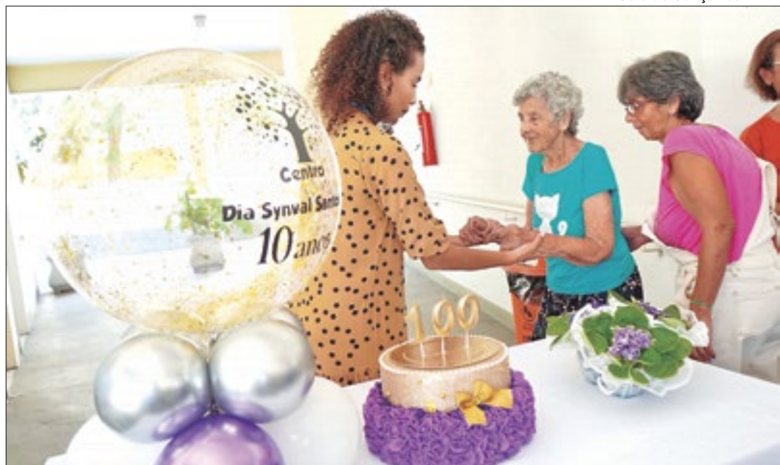
Durante os 10 anos de funcionamento centro já atendeu mais de 350 pessoas

O Centro Dia fica na Rua 548, número 101, no bairro Jardim Paraíba, ocupando uma área construída de 870 metros quadrados. A unidade possui dois andares com recepção, três salas de atividades, duas salas de repouso (com