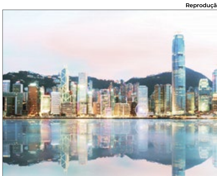
Censura faz parte da Lei de Segurança Nacional

Um adendo à polêmica Lei de Segurança Nacional, que há quatro anos já vinha provocando um êxodo de artistas, o chamado Artigo 23 agora impõe