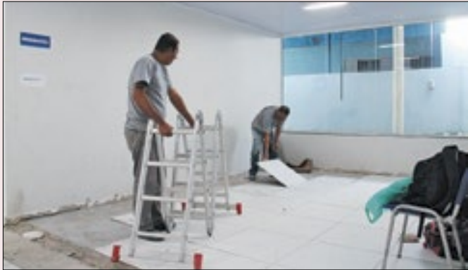
Unidade referência na cidade mantém atendimentos