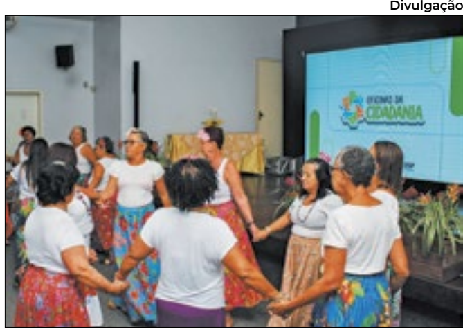
Ação acontecerá em todos os CRAS da cidade

O professor ainda destaca que a gestão de riscos exige uma participação ativa dos moradores e que, por isso, acredita que articulação de múltiplas instituições e das comunidades onde os levantamentos são realizados é um grande desafio.