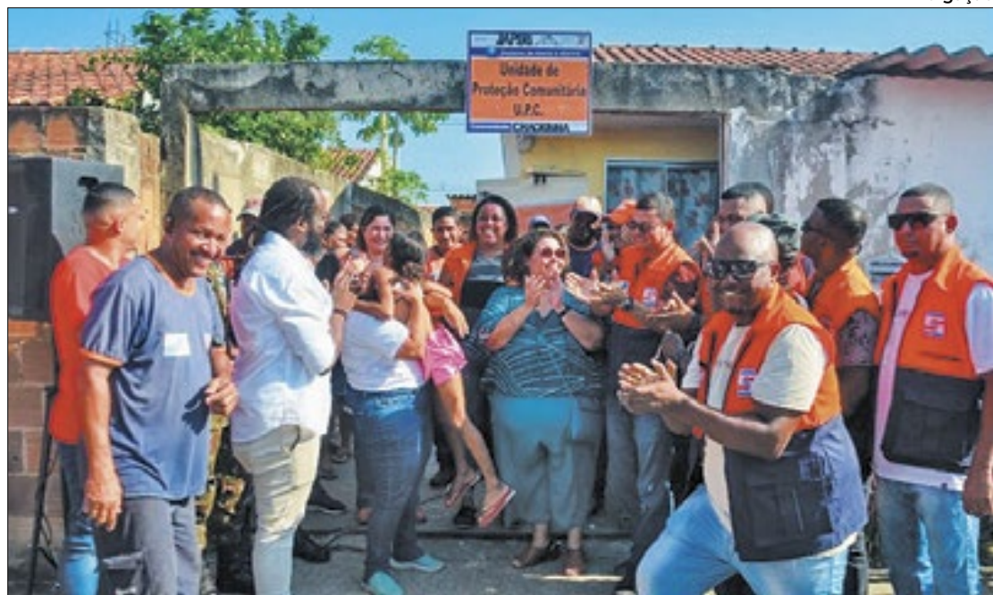
Núcleos de Proteção e Defesa Civil foram inaugurados pela Prefeitura de Japeri

Para este trabalho, o secretário pontuou que as parcerias têm sido fundamentais para o apoio à população. Ele citou as secretarias Municipais do Meio