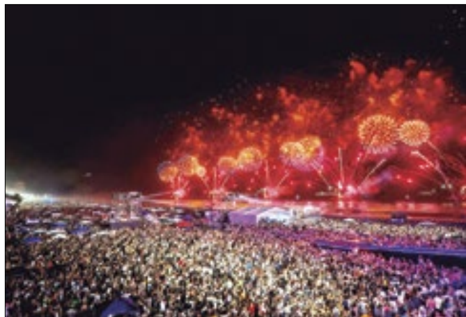
Documento mantém os mesmos locais de shows de 2024