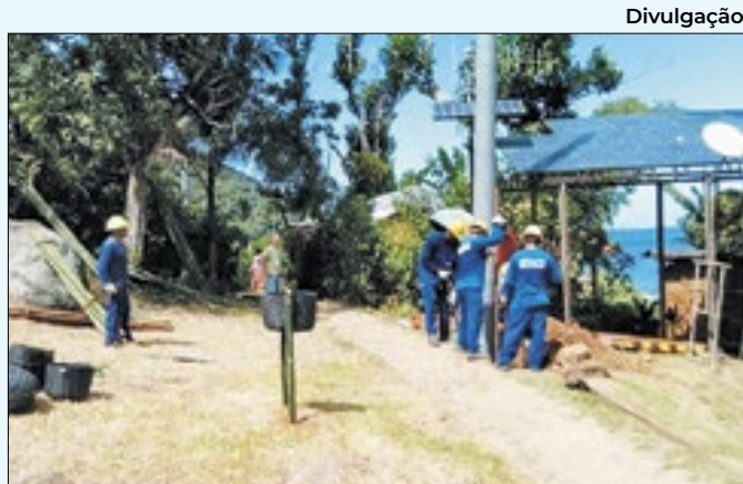
'Samuel e a Luz' mostra comunidade caiçara

tência Social (SUAS), atendendo as necessidades de todos os serviços: Cadastro Único, PROCAD, Vigilância Socioassistencial, Ouvidoria da Assistência Social, Gestão Financeira.