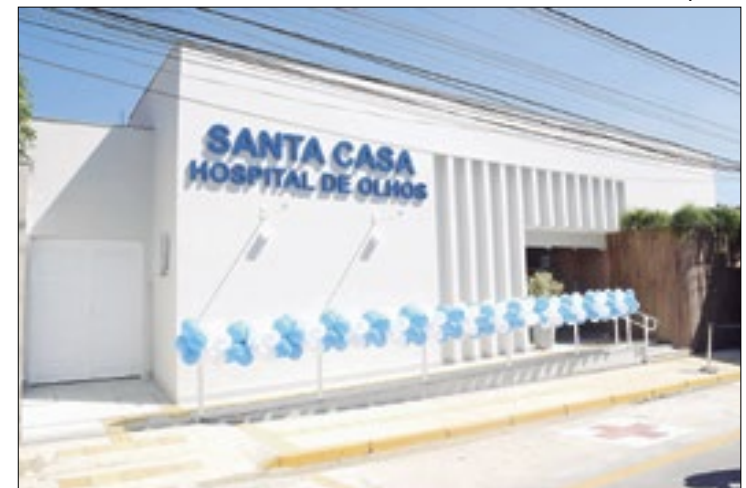
Inaugurado o primeiro Hospital de Olhos no Sul Fluminense