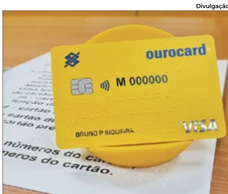
BB dá mais um passo crucial na direção da inclusão social

Ao solicitarem uma nova via de seu cartão, ou um cartão novo, eles receberão em seu endereço um kit contendo um cartão com as informações de número, CVV, data de validade e bandeira em braile, além de um manual com instruções sobre o cartão e sua forma de desbloqueio e de um porta-cartão com os seus dados comple-