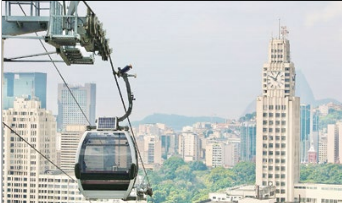
Teleférico foi inaugurado em 2014, ao custo de R$ 75 milhões, via obra do PAC

O retorno do Teleférico da Providência será gradual. Em abril, o equipamento irá funcio-