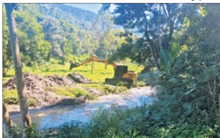
Dragagem e limpeza do Lago de Nogueira em Petrópolis

“A atenção às necessidades dos municípios, é uma determinação do governador Cláudio Castro. No caso do lago de Nogueira estamos falando de um trabalho ambientalmente importante, e que beneficia os frequentadores da região, pois