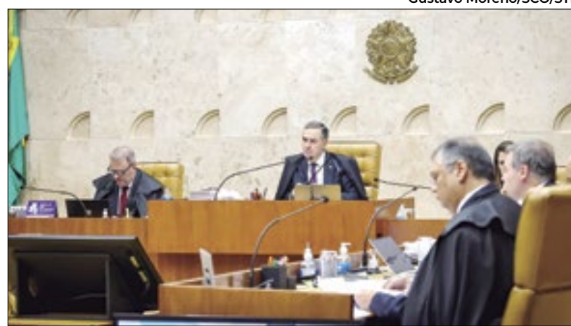
Corte irá julgar foro privilegiado

O julgamento que acontece em plenário virtual da Corte começou no final de março e, até o momento, somam-se, além de Cármen Lúcia, aos votos do relator, ministro Luiz Fux, os ministros Gilmar Mendes, Flávio Dino, Edson Fachin, André Mendonça, Cristiano Zanin, e o presidente do Supremo, Luís Roberto Barroso.