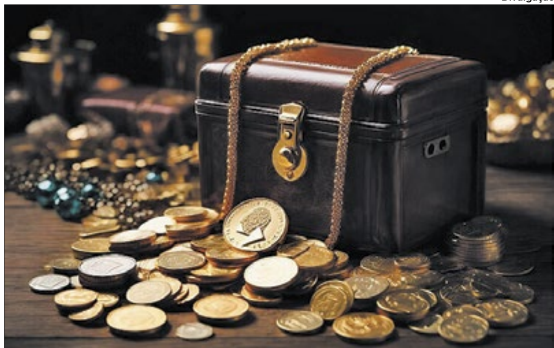
Não reajuste de pisos salariais é a solução da hora encontrada pelo Executivo

A necessidade de harmonizar essas vinculações com o novo arcabouço fiscal foi tratada pela primeira vez em abril de 2023 por Haddad em entrevista à Folha. Desde então,