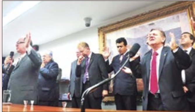
Governo terá que se aproximar dos líderes religiosos