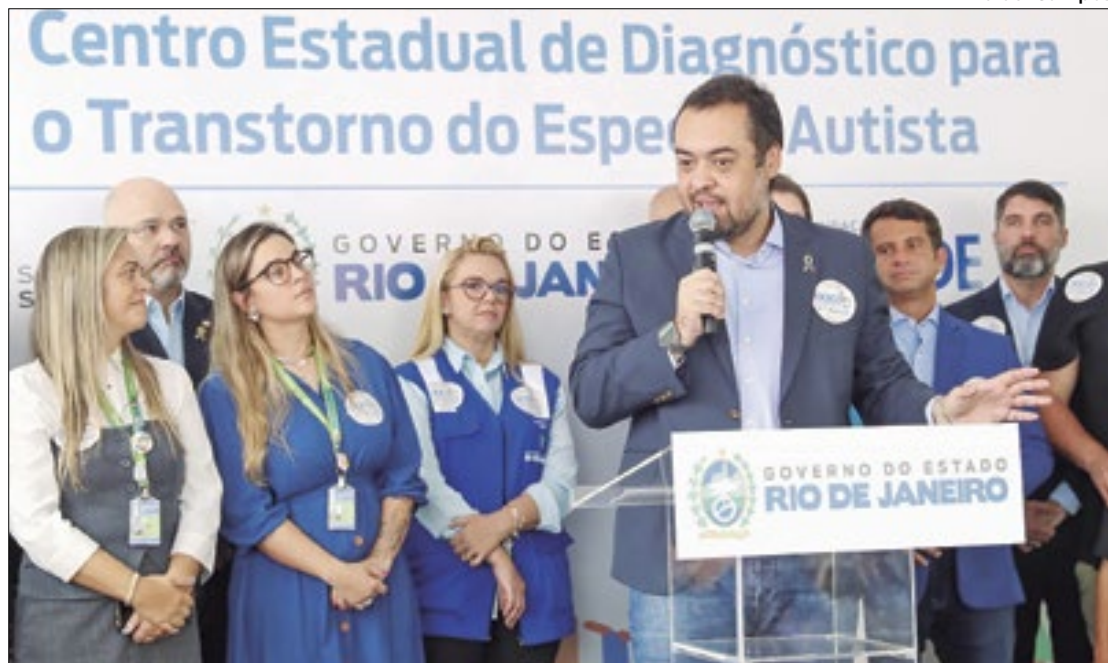
Iniciativa pioneira vai ajudar no tratamento e diagnóstico do autismo na capital

O CedTEA vai atuar no diagnóstico precoce e diferenciado de pacientes com autismo, especialmente crianças e adolescentes. O atendimento será feito inicialmente de for-