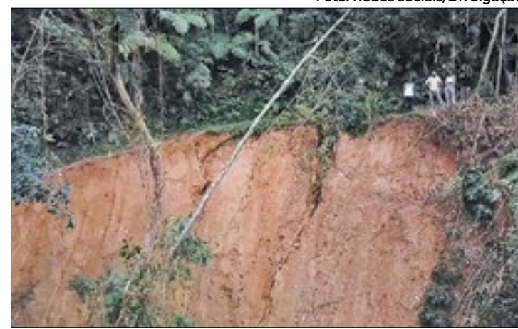
Trecho para o acesso à Barragem Beija-Flor e o Abrigo

O Parque Nacional da Serra dos Órgãos (PARNASO) em Teresópolis divulgou um alerta em suas redes sociais sobre um deslizamento ocorrido na trilha do Sino, provocado pelas chuvas recentes. O deslizamento afetou o trecho entre a barragem Beija-Flor e o Abrigo 1. Apesar do ocorrido, a trilha permanece aberta, contando com um desvio emergencial. A equipe do PARNASO está trabalhando na avaliação das melhores alternativas para um novo trajeto, enquanto isso, recomenda-se cautela aos visitantes nesse trecho da trilha.