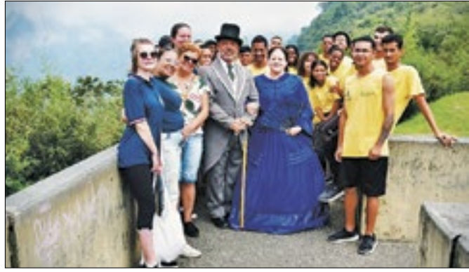
Aula-passeio do Projeto 'Olhar a cidade'