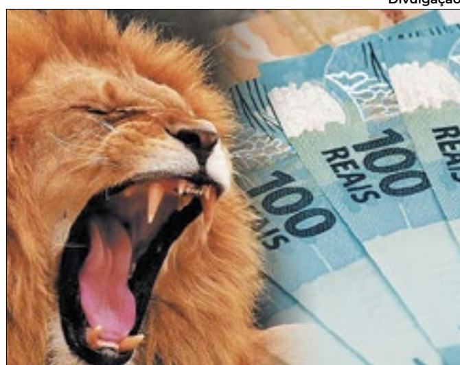
Volume de autuações da Receita obtém nova marca

Projeção foi apresentada por técnicos do Tesouro Nacional