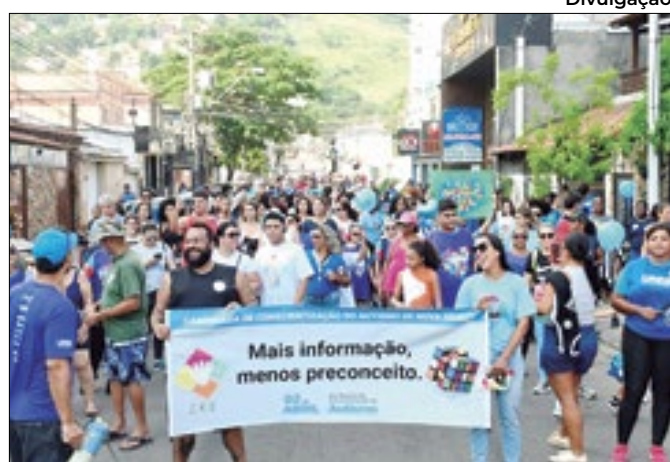
Caminhada de conscientização pelo Autismo