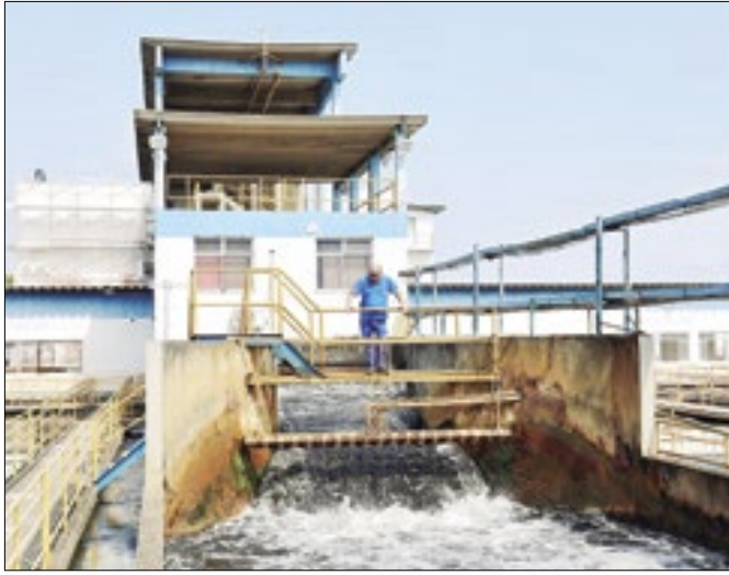
Polícia Civil potencializa as investigações sobre o crime