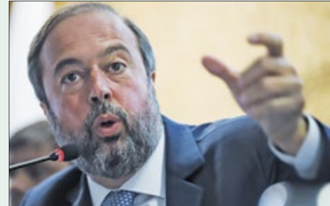
Silveira admitiu divergências com Prates