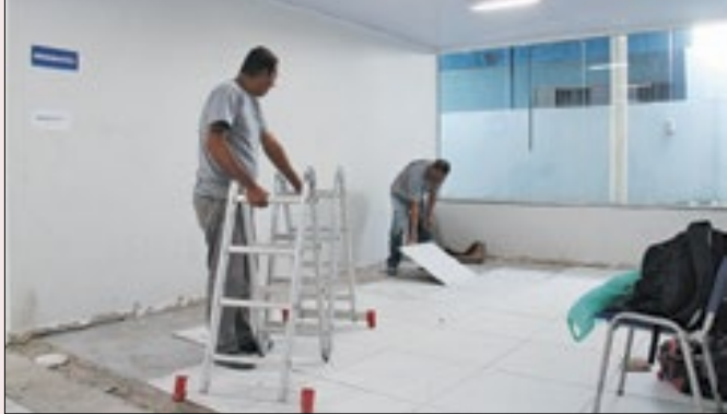
Unidade referência na cidade mantém atendimentos