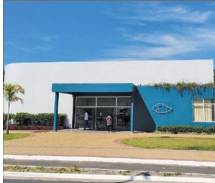
Abertura do plano acontecerá no Centro de Estudos Ambientais

O Plano Municipal de Redução de Riscos é coordenado pelo Departamento de Mitigação e Prevenção da Secretaria Nacional de Periferias do Mi-