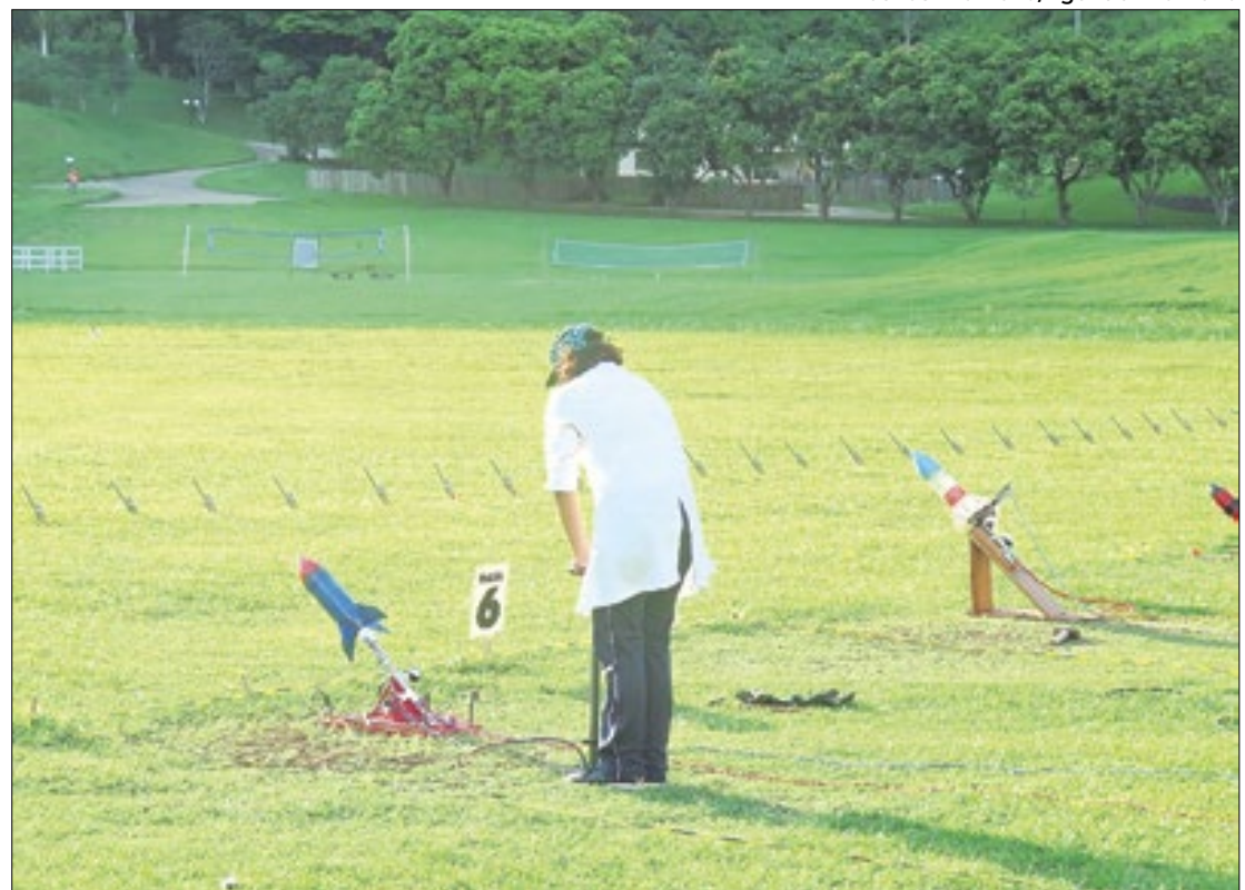
Mostra Brasileira de Foguetes ensina astronáutica e astronomia e reúne várias escolas

Os estudantes podem lançar os foguetes até o dia 17 de maio. Para validar a participação, as escolas precisam enviar, de 18 a 31 de maio de 2024, as informações sobre os alcances dos foguetes para a organização da MOBFOG.