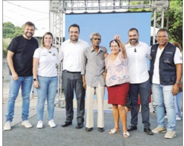
Cerimônia marcou a entrega das chaves para os moradores