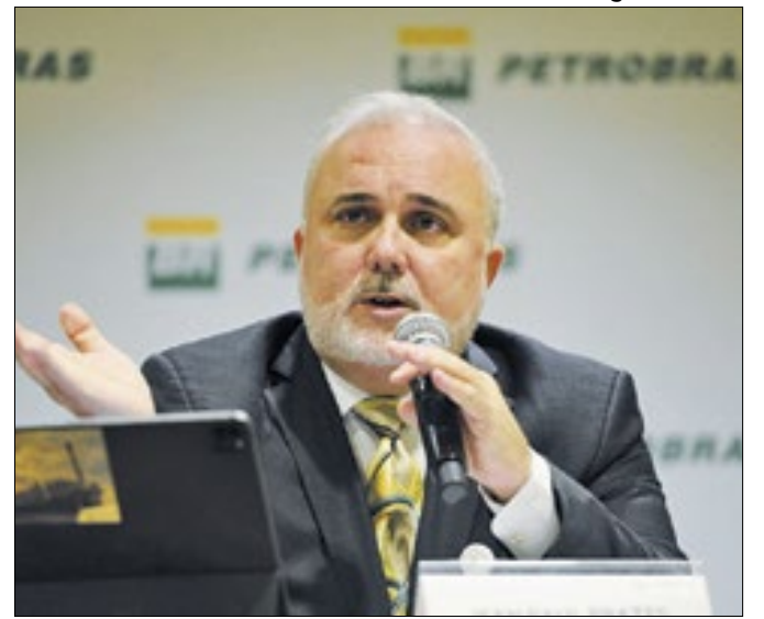
Presidente é alvo de fritura no governo