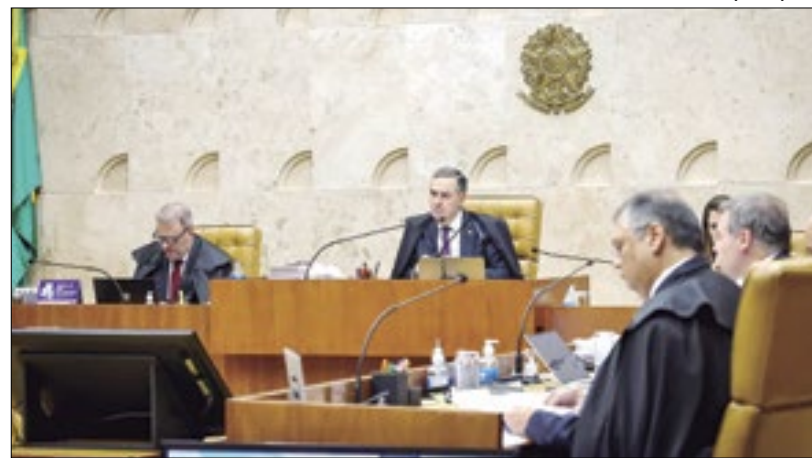
Corte irá julgar foro privilegiado

O julgamento que acontece em plenário virtual da Corte começou no final de março e, até o momento, somam-se, além de Cármen Lúcia, aos votos do relator, ministro Luiz Fux, os ministros Gilmar Mendes, Flávio Dino, Edson Fachin, André Mendonça, Cristiano Zanin, e o presidente do Supremo, Luís Roberto Barroso.