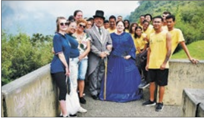
Aula-passeio do Projeto 'Olhar a cidade'