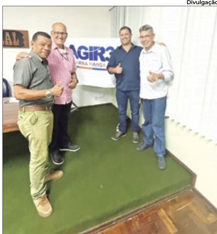
Agir fecha a nominata em Barra Mansa