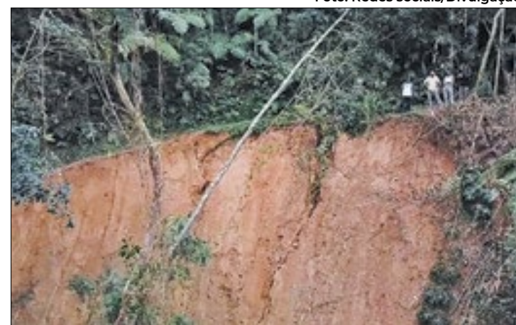
Trecho para o acesso à Barragem Beija-Flor e o Abrigo

O Parque Nacional da Serra dos Órgãos (PARNASO) em Teresópolis divulgou um alerta em suas redes sociais sobre um deslizamento ocorrido na trilha do Sino, provocado pelas chuvas recentes. O deslizamento afetou o trecho entre a barragem Beija-Flor e o Abrigo 1. Apesar do ocorrido, a trilha permanece aberta, contando com um desvio emergencial. A equipe do PARNASO está trabalhando na avaliação das melhores alternativas para um novo trajeto, enquanto isso, recomenda-se cautela aos visitantes nesse trecho da trilha.